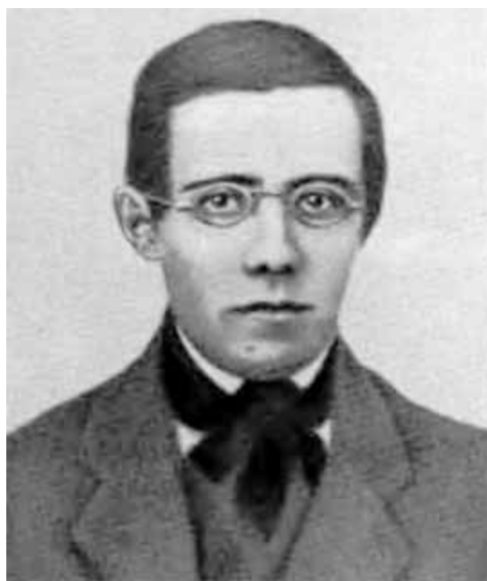
Бедржих Сметана. Дагерротип. 1843 г.