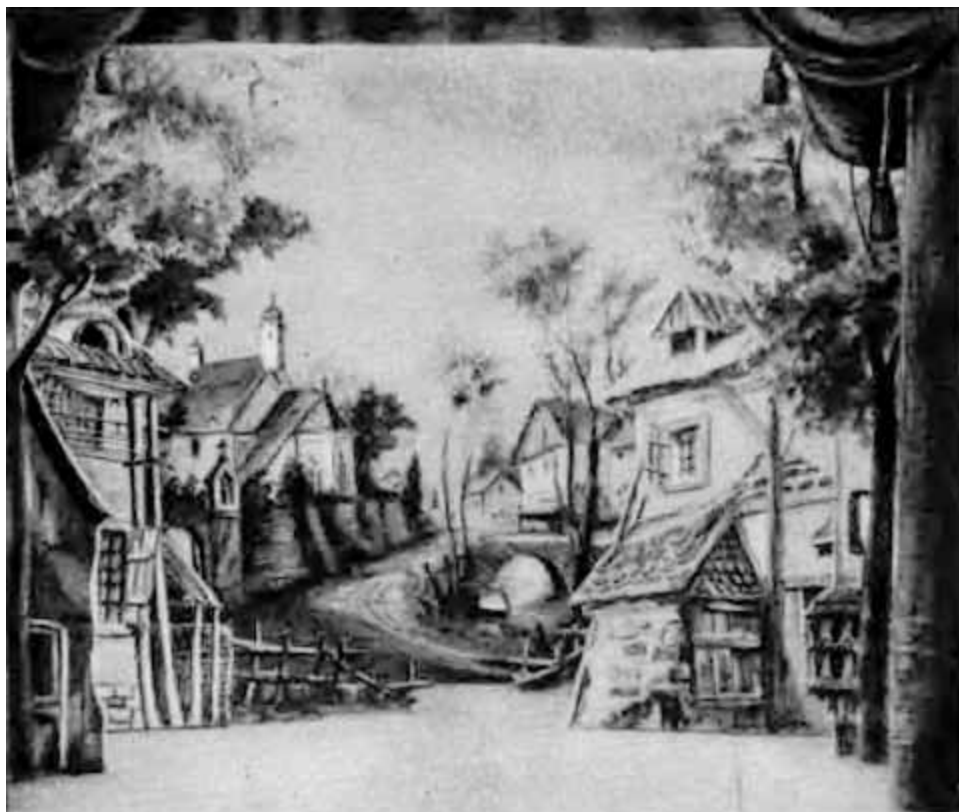
Декорация одной из постановок «Проданной невесты».