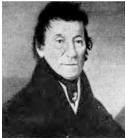
Отец Бедржиха Сметаны. Портрет работы Антонина Махека.