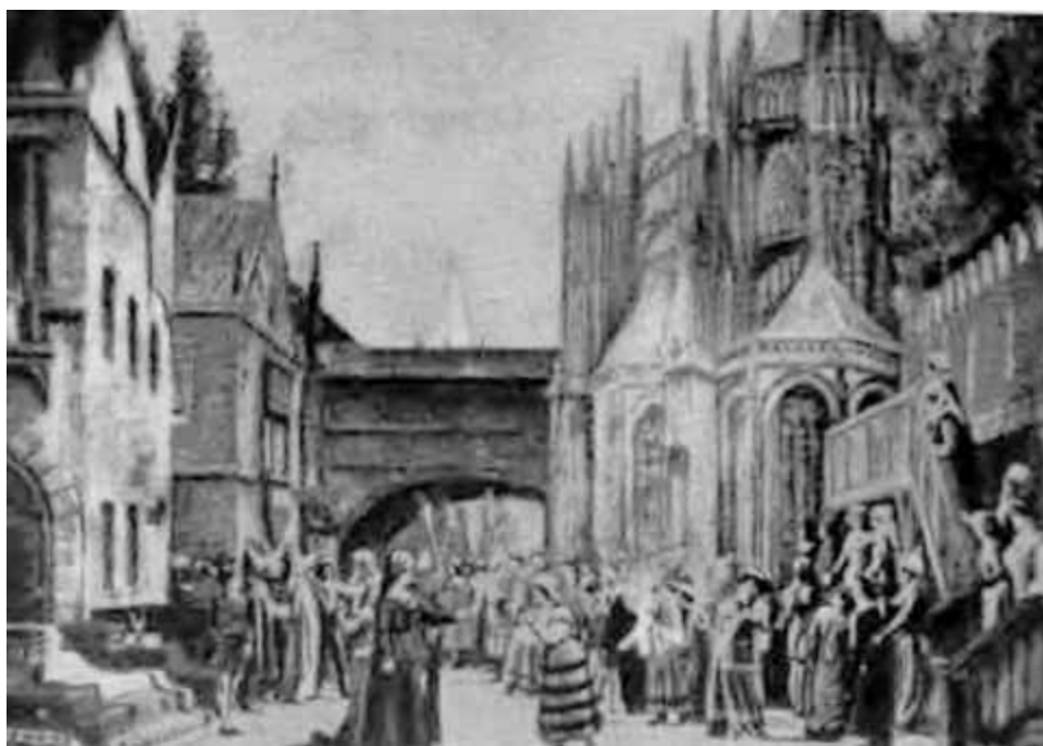
«Делибор». Сцена из 1-го акта, пражская постановка 1900 г.