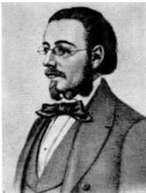
Б. Сметана. Портрет работы шведского художника Г. Саломана. 1857 г.