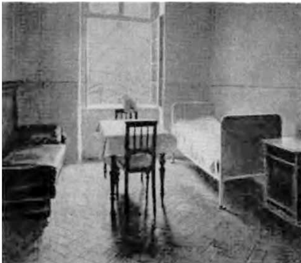
Больничная палата, в которой умер Сметана.