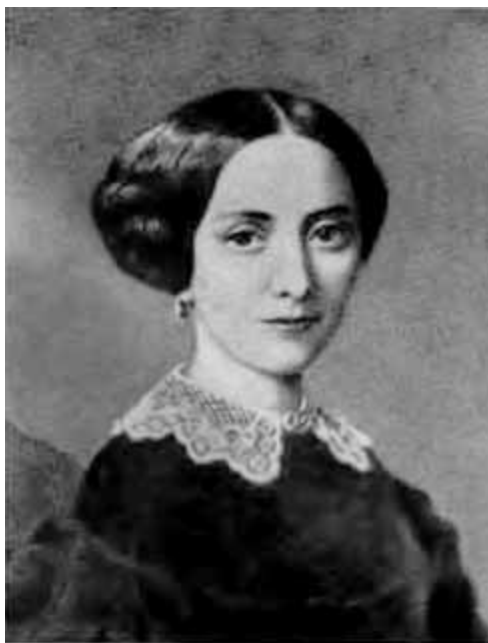
Катержина — первая жена Сметаны.