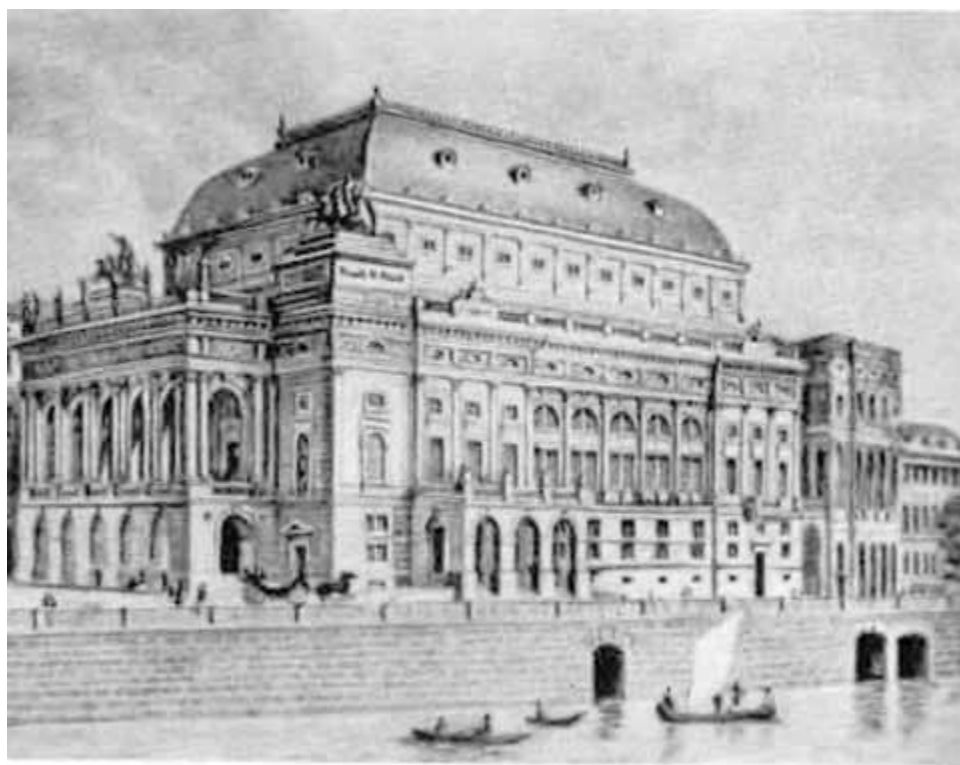
Пражский Национальный театр.