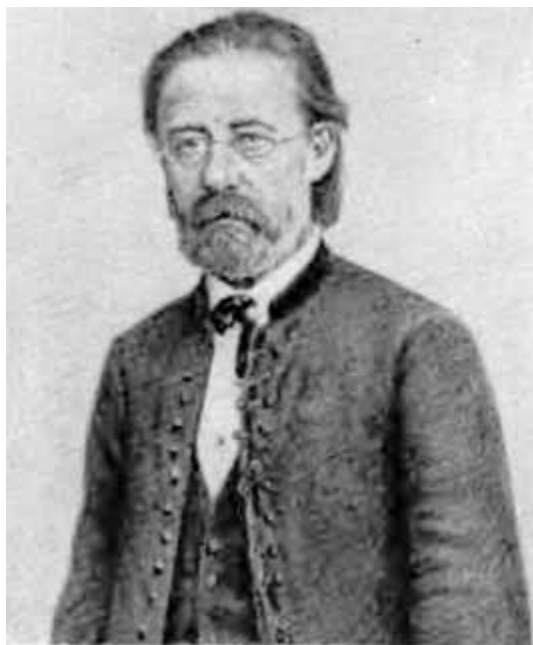
Б. Сметана. Портрет работы Макса Швабинского.