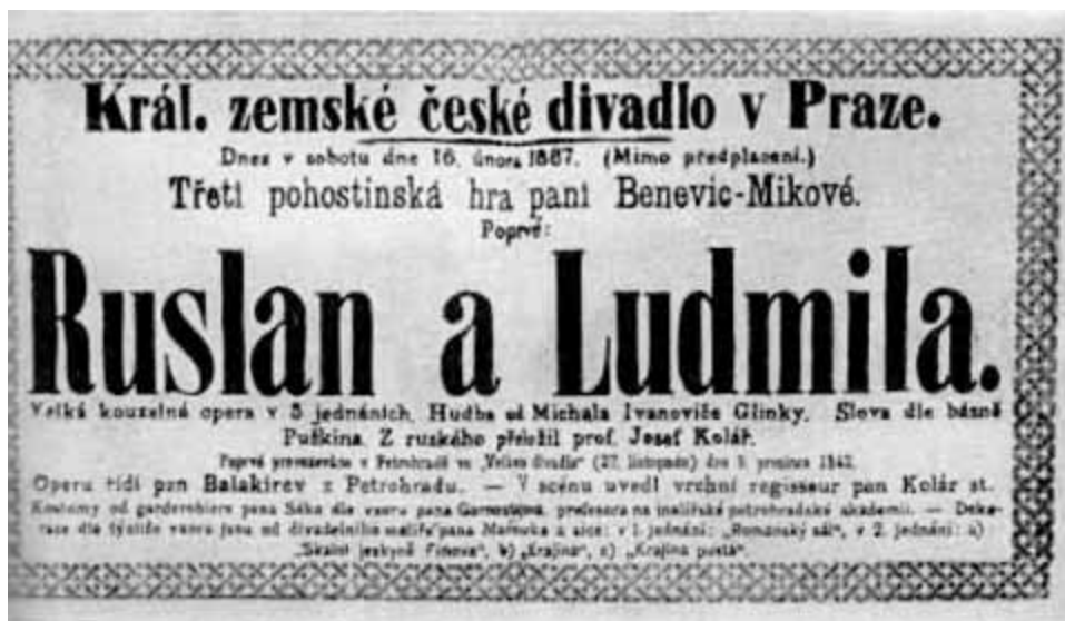
Афиша пражской премьеры оперы «Руслан и Людмила» под управлением М. А. Балакирева.