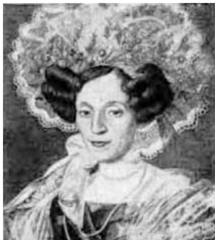
Мать Бедржиха Сметаны. Портрет работы Антонина Махека.