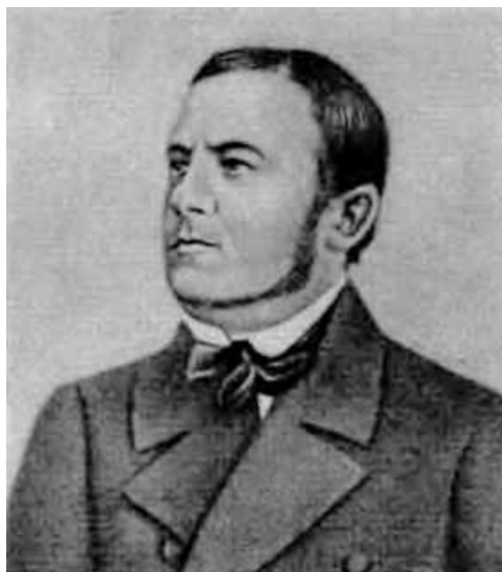
М. И. Глинка.