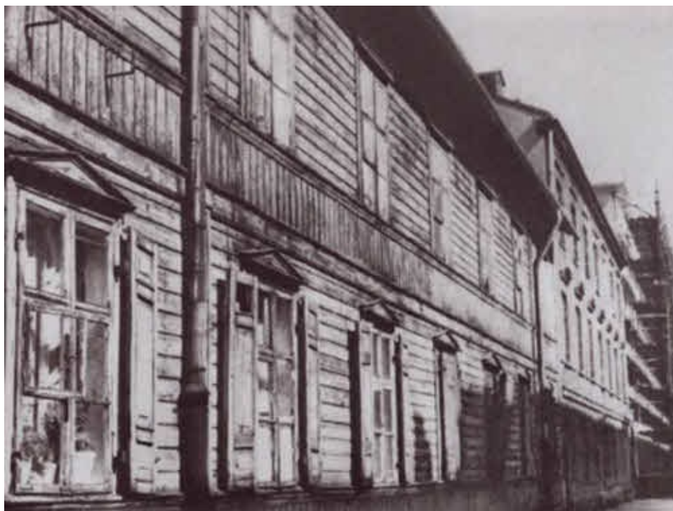
Каменотёсная мастерская на улице Стшелеикой. в которой работал Костя