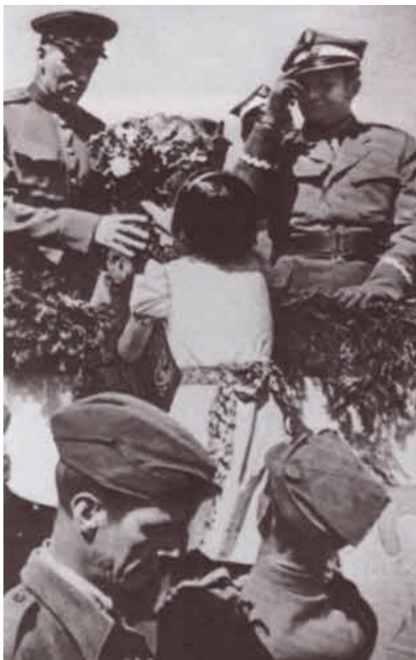
Цветы командующему 1-м Белорусским фронтом маршалу Рокоссовскому от жителей освобождённого Люблина. Рядом с маршалом главнокомандующий Войска Польского генерал М. Роля-Жимерский