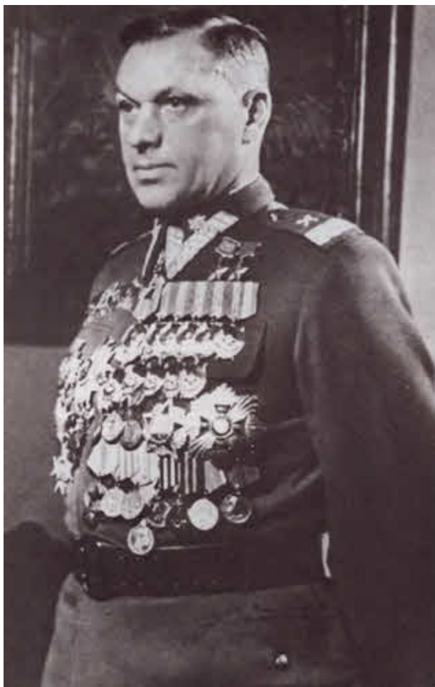
Маршал двух армий