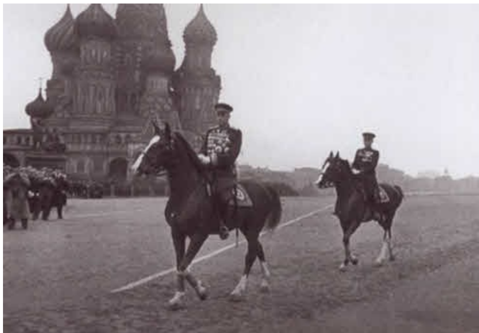
На Параде Победы