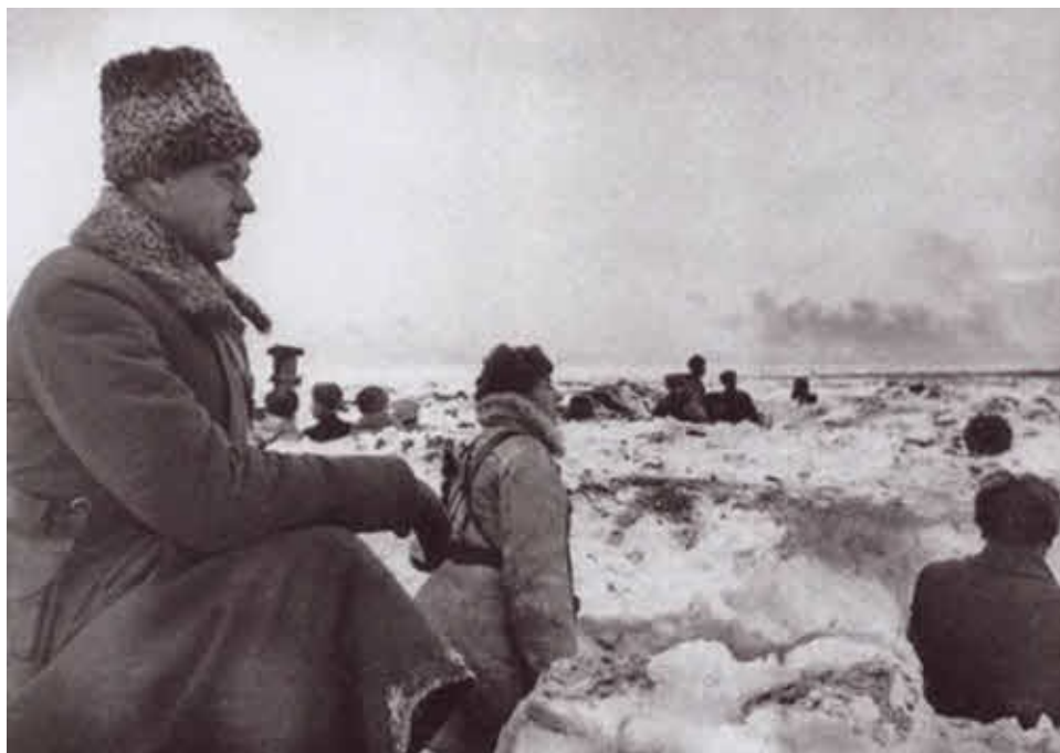
Командующий Донским фронтом генерал-полковник К. К. Рокоссовский