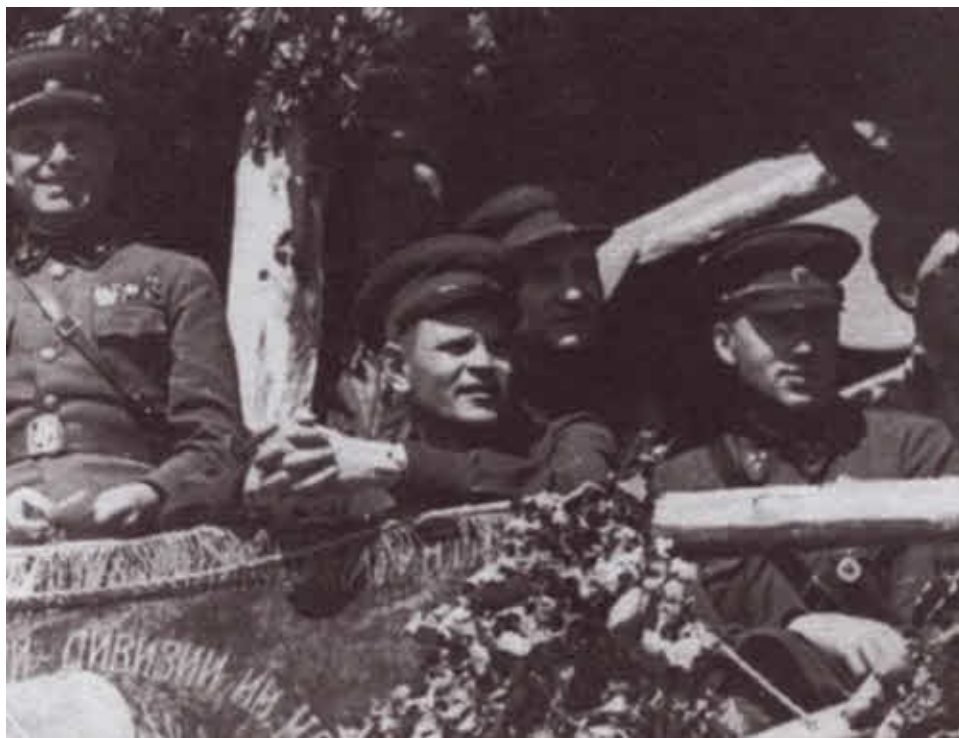
К. К. Рокоссовский на Брянском фронте. Лето 1942 г.