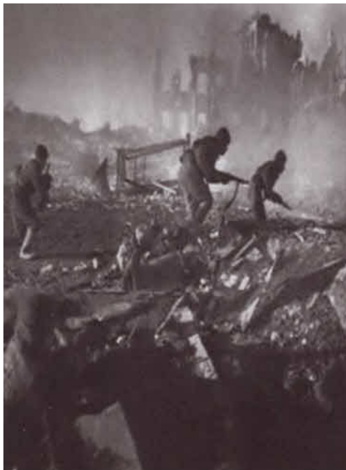
Уличные бои в Сталинграде