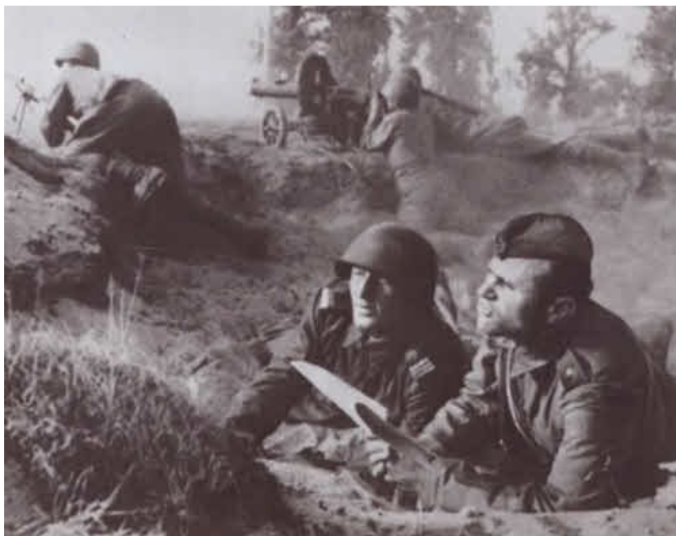
Воины 1-й польской армии на варшавском направлении