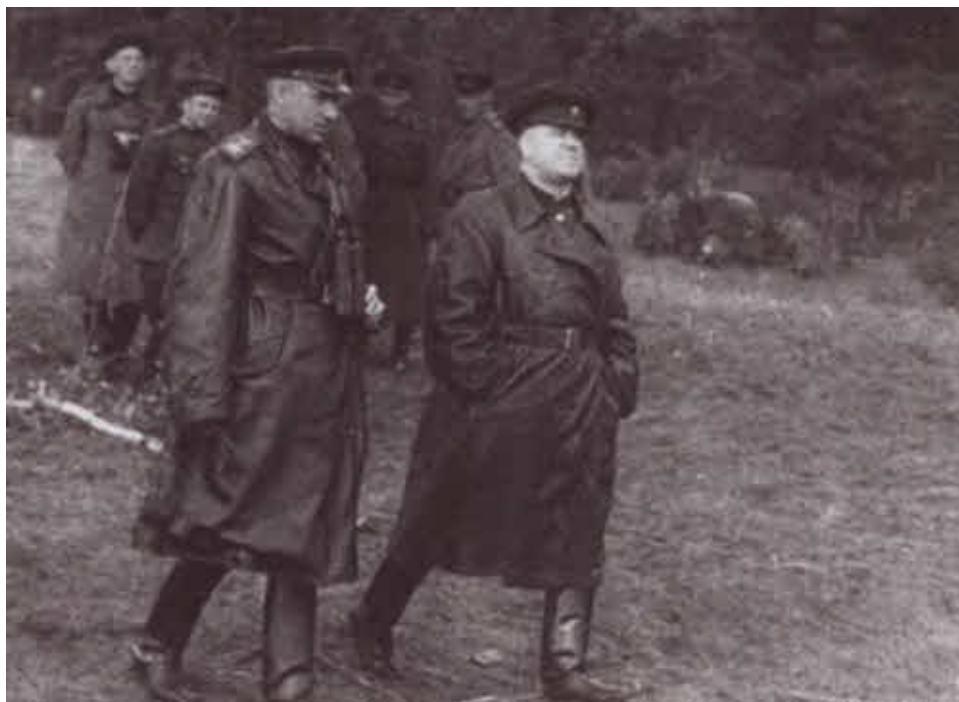
К. К. Рокоссовский и Г. К. Жуков. Польша, 1944 г.