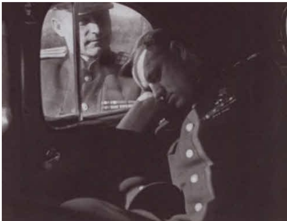
Командующий 2-м Белорусским фронтом К. К. Рокоссовский. 1945 г.