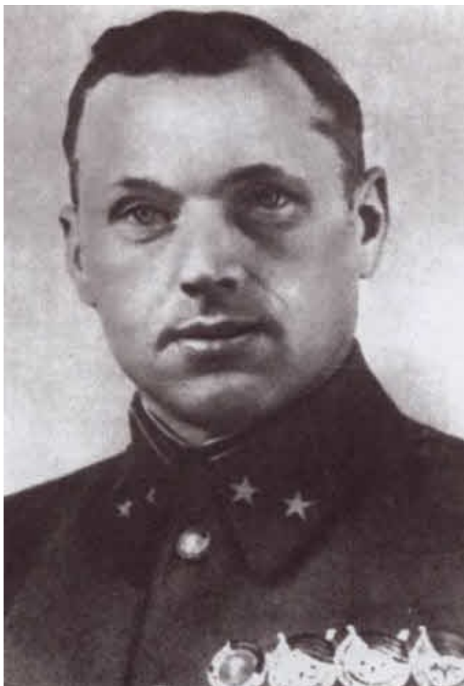
Командир 9-го механизированного корпуса генерал-майор К. К. Рокоссовский в первые дни Великой Отечественной войны