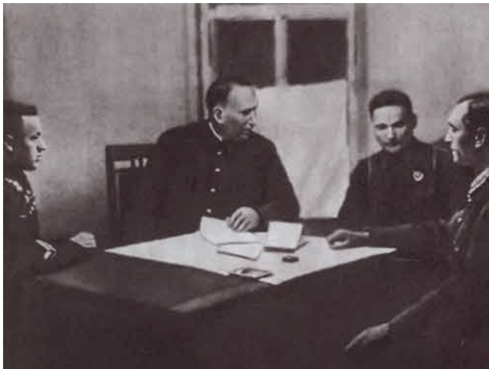
К. К. Рокоссовский и Н. Н. Воронов допрашивают фельдмаршала Паулюса