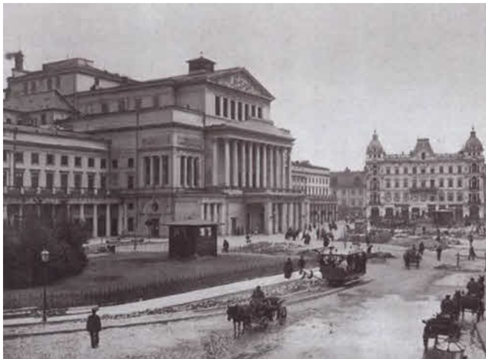
Варшава времён детства Кости Рокоссовского