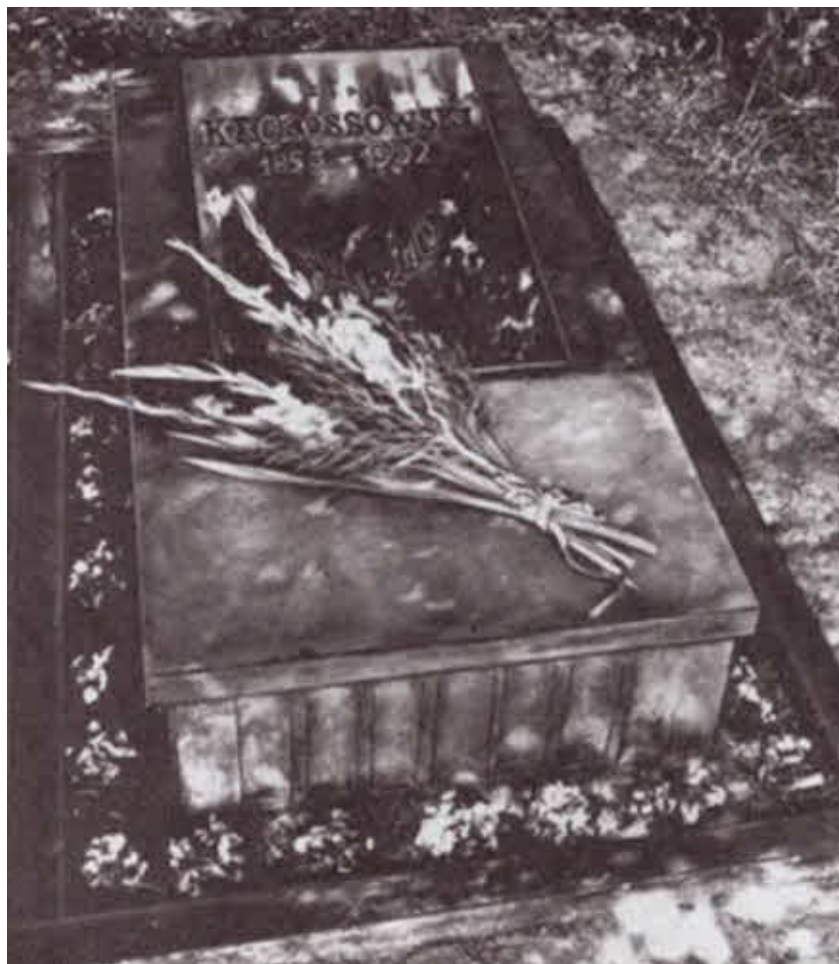
Константин в 18 лет