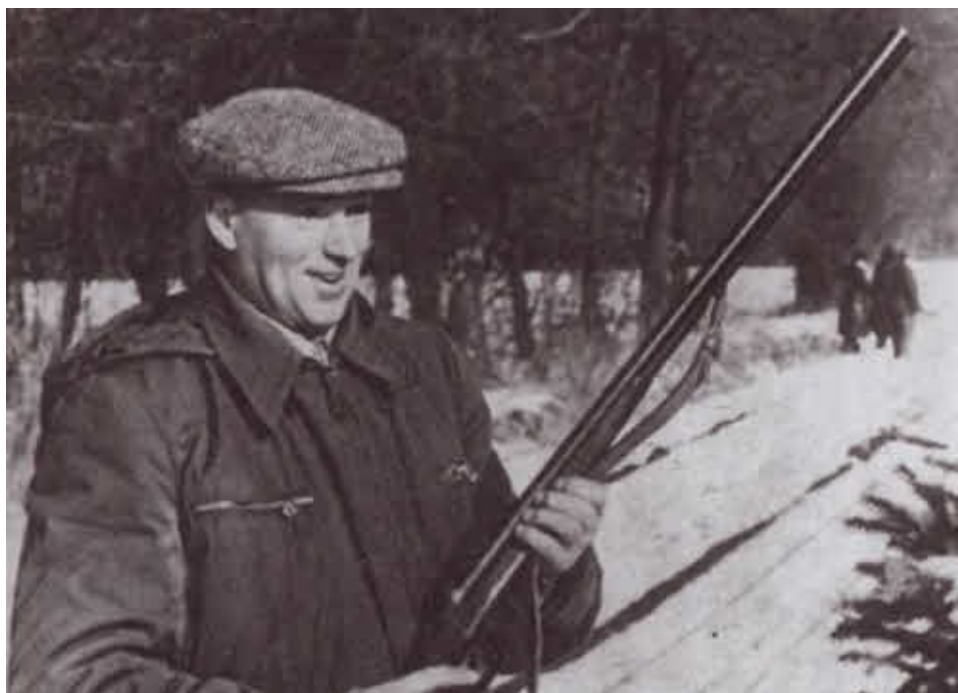
На охоте. Чехословакия, январь 1956 г.