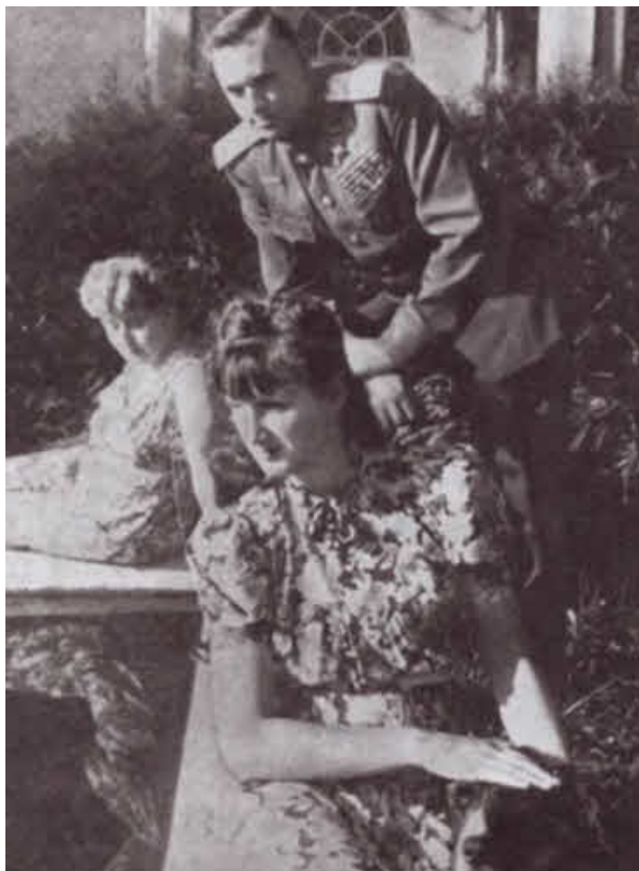
С женой и дочерью. 1947 г.