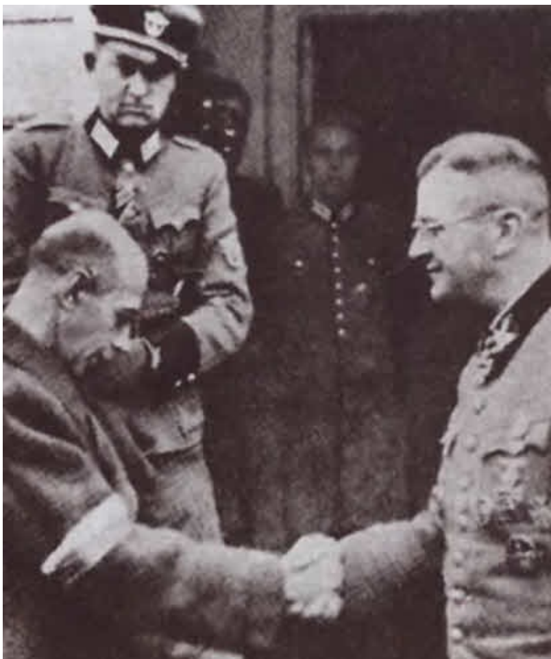
Бур-Коморовский и обергруппенфюрер СС Эрих фон дем Бах после подписания капитуляции варшавских повстанцев