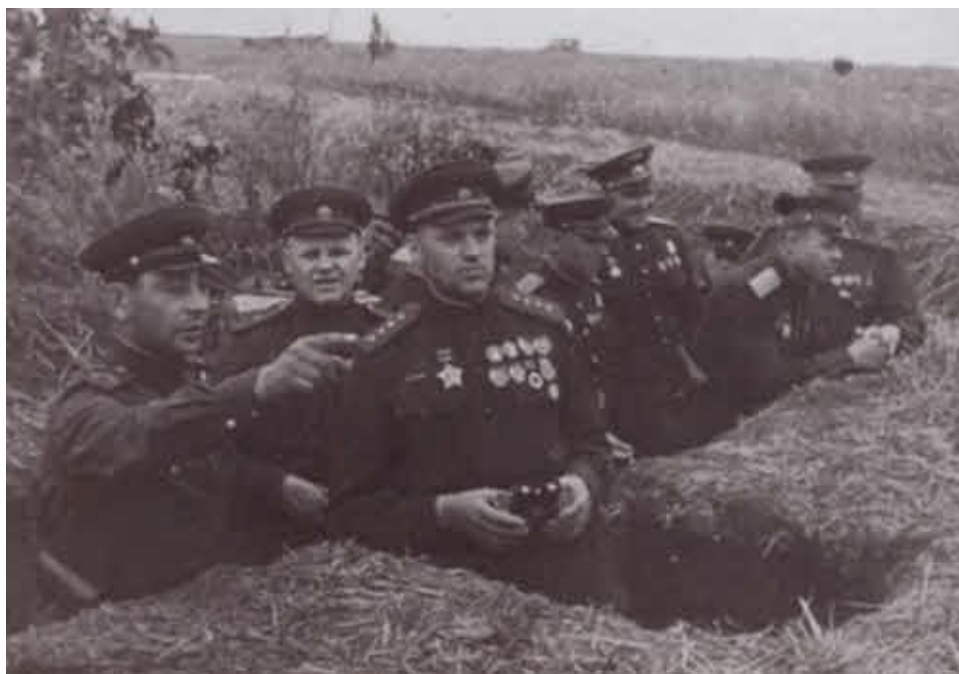
На КП под Курском. 1943 г.