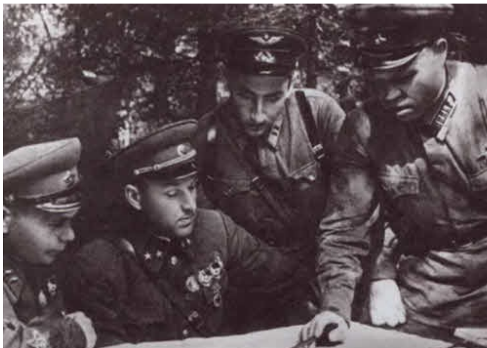
Командование 16-й армией во время оборонительных боёв в районе Волоколамска