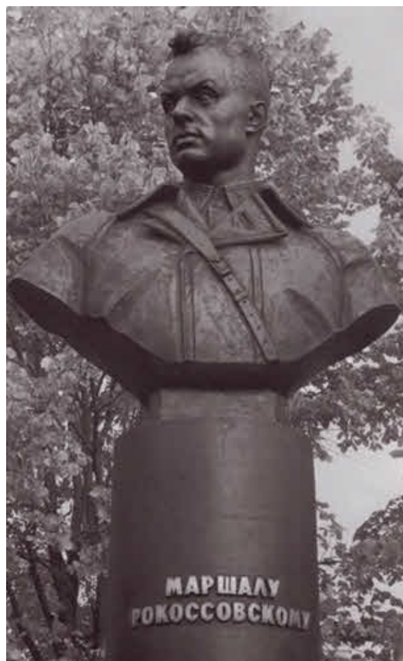
Памятник маршалу Рокоссовскому в Зеленограде