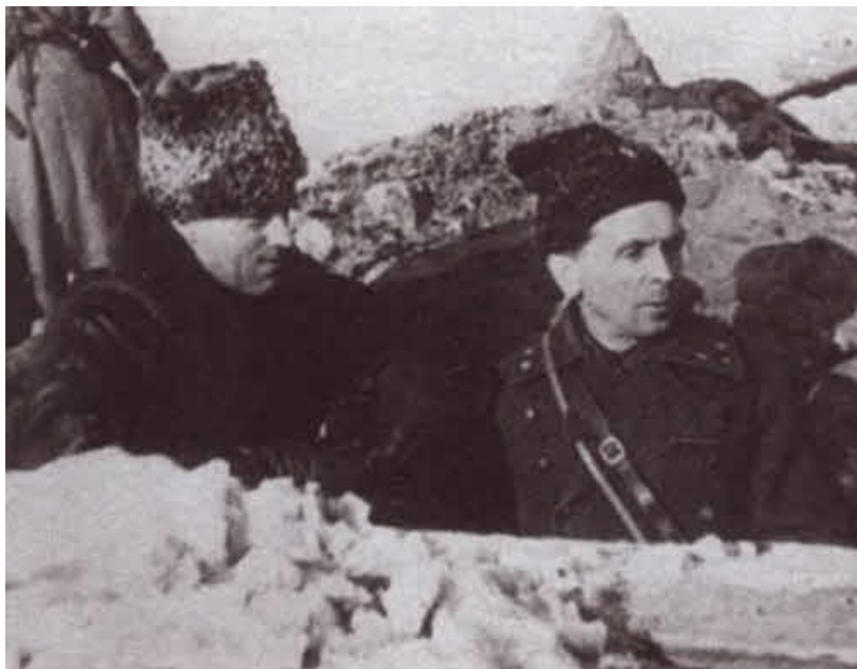
Командующий Донским фронтом К. К. Рокоссовский и генерал П. И. Батов в окопе под Сталинградом