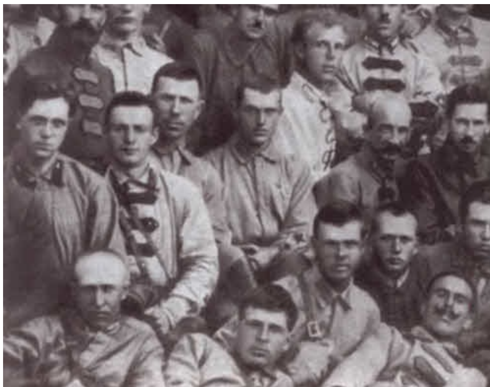
К. Рокоссовский среди участников борьбы с Унгерном. 1923 г.