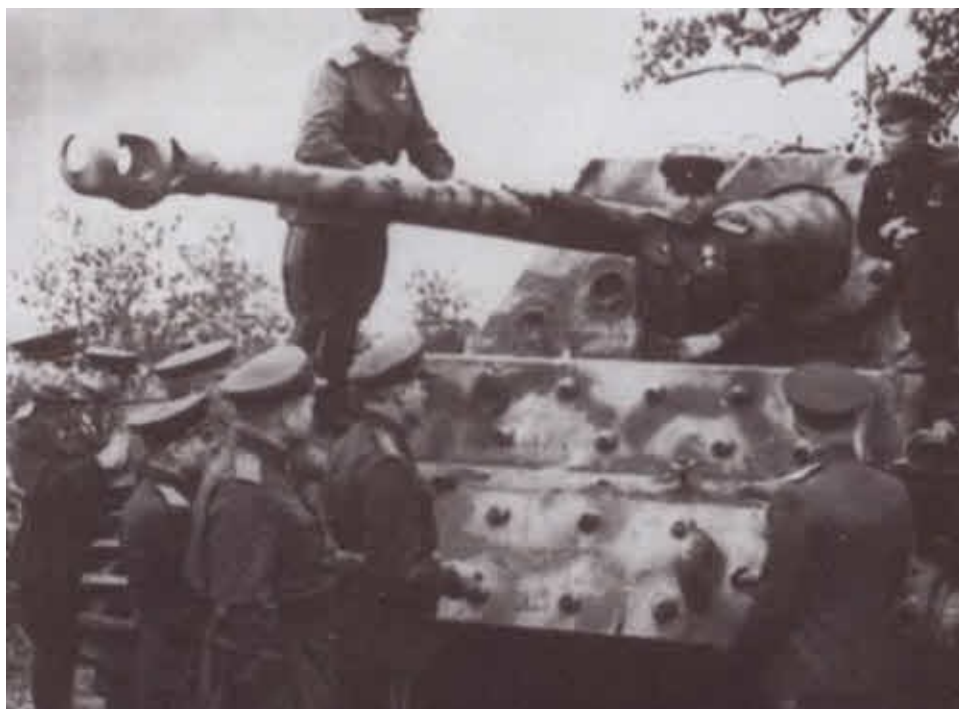
Рокоссовский с офицерами осматривает подбитую немецкую САУ «Фердинанд»