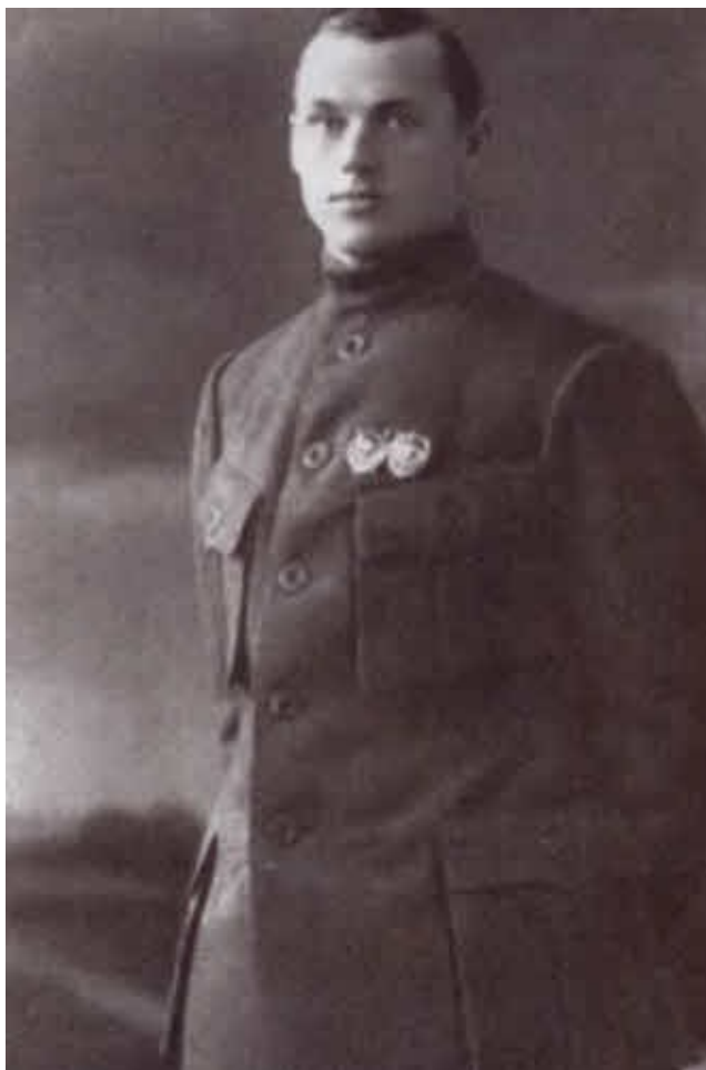
Кавалер двух орденов Красного Знамени. Конец 1920-х гг.