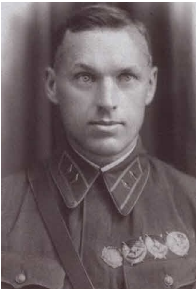
После освобождения из заключения и восстановления в звании. 1940 г.