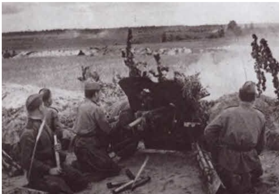
Операция «Багратион». Бои на подступах к городу Барановичи. 1944 г.