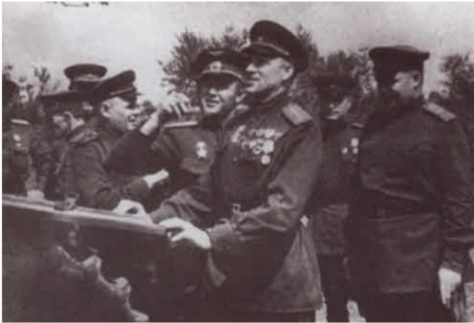
Командование Центрального фронта осматривает подбитую немецкую технику В центре — командующий фронтом К. К. Рокоссовский и командующий 16-й воздушной армией С. И. Руденко. Июль 1943 г.