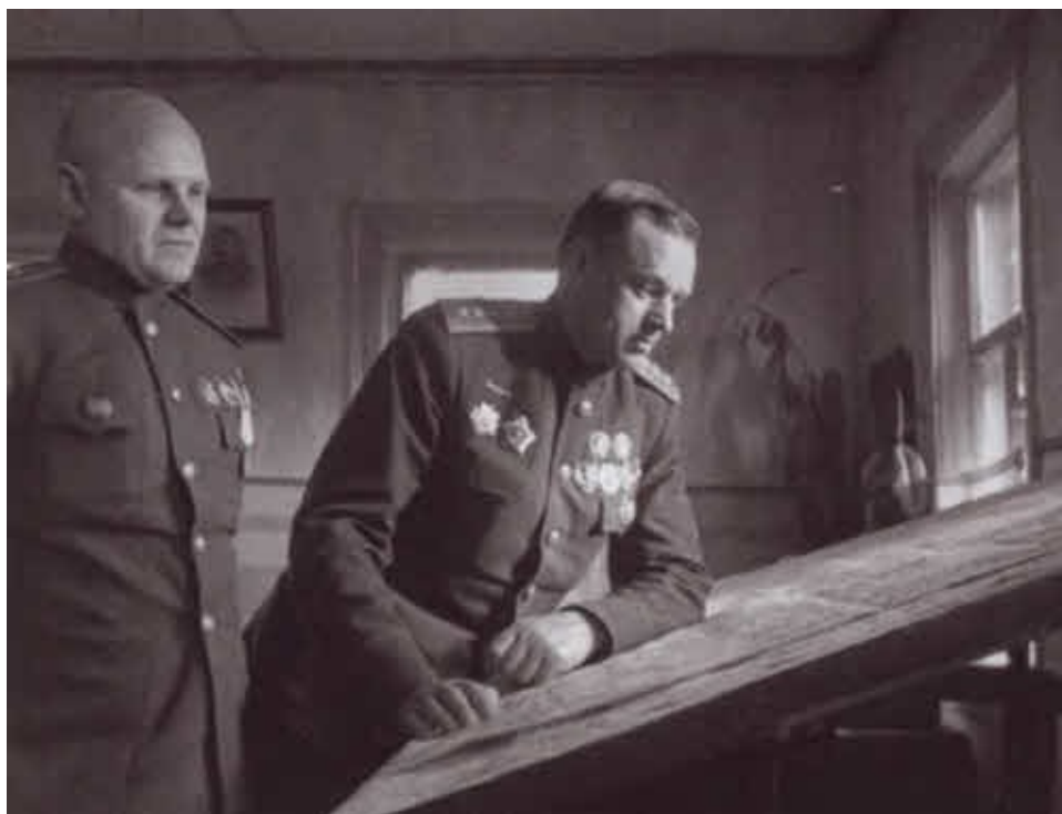
К. К. Рокоссовский и К. Ф. Телегин в штабе 1-го Белорусского фронта. 1944 г.