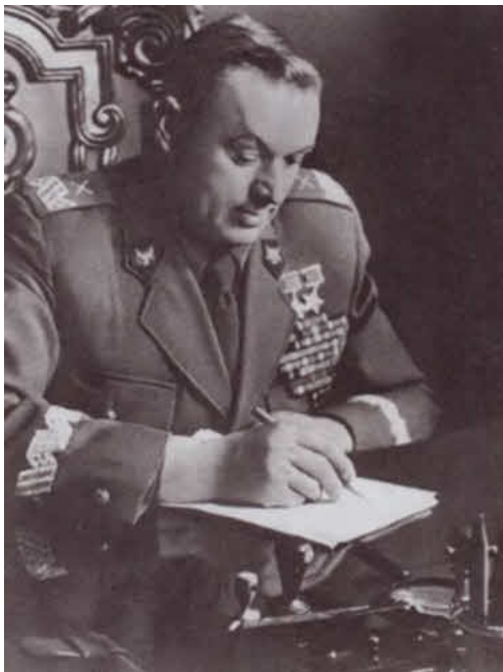
На ответственном посту министра национальной обороны Польши. 1949 г.