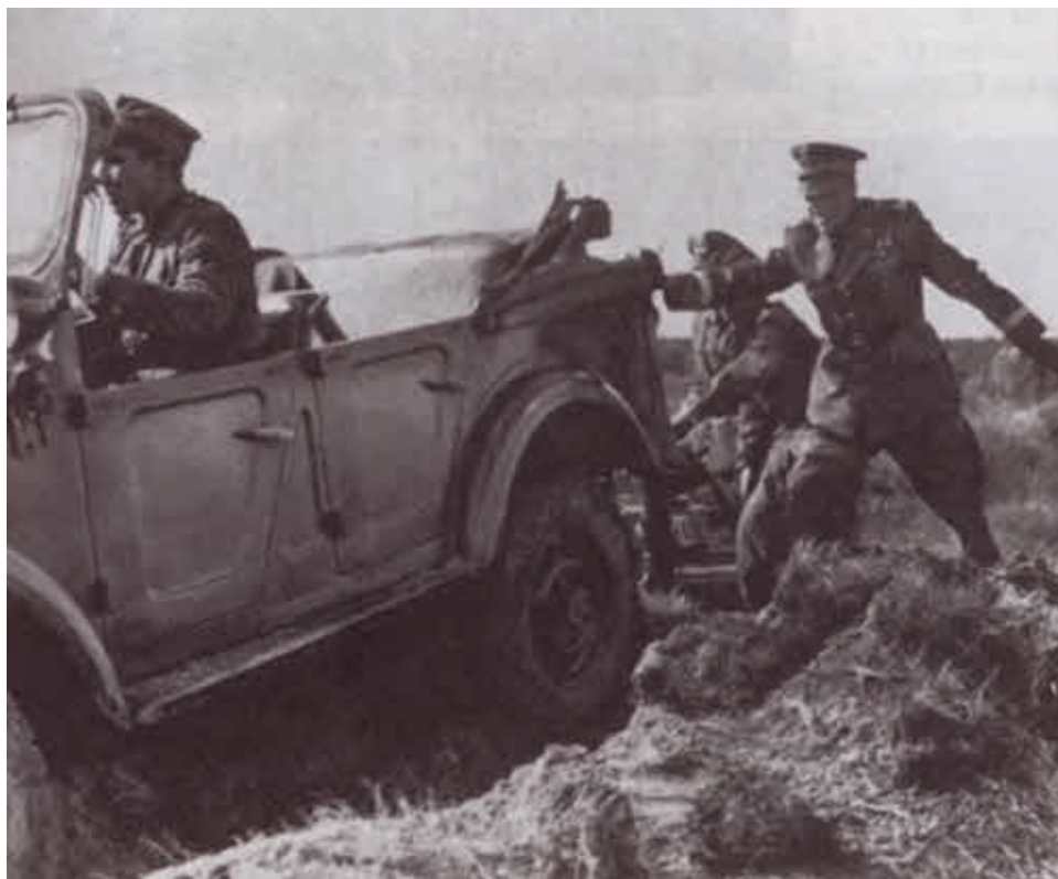
На полигонах случалось всякое... Польша, 1950-е гг.