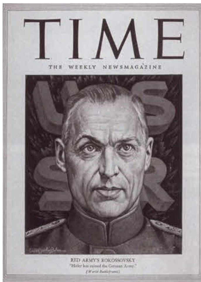
Портрет К. К. Рокоссовского на обложке американского журнала «Тайм».