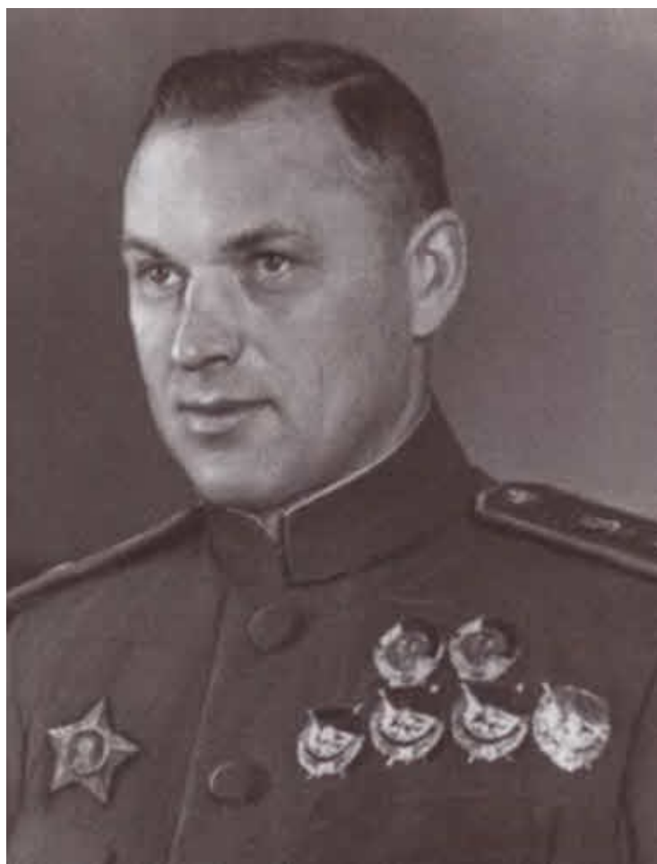
Маршал Советского Союза К. К. Рокоссовский. 1944 г.