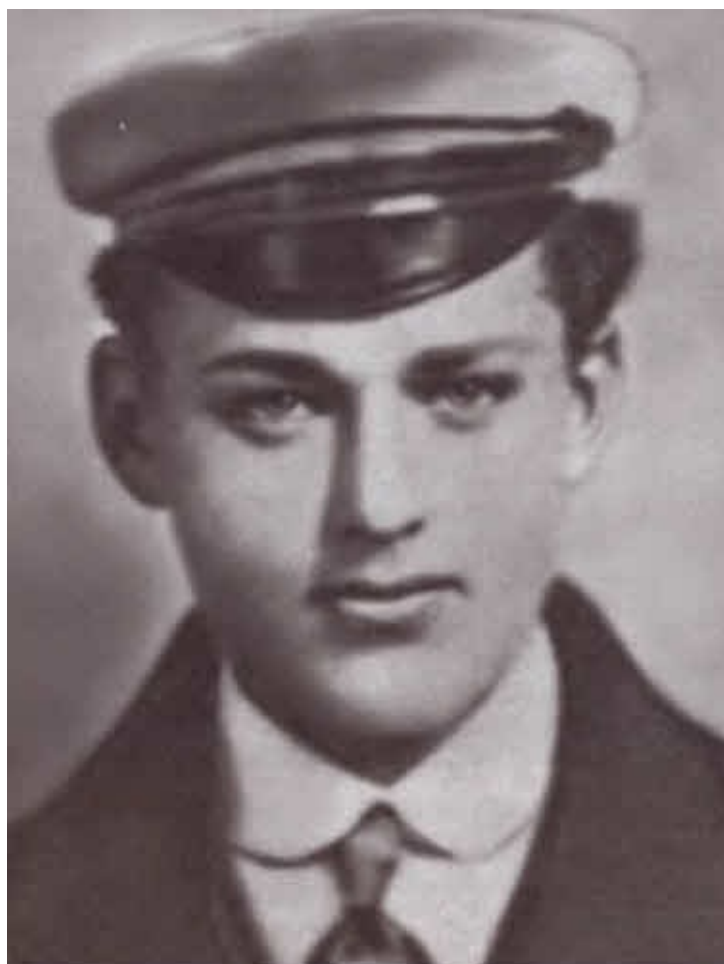
Могила Ксаверия Рокоссовского на кладбище Брудно. Плита установлена его сыном К. К. Рокоссовским в начале 1950-х годов