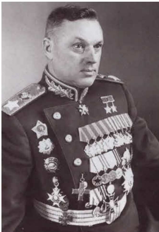
Маршал Советского Союза К. К. Рокоссовский перед Парадом Победы. 1945 г.