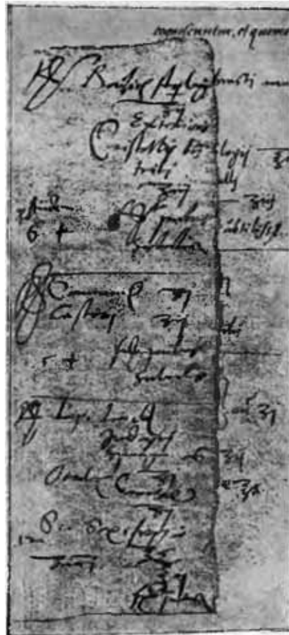
Рецепт, написанный рукою Парацельса.