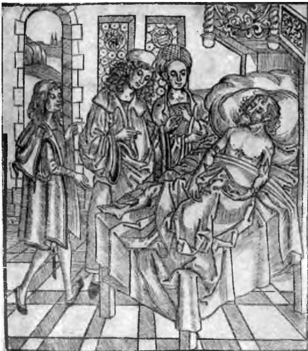
Врач с помощниками у постели больного. С гравюры на дереве 1497 г.