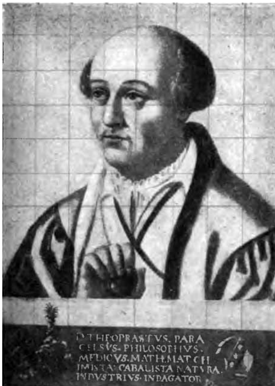
Парацельс. С портрета маслом неизвестного художника.