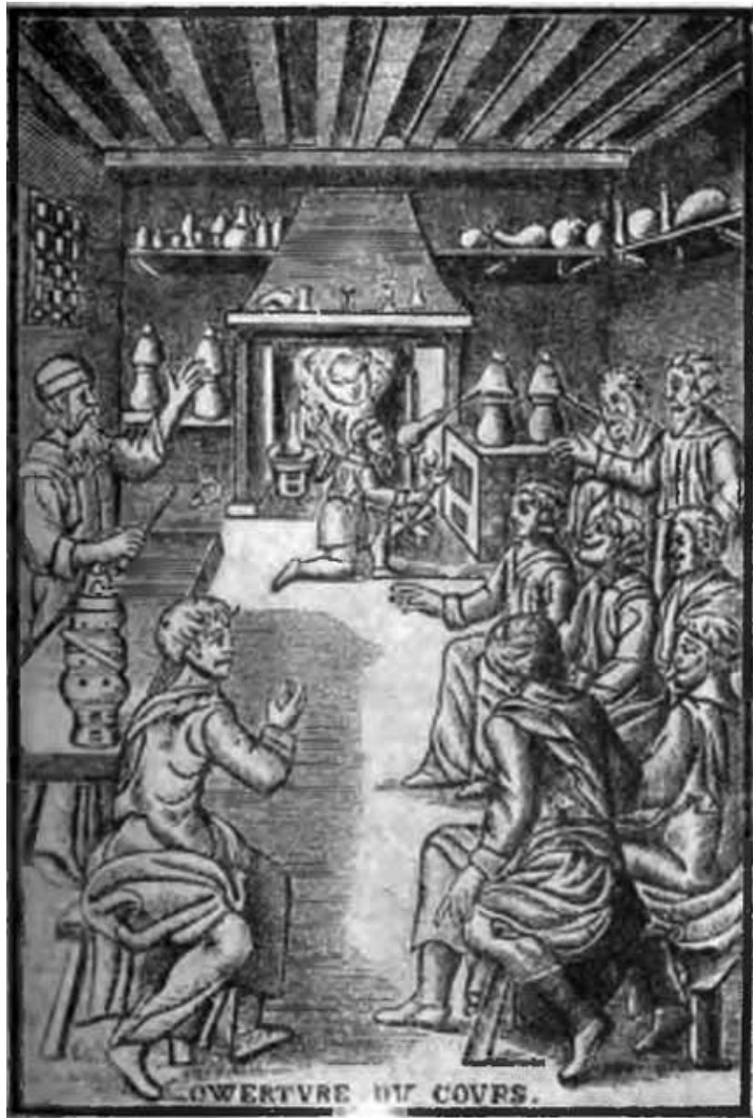
Аудитория алхимика конца средних веков. С гравюры XV века.