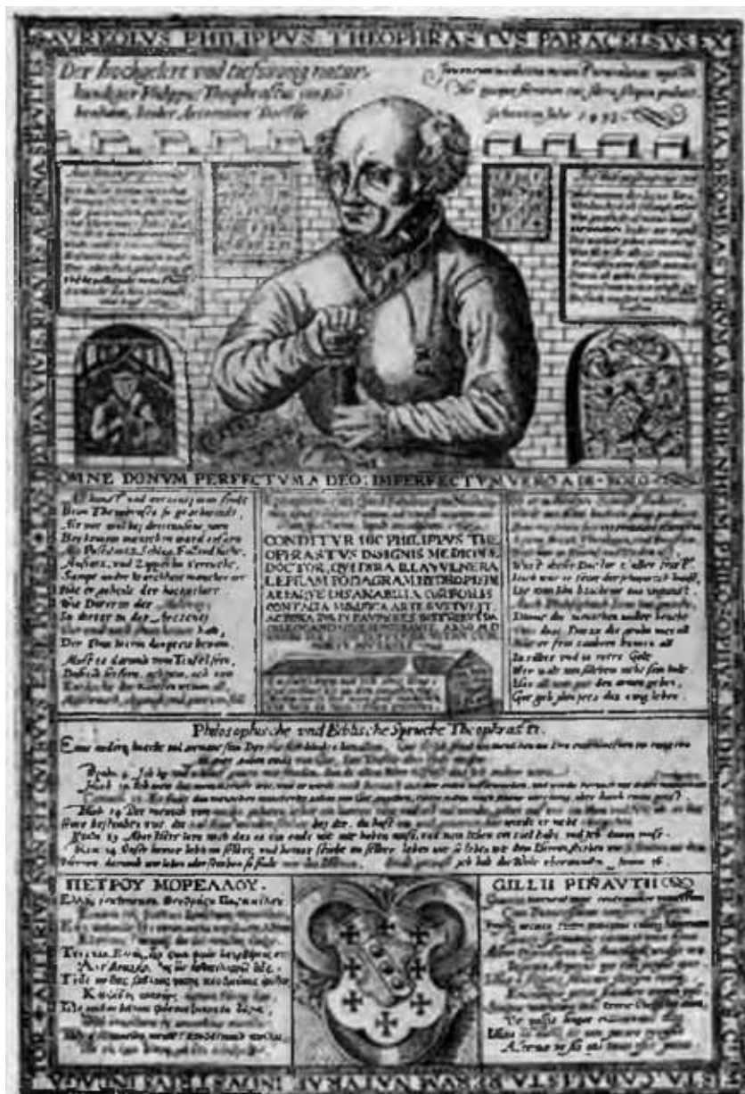
Листовка о Парацельсе с его портретом. С гравюры на меди XVI века.