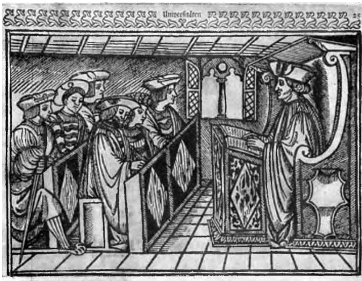
Университетский преподаватель с учениками. С гравюры на дереве 1523 г.