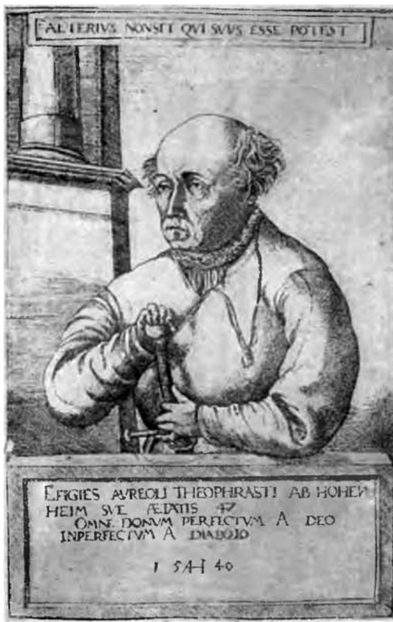
Портрет Парацельса за год до смерти. По рисунку Августина Гирцфогеля.