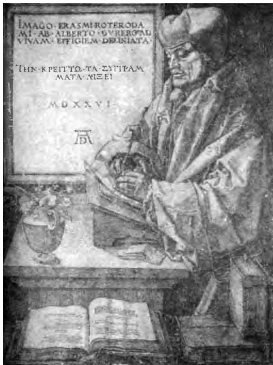
Эразм Роттердамский. С гравюры на меди Дюрера.