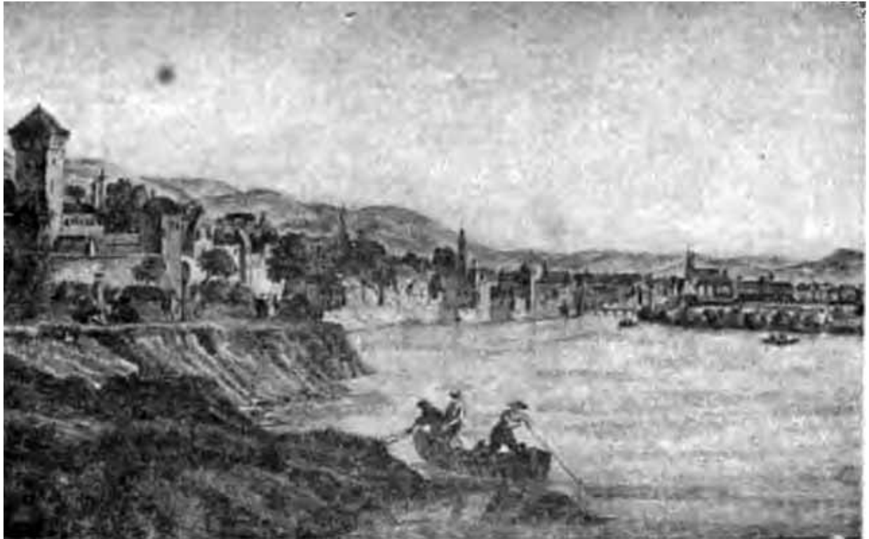
Вид города Базеля. С гравюры Лейцеля по рисунку Шерниньяна.