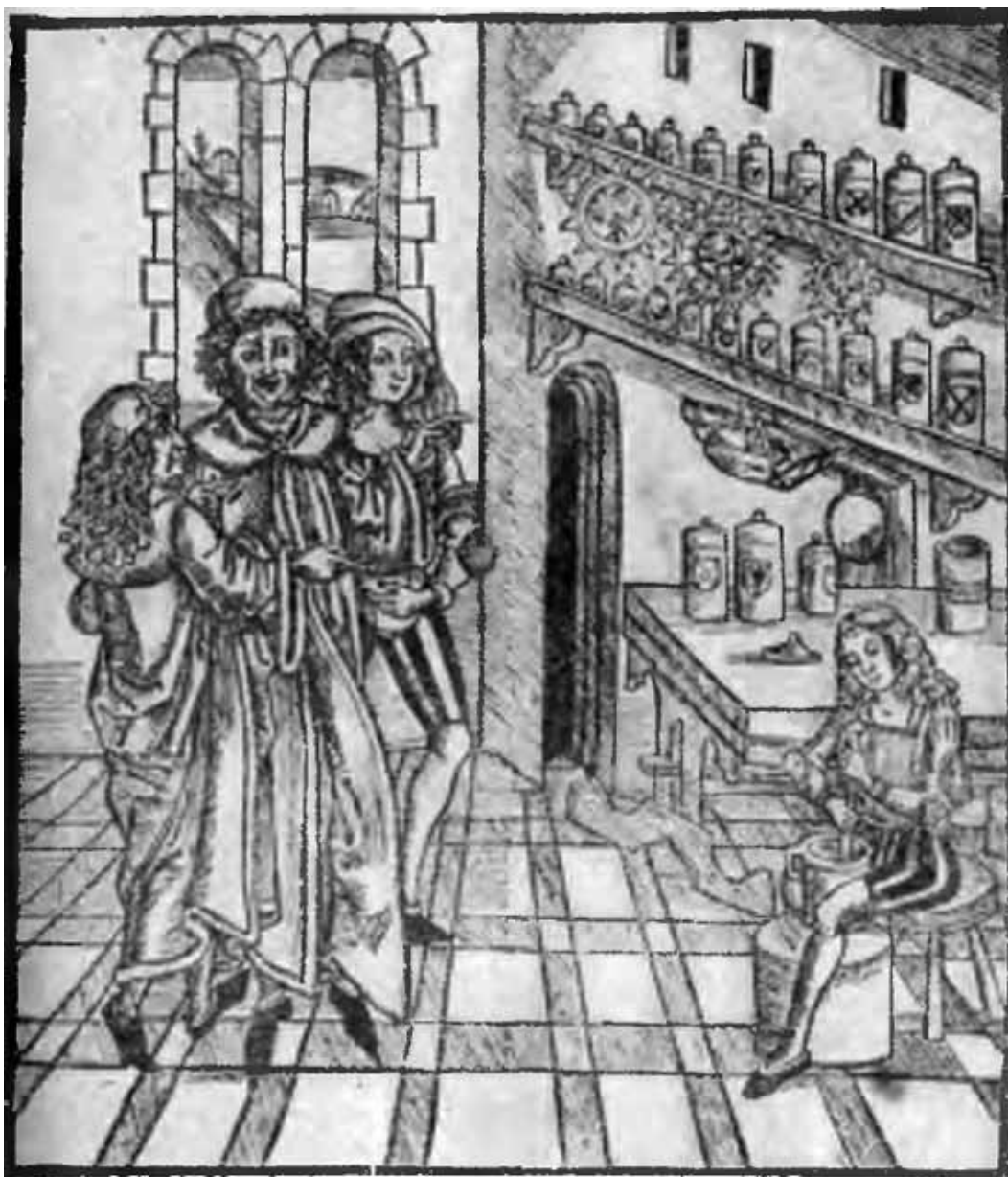
Аптека. С гравюры на дереве. 1497 г.