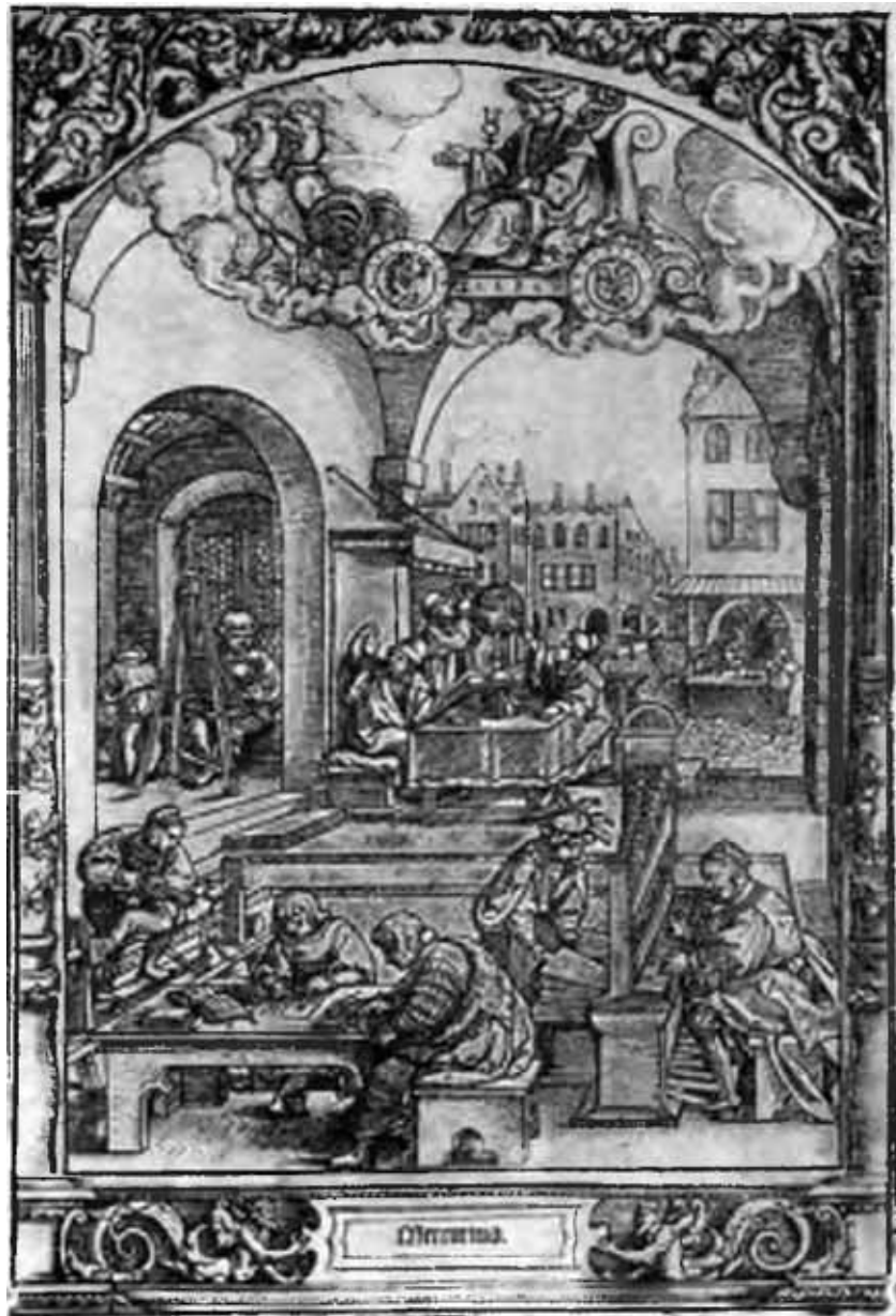
Городская жизнь Германии в первую половину XVI века. С гравюры на дереве Ганса Зебальда Бэгама.