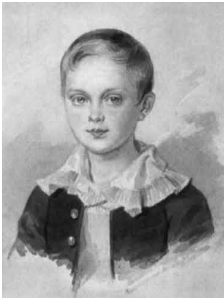
Цесаревич Александр Николаевич. Здесь и далее портреты П. Соколова из альбома императрицы Александры Федоровны (1828–1829 гг.).