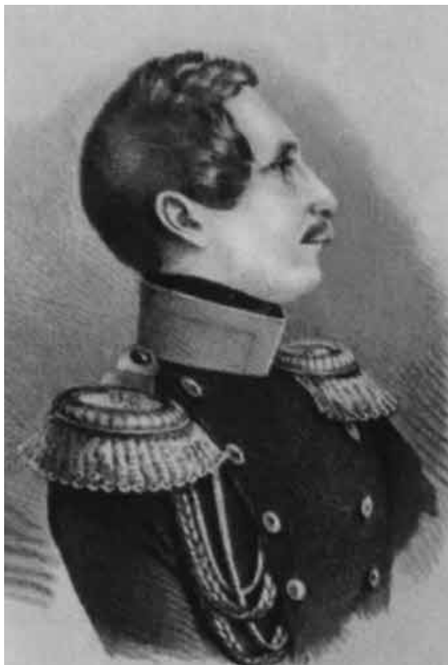
П. А. Клейнмихель.