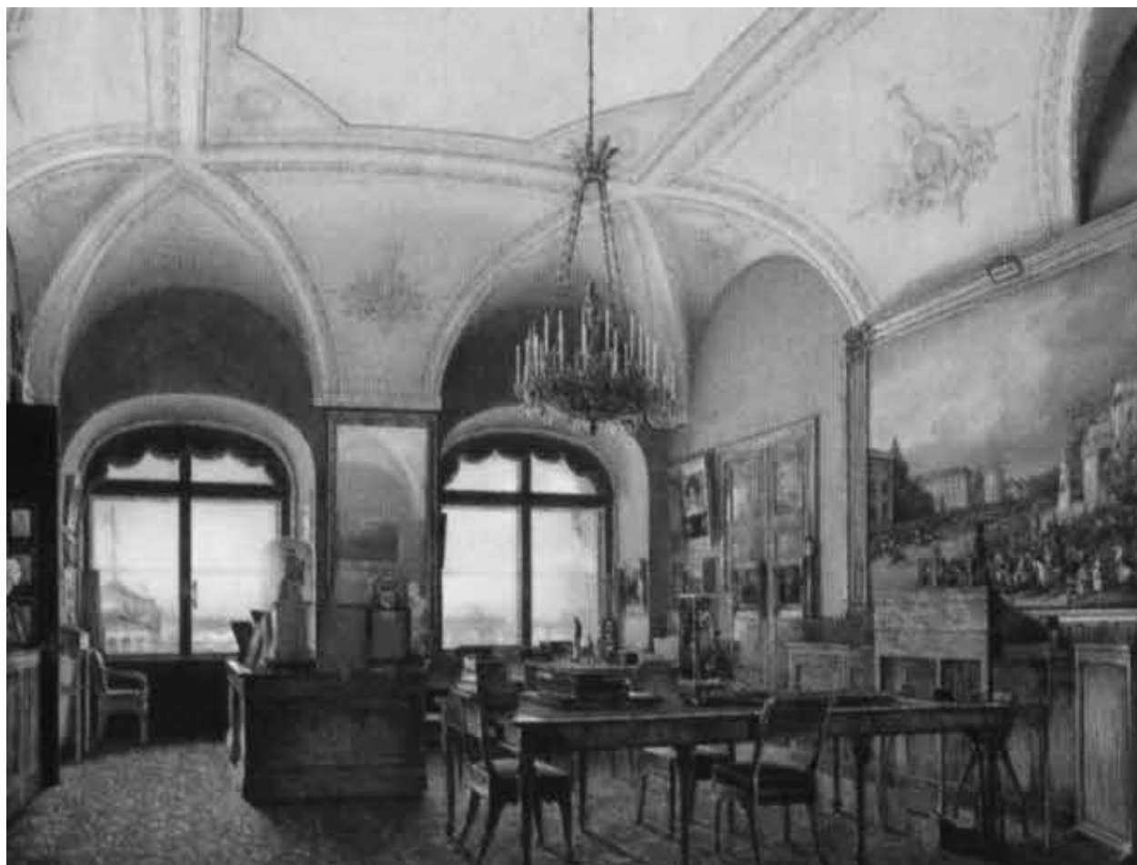
Кабинет Николая I на третьем этаже Зимнего дворца.