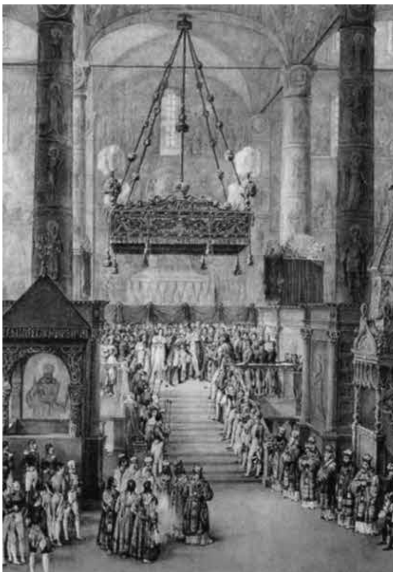
Коронация императора Николая I в Успенском соборе Московского Кремля 22 августа 1826 г. Гравюра из «Коронационного альбома». 1828 г.