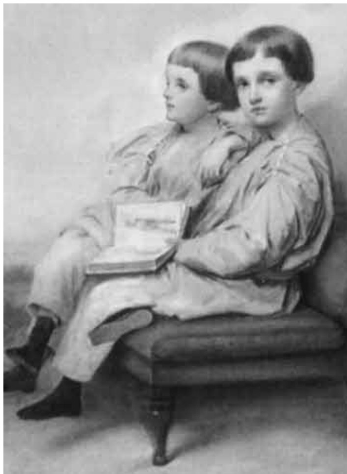
Великие князья Николай и Михаил Николаевичи.