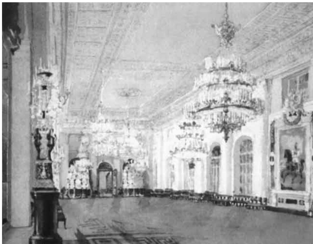
Николаевский зал Зимнего дворца.