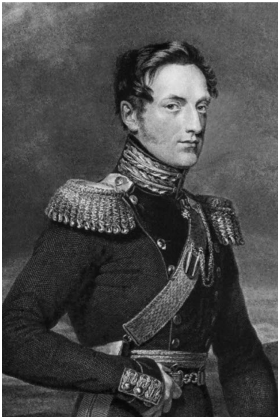
Император Николай I.