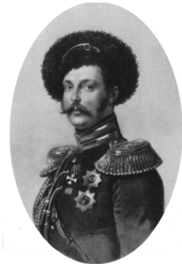
Великий князь Александр Николаевич.