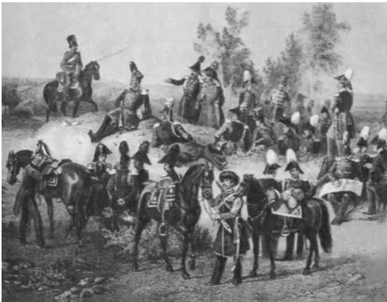
Император Николай I на бивуаке.