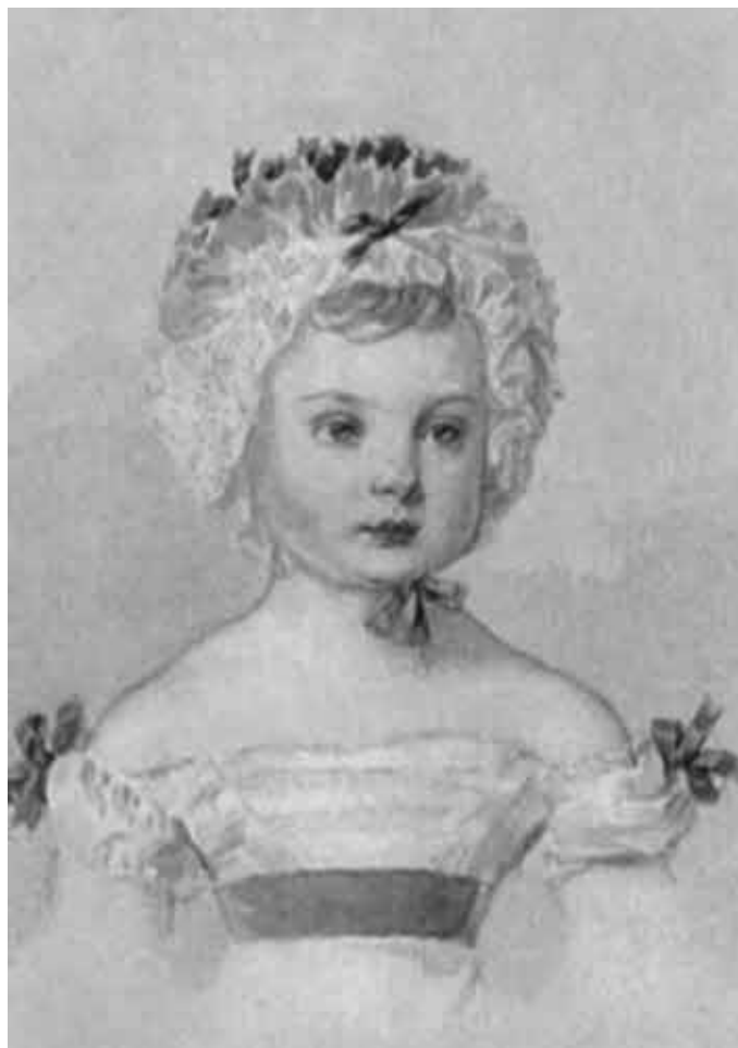
Великая княжна Александра Николаевна.