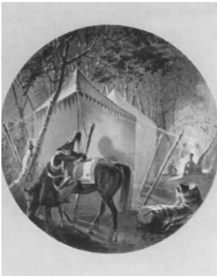
Палатка императора Николая I на маневрах под Кипенью.