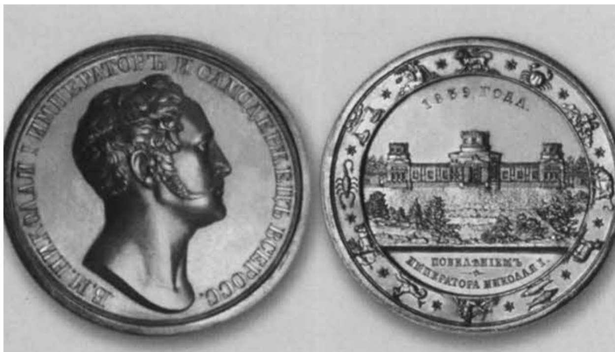
Медаль в честь основания Пулковской обсерватории. 1839 г.