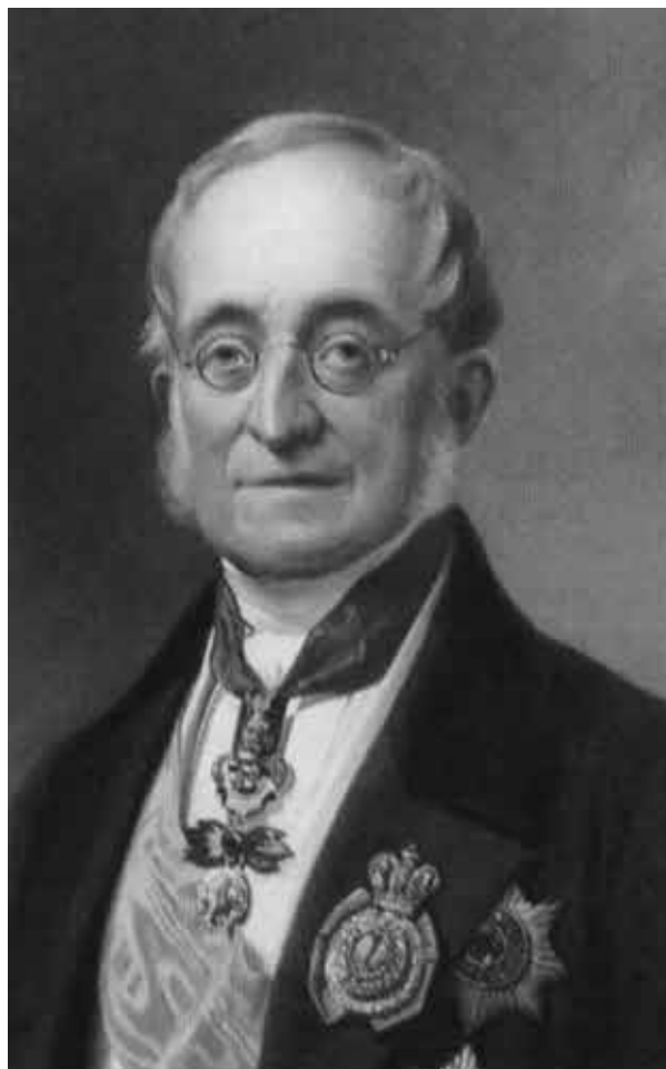
К. В. Нессельроде.