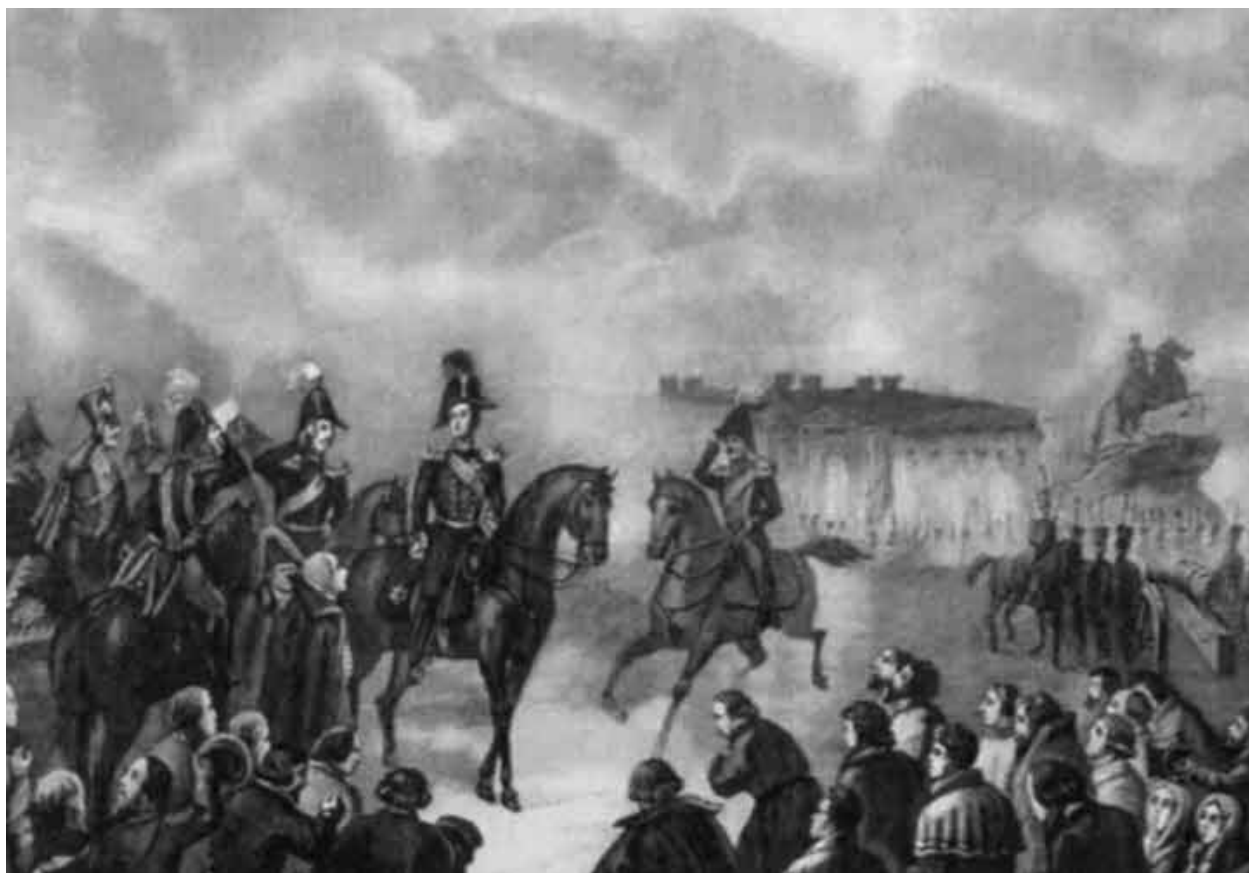
Император Николай I на Сенатской площади 14 декабря 1825 г. Литография Рябцова с рисунка В. Садовникова.