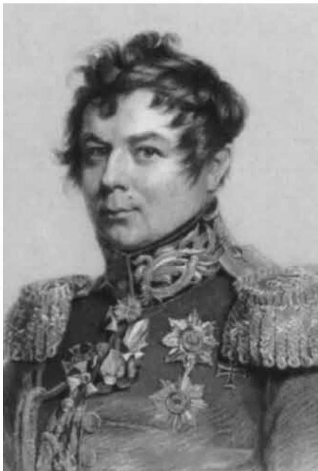
И. И. Дибич-Забалканский.