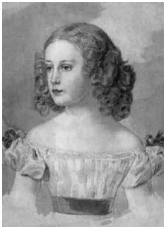
Великая княжна Мария Николаевна.