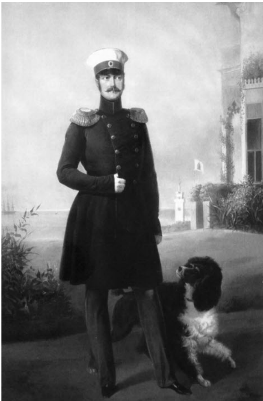
Император Николай I. Е. Ботман. 1849 г.