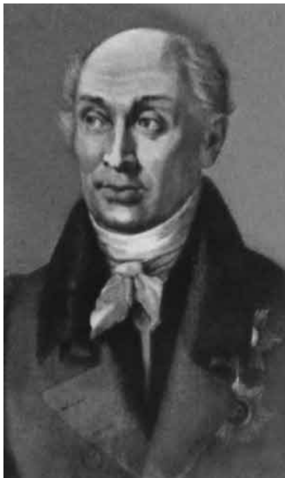
М. М. Сперанский.