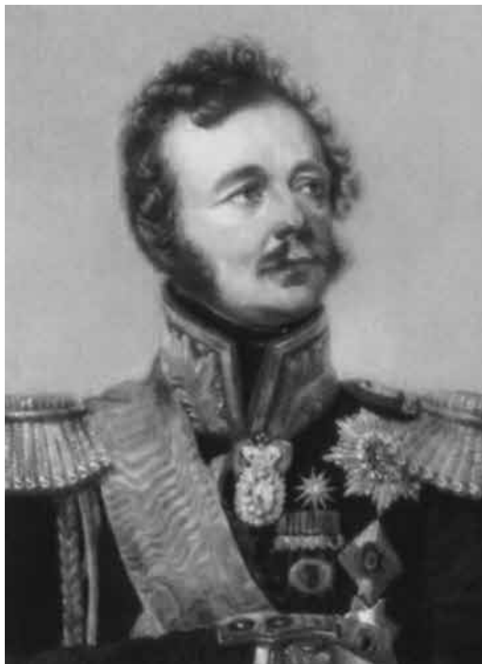
И. Ф. Паскевич-Эриванский.