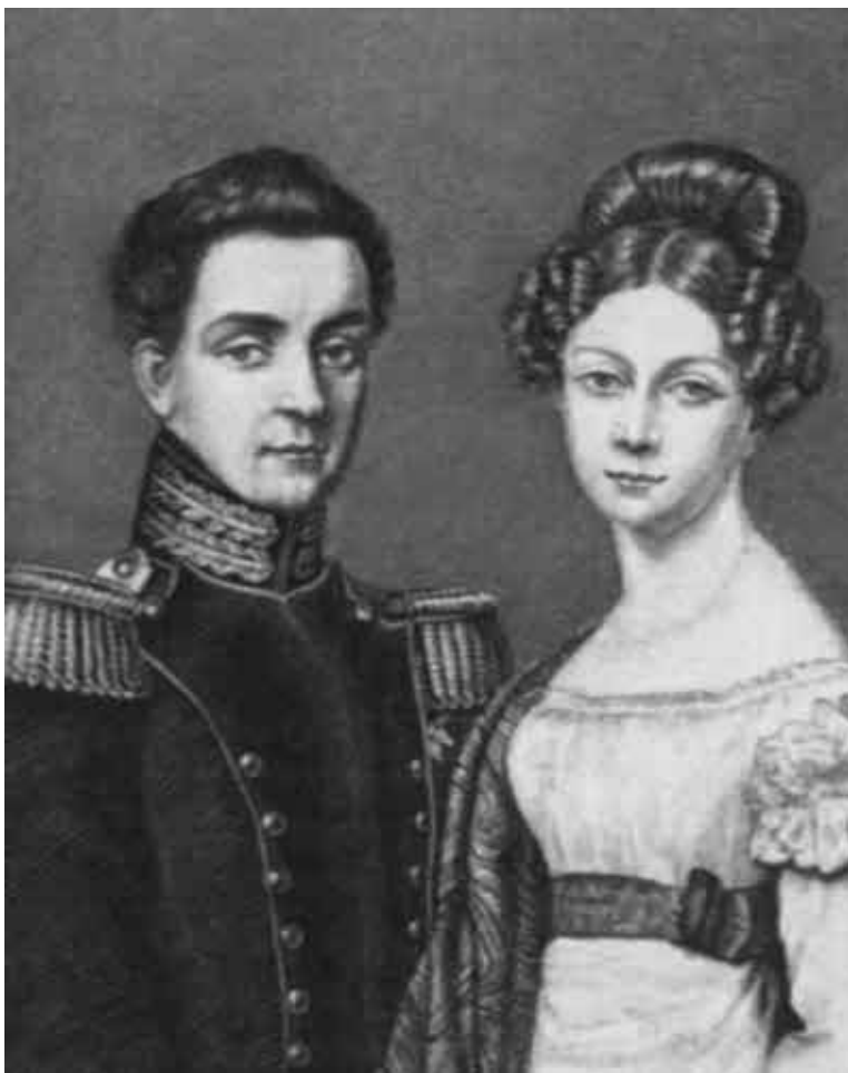
Великий князь Михаил Павлович и его супруга великая княгиня Елена Павловна. С портрета начала XIX в.