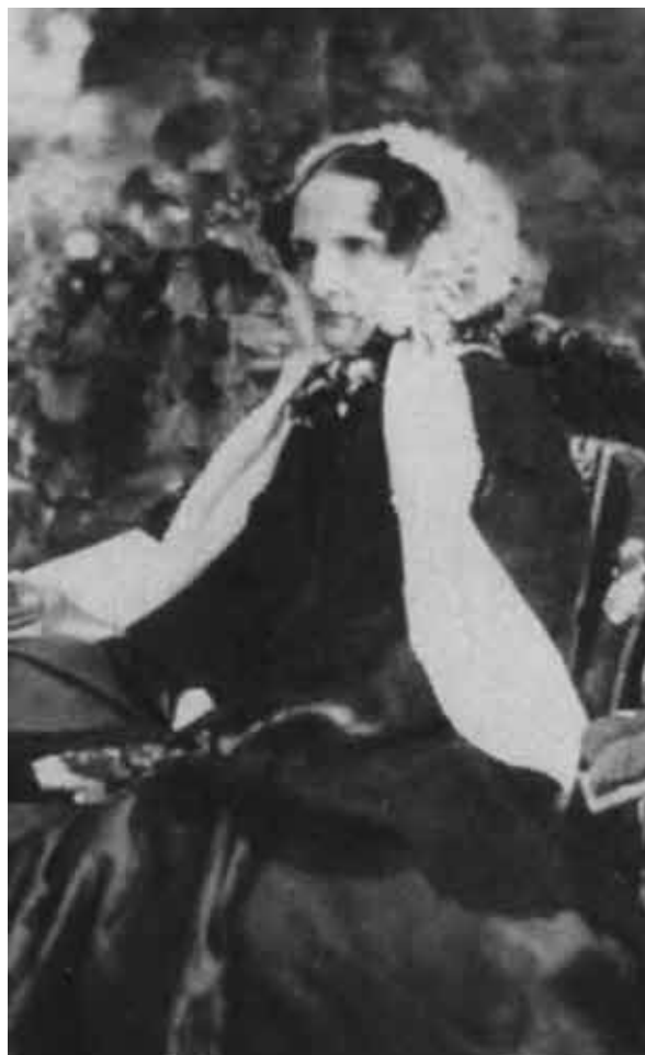
Императрица Александра Федоровна.