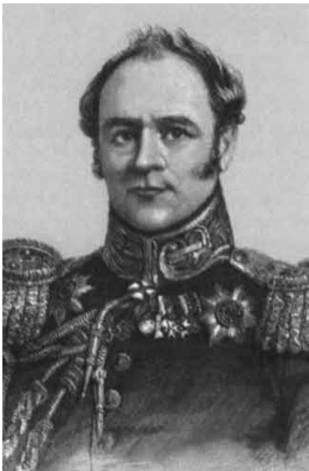
А. Х. Бенкендорф.