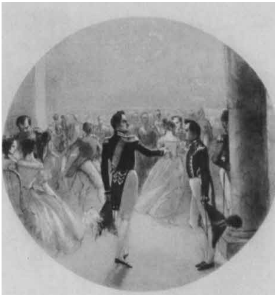
Николай I на балу в Зимнем дворце 6 декабря 1827 г.