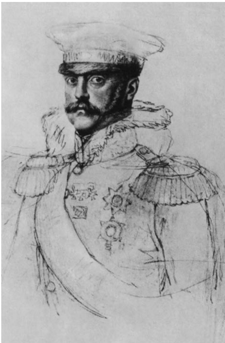
Император Николай I.