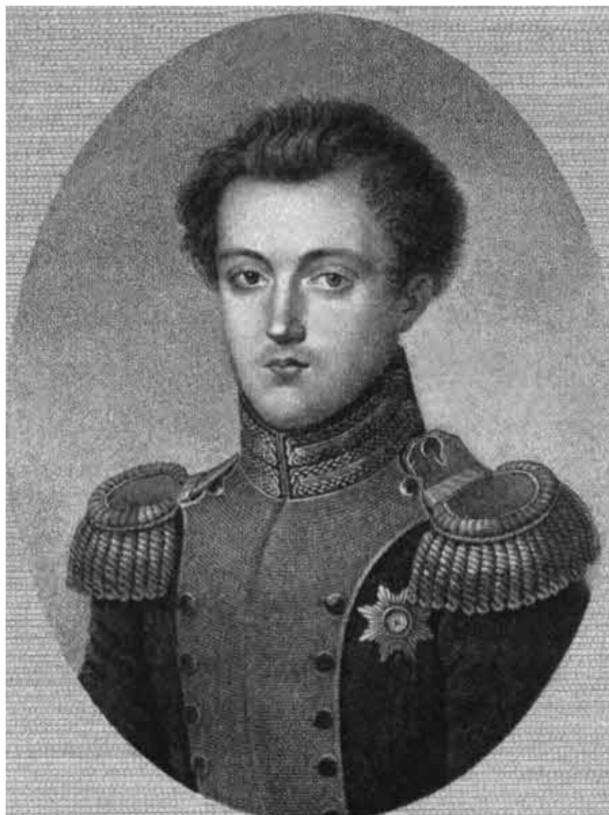
Великий князь Николай Павлович.