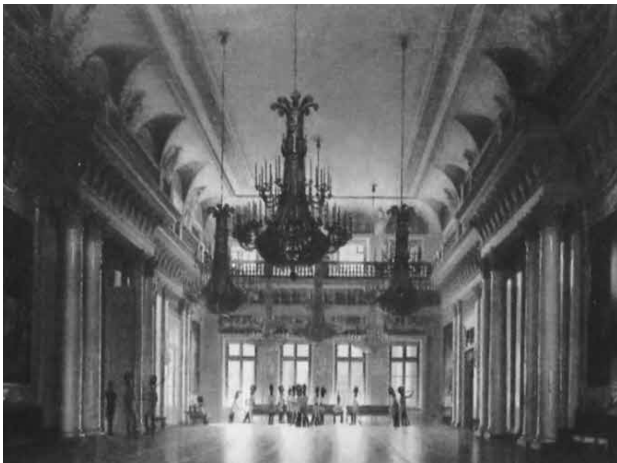
Фельдмаршальский зал Зимнего дворца.