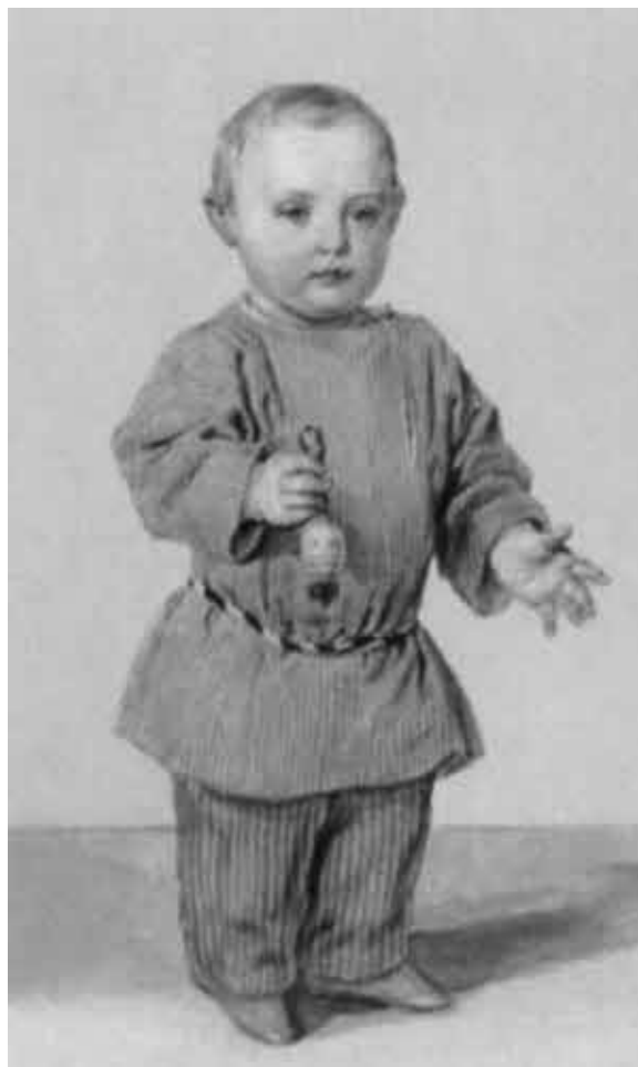
Великий князь Константин Николаевич.