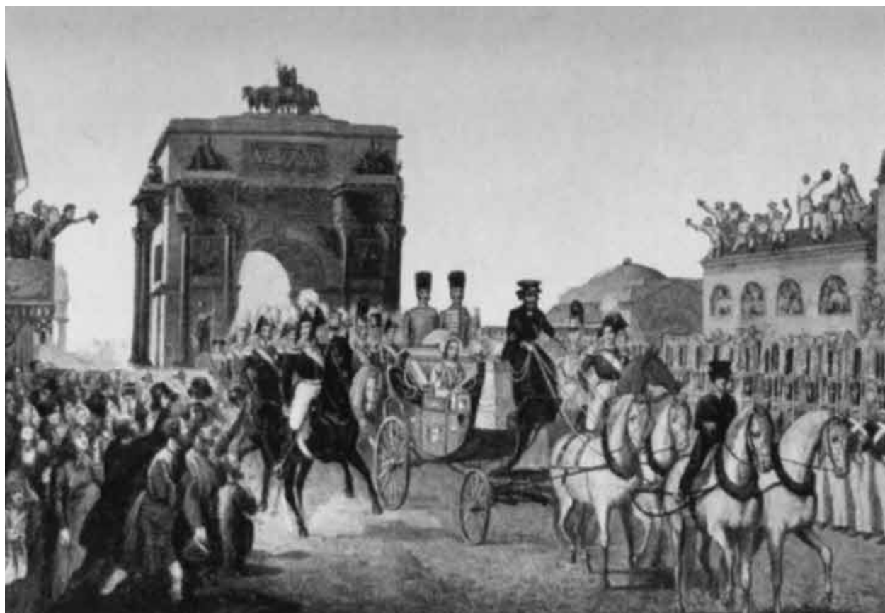
Въезд императора Николая Павловича и императрицы Александры Федоровны в Москву. Литография второй четверти XIX в.