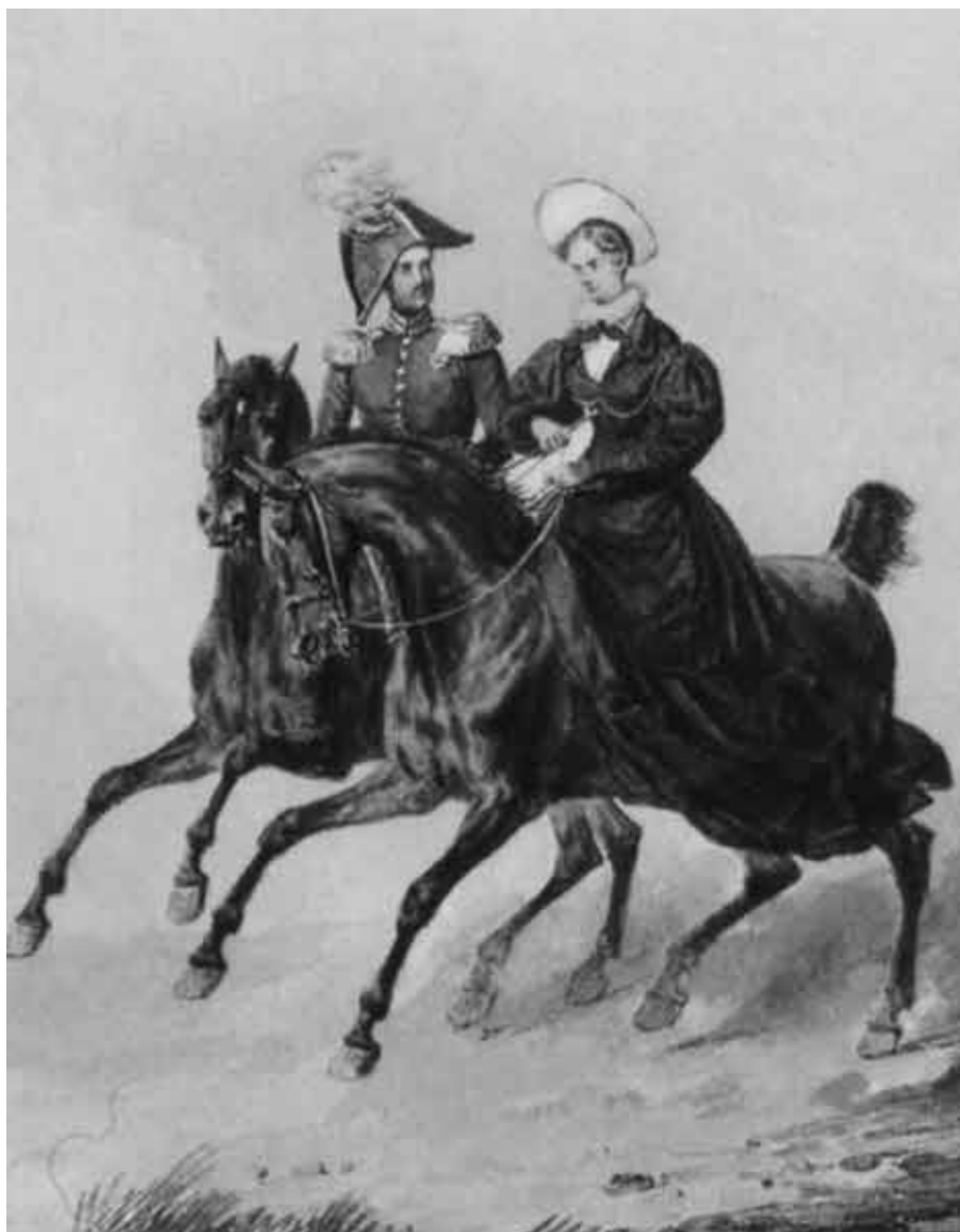
Императрица Александра Федоровна и император Николай Павлович на прогулке верхом. Ф. Крюгер. 1833 г.