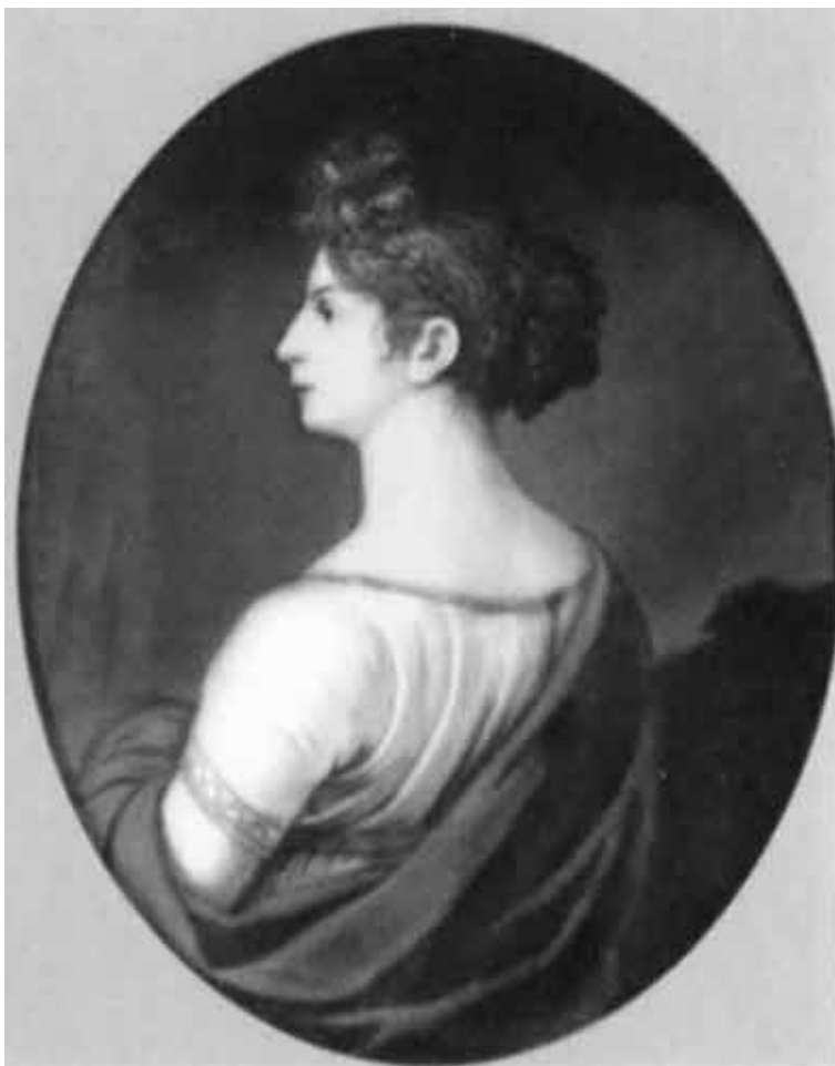
Прусская королева Луиза, мать императрицы Александры Федоровны.