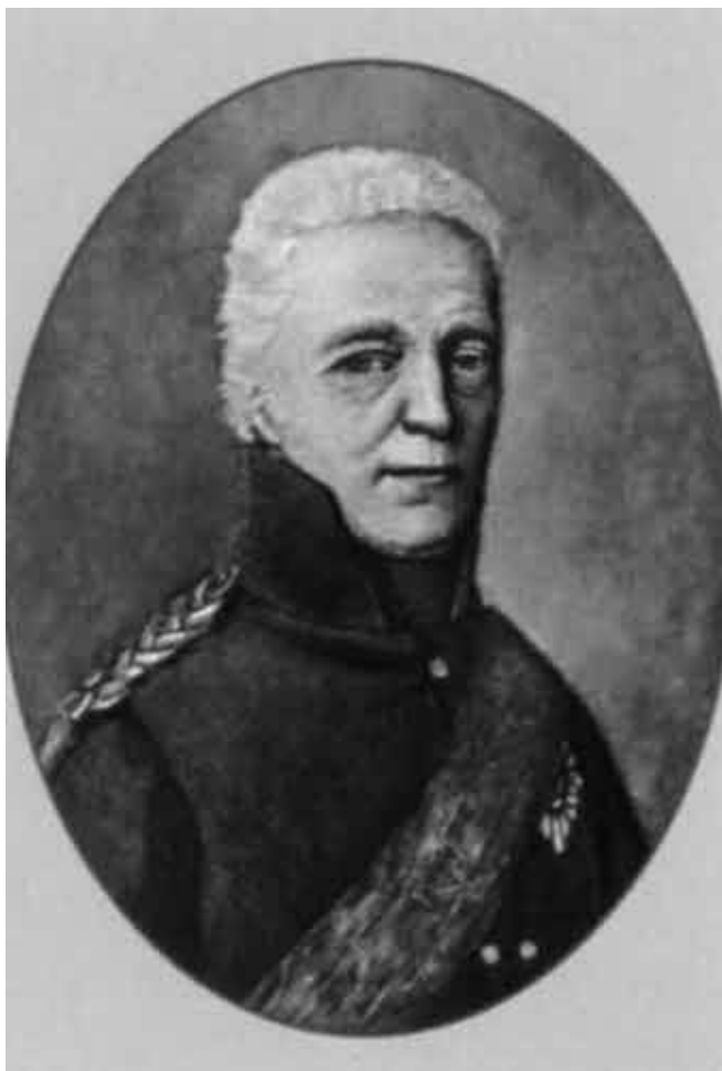
М. И. Ламздорф.