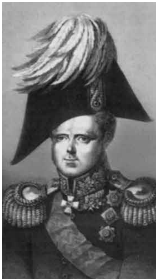
Цесаревич Константин Павлович.