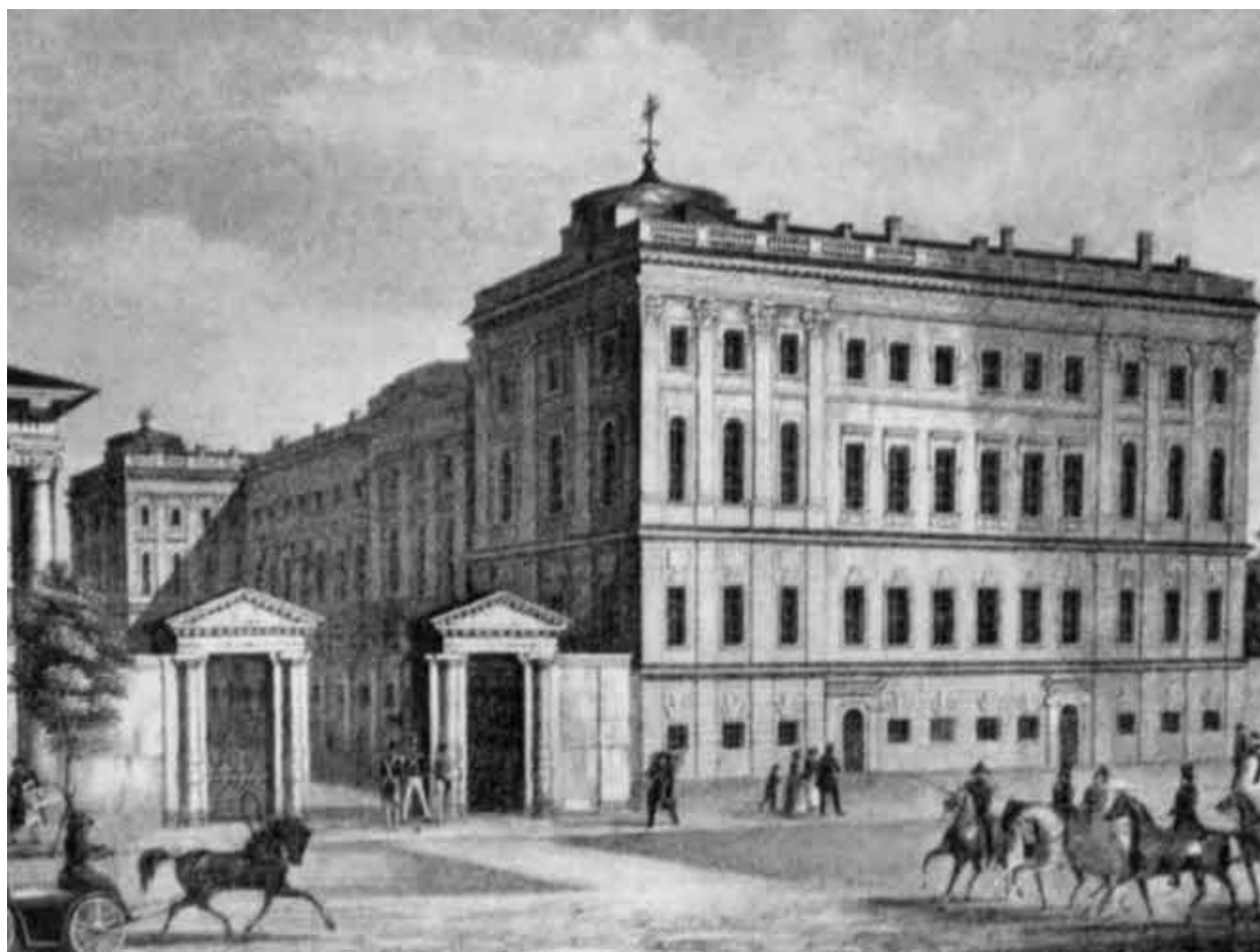
Аничков дворец в Петербурге.