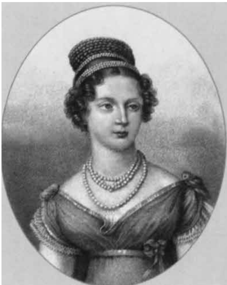
Великая княгиня Александра Федоровна.