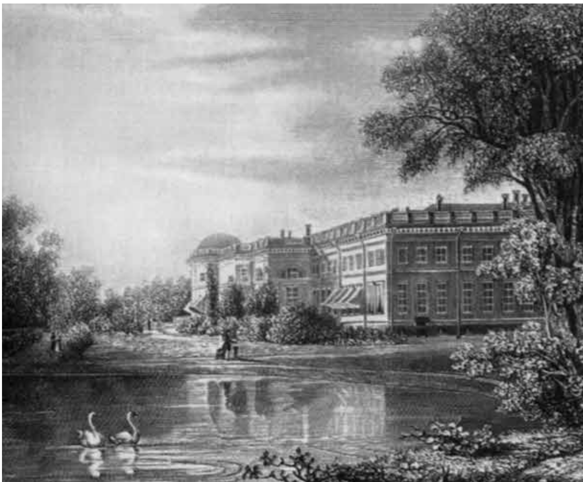
Александровский дворец в Царском Селе.