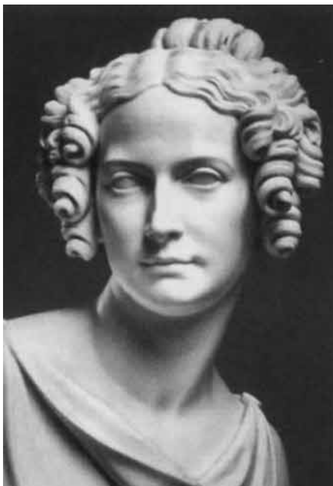
Портрет императрицы Александры Федоровны.