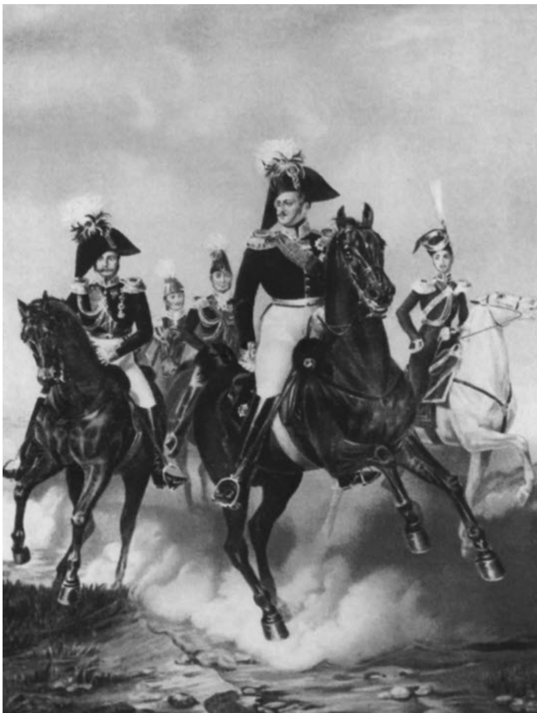
Император Николай I, великий князь Михаил Павлович, цесаревич Александр Николаевич, князь П. М. Волконский и граф А. Х. Бенкендорф. Портрет Ф. Крюгера.