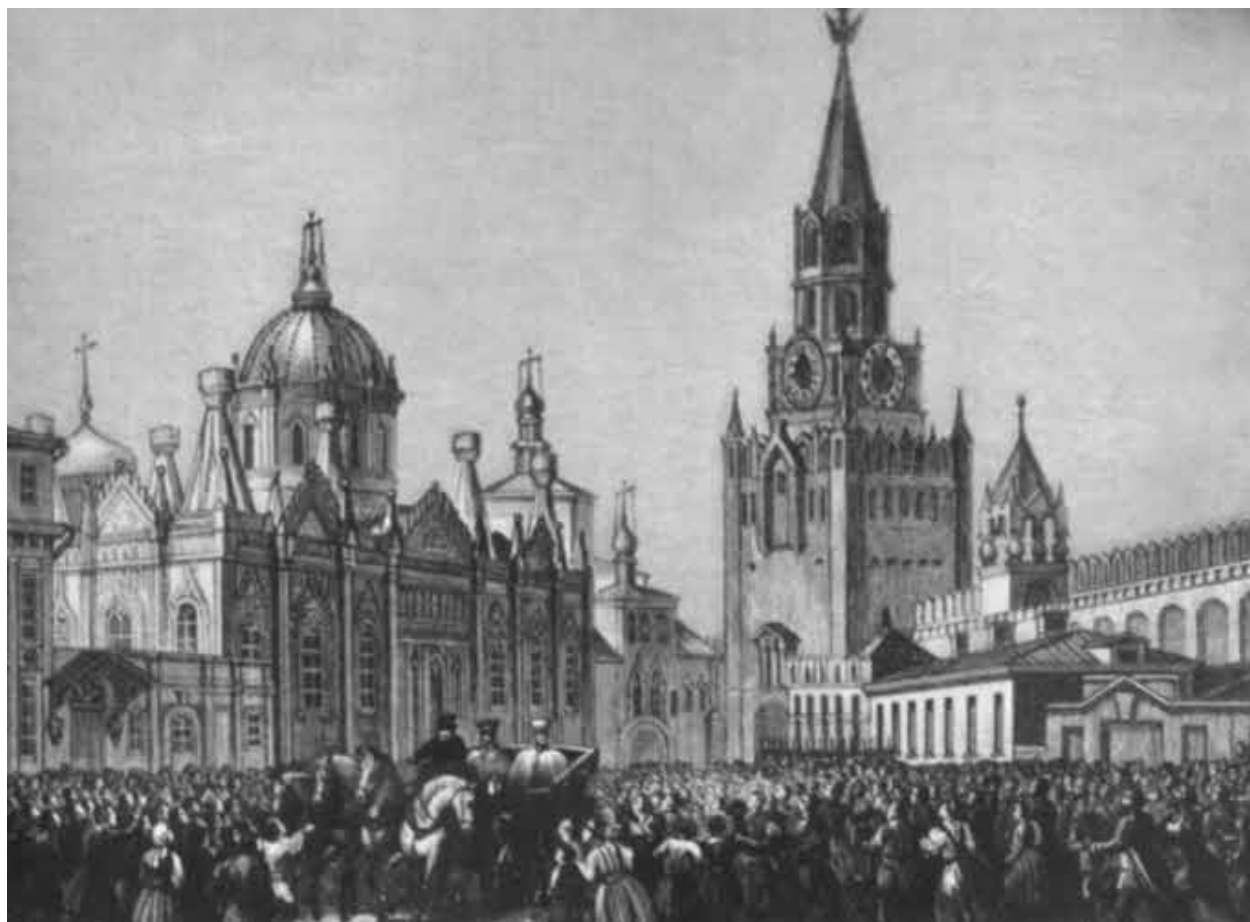
Въезд императора Николая I в Москву во время холеры 1831 г.