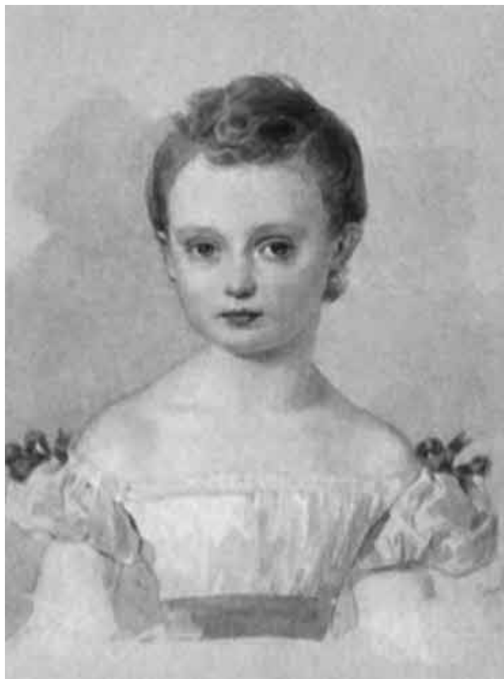
Великая княжна Ольга Николаевна.