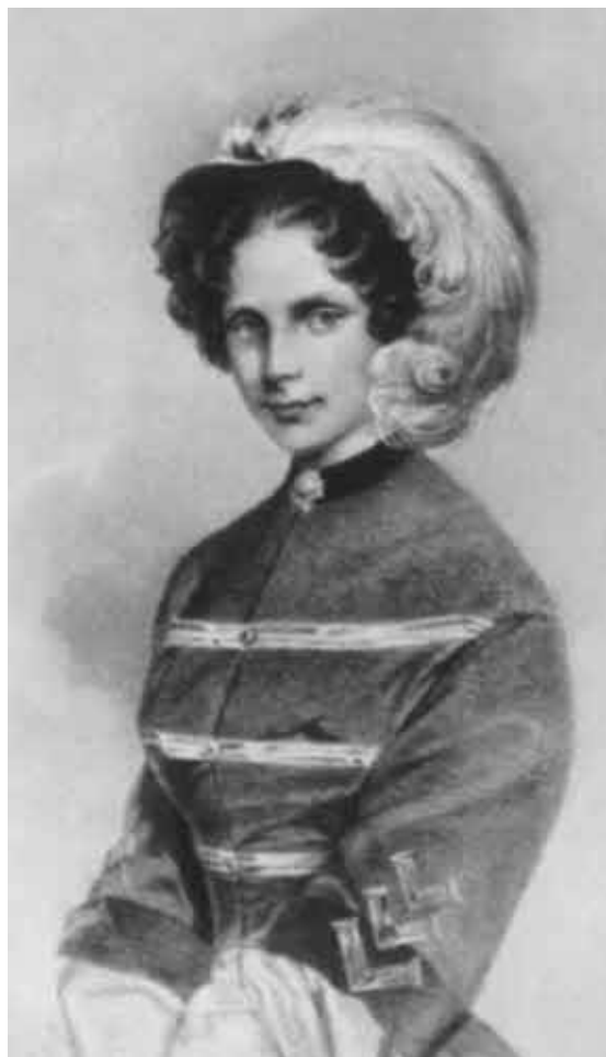
Императрица Александра Федоровна.