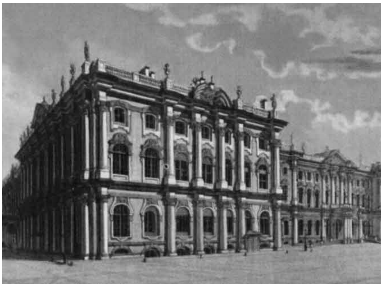
Зимний дворец в 1824 г.