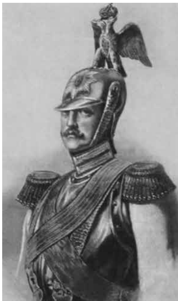
Император Николай I. Литография Шмидта.