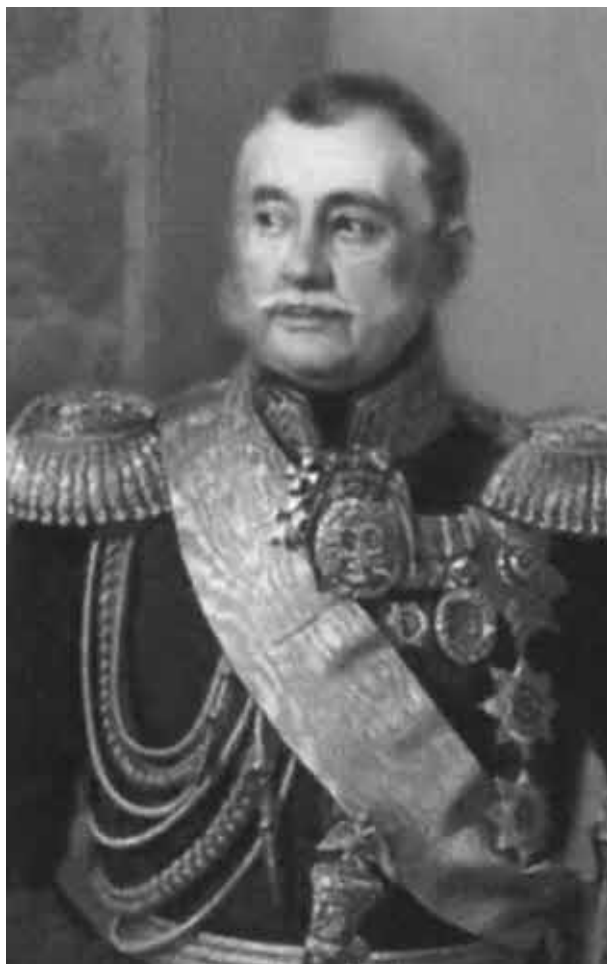
П. М. Волконский.