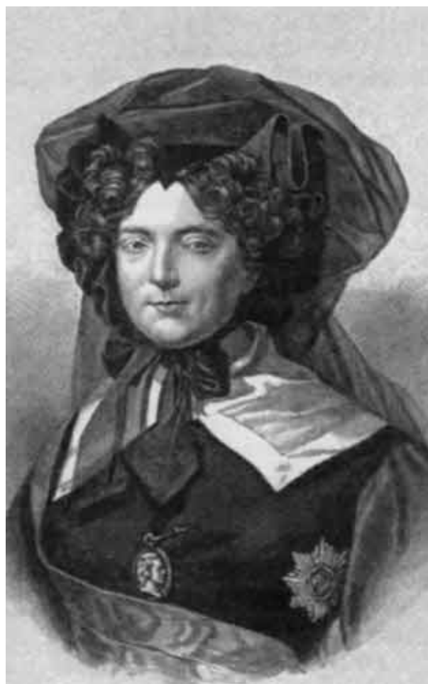
Императрица Мария Федоровна в трауре.