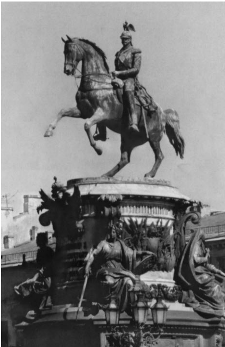
Памятник императору Николаю I на Исаакиевской площади в Санкт-Петербурге. Современное фото.