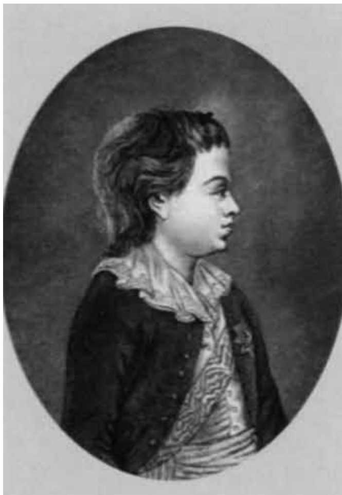
Великий князь Николай Павлович в детстве.