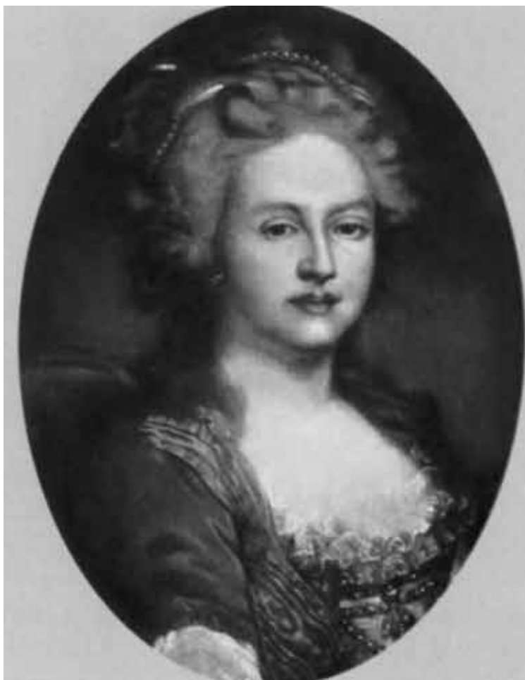
Императрица Мария Федоровна.