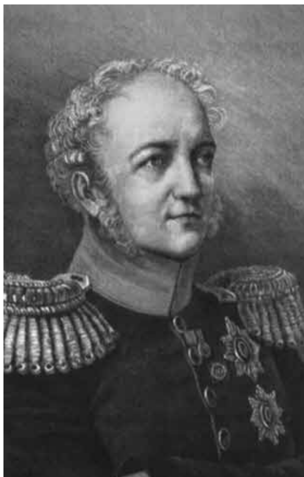
Е. Ф. Канкрин.