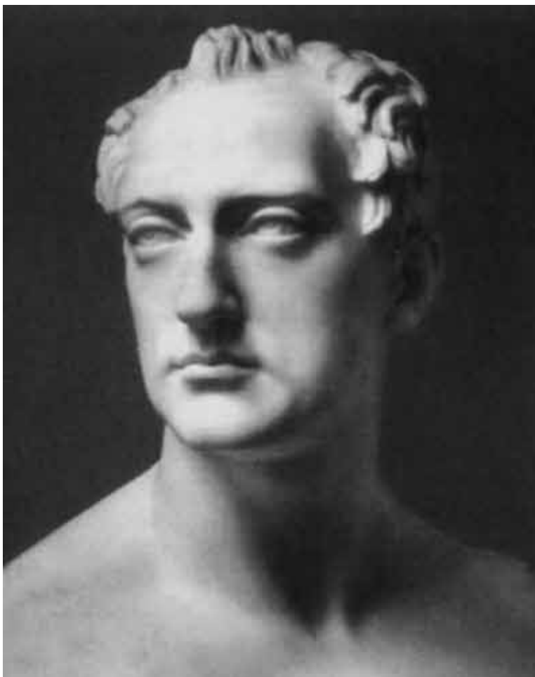
Портрет великого князя Николая Павловича.