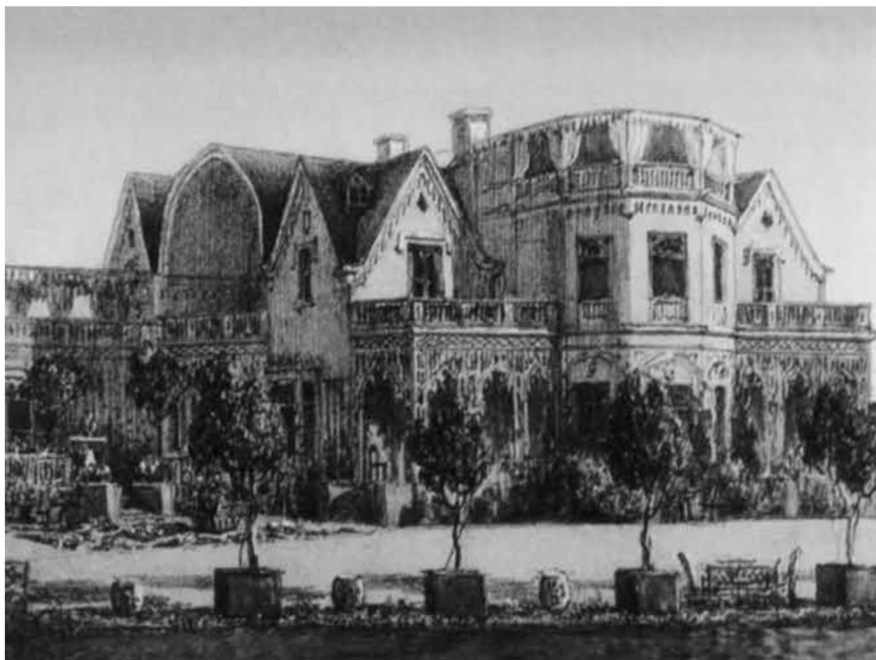
«Коттедж» в Петергофе. 1826–1829 гг.