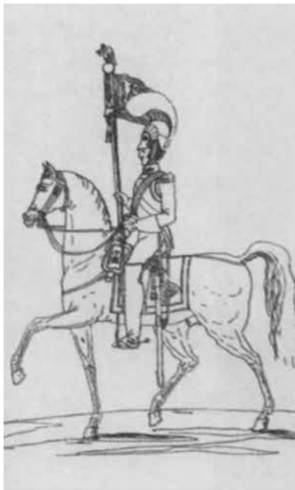
Офорт, сделанный императором Николаем I собственноручно.