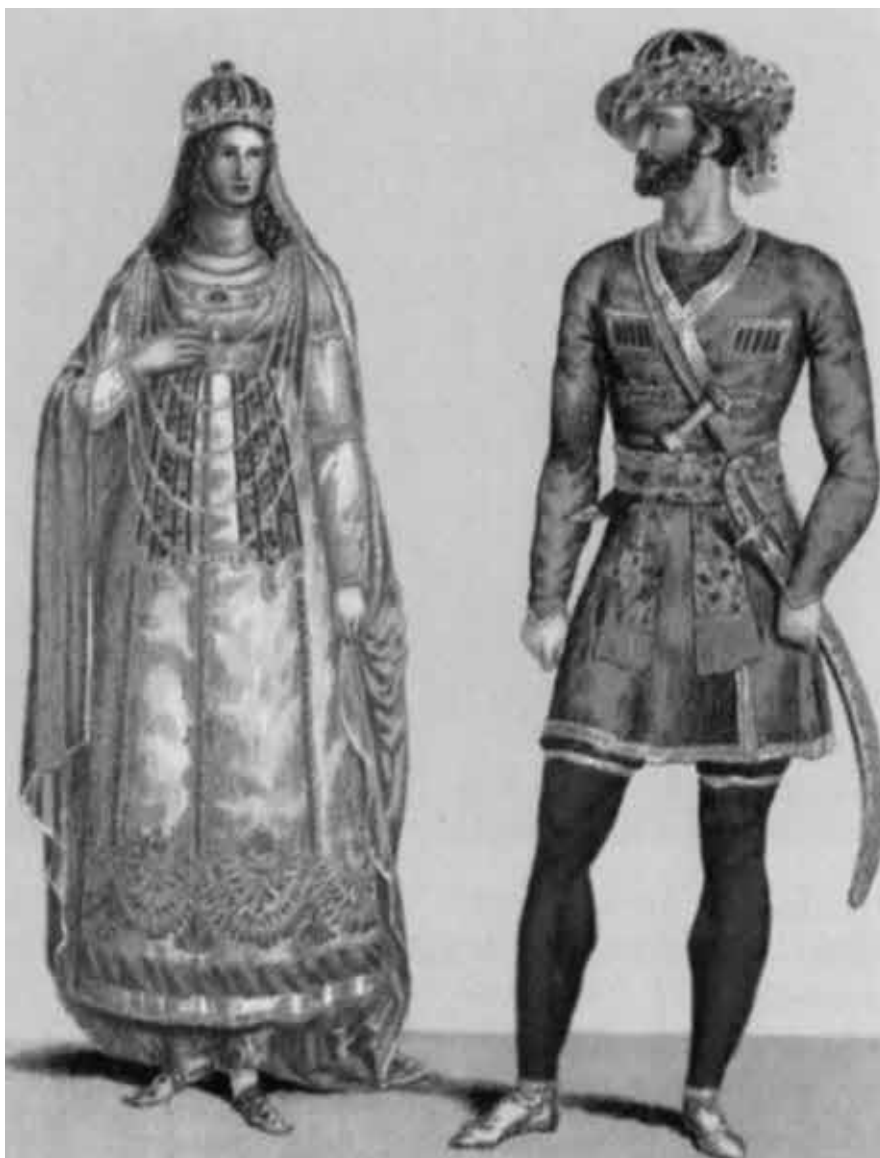
Великий князь Николай Павлович и великая княгиня Александра Федоровна в костюмах Алариса, принца Бухарского, и Лаллы-Рук.