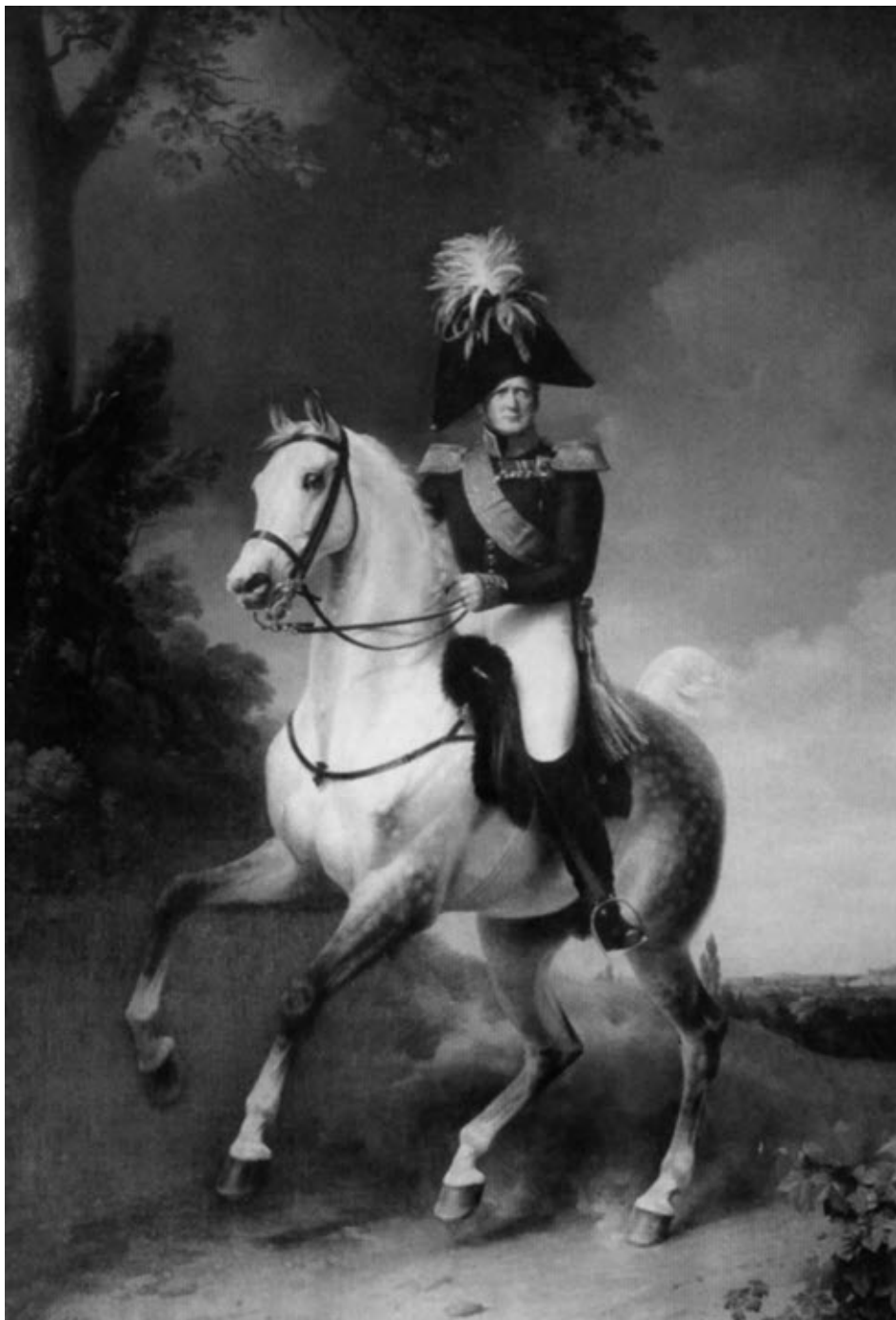
Император Александр I.