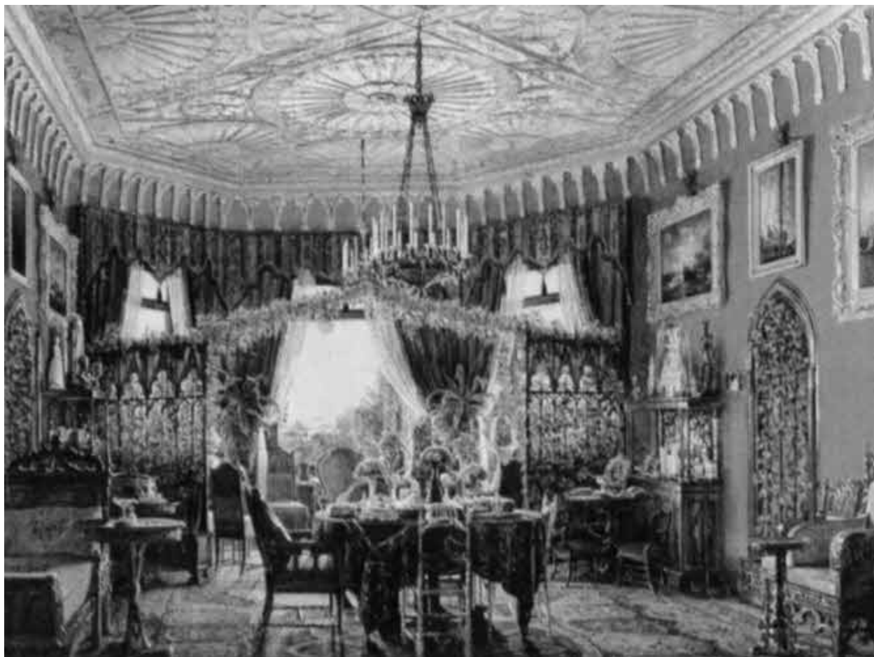
Гостиная императрицы Александры Федоровны в «Коттедже».