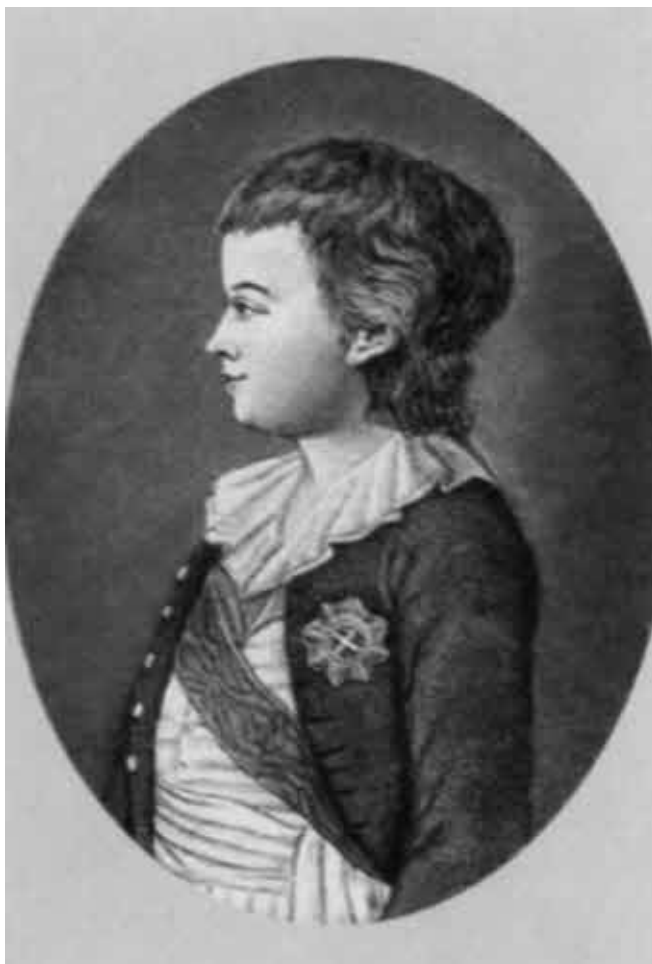
Великий князь Михаил Павлович в детстве.