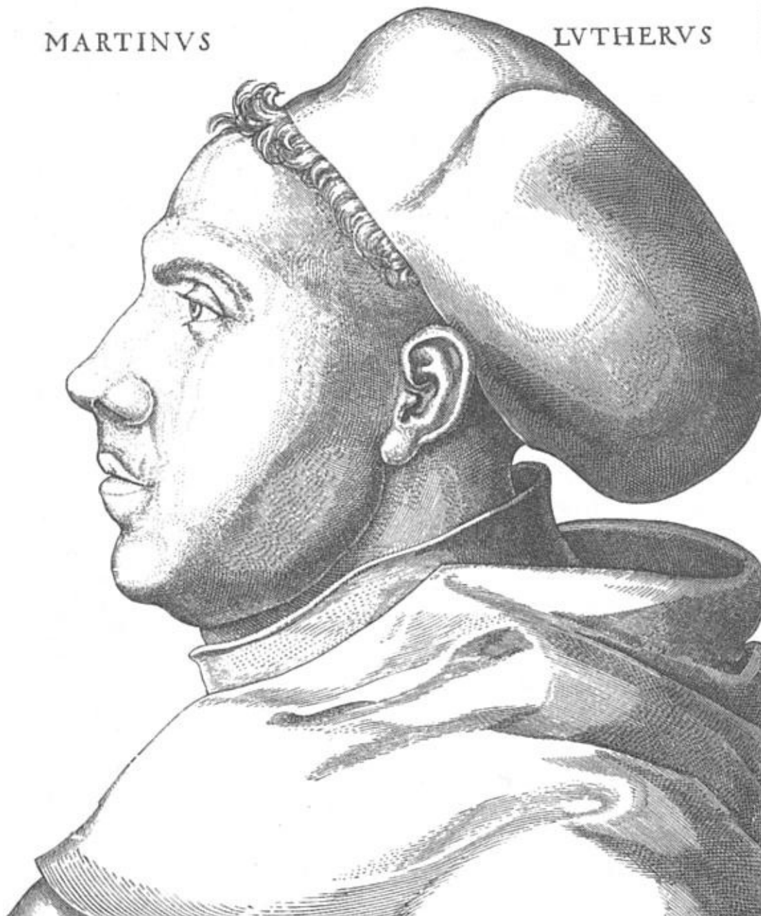
Мартин Лютер, 38 лет, в одежде августинского монаха. По гравюре Л. Кранаха, 1521 г.