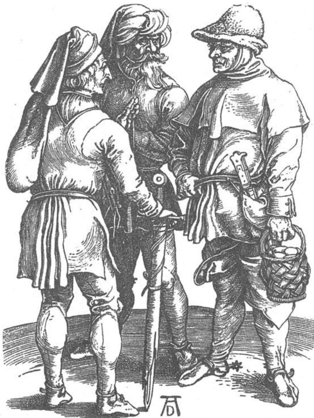
Трое крестьян начала XVI века. С гравюры Альбрехта Дюрера

Сначала восставшие ограничивались только демонстрациями, долженствовавшими подкрепить их требования, предлагали дворянам