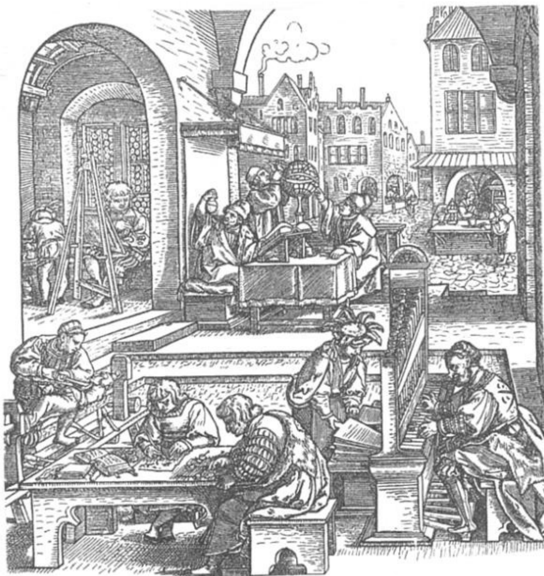
Городская жизнь в Германии в первой половине XVI в. Фрагмент гравюры Ганса Зебальда Бэгама

Результаты этой системы более или менее известны. Продажа должностей повлекла за собой порчу высшей иерархии. Обязанные своим назначением не личным достоинствам, а большей или меньшей сумме, внесенной в папскую канцелярию, высшие духовные лица мало заботились о духовных нуждах паствы и преследовали свои личные мирские цели. С высшего духовенства деморализация вскоре перешла на низшее, и в особенности на монашество. Образование, которым в средние века отличалось духовенство, почти совершенно исчезло из этого сословия.