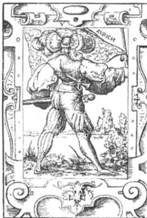
Из времен битв при Каппеле: “Швейцарские кантонов Швиц, Ури, Унтервальден и Цюрих” (гравюра Виргилия Солиса)