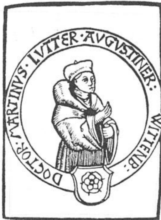
Доктор Мартинус Лютер, августинец. Старейшее из известных

Через год его постригли под именем брата Августина. Теперь он достиг цели. Среди обычных поздравлений ему говорили, что теперь он чист, как дитя, только что вышедшее из купели. И Лютер старался верить этому: ведь он исполнял закон с величайшей строгостью, а сколько тысяч людей обрели душевный покой в этом сознании!