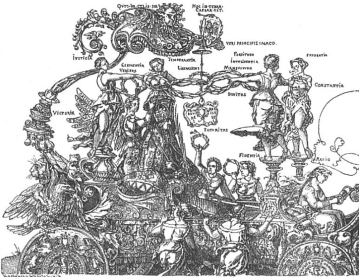
Император Максимилиан на триумфальной колеснице, увенчиваемый олицетворениями добродетелей

Каетан решил быть с ним как можно более мягким и, когда Лютер явился в Аугсбург, принял его весьма ласково и отечески увещевал отречься от своих заблуждений. Но на Лютера эта любезность мало подействовала. Он рассчитывал, что будет иметь возможность открыто защищать свои взгляды, готовился даже положить за них голову. Но вышло совсем не то. Правда, при втором свидании кардинал, видя, что Лютер не поддается, удостоил даже вступить с ним в спор и стал доказывать ошибочность его взглядов. Но точки зрения обоих людей были слишком различны, чтобы они могли понять друг друга. Один ссылался на учение Фомы и папские буллы, другой требовал доказательств из Св. Писания. Наконец Каетан потерял терпение и оборвал спор лаконическим возгласом: “Revoca! revoca (отрекись)!” Лютер, в пылу спора, также утратил свою сдержанность и высказал противнику несколько горьких истин. Тогда