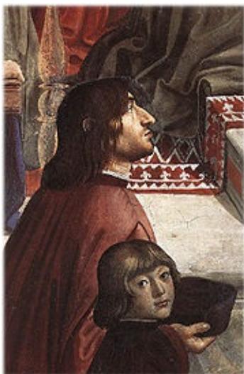
Доменико Гирландайо "Анджело Полициано с сыном Лоренцо Медичи Пьеро"

Мне кажется, у него немножко болит язык, а не горло, потому-то он и не сосет. Наверное, побаливает у него и шейка — вот отчего ему трудно поворачивать головку. Но в нем нисколько не заметно слабости, и почти никогда не заметно, что ему больно — только когда он сосет, как я уже писал Вам».