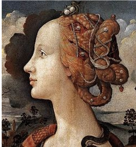
Пьеро ди Козимо. «Портрет Симонетты Веспуччи» (фрагмент).

Этого было достаточно для слухов, будто она любовница младшего Медичи. Симонетта и Джулиано были ровесниками. Она родилась в Генуе в патрицианской семье, а в 1468 году замужество ввело ее в круг приближенных Медичи.