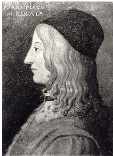
Джованни Пико делла Мирандола

В 1484 году в ближайшем окружении Медичи появился молодой человек из очень знатной семьи: граф Джованни Пико делла Мирандола, двадцати одного года от роду, тоже наделенный поэтическим даром. Вскоре он стал другом Полициано и поэта Джироламо Бенивьени. Пико, ученик лучших гуманистов, воспитанный на философии Аристотеля, не замедлил приступить к критике «Платонова богословия» Фичино, хотя и с ним был связан самой искренней дружбой. Позиция Пико, основанная на доводах, подкреплённых многочисленными примерами, ничуть не вредила ему, а, напротив, возбуждала всеобщее восхищение.