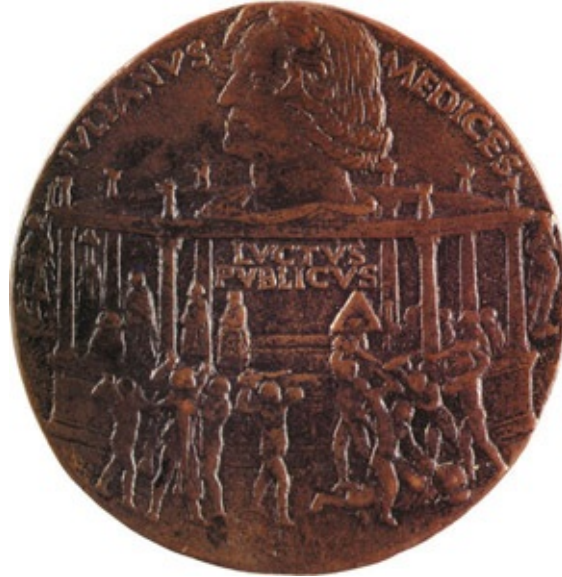
Оборотная сторона медали с профилем Джулиано Медичи, где изображено убийство

краской в телесный цвет. Сходство получилось поразительное. Одну из этих фигур в той самой одежде, что была на Лоренцо в соборе во время покушения, выставили у августинцев на улице Сан-Галло, другую, в «лукко», длинном плаще высокопоставленных флорентийцев, — в церкви Благовещения, третью — в Санта-Мария дельи Анджели.