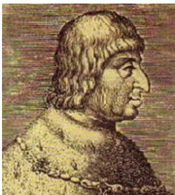
Фернандо I (Фердинанд I )Неаполитанский

18 декабря Лоренцо сошел на берег в Неаполе. Его приняли чрезвычайно пышно. В гавани ждали младший сын и внук короля. На другой день сам Фердинанд явился к нему, любезнейшим образом приветствовал и проводил к себе во дворец. 20 декабря начались переговоры с четырьмя королевскими советниками, среди которых были могущественный секретарь Антонелло Петруччи и Антонио Чичинелло, специальный уполномоченный по сношениям с Римом. Споры шли жаркие: добиться мира оказалось гораздо сложнее, чем думал Лоренцо, основываясь на сведениях из Милана.