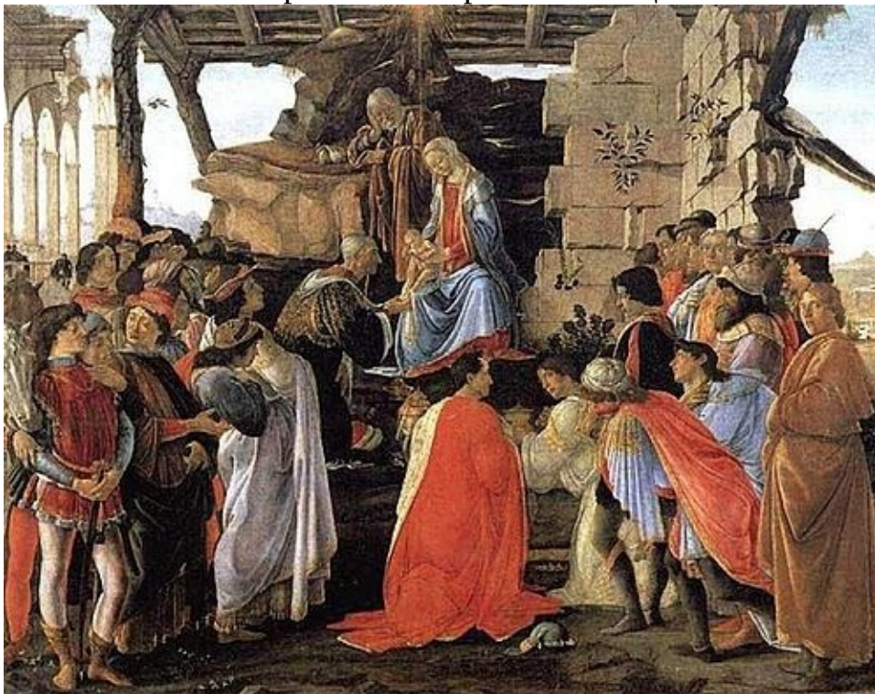
Сандро Боттичелли. «Поклонение волхвов»

Лоренцо здесь изображен на первом плане слева как молодой рыцарь в короткой красно-голубой тунике, горделиво опирающийся на меч. Два персонажа смотрят прямо на зрителя: рядом с Джулиано — заказчик, указывающий на самого себя пальцем, а на переднем плане справа сам белокурый Боттичелли в коричневатом-красном плаще.