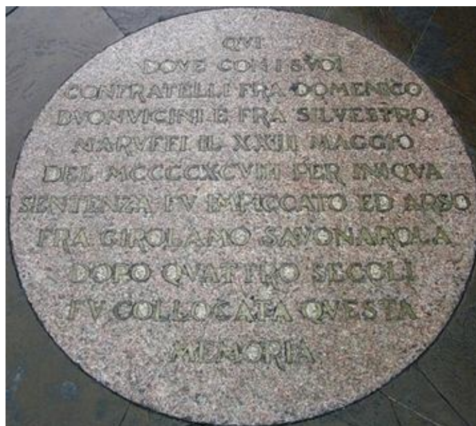
Место публичной казни Сарвонароллы

Трагическая развязка не привела к изменению направления политики. Интриги Пьеро Медичи полностью дискредитировали его в глазах флорентийцев. Назад его не позвали. Сменявшие друг друга синьории были поглощены треволнениями итальянских войн, которые французский король Людовик XII возобновил под предлогом наследственных прав Орлеанского дома на Ломбардию. Флорентийским грандам, в том числе пожизненному гонфалоньеру Пьеро Содерини, удалось сохранить международный престиж республики, да и сама она окрепла, а новые институты заработали.