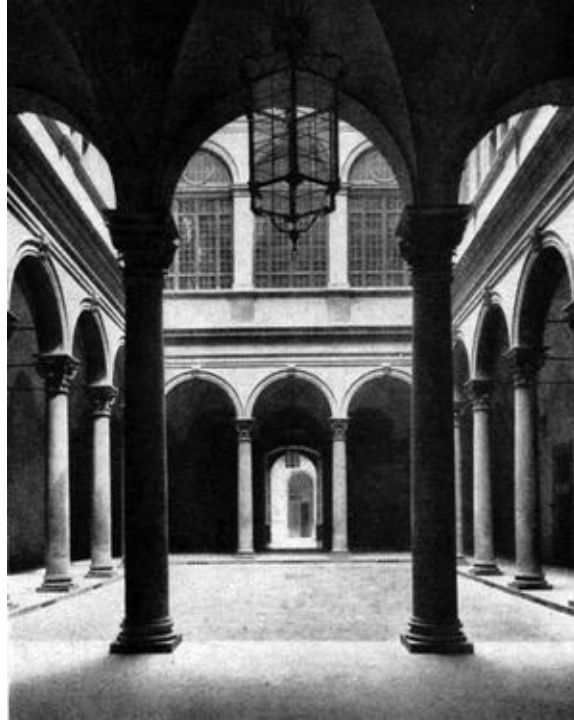
Бенедетто да Майяно. Палаццо Строчи во Флоренции. Внутренний двор.

Очевидно, именно к этому времени относится созданный им бюст Лоренцо Медичи, хранящийся в Праге. Эта малоизвестная скульптура — один из самых живых портретов Лоренцо: некрасивое лицо с большим носом уточкой и тяжелым подбородком, но легкая улыбка губ и глаз отражает ум и доброту.