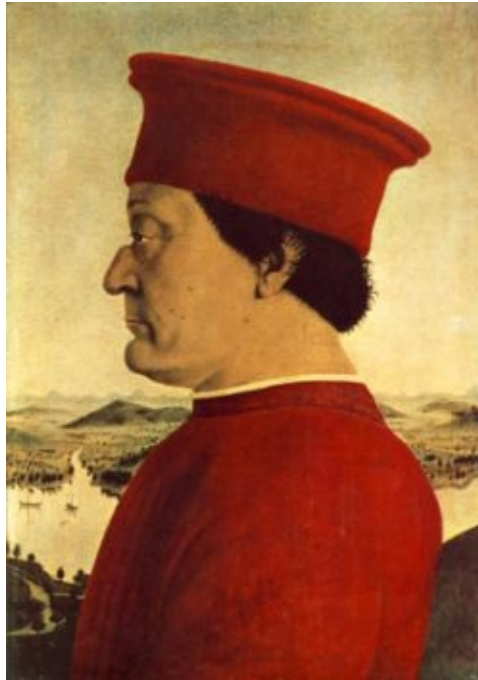
Портрет Федерико да Монтефельтро работы Пьеро делла Франческа

Не щадили ничего: ни монастыри, ни церкви, ни дома бедняков. И конечно, не обошлось без насилия над жителями. Когда Лоренцо уведомили об этом, он выразил сожаление о чрезмерной жестокости, которой он, по его словам, не желал. Несомненно, он лицемерил. Монтефельтро получил приказ преподать пример жестокого наказания, как прежде было в Прато. По завершении похода сорок именитых граждан Вольтерры были казнены, а шестидесяти семьям пришлось покинуть город. Лоренцо же добился своего: Вольтерра и прилегающие к ней земли были включены в состав Флорентийского государства, коммунальные вольности упразднены, а квасцовый карьер перешел в полную собственность республики. Правда, 29 июля город передал его цеху Лана, одному из старших цехов Флоренции. Но уже полгода спустя, 23 декабря, цех вернул права добычи квасцов все той же компании — Лоренцо и его друзьям. Таким образом, дело Вольтерры закончилось к полному удовольствию Лоренцо. Отныне он играл на рынке квасцов такую же роль, как папа и неаполитанский король. Эти государи помогали ему в организации карательной экспедиции. Они позволили Федерико да Монтефельтро использовать не только флорентийские, но и их войска. Ведь они, так же как и Медичи, были не заинтересованы в появлении независимого производителя квасцов, который мог бы нанести им ущерб.