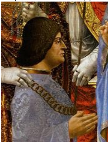
Лодовико Мария Сфорца (Моро). Алтарь Сфорца, 1494. Брера, Милан