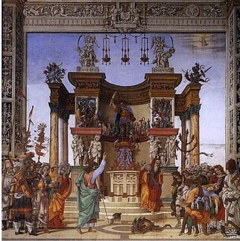
«Чудо апостола Филиппа пред алтарем Марса»

Лоренцо ценил в Филиппино фантазию, способность усваивать уроки древних и подражать им. Время от времени художник писал аллегорические картины странного содержания.