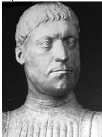
Пьеро де Медичи, скульптура работы Мино да Фьезоле

«Граждане, дорогой мой Пьеро, без сомнения признают тебя моим наследником, и я не сомневаюсь, что ты получишь власть, которую они вручили мне. Но так как государство — тело многоглавое и невозможно нравиться всем, всегда помни, что выбирать надобно самый честный образ действий и предпочитать общее благо частным интересам».