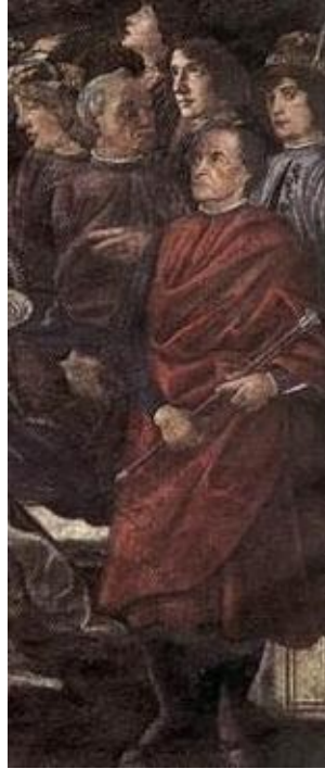
Боттичелли «Искушение Христа», фрагмент

Джованни Торнабуони, его сына Лоренцо и знаменитого гуманиста Иоанна Аргиропулос в «Призвании Петра и Андрея» Гирландайо.