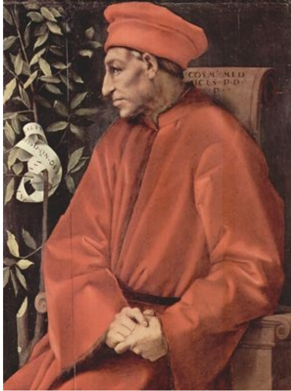
Джакопо Понтормо "Портрет Козимо Медичи"

Последние дни Козимо на вилле Кареджи напоминали кончину античного философа. Страдая от распухших суставов и жесточайшей урикемии, он до конца сохранял ясность ума и чувство юмора. Его непрестанно преследовал страх смерти, и он велел читать ему с комментариями переведенные Фичино рассуждения Платона о начале мира и высшем благе, а затем часами молча размышлял об этом. Жена Козимо Контессина, добрая хозяйка и верная спутница, однажды спросила, почему он лежит без движения. «Когда мы переезжаем в деревню, — ответил Козимо, — ты за две недели начинаешь собираться. Разве не понимаешь, что мне есть о чем подумать, собираясь из этой жизни в вечную?» Когда же она в ужасе спросила мужа, почему он лежит с закрытыми глазами, тот просто ответил: «Привыкаю».