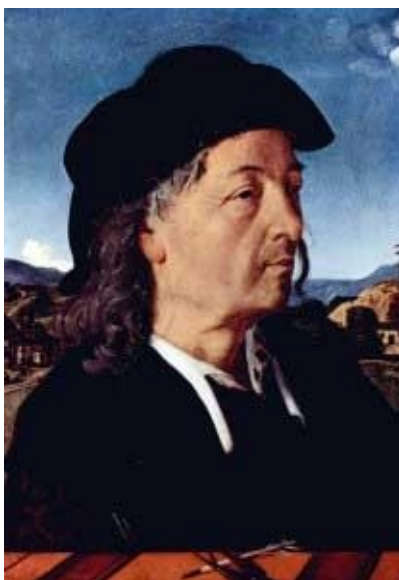
Джулиано да Сангалло

В 1485 году Франческо Сассетти поручил Сангалло сделать саркофаги для него и для его жены в церкви Санта-Тринита во Флоренции. Одновременно с этим престижным заказом появились и другие: строительство цитадели в Остии для кардинала Джулиано делла Ровере (будущего папы Юлия II) и церковь Санта-Мария делле Карчери в Прато, в совет которой Сангалло был избран по рекомендации Лоренцо Медичи. Между тем Великолепный продолжал использовать архитектора как военного специалиста. В 1486 году он поручил ему перестроить укрепления Поджо Имперiale близ Поджибонси. Сангалло занимался этим до 1490 года. Затем отправился в Рим, чтобы контролировать работы в базилике Святого Петра. Вскоре с этим он получил приказ отправиться на осаду Сарцаны, а когда крепость пала, отстроить для нее новые укрепления. Сангалло был так знаменит, что в 1488 году Лоренцо отправил его в Неаполь, чтобы тот сделал для короля Фердинанда макет дворца, не уступающего в великолепии только что построенной вилле Поджо Реале. Король остался очень доволен работой архитектора и вознаградил его полным кубком золотых монет, двумя конями, многими другими подарками и сотней золотых скудо в придачу. Отблагодарил Фердинанда и Лоренцо, подарив ему античные скульптуры: бюст императора Адриана, женский портрет и статую Купидона. Все они заняли место в садах Медичи.