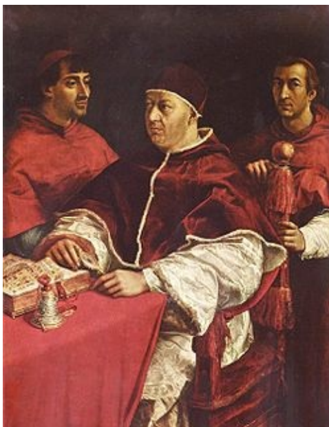
Рафаэль Санти. Портрет Льва X с кардиналами Джулиано Медичи и Луиджи Росси

В 1513 году, через двадцать один год после смерти своего отца Лоренцо Великолепного, Джованни был избран папой под именем Льва X. Новый понтифик оказался несравненным меценатом, покровителем искусства и литературы, уравновешенным политиком; он приятно соединял в себе античную мудрость с христианской верой. В Риме он жил так же, как Лоренцо во Флоренции, только был еще и набожен. Окружавшее его сияние было отблеском золотого века, стоявшего под знаком его отца. Во Флоренции организация торжеств в честь интронизации папы Льва была поручена папскому брату Джулиано и его племяннику, сыну Пьеро, которого звали Лоренцо. Триумфальная колесница символизировала золотой век. На колеснице везли земной шар, окруженный четырьмя великими добродетелями, а на нем изображение мертвеца; над трупом, как бы выходя из него, возвышался живой позолоченный мальчик. Торжественная сцена олицетворяла триумф династии Медичи, пошедшей от Лоренцо Великолепного.