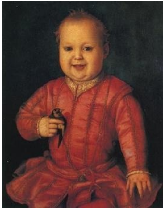
Бронзино. Портрет Джованни Медичи

мире. При сложившихся обстоятельствах папа Сикст не мог препятствовать тому, чтобы маленький Джованни получил эти титулы, и приносящие доход, и чрезвычайно почетные.