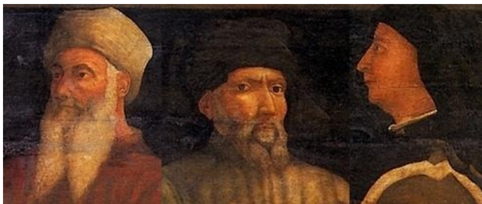
Паоло ди Доно, Донателло, Флиппо Брунеллески

Вместе со всей Флоренцией Козимо с интересом наблюдал за работой Лоренцо Гиберти — созданные им двери баптистерия Сан-Джованни — настоящий шедевр. Третья, самая красивая, дверь была при общем восторге навешена 16 июня 1452 года. Благодаря великому Донателло в городе появилось множество статуй — на колокольне собора, на стенах Ор Сан-Микеле, в частных дворцах. Дружеские отношения между Козимо Медичи и скульптором оставили в памяти людей много анекдотов, записанных Веспасиано да Бистиччи, а позднее воспроизведенных Джорджо Вазари. Именно благодаря ходатайствам Медичи Донателло получил заказы в Неаполе, Прато, Сан-Лоренцо и в самой Флоренции.