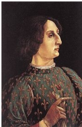
Пьеро дель Поллайоло "Портрет Галеаццо Марии Сфорца"

С самых юных лет молодой Медичи принимал участие в гонких играх флорентийской дипломатии. Ему это очень нравилось. Сношения с разными государями позволяли ему соперничать с ними в великолепии. Честолюбие Лоренцо торжествовало, когда он появлялся перед толпой флорентийцев во время дипломатических визитов. С этой точки зрения очень показателен приезд герцога Миланского, одного из главных должников Медичи.