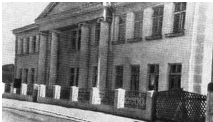
Здание на Шлосштрассе в Ровно, близ которого Н. Кузнецов