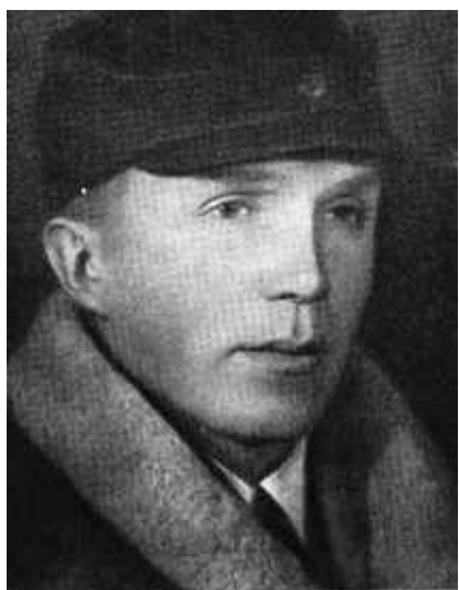
Николай Кузнецов. 1939 г.