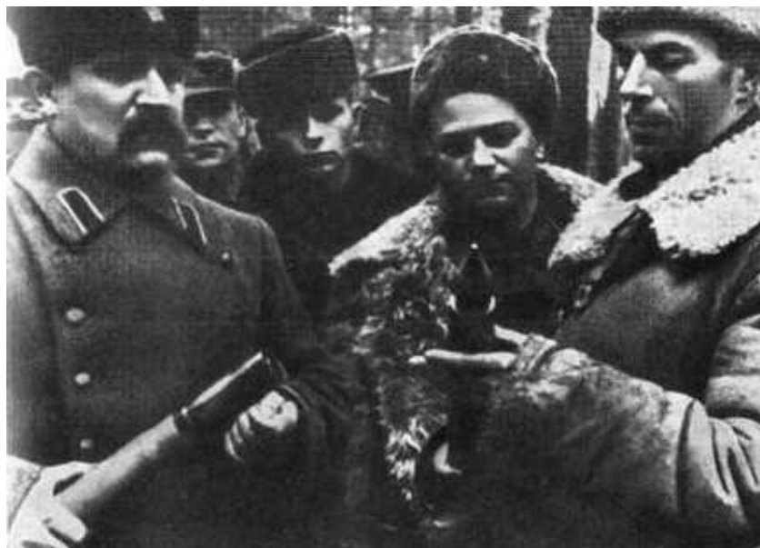
В партизанском соединении дважды Героя Советского Союза А. Ф. Федорова (слева). Д. Н. Медведев и А. А. Лукин (в центре) осматривают захваченный в бою трофей – новый немецкий снаряд.