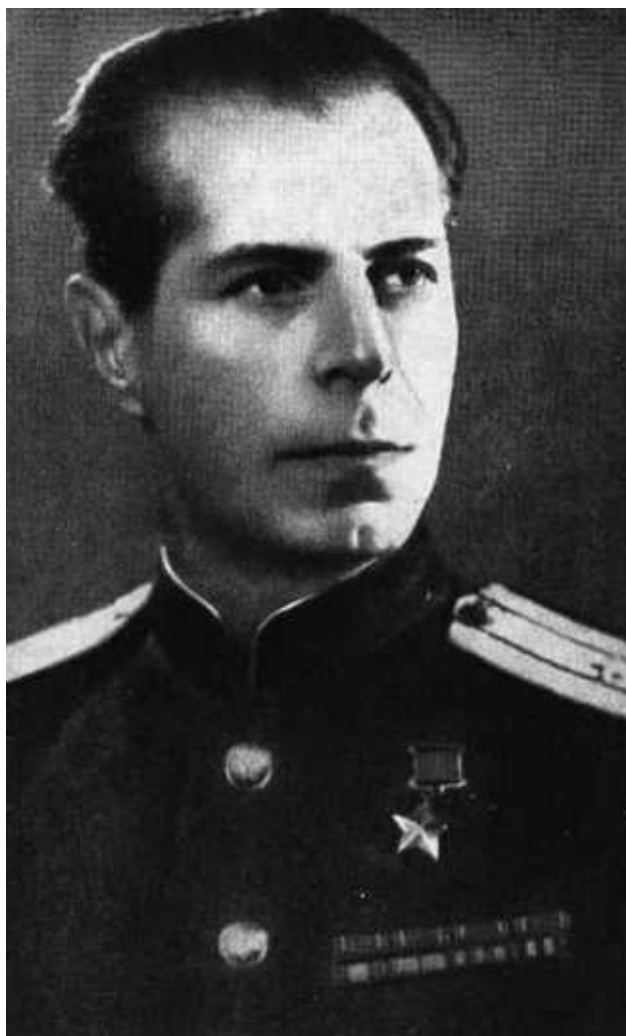
Герой Советского Союза Дмитрий Николаевич Медведев.