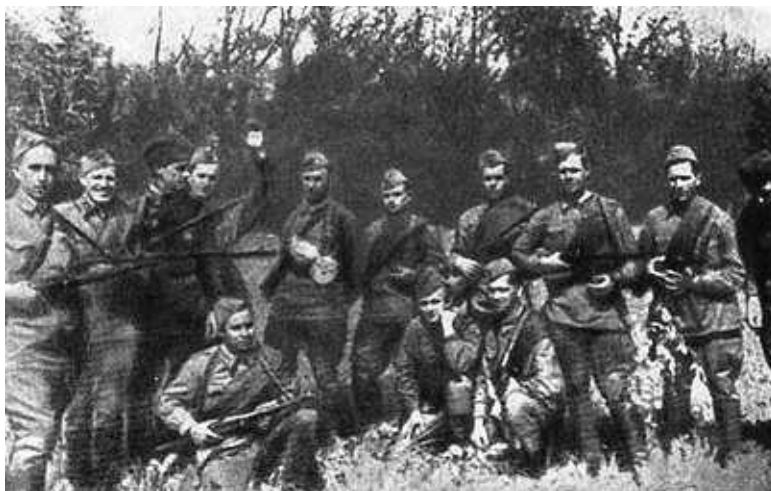
Группа бойцов отряда «Победители».