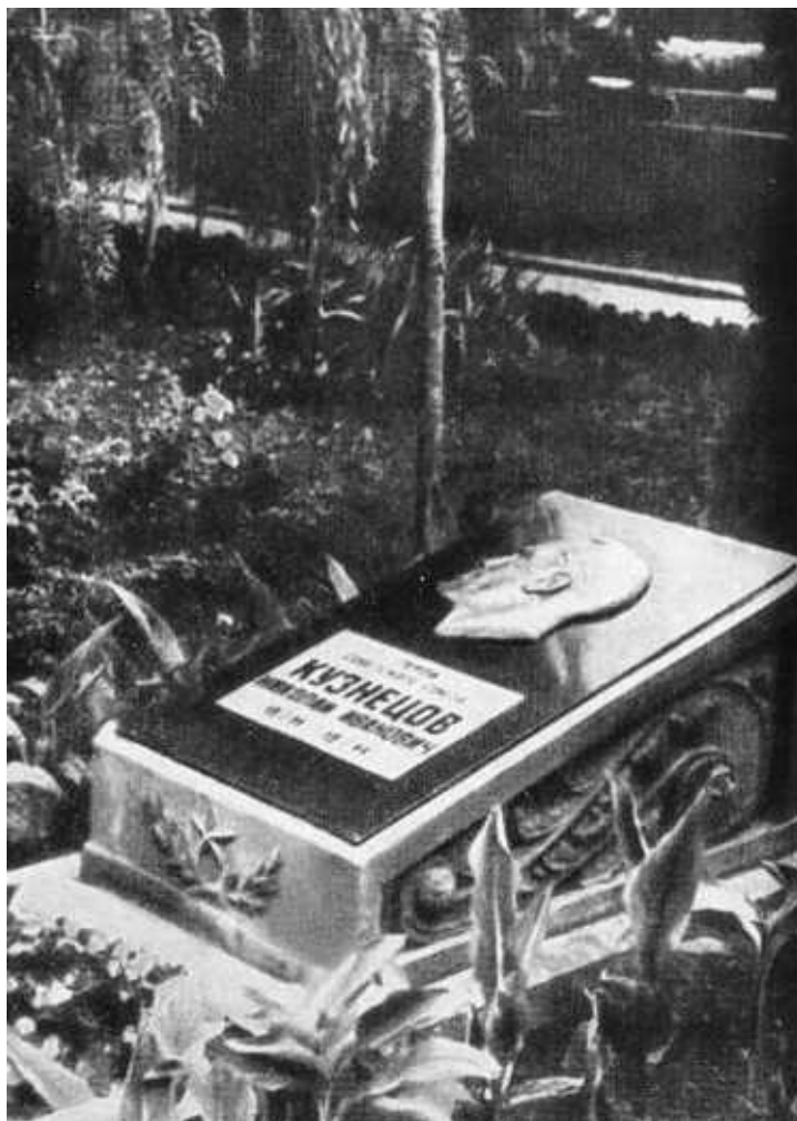
Могила Н. И. Кузнецова во Львове, на Холме Славы.