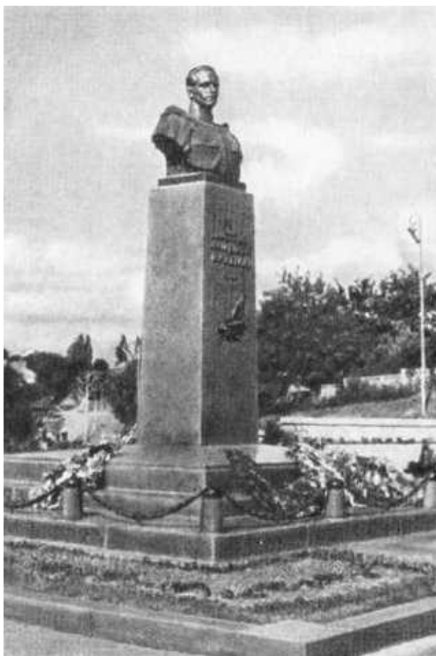
Памятник Н. И. Кузнецову в Ровно.