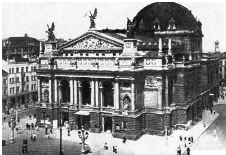
Оперный театр во Львове.