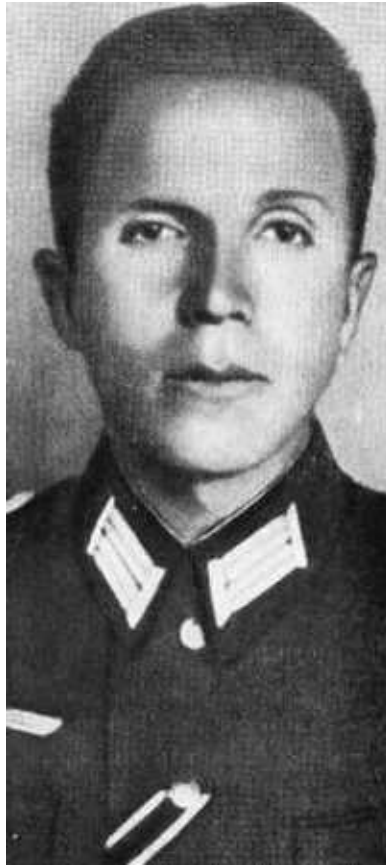
Офицер вермахта Пауль Вильгельм Зиберт.