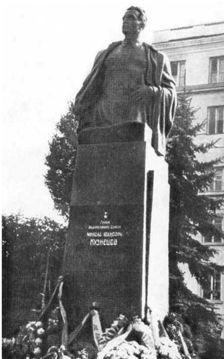
Памятник Н. И. Кузнецову во Львове.