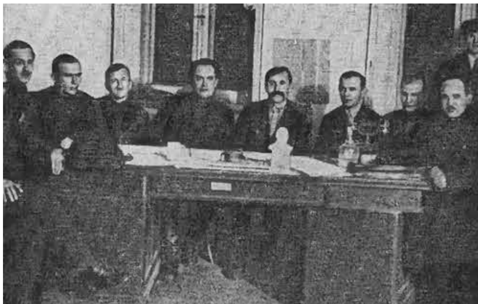
Заседание Донецкой губернской контрольной комиссии с участием В. В. Куйбышева. 1925 год.