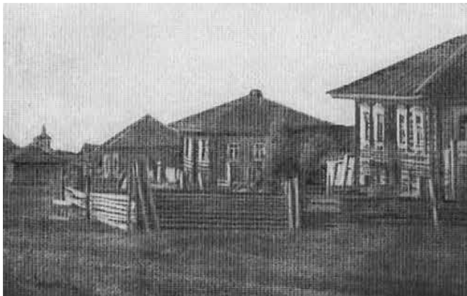
Селение Нарым. В первом доме справа жил в годы ссылки (1910–1912) В. В. Куйбышев.