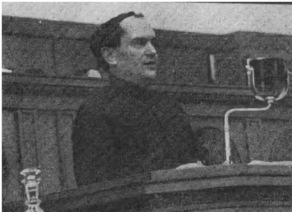
В. В. Куйбышев на трибуне XVII съезда партии. Февраль 1934 года.