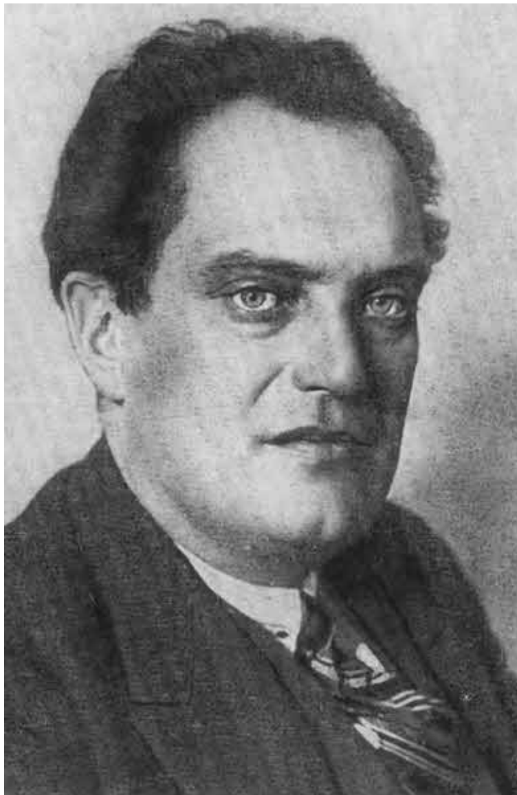
Валериан Владимирович Куйбышев. 1934 год.

На встрече челюскинцев. Справа налево: В. В. Куйбышев, О. Ю. Шмидт, Герой Советского Союза летчик-комсомолец Н. П. Каманин. Москва, 1934.