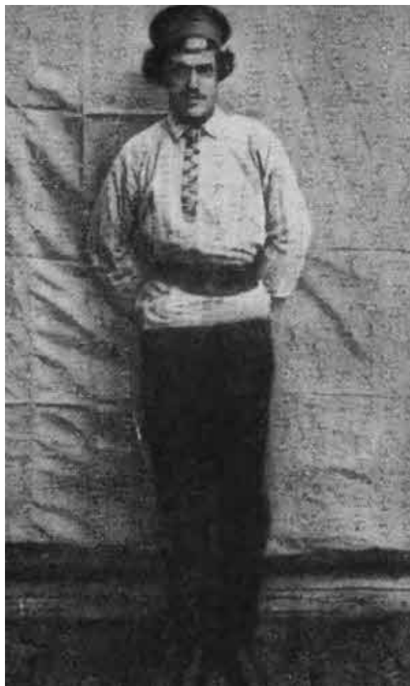
В. В. Куйбышев в томской тюрьме. 1910 год