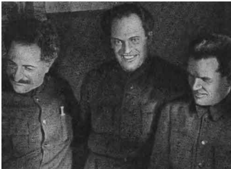
Г. К. Орджоникидзе, В. В. Куйбышев, С. М. Киров.