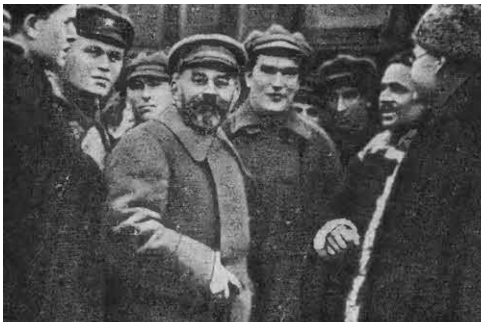
В. В. Куйбышев и Г. И. Петровский в городе Артемовске на Украине. 1925 год.