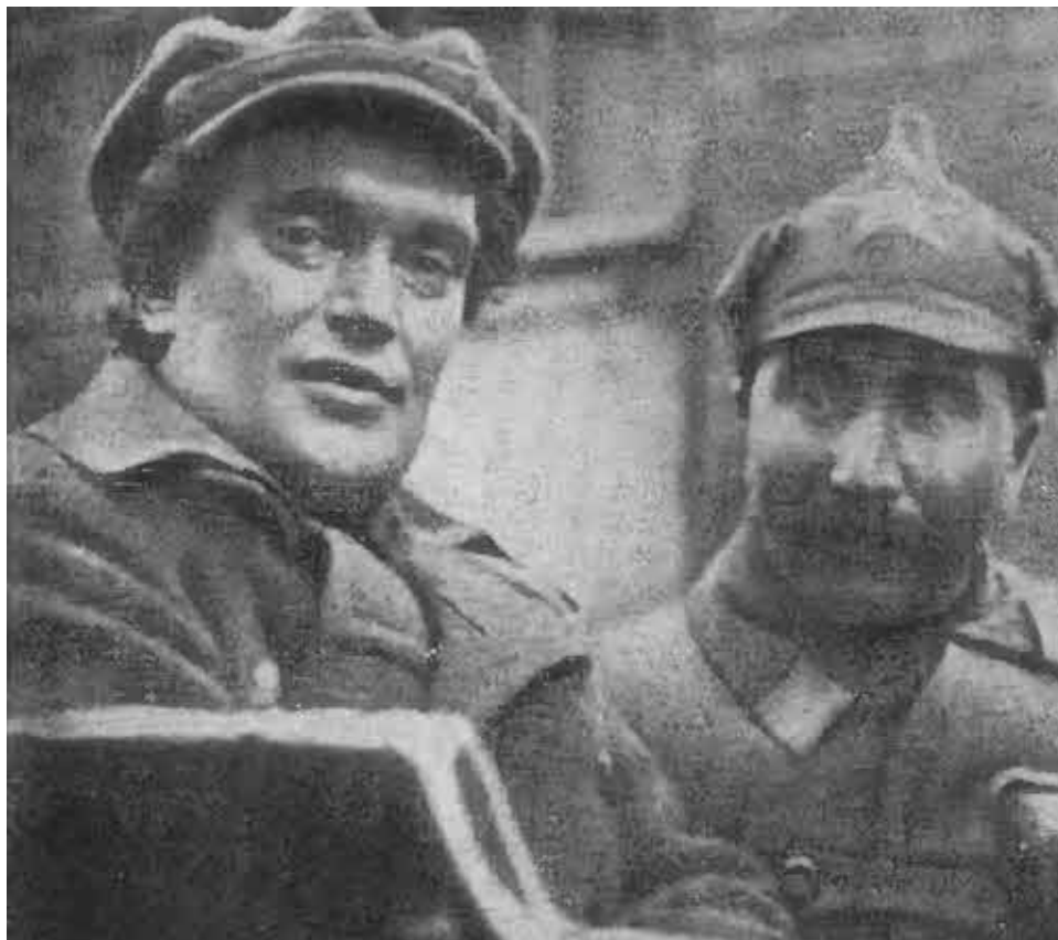
В. В. Куйбышев и С. М. Буденный на вокзале в Ростове. Март 1923 года.