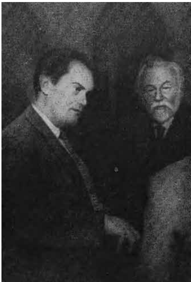
В. В. Куйбышев и академик Д. Н. Прянишников.