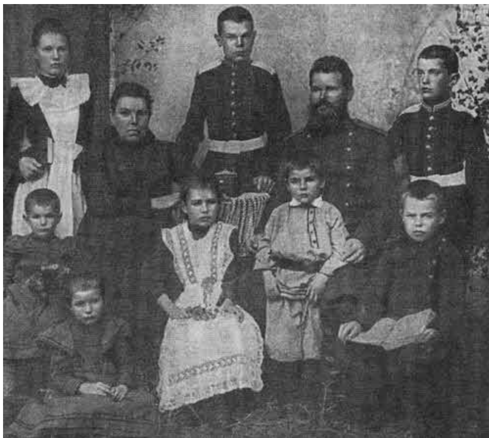
Семья Куйбышевых. 1900 год.