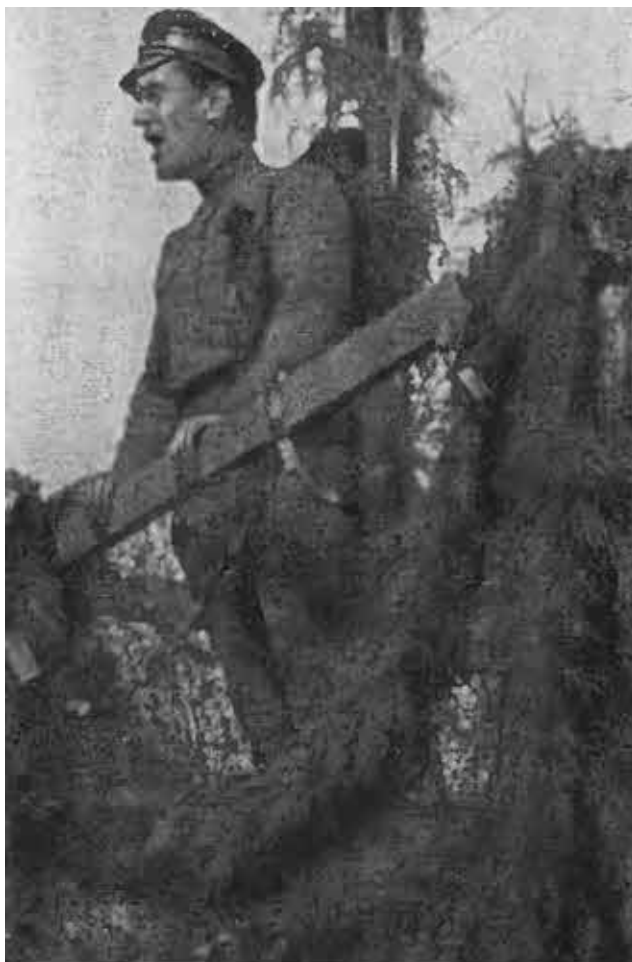
Выступление В. В. Куйбышева на митинге. Туркестанский фронт.