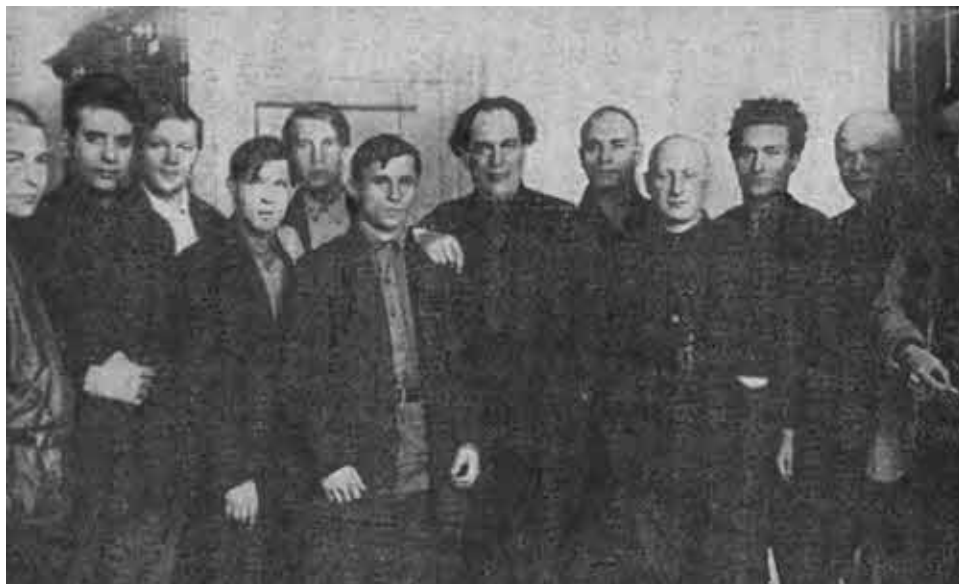
В. В. Куйбышев с делегатами XVI партийной конференции — комсомольскими работниками. Апрель 1929 года.