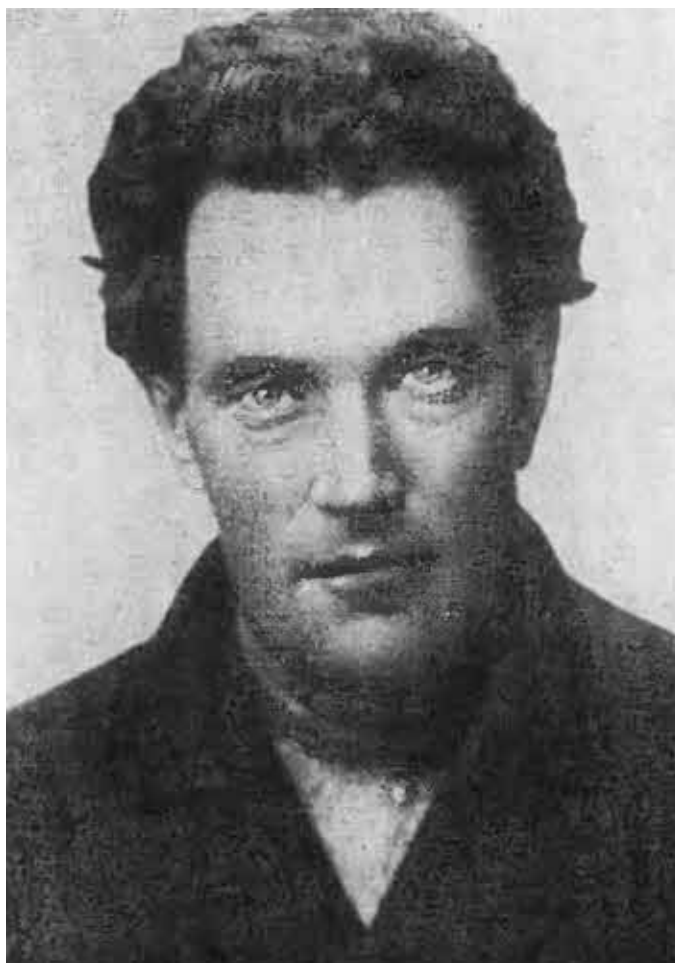
Валериан Владимирович Куйбышев в самарской тюрьме. 1916 год.