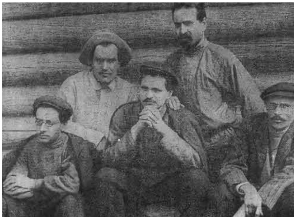
Группа политических ссыльных в Нарыме (слева направо): Я. М. Свердлов, В. В. Куйбышев, В.