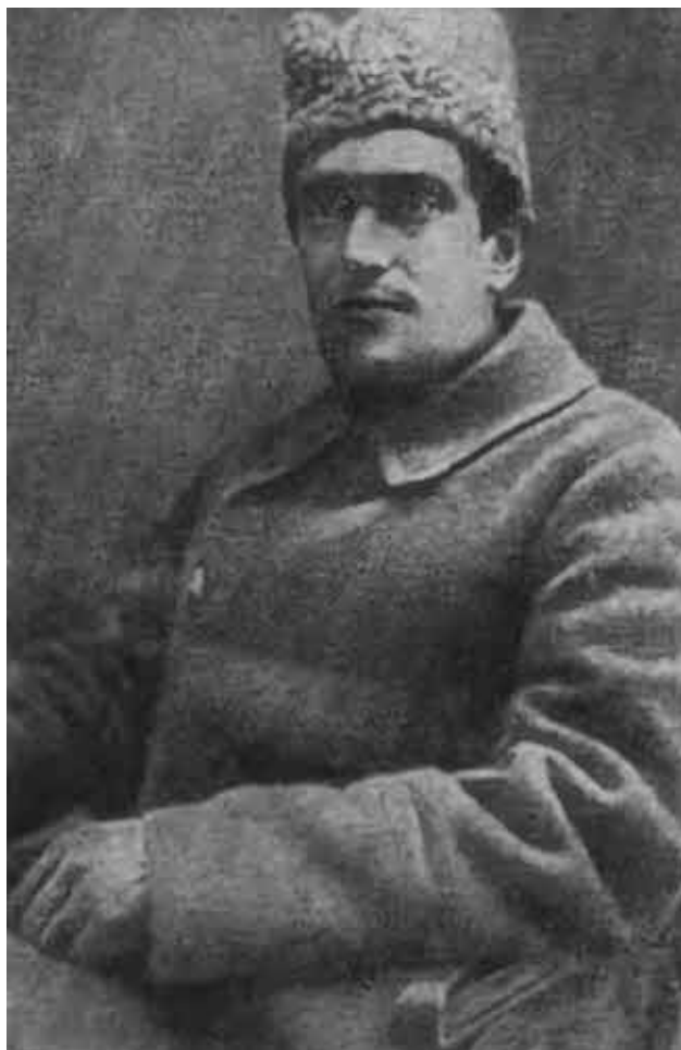
Валериан Владимирович Куйбышев во время гражданской войны. 1918–1919 годы.