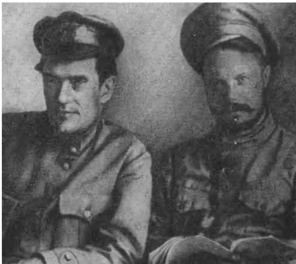
В. В. Куйбышев и М. В. Фрунзе на Туркестанском фронте. 1920 год.