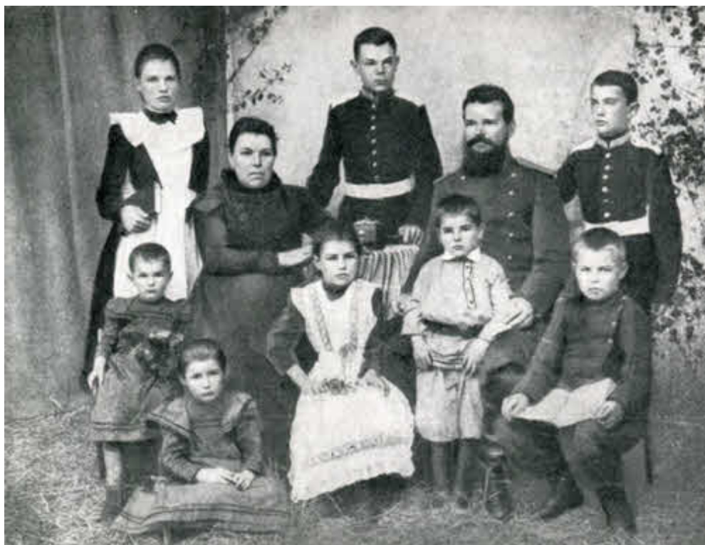
Семья Куйбышевых в Кокчетаве.