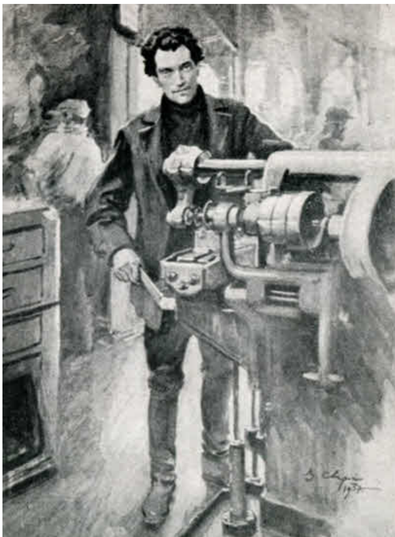
«В. В. Куйбышев у станка на трубочном заводе в Самаре»