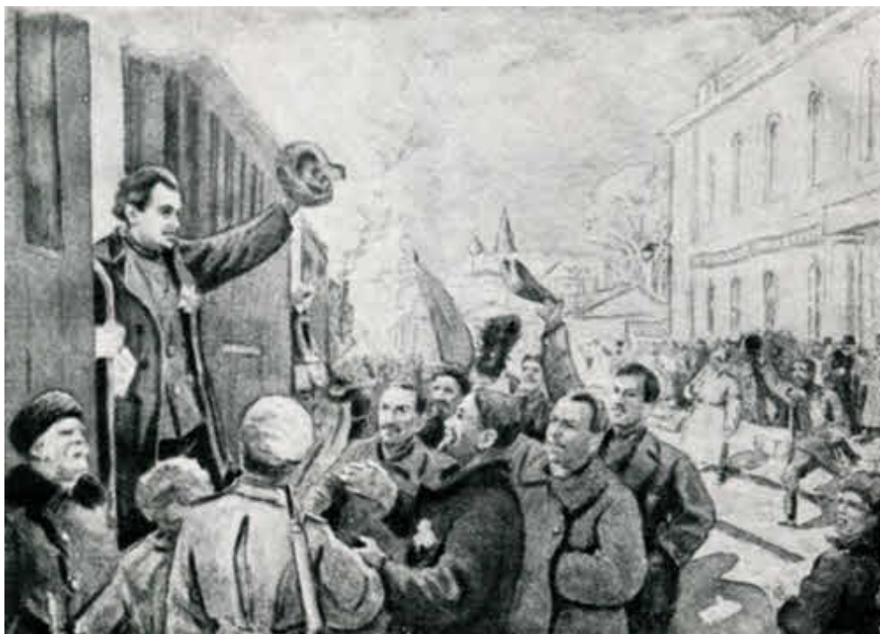
«Приезд В. В. Куйбышева из ссылки в Самару».