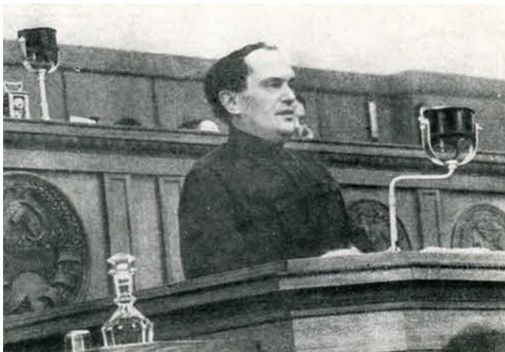
В. В. Куйбышев на трибуне XVII съезда ВКП(б).