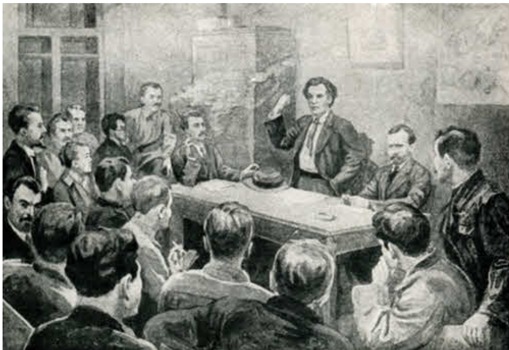
«Заседание Самарского губкома и горкома партии под руководством В. В. Куйбышева 22 октября 1917 года».