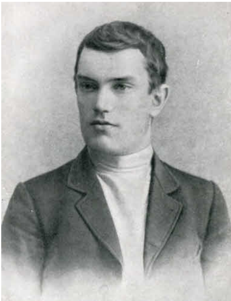
В. В. Куйбышев (1906 г).