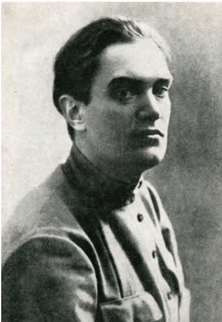
В. В. Куйбышев