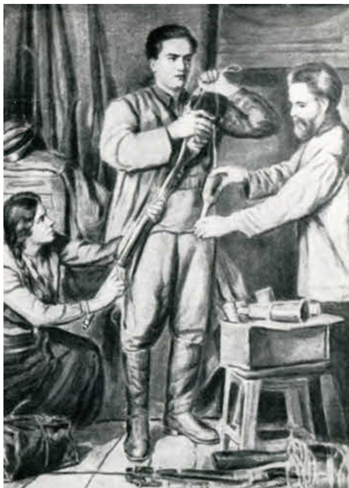
«Переноска оружия В. В. Куйбышевым в 1905 году».