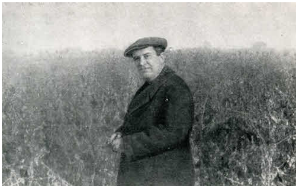
В. В. Куйбышев на хлопковом поле в Туркестане.

Вскоре Куйбышев приехал в колхоз имени Фрунзе Ферганского района и стал знакомиться с записью трудодней. Оказалось, что колхозный счетовод вел учет не по установленной форме, а по своей, им самим выдуманной, весьма сложной и путаной.