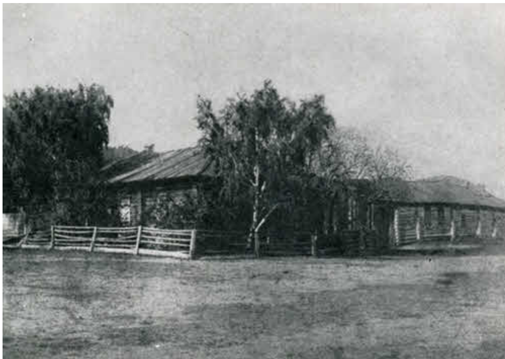
Дом в Кокчетаве, в котором В. В. Куйбышев провел детство.