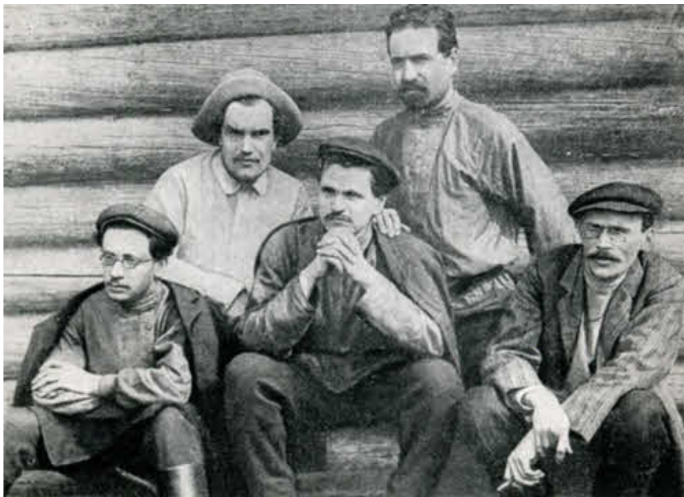
Я. М. Свердлов и В. В. Куйбышев с группой большевиков в нарымской ссылке.