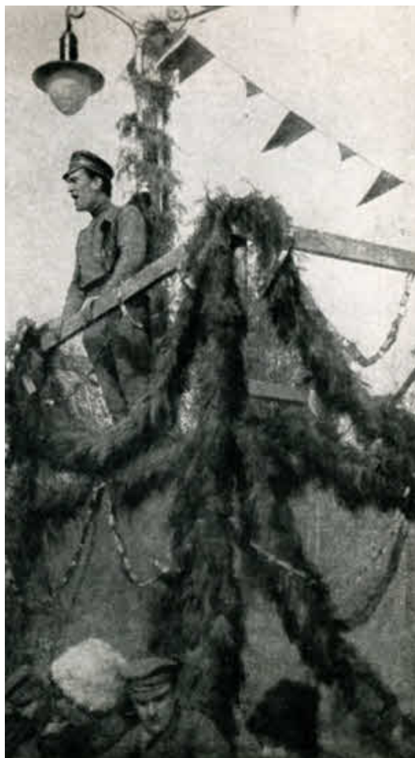
Выступление В. В. Куйбышева на митинге в Туркестане.