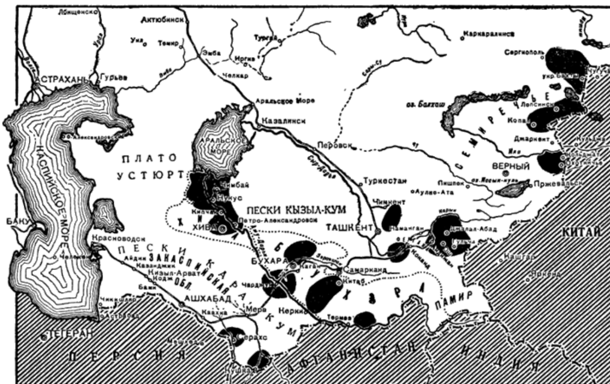
Основные очаги вооруженной борьбы в Туркестане.

Красноармейская колонна выступила в семь часов вечера 14 декабря. Шла четверо суток. Шла день и ночь, так как успех боевой операции зависел от быстроты и стремительности обхода.