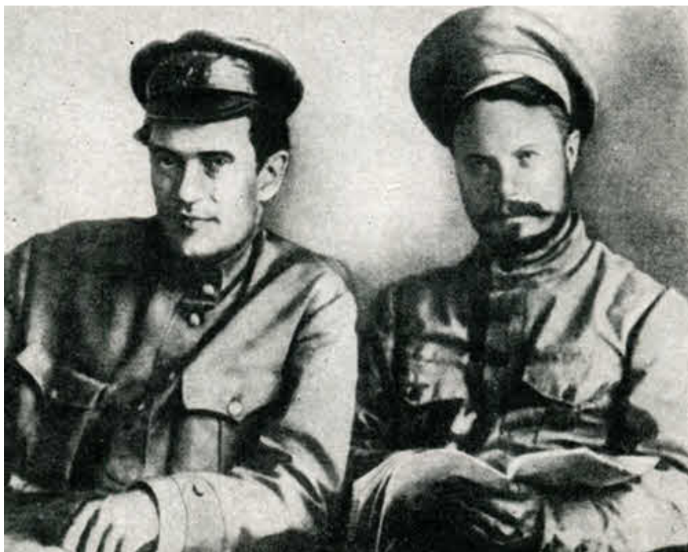
В. В. Куйбышев и М. В. Фрунзе (1919 г).