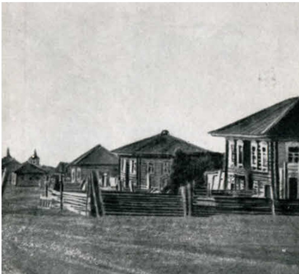
Селение Нарым. В первом доме справа жил В. В. Куйбышев