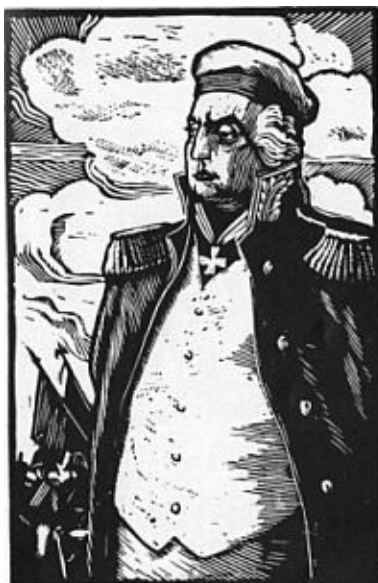
Михаил Т. Кутузов.