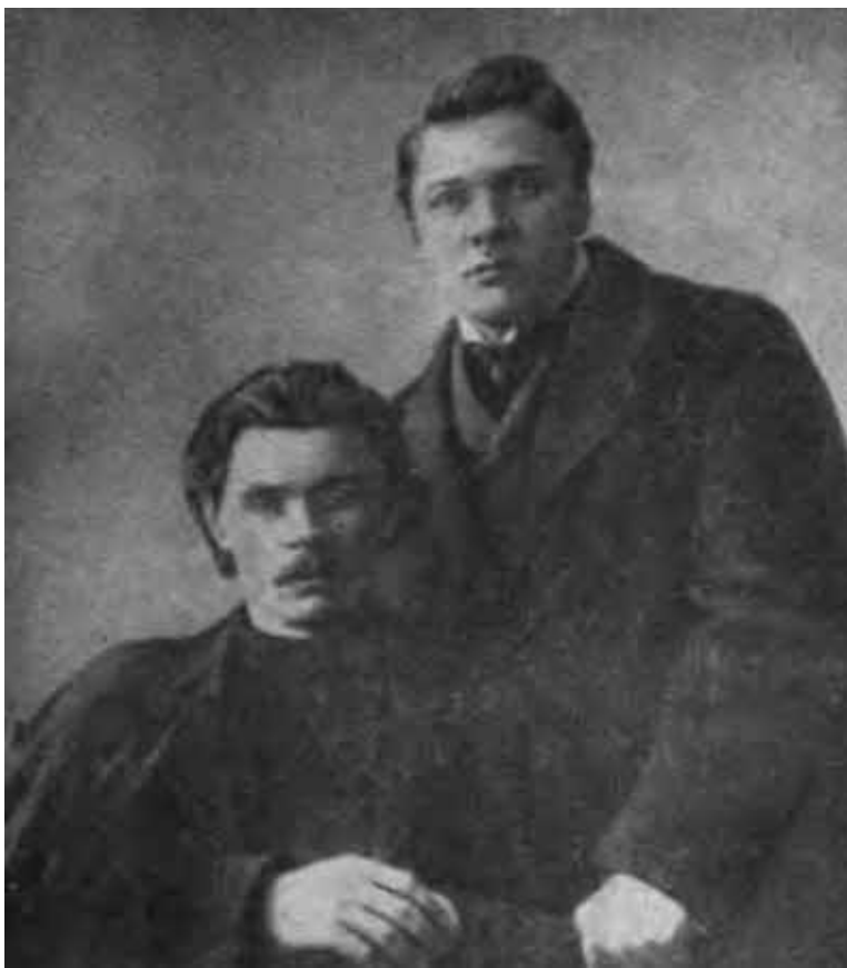
М. Горький, Ф. Шаляпин.