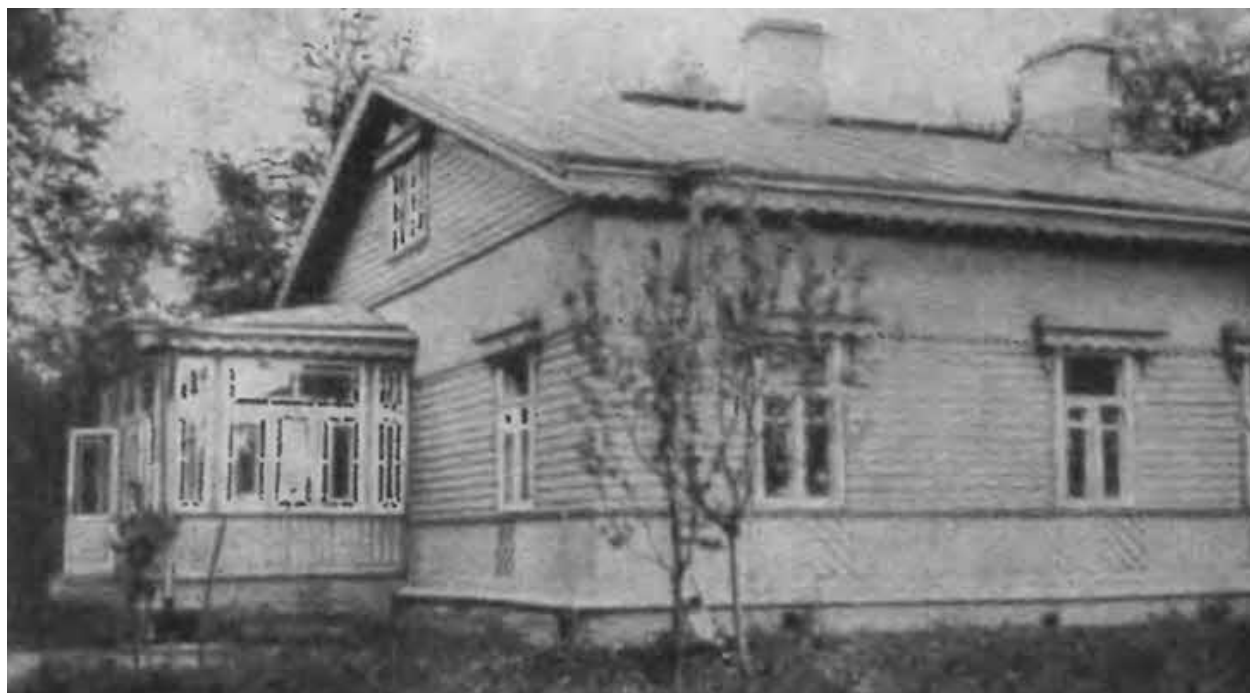
Зеленый домик в Гатчине.