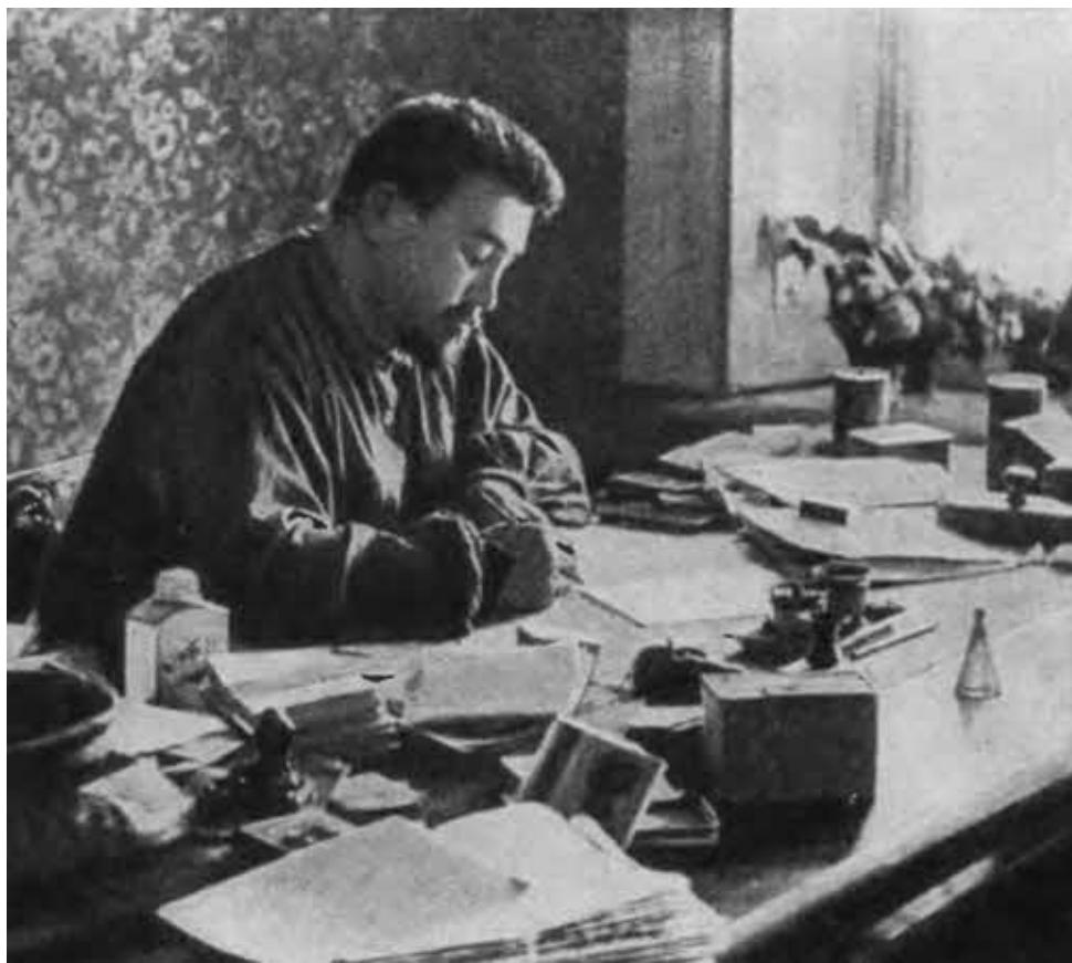
А. И. Куприн за работой.