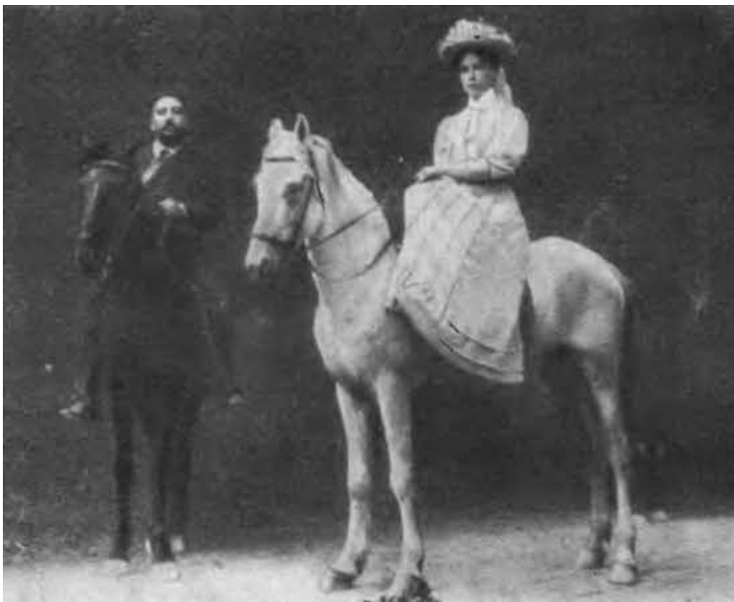
А. И. Куприн и Е. М. Куприна. Ялта. 1907 г.