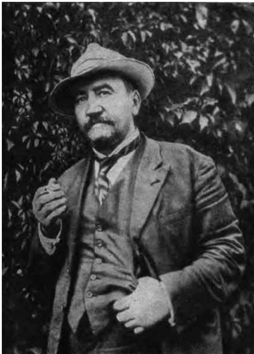
А. И. Куприн. 1908—1909 гг.