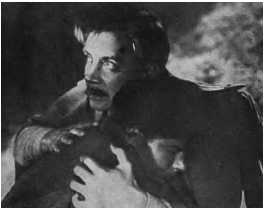
Кадр из фильма «Поединок».