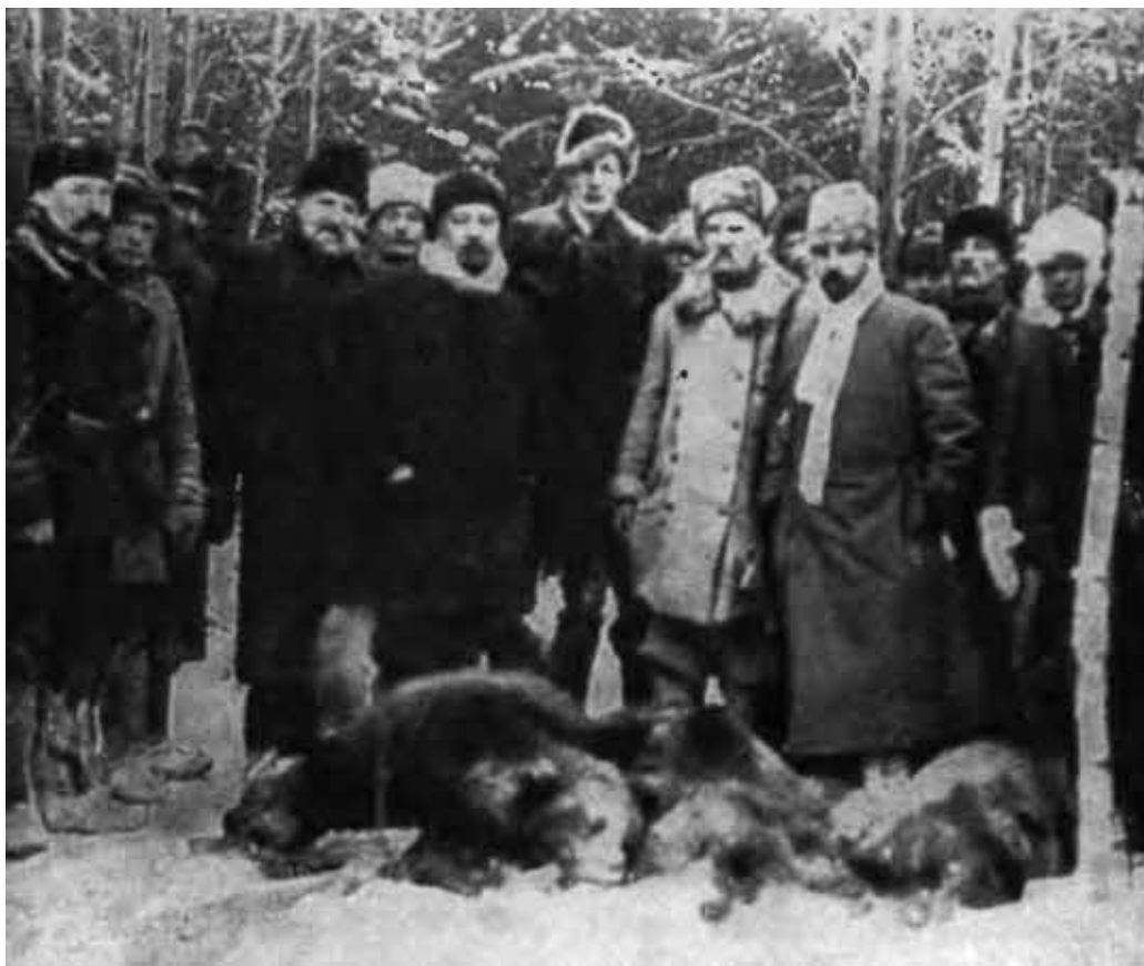
А. И. Куприн и Ф. Д. Батюшков в Даниловском на охоте.