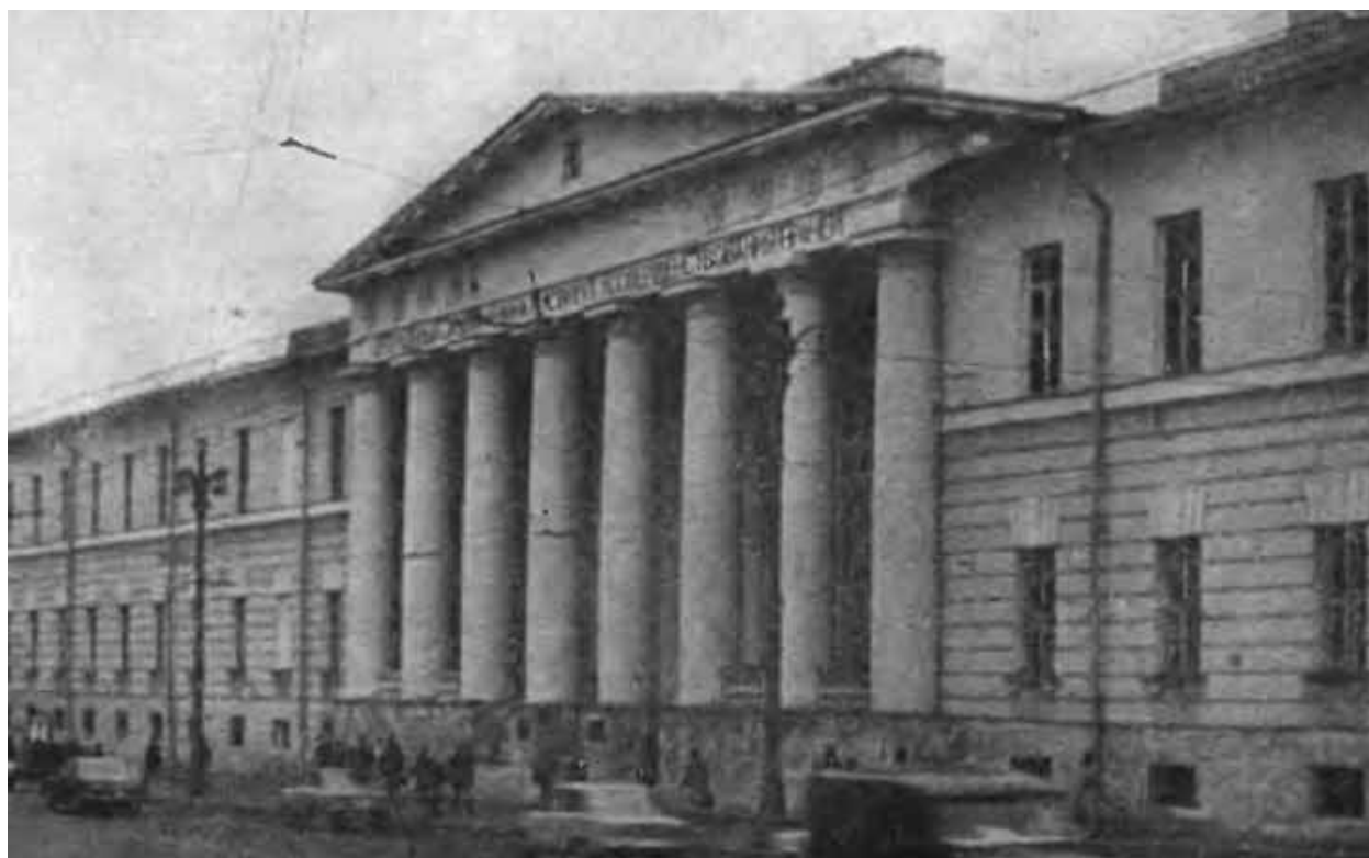
Здание бывшего Вдовьего дома в Москве на Кудринах.