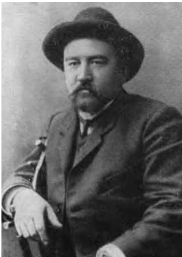
А. И. Куприн. 1922 г.