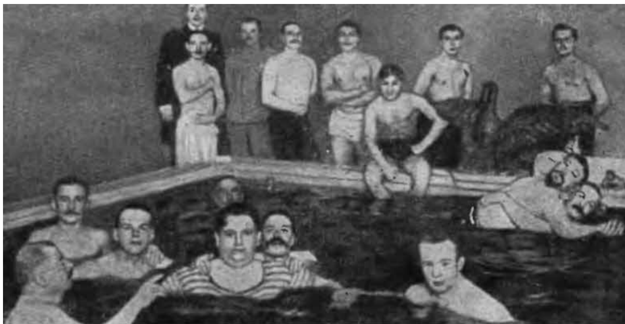
А. И. Куприн в бассейне (справа). Петербург.