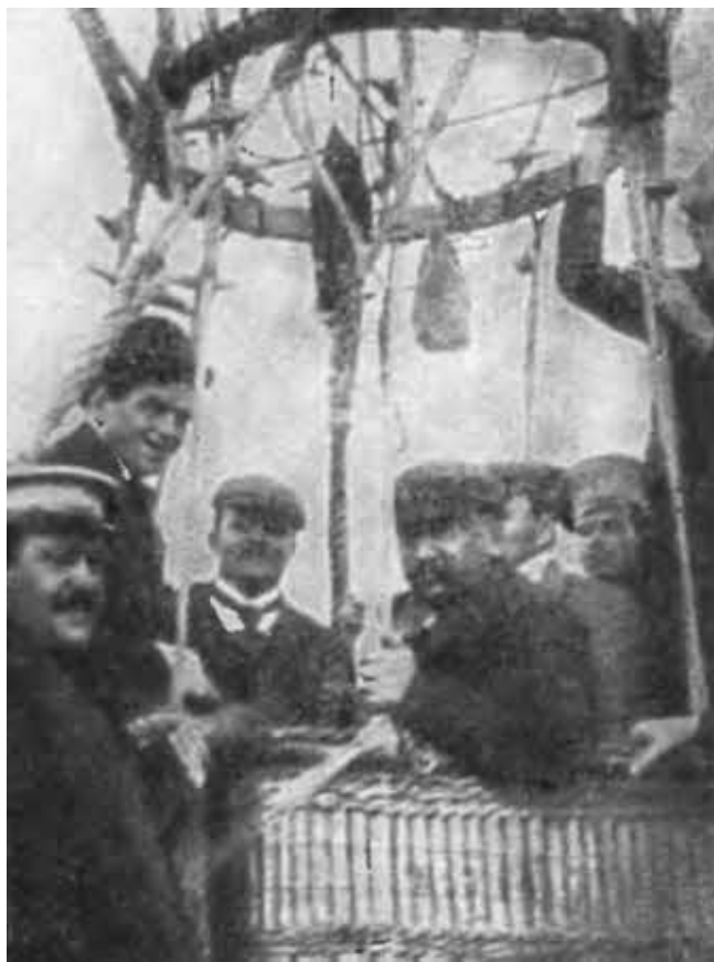
А. И. Куприн на воздушном шаре. 1911 г.