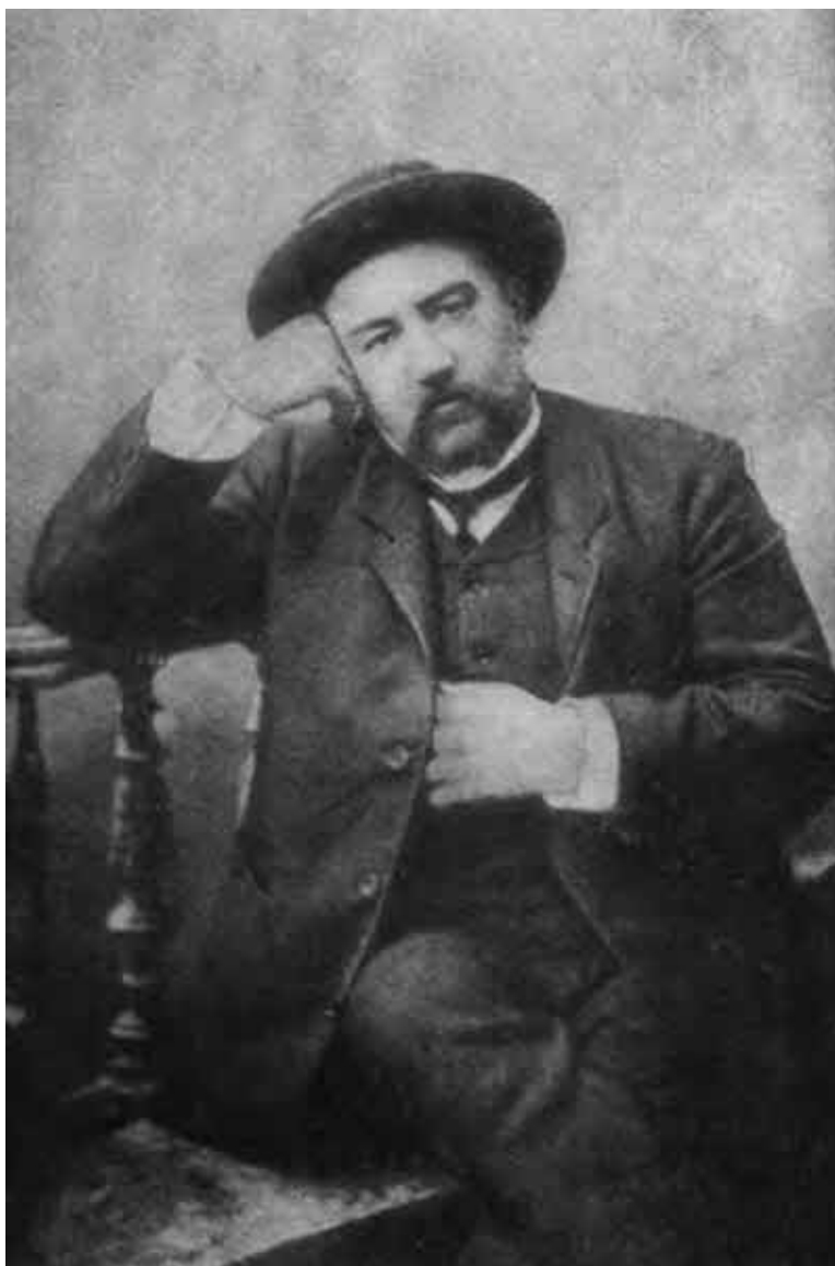
А. И. Куприн, 1907 г.