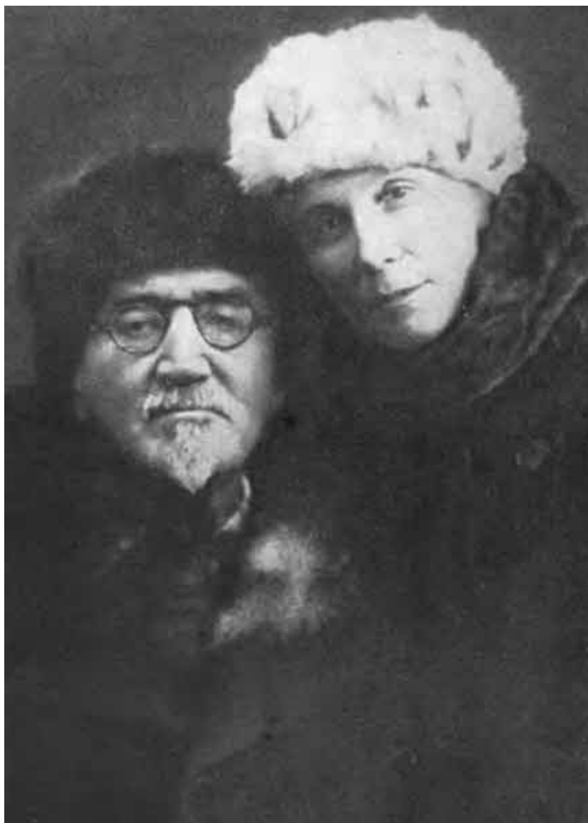
А. И. Куприн и Е. М. Куприна.