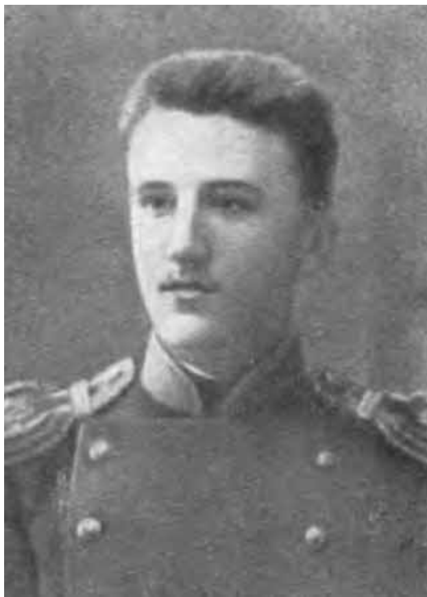
А. И. Куприн — офицер.