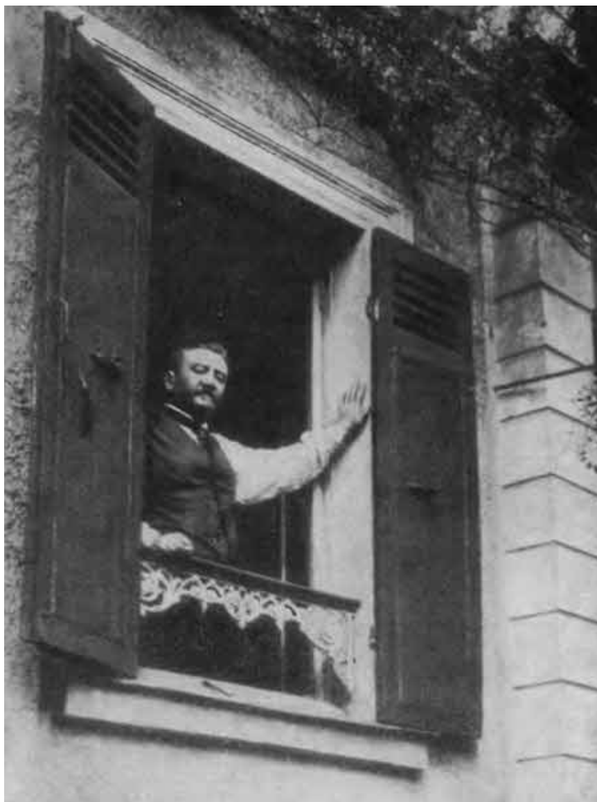
А. И. Куприн. Пригород Парижа Севр Виль д'Авре