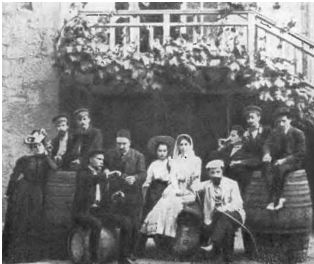
А. И. Куприн и Е. М. Куприна в группе. Массандра. 1907 г.