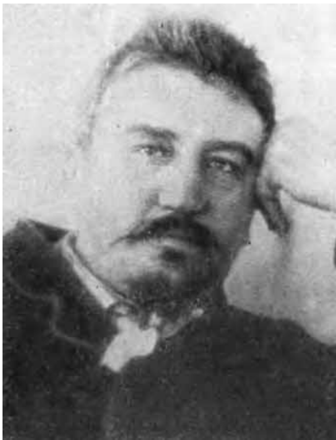
А. И. Куприн.