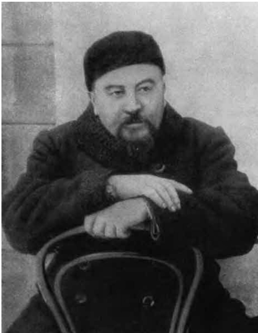
А. И. Куприн. 1912 г.