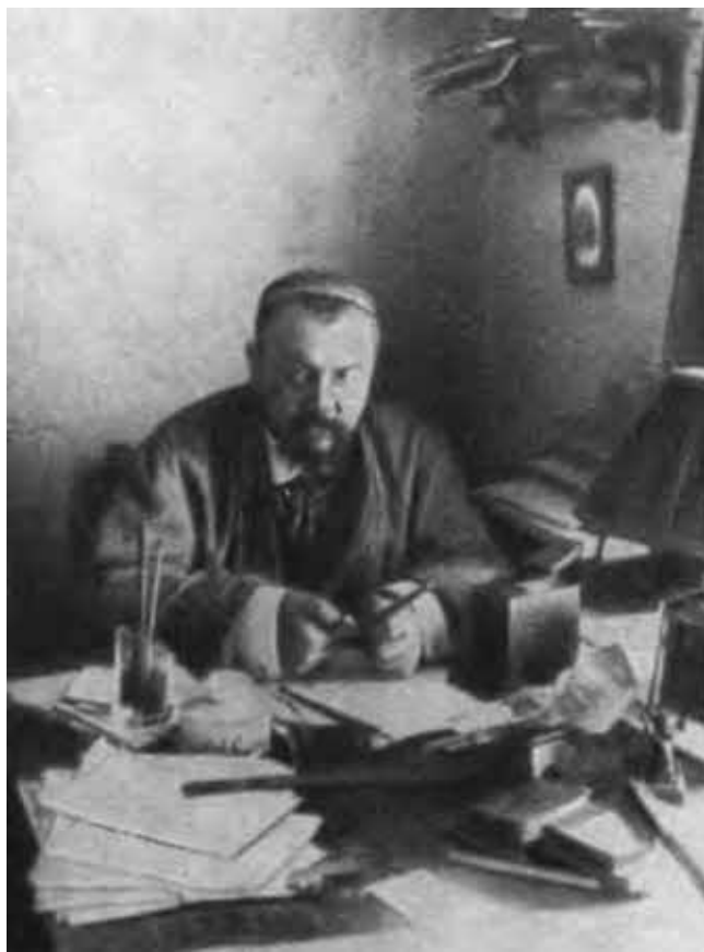
А. И. Куприн в кабинете. Гатчина.