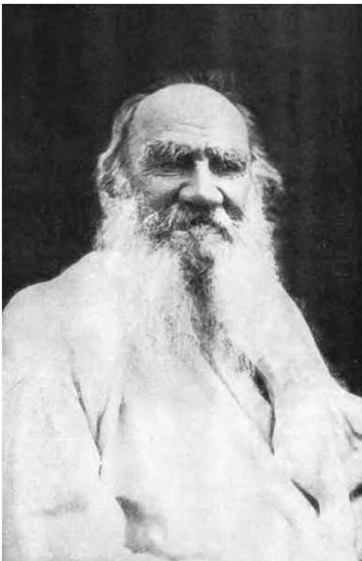
Л. Н. Толстой