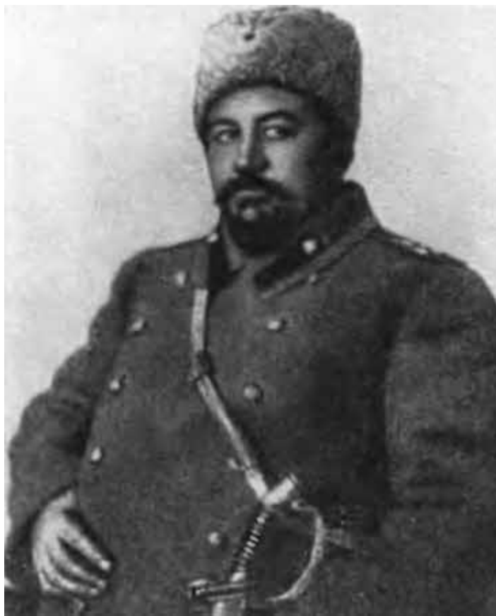
А. И. Куприн, мобилизованный в армию. 1914 г.