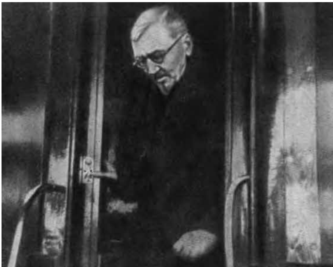
Приезд А. И. Куприна на Родину. 1937 г.