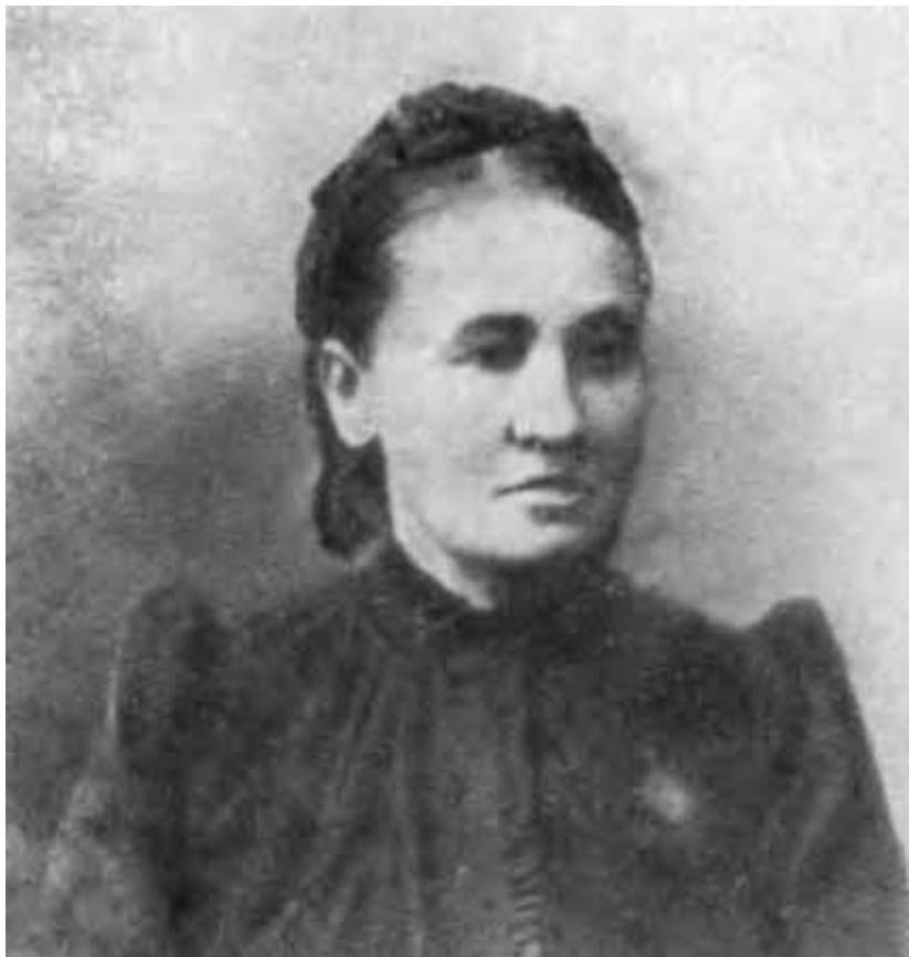
Л. А. Куприна — мать А. И. Куприна.