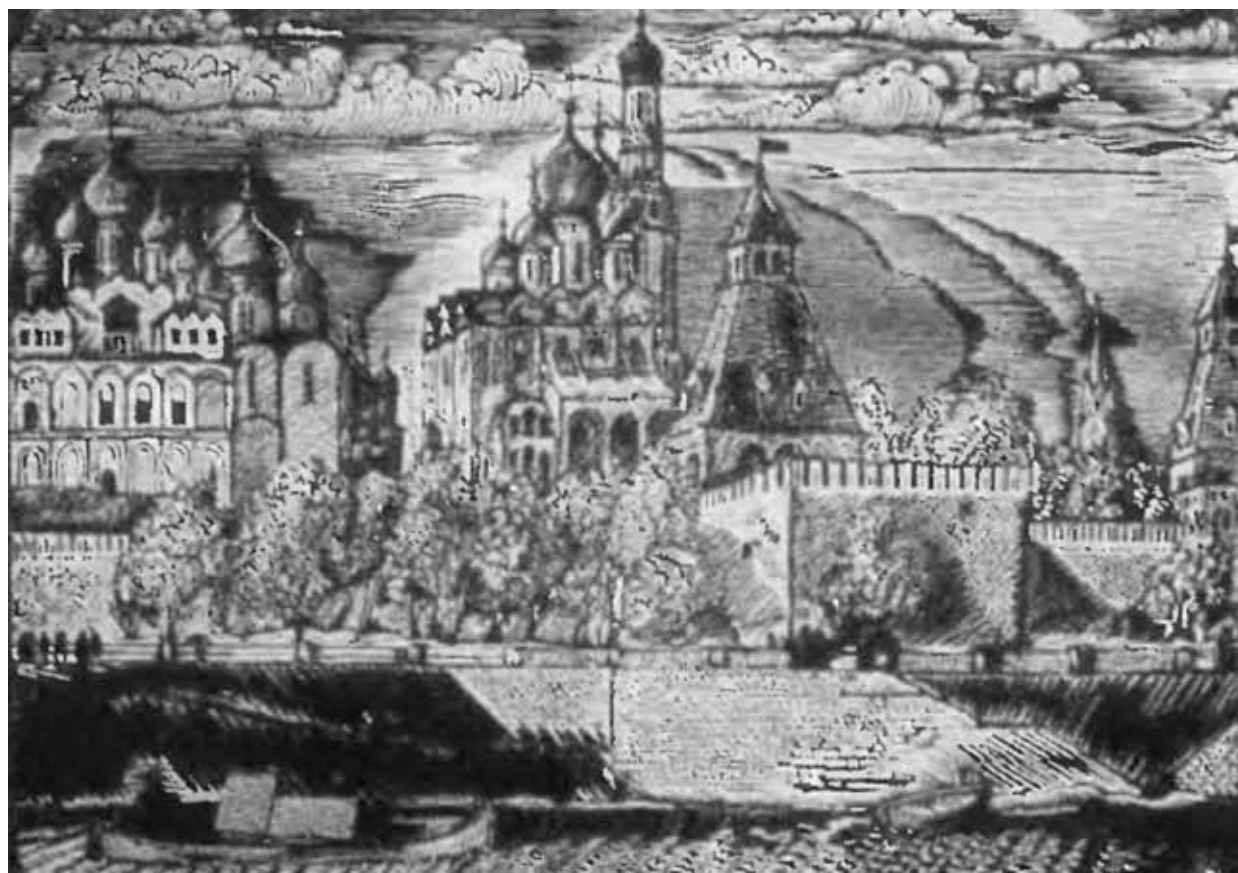
А. И. Кравченко. Кремль. Гравюра на дереве. 1923 г.