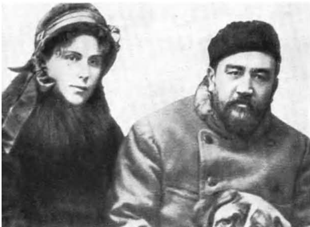
А. И. Куприн и Е. М. Куприна.