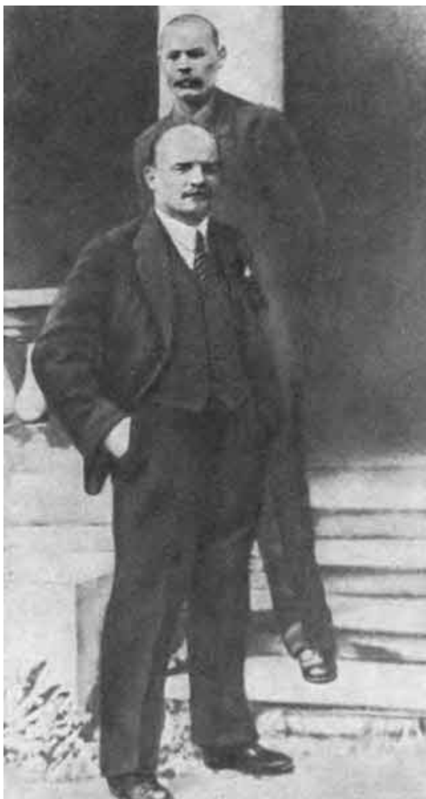
В. И. Ленин и А. М. Горький.