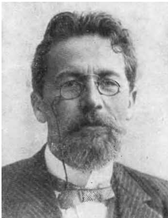
А. П. Чехов