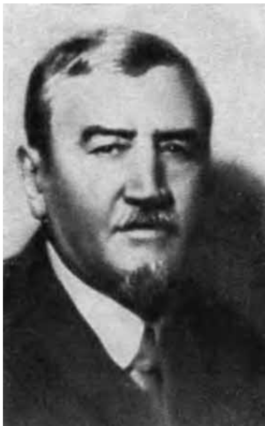
А. И. Куприн. 1910-е годы.