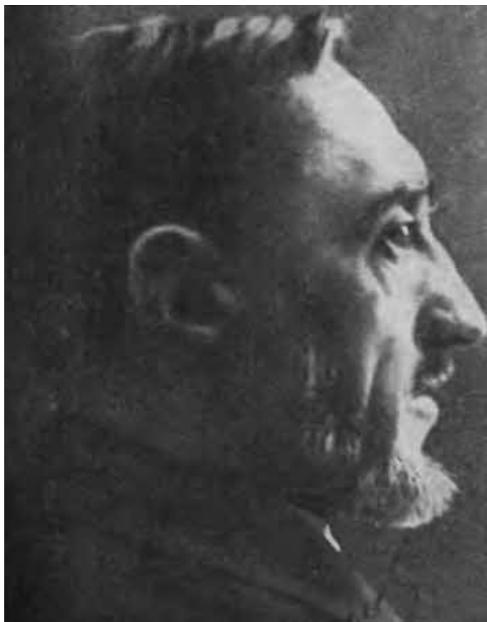
И. С. Шмелев