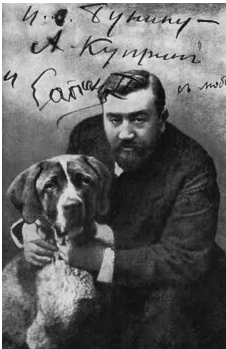
А. И. Куприн. Фотография, подаренная И. А. Бунину.