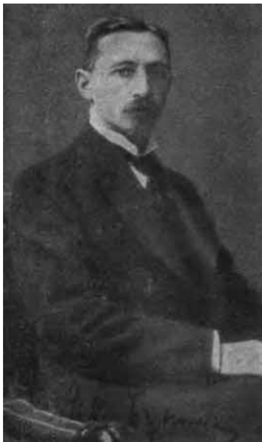
И. А. Бунин