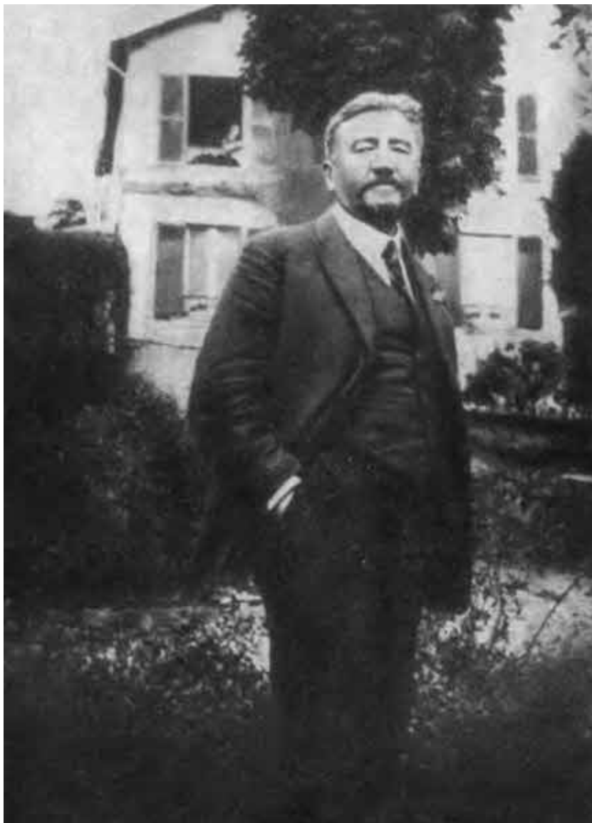
А. И. Куприн. Пригород Парижа Севр Виль д'Авре. 1922 г.