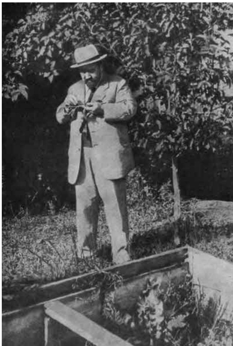
А. И. Куприн в своем саду. Гатчина.