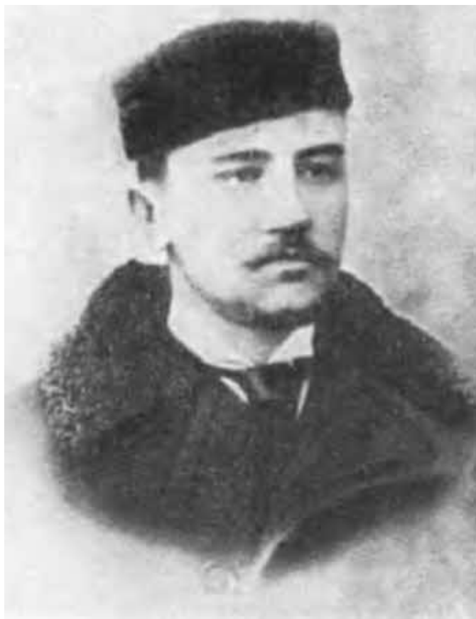
А. И. Куприн. 1897 г. Киев.