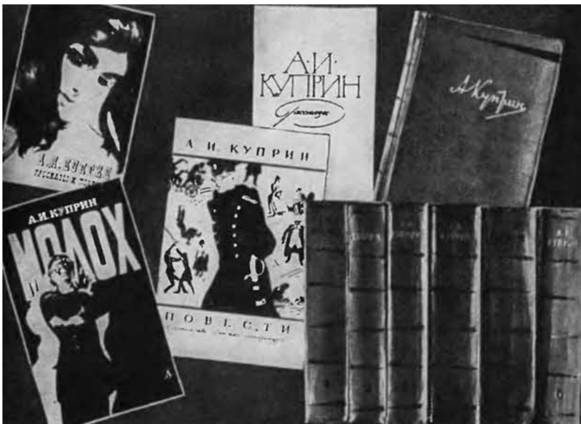
Книги А. И. Куприна, изданные в последние годы.