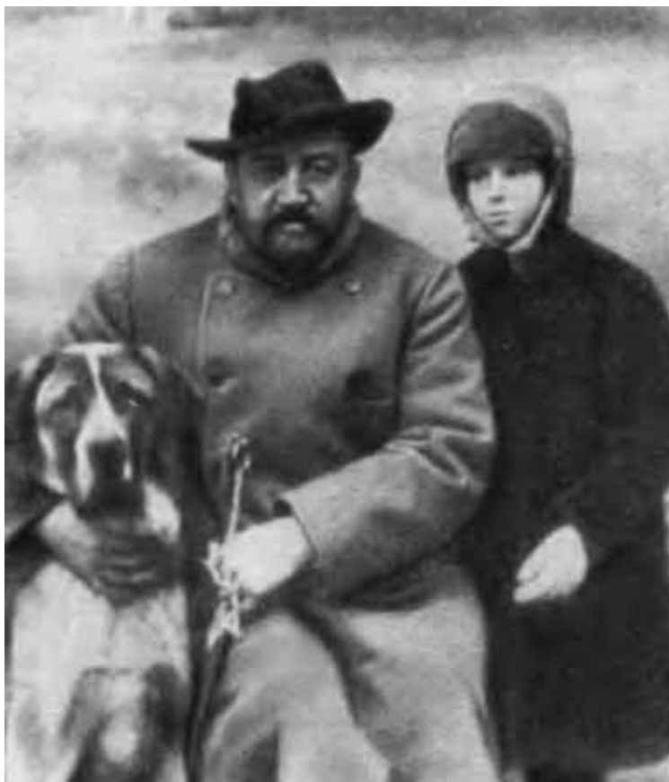
А. И. Куприн с дочерью Ксенией.