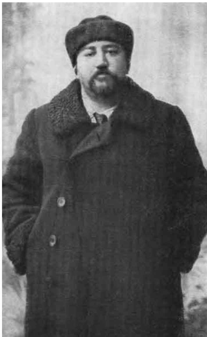
А. И. Куприн. 1900-е годы.