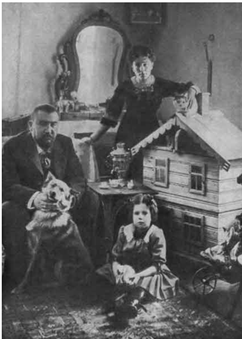
А. И. Куприн с семьей. Гатчина.