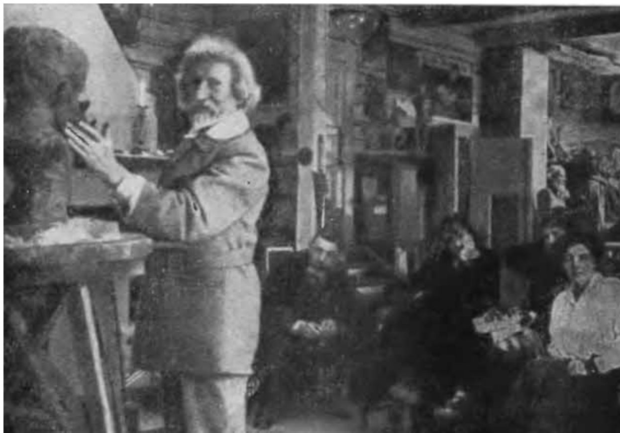
И. Е. Репин в своей мастерской в Пенатах.