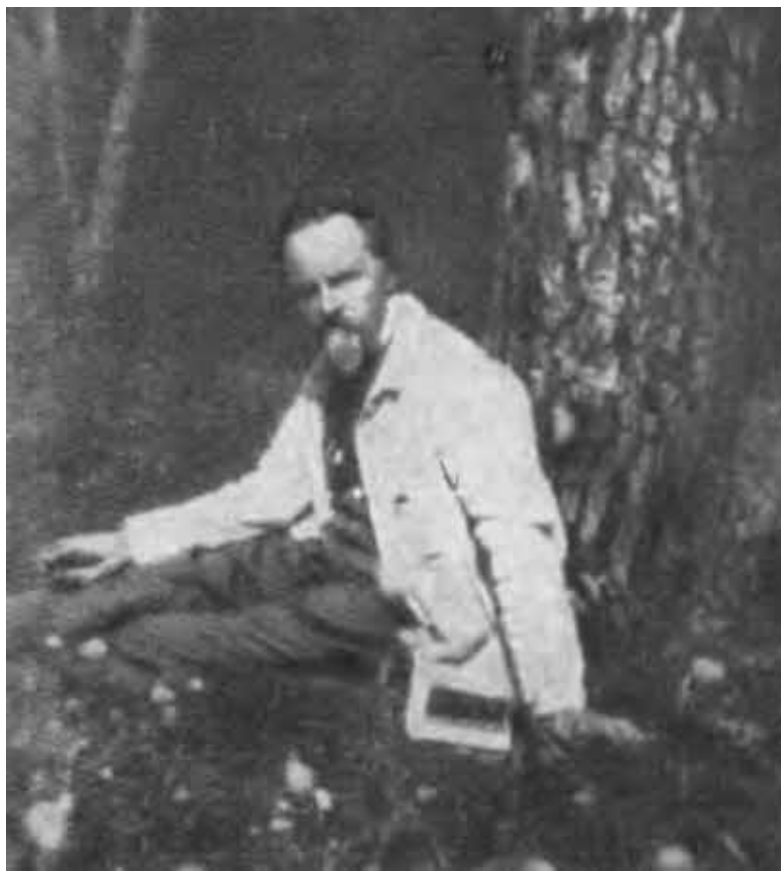
К. Д. Бальмонт.