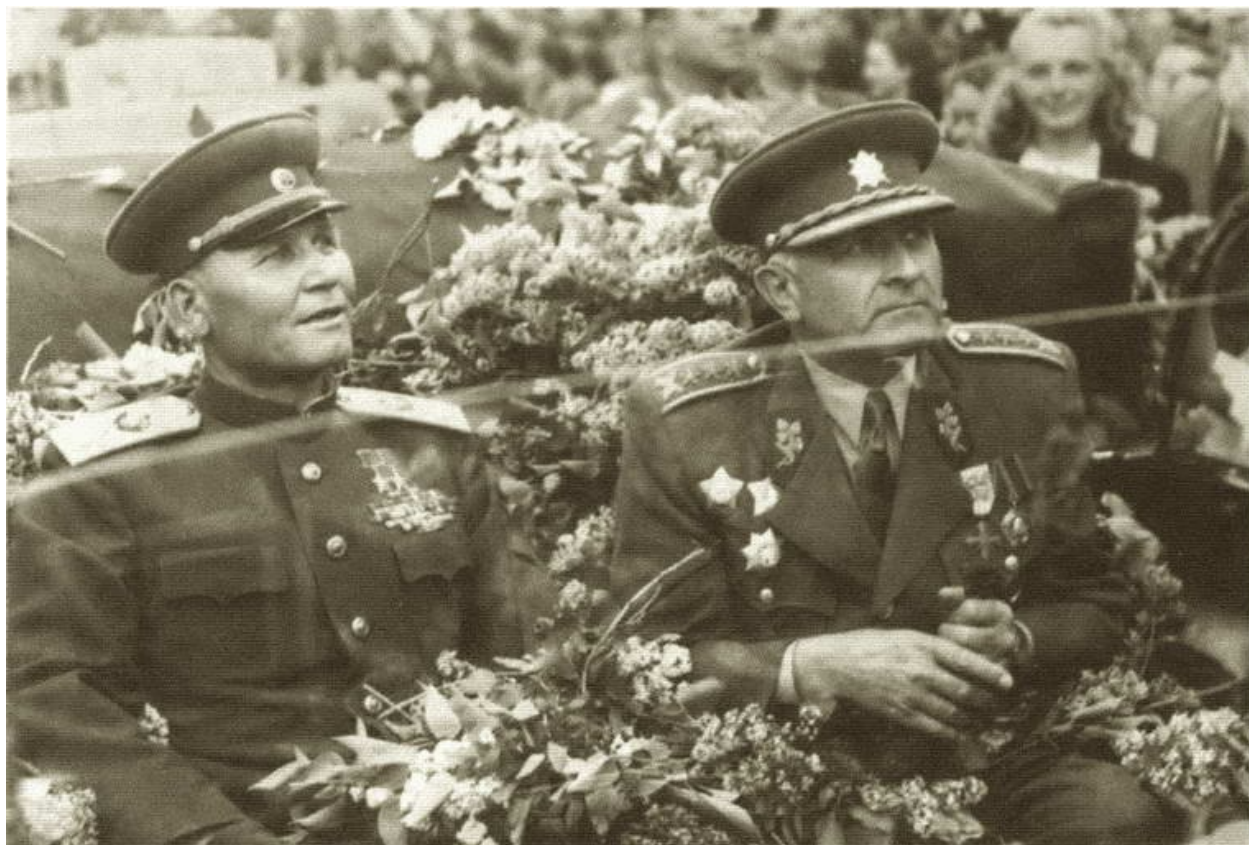
И.С. Конев и командующий 1-м Чехословацким армейским корпусом Л. Свобода. 1945 г.