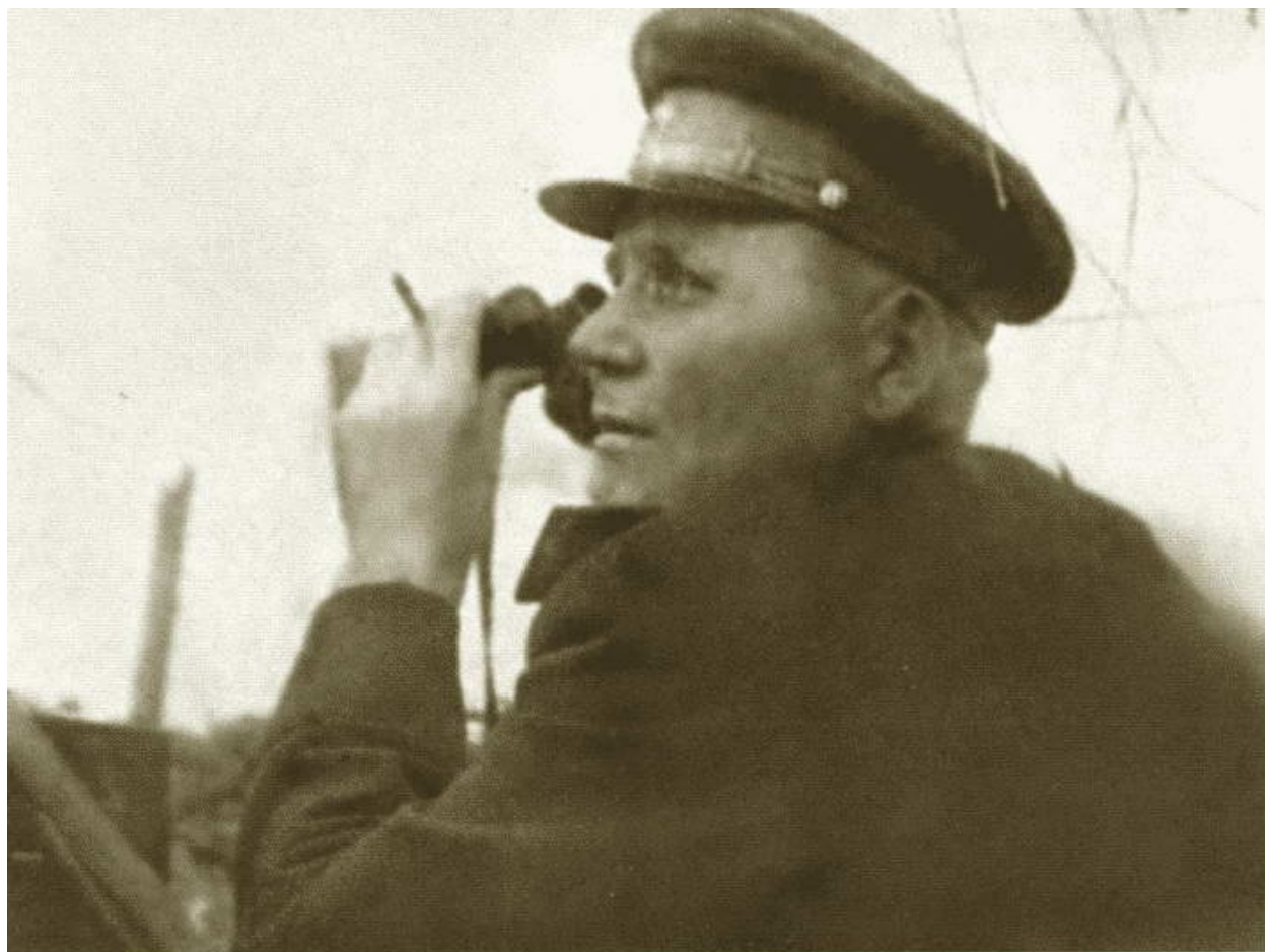
Конеv на фронте. 1944 г.