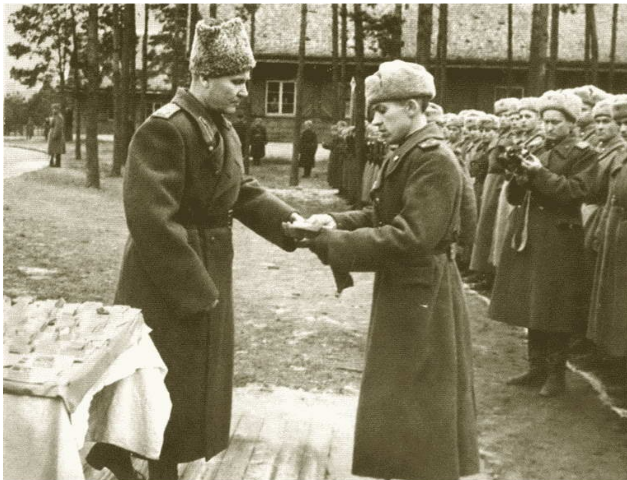
И.С. Конев на Сandomирском плацдарме вручает награды воинам. 1945 г.