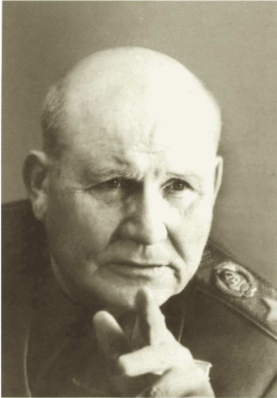
Маршал Иван Степанович Конев