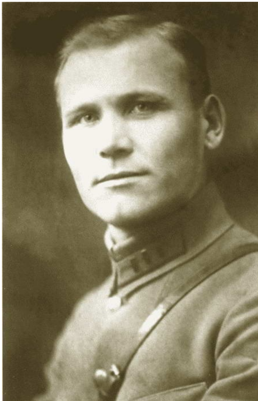
И.С. Конев — командир 50-го стрелкового полка. Середина 1930-х гг.