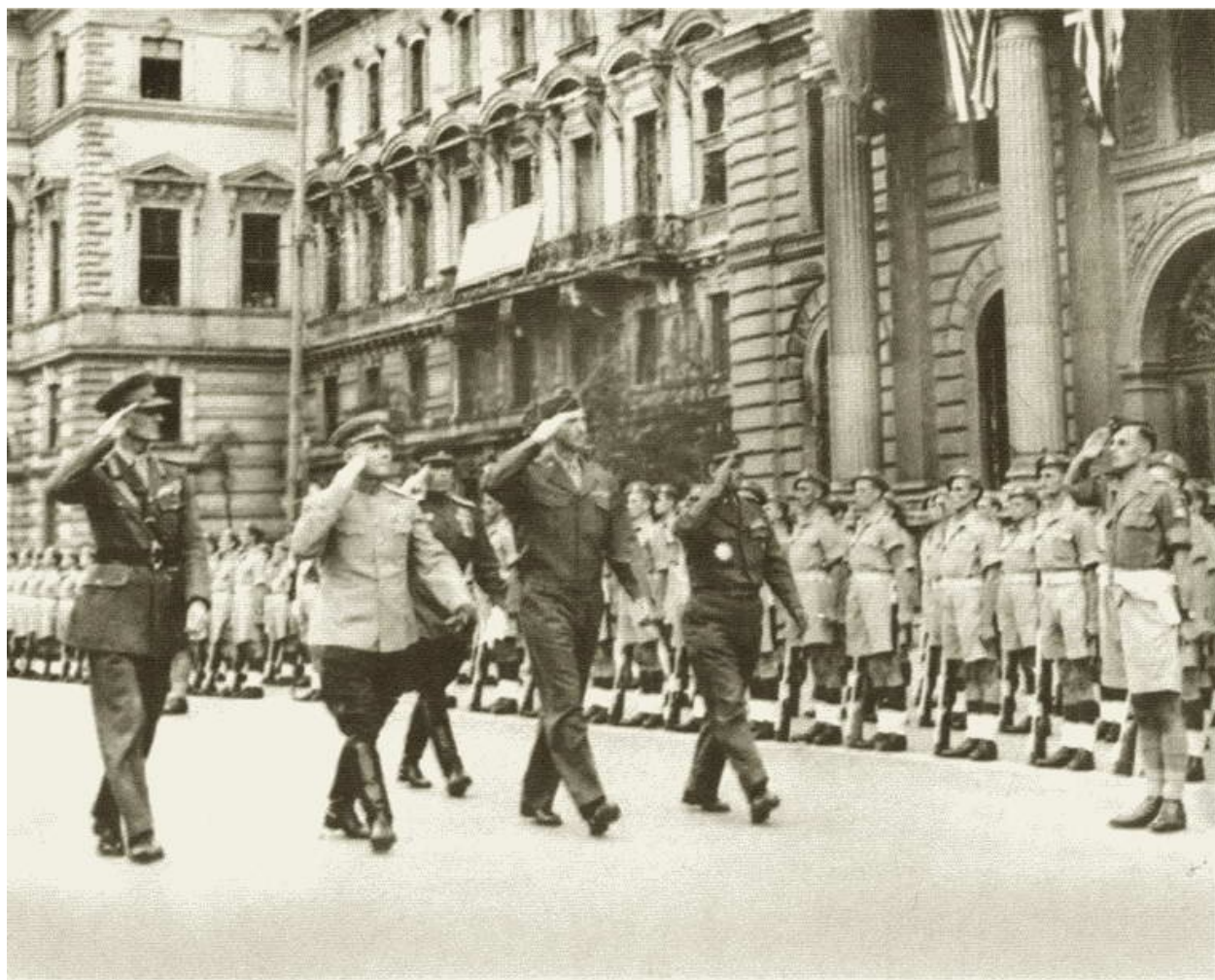
Парад союзных войск в Вене. 1945 г.