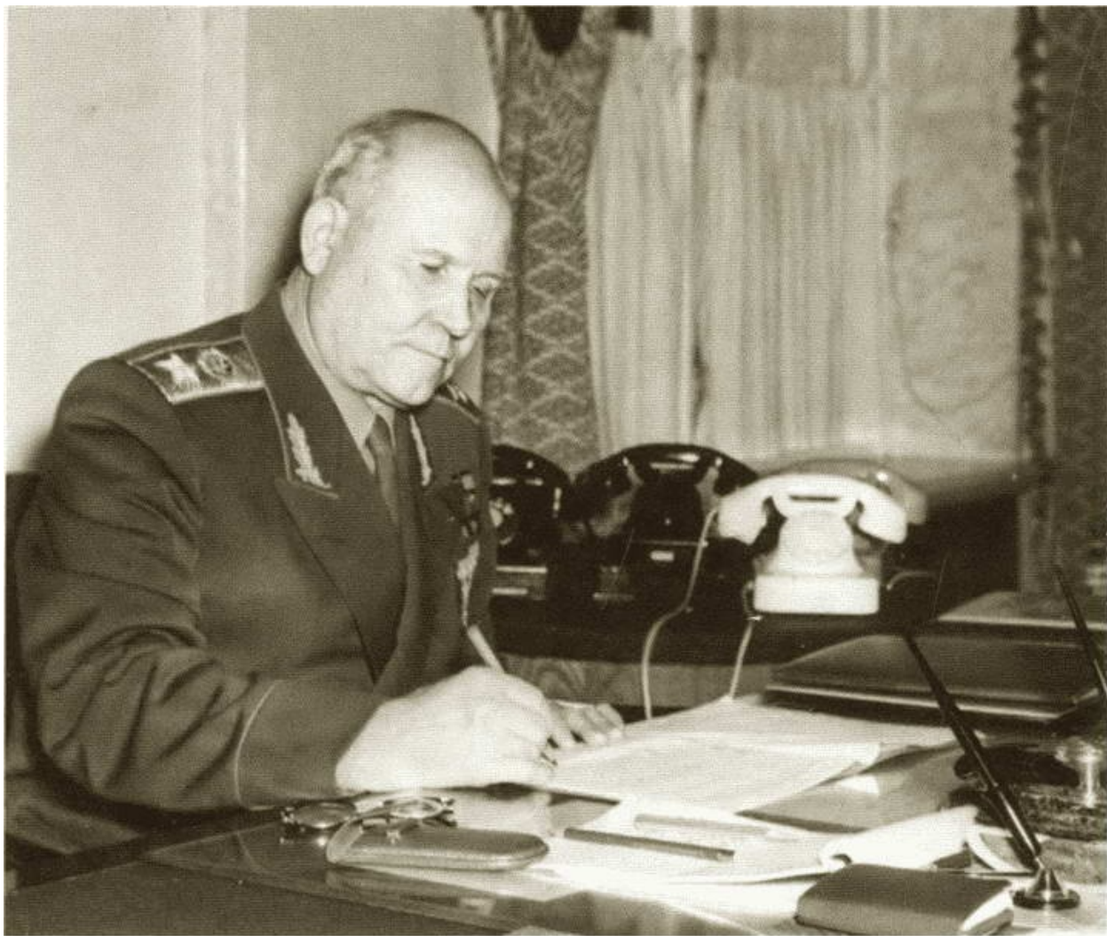
Первый заместитель министра обороны И.С. Конев в рабочем кабинете. Конец 1950-х гг.