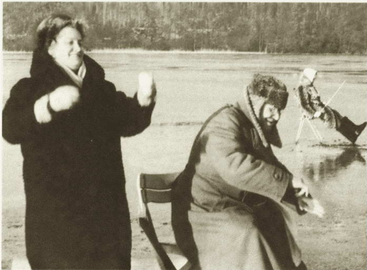
И.С. Конев с женой и дочерью на зимней рыбалке в Бадзарове. 1962 г.