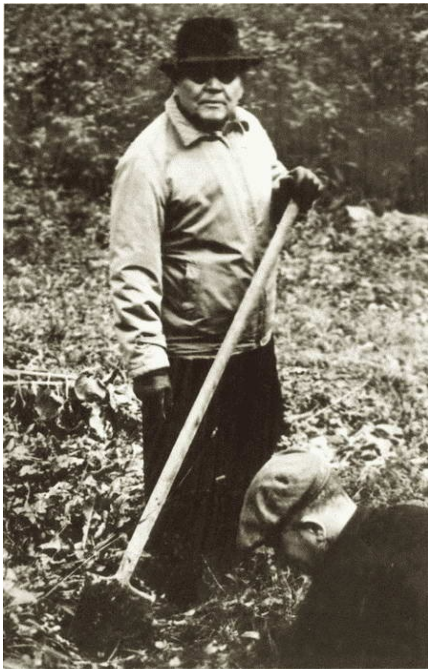
И.С. Конев на даче. Начало 1960-х гг.