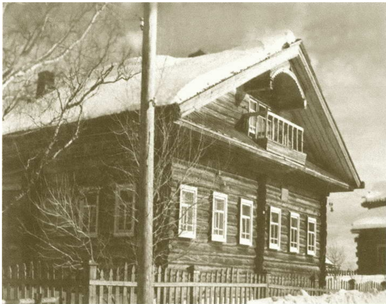
Дом Коневых в деревне Лодейно