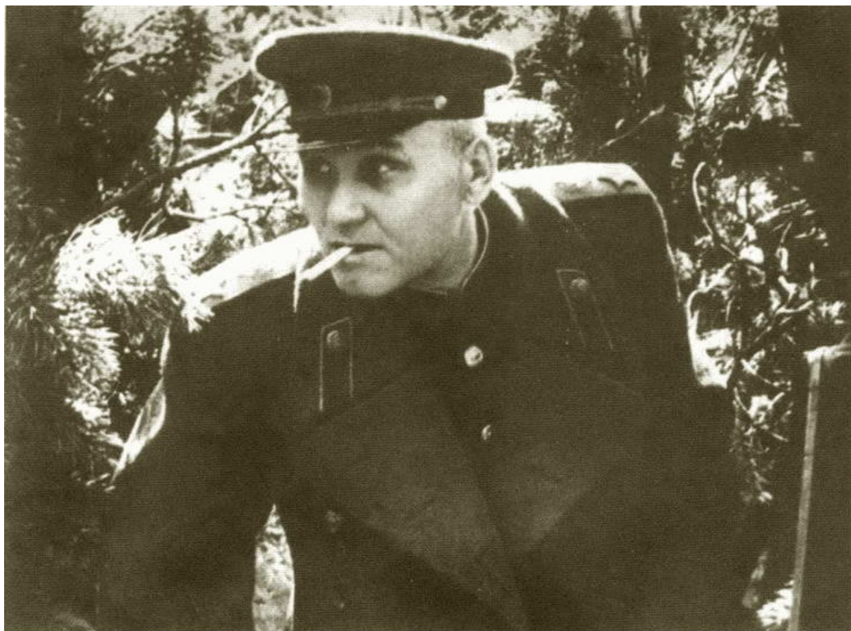
И.С. Конев во время подготовки Берлинской операции. 1945 г.