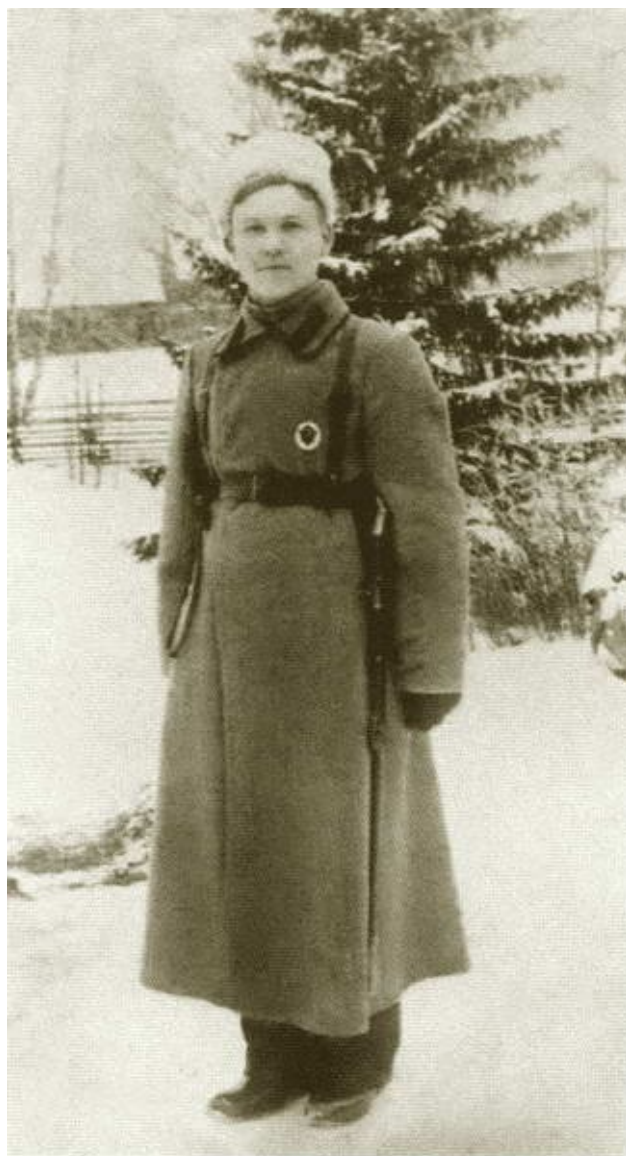
Иван Конев — солдат-большевик. 1917 г.