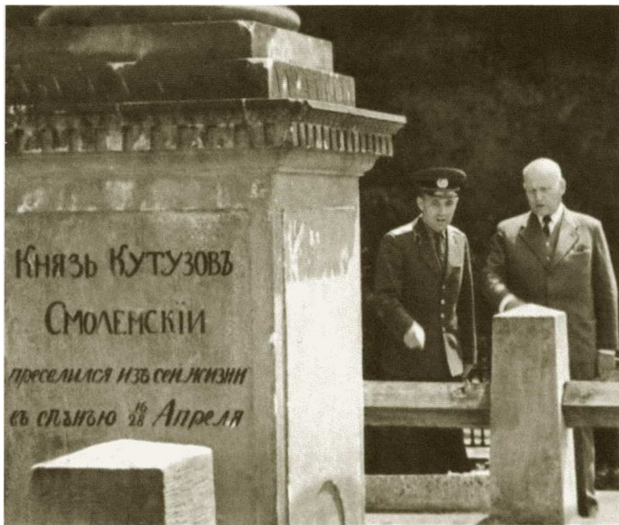
И.С. Конев (справа) у обелиска М.И. Кутузову в Польше. 1960-е гг.