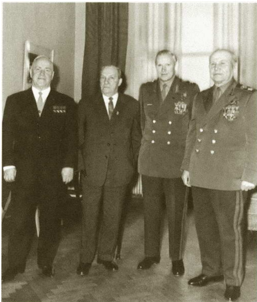
Г.К. Жуков, М. Ф.Лукин, К.К. Рокоссовский и И.С. Конев на премьере фильма о московской битве Конец 1960-х гг.