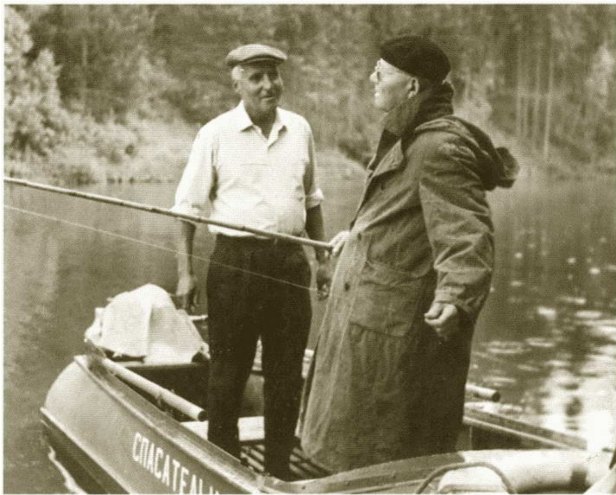
К.М. Симонов и И.С. Конев на рыбалке в Подмосковье. 1970-е гг.