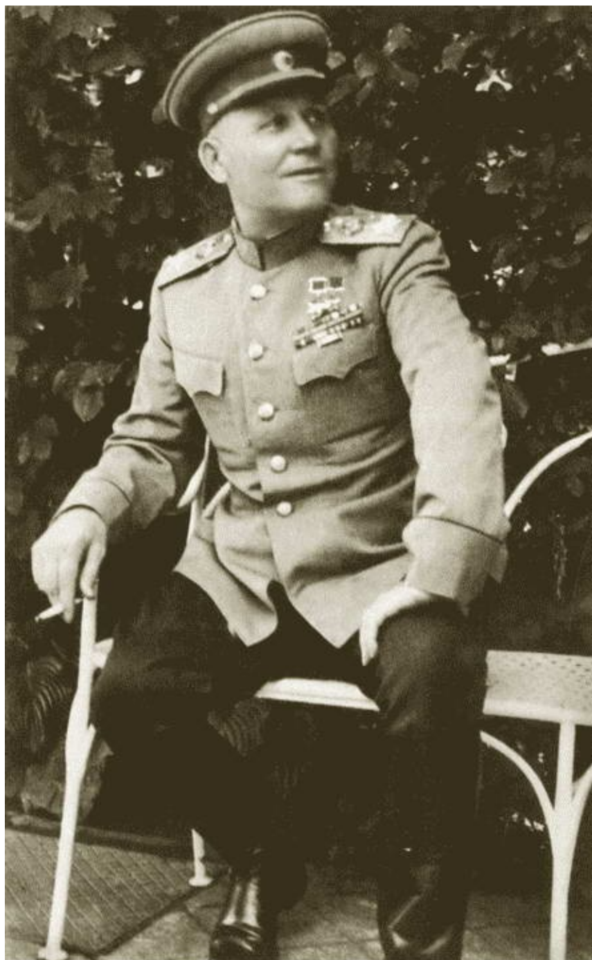
И.С. Конев в Вене. 1946 г.