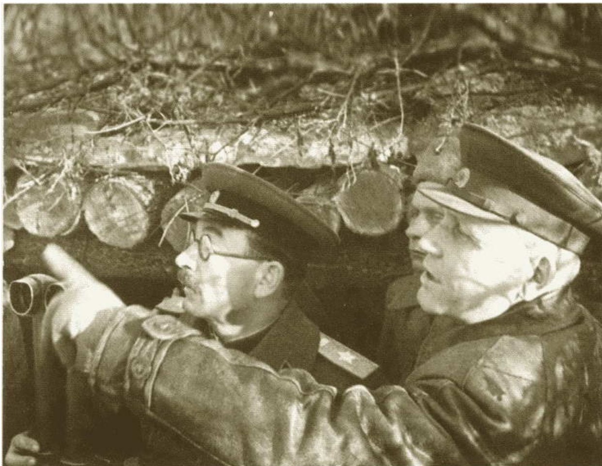
П.А. Ротмистров и И.С. Конев. 1944 г.