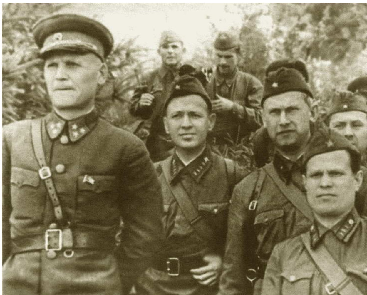
Слева направо: командующий 19-й армией И. Конев, М. Шолохов, А. Фадеев, Е. Петров. 1941 г.