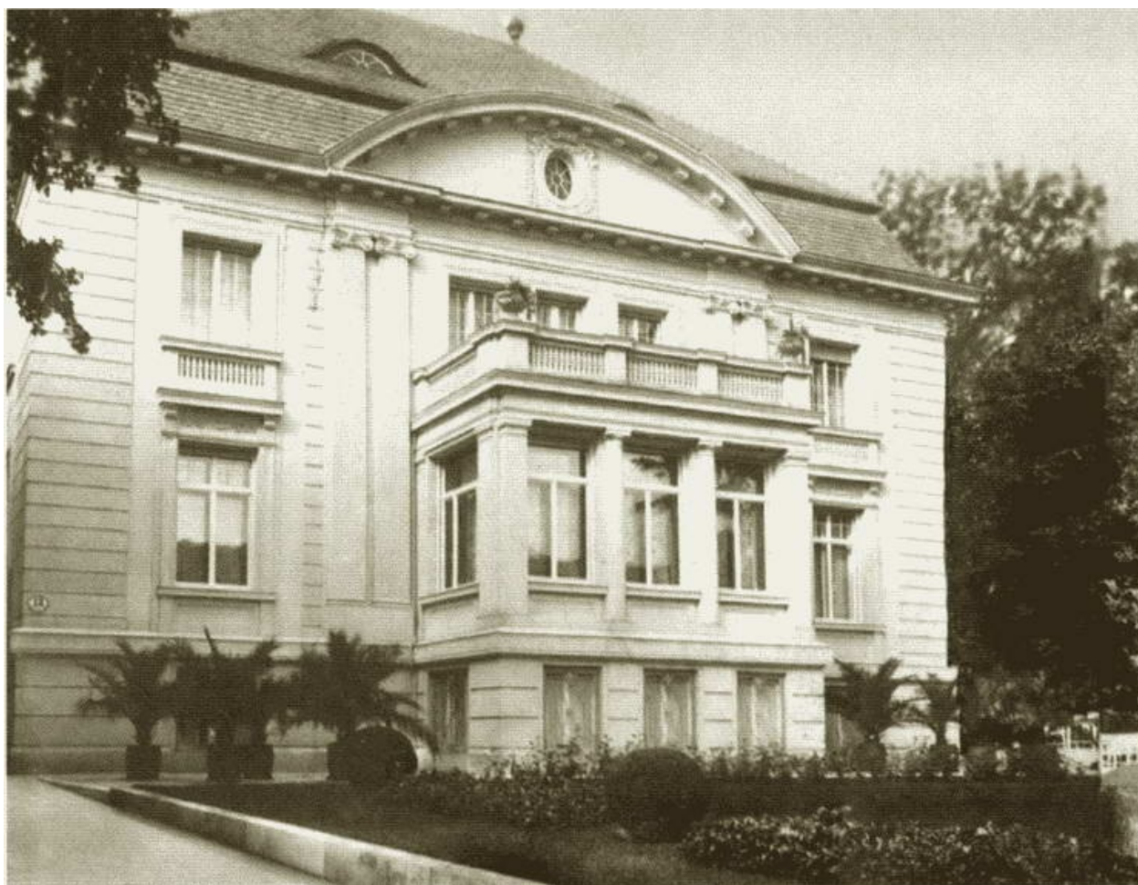
Дом в Бадене, в котором жил И.С. Конев в 1945—1946 годах