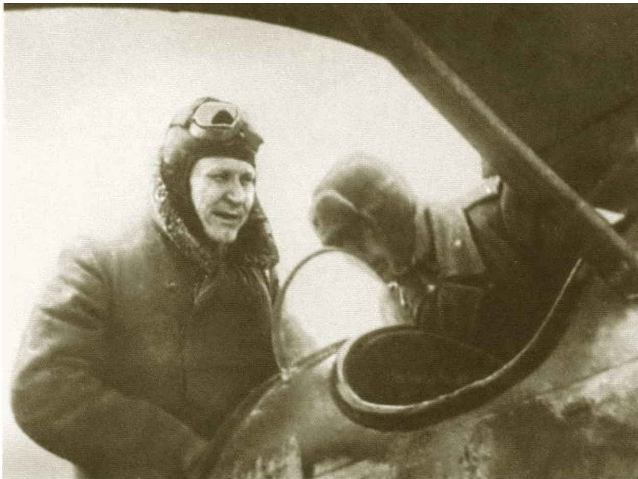
Конев под Корсунь-Шевченковским. 1944 г.