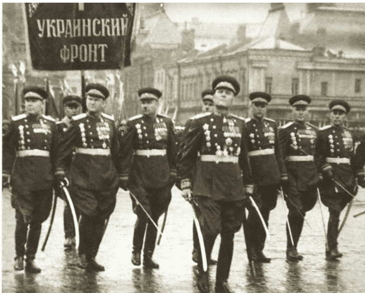
И.С. Конев на Параде Победы на Красной площади в Москве. 24 июня 1945 г.