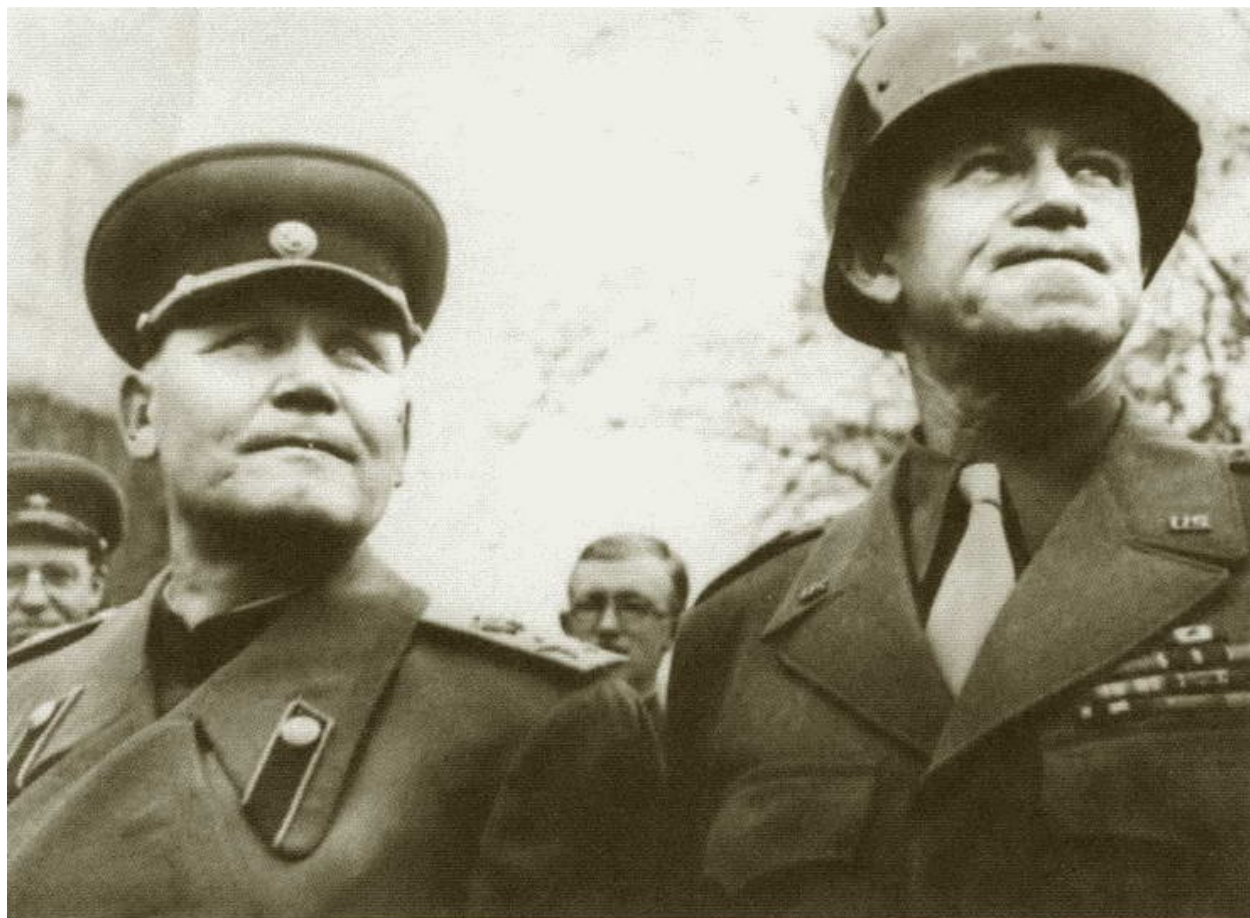
И.С. Конев и О. Бредли во время встречи на Эльбе. 1945 г.