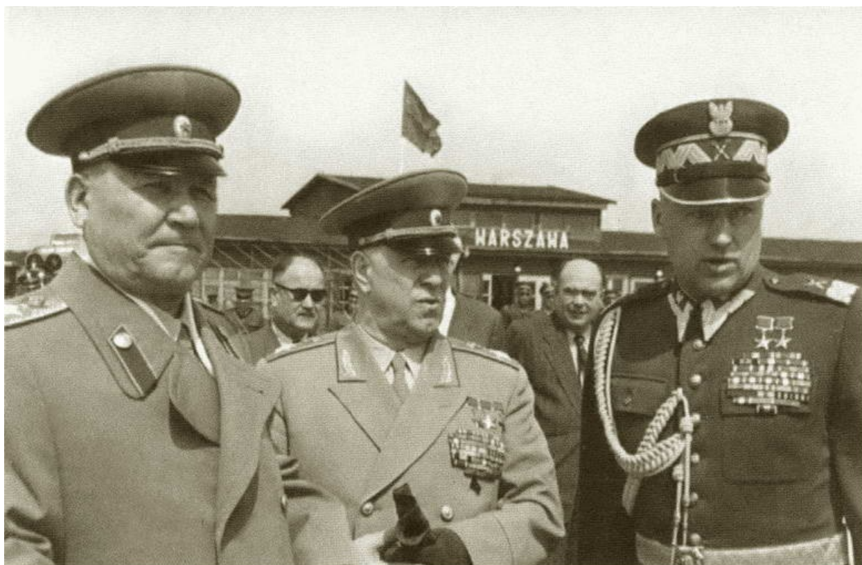
И.С. Конев, Г.К. Жуков и К.К. Рокоссовский на аэродроме в Варшаве. 1955 г.