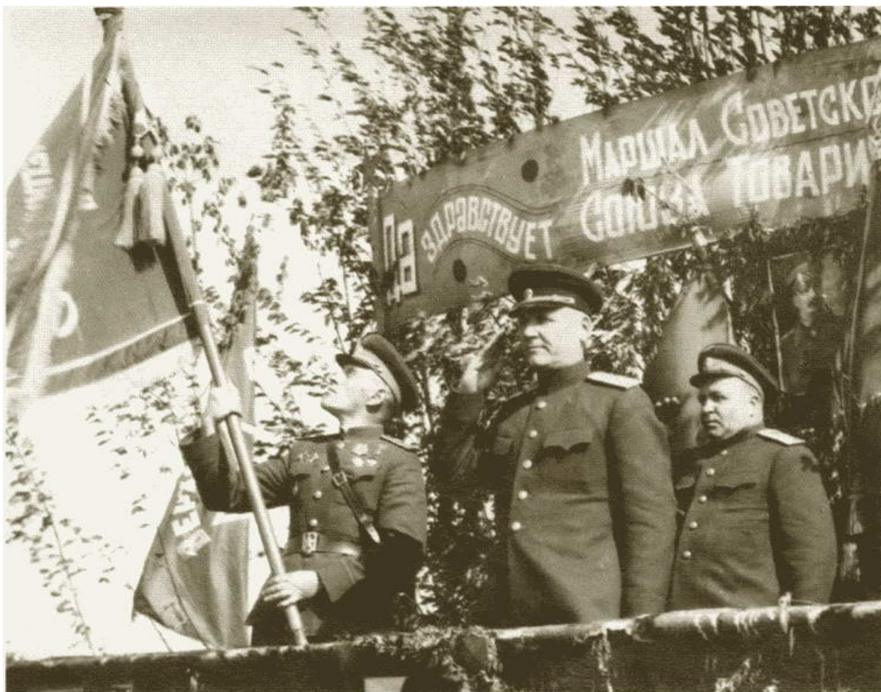
И.С. Конеv — командующий 1-м Украинским фронтом. 1944 г.