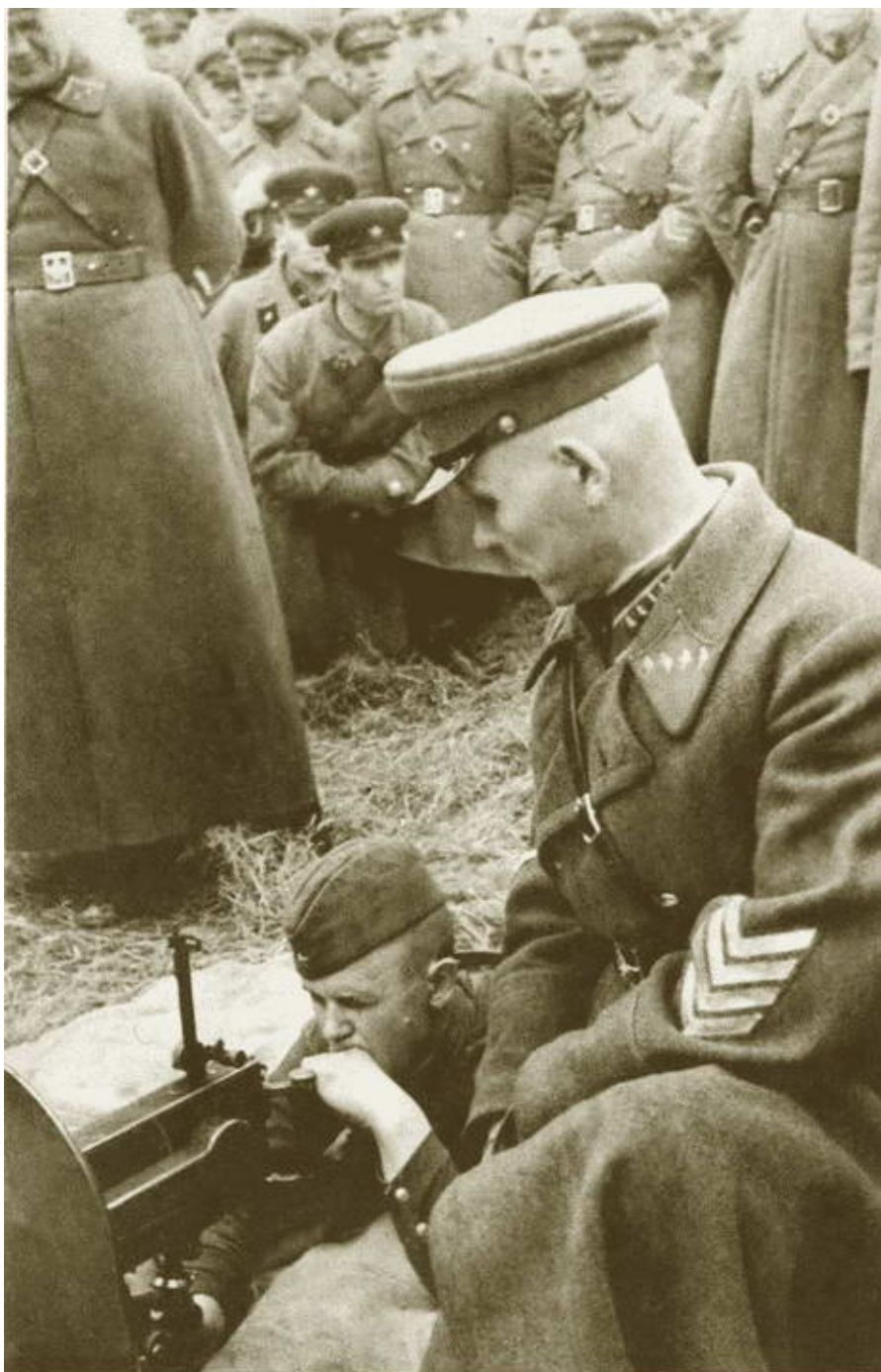
Командарм 2-го ранга И.С. Конев на учениях 2-й Отдельной Краснознамённой армии. Хабаровск, 1939 г.