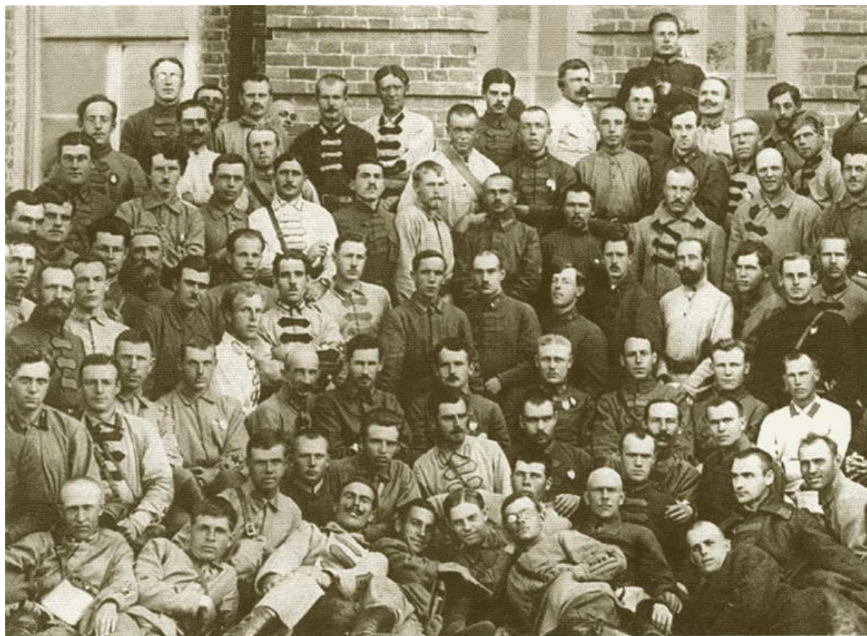
Участники корпусных манёвров (среди них И.С. Конев и К.К. Рокоссовский). Никольск-Уссурийск, 1923 г.