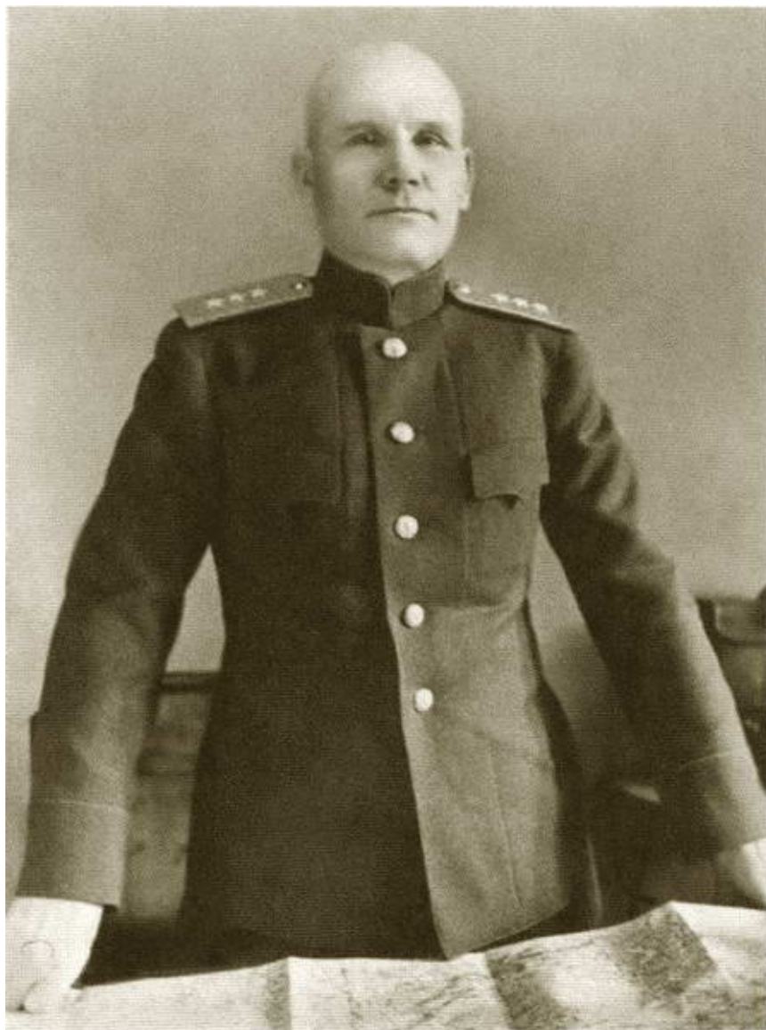
И.С. Конев — командующий 2-м Украинским фронтом. 1943 г.