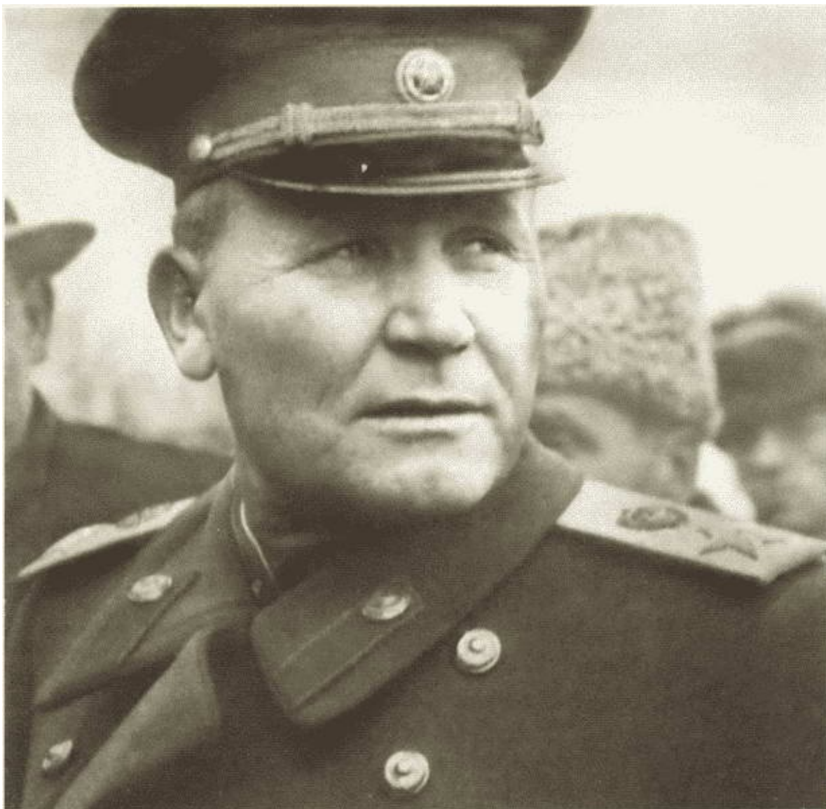
И.С. Конев — командующий Прикарпатским военным округом. Начало 1950-х гг.