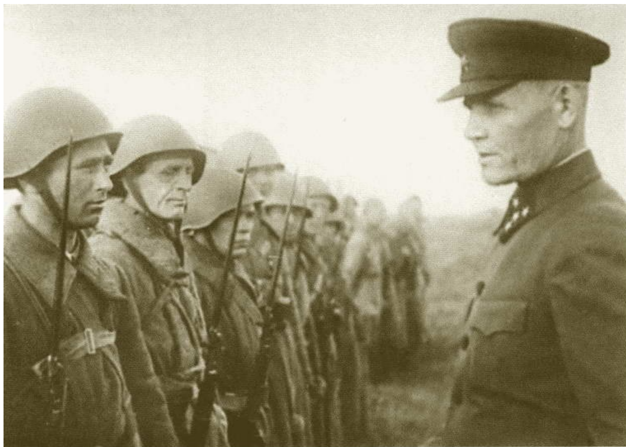
С бойцами Калининского фронта. 1941 г.