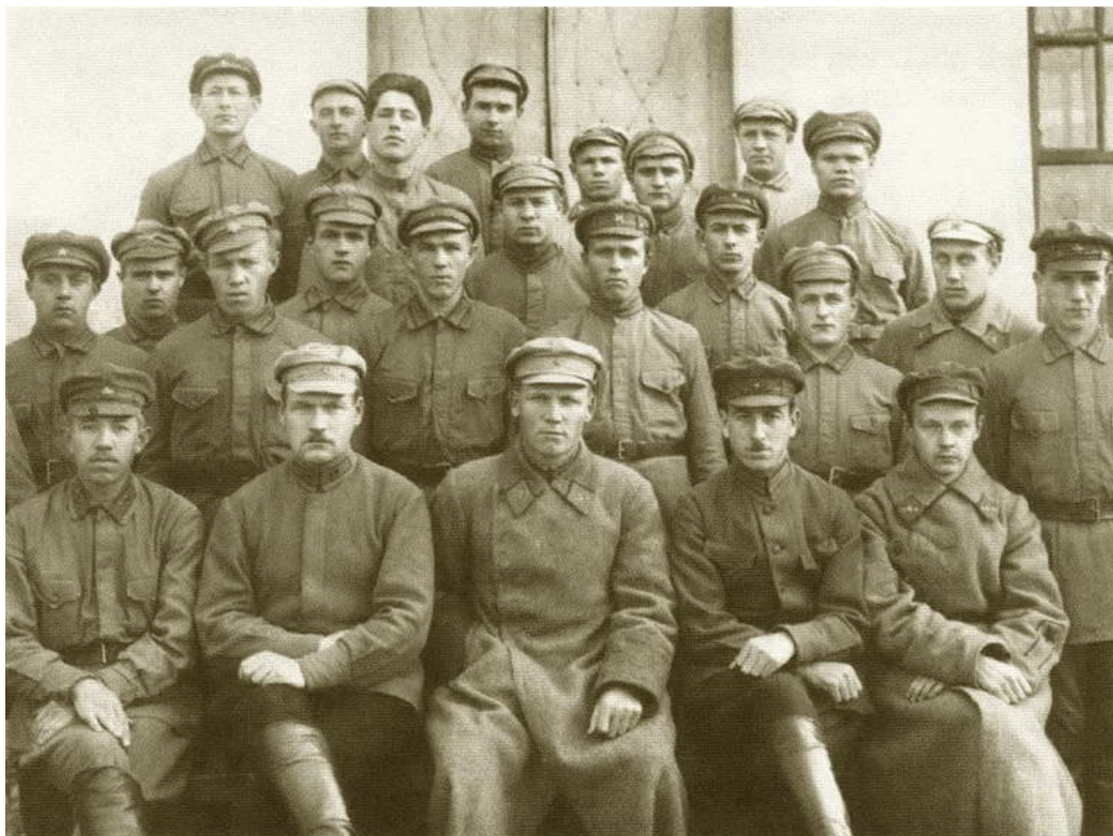
Командир 50-го стрелкового полка И.С. Конев (в первом ряду в центре) с сослуживцами. Нижний Новгород, 1926 г.