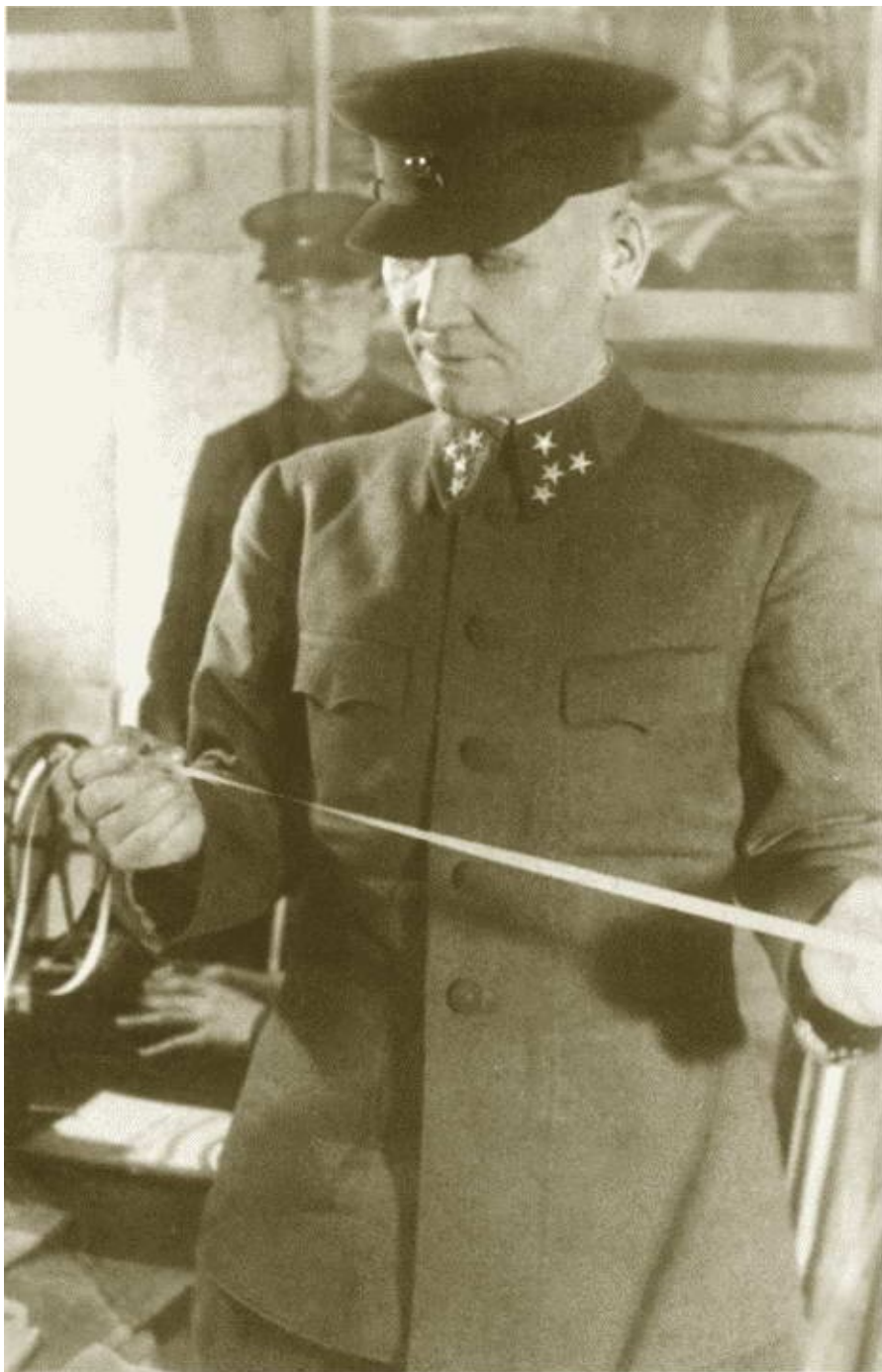
И.С. Конеv — командующий Калининским фронтом. 1941 г.