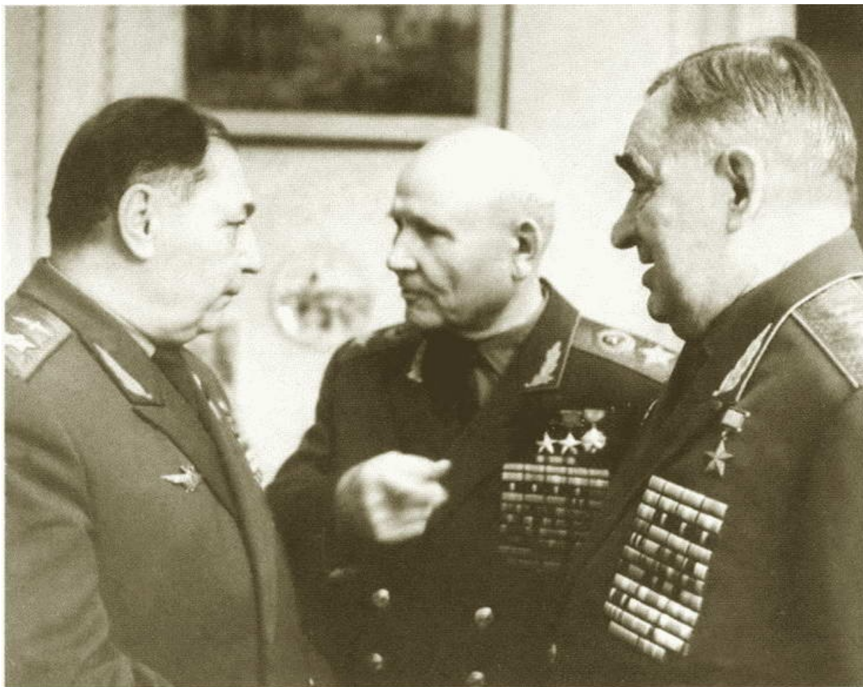
А.И. Покрышкин и А.С. Жадов с И.С. Коневым в день его 75-летия. 1972 г.