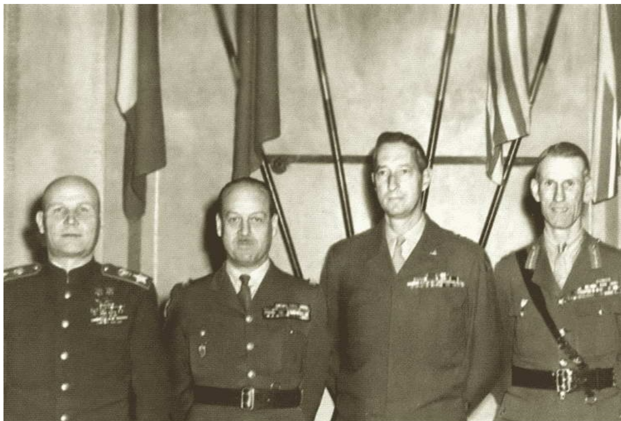
Представители союзного командования: маршал Конев, генерал Бетуар (Франция), генерал Кларк (США) и генерал Маккрири (Великобритания)