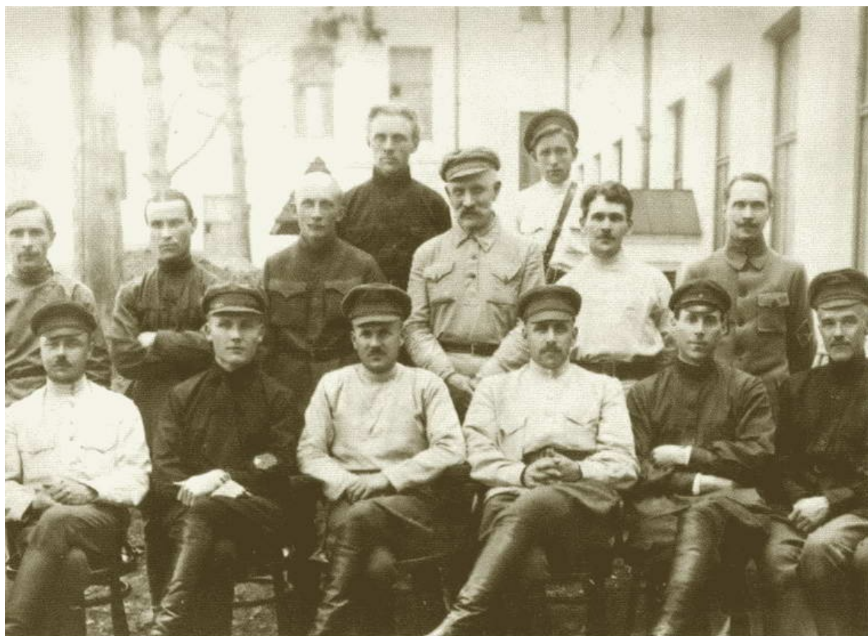
И.С. Конев (в первом ряду третий слева) и В.К. Блюхер (в первом ряду третий справа) с соратниками. Дальний Восток