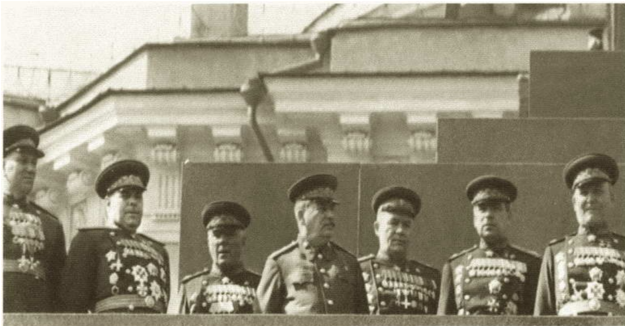
И.В. Сталин и маршалы Советского Союза на трибуне мавзолея. Начало 1950-х гг.