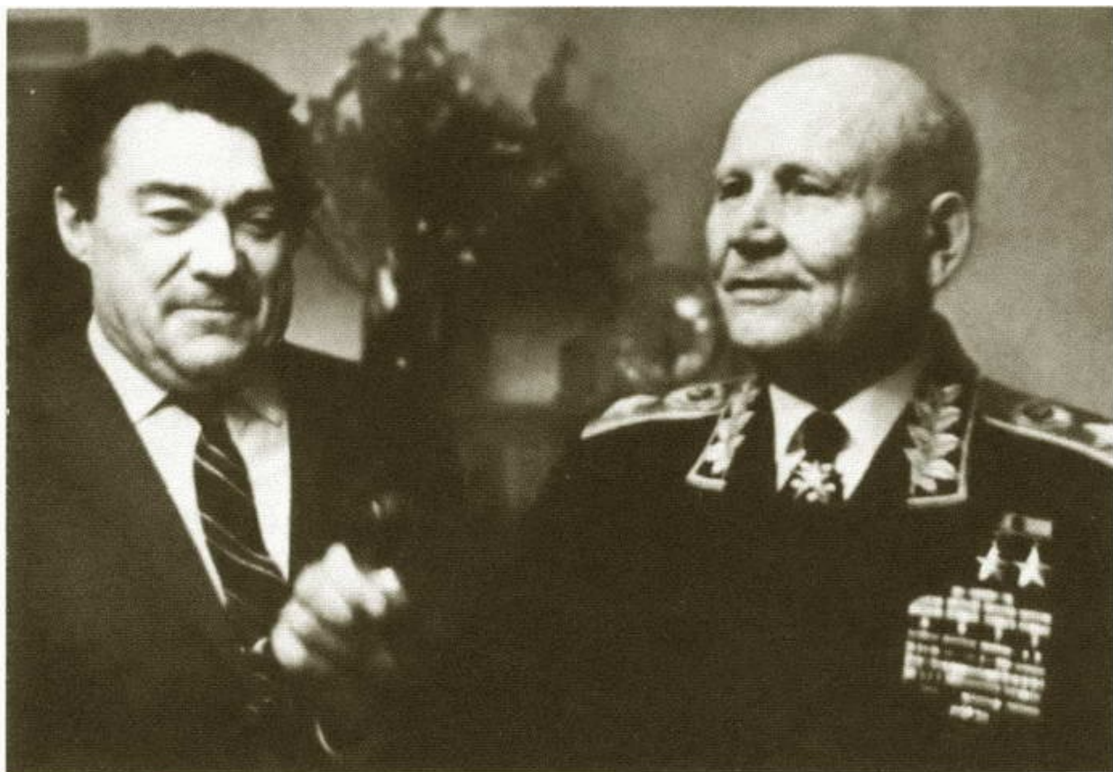
Б.Н. Полевой и И.С. Конев на праздновании 25-летия освобождения города Калинина. 1967 г.