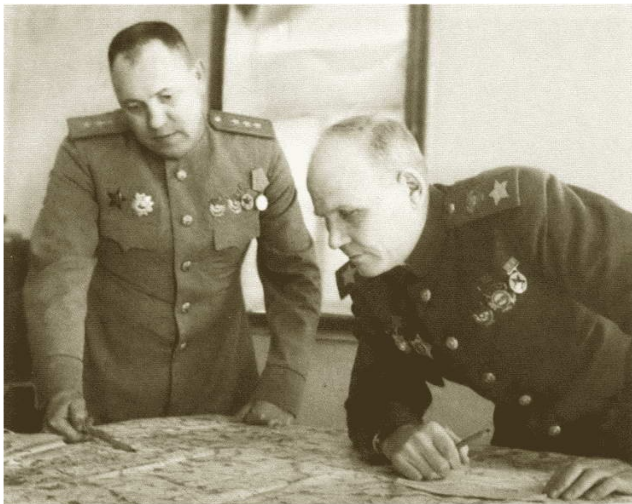
И.С. Конев и начальник штаба М.В. Захаров. 1944 г.