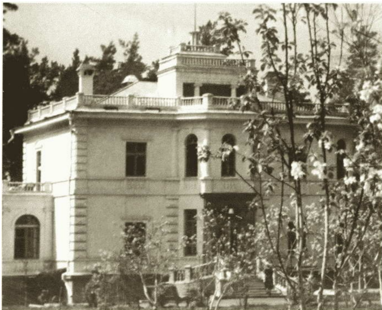
Государственная дача И.С. Конева в посёлке Архангельское