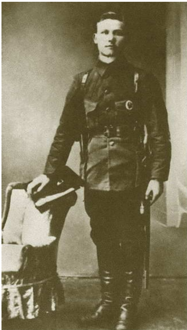
И.С. Конев — военный комиссар города Никольска. 1918 г.