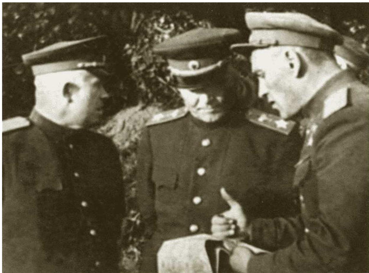
Н.С. Хрущёв и И.С. Конев в период проведения Львовской операции. 1944 г.