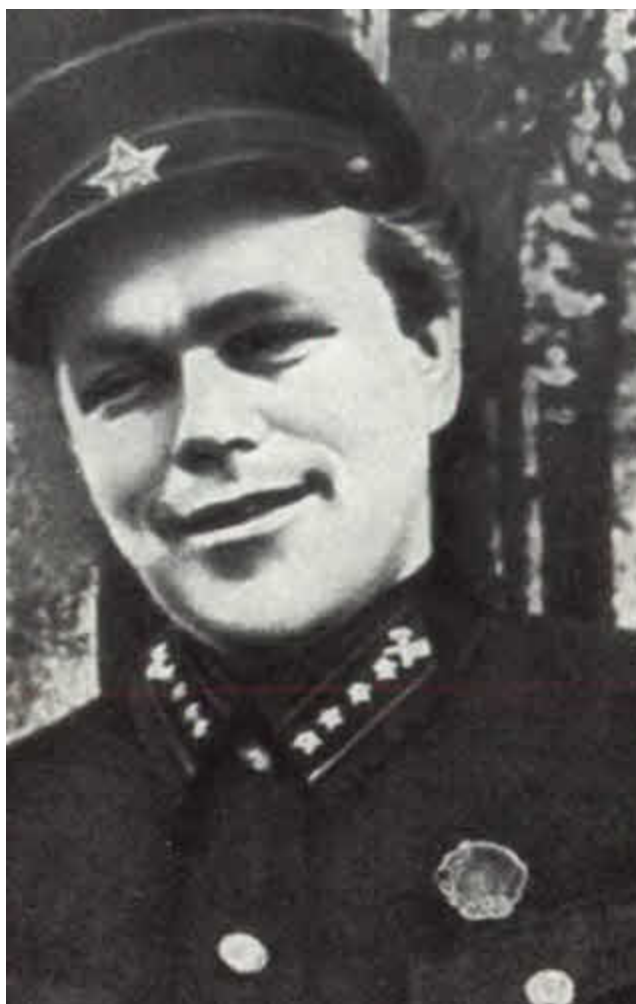
Николай Чаплин. 1936.