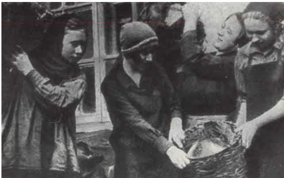
Комсомольский воскресник. 1932.