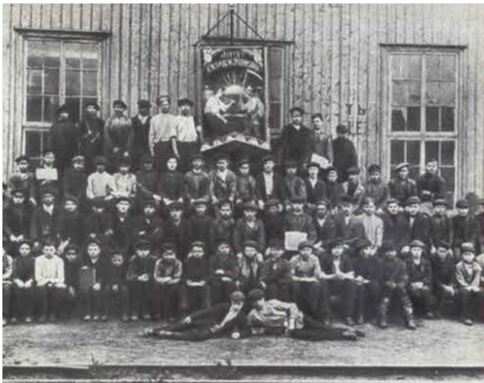
Группа молодых рабочих завода «Розенкранц».