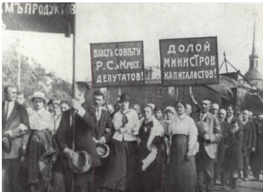
Елизавета Пылаева среди демонстрантов. 1917.