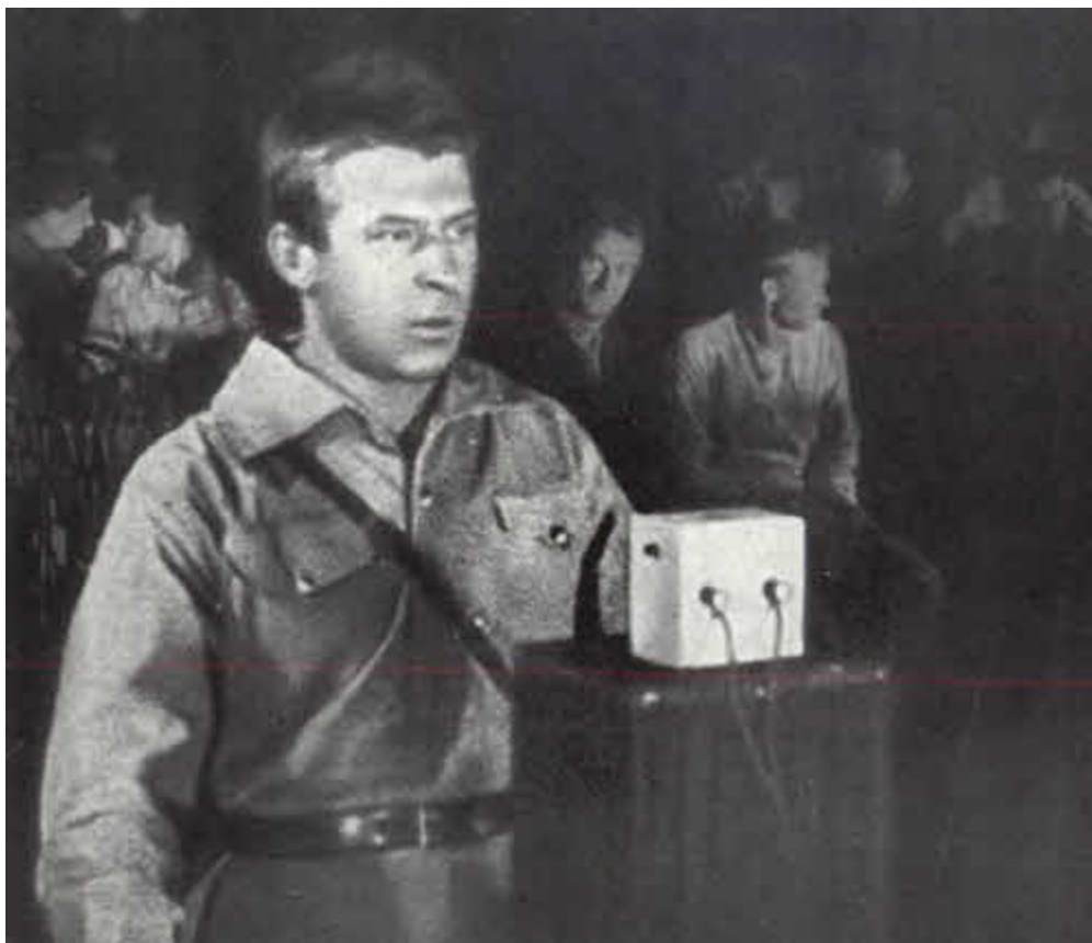
Александр Косарев на конгрессе Коминтерна.