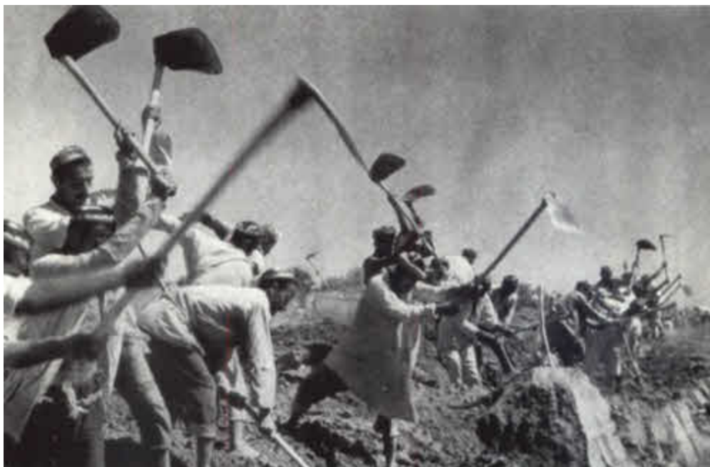
Строительство Ферганского канала. 1939