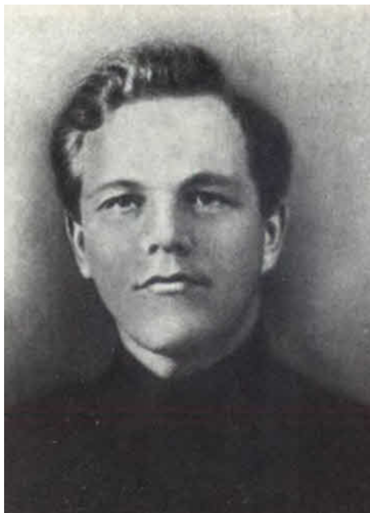
Николай Чаплин, секретарь ЦК ВЛКСМ.