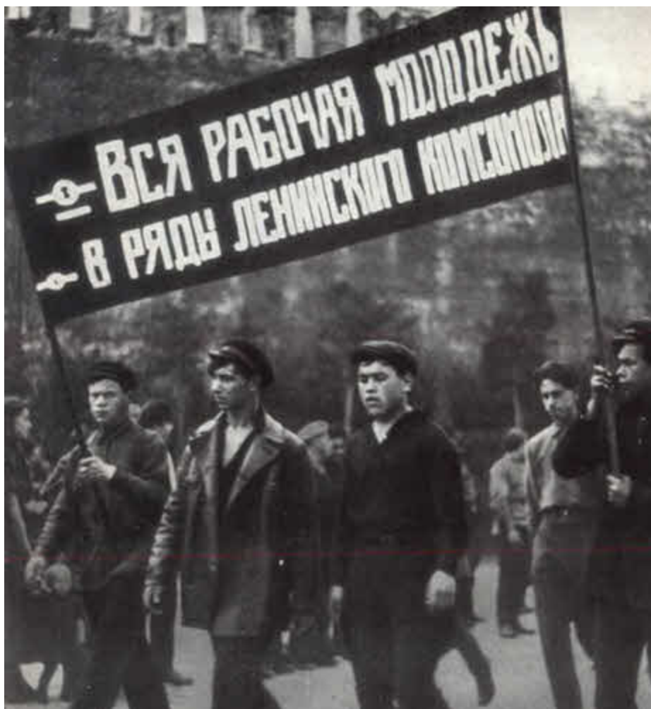
Колонна комсомольцев на Красной площади. Москва, 1925.