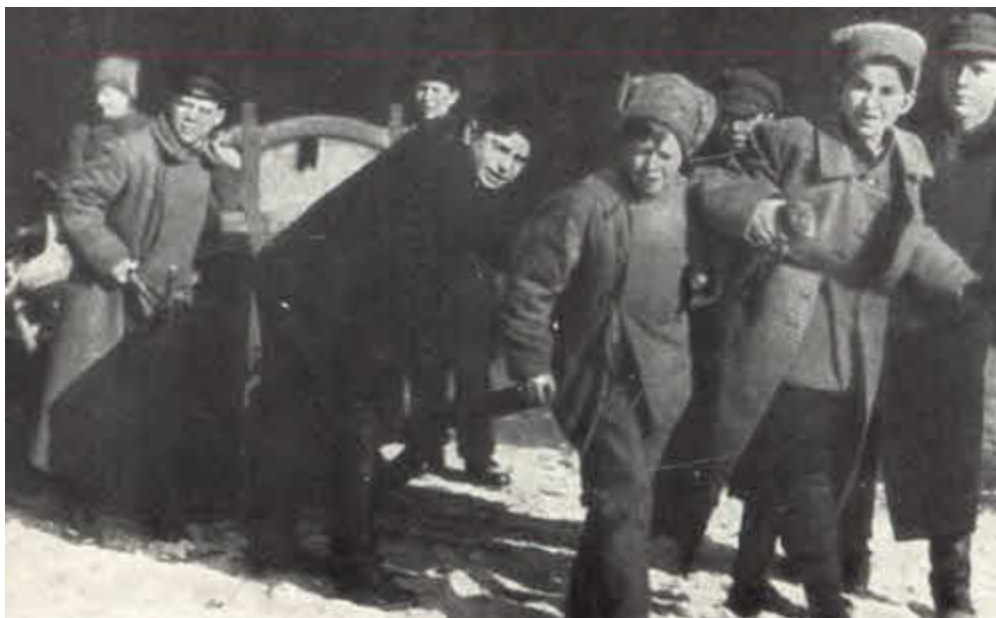
Питерские комсомольцы на субботнике. 1919