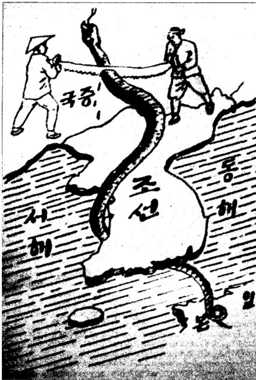
Японская империя — змея, удушившая независимость Кореи. Рисунок корейцев-партизан. 1930-е гг.