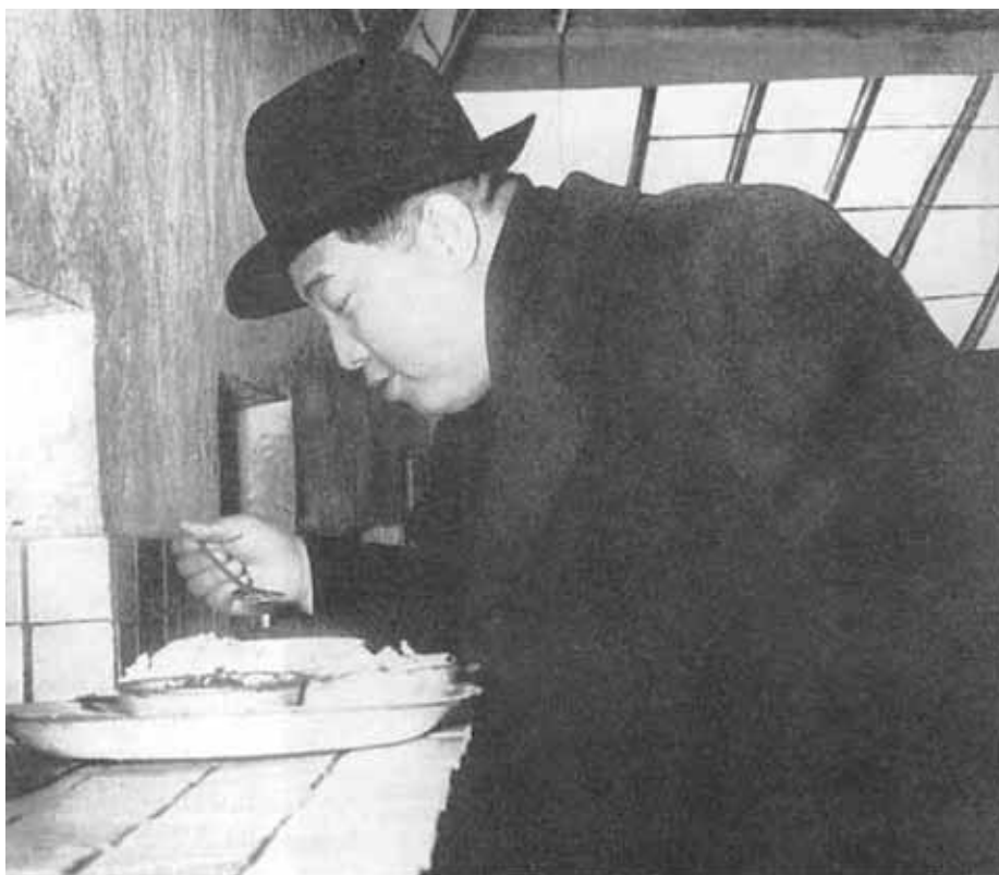
Вождь-отец в рабочей столовой. 1961 г.