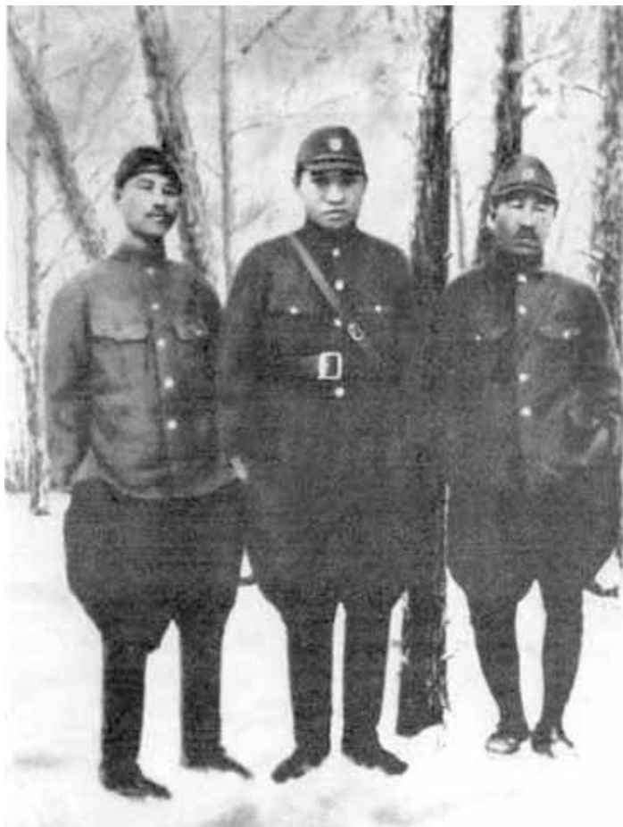
Ким Ир Сен (в центре) с товарищами по партизанскому отряду. 1930-е гг.