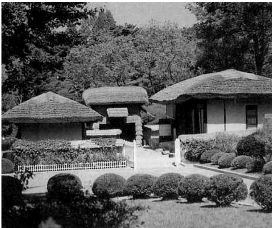
Дом в Мангёндэ, вблизи Пхеньяна, где родился Ким Ир Сен.