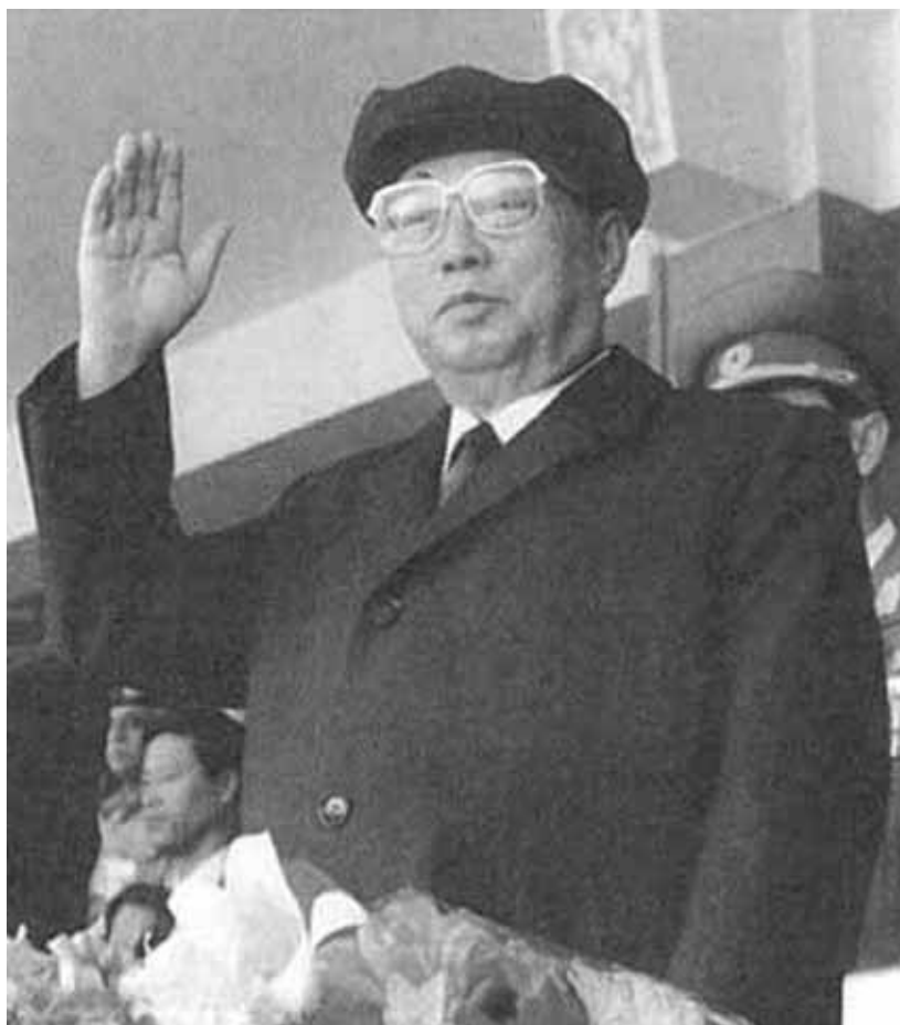
Вечное приветствие своему народу.