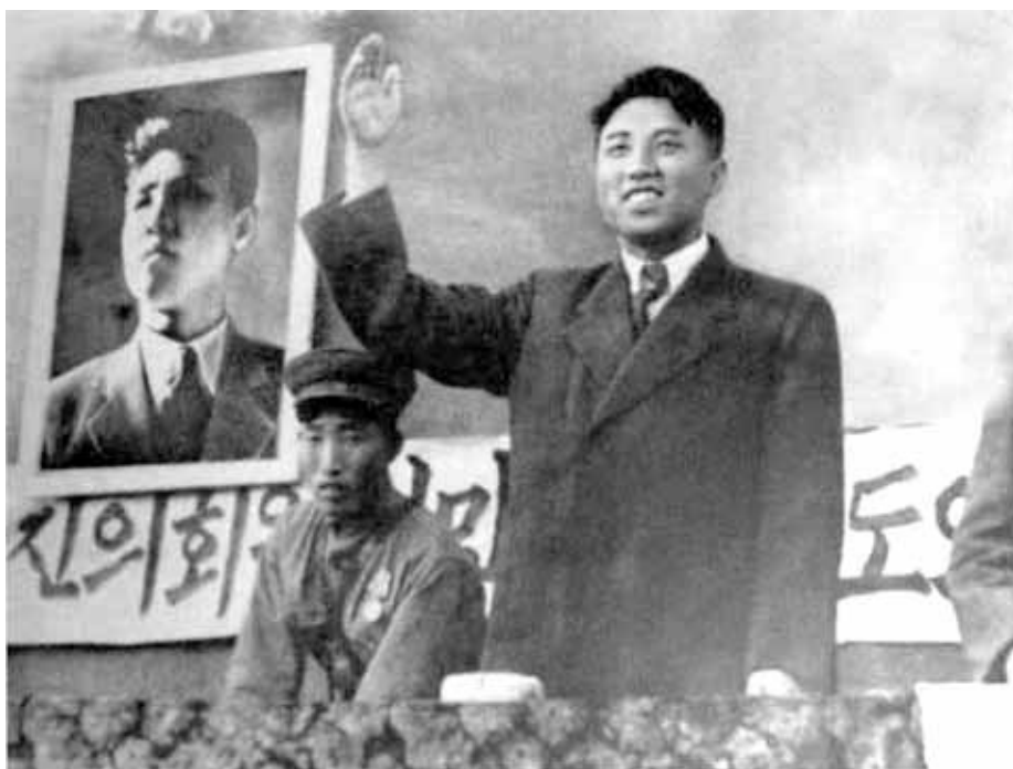
Приветствие избирателям на митинге в честь первых выборов. 16 октября 1947 г.