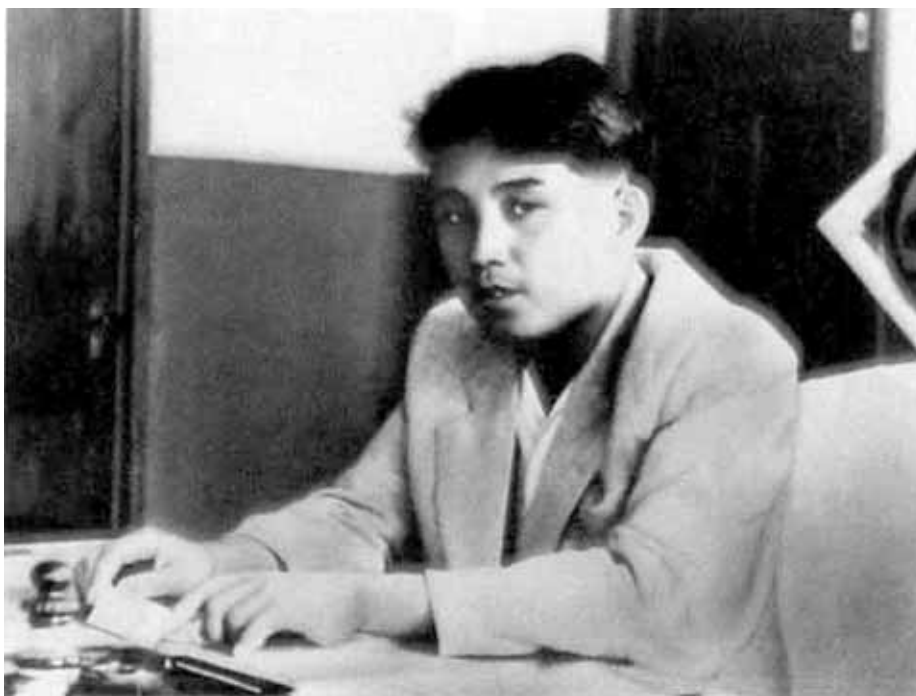
После возвращения Ким Ир Сена на родину корейцы удивлялись молодости прославленного партизанского командира. 1945 г.