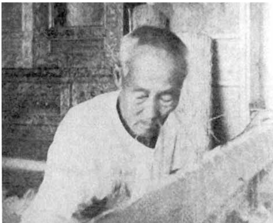
Дед Ким Ир Сена Ким Бо Хён.