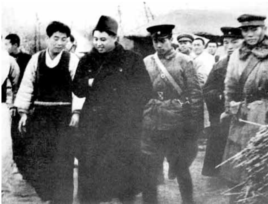
Проверка хода выполнения земельной реформы на местах. 1947 г.