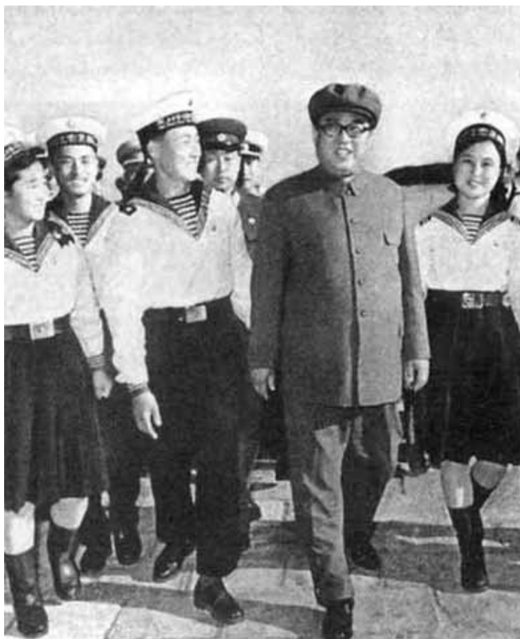
...и флот тоже. 1960-е гг.