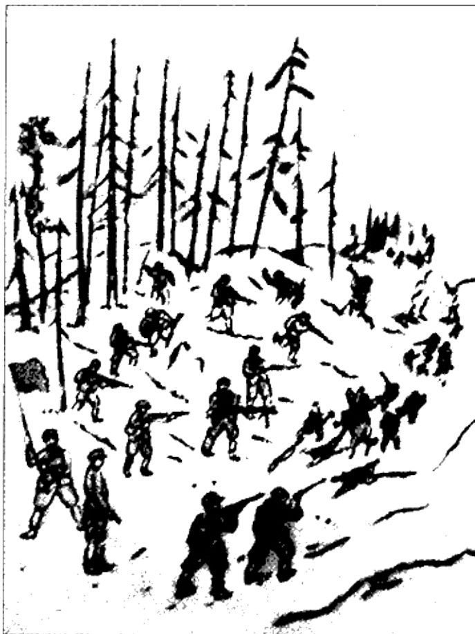
Зарисовки боев, сделанные «с натуры». Рисунки корейцев-партизан. 1930-е гг.