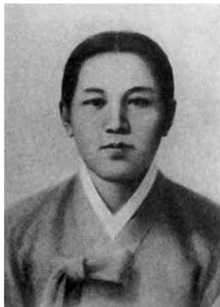
Мать Ким Ир Сена — Кап Баи Сок.