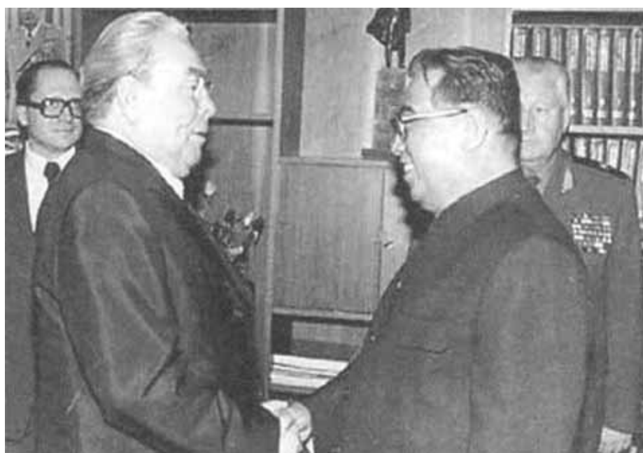
Леонид Брежнев и Ким Ир Сен. Встреча на похоронах Иосипа Броз