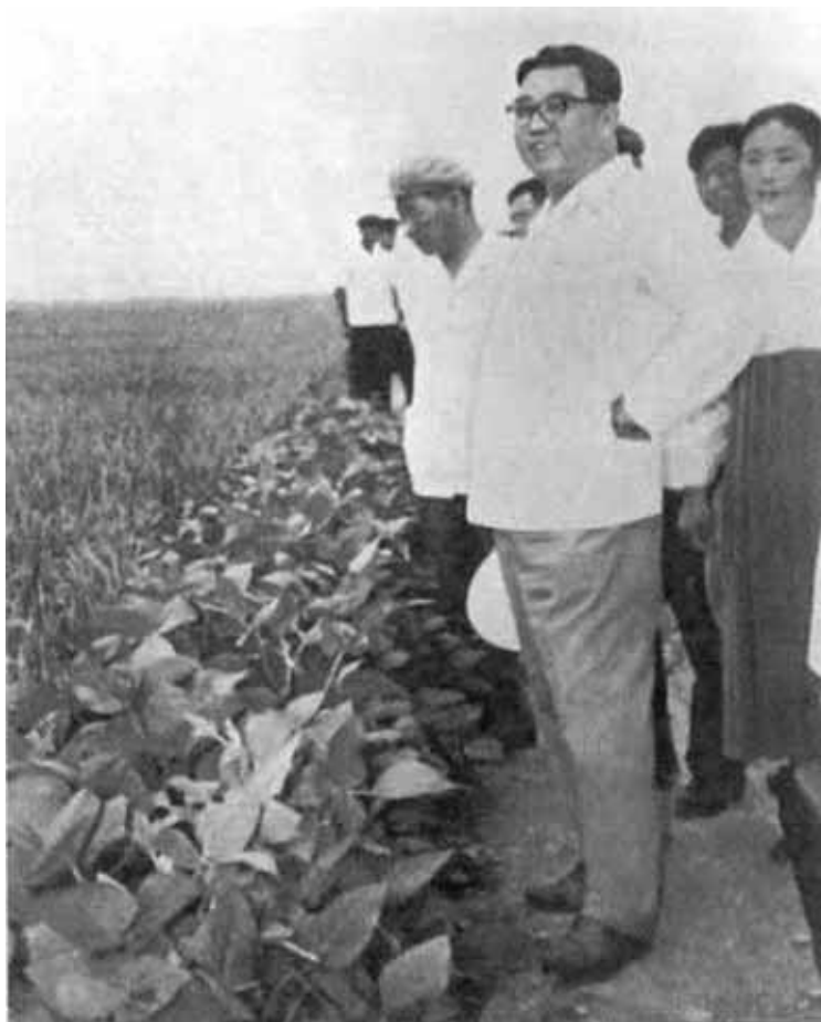
Богатым урожай на полях совхоза «Мигок». 1960-е гг.