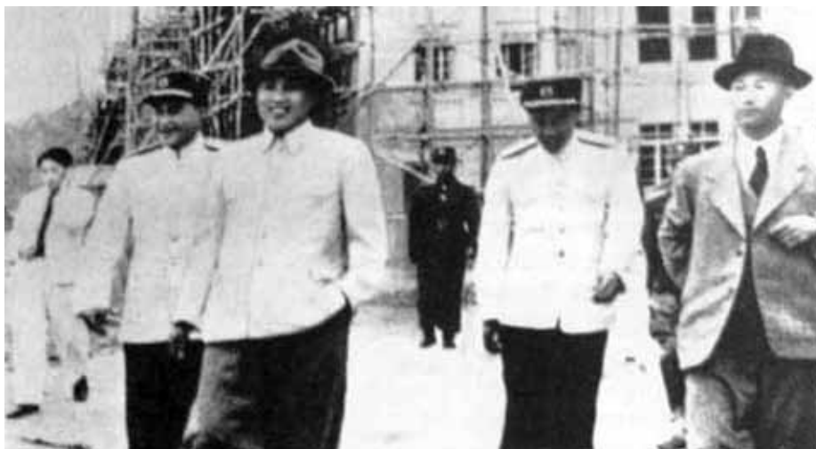
Послевоенный Пхеньян отстроили ударными темпами. Середина 1950-х гг.