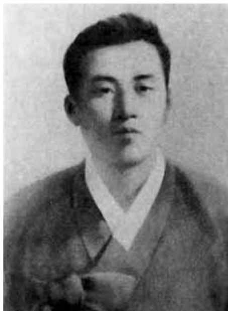
Отец Ким Ир Сена — Ким Хён Чжик и мать Кап Баи Сок.