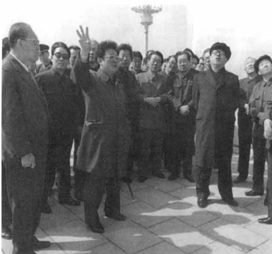
Великий вождь и Любимый руководитель у монумента идей чучхе. 1980-е гг.