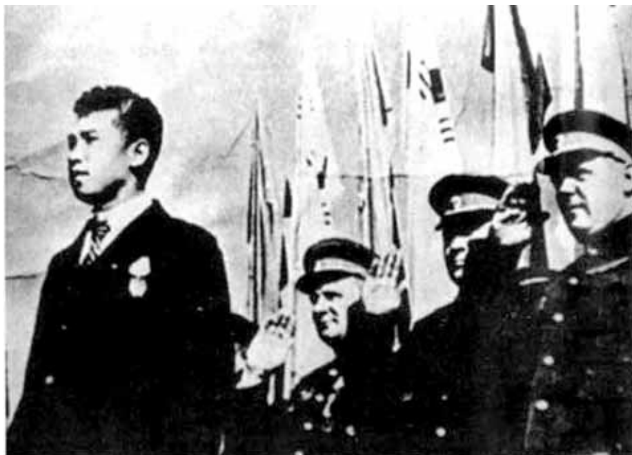
Ким Ир Сен на митинге по случаю освобождения Кореи. Позади — советские генералы. 14 октября 1945 г.