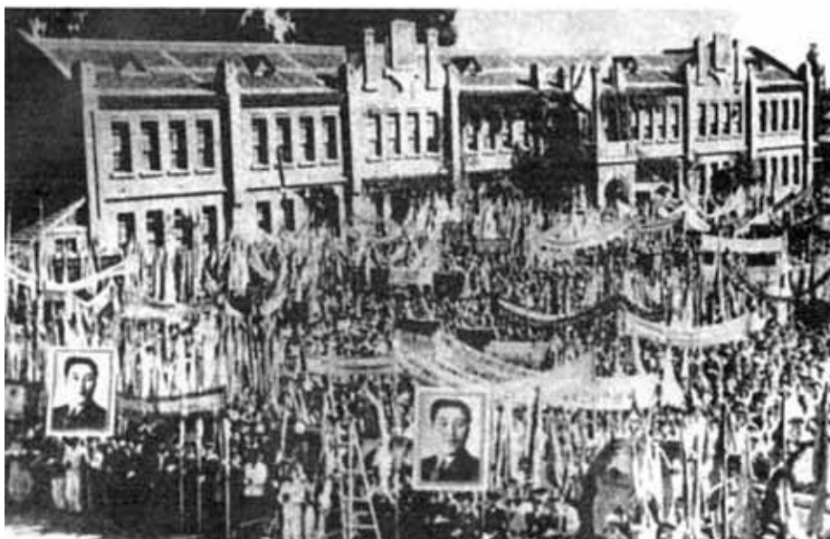
Митинг в Пхеньяне по случаю образования Единого демократического отечественного фронта. 1948 г.