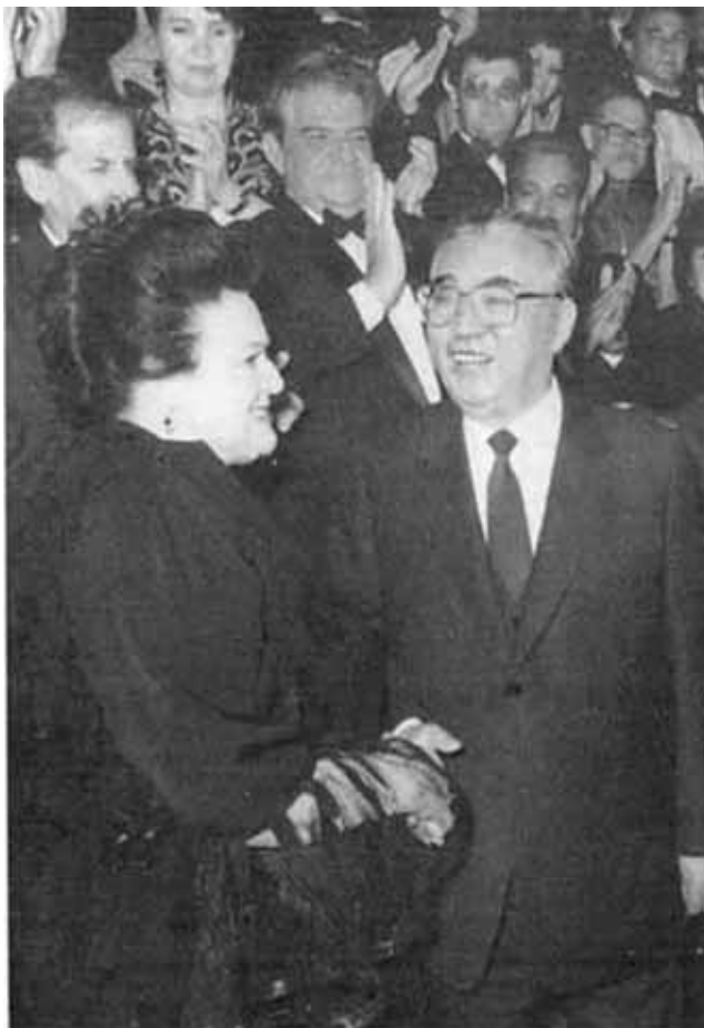
Вождь всегда любил русскую песню. С Людмилой Зыкиной. 1990-е гг.