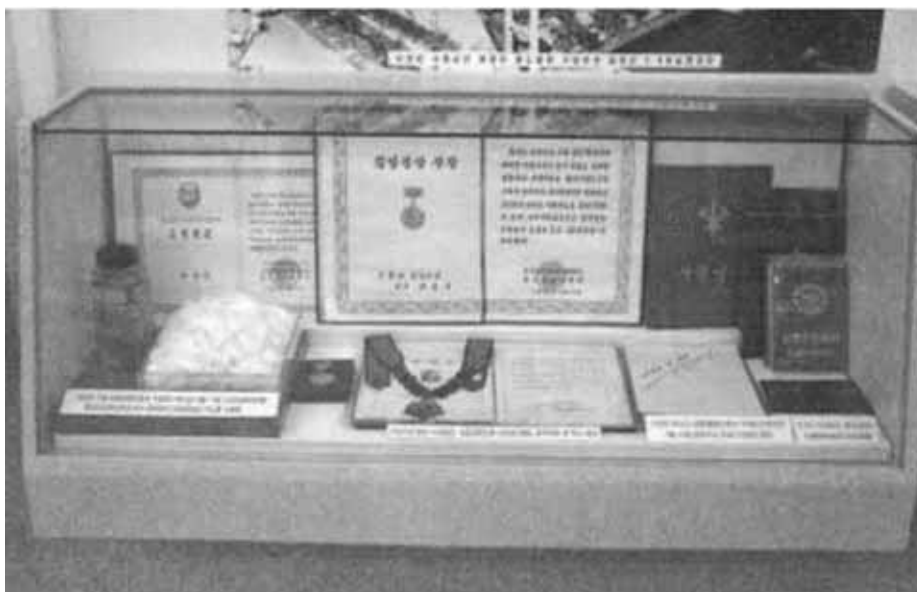
Коробка виналоновой ваты, которую Ким Чем Ир привез в мавзолей Ким Ир Сена.