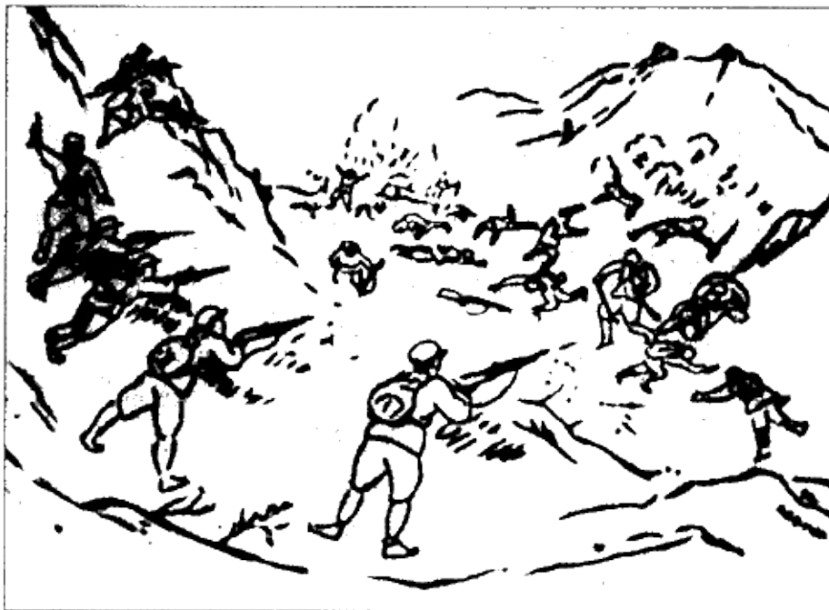
Зарисовки боев, сделанные «с натуры». Рисунки корейцев-партизан. 1930-е гг.