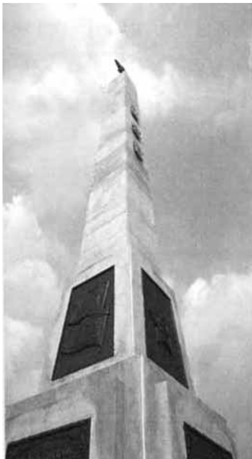
Памятник советским воинам-освободителям Кореи в Пхеньяне.