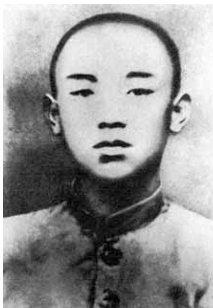
Ким Сон Чжу (в будущем — Ким Ир Сен) во время учебы в училище «Хвасоньисук». 1926 г.