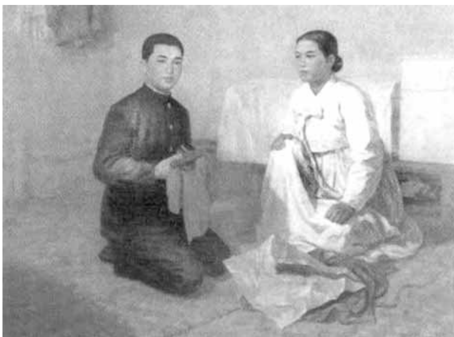
Наследие отца — два пистолета.