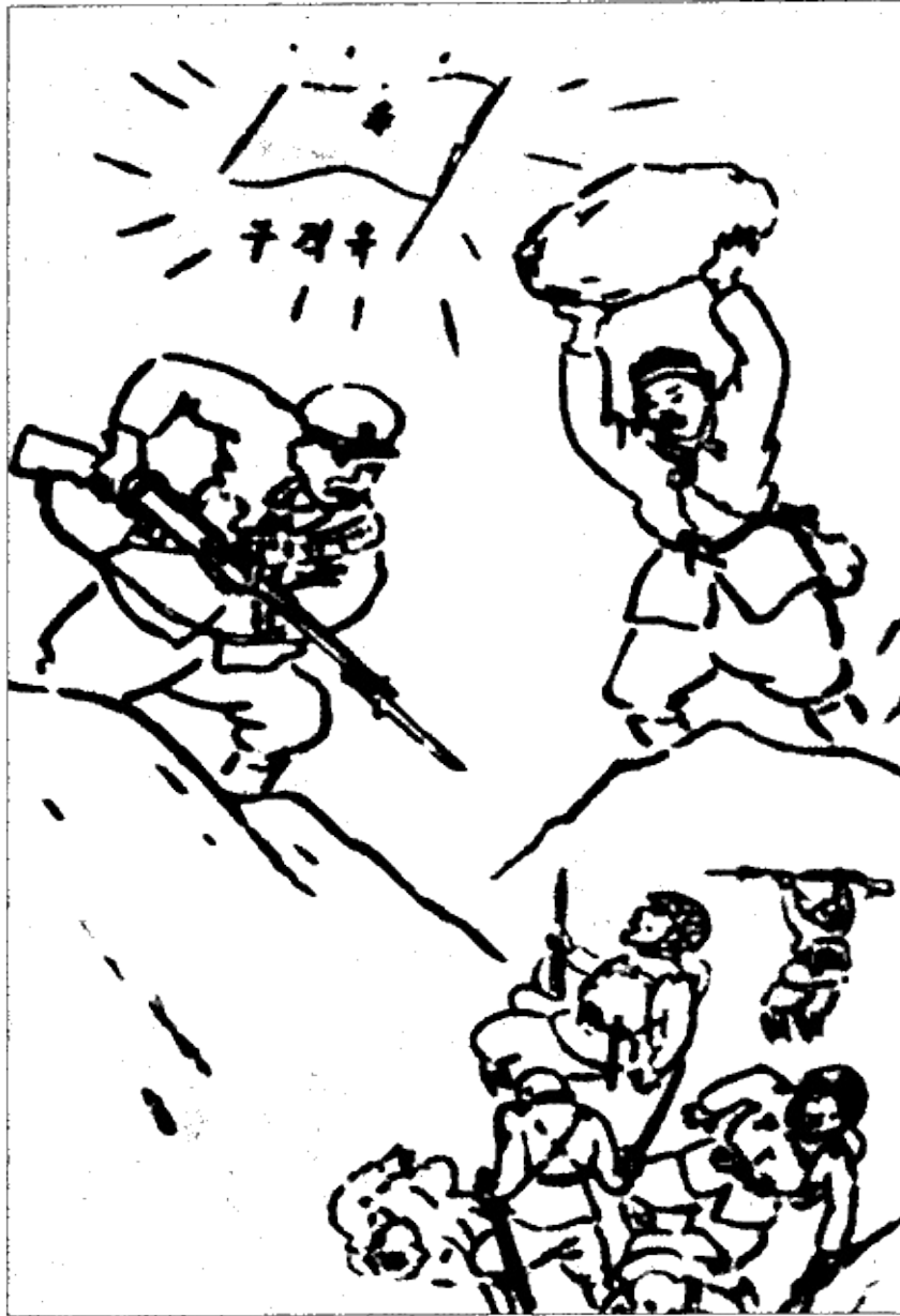
Смерть японским оккупантам! Рисунок корейцев-партизан. 1930-е гг.