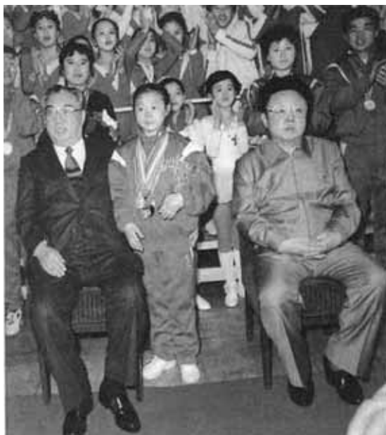
Ким Ир Сен и Ким Чен Ир с юными спортсменами. 1992 г.