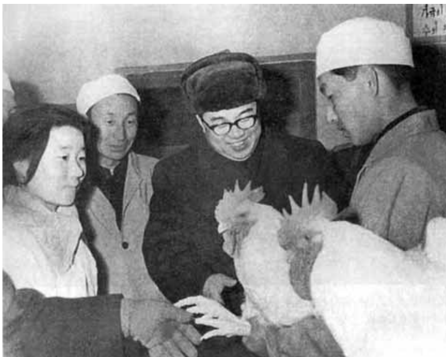
Ким Ир Сен на птицефабрике. 1967 г.