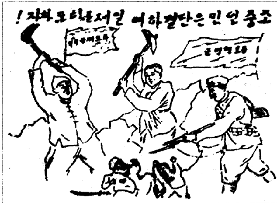
Мировой интернационал против японского империализма. Рисунки корейцев-партизан. 1930-е гг.

Маньчжурские партизанские отряды получили распоряжение от Коминтерна атаковать столицу Маньчжоу-Го Чанчунь, а затем ударить в спину наступающим на внутренний Китай японским войскам. Однако наступление захлебнулось, а японцы начали карательную операцию против партизан. Отряд Кима попал в окружение.