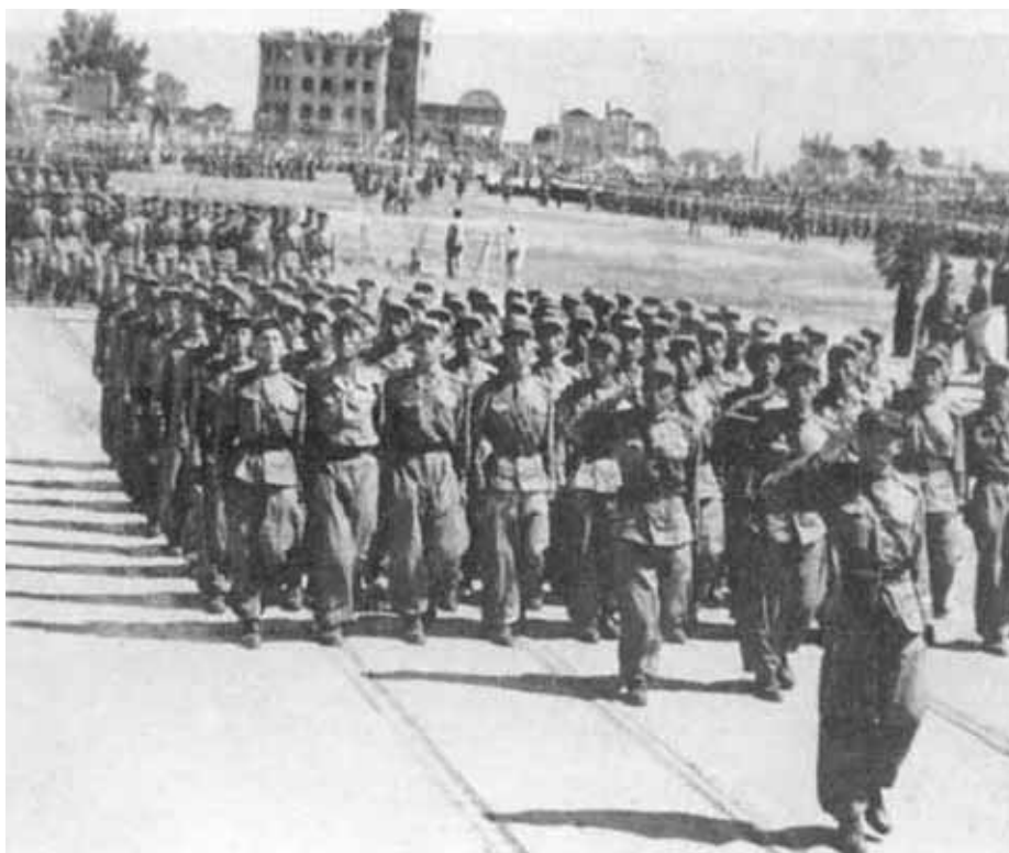
Маршал Ким Ир Сем принимает военный парад после окончания войны. Июль 1953 г.