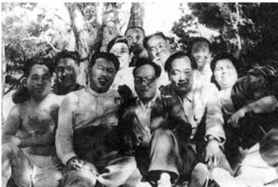
Ким Ир Сен и министр иностранных дел КНДР Пак Хон Ён (в очках) на отдыхе с соратниками. Вскоре Пак Хон Ён будет арестован по обвинению в заговоре. Конец 1940-х гг.