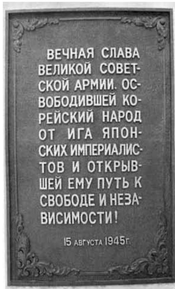
Памятник советским воинам-освободителям Кореи в Пхеньяне.