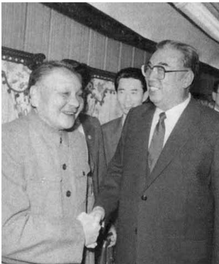
...и Дэн Сяопином (1982 год).