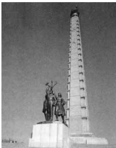
Монумент идей чучхе.