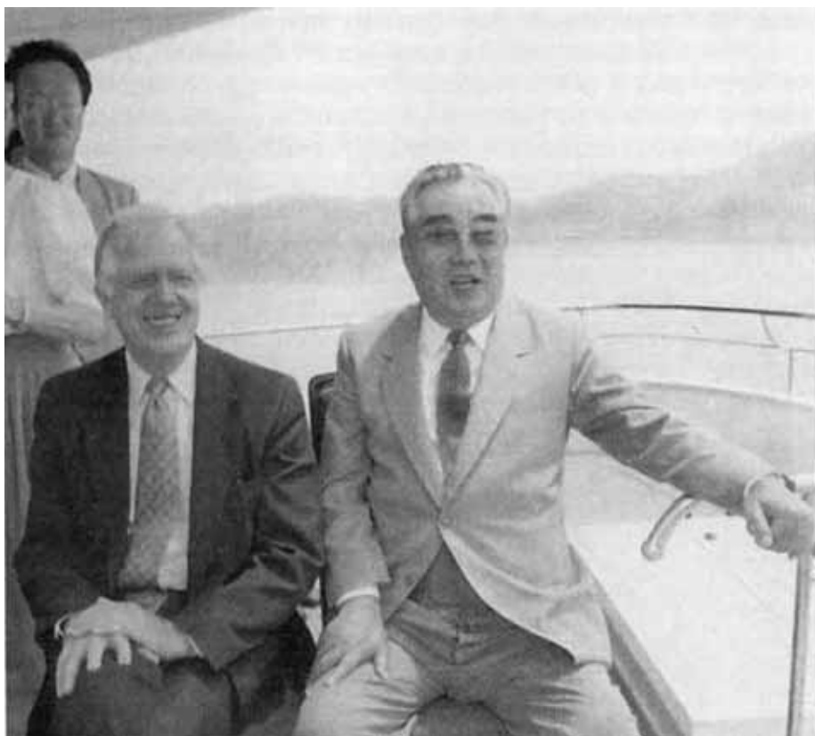
«Давайте плыць тише, там сядят рыбаки...» С Джимми Картером за месяц до смерти. 1994 г.