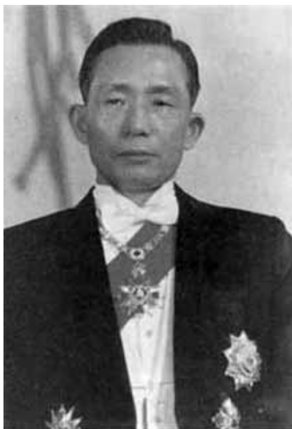
Генерал Пак Чон Хи — президент Республики Корея в 1960-1970-е годы.