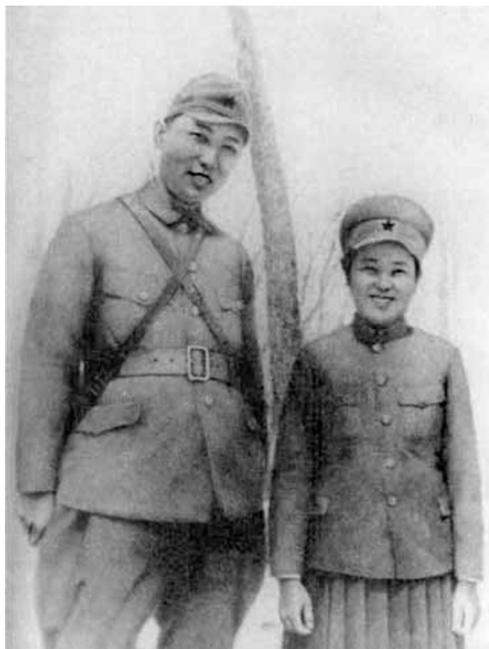
«Встречая весну на чужбине...» Ким Ир Сен и Ким Чен Сук в советском военном лагере. 1 марта 1941 г.