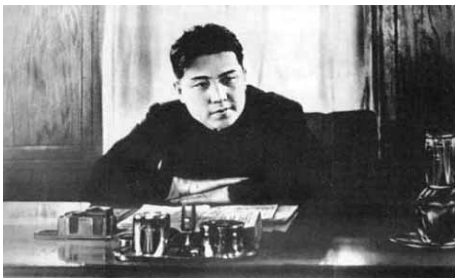
Ким Ир Сен в личном рабочем кабинете. Конец 1940-х гг.