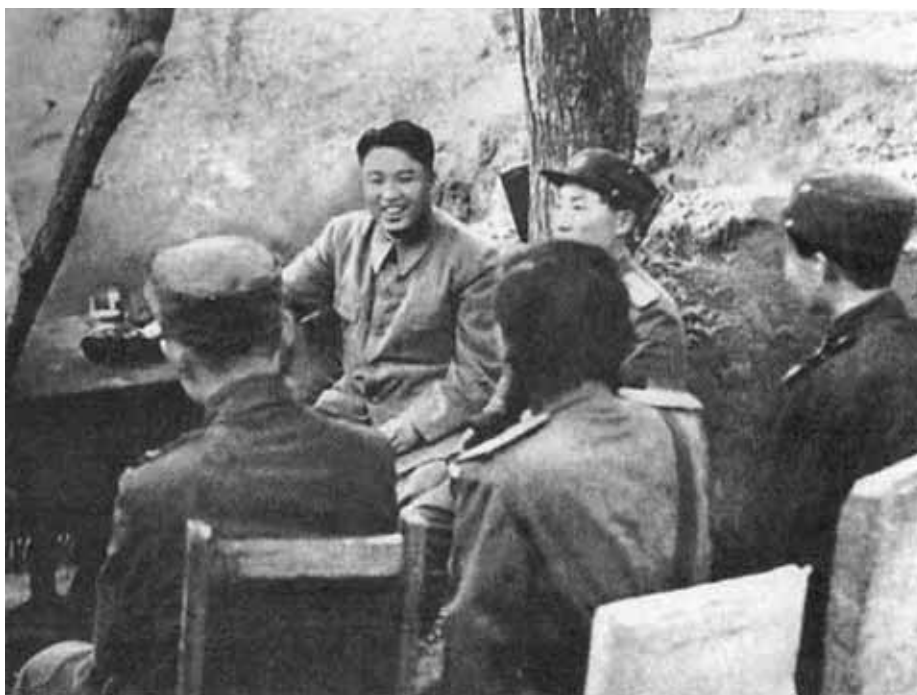
Встреча в ставке с бойцами. 1950 г.

«Дорогие братья и сестры!» Выступление по радио в связи с началом Корейской войны 1950–1953 годов. 26 июня 1950 г.