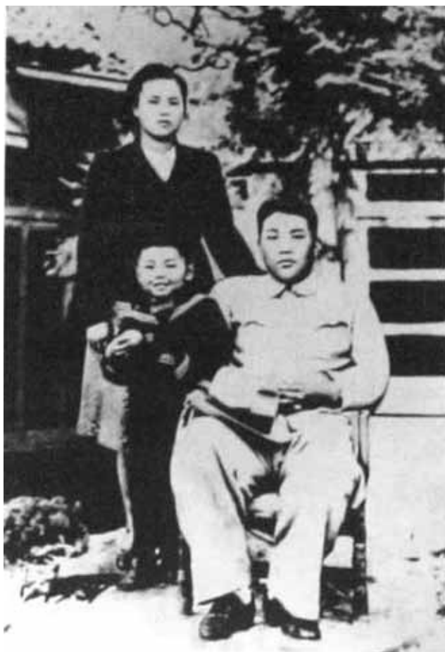
С женой и сыном. Одна из последних совместных фотографий. 1949 г.