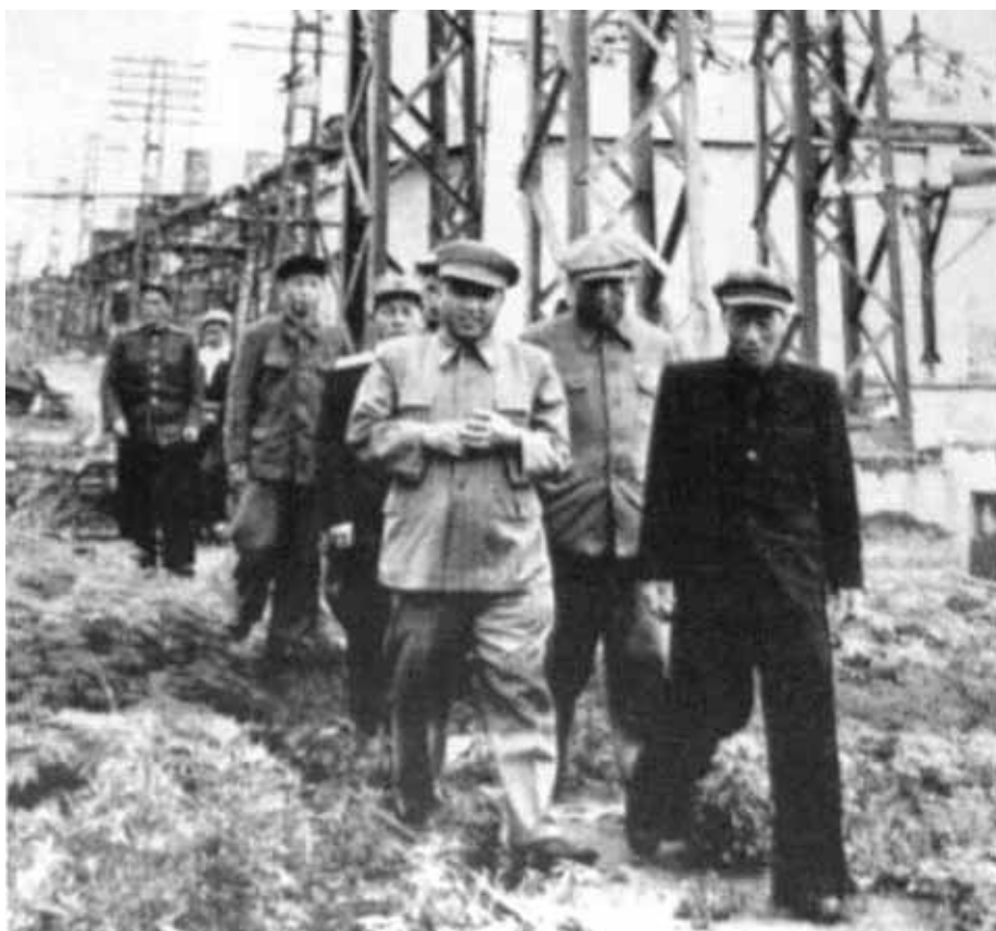
Руководство восстановлением промышленности. Середина 1950-х гг.