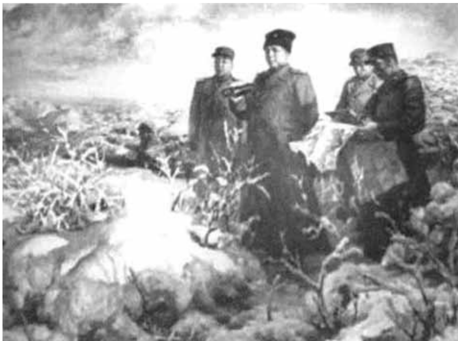
Ким Ир Сен на фронте.