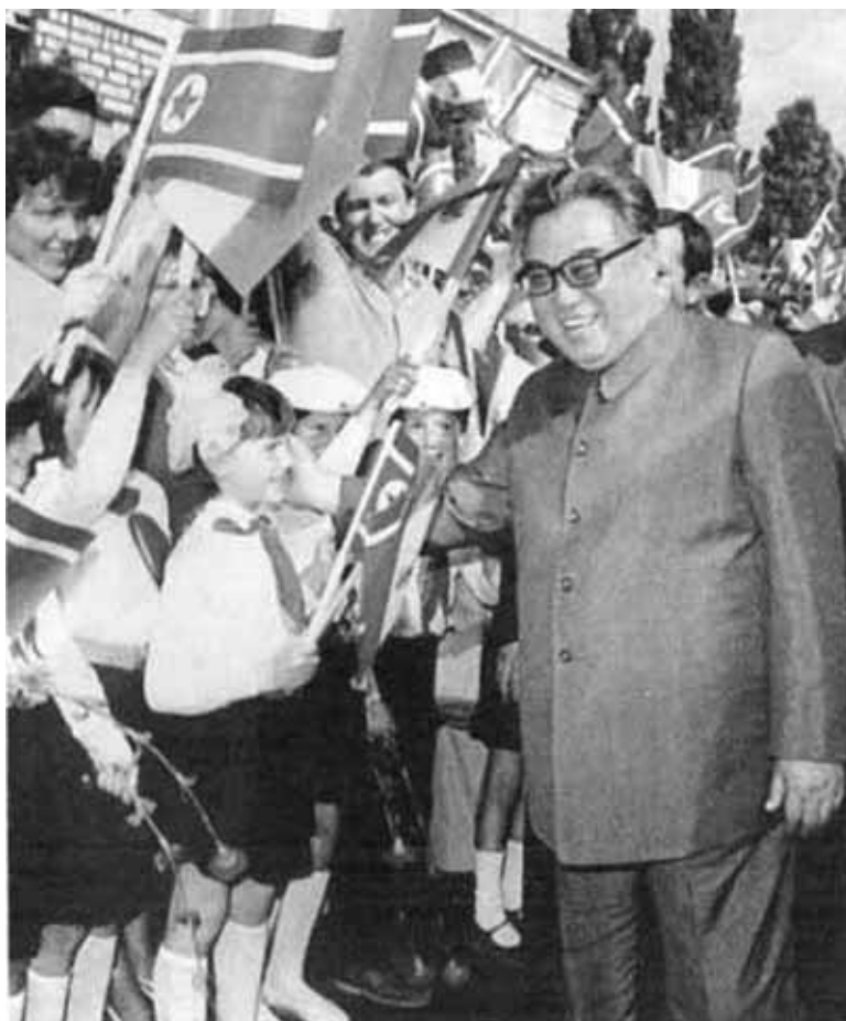
Бухарест встречает президента Ким Ир Сена.