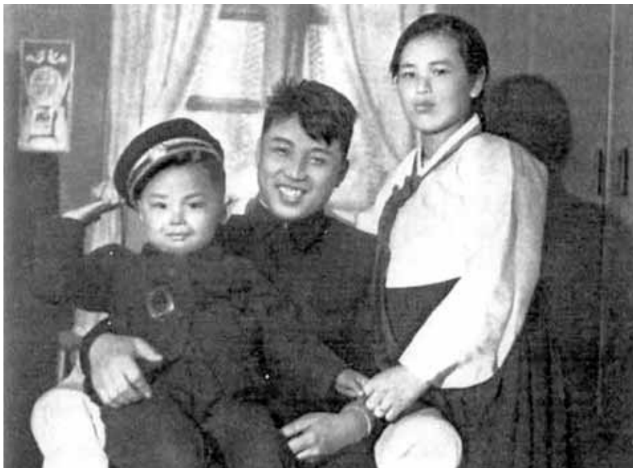
Счастливая семья в Пхеньяне. 1947 г.