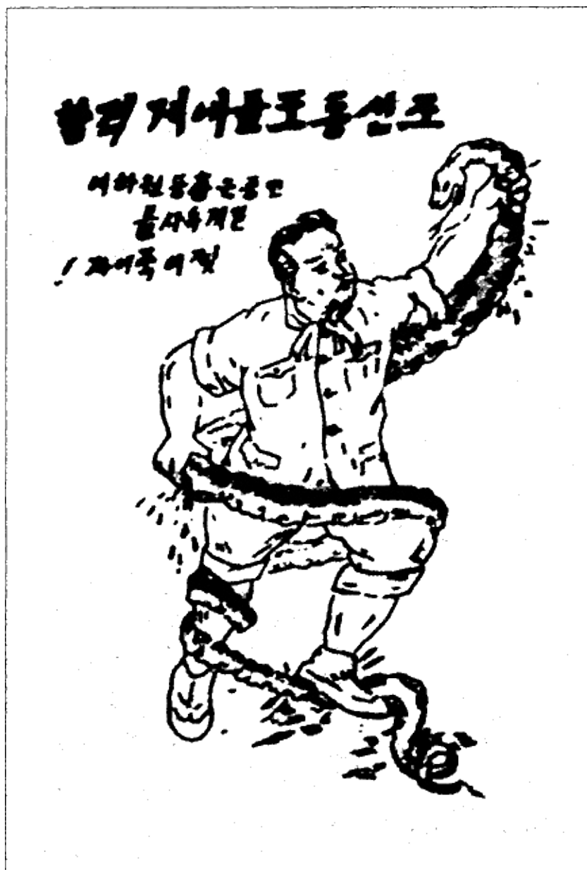
Сорвем змеиные путы японского колониального ига! Рисунок корейцев-партизан. 1930-е гг.