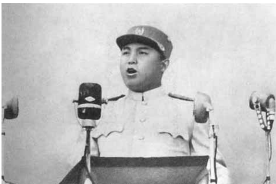
Маршал Ким Ир Сем принимает военный парад после окончания войны. Июль 1953 г.