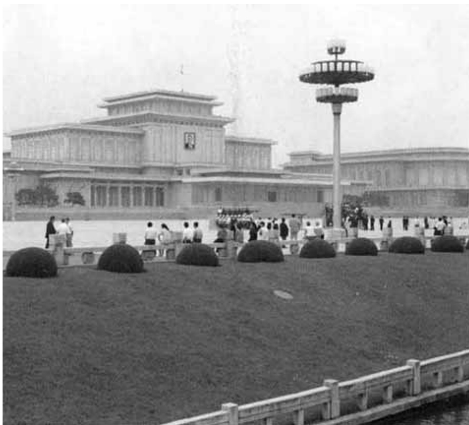
Кымсусанский мемориальный дворец — высшая святыня чучхе.