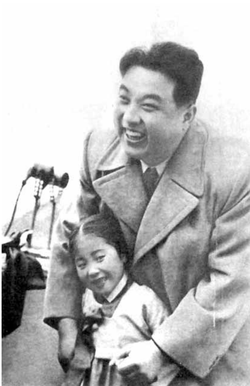
«Дети в стране — короли!» — учил вождь. 1960-е гг.