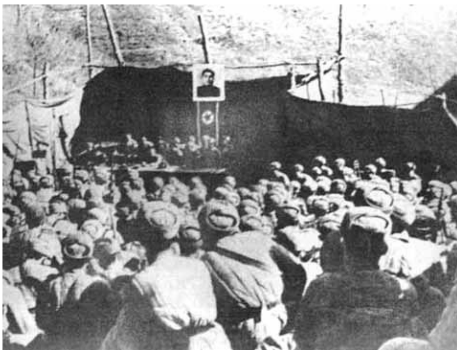
Собрание партактива одной из частей КНА во время войны.