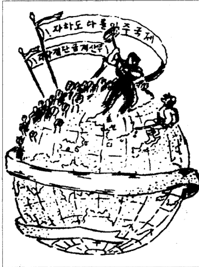
Мировой интернационал против японского империализма. Рисунки корейцев-партизан. 1930-е гг.