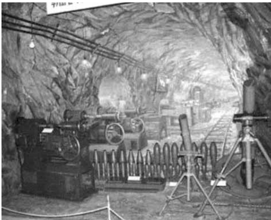
Во время войны в Северной Корее заводы и фабрики переместили под землю.