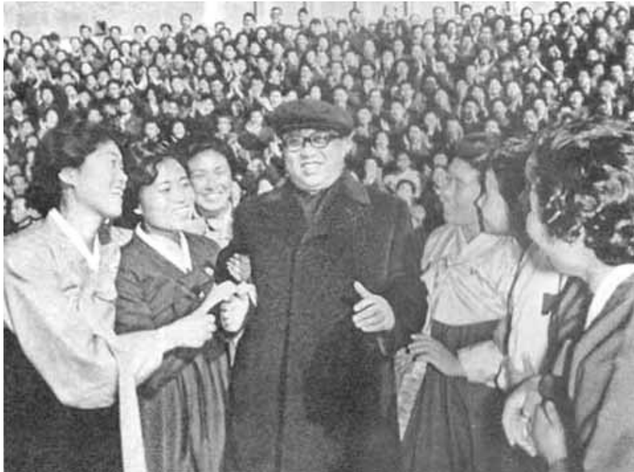
Бурные аплодисменты женщин «отцу нации».

один из главных проводников выдвижения Ким Чен Ира в качестве преемника.