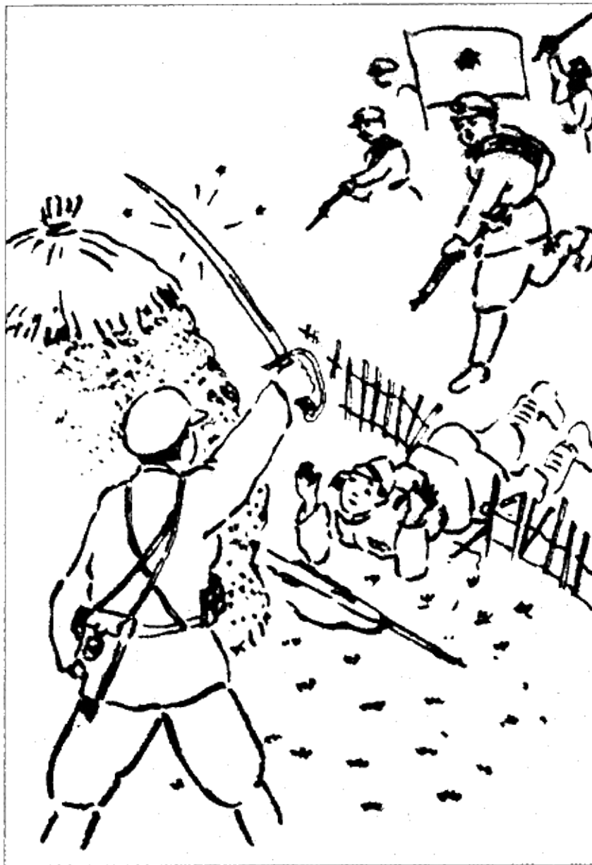
Никакой пощады японским порабощителям! Рисунок корейцев-партизан. 1930-е гг.