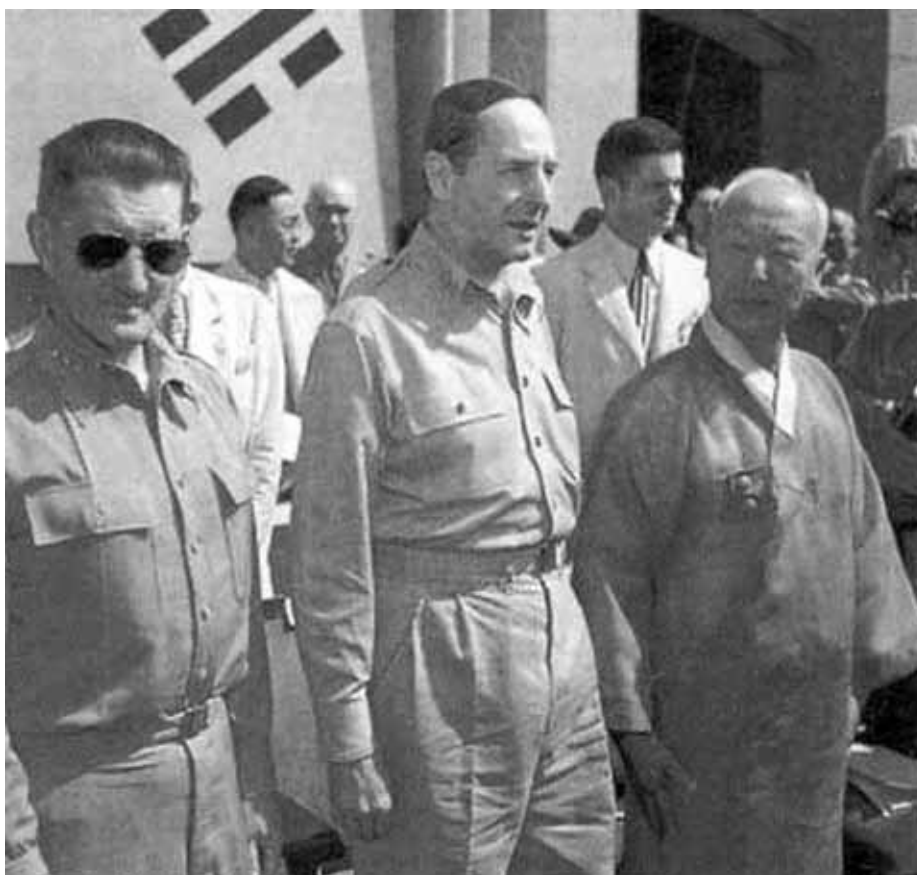
Южная Корея под опекой американцев: генералы Джон Ходж (слева) и Дуглас Макартур (в центре) с президентом Ли Сын Маном (справа) на