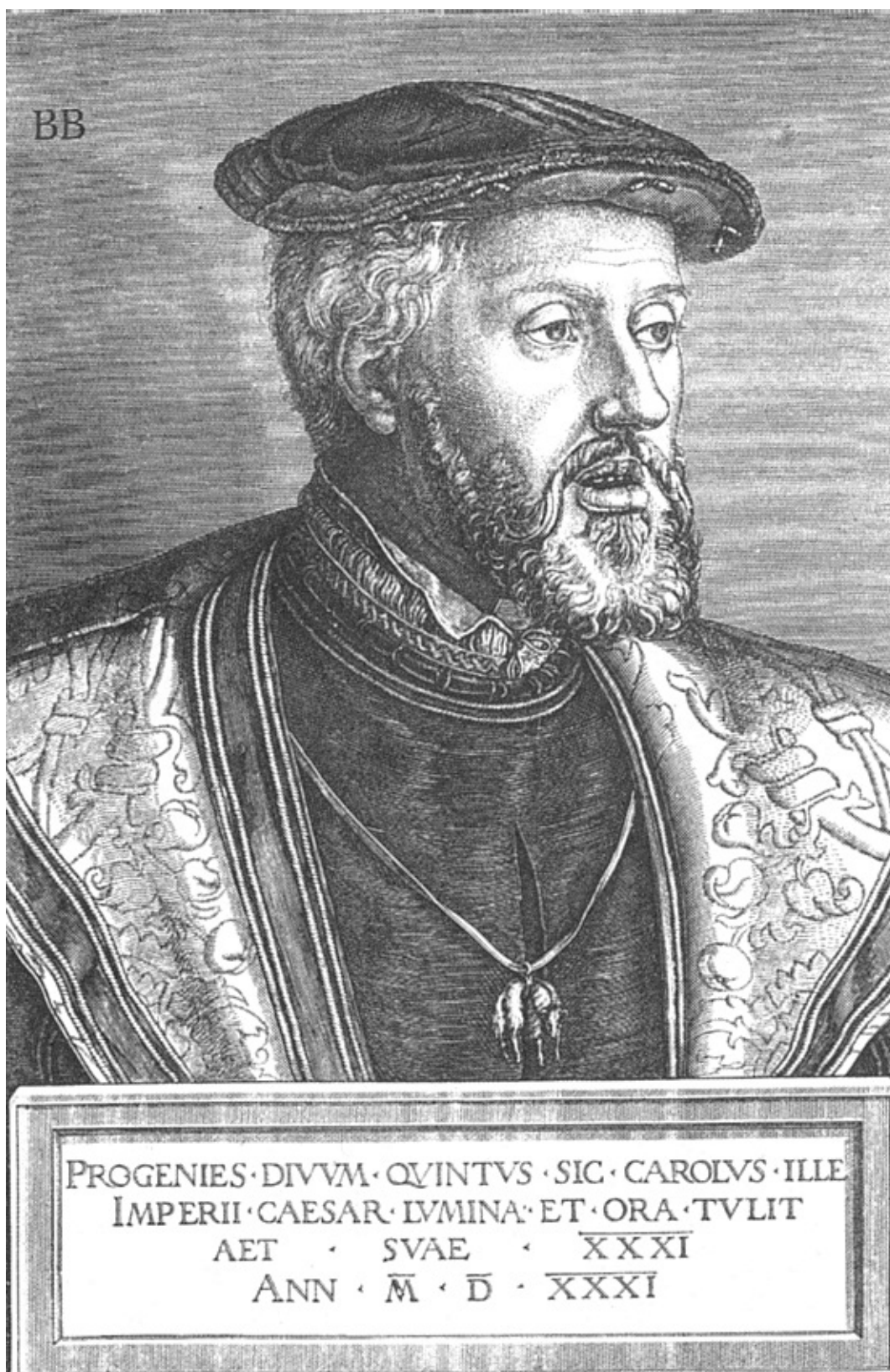
Император Карл V на 32 году жизни. С гравюры на меди Бартеля Бегаме, 1538 г.