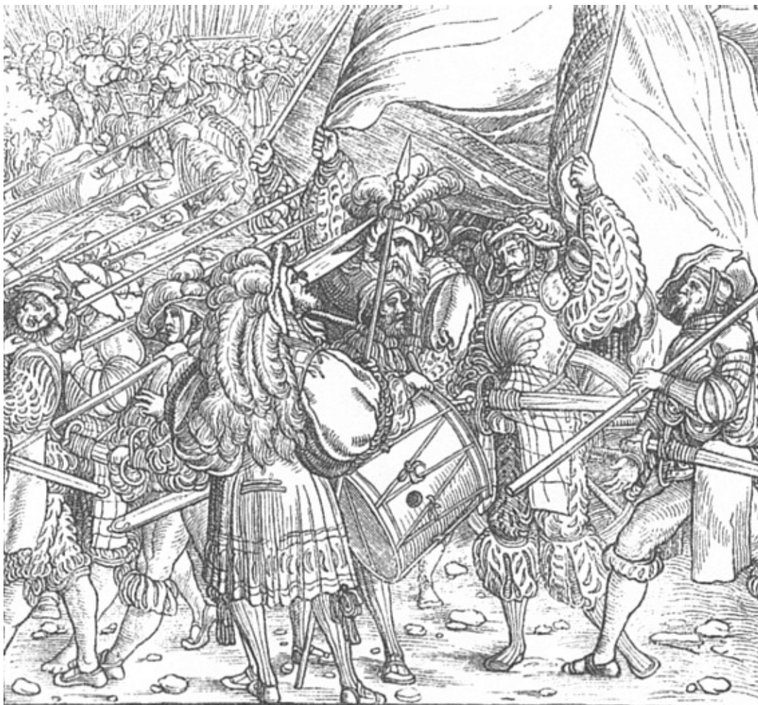
Ландскнехты Карла V во время первой его войны против Франциска I. С гравюры, исполненной ок. 1520 г. Шеффелином