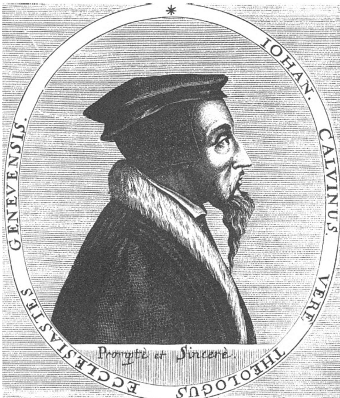
Жан Кальвин. С гравюры неизвестного автора

Но и эта попытка окончилась неудачей. Весть об их возвращении вызвала в Женеве настоящий взрыв народной ярости. Еще за милю от города бернское посольство было встречено уполномоченными совета, которые, на основании приговора об изгнании, строго-настрого запретили проповедникам вступать в город. Таким образом, они, скрепя сердце, принуждены были положиться на одно ходатайство бернских уполномоченных. 26 мая, по настоянию последних, было созвано народное