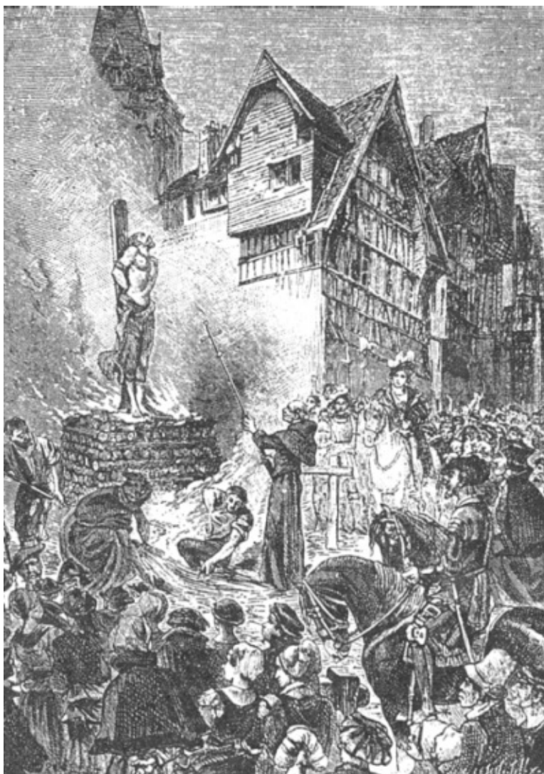
Сожжение Сервета (Рисунок из книги Г. Тиссандье “Мученики науки”)

Казнь Сервета, как мы уже сказали, легла неизгладимым позорным пятном на деятельность реформатора. Сервет был иностранец, он не проповедовал в Женеве, его книга даже не была напечатана в Женеве. Кальвин мог, по крайней мере, предоставить печальное право наказать еретика осудившим его католикам. Но, тем не менее, несправедливо было бы свалить на него одного всю вину этого осуждения. Кальвин выступил в духе своего времени. И швейцарские кантоны, и Фарель, и Бусер – все они требовали казни Сервета. Даже кроткий Меланхтон и тот безусловно оправдывает поведение Кальвина, освободившего церковь от этого “богохульника”. Костер, на котором погиб Сервет, не был делом одного только реформатора: он был сложен фанатизмом и жестокостью всего XVI