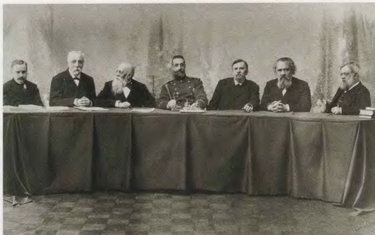
Академическое заседание корифеев русской словесности под председательством Великого князя Константина Константиновича Романова. Среди присутствующих: А. А. Шахматов, И. М. Гревс, А. Ф. Бычков, А. Н. Веселовский, А. Н. Пыпин. 1900 г.