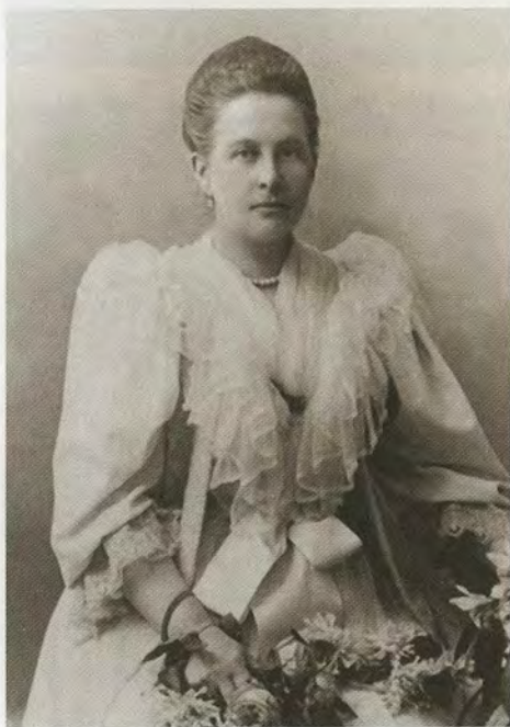
Королева эллинов Ольга Константиновна