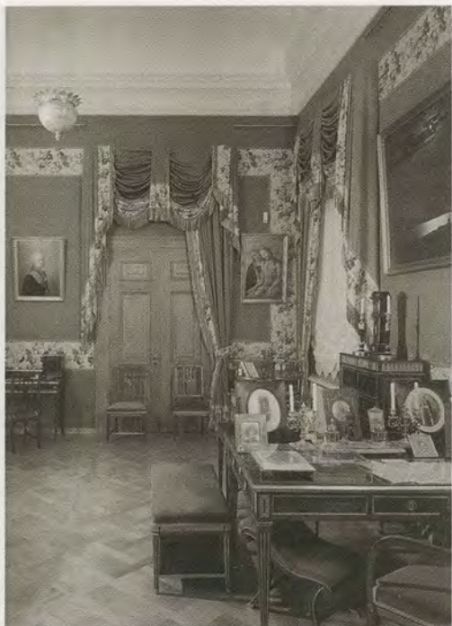
Мраморный зал Константиновского дворца. 2003 г.