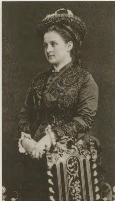
Великая княжна Ольга Константиновна, сестра К. Р. 1870-е гг.

Мраморный дворец Великого князя Константина Константиновича. Построен по проекту А. Ринальди. Санкт-Петербург