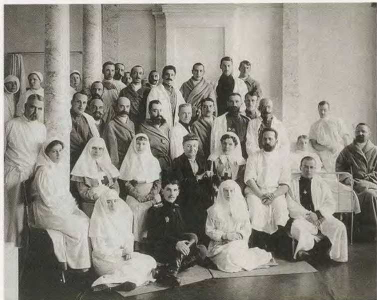
Лазарет в особняке Юсуповых, открытый с началом войны. 1914 г.