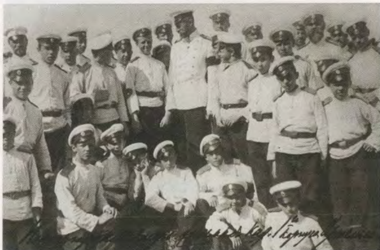
Великий князь Константин Константинович среди кадет

ПОЛУЧЕНО 14 сентября 1900 г. ГЛ. УПР. ВОЕН.-УЧЕБ. ЗАВ. № 5630