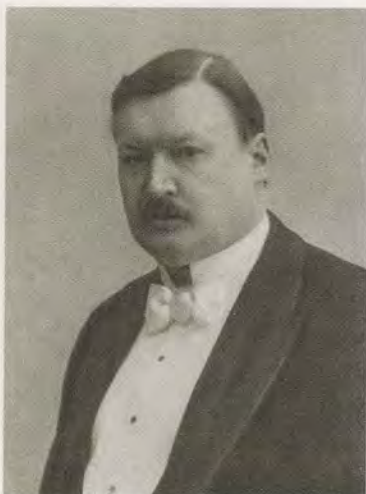
Композитор А. К. Глазунов, автор музыки к драме К. Р. «Царь Иудейский»