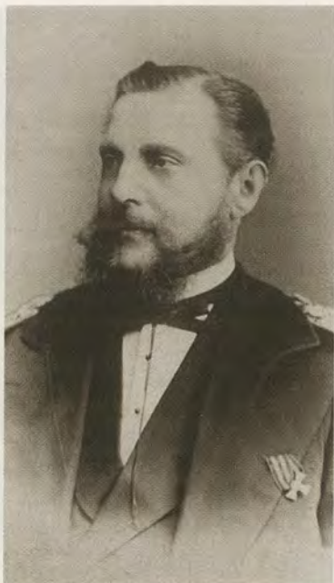
Великий князь Константин Николаевич Романов, отец К. Р.