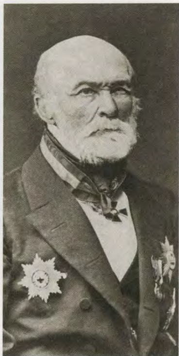
Н. И. Пирогов. Конец 1870-х — начало 1880-х гг.