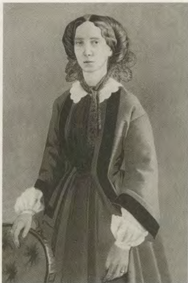
Императрица Мария Александровна. 1860-е гг.