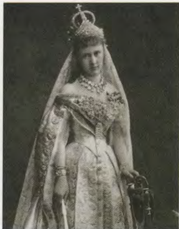
Принцесса Елизавета Саксен Альтенбургская, невеста К. Р. 1884 г.