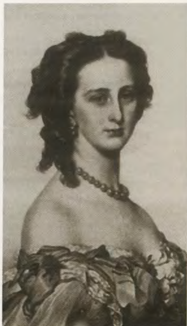
Великая княгиня Александра Иосифовна, мать К. Р.