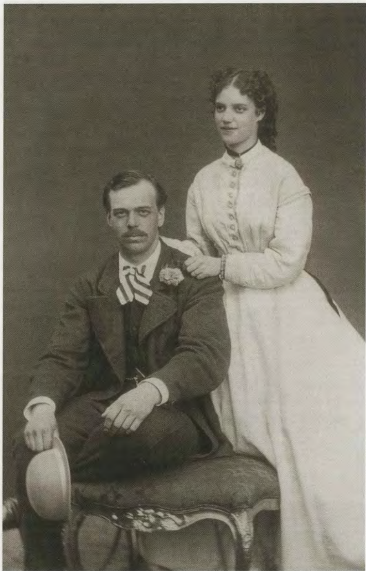
Цесаревич Александр Александрович и датская принцесса Дагмара. Июнь 1866 г.