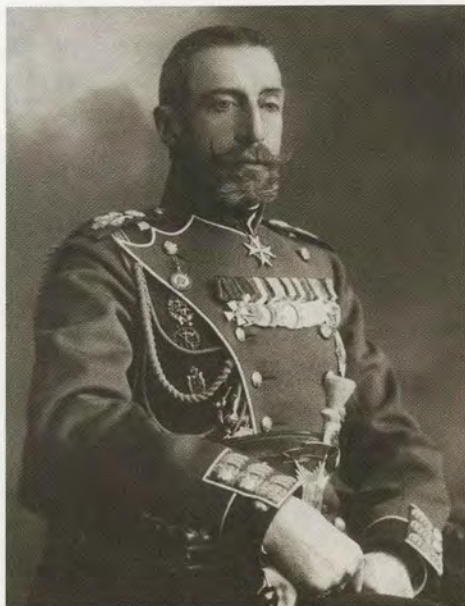
Великий князь Константин Константинович Романов: «Я – человек военный...»