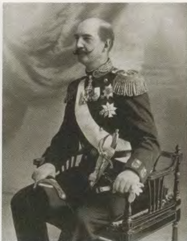
Король Греции Георг I, супруг Ольги Константиновны, сестры К. Р.

Семья Великого князя Константина Константиновича. Верхний ряд: князь Гавриил, Великий князь Дмитрий Константинович, князь Иоанн, принц Христофор Греческий; средний ряд: К. Р., Великая княгиня Елизавета Маврикиевна, князь Константин, Ольга Константиновна — Королева эллинов, княжна Татьяна; нижний ряд: князь Олег, князь Игорь. 1900 г.