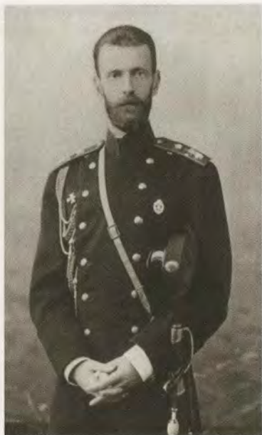
Великий князь Сергей Александрович