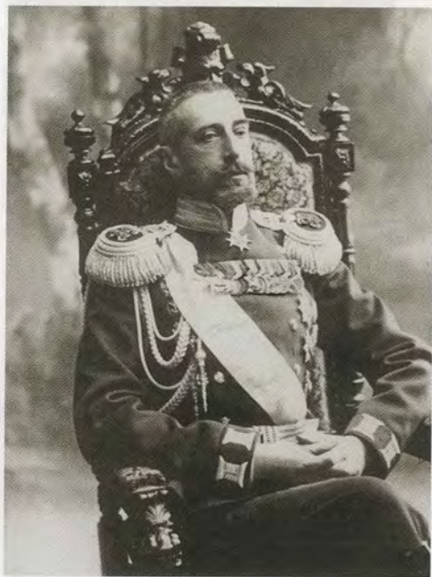
Великий князь Константин Константинович — «отец всех кадет». 1900-е гг.