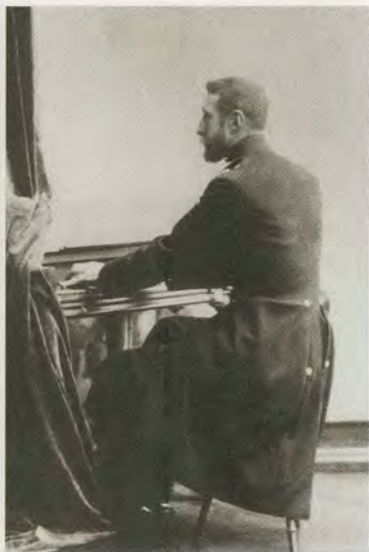
К. Р. музицирует. 1880-е гг.

Император Александр III, датская принцесса Тира, сестра Императрицы, и Императрица Мария Федоровна. 1890-е гг.