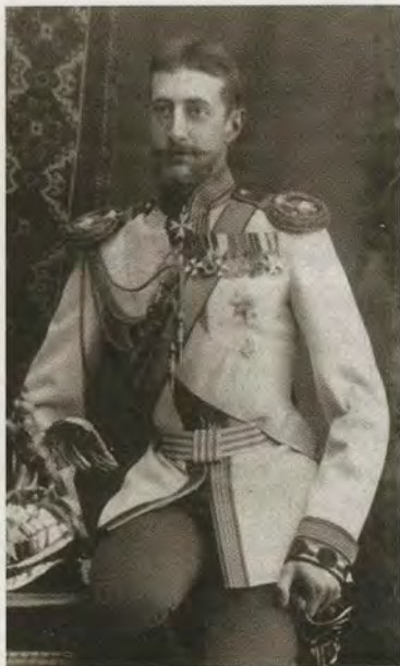
Великий князь Константин Константинович в мундире лейб-гвардии Конного полка

Часовня у Летнего сада. Санкт-Петербург. 1890-е гг.