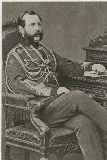
Император Александр II. 1866 г.