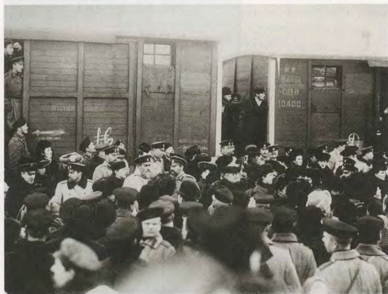
Проводы на фронт. 1914 г.