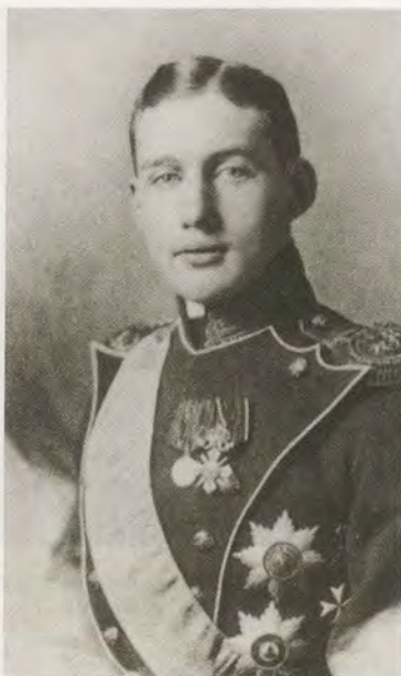
Князь Иоанн, сын К. Р. 1914 г. В 1918 году сброшен в шахту под Алапаевском