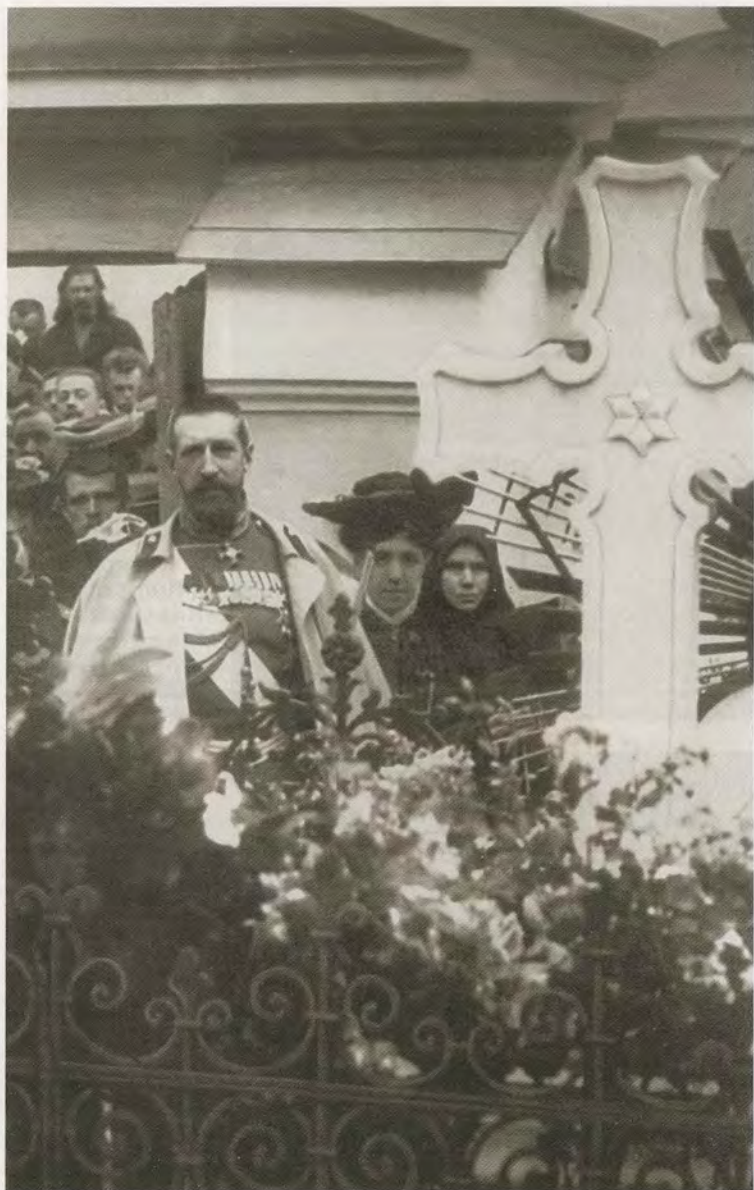
К. Р. открывает панихиду по случаю 50-летия со дня смерти Михаила Глинки у могилы композитора на Тихвинском кладбище Алекса́ндро-Невской лавры. Санкт-Петербург. 1907 г.