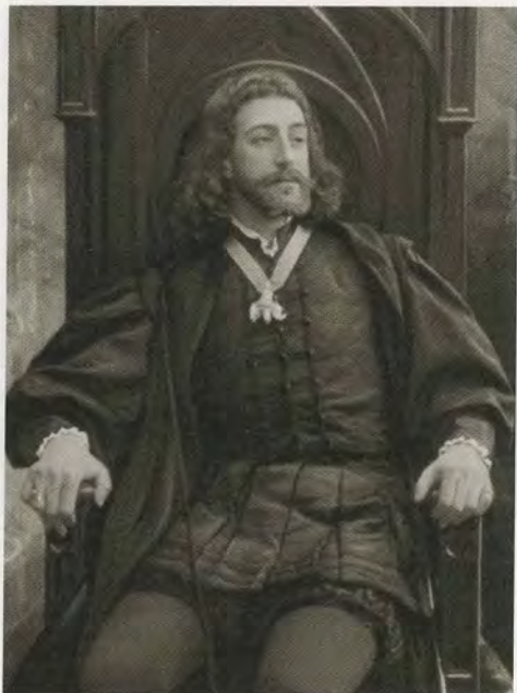
Великий князь Константин Константинович в роли Гамлета в спектакле по его переводу «Трагедия о Гамлете, принце Датском» на сцене Эрмитажного театра. 1899 г.