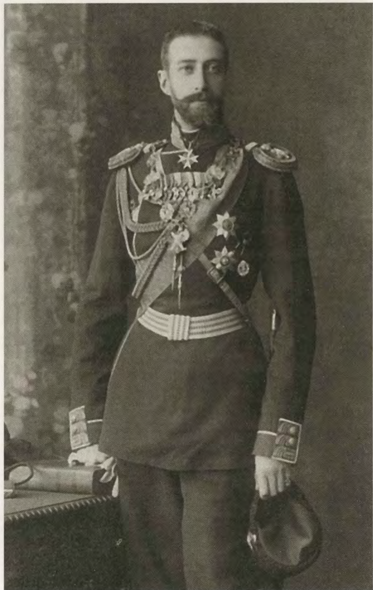
Великий князь Константин Константинович