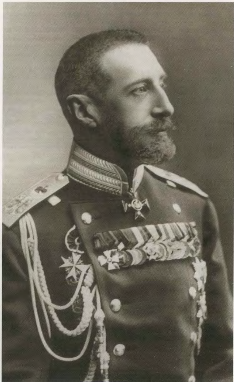
Президент Академии наук