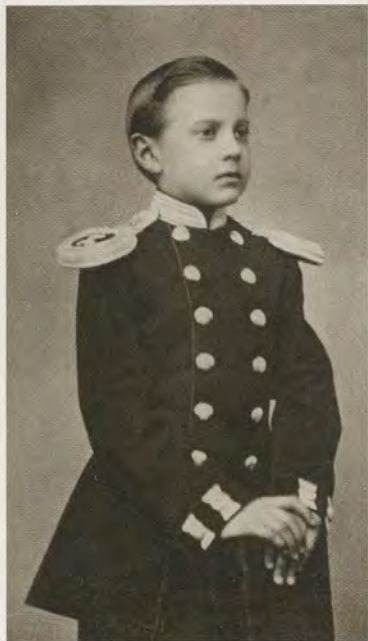
Великий князь Константин Константинович, будущий поэт К. Р., в отрочестве