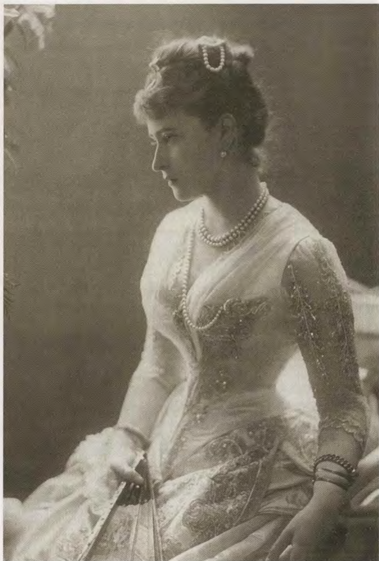
Великая княгиня Елизавета Федоровна. 1898 г. Основательница Марфо-Мариинской обители в Москве.

И всякий, увидав тебя, прославит Бога, Создавшего такую красоту!