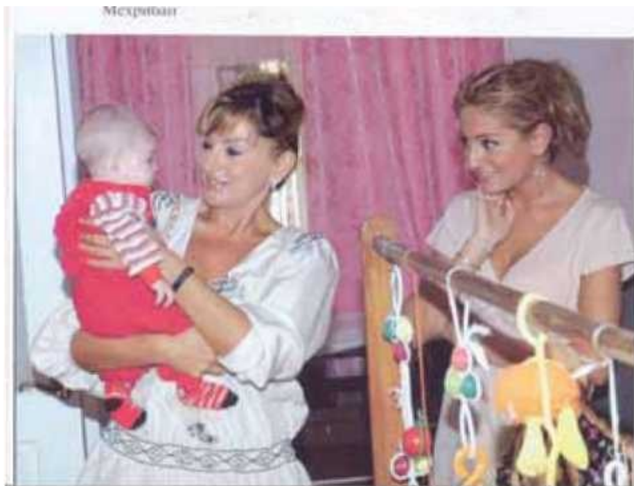
Мехрибан Алиева с дочерью Арзу в одном из детдомов Баку