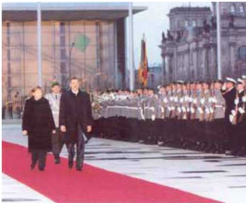
... с канцлером Германии Анжелой Меркель...