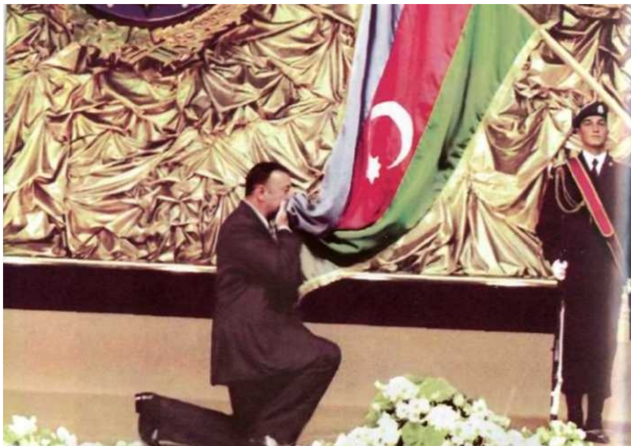
Клятва на верность Родине. Баку, 2003 г