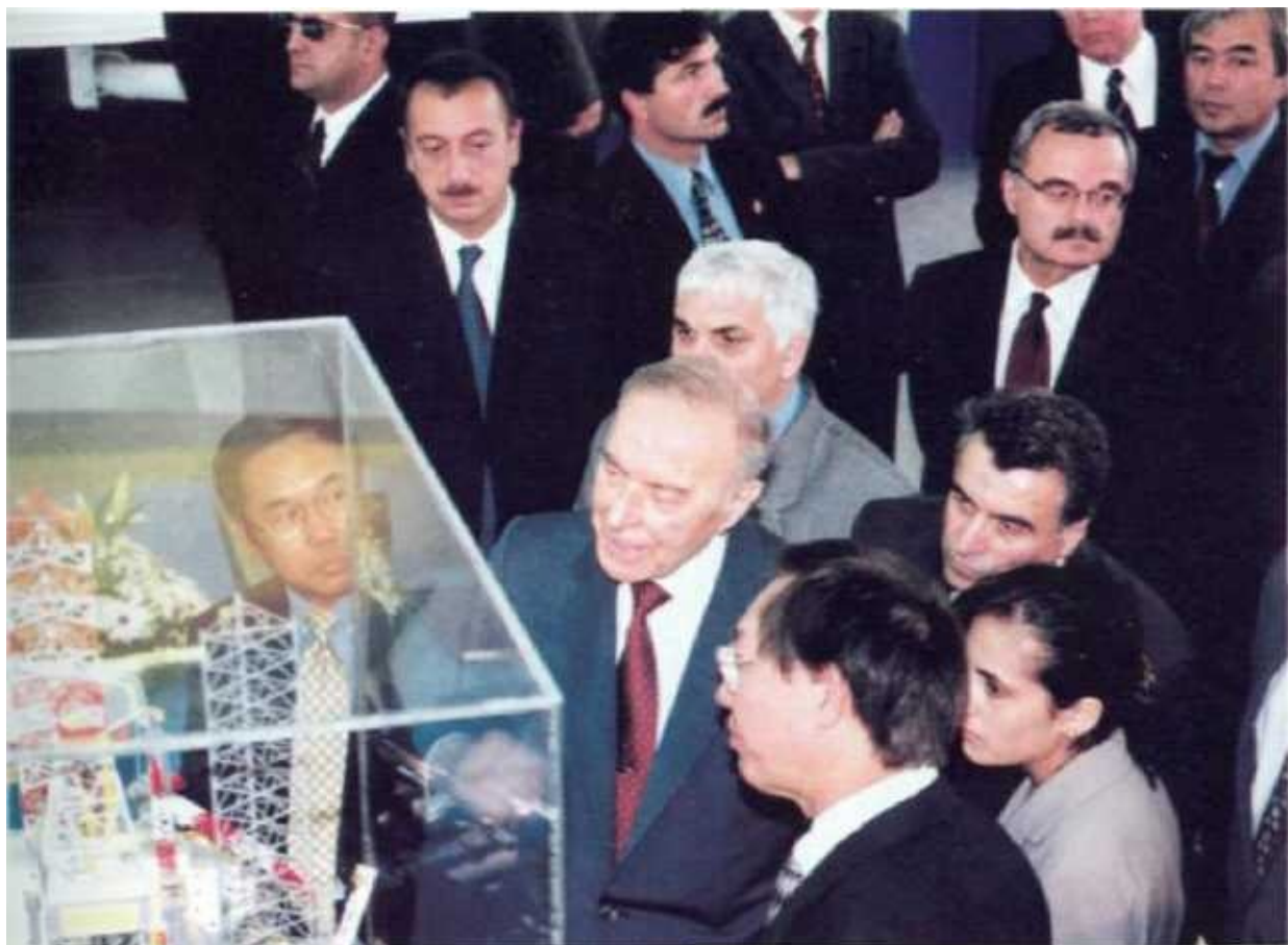
Международная выставка «Нефть и газ». Баку, 2002 г.