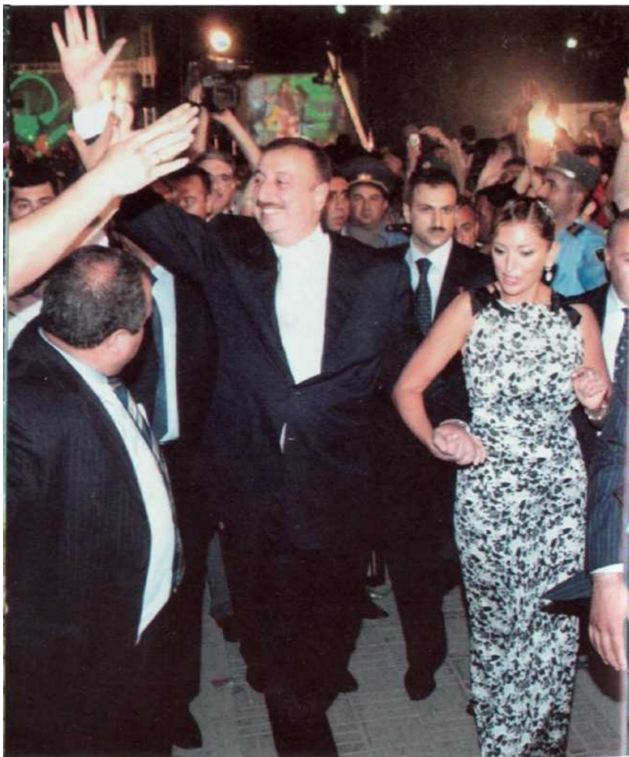
Баку приветствует будущего президента республики. Октябрь, 2003 г.