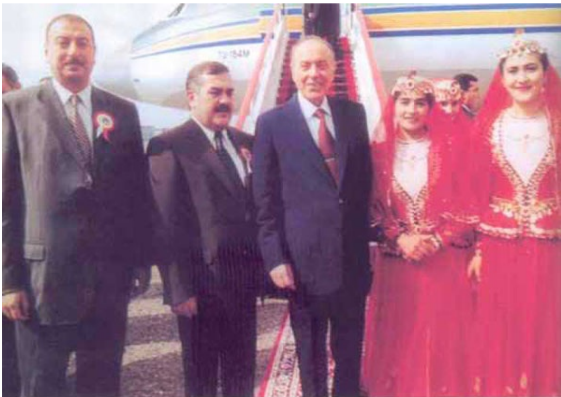
Гейдара и Ильхама Алиевых приветствует председатель Верховного меджлиса Нахичеванской Автономной Республики Васиф Талыбов