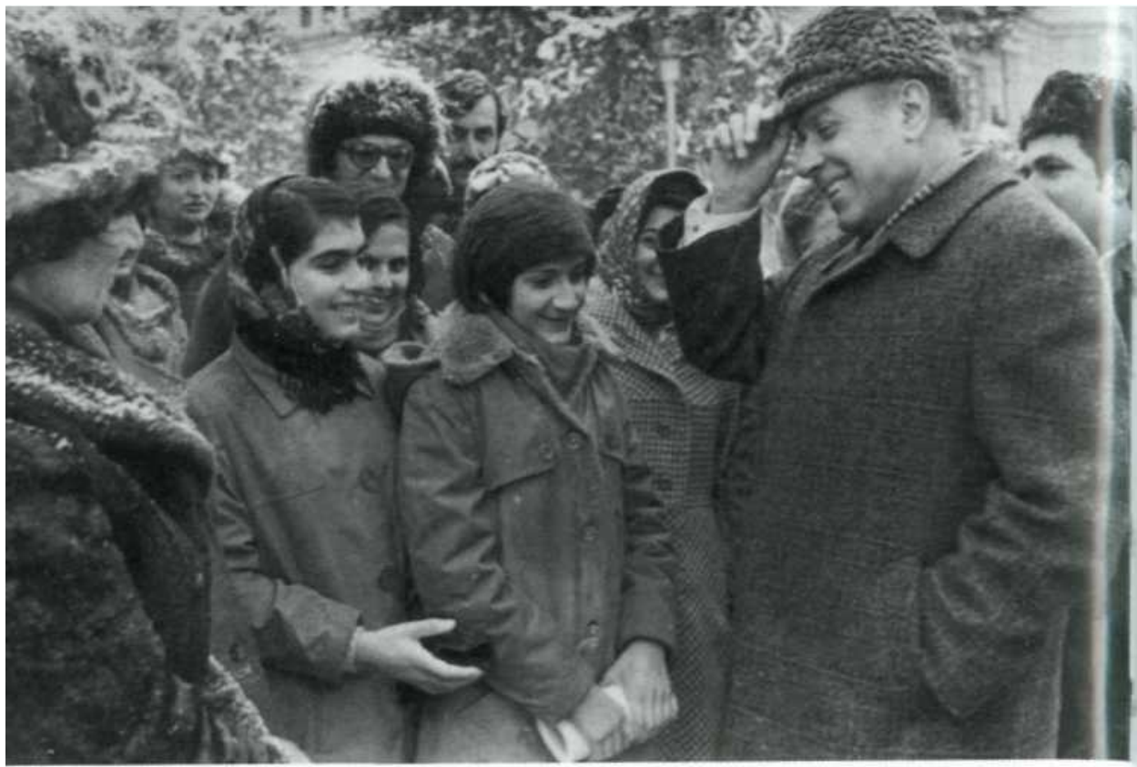
Гейдар Алиев открывает в Шуше мавзолей великого Вагифа.