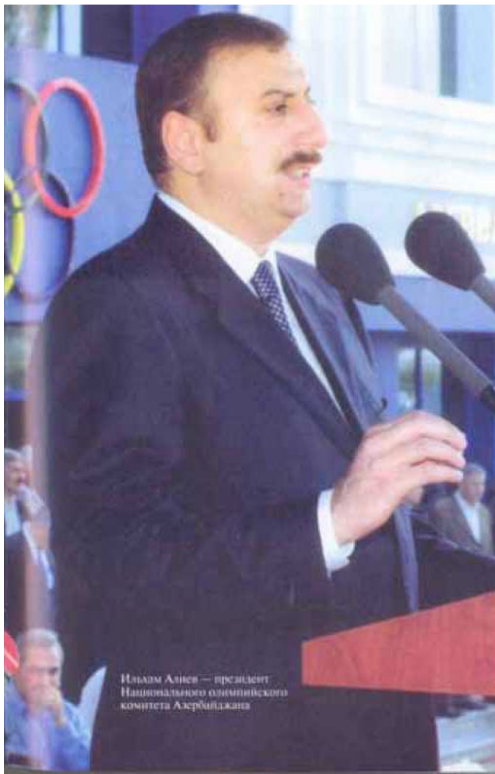
Ильхам Алиев - президент Национального олимпийского комитета Азербайджана