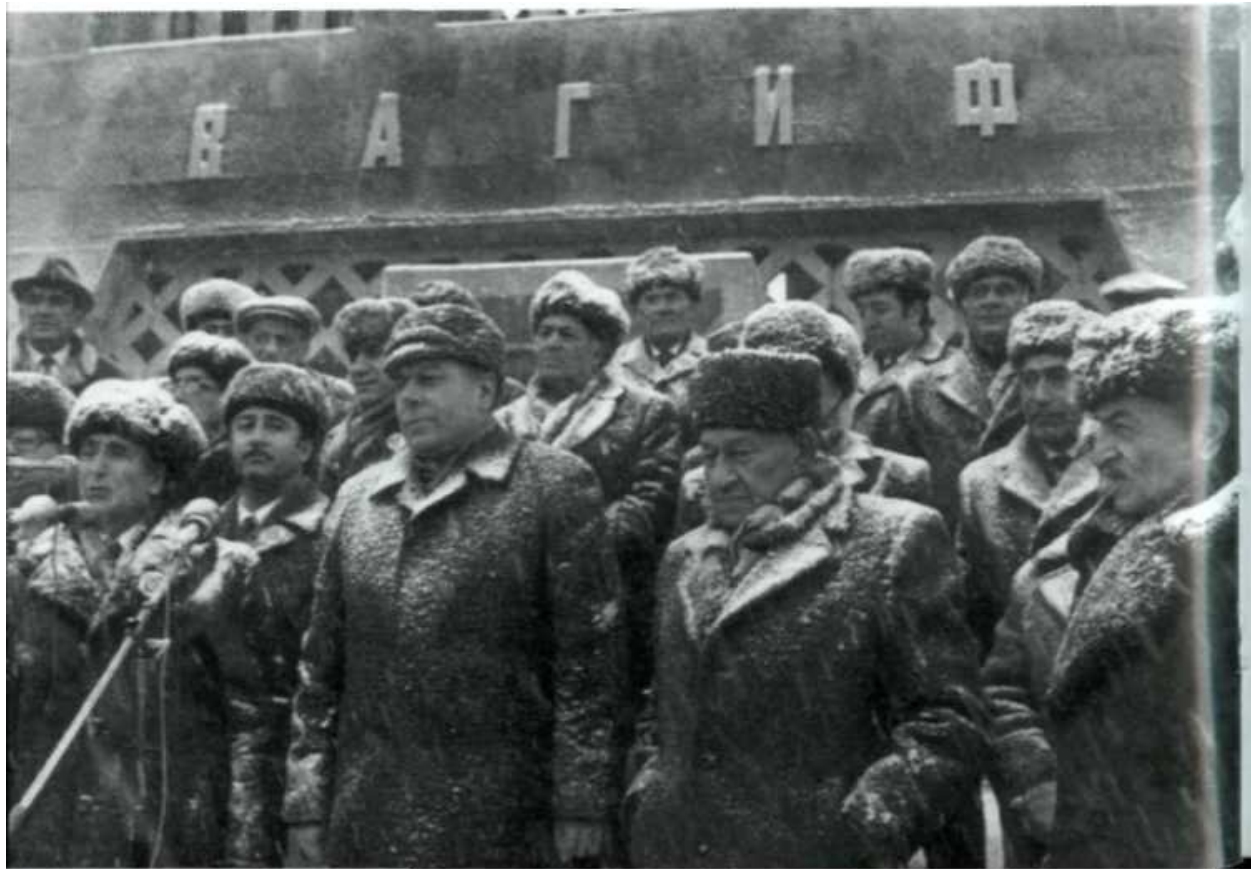
Ильхам тоже был на празднестве, но объективов сторонился.