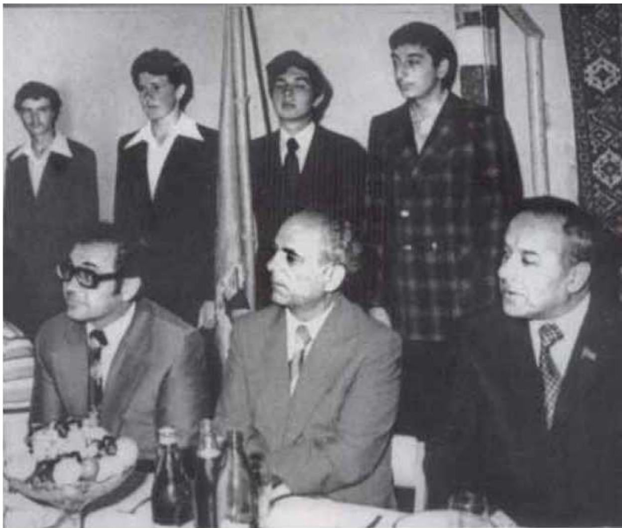
Вместе с родителями одноклассников сына пришел поздравить выпускников первый секретарь ЦК Компартии Азербайджана Гейдар Алиев...