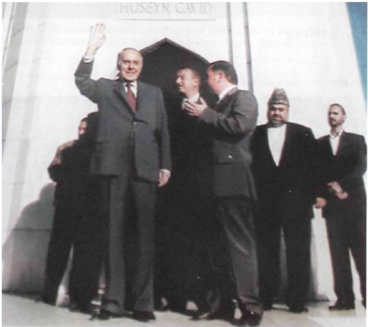
Гейдар Алиев открывает мавзолей выдающегося азербайджанского поэта Гусейна Джавида. Рядом с отцом Ильхам. Нахичевань, 1996 г.