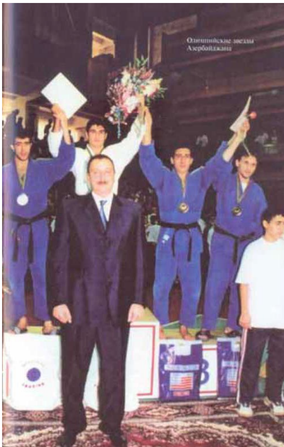
Олимпийские звезды Азербайджана