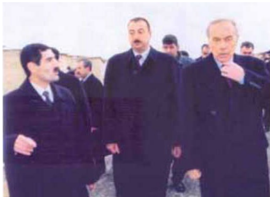
...и в городке у беженцев