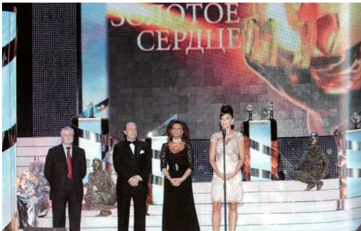
Премия «Золотое сердце» Мехрибан Алиевой вручают Сергей Миронов, Игорь Иванов и Софи Лорен. Москва, май 2007 г.