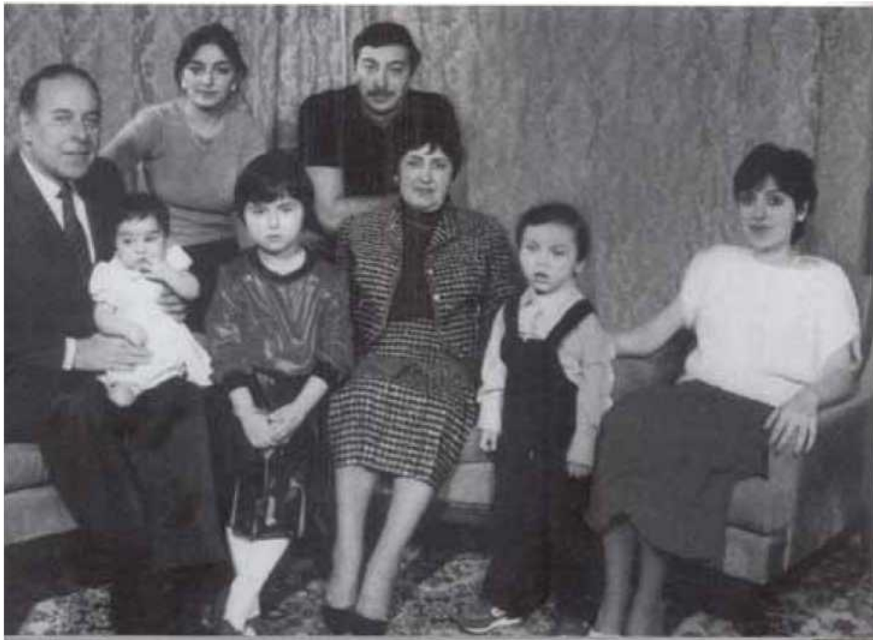
В московском доме Алиевых-старших