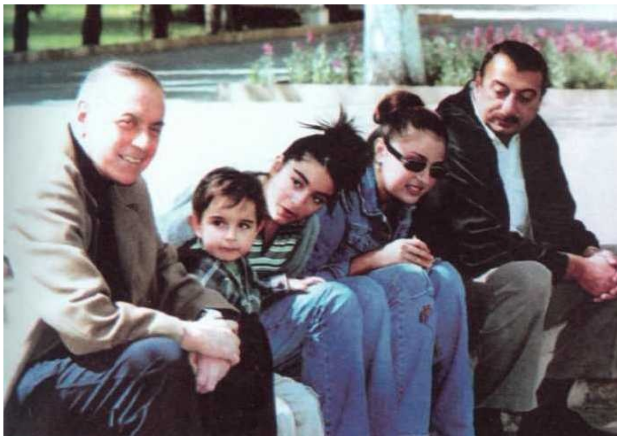
Гейдар Алиев с сыном и внуками

В памяти сына - каждая встреча, каждый разговор с отцом.