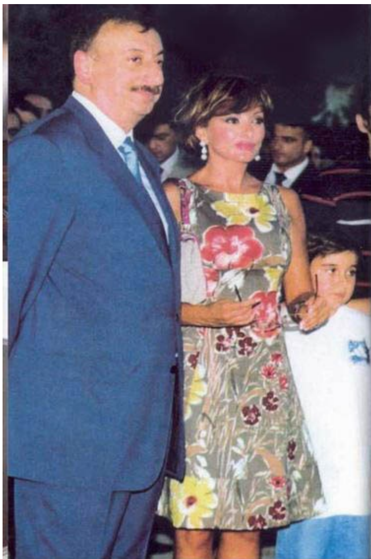
Счастливы вместе. Ильхам Алиев, Мехрибан и их сын Гейдар.