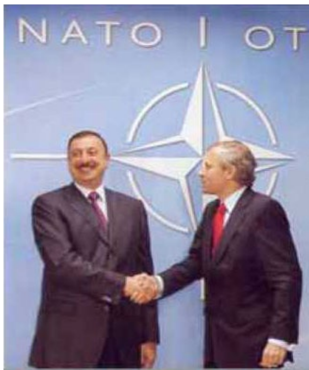
...Генсеком НАТО Йеапом Хоопом Схеффером