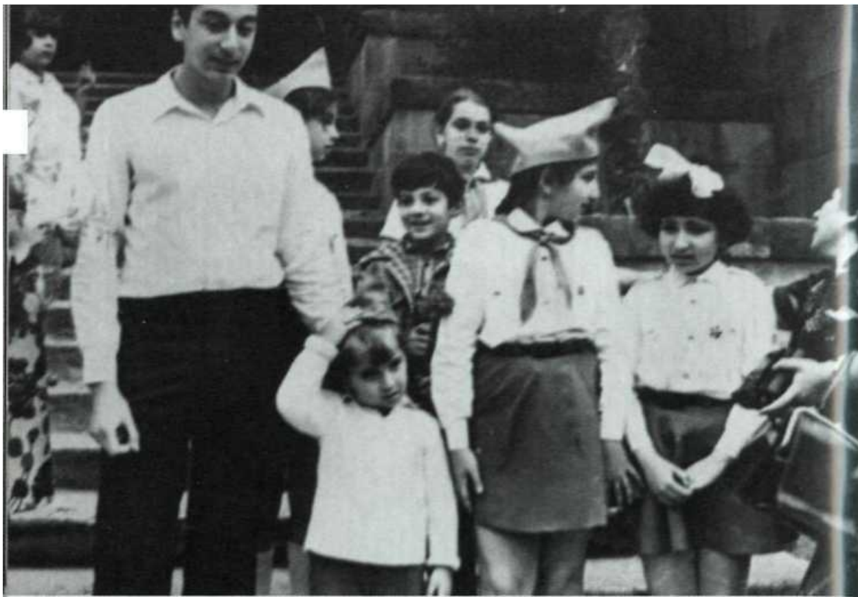
В бакинской школе №6 последний звонок.