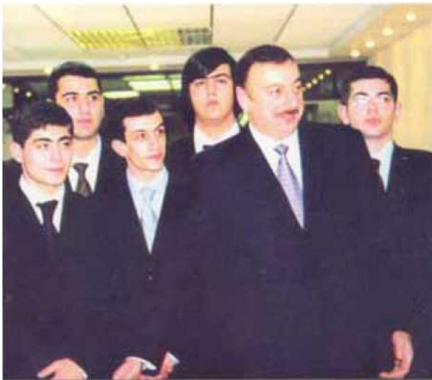
Встреча с молодежью