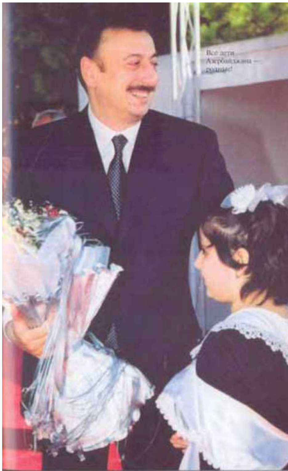
Все дети Азербайджана - родные!