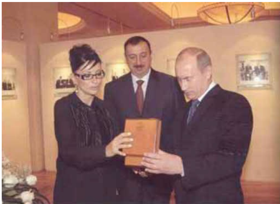
Ильхам Алиев и Мехрибан-ханум тепло встречали Президента России