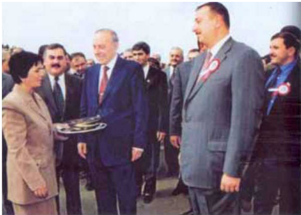
Президент Гейдар Алиев и Ильхам Алиев на новостройках...