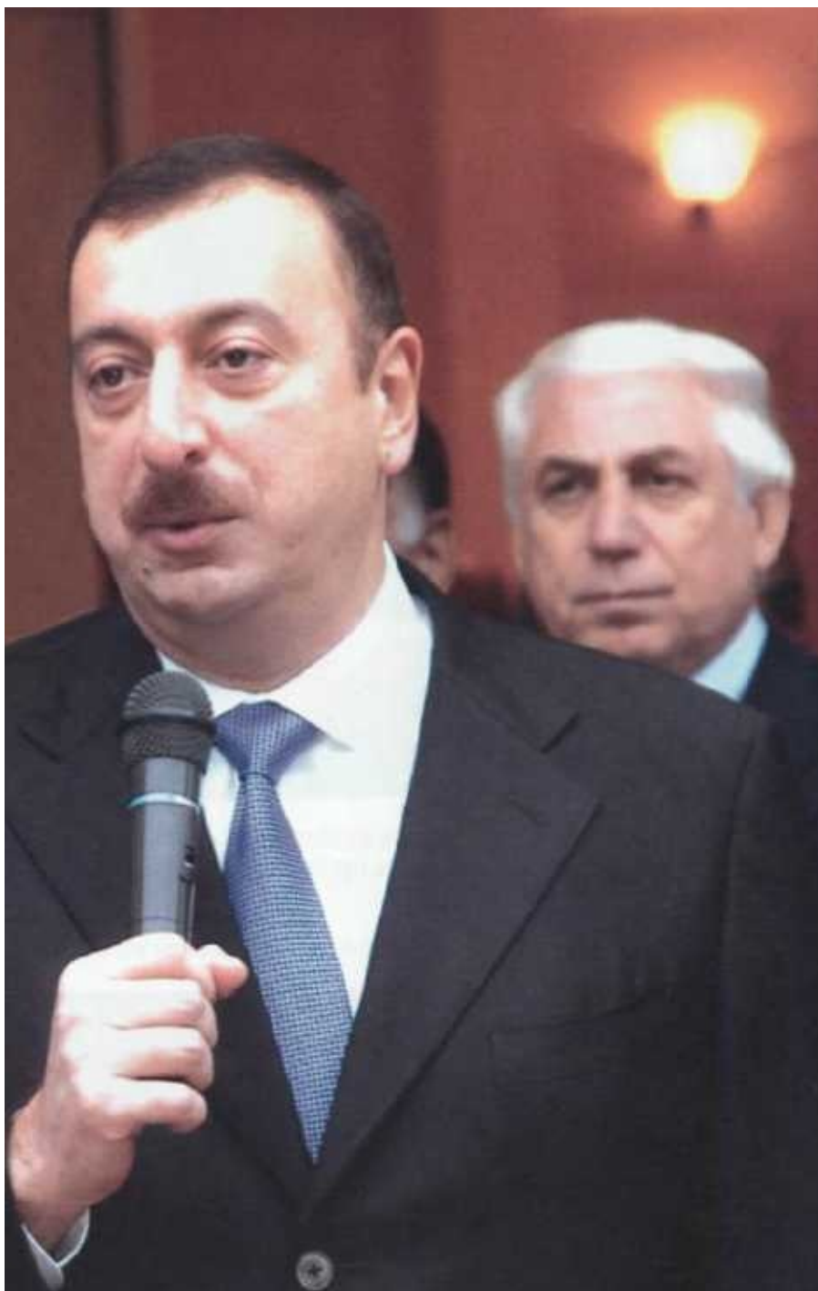
Президент Ильхам Алиев на открытии Государственного драматического театра в Ленкорани. 2005 г.