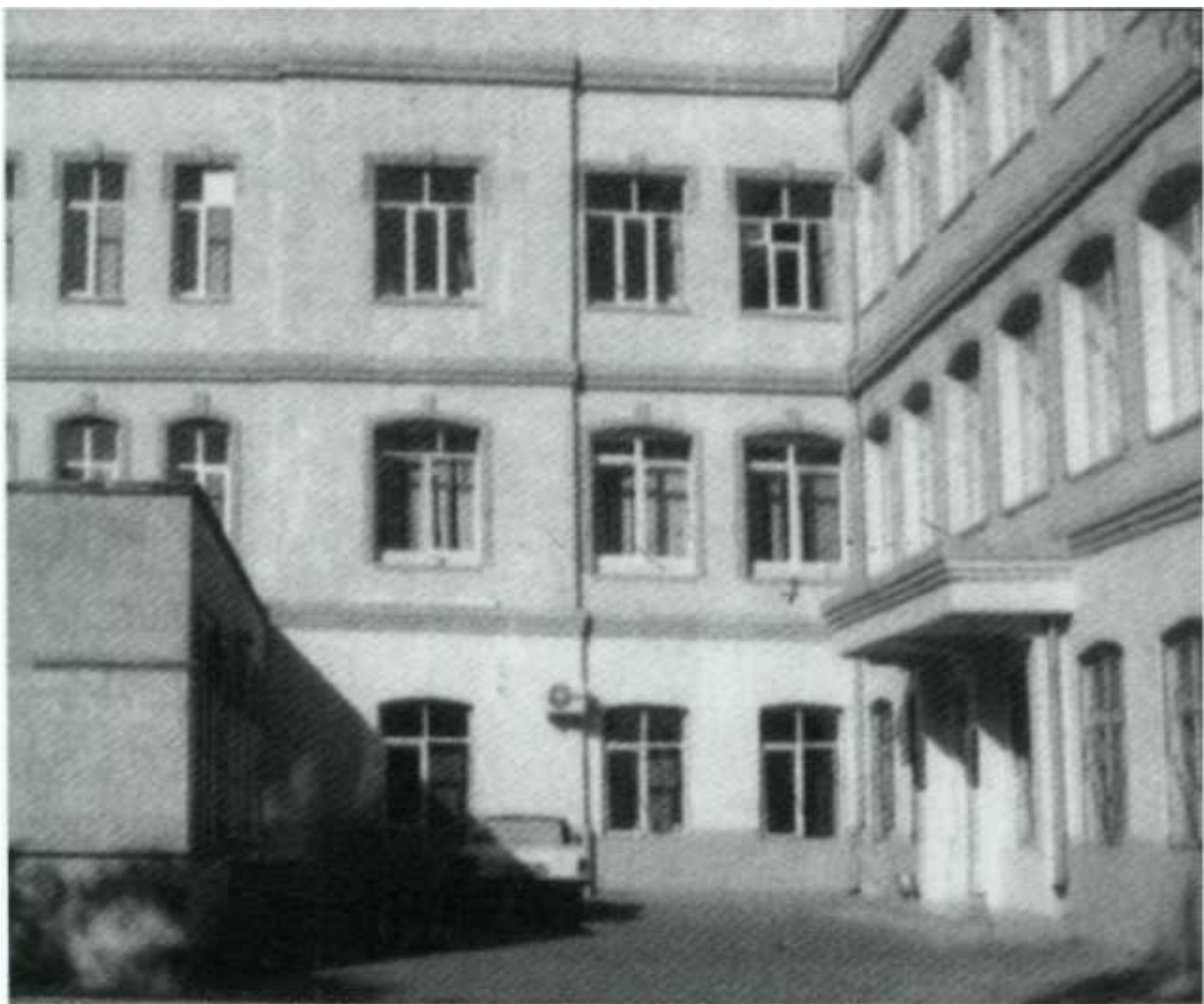
В этой школе учился Ильхам Алиев. Учился отлично.