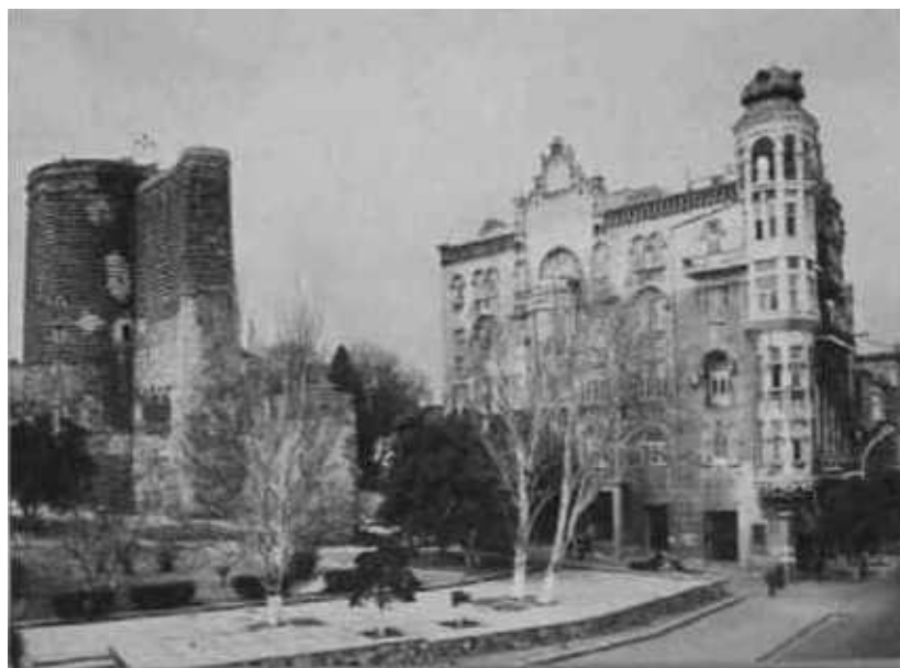
Их породнил Баку