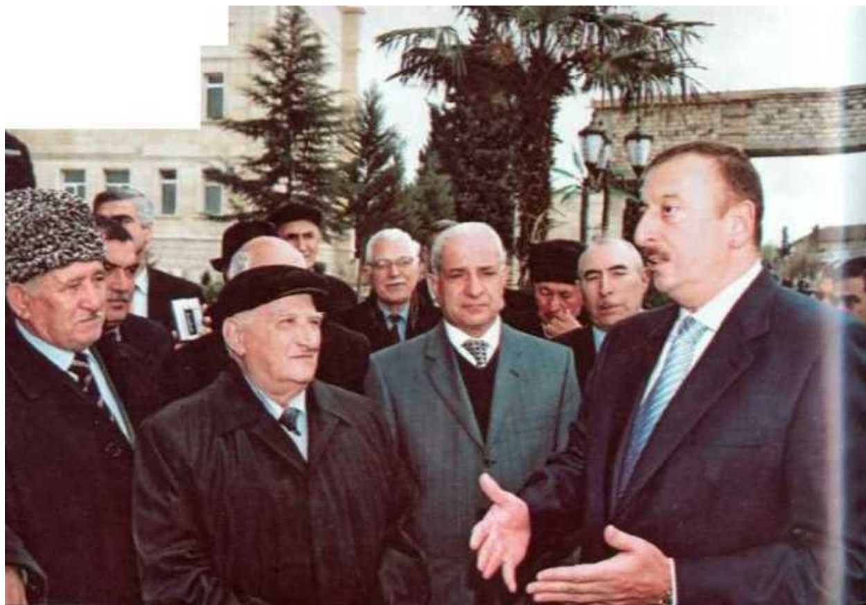
Слово президента подкрепляется делом