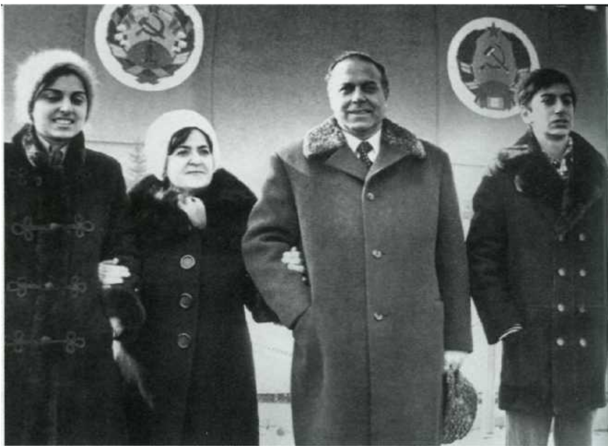
Семейный снимок на память - в Баку и в Москве