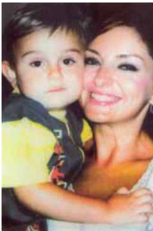
Мехрибан-ханум и Ильхам Алиев с сыном Гейдаром