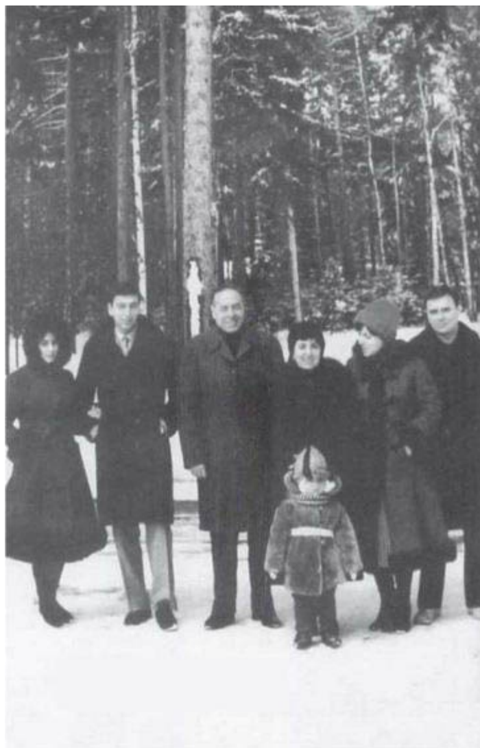
Всем Алиевым в Подмоскowie верилось в доброе, счастливое будущее