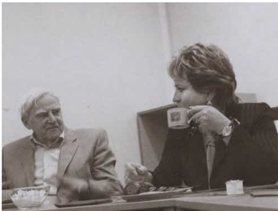
Даниил Гранин и губернатор Санкт-Петербурга Валентина Матвиенко