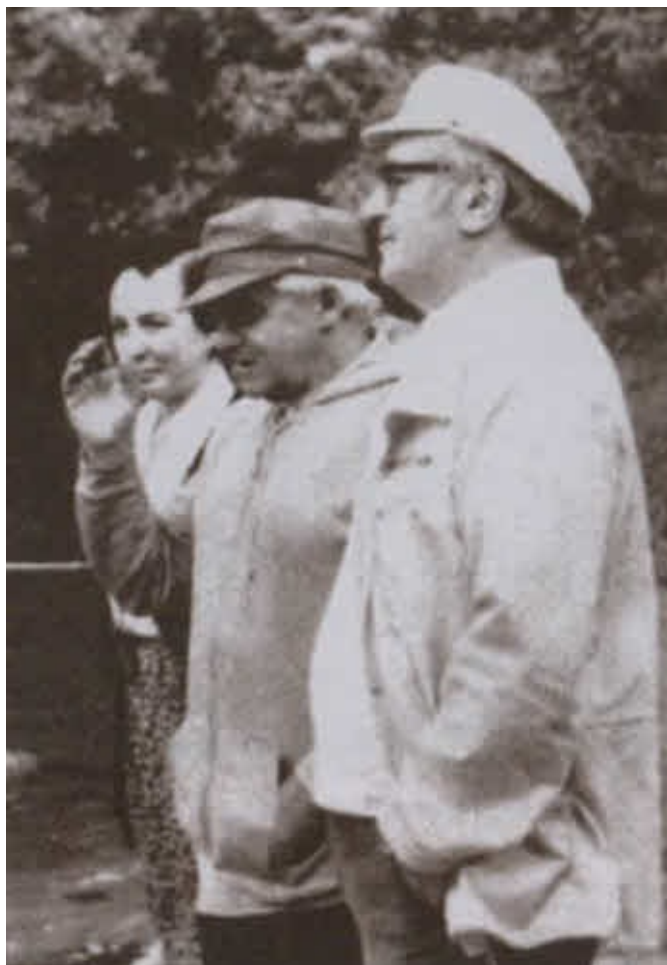
С режиссером Игорем Таланкиным во время работы над фильмом «Выбор цели»