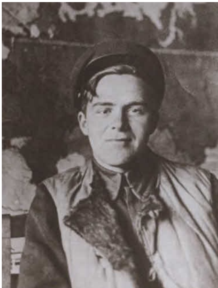
Боец пулеметно-артиллерийского батальона