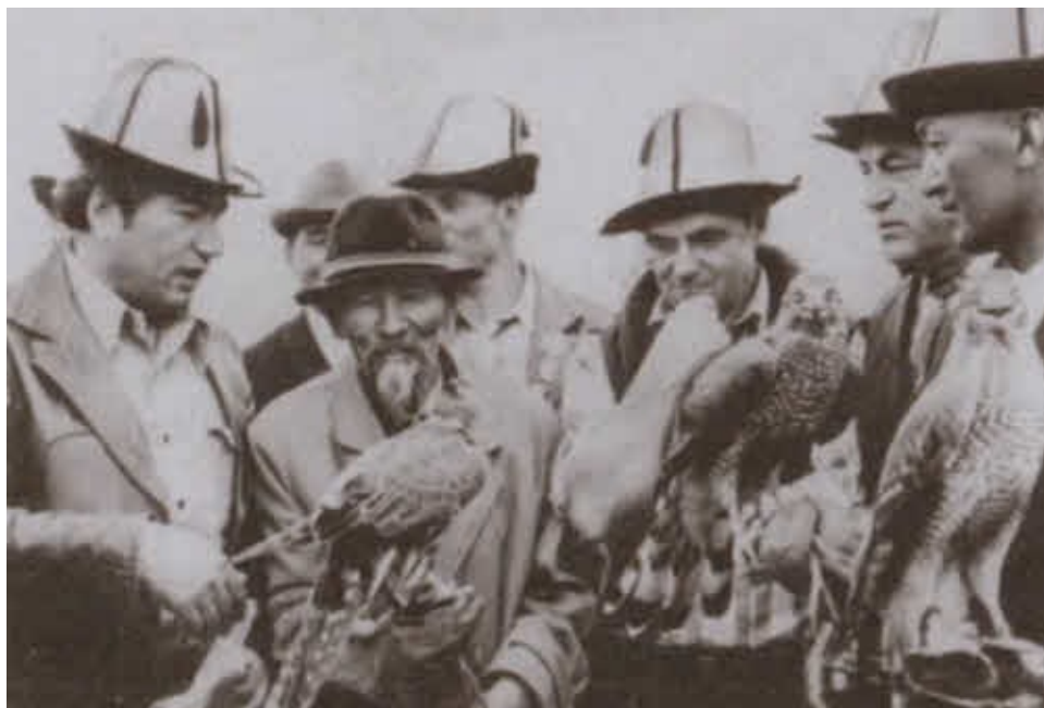
С Чингизом Айтматовым во время поездки в Киргизию