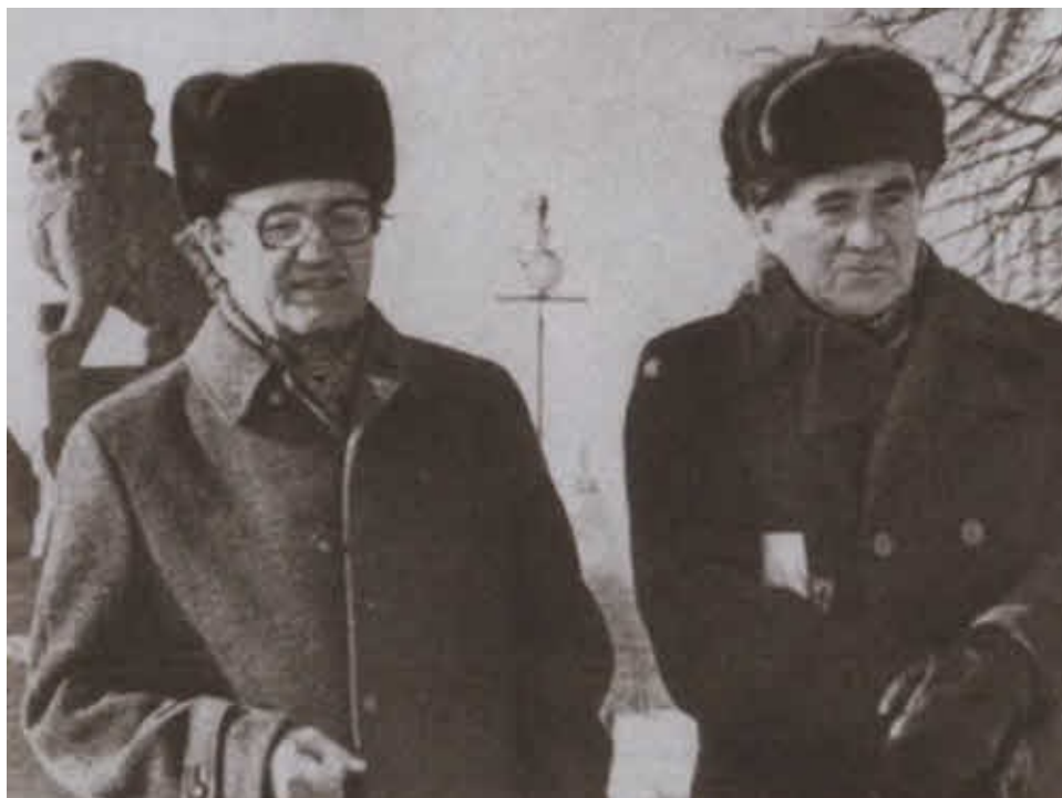
А. Адамович и Д. Гранин во время работы над «Блокадной книгой»