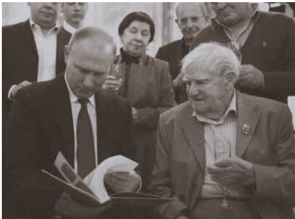
Встреча с Владимиром Путиным