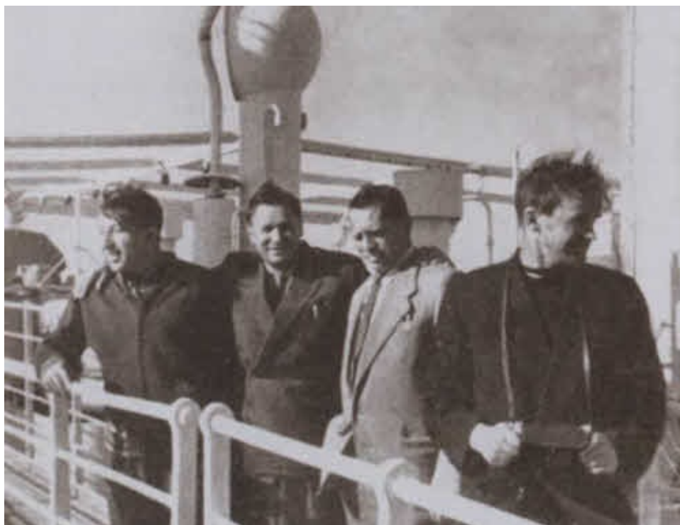
Круиз советских писателей по Европе на теплоходе «Победа».