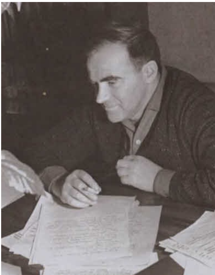
За рабочим столом. 1956 г.