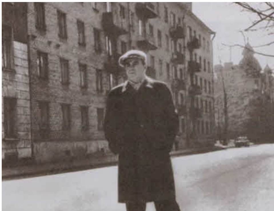
У дома на Малой Посадской