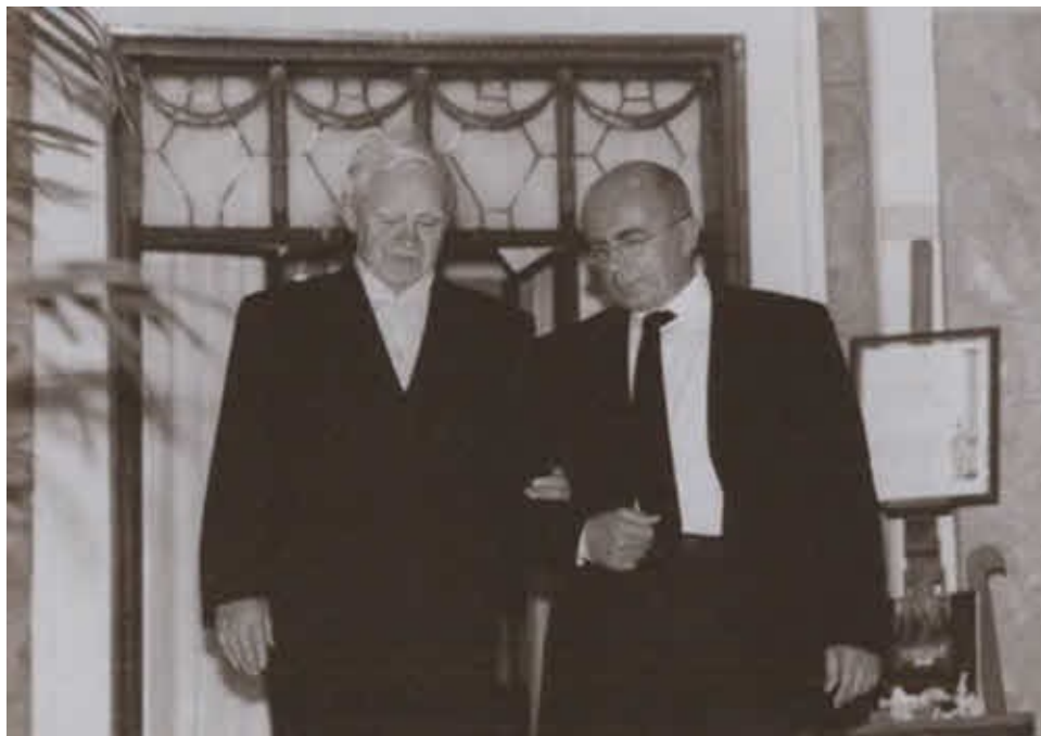
С ректором Санкт-Петербургского гуманитарного университета профсоюзов Александром Запесоцким