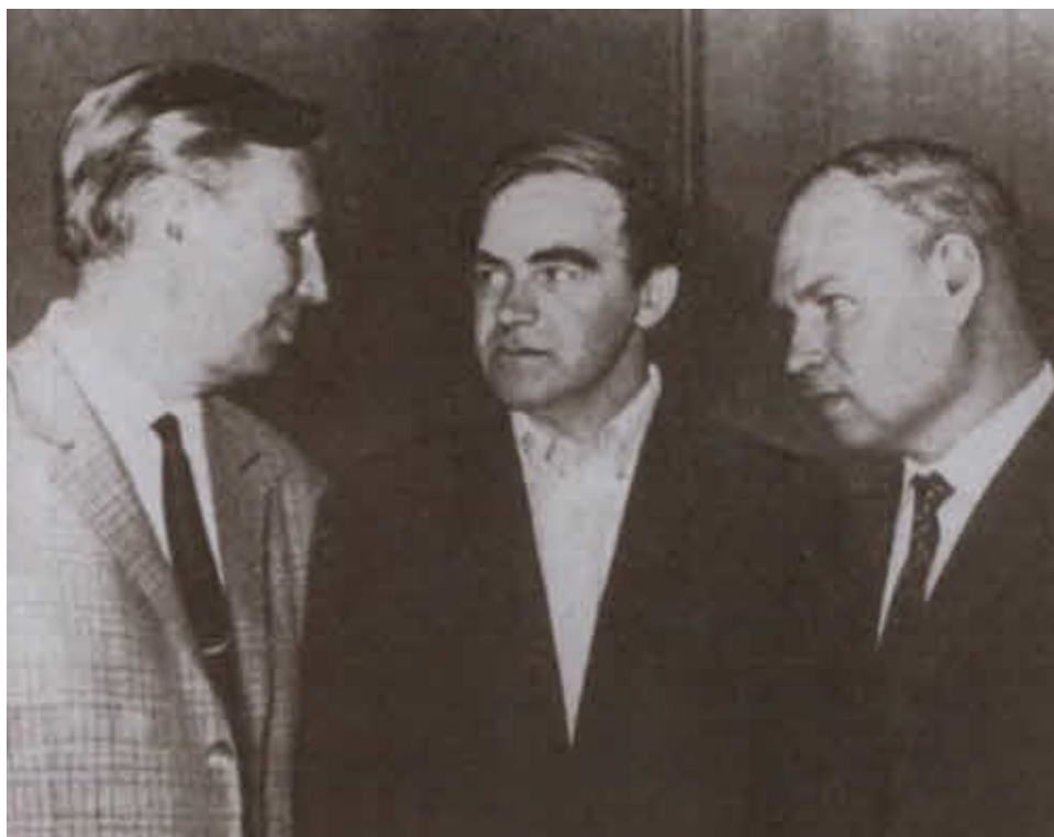
С М. Дудиным и М. Стельмахом на IV съезде писателей. 1968 г.