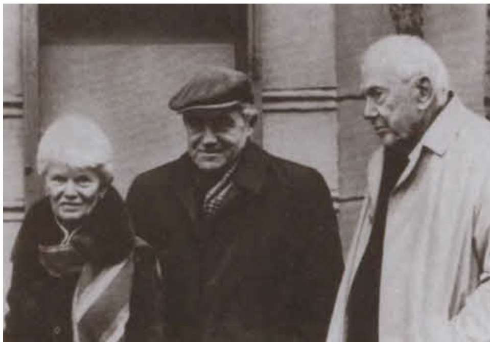
Гранин с женой и английским писателем Грэмом Грином. 1986 г.