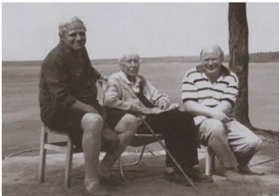
Д. Гранин, академик Д. Лихачев и автор книги В. Лопатников на озере Красавица в окрестностях Санкт-Петербурга