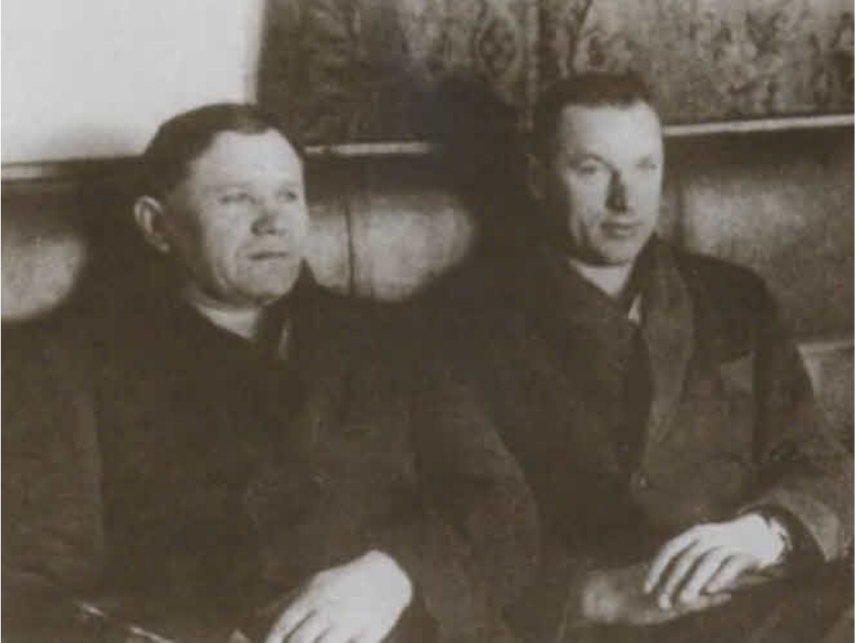
А. И. Еременко и К. К. Рокоссовский в госпитале. Москва, май 1942 г.