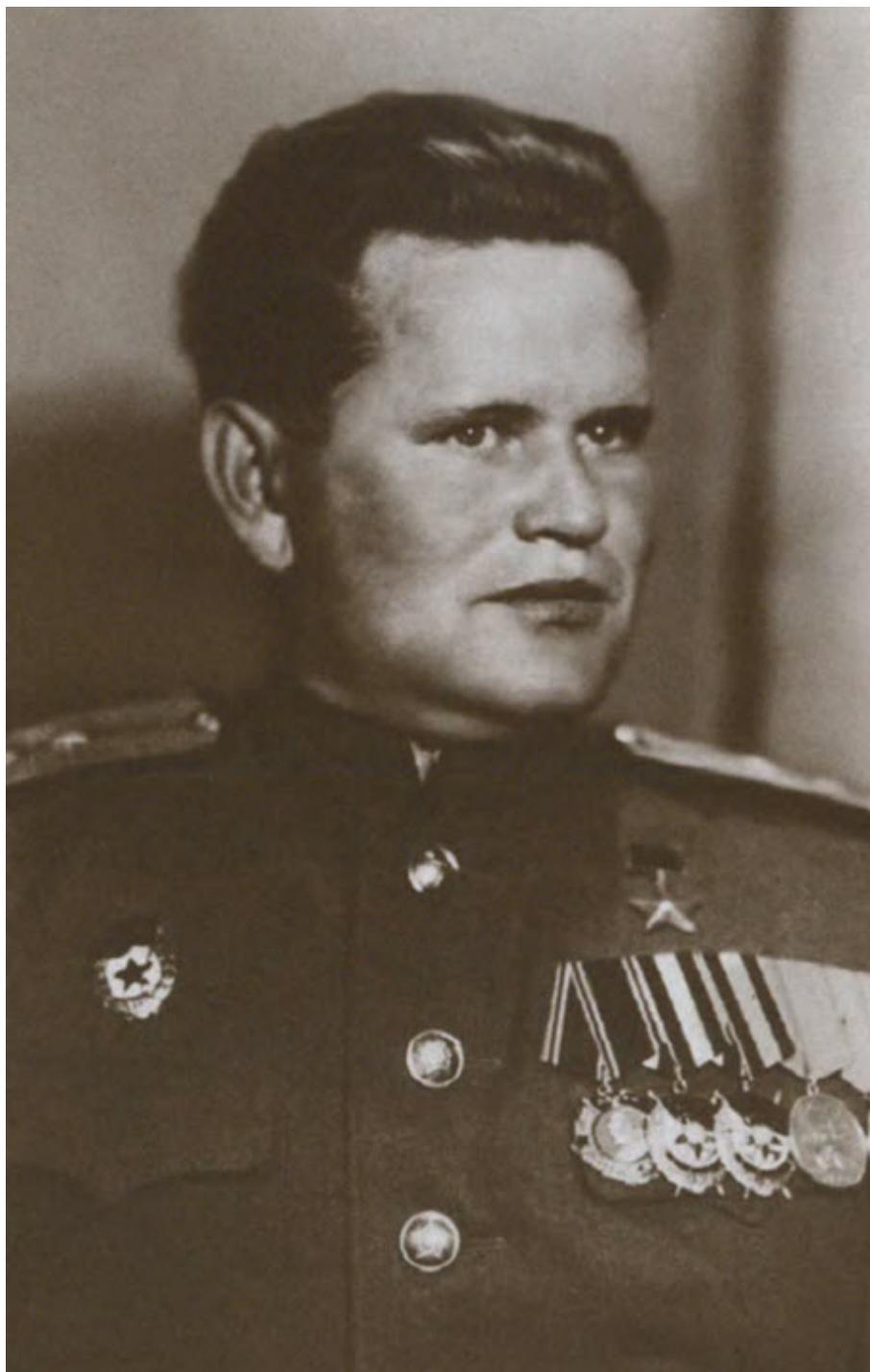
В. Г. Зайцев. 1945 г.