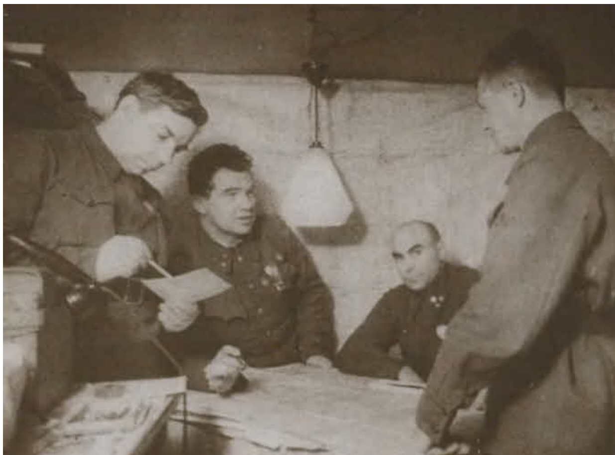
Командный пункт 62-й армии (слева направо): начальник штаба Н. И. Крылов, командарм В. И. Чуйков, член Военного совета К. А. Гуров, командир 13-й гвардейской стрелковой дивизии А. И. Родимцев. Сталинград, 1942 г.