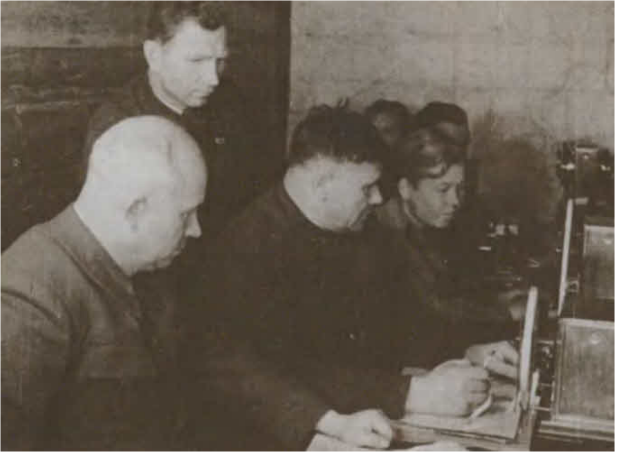
Сталинградский фронт. Слева направо: Н. С. Хрущев, А. И. Еременко. Во втором ряду — И. С. Варенников. 20 августа 1942 г.