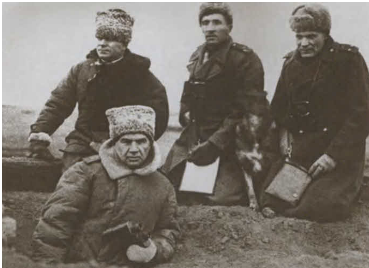
Командующий 8-й гвардейской армией В. И. Чуйков на передовой. Украина, 1943 г.