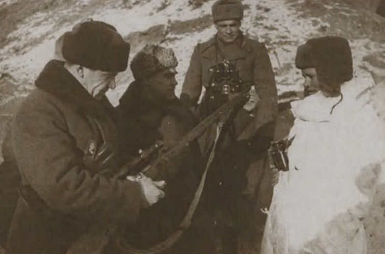
Командующий 62-й армией В. И. Чуйков (первый слева) и член Военного совета К. А. Гуров (второй слева) беседуют со снайпером В. Г. Зайцевым (крайний справа). Сталинград, 1942 г.