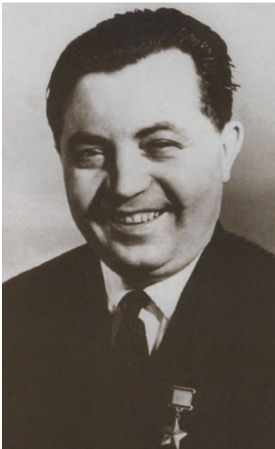
Герой Советского Союза Я. Ф. Павлов. 1970-е гг.