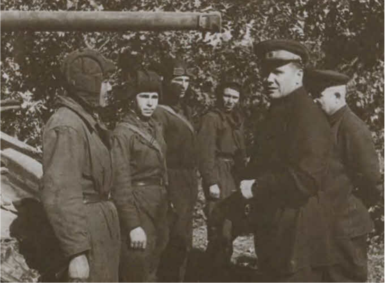
А. И. Еременко с танкистами 90-й танковой бригады. Сталинград, 1942 г.