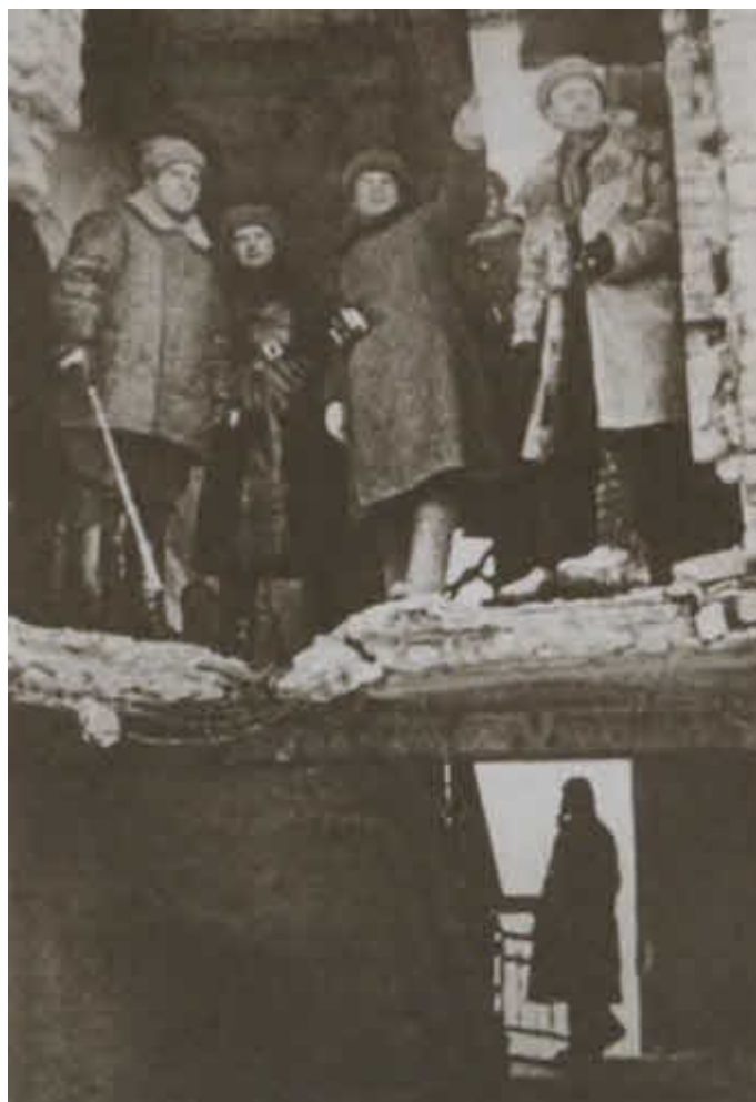
На НП в районе метизного завода. Сталинград, 1942 г.