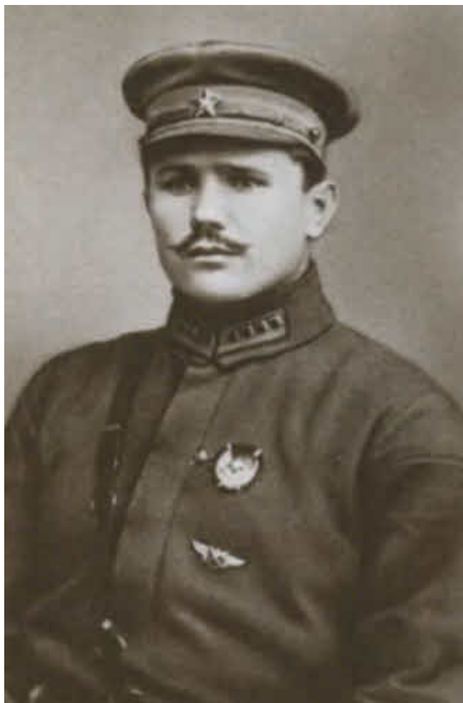
Командир 79-го кавалерийского полка 14-й кавалерийской дивизии А. И. Еременко. 1930 г.