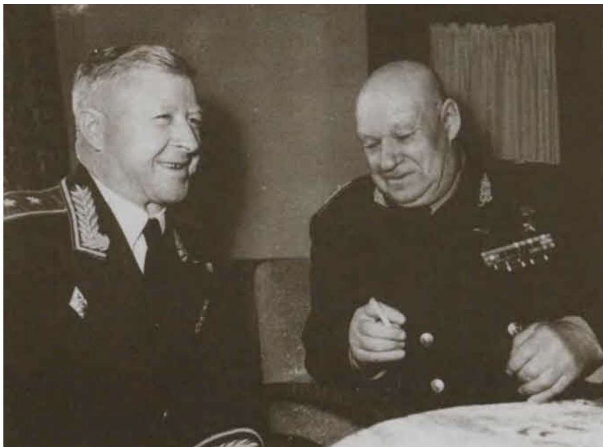
А. И. Родимцев и М. С. Шумилов. Москва, конец 1950-х гг.