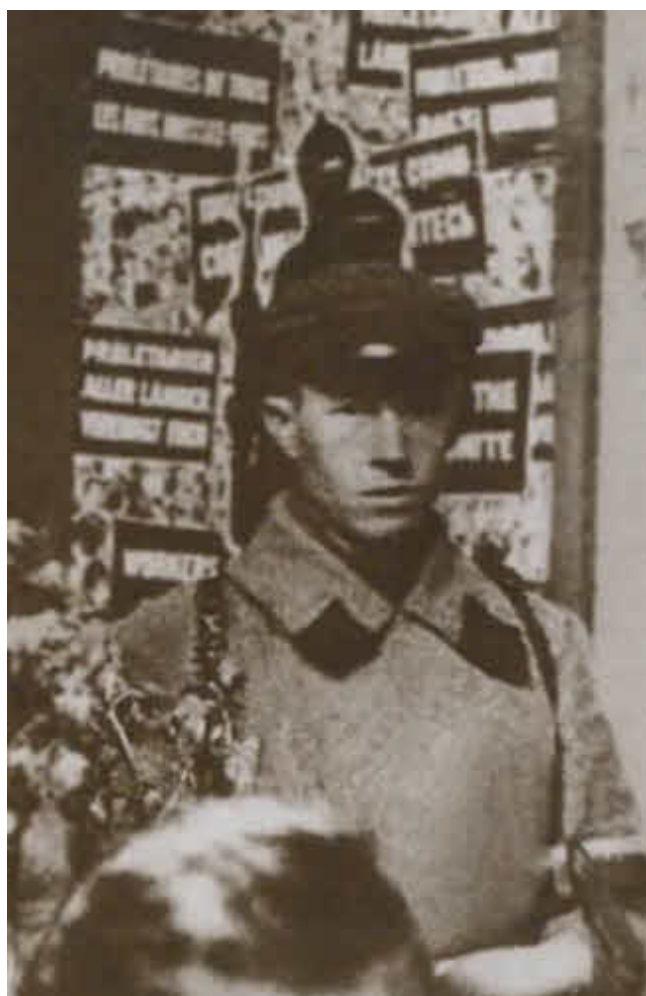
Александр Родимцев — курсант Московской объединенной высшей военной школы им. ВЦИК