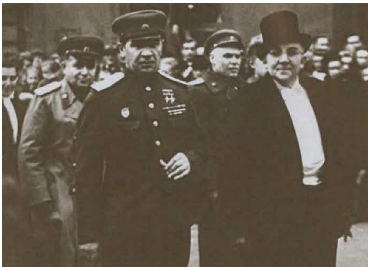
Генерал-полковник В. И. Чуйков на открытии Йенского университета. Германия