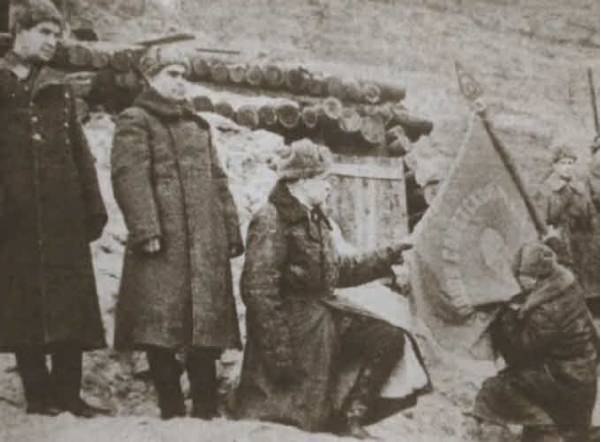
Вручение гвардейского знамени 39-й стрелковой дивизии.