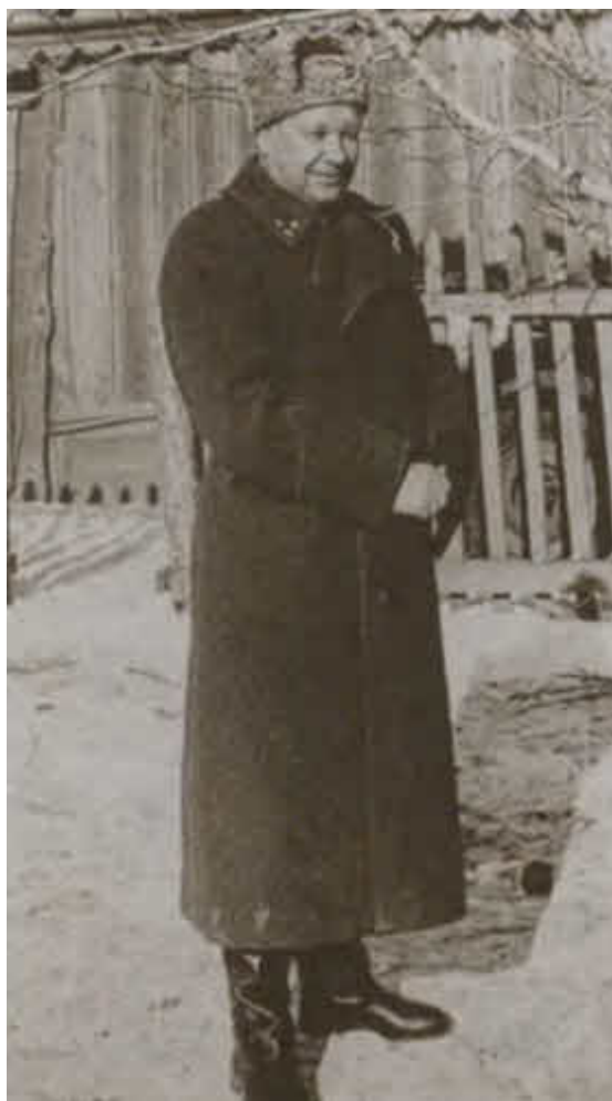
Генерал-лейтенант М. С. Шумилов в расположении штаба 64-й армии. Зима, 1943 г.