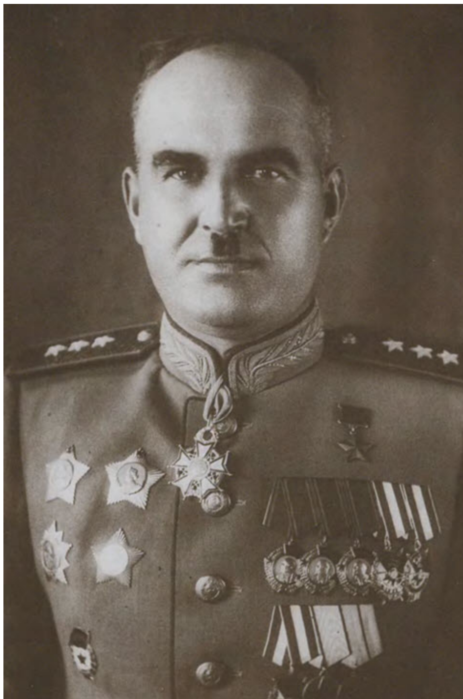
Генерал-полковник И. И. Людников в парадной форме. 1945 г.