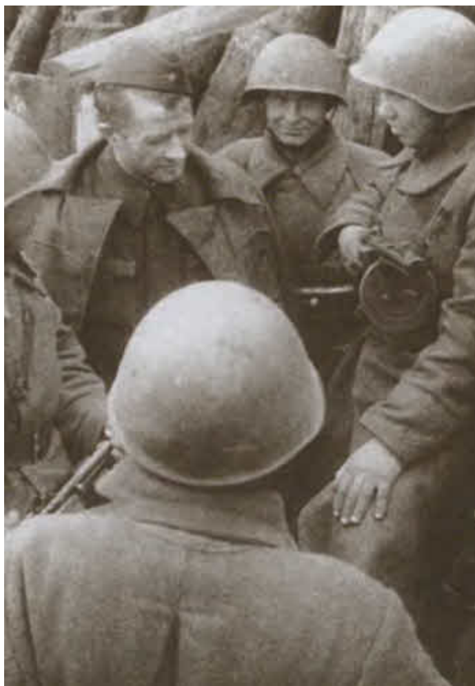
А. И. Родимцев беседует с бойцами. Сталинград, 1942 г.