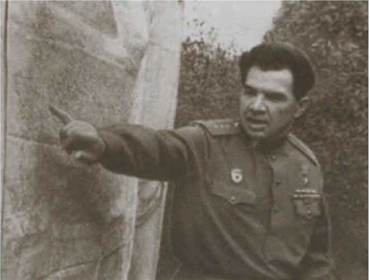
В. И. Чуйков во время подготовки к боевым действиям. 1944 г.