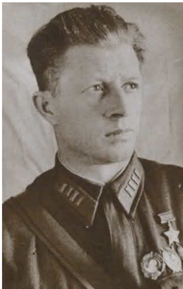
Таким встретил Великую Отечественную войну командир 5-й воздушно-десантной бригады полковник А. И. Родимцев