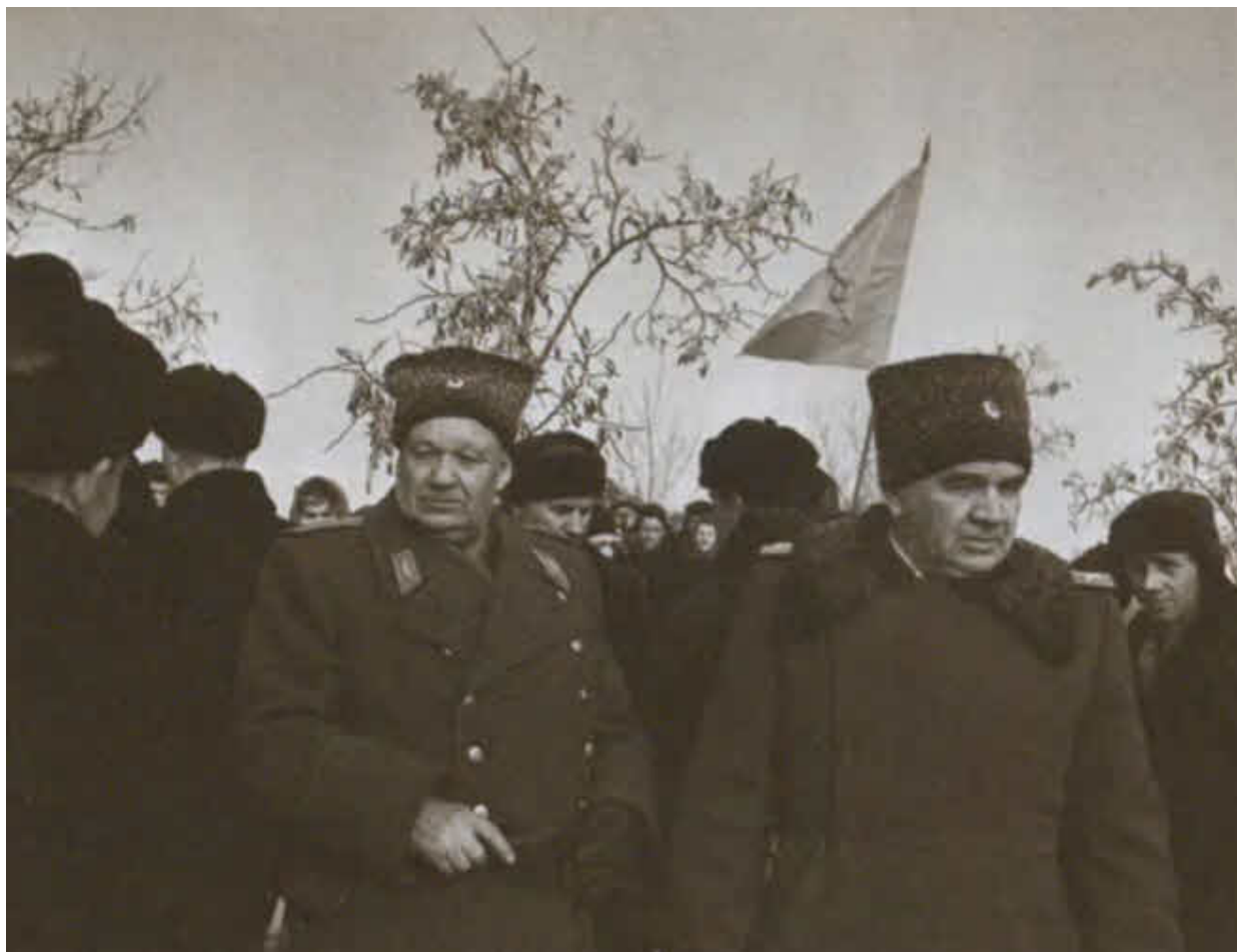
М. С. Шумилов и В. И. Чуйков в Волгограде на площади Павших борцов. 1 февраля 1963 г.