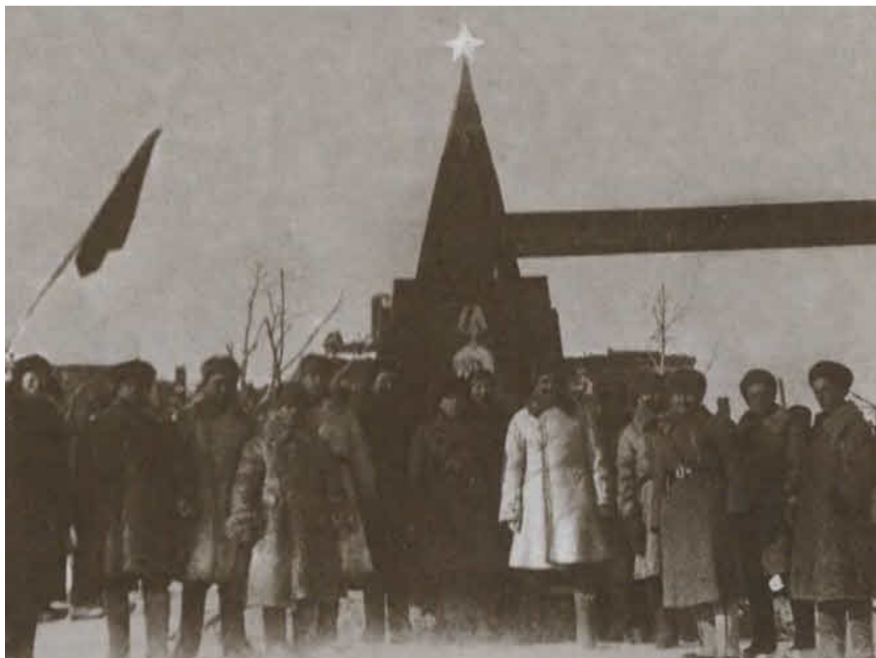
Командир и воины 138-й стрелковой дивизии после окончания боев. Сталинград, февраль 1943 г.