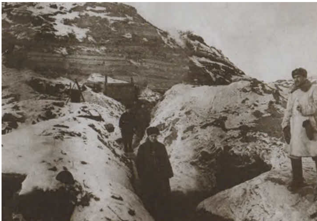
На «Острове Людникова». Сталинград, 1943 г.