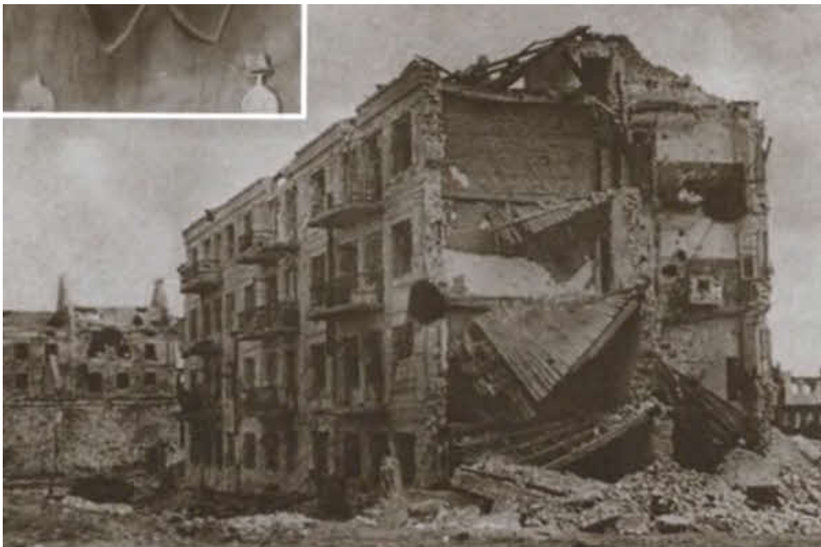
Дом Павлова. Сталинград, весна 1943 г.