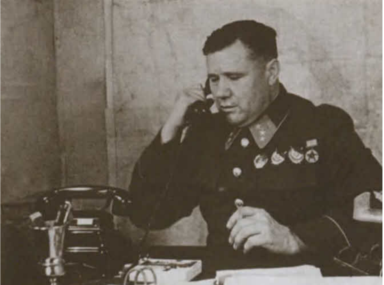
Командующий Сталинградским фронтом генерал-полковник А. И. Еременко в штабе фронта. 1942 г.