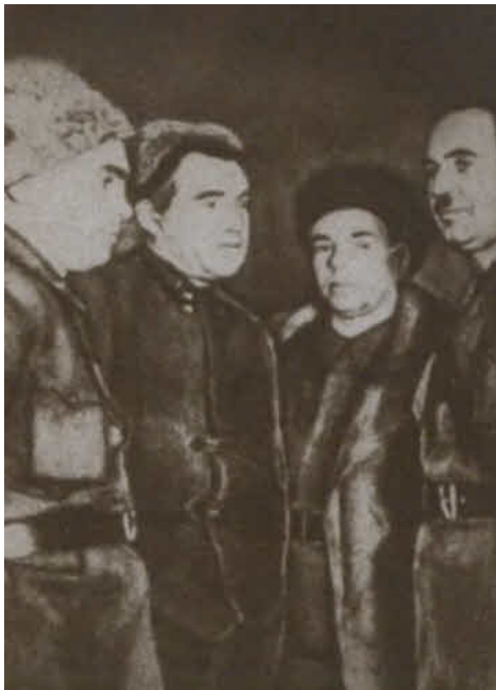
На КП 138-й стрелковой дивизии. Слева направо: командование 62-й армии — член Военного совета К. А. Гуров, командующий В. И. Чуйков, начальник штаба Н. И. Крылов и комдив И. И. Людников. Сталинград, 1942 г.