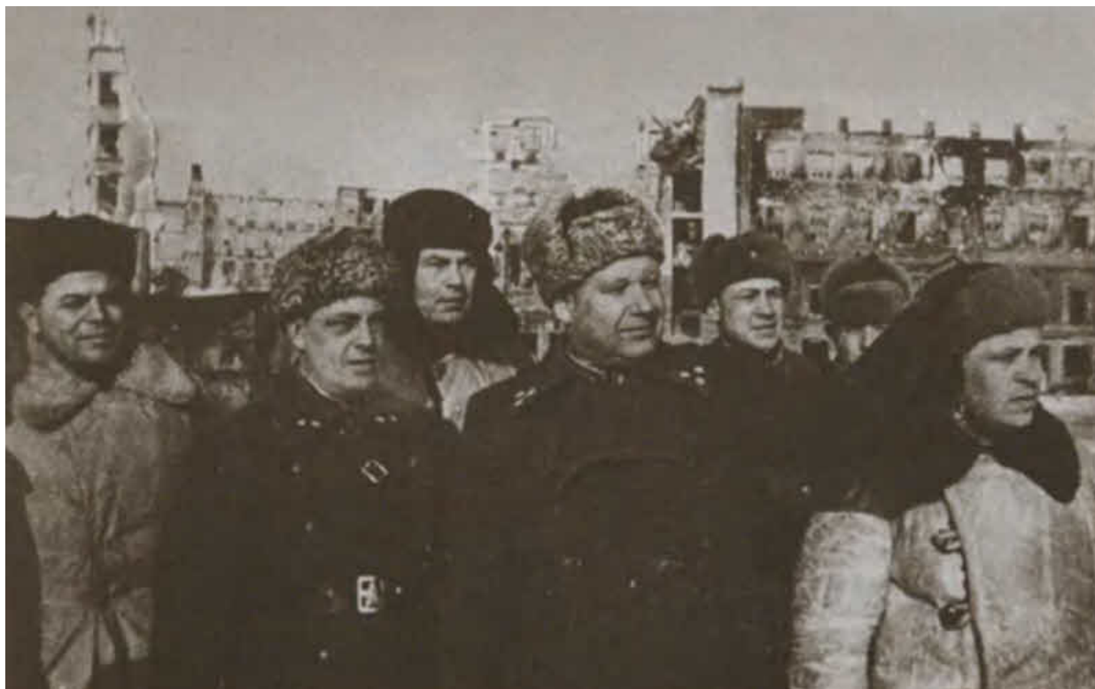
М. С. Шумилов на площади Павших борцов. Сталинград, 1943 г.