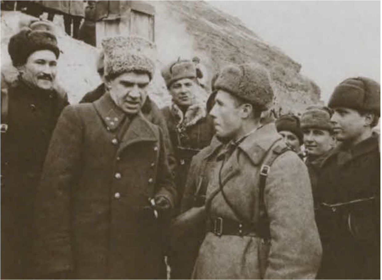
В. И. Чуйков беседует с бойцами. Сталинград, 1942 г.