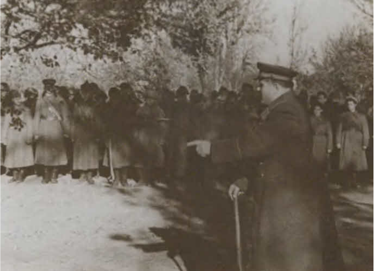
А. И. Еременко обращается к войскам Сталинградского фронта. 1942 г.