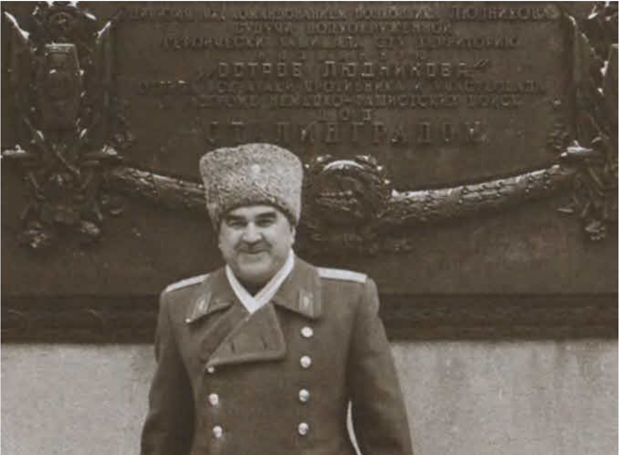
И. И. Людников у мемориальной доски на «Острове Людникова». Волгоград, 1963 г.