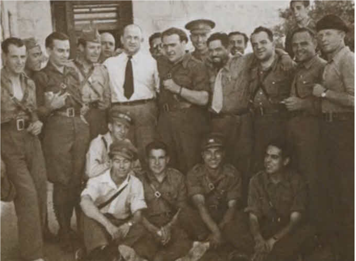
А. И. Родимцев (крайний справа стоит в берете) с офицерами республиканской армии. Испания, 1937 г.