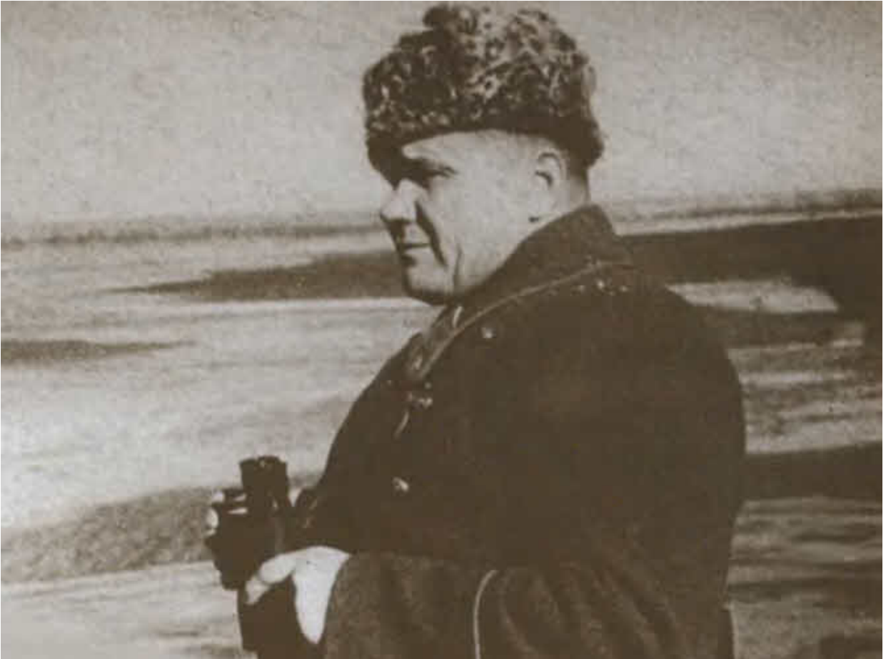
Командующий Сталинградским фронтом генерал-полковник А. И. Еременко накануне контрнаступления советских войск под Сталинградом. Ноябрь, 1942 г.