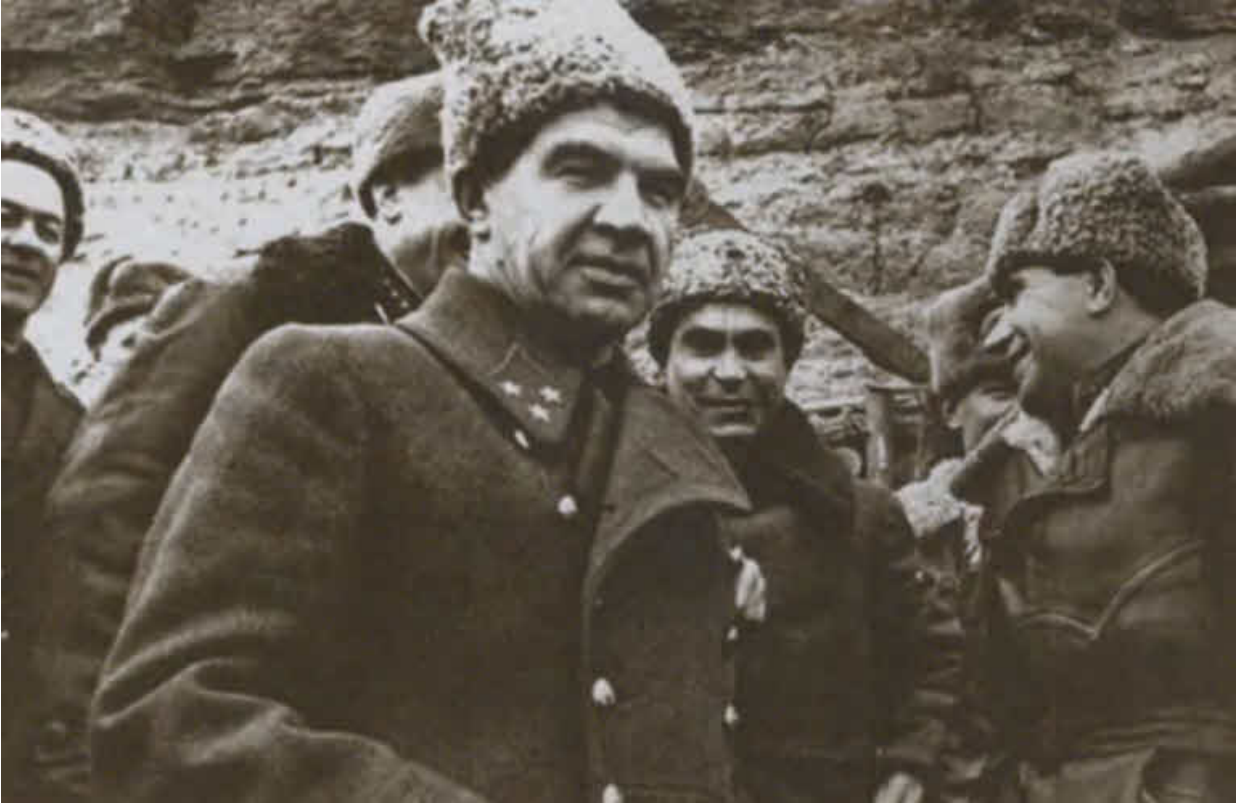
Командующий 62-й армией В. И. Чуйков на КП 62-й армии.