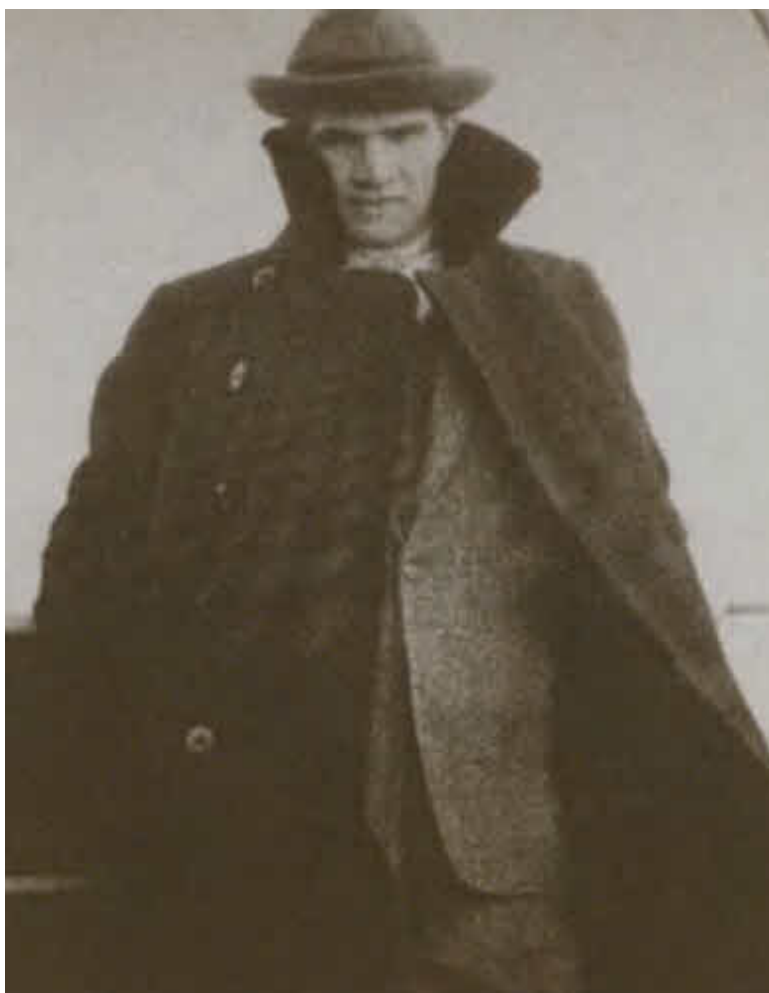
Сотрудник Разведывательного управления В. И. Чуйков в Китае