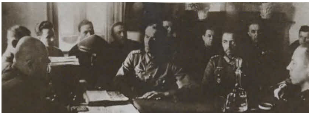
Допрос генерал-фельдмаршала Паулюса (за столом в центре) в штабе 64-й армии. Слева — генерал-лейтенант М. С. Шумилов. Бекетовка, 31 января 1943 г.