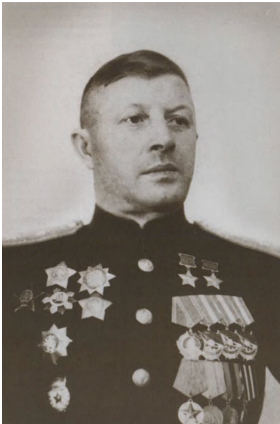
Генерал-лейтенант А. И. Родимцев в парадной форме. 1945 г.