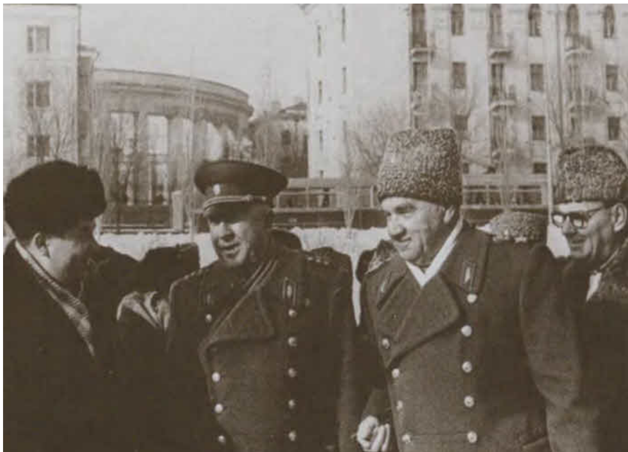
Слева направо: Герой Советского Союза Я. Ф. Павлов, генерал-полковник А. И. Родимцев, маршал Советского Союза В. И. Чуйков и главный скульптор мемориала на Мамаевом кургане Е. В. Вучетич. Волгоград, 1967 г.