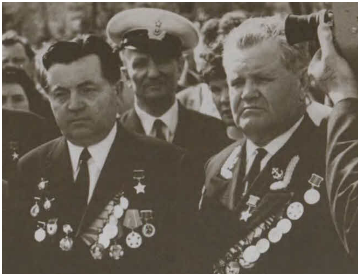
На переднем плане — Я. Ф. Павлов и В. Г. Зайцев. Два легендарных героя Сталинградской битвы на Мамаевом кургане. Волгоград, 1970 г.