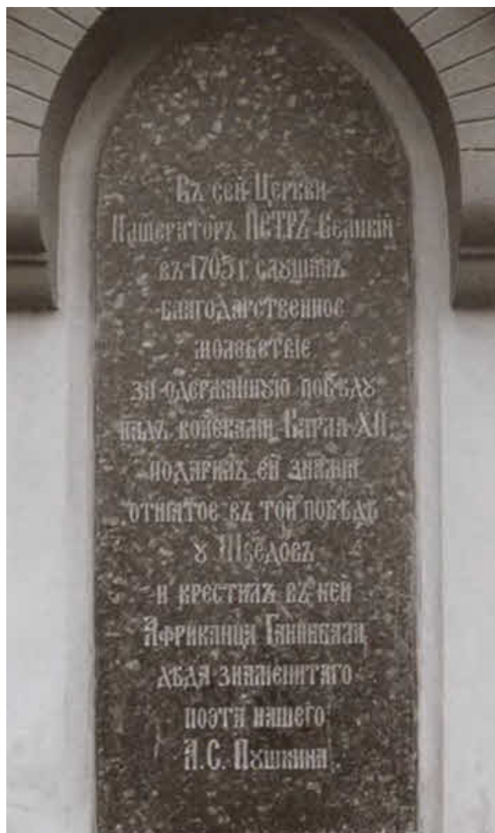
Памятная доска на стене Пятницкой церкви в Вильнюсе, где в 1705 году Петр I крестил Абрама Ганнибала