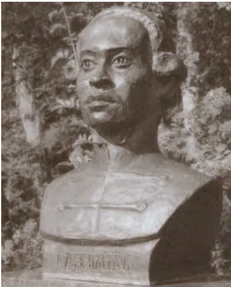
Бюст Абрама Петровича Ганнибала в усадьбе Петровское.