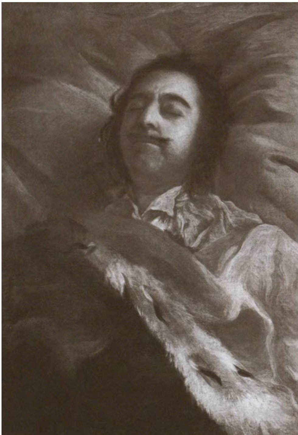
Петр I на смертном одре.