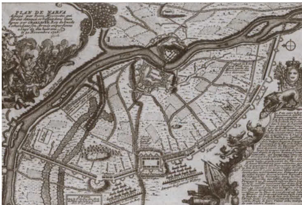
План Нарвы. 1701 г.