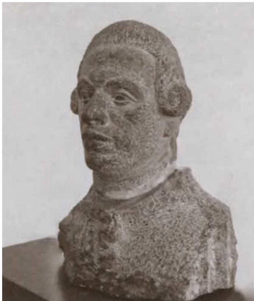
Бюст Абрама Петровича Ганнибала в усадьбе Суйда.