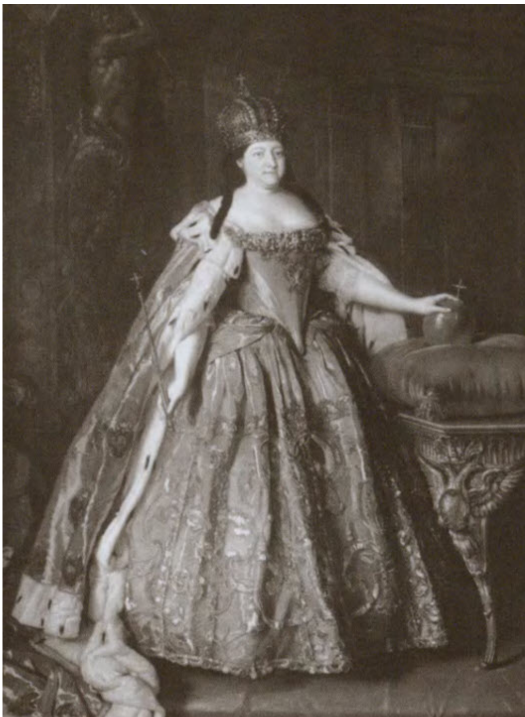
Императрица Анна Иоанновна.