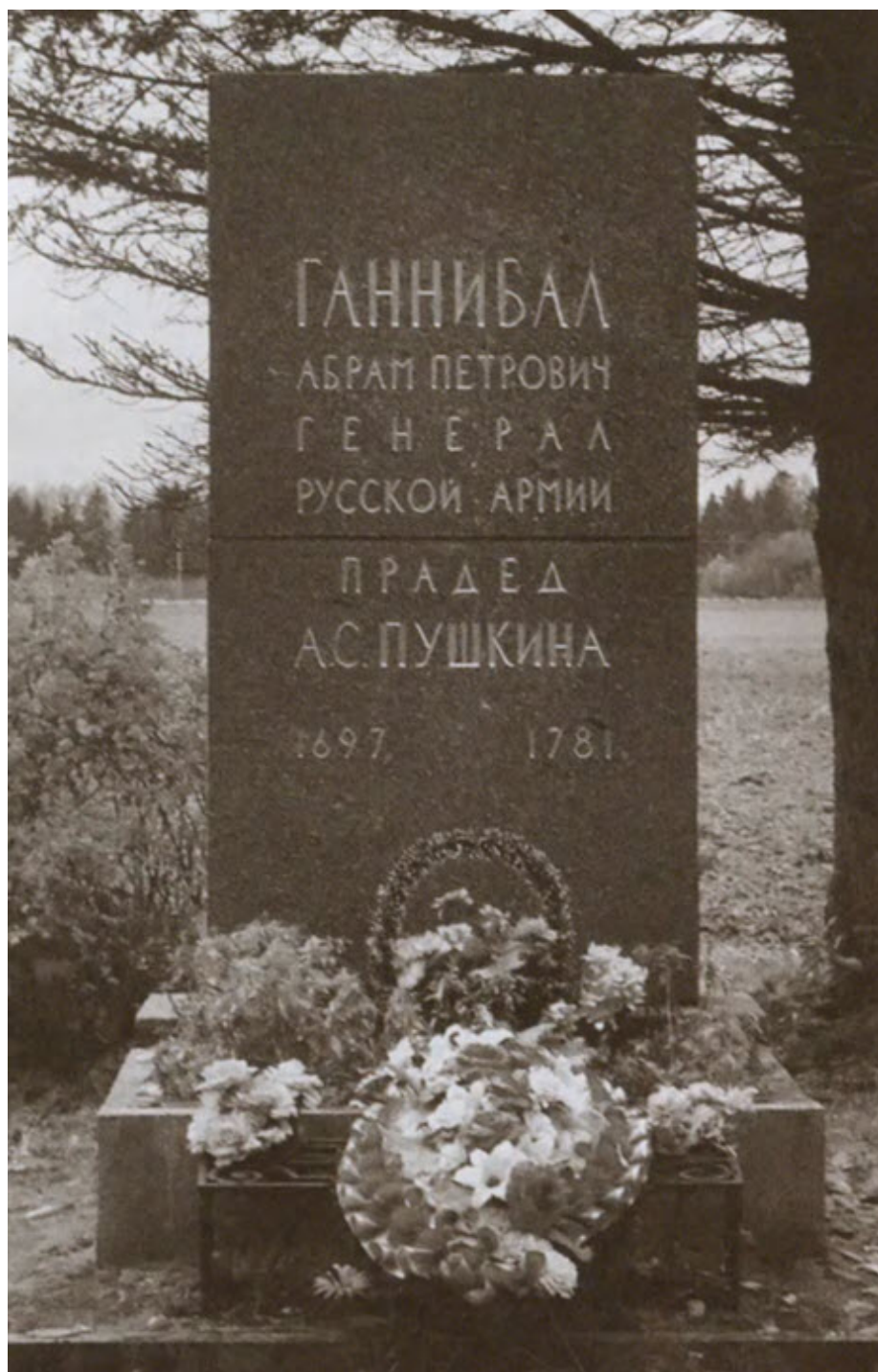
Гранитный обелиск на месте предполагаемого захоронения А. П. Ганнибала