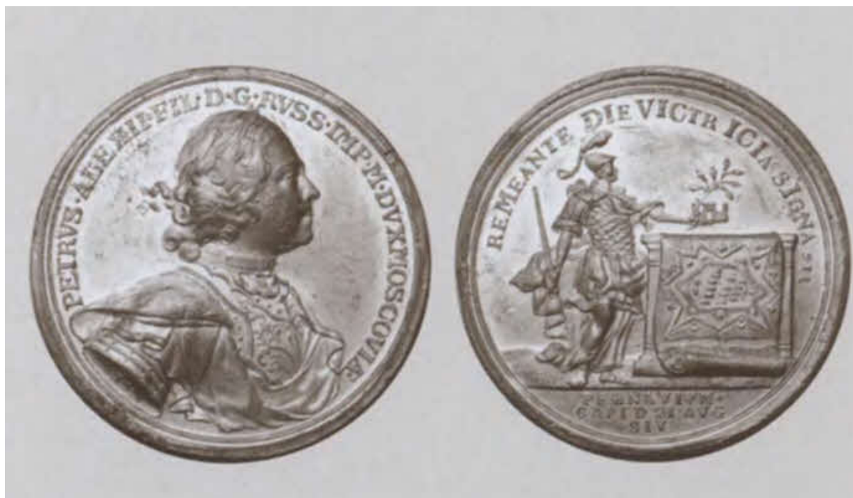
Медаль в память взятия Пернова 14 августа 1710 года