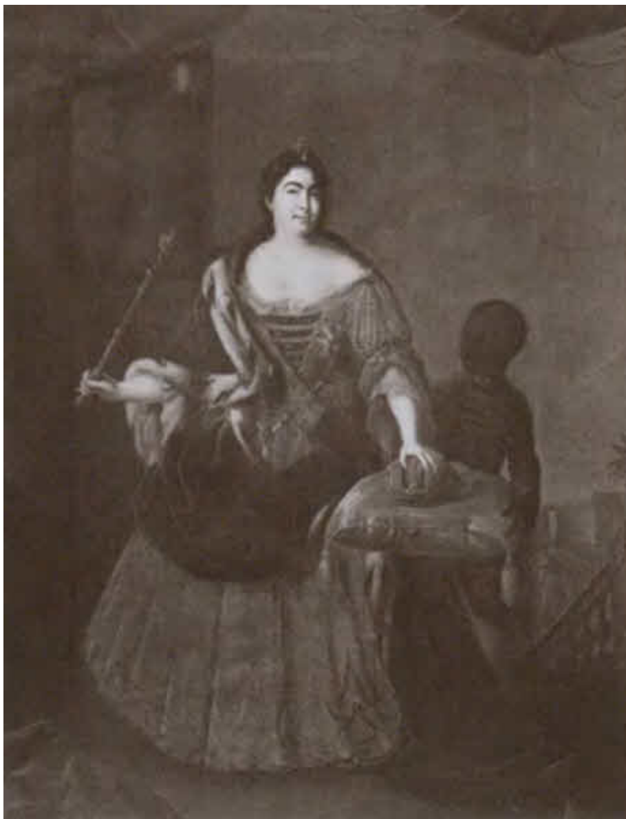
Екатерина I с арапчонком.

Портрет работы И. Г. Одольского. Не позднее 1726 г.