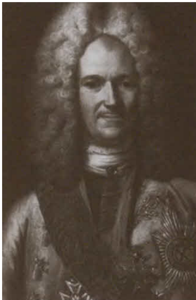
Светлейший князь Александр Данилович Меншиков.

Неизвестный художник первой четверти XVIII в.