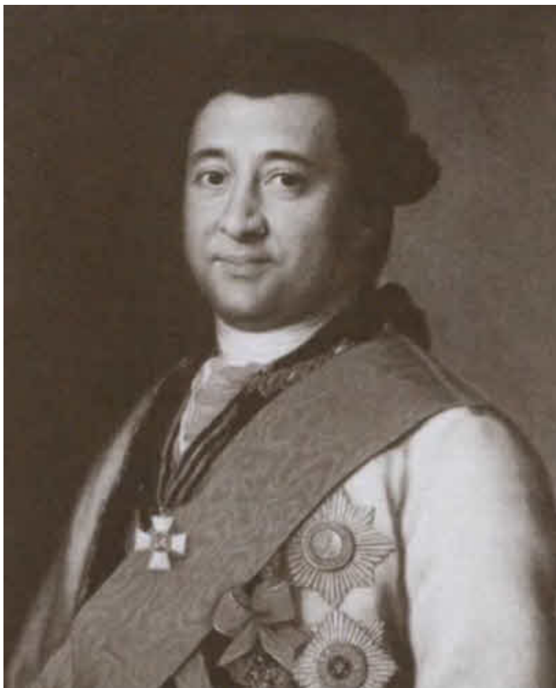
Иван Абрамович Ганнибал.

Портрет работы неизвестного художника. Конец XVIII в.