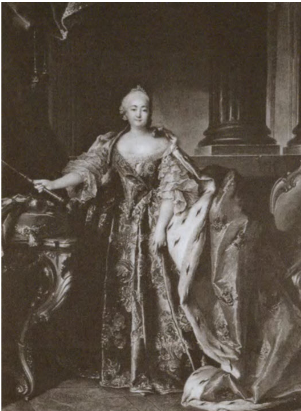
Императрица Елизавета Петровна.