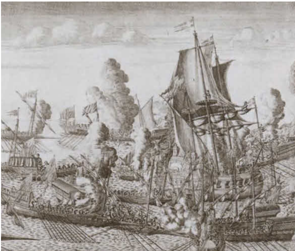
Морская баталия близ Гангута.