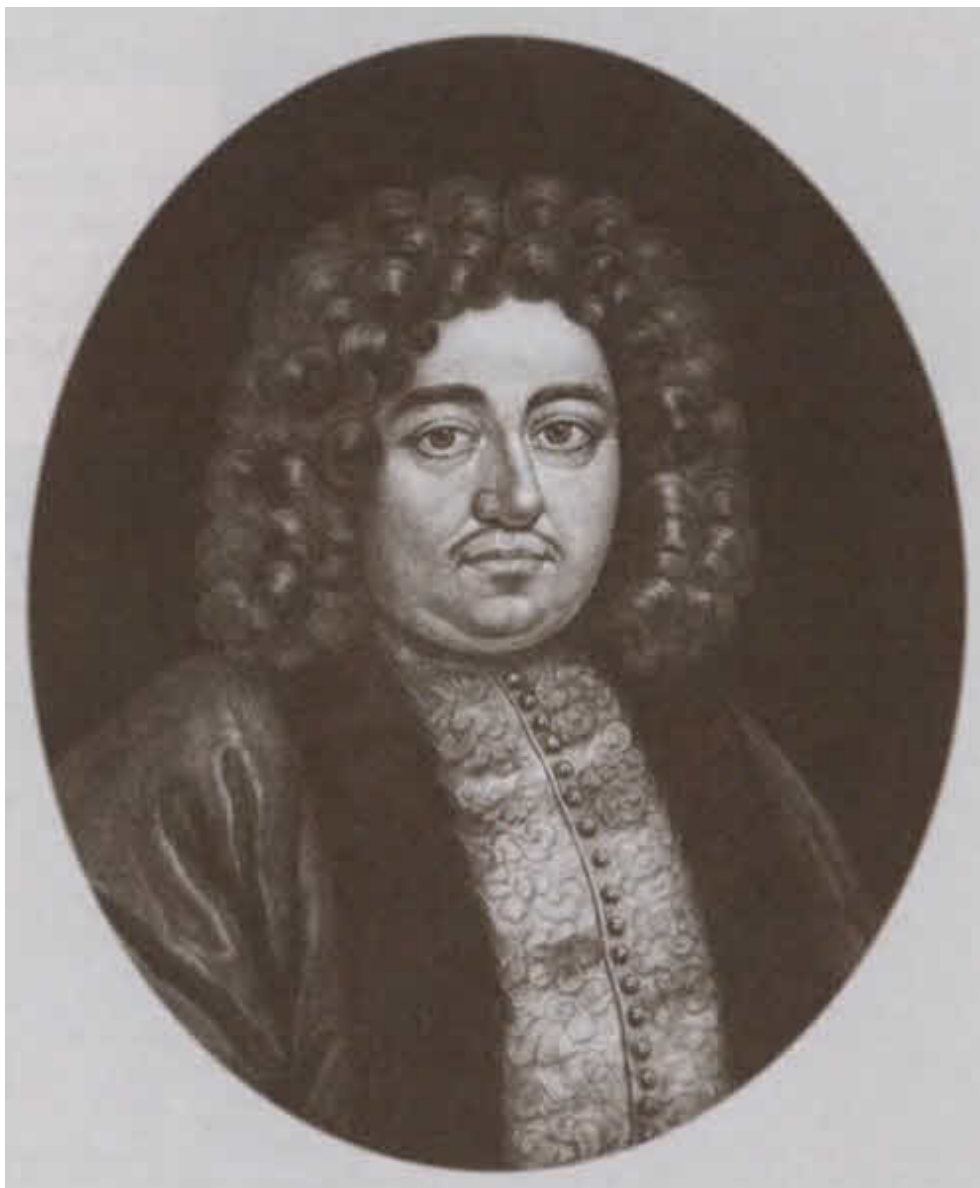
Федор Алексеевич Головин.