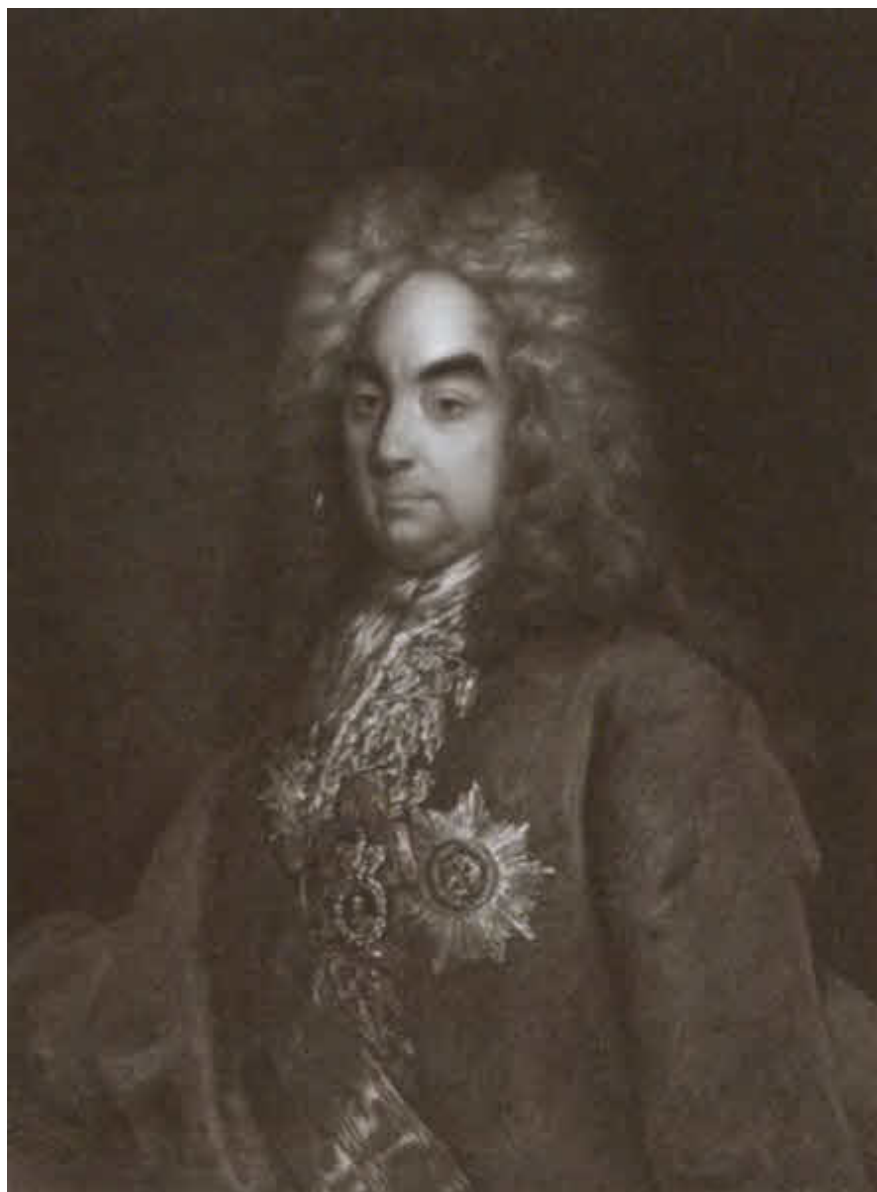
Граф Петр Андреевич Толстой.