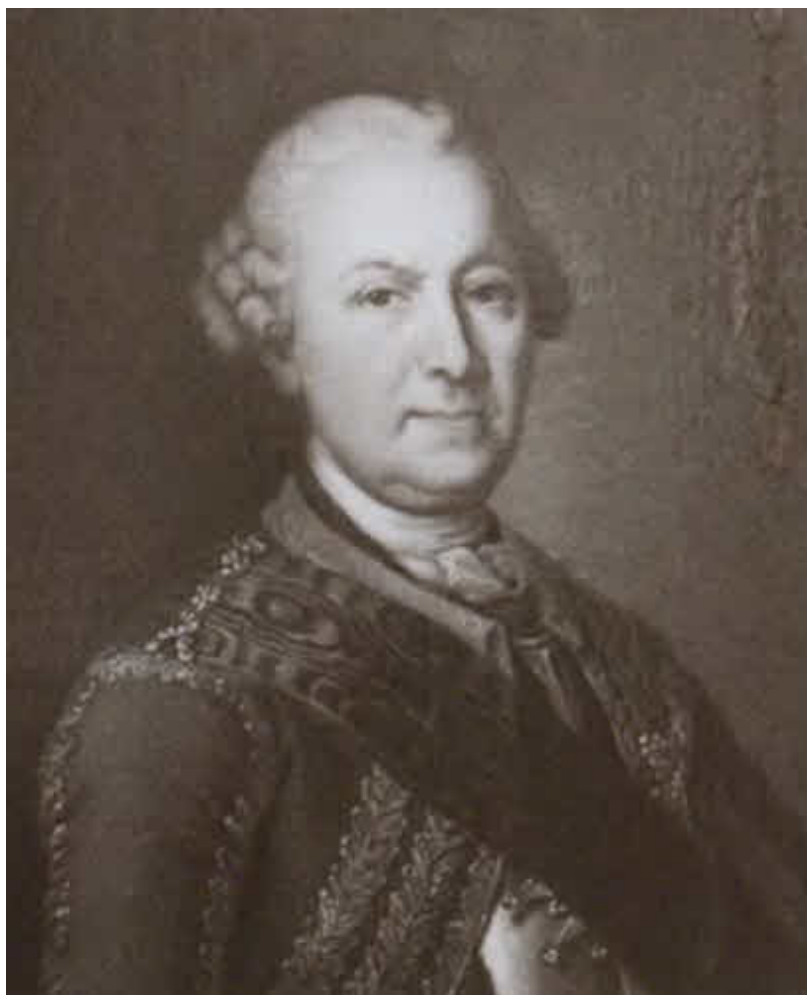
Граф Бурхард Христофор фон Миних