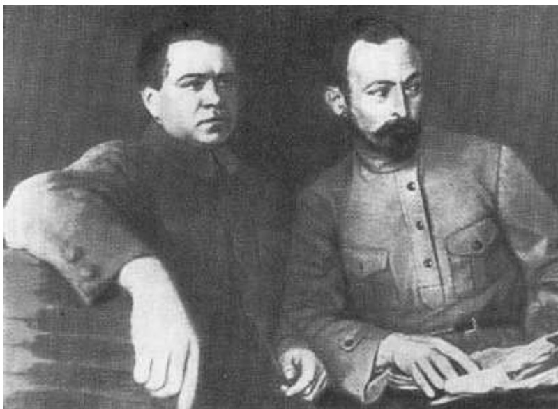
Ф. Э. Дзержинский и Я. Х. Петерс.