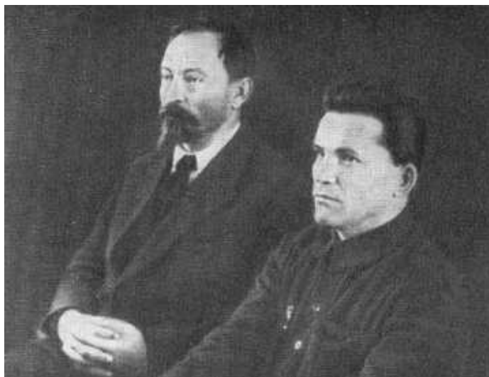
Ф. Э. Дзержинский и С. М. Киров на XXII чрезвычайной ленинградской губернской конференции ВКП(б). Февраль, 1926 г.