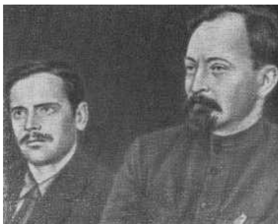
Ф. Э. Дзержинский и А. А. Андреев на конференции союза железнодорожников. 1923 г.