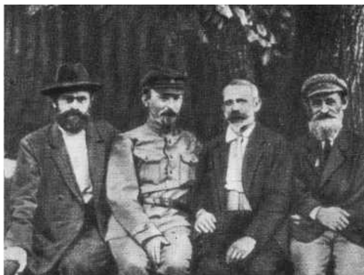
Ф. Э. Дзержинский за работой в штабе тыла Юго-Западного фронта. 1920 г.