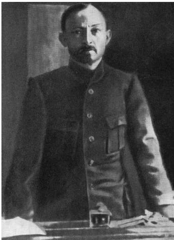
Ф. Э. Дзержинский. 1918 г.