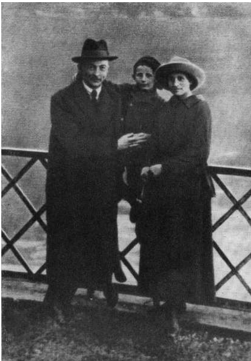
Ф. Э. Дзержинский с семьей. Лугано. Октябрь, 1918 г.