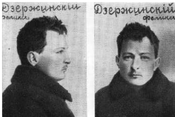
Ф. Э. Дзержинский в Бутырской тюрьме. 1902 г..