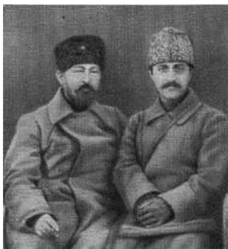
Ф. Э. Дзержинский и Г. К. Орджоникидзе. Сухуми, 1922 г.