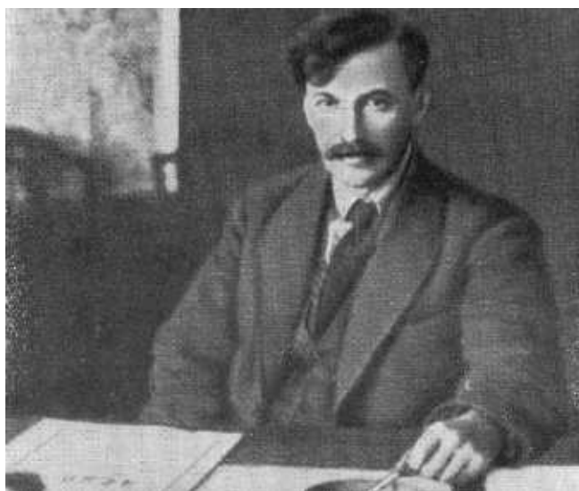
В. Р. Менжинский.