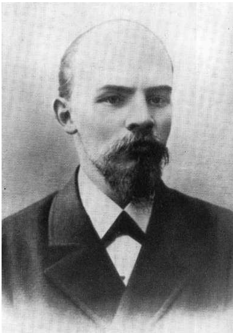
В. И. Ленин. 1897 г.