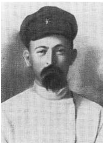
Ф. Э. Дзержинский — начальник тыла Юго-Западного фронта. Июнь-июль 1920 г.