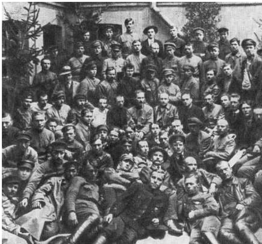
Ф. Э. Дзержинский среди делегатов 3-й конференции чрезвычайных комиссий. 1919 г.