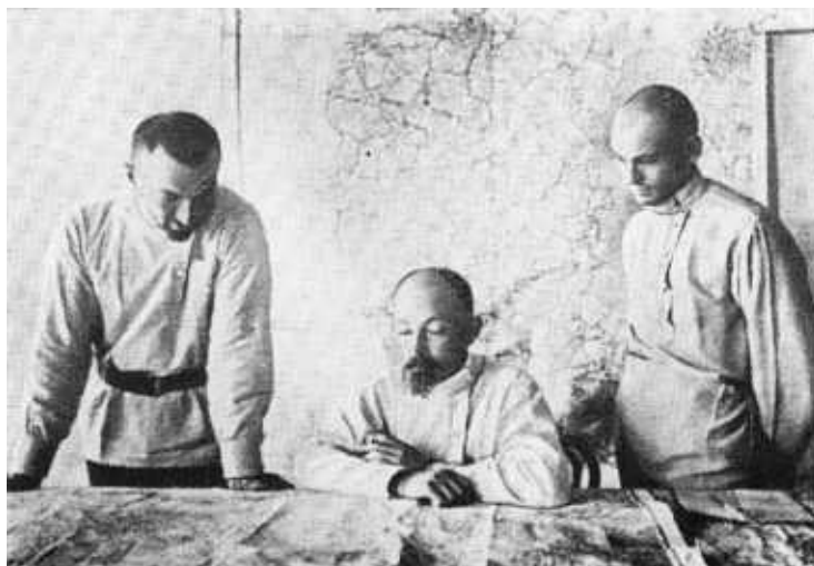
Ф. Э. Дзержинский, Ю. Ю. Мархлевский, Ф. Я. Кон — члены Временного революционного комитета Польши. Крайний слева — И. И. Скворцов-Степанов. Август, 1920 г.