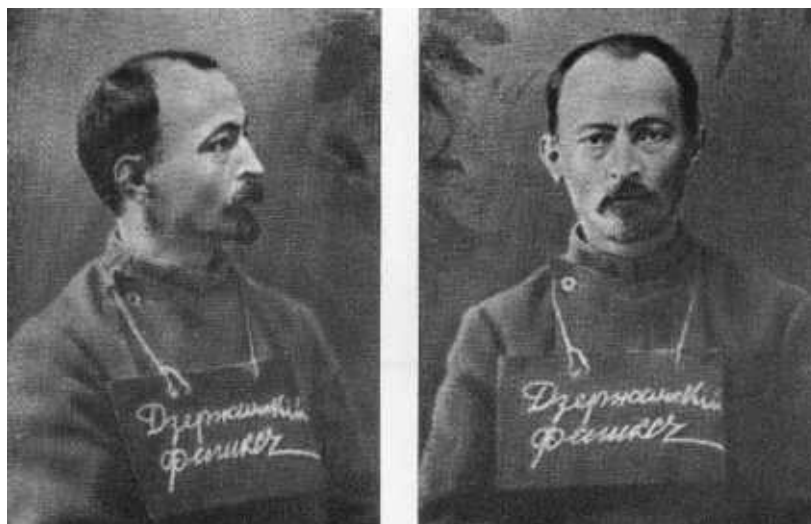
Ф. Э. Дзержинский в Орловском каторжном центре. 1914 г.