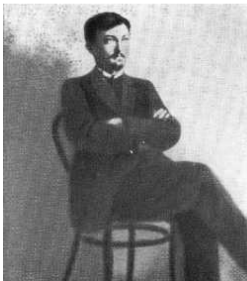
Ф. Э. Дзержинский. 1905 г.