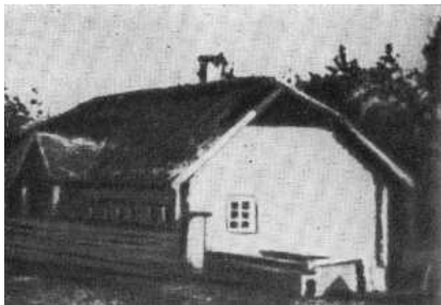
Дом в Держинове Ошмянского уезда Виленской губернии, где родился Ф. Э. Держинский.