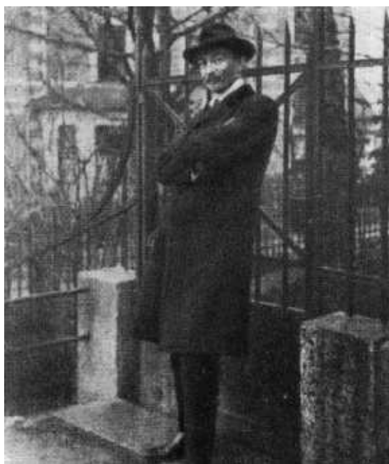
Ф. Э. Дзержинский в Цюрихе. 1910 г.