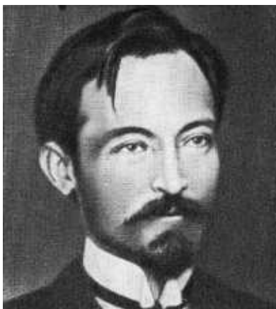
Ф. Э. Дзержинский. Краков. 1911 г.