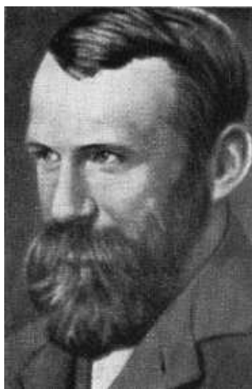
Руководители социал-демократии Королевства Польского и Литвы: Роза Люксембург, Адольф Варский и Юлиан Мархлевский.