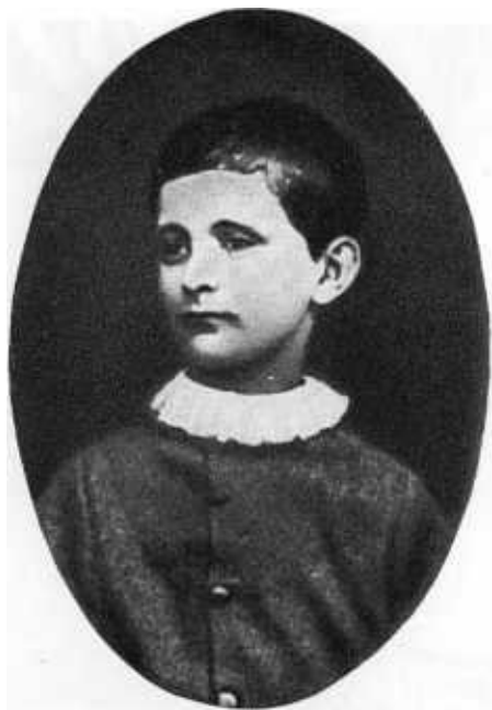
Ф. Э. Дзержинский в восьмилетнем возрасте.