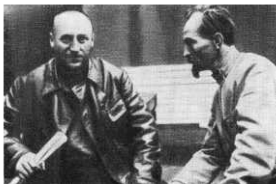
Ф. Э. Держинский и И. К. Ксенофонтов.