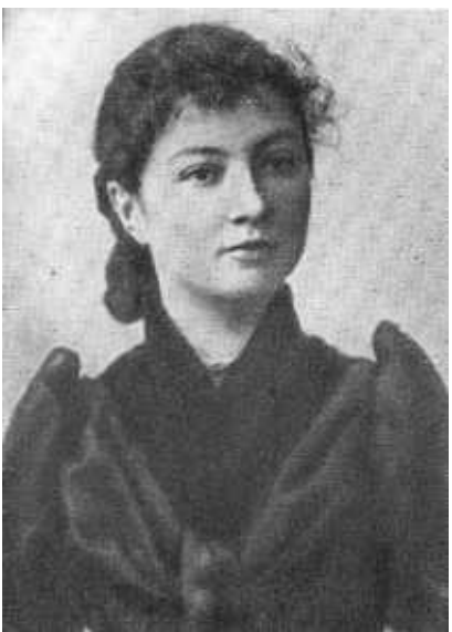
Старшая сестра Ф. Э. Дзержинского — Альдона.