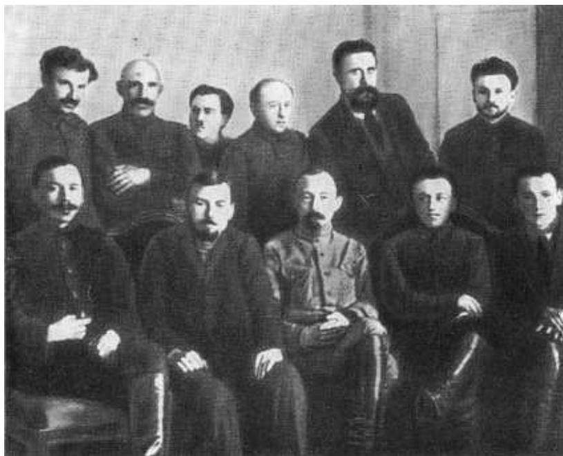
Коллегия ВЧК. 1919 г.