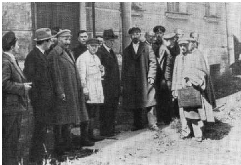
Ф. Э. Дзержинский в Ленинграде у здания Института прикладной химии НТО ВСНХ с группой ученых и сотрудников института. 1925 г.