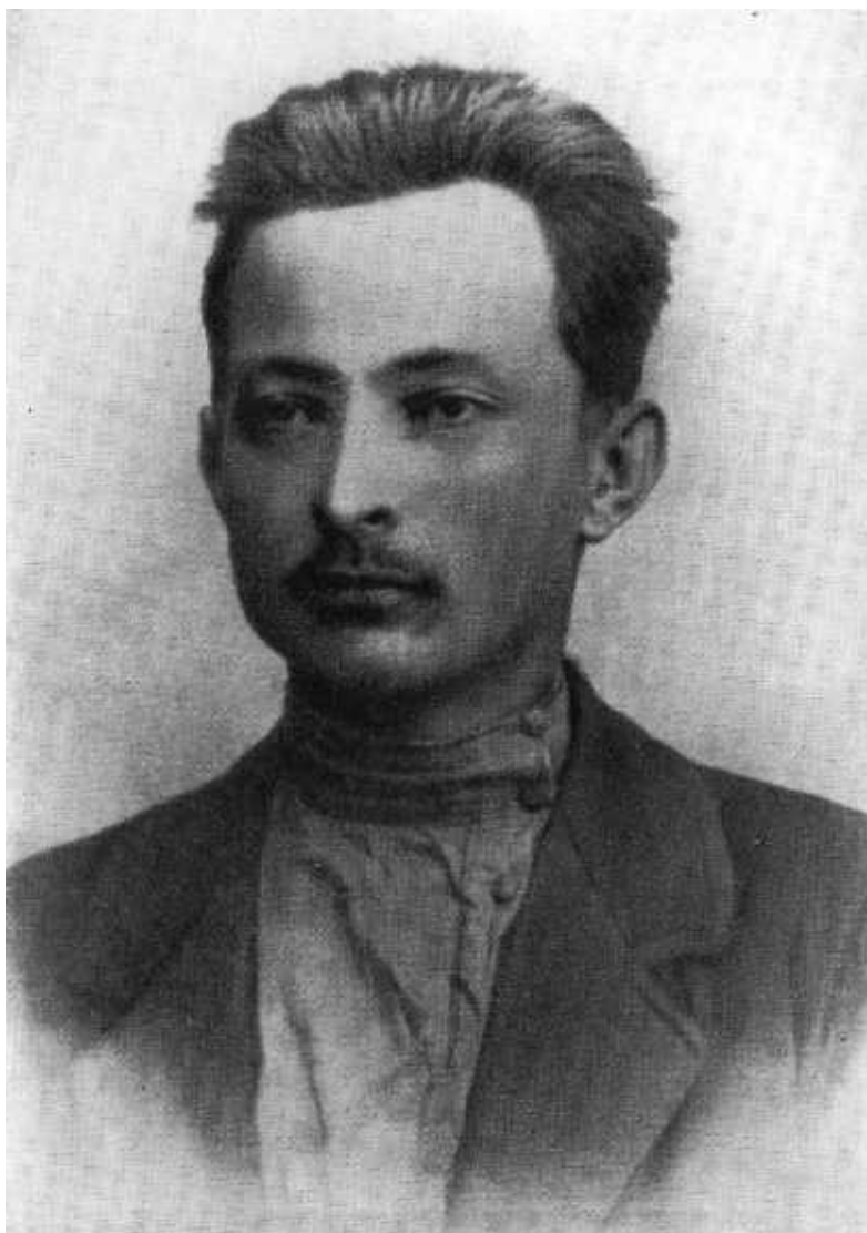
Ф. Э. Дзержинский в Седлецкой тюрьме. 1901 г.