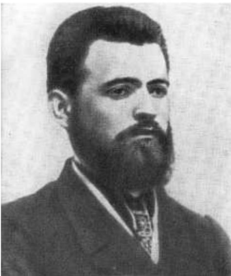
Отец, Эдмунд-Руфин Иосифович Дзержинский.