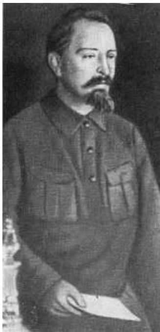
Ф. Э. Дзержинский. 1926 г.