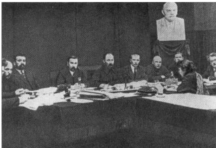
Ф. Э. Дзержинский на заседании Президиума ВСНХ. Февраль, 1924 г.