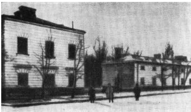
Х павильон Варшавской цитадели, в котором неоднократно содержался в заключении Ф. Э. Дзержинский.