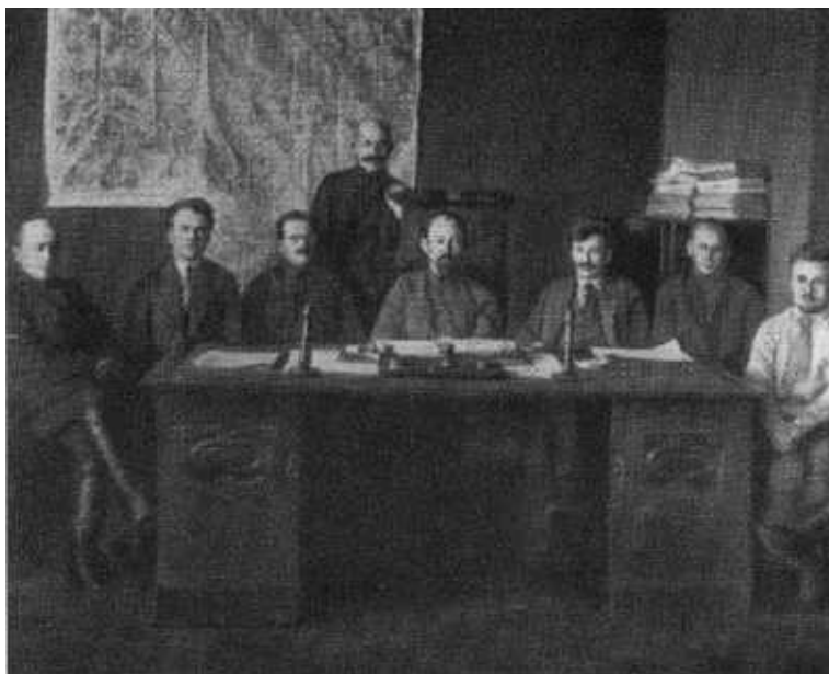
Коллегия ОГПУ. 1922 г. С. А. Мессинг, Я. Х. Петерс, И. С. Уншлихт, А. Я Бельный, Ф. Э. Дзержинский, В. Р. Менжинский, Г. И. Бокий, А. Х. Артузов.