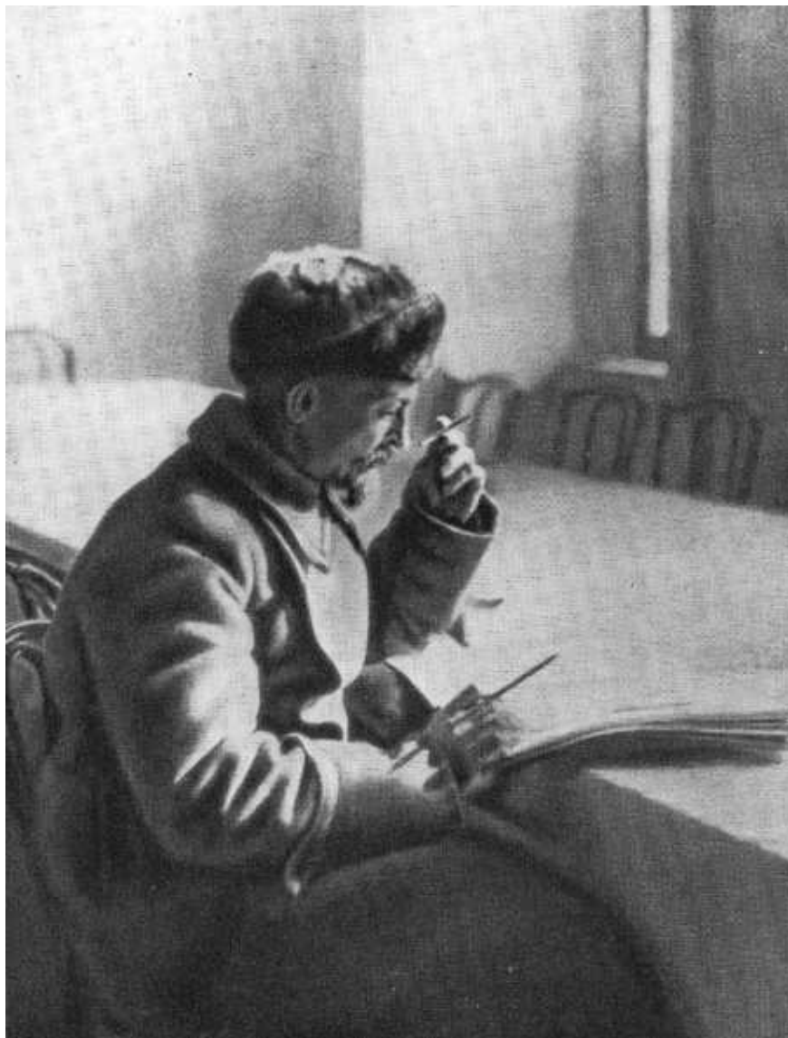
Наркомпутъ и Председатель ВЧК Ф. Э. Дзержинский во время поездки в Сибирь. 1922 г.