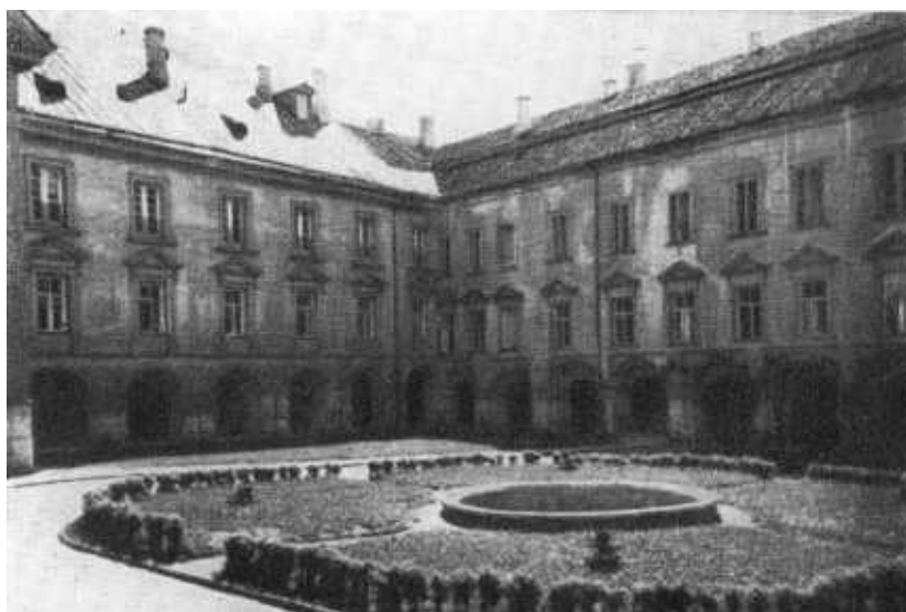
Здание 1-й виленской гимназии, где с 1887 по 1896 год учился Ф. Дзержинский.