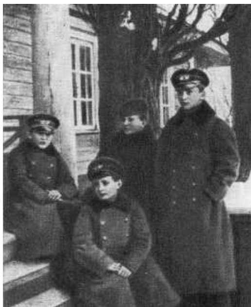
Ф. Э. Дзержинский (в центре) с матерью и братьями Казимиром (сидит слева) и Станиславом (стоит).