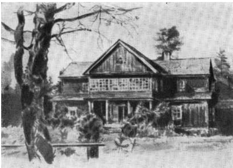
Дом в Держинове, а котором провел детские годы Ф. Э. Держинский.