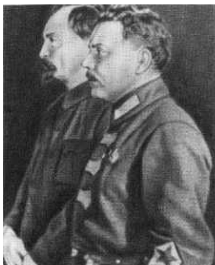
Ф. Э. Дзержинский и К. Е. Ворошилов у гроба Б. И. Ленина.