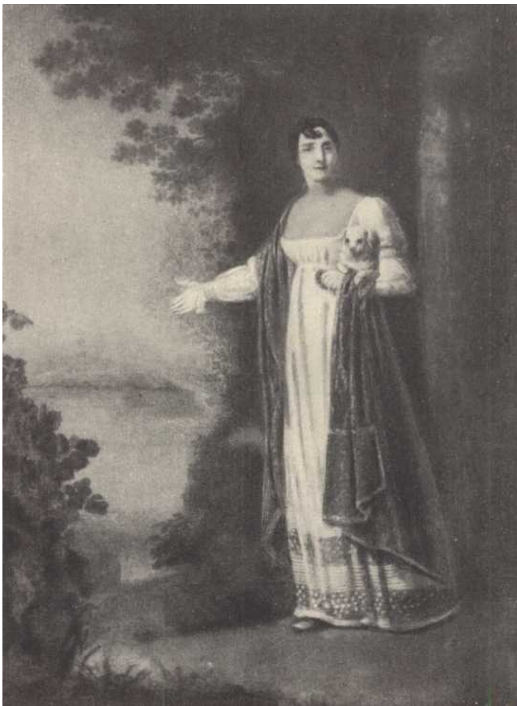
Дарья Алексеевна Державина. Портрет работы В. Л. Боровиковского.

Державин был в Таврическом дворце, но не в качестве гостя. Он писал хоры, исполнявшиеся на празднике, и следил за их исполнением. Потемкин поручил ему также сочинить описание торжества.