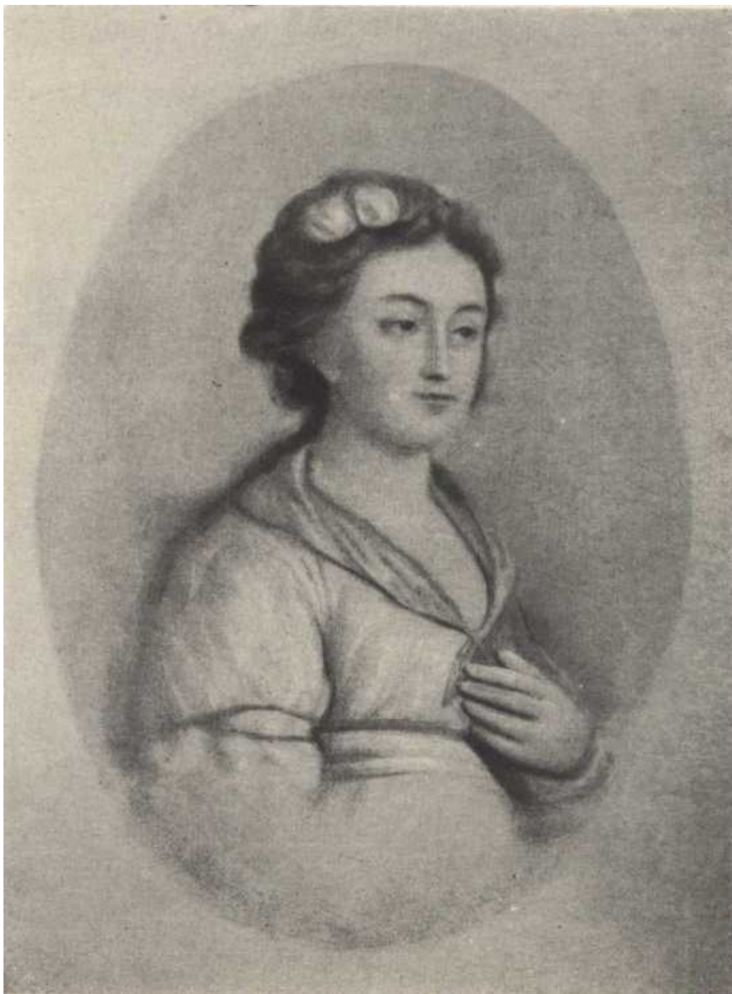
Екатерина Яковлевна Державина. Портрет работы В. Л. Боровиковского.

Ода «На смерть князя Мещерского», написанная в 1779 году, передает размышления Державина о жизни и смерти, навеянные тем, что довелось ему видеть и испытать. Поэта поражает мысль, что все люди на земле