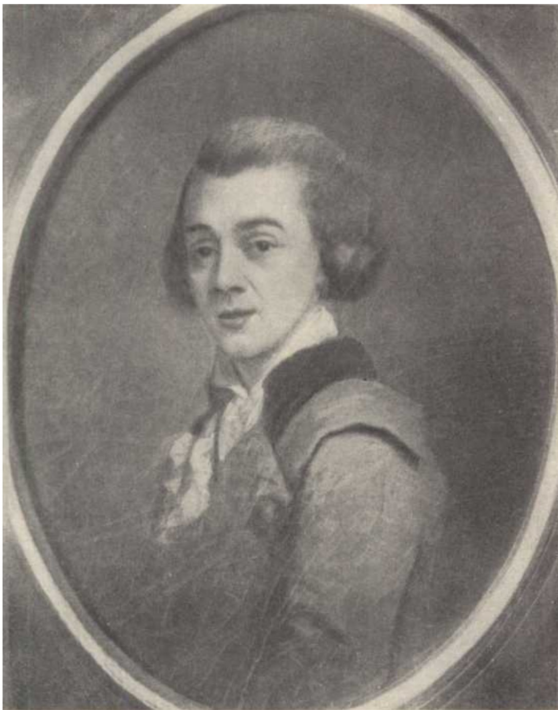
Николай Александрович Львов. Портрет работы Д. Г. Левицкого.