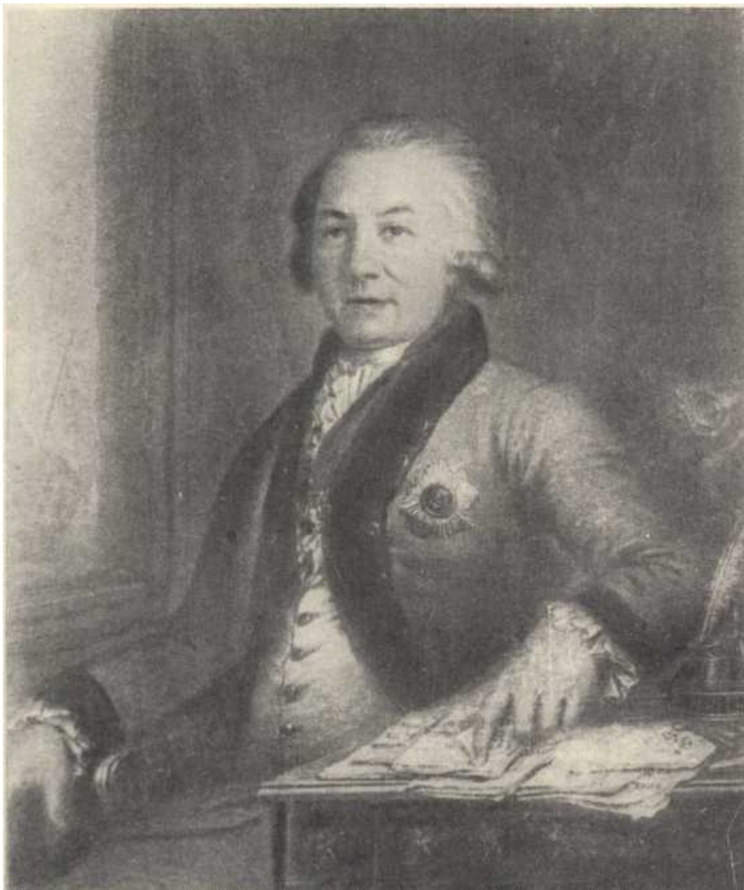
Гавриил Романович Державин. Портрет работы В. Л. Боровиковского.