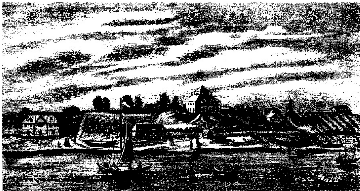
«Званка» — усадьба Державина.

Чего в мой дремлющий тогда не входит ум? Мимолетящи суть все времени мечтанья: Проходят годы, дни, рев морь и бурей шум, И всех зефиров повеванья.