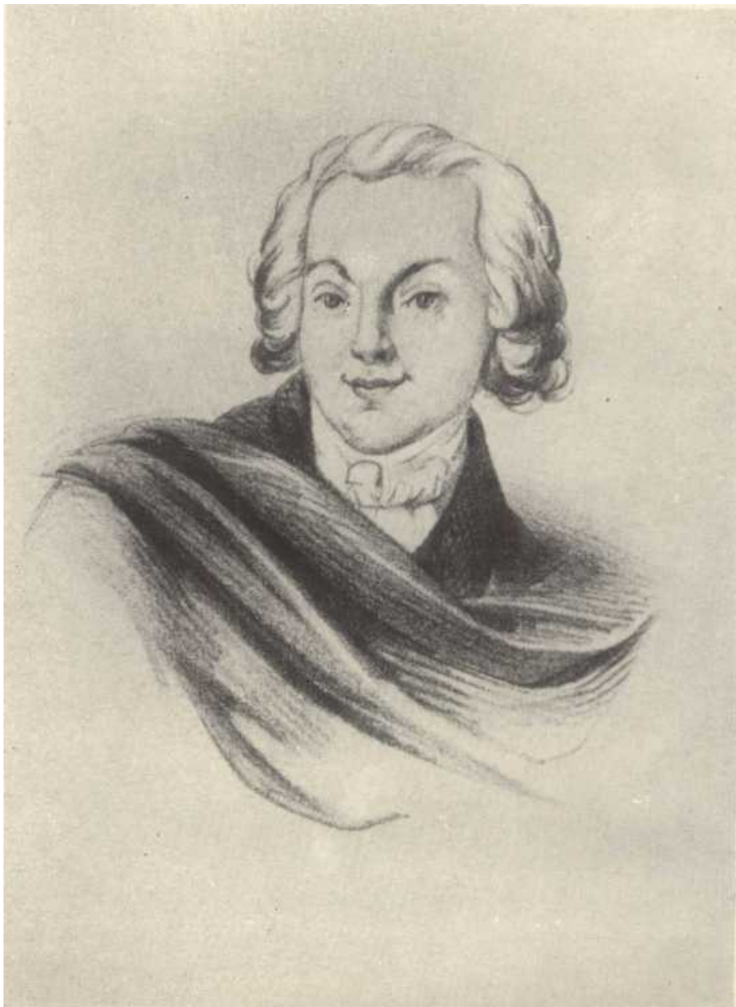
Василий Васильевич Капнист. Литография В. Ф. Тимма.

Одним из них было, например, начатое против Державина «Дело о медведе», как оно именовалось в казенных бумагах.