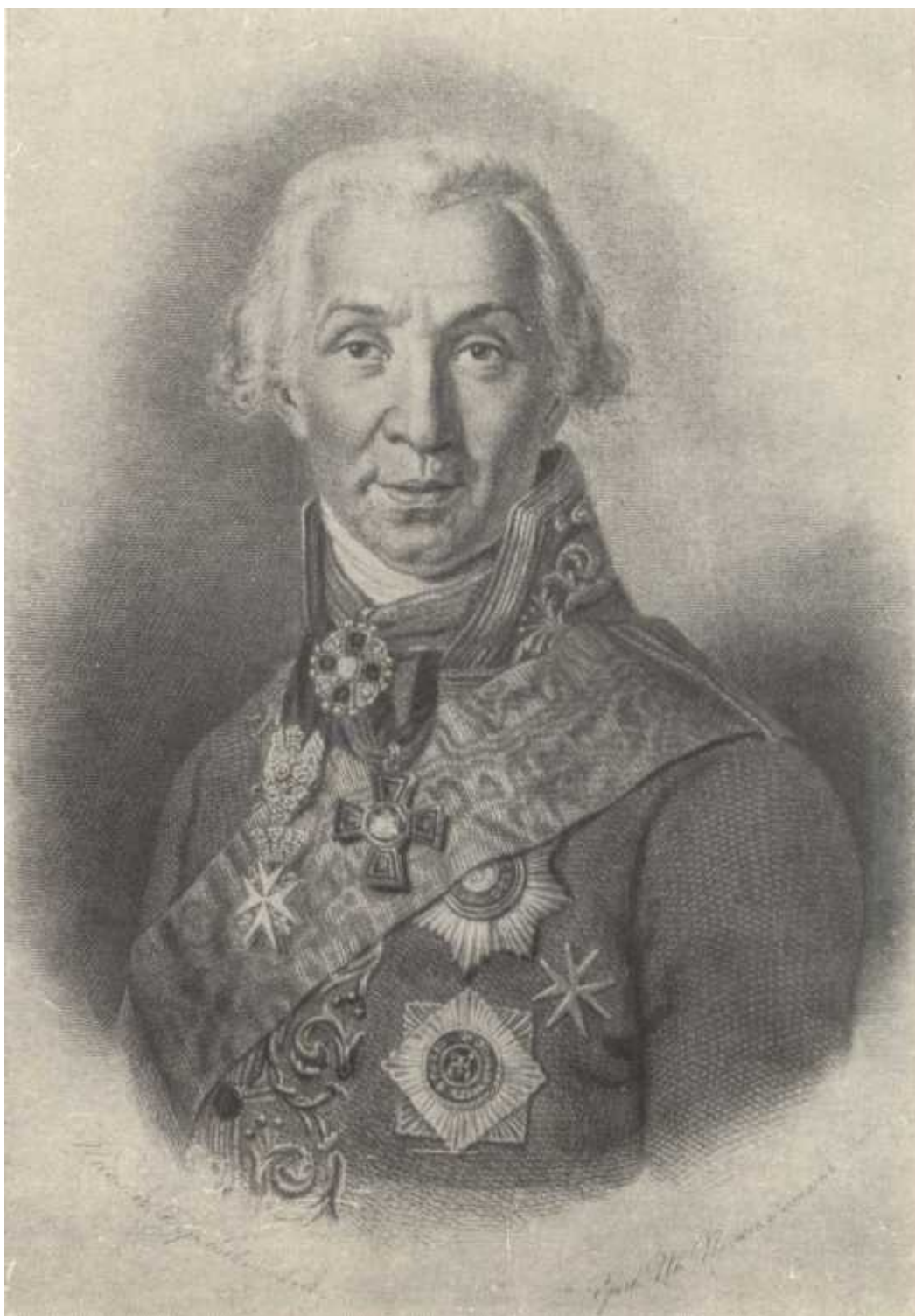
Гавриил Романович Державин. Портрет работы В. Л. Боровиковского.

Державин не одобрял этой реформы, но принялся трудиться с обычной энергией и добросовестностью. Распорядок его дня свидетельствует об этом. Державин садился за стол в пять часов утра, с семи-восьми начинал