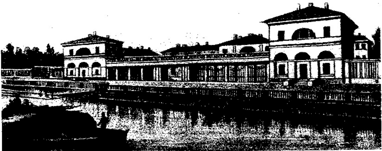
Дом Державина в Петербурге на берегу Фонтанки.