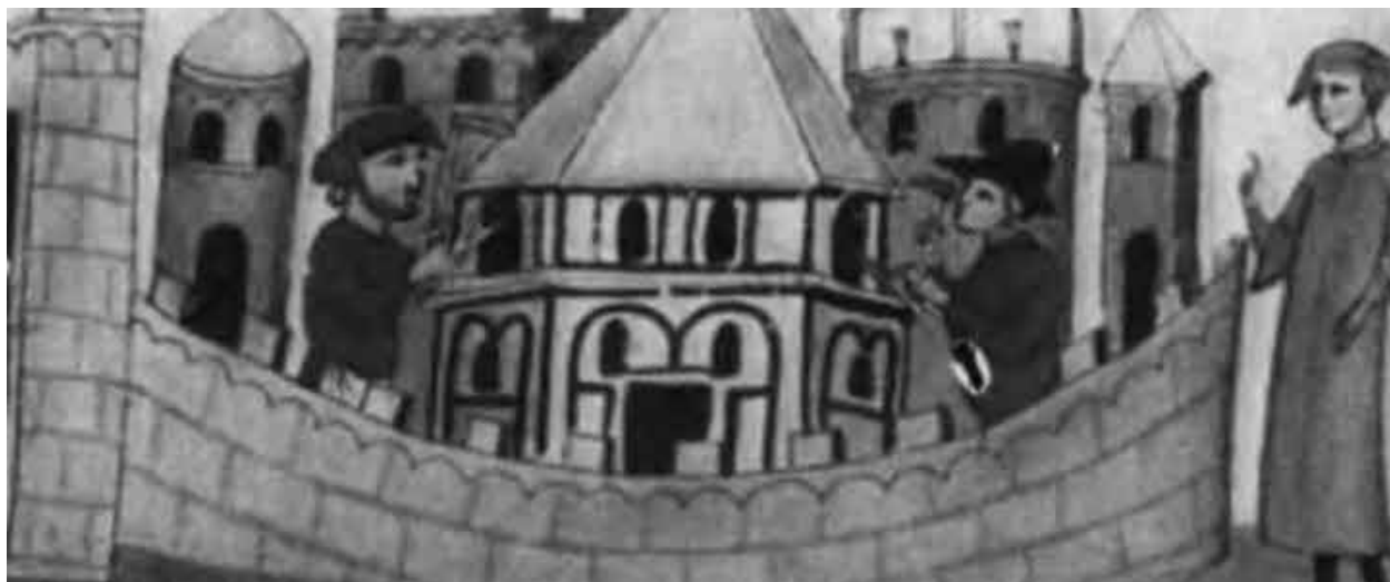
Постройка храма Марса (впоследствии баптистерий Сан Джованни).