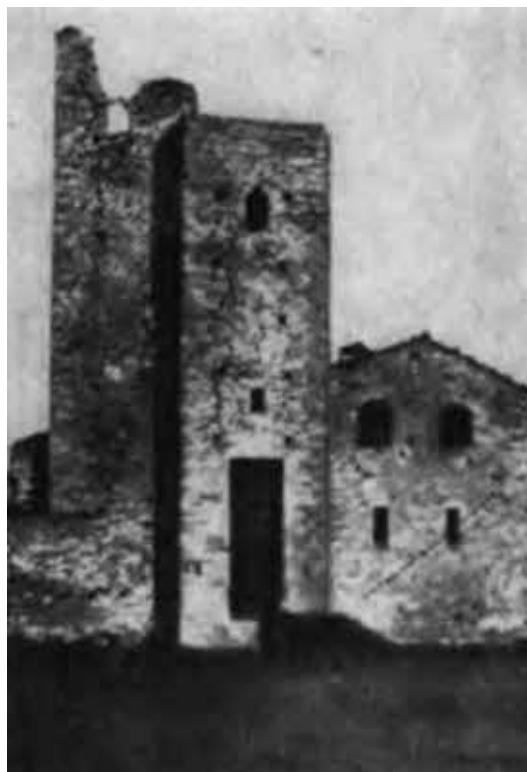
Башня Данте в замке Ромена.