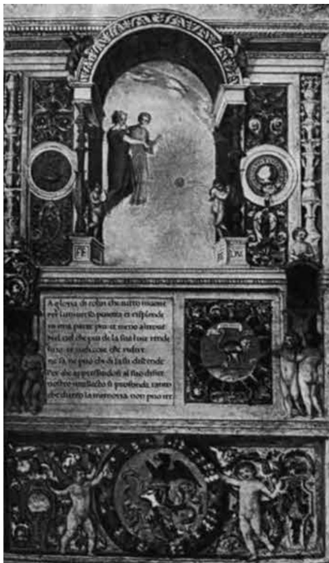
Первая страница рукописного списка «Рая» с миниатюрами Кловио (библиотека Ватикана).