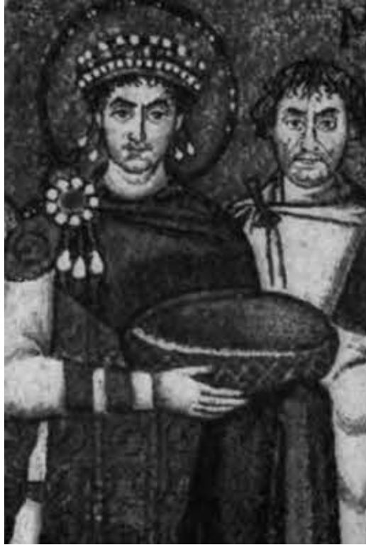
Император Юстиниан. Фрагмент фрески.