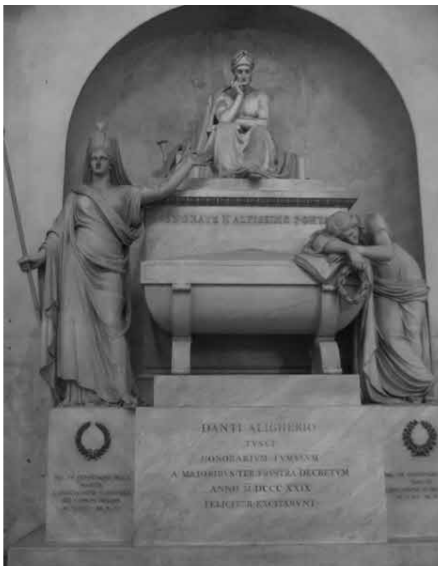
Памятник Данте в Санта Кроче работы С. Риччи (1829 г.)