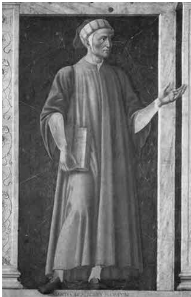
Андреа дель Кастаньо. Портрет Данте в Сан Аполлония (Флоренция).