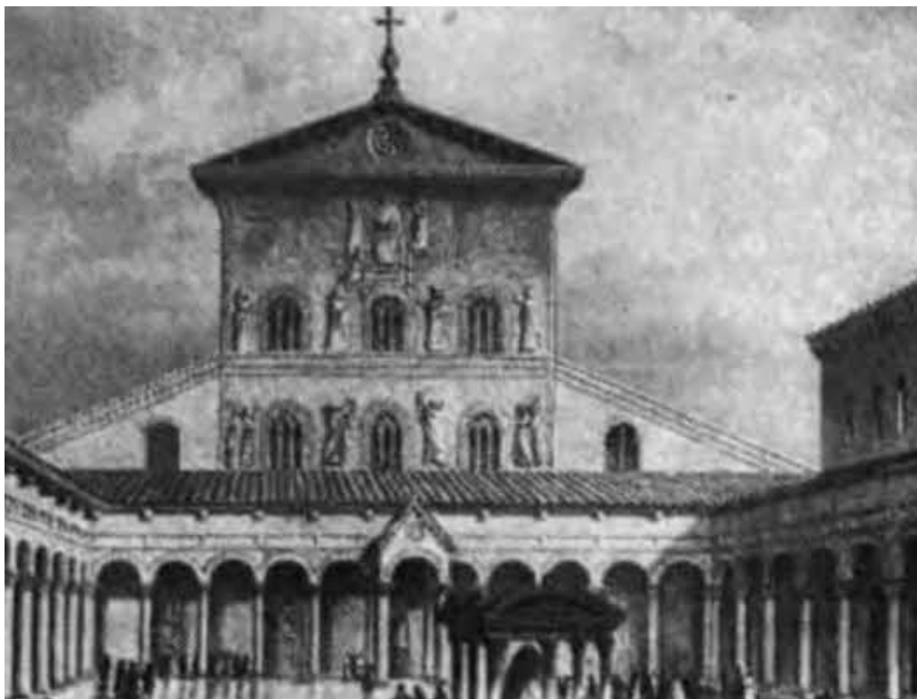
Базилика в Ватикане.