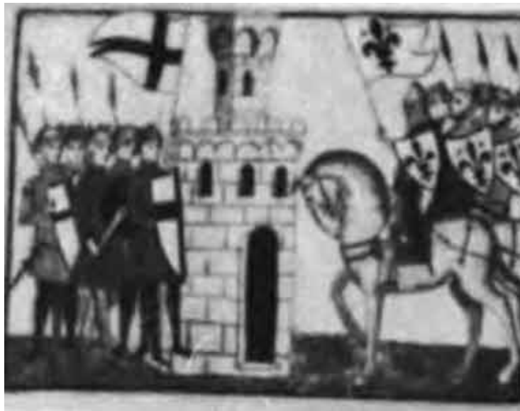
Бунт грандов 1295 г.