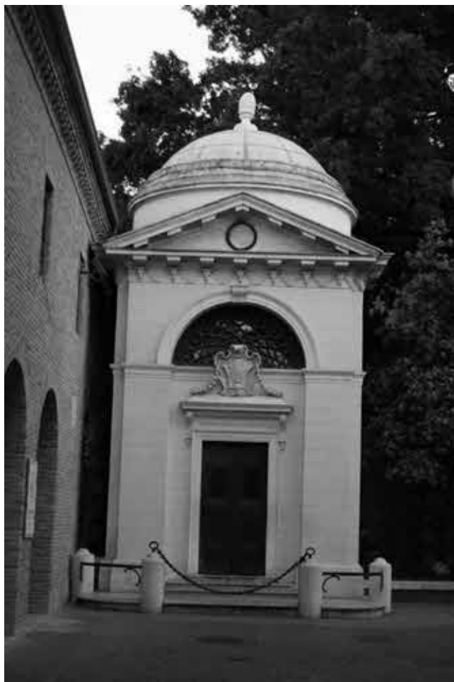
Мавзолей Данте в Равенне (XV в.).