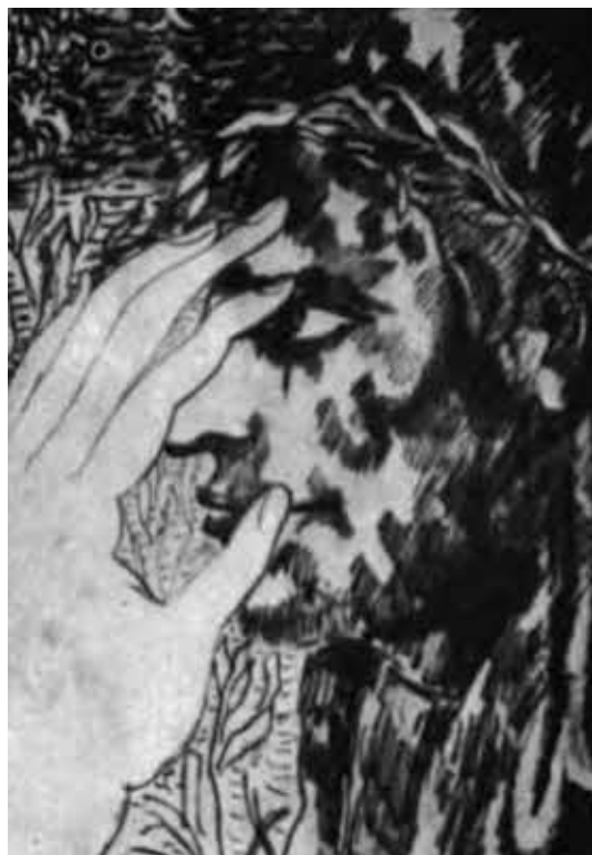
Карло Леви. Данте в Чистилище (песнь I, 43–51).