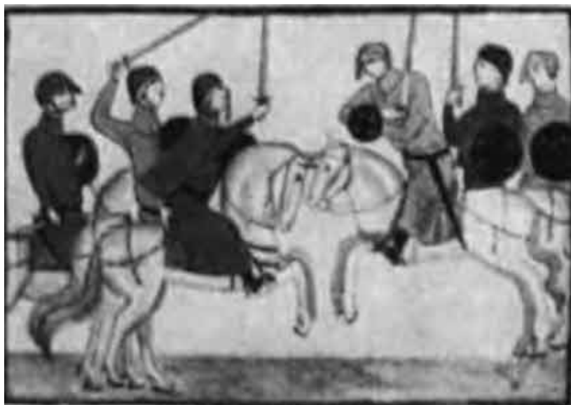
Стычка черных и белых гвельфов