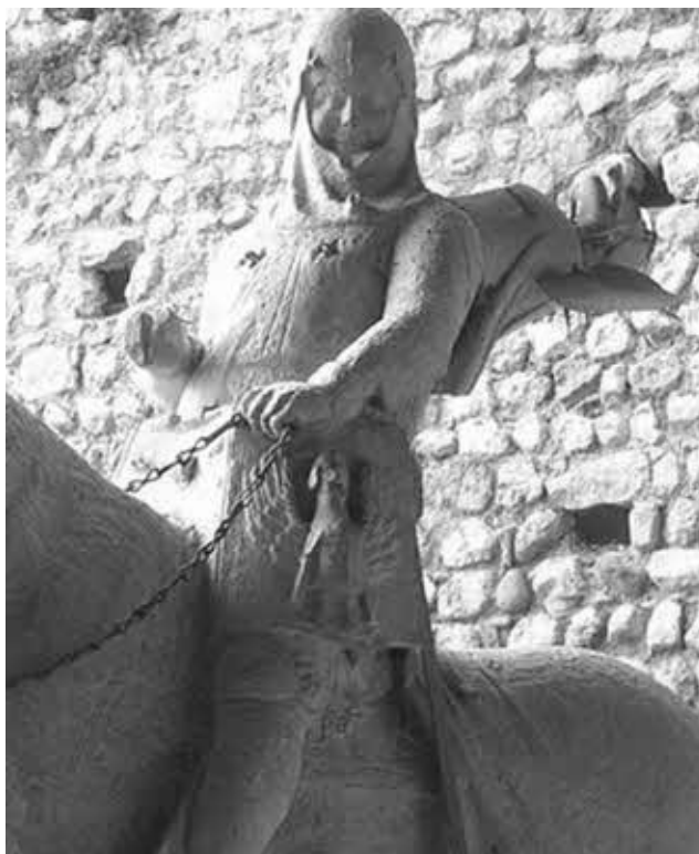
Кан Гранде делла Скала. Фрагмент конной статуи. Верона.