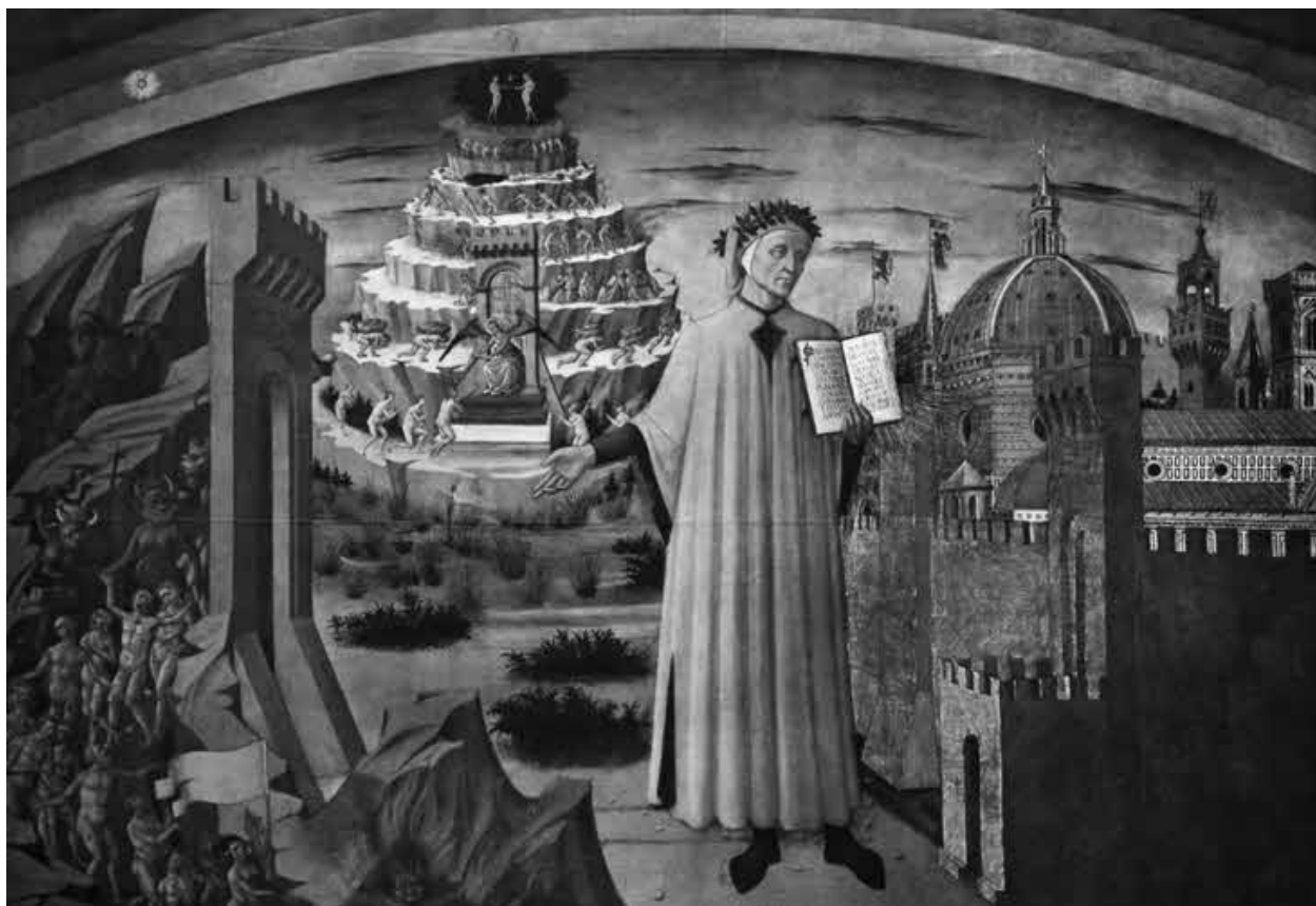
Доменико ди Франческо (Микелино). Данте и его творение (XV в). Фреска в Санта Мария дель Фиоре. (Флоренция.)