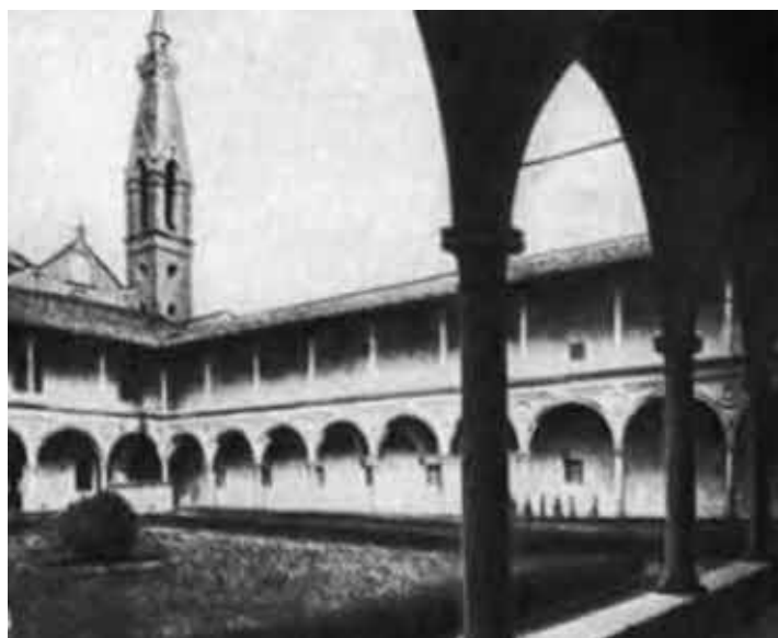
Двор аббатства Сайта Кроче. Флоренция.