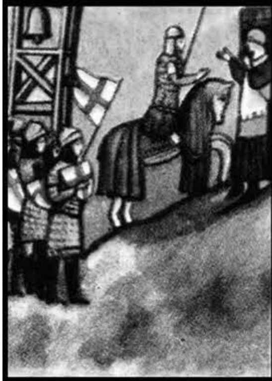
Победа гибеллинов при Монтаперти в 1260 г.