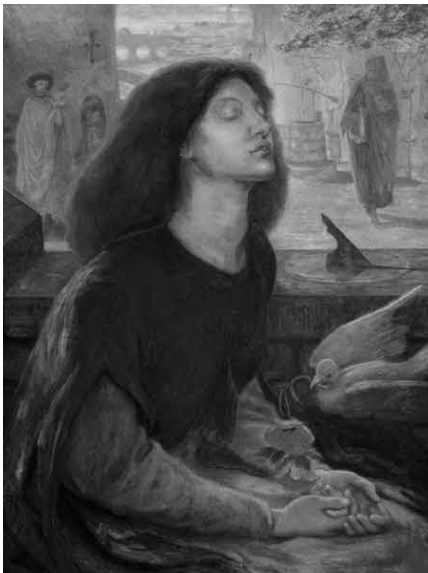
Д. Г. Россети. Благословенная Беатриче.