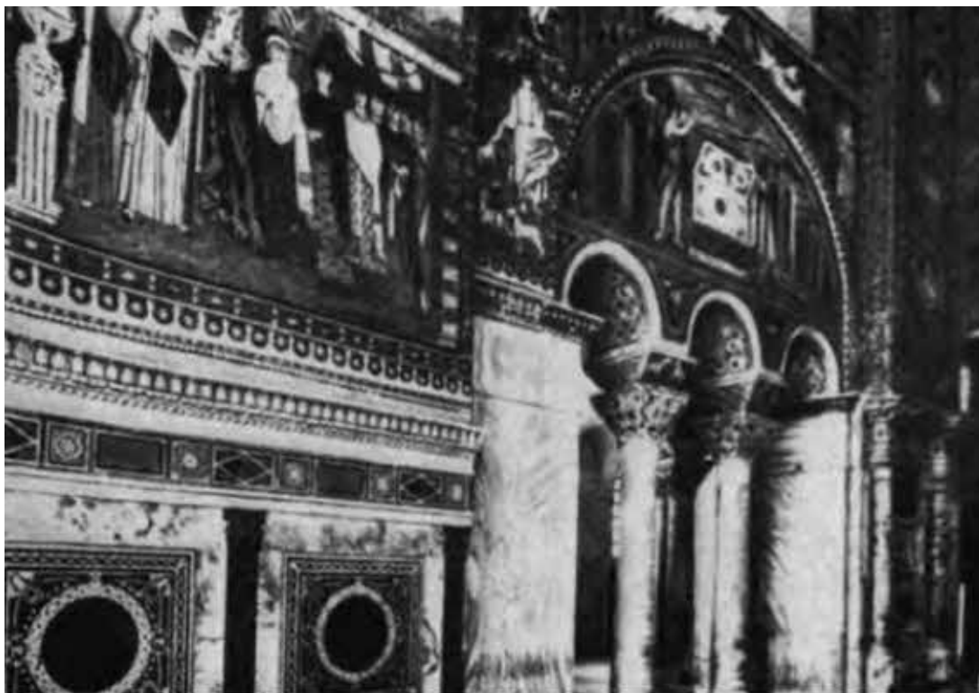
Равенна. Собор Сан Витале. Слева вверху на мозаичной фреске — императрица Феодора