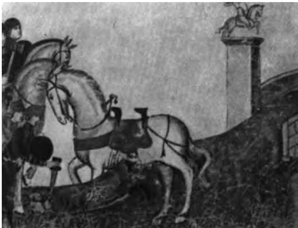
Убийство Буондельмонте на Старом мосту (начало распри гвельфов и гибеллинов).