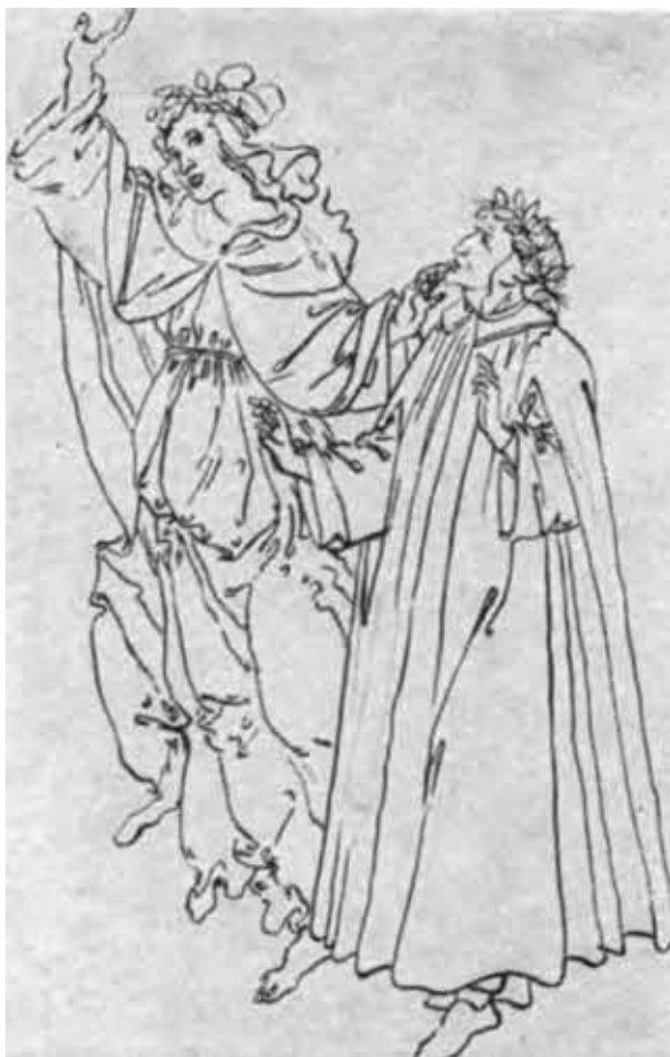
С. Боттичелли. Беатриче и Данте в Раю.