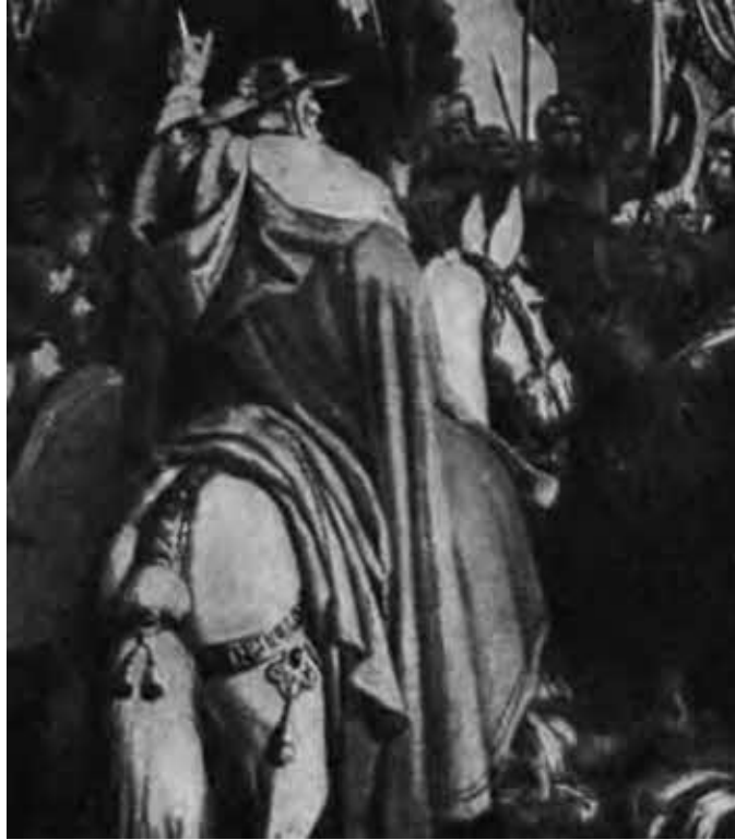
Дж. Беццуоли (XIX в.). Папский легат проклиняет короля Манфреда, павшего в битве при Беневенте. Фрагмент картины. (Музей Беневента.)