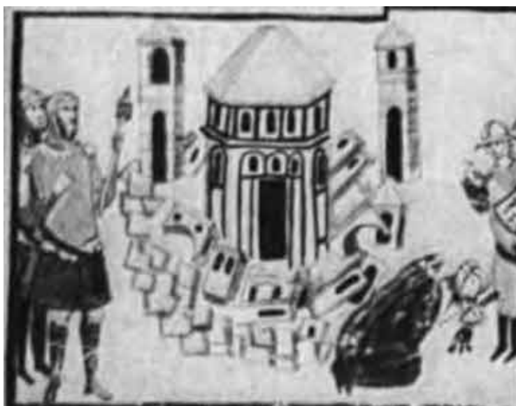
Разрушение города Тотилой.