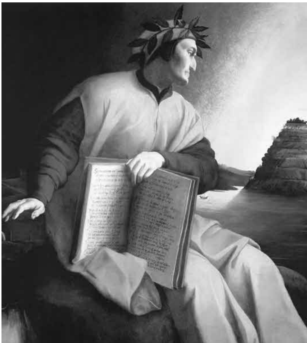
Портрет Данте работы неизвестного флорентийского живописца XVI в. (Национальная галерея Вашингтон.)