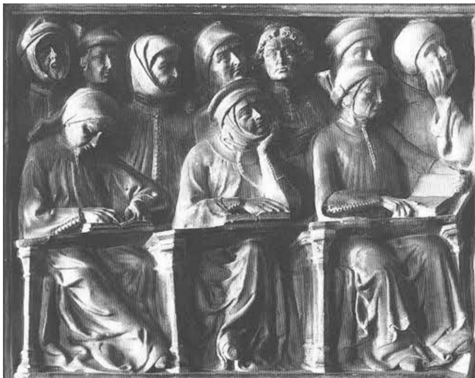
Болонские студенты. В первом ряду — Данте и Чино да Пистоия. Деталь надгробного памятника Джованни да Леньяно.