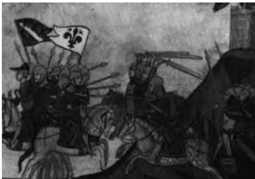
Битва гвельфов и гибеллинов. Миниатюра Киджаиского кодекса.