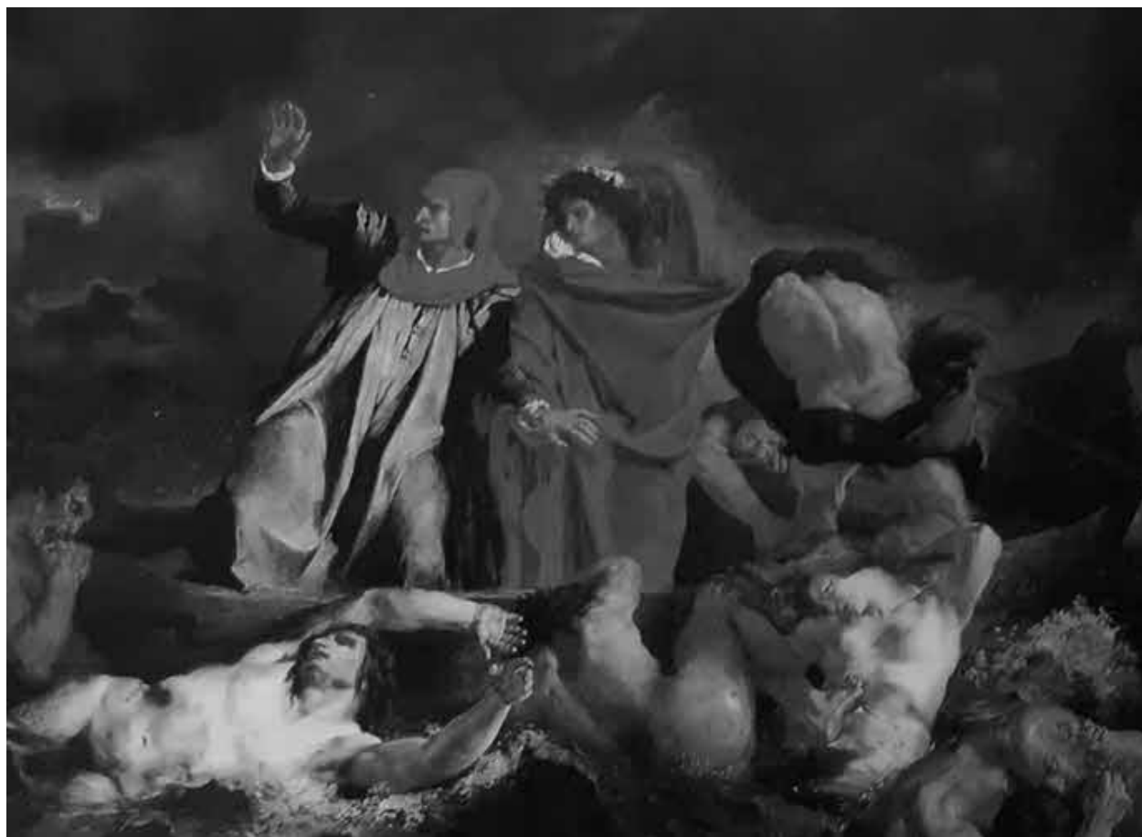
Э. Делакруа. Данте и Вергилий