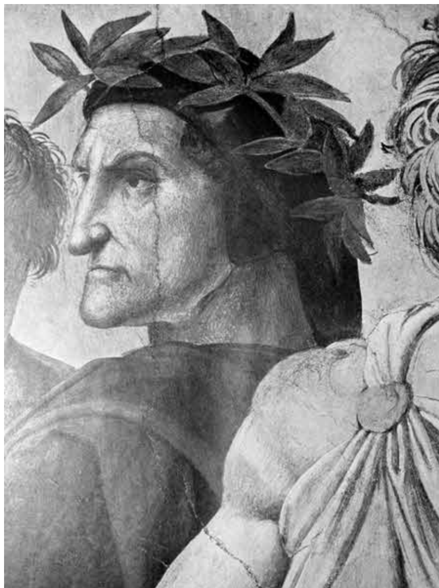
Рафаэль. Портрет Данте. Фрагмент фрески «Диспут». (Ватикан.)