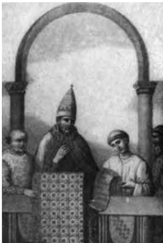
Джотто. Папа Бонифаций VIII в юбилейный 1300 г. (Рим, Латеран, церковь Сан Джованни).