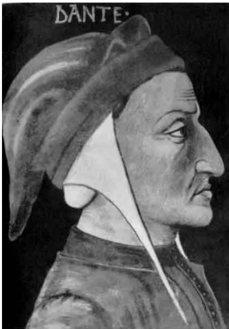
Портрет Данте, приписываемый Джованни дель Понте. (Флоренция, библиотека Риккардиана.)