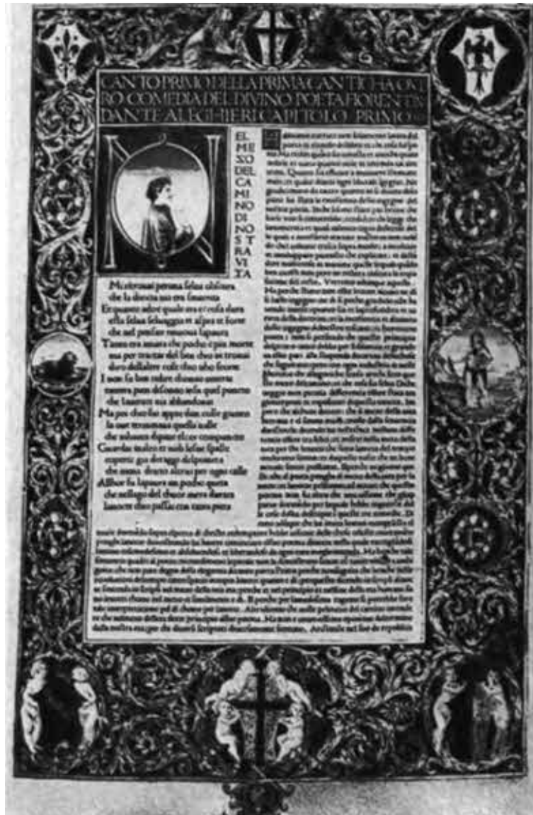
Первая страница флорентийского издания «Божественной Комедии» 1481 г. с комментариями Кристофора Ландино.