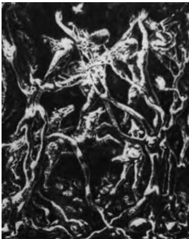
Перикл Фаццини. Лес самоубийц.