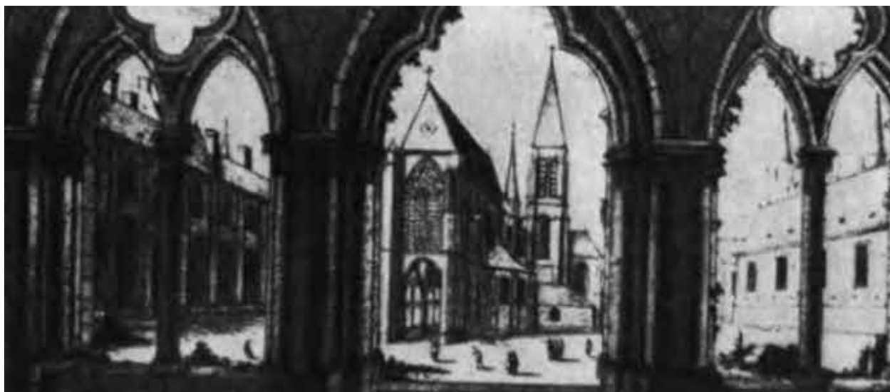
Замок тамплиеров в Париже. Внутренний двор