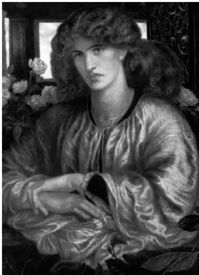
Д. Г. Россети. Сострадательная Дама последних глав «Новой Жизни».