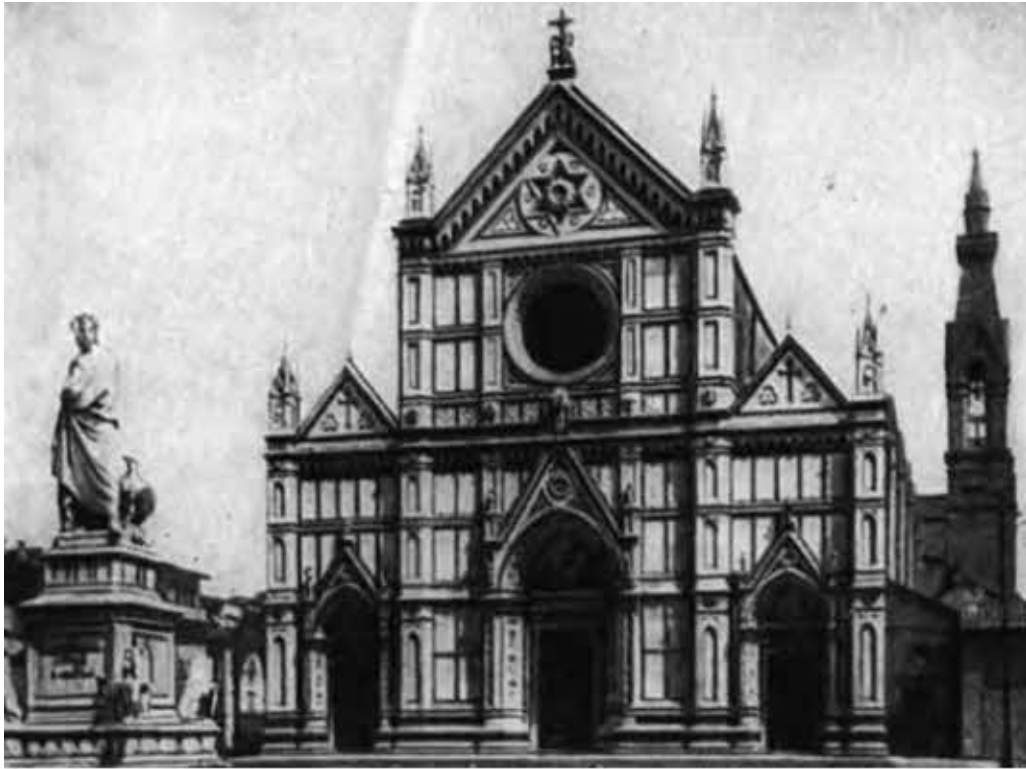
Санта Кроче. Флоренция