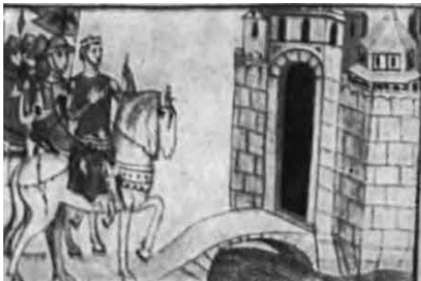
Осада Флоренции Генрихом VII.