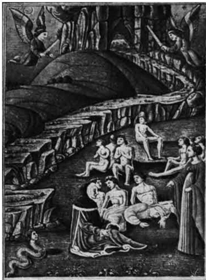
Сон Данте у входа в Чистилище. Миниатюра из латинской рукописи «Божественной Комедии». (Рим, библиотека Ватикана.)