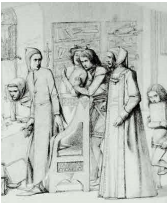
Д. Г. Россети. Иллюстрация к главе XXXIV «Новой Жизни»