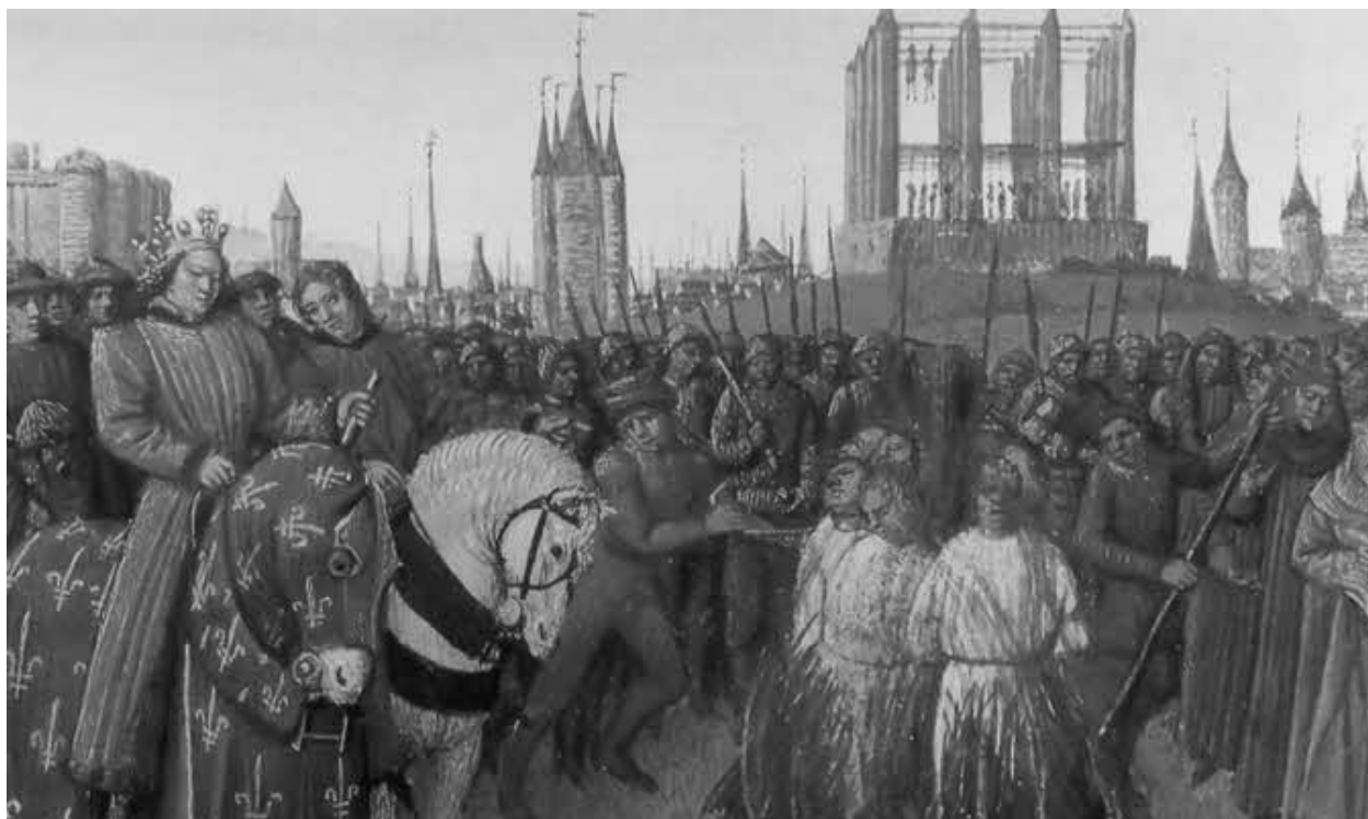
Казнь тамплиеров в Париже при Филиппе Красивом