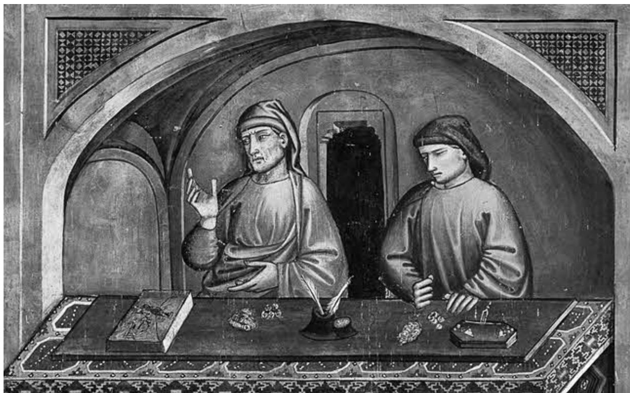
Лавка флорентийского менялы. С фрески Никколо ди Пьеро Джерини (Прато, Сан Франческо).