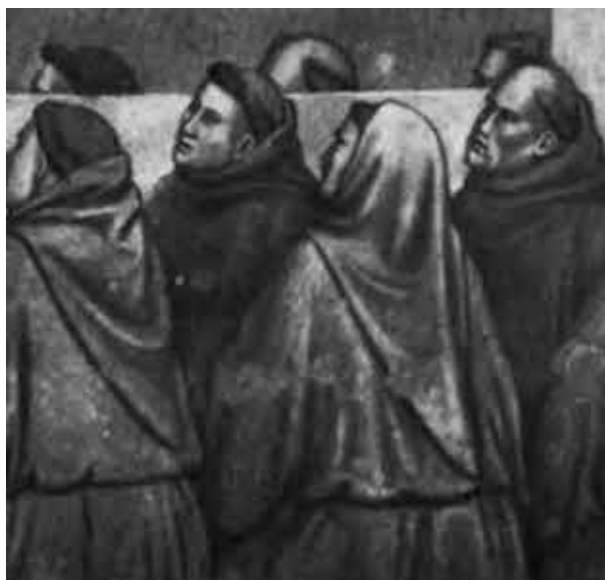
Джотто. Братья минориты. Фрагмент фрески в Санта Кроче во Флоренции.