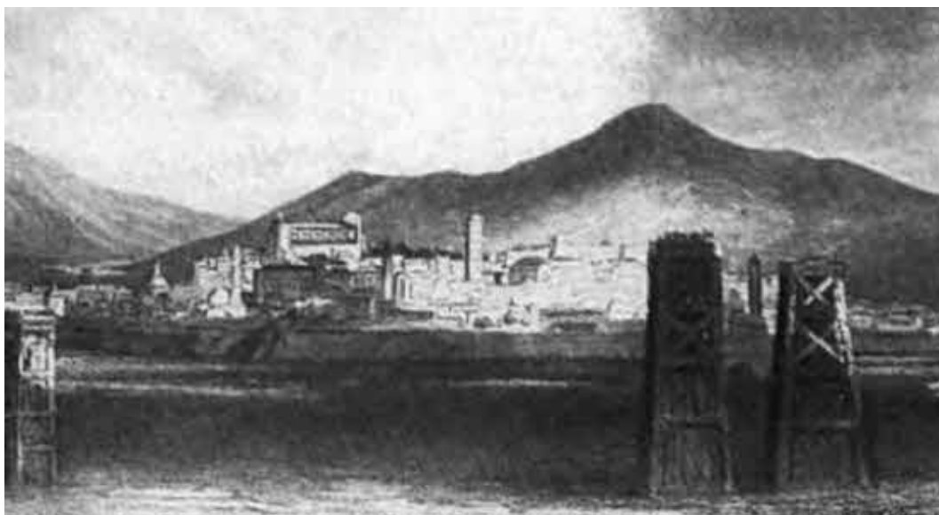
Осада Ареццо флорентийцами в 1289 г.