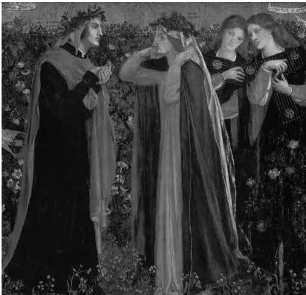
Д. Г. Россети. Данте и Беатриче в Земном Раю