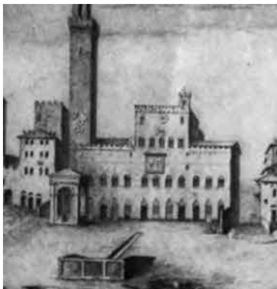
Сьена. Пьяццо дель Кампо.