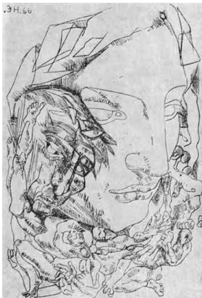
Э. О. Неизвестный. Данте и Вергилии в аду.