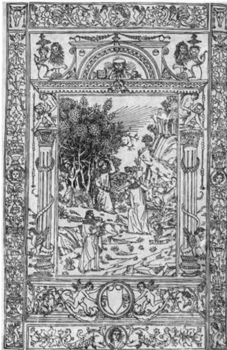
Данте. Вергилий и три зверя. Страница венецианского издания поэмы Данте 1493 г. Маттео Калказа. (Ленинград, БАН.)