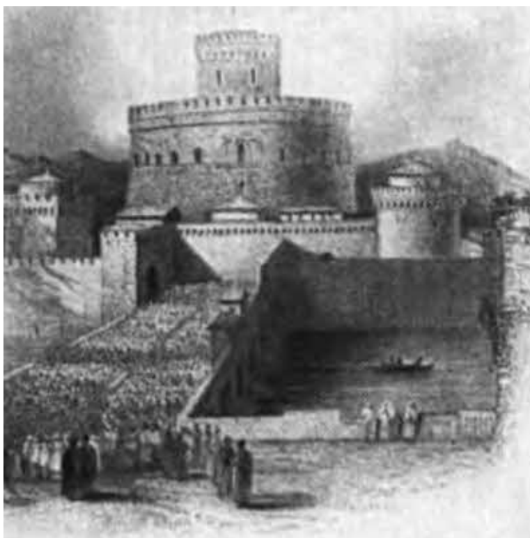
Рим. Замок св. Ангела.