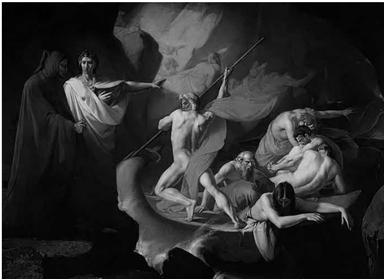
К. П. Померанцев. Харон перевозит души умерших (1863 г.). (Горьковский художественный музей.)