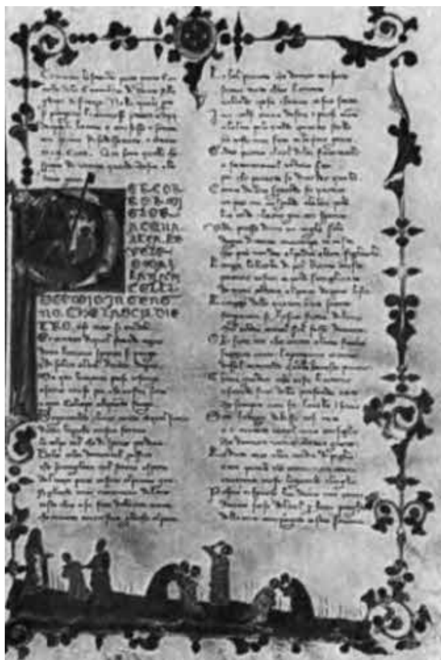
Первая страница рукописного списка «Чистилища». (Милан, библиотека Тривульциана.)