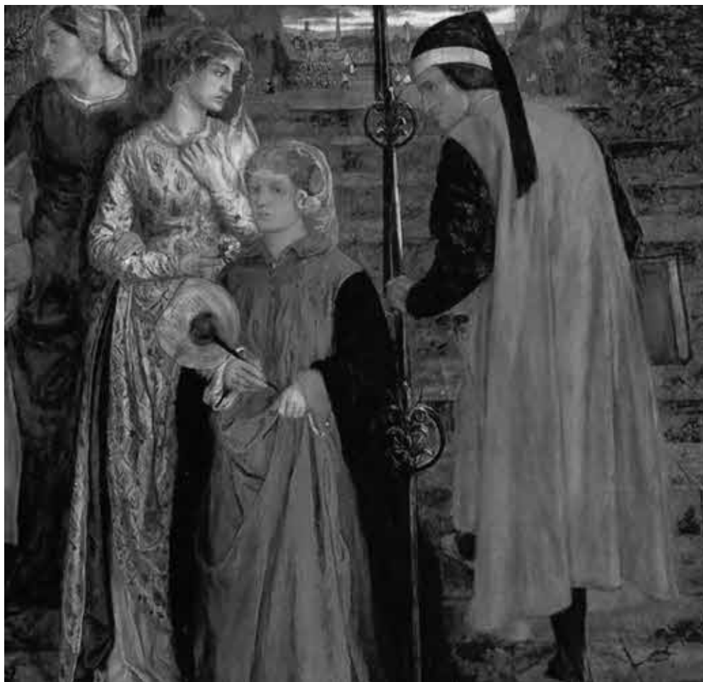
Д. Г. Россети Встреча Данте с Беатриче на улице Флоренции.