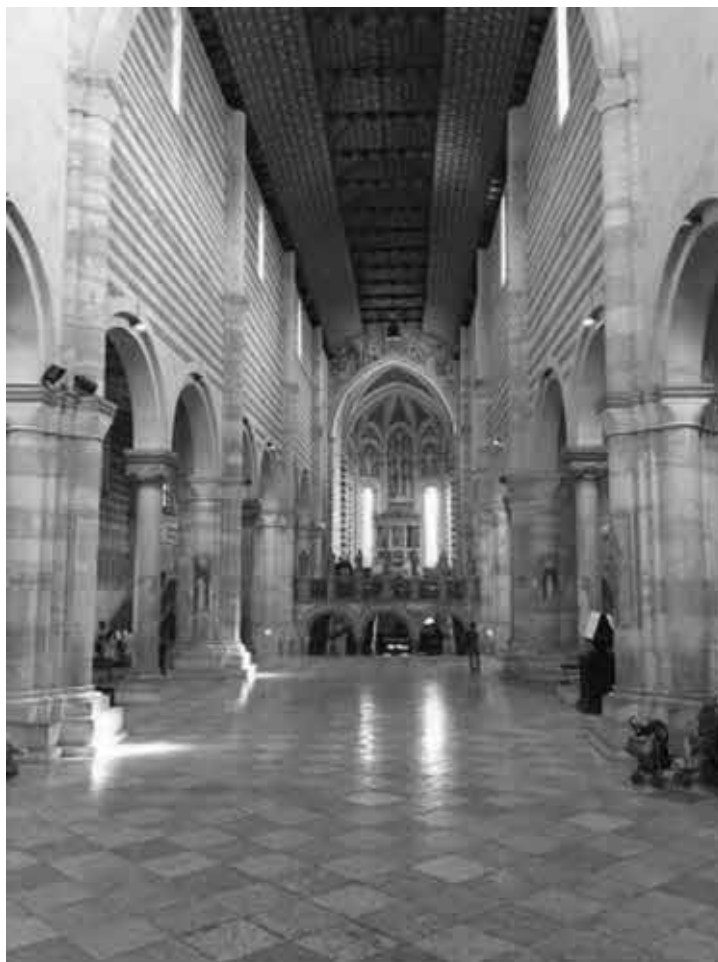
Базилика аббатства Сан Дзено Интерьер.