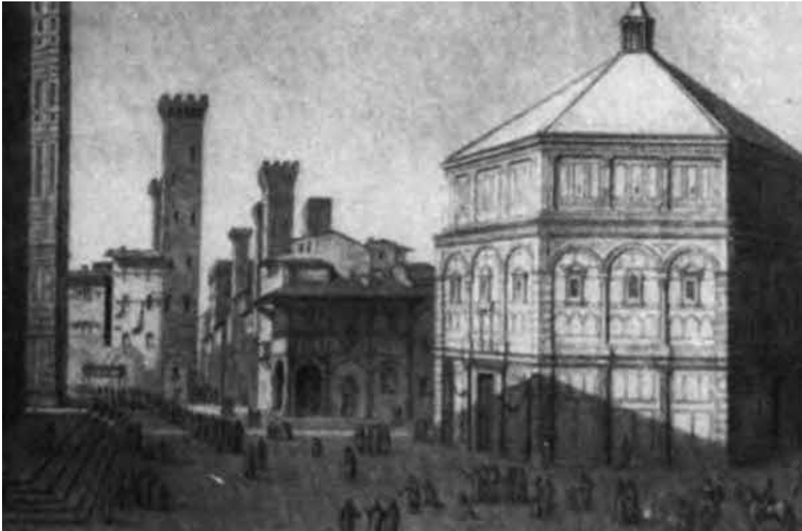
Баптистерий Сан Джованни — «там, где крещение принимал ребенком»