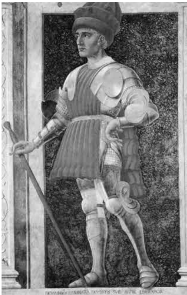
Андреа дель Кастаньо. Фарината дельи Уберти. (Флоренция. Салл'Аполлония.)