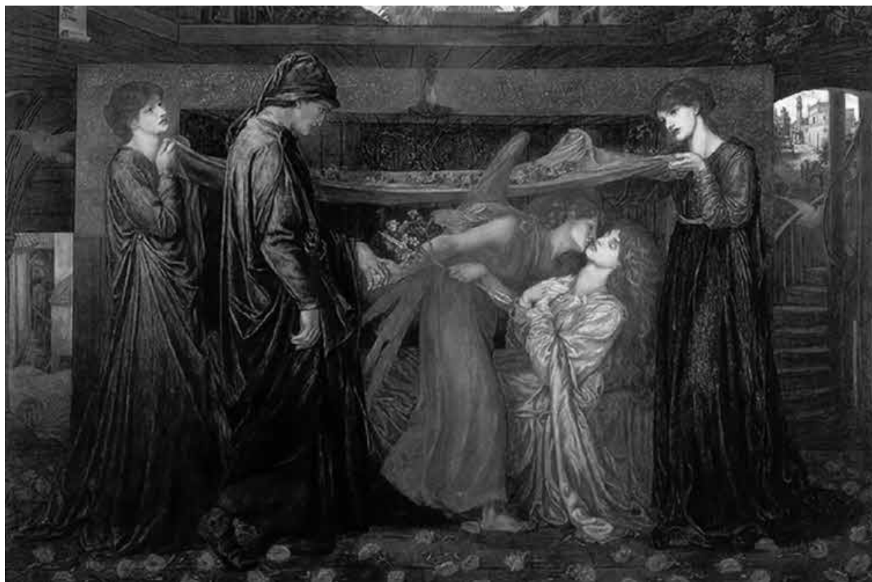
Д. Г. Россети. Сон Данте (смерть Беатриче)