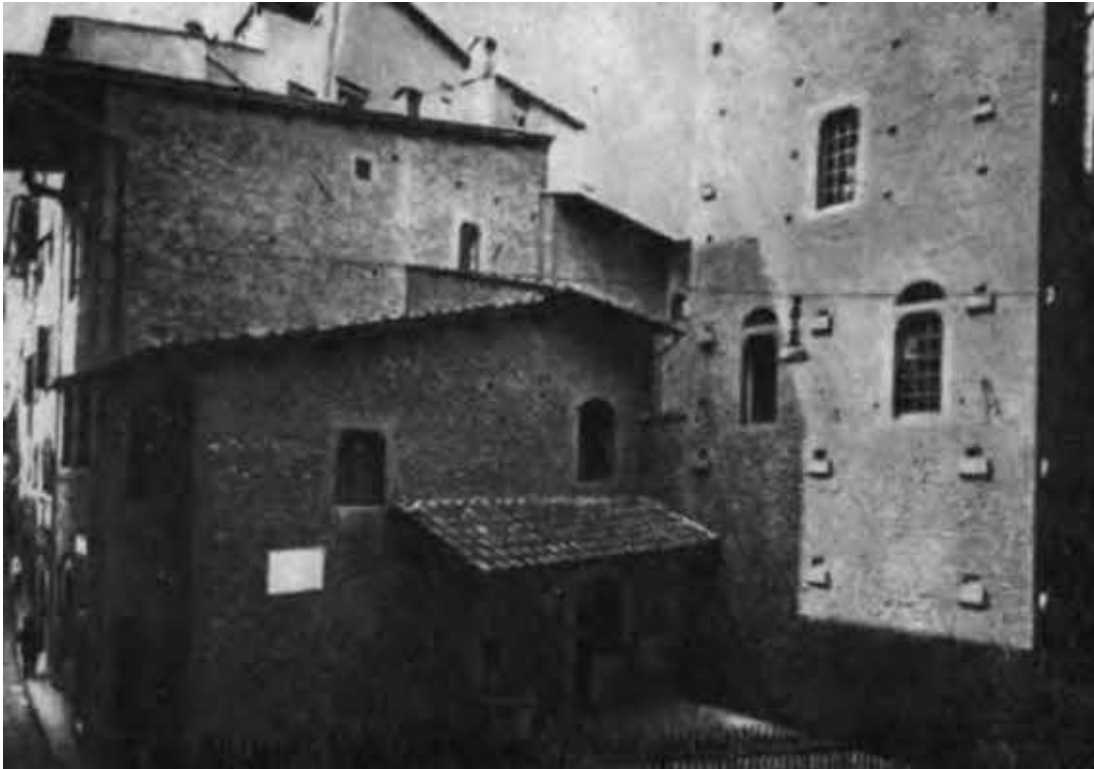
Дом семьи Алигьери, где родился Данте. Реставрация.