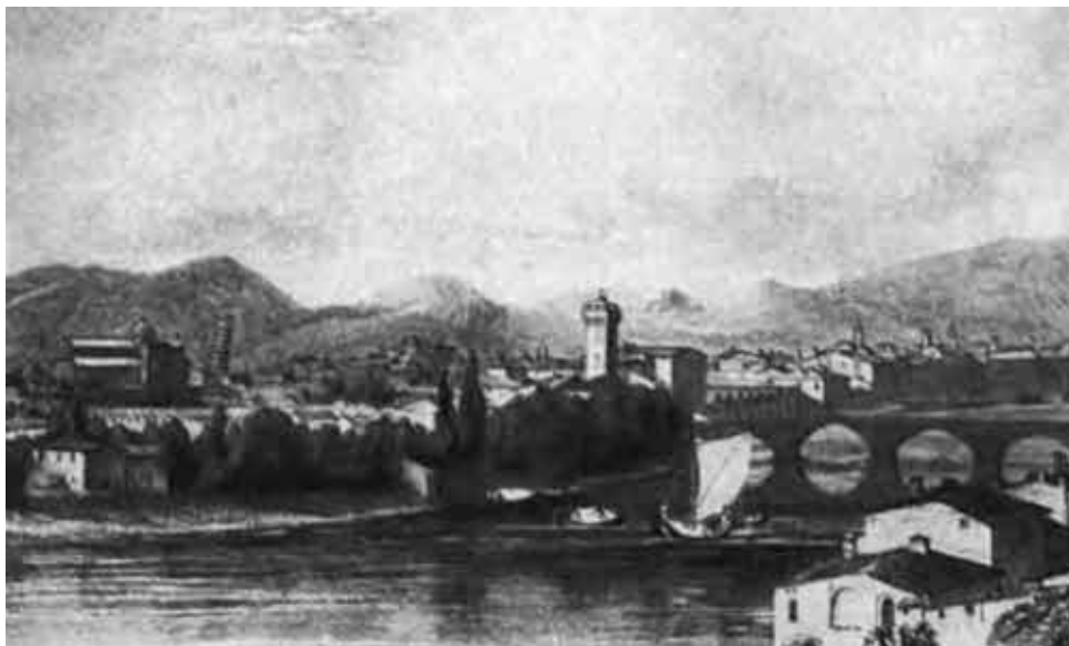
Пиза. Мост через Арно