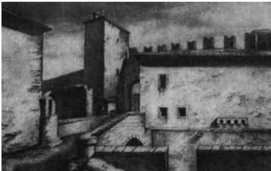
Улица Зеленого мяча в Вероне.