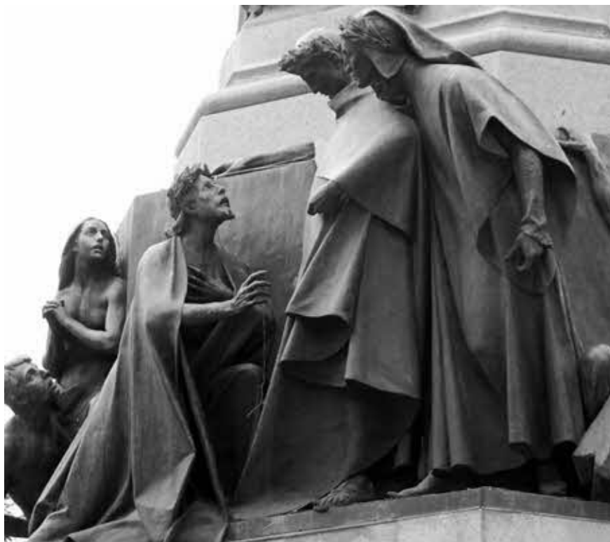
К. Дзокки. Встреча Данте с Сорделло. Деталь памятника Данте в Тренто (XIX в.).