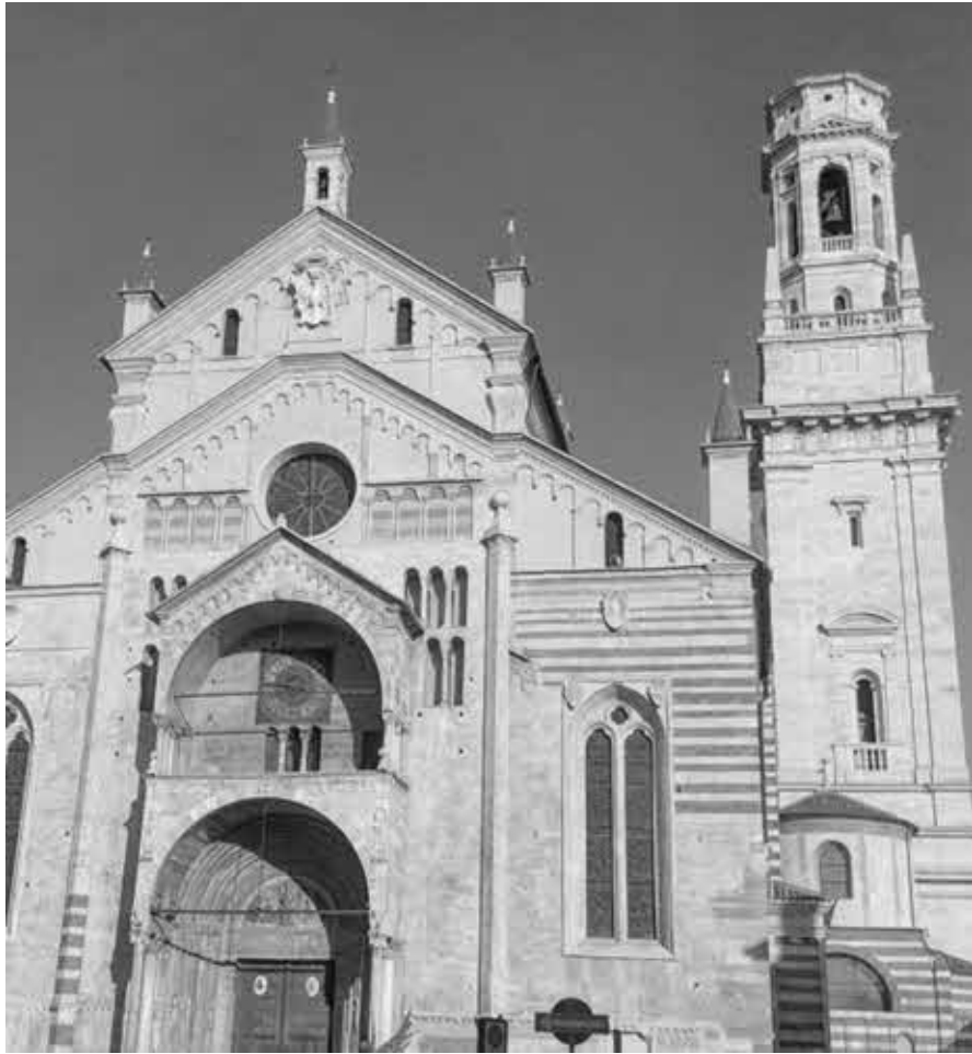
Верона. Кафедральный собор.