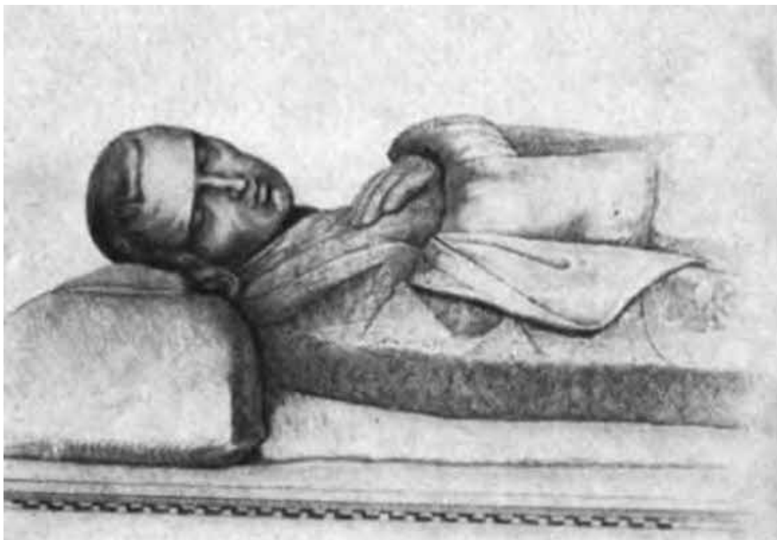
Тино да Камаино (XIV в.). Генрих VII. Деталь саркофага в Пизе (Кампосанто).