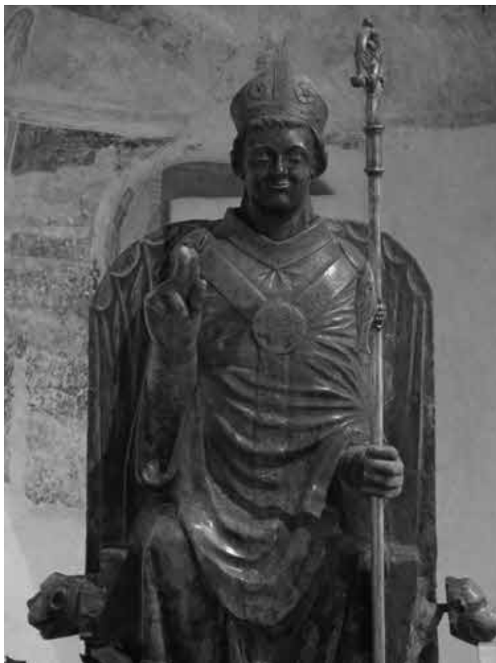
Верона. Аббатство Сан Дзено. Основатель обители.