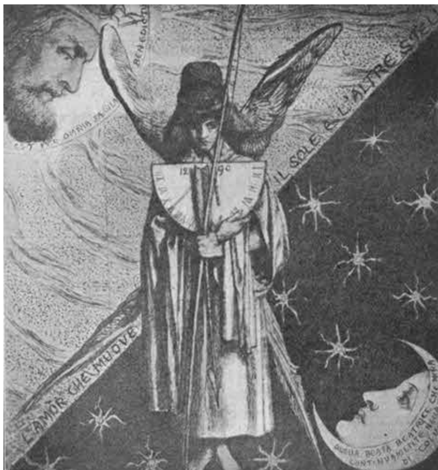
Д. Г. Россети. Амор «Новой Жизни».