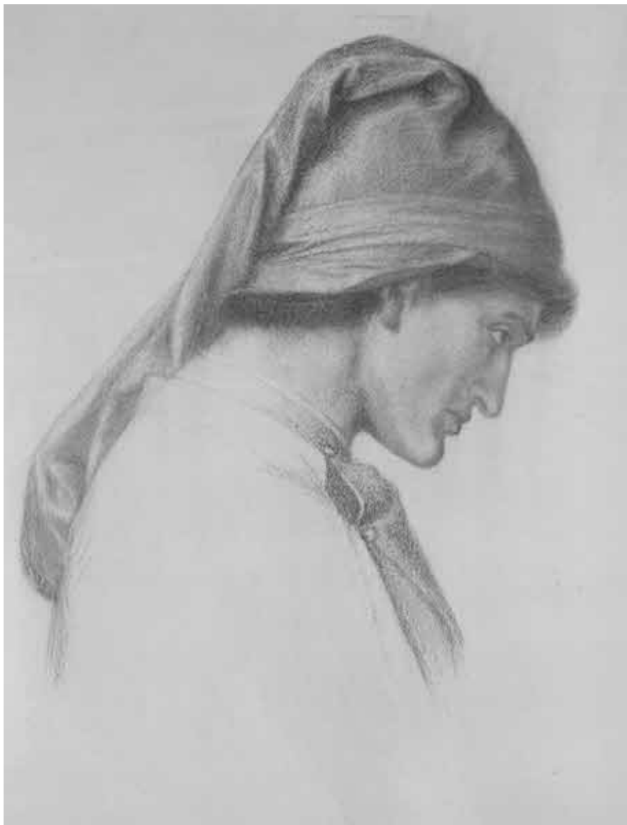
Данте Габриель Россети. Данте периода «Новой Жизни».