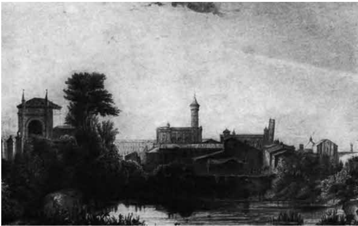
Равена. Общий вид.