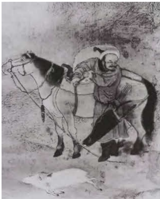
Монгольский всадник, седлающий коня