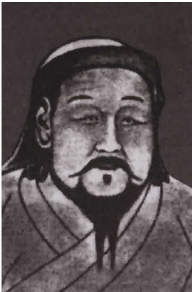
Хубилай-хан, внук Чингисхана (сын Толуя)