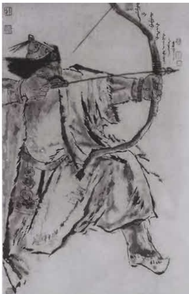
Хасар — брат Чингисхана