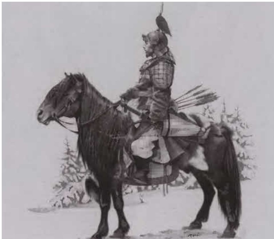
Монгольский воин. XIII в.