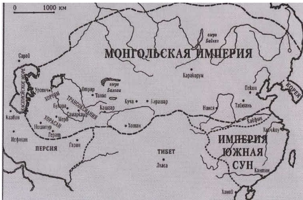
Монгольская империя к 1227 году