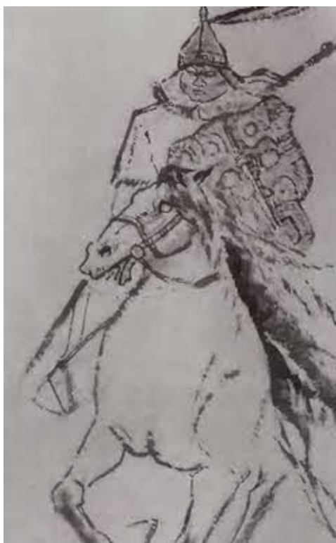
Верный соратник Субэдэй