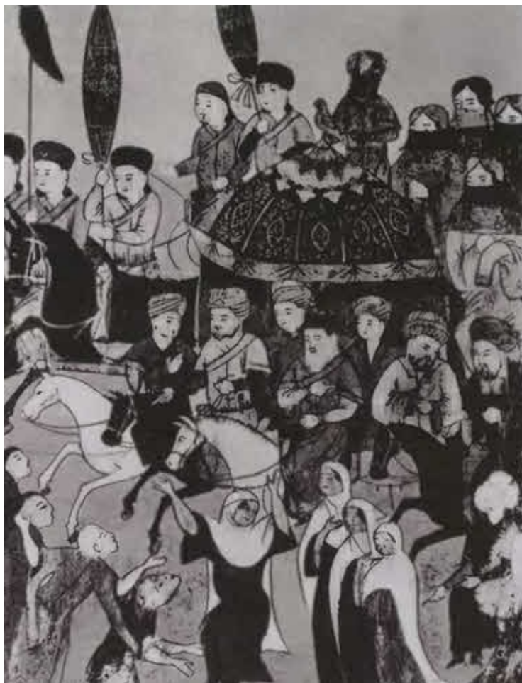
Выезд монгольского хана.