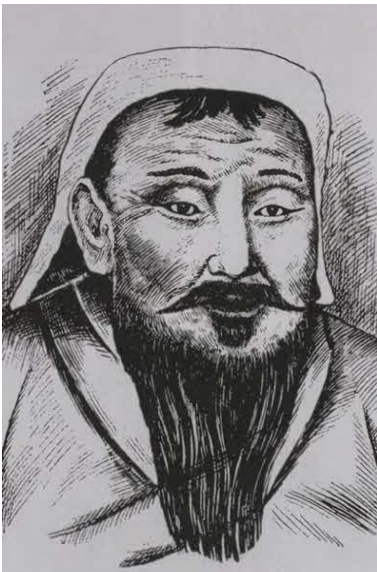
Чингисхан. Китайский портрет. XIII в.