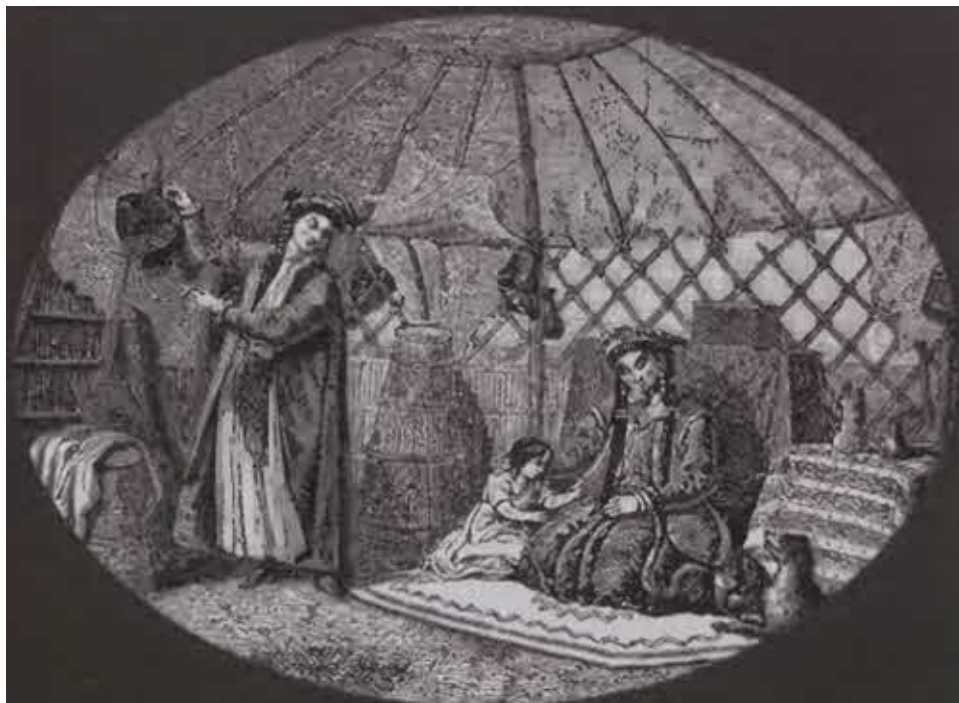
Внутреннее убранство монгольской юрты