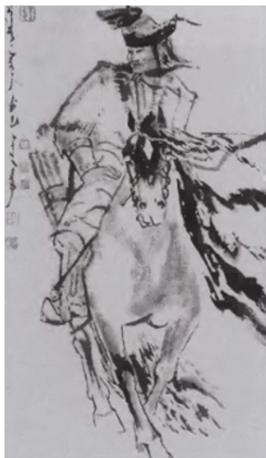
Чингисхан и его сыновья: Джучи, Угэдэй, Чагатай