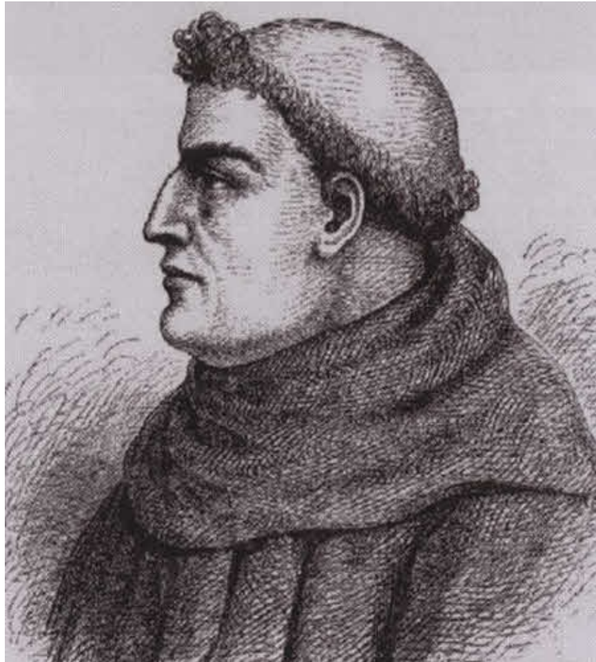
Плано Карпини, первый европеец, посетивший Монгольскую империю