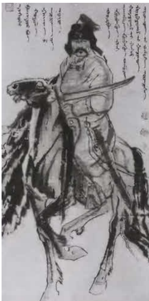
Есугей — отец Чингисхана