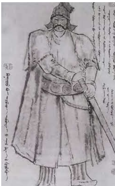
Друг детства и товарищ по оружию Боорчу