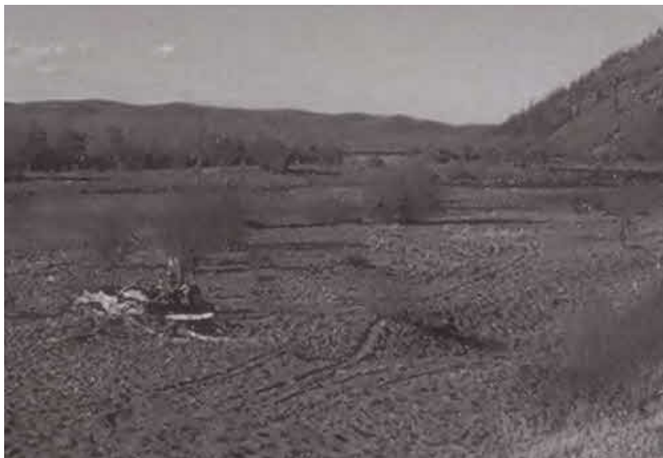
Река Онон — одно из предполагаемых мест, где родился и вырос Чингисхан