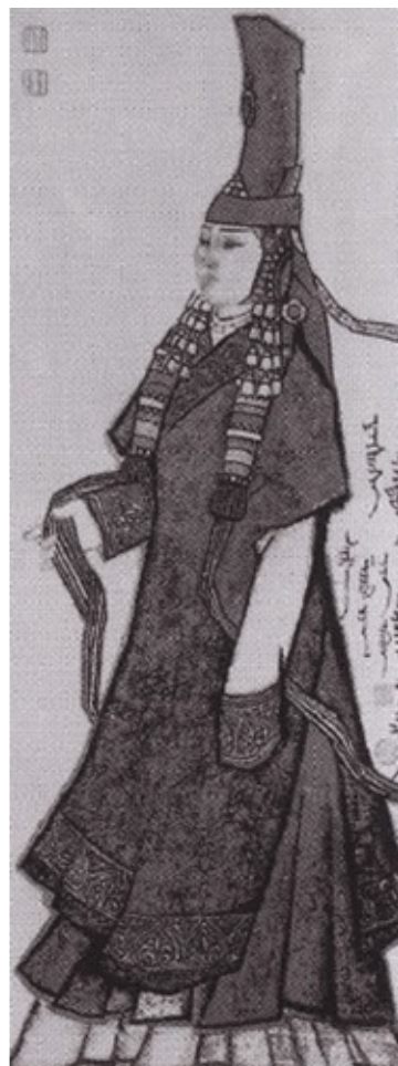
Хулан, сёстры Есуй и Есуген — жёны Чингисхана