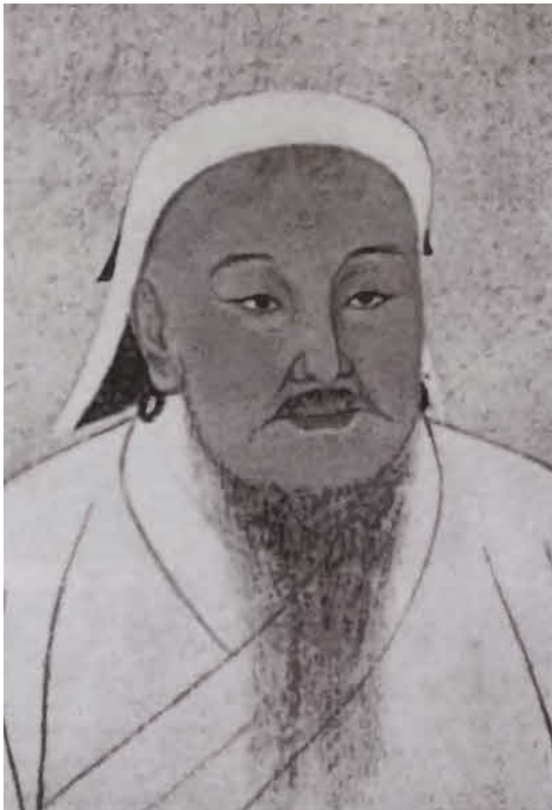
Чингисхан, основатель и первый великий хан Монгольской империи.