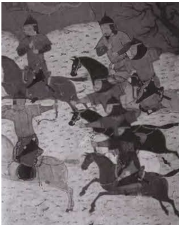
Монгольские конные лучники.

Иллюстрация из «Собрания летописей» Рашид ад-Дина. 1303 г.