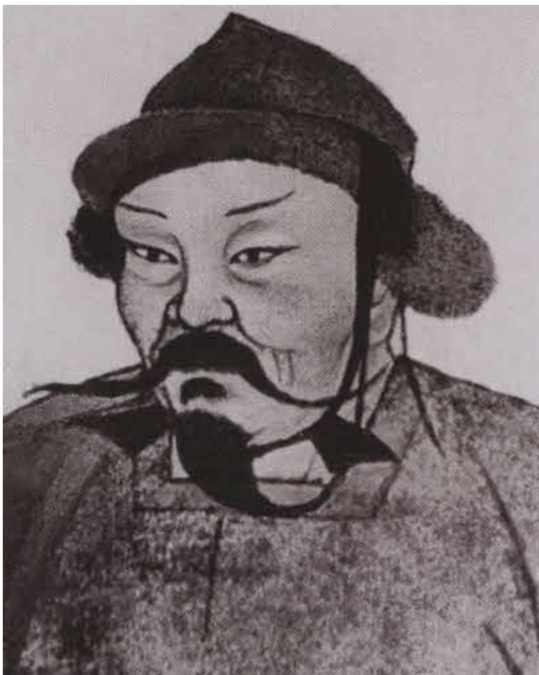
Угэдэй, второй великий хан, главный строитель Каракорума.