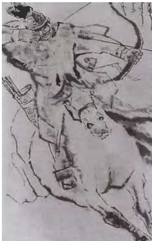
Самый отважный военачальник Джэлмэ