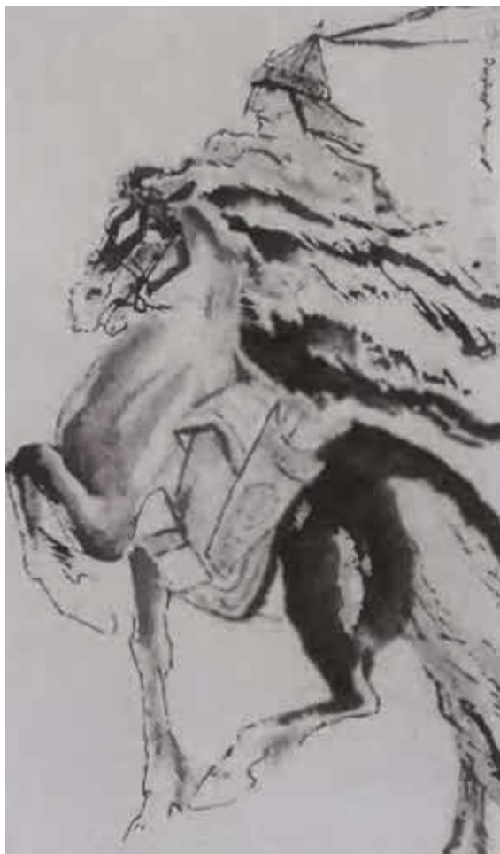
Тулуй — младший сын Чингисхана