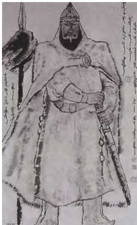
Отважный воин Мухали