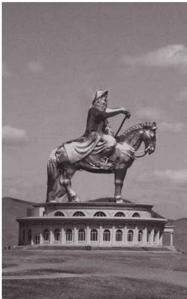
Конная статуя Чингисхана в Монголии