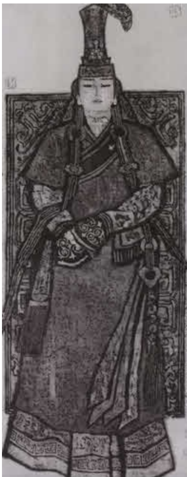
Бортэ — первая жена Чингисхана