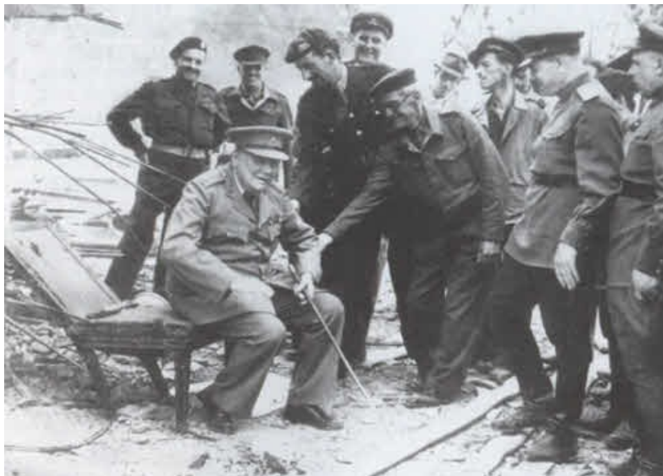
На развалинах бункера Гитлера в Берлине: Черчилль, окруженный советскими и британскими офицерами, пытается сесть на стул фюрера