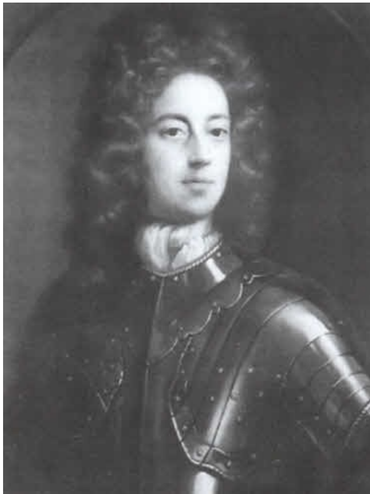
Джон Черчилль, первый герцог Мальборо.