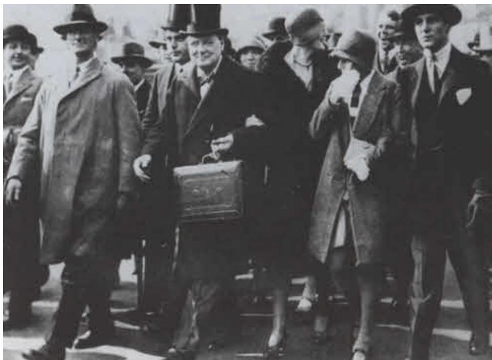
Черчилль диктует секретарю текст выступления