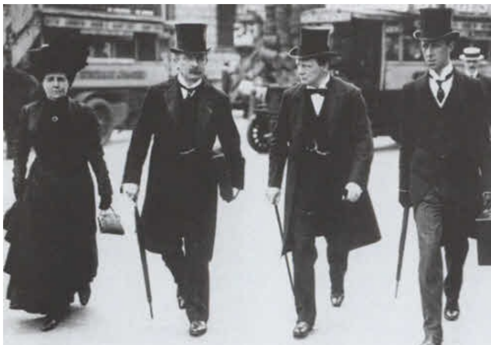
В день принятия «народного бюджета» 1910 года.

Слева направо — миссис Маргарет Ллойд Джордж, Ллойд Джордж, Черчилль, секретарь Ллойда Джорджа