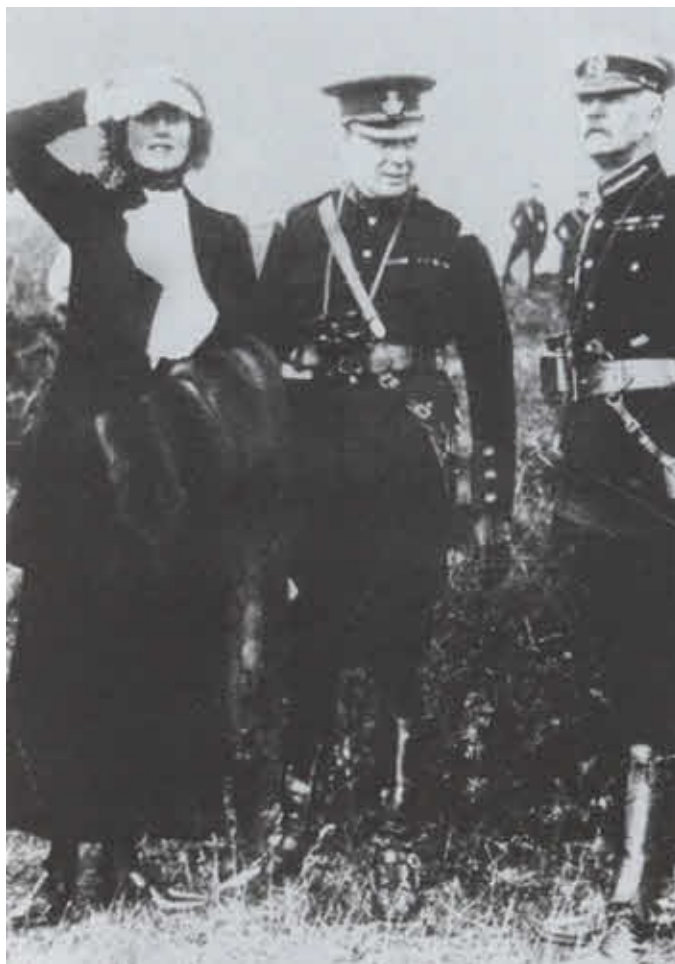
Клементина, Уинстон и генерал Гамильтон на военных учениях в Алдершоне. 1910 г.