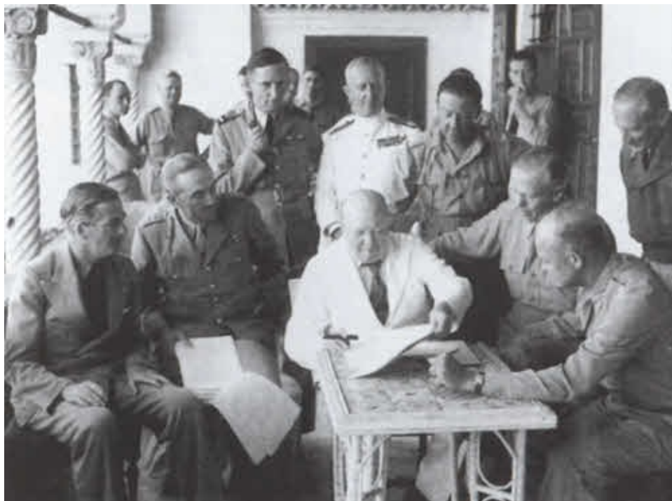
Совещание с командующими союзническими войсками: справа от Черчилля — Иден и генерал Брук; слева — генералы Маршалл и Эйзенхауэр.