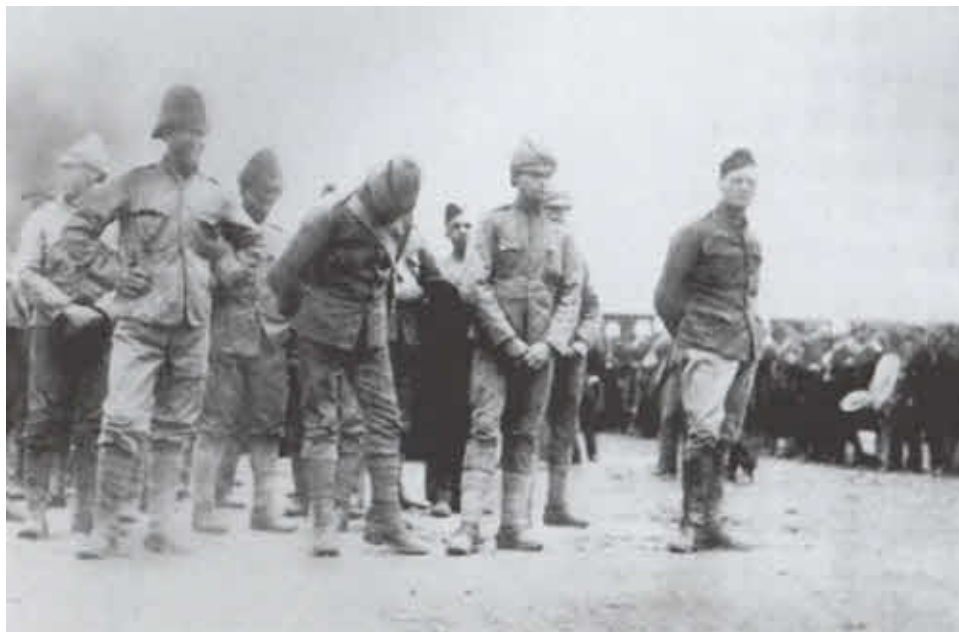
Британцы, плененные бурами. Уинстон — в пилотке справа. 1899 г.