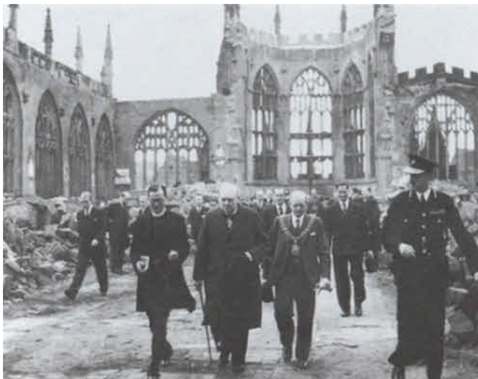
На руинах собора в Ковентри