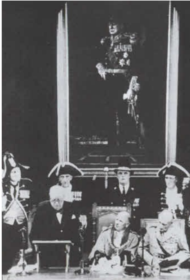
Ратуша в Гастингсе: Черчилль выражает благодарность за подаренный ему портрет, на котором он изображен в мундире хранителя пяти портов (к числу которых относится и Гастингс). 1957 г.