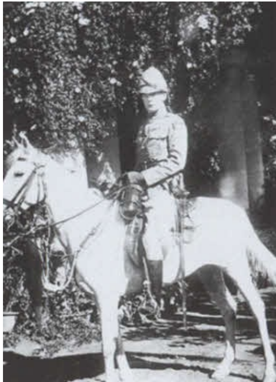
Лейтенант гусарского полка на службе в Индии