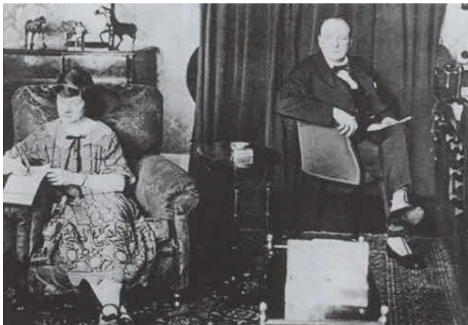
Предвыборная кампания 1924 года.