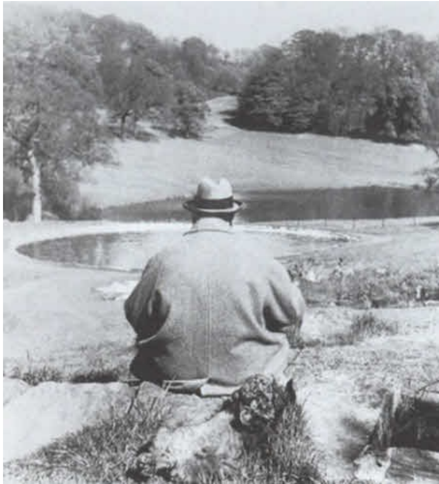
Черчилль со своей собакой Руфусом в Чартвелле