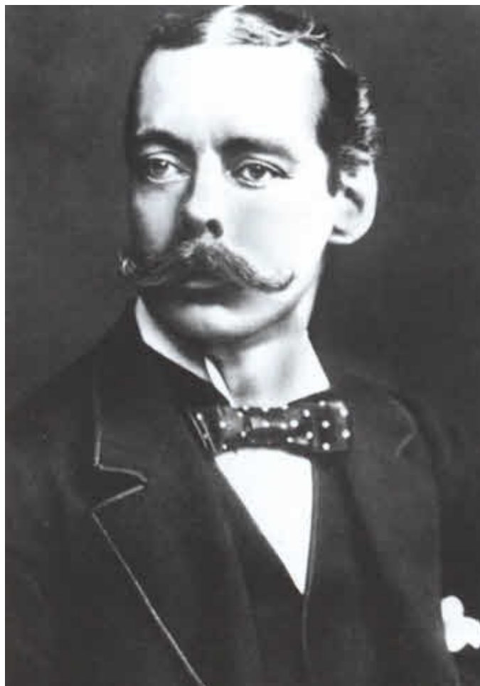
Лорд Рандольф Черчилль