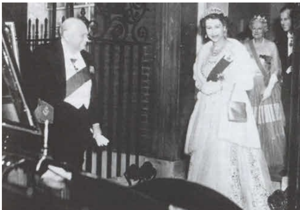
Сэр Уинстон и леди Черчилль принимают королеву Англии и герцога Эдинбургского, посетивших прощальный обед на Даунинг-стрит 4 апреля 1955 года