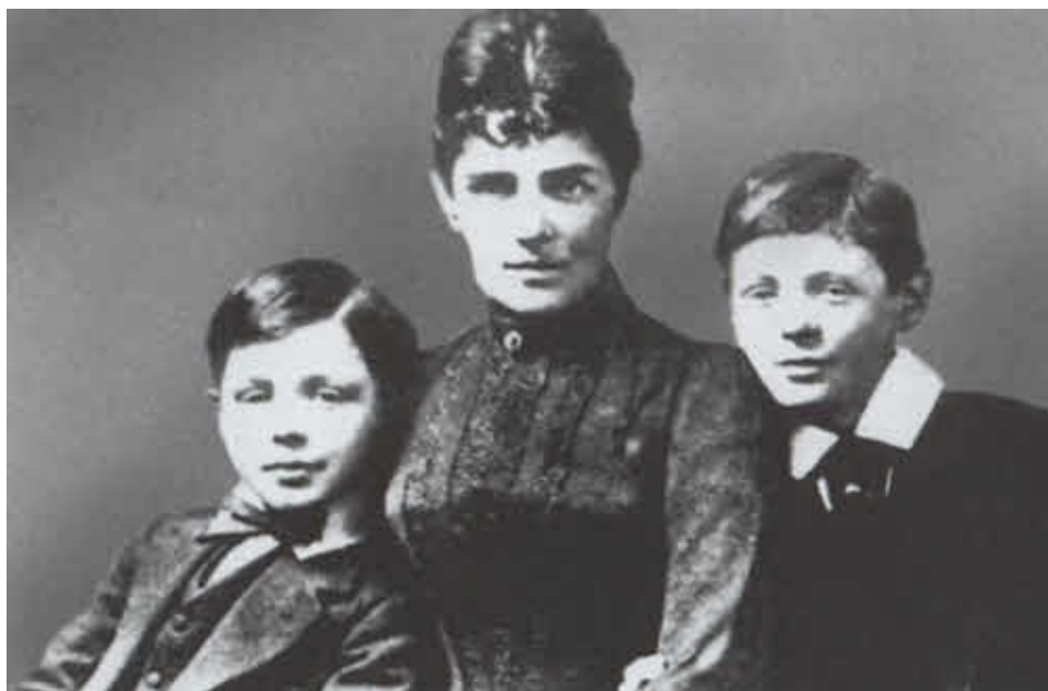
Леди Рандольф с сыновьями — Уинстоном и Джеком