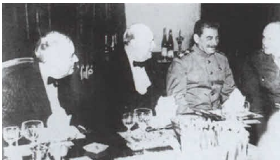
Позади — маршал авиации Теддер, адмирал Каннингем, генералы Александер и Монтгомери