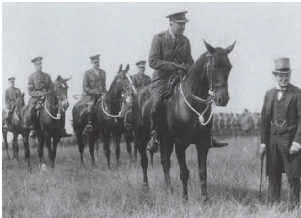
Глава военного министерства Уинстон Черчилль и маршал Уинсом инспектируют британские войска в Рейнланде.