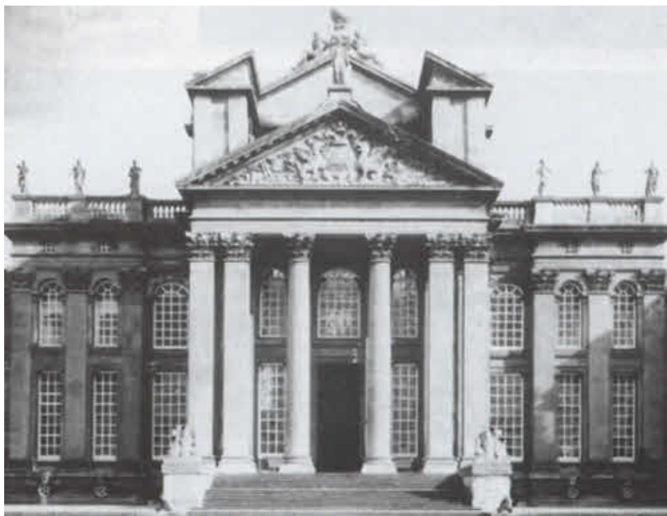
Замок в Бленхейме — родовое гнездо герцогов Мальборо