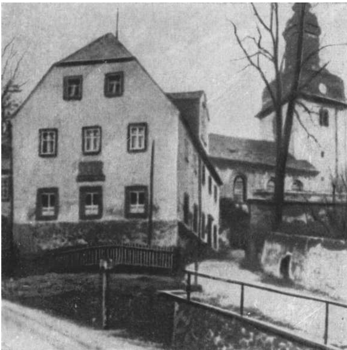
Дом в Видерау, где родилась Клара Цеткин.