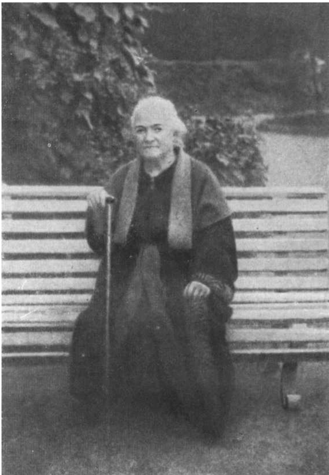
Клара Цеткин в последние годы жизни.

Во время своей продолжительной, часто очень трудной и