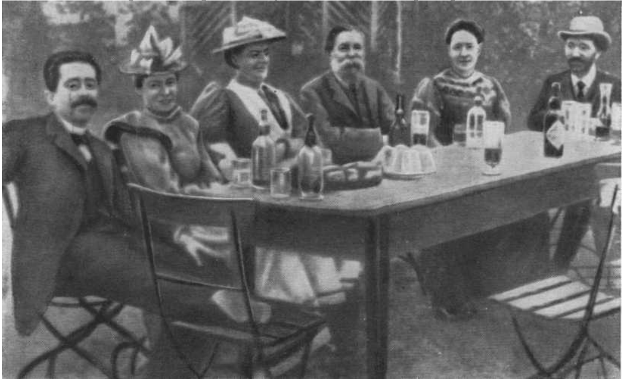
Клара Цеткин (третья слева) и Фридрих Энгельс (четвертый слева). 1893.

газеты. С полным удовлетворением прочла Клара заметку: «Из 2 600 марок, поступивших в редакцию «Равенства» для оказания помощи бастующим, 1 300 марок были собраны женщинами из пролетариата». Эти деньги работницы-социалистки из солидарности с бастующими сэкономили на питании. Они придали прачкам мужества, чтобы продержаться до конца.