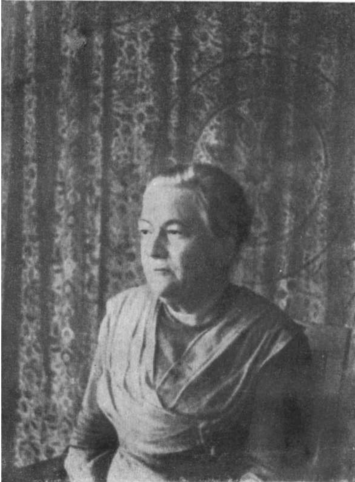
Клара Цеткин Амстердам, 1915

Общественность ожидает от процесса сенсации, а товарищи по партии надеются, что процесс будет иметь огромное агитационное значение.