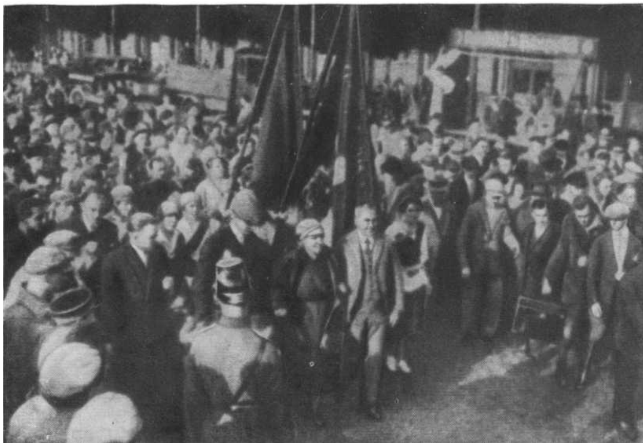
Торжественная встреча Клары Цеткин на берлинском вокзале 31 августа 1927 года. Справа — Вильгельм Пик.