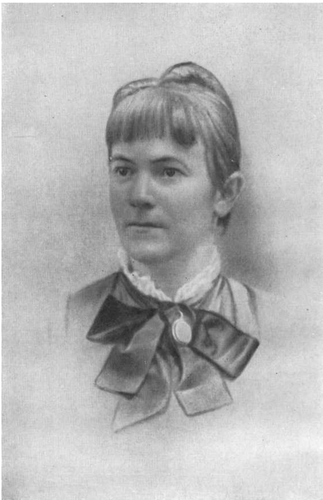
Клара Цеткин Париж, 1885.