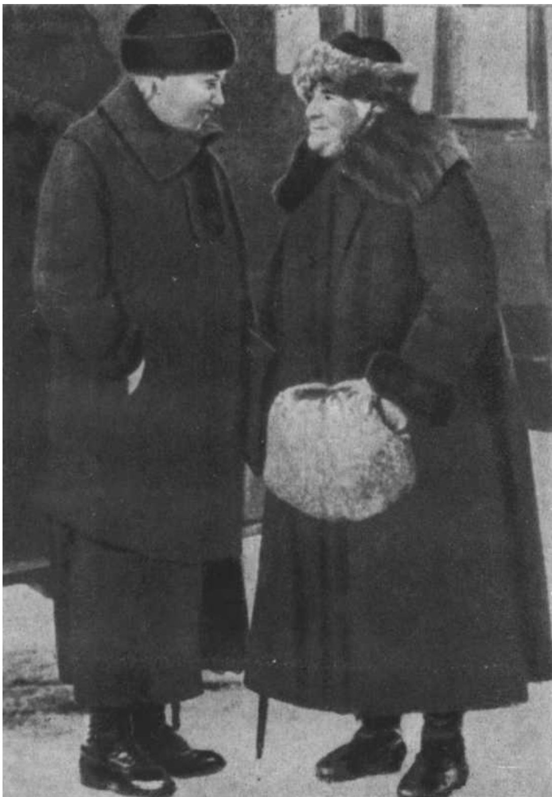
Надежда Константиновна Крупская и Клара Цеткин.