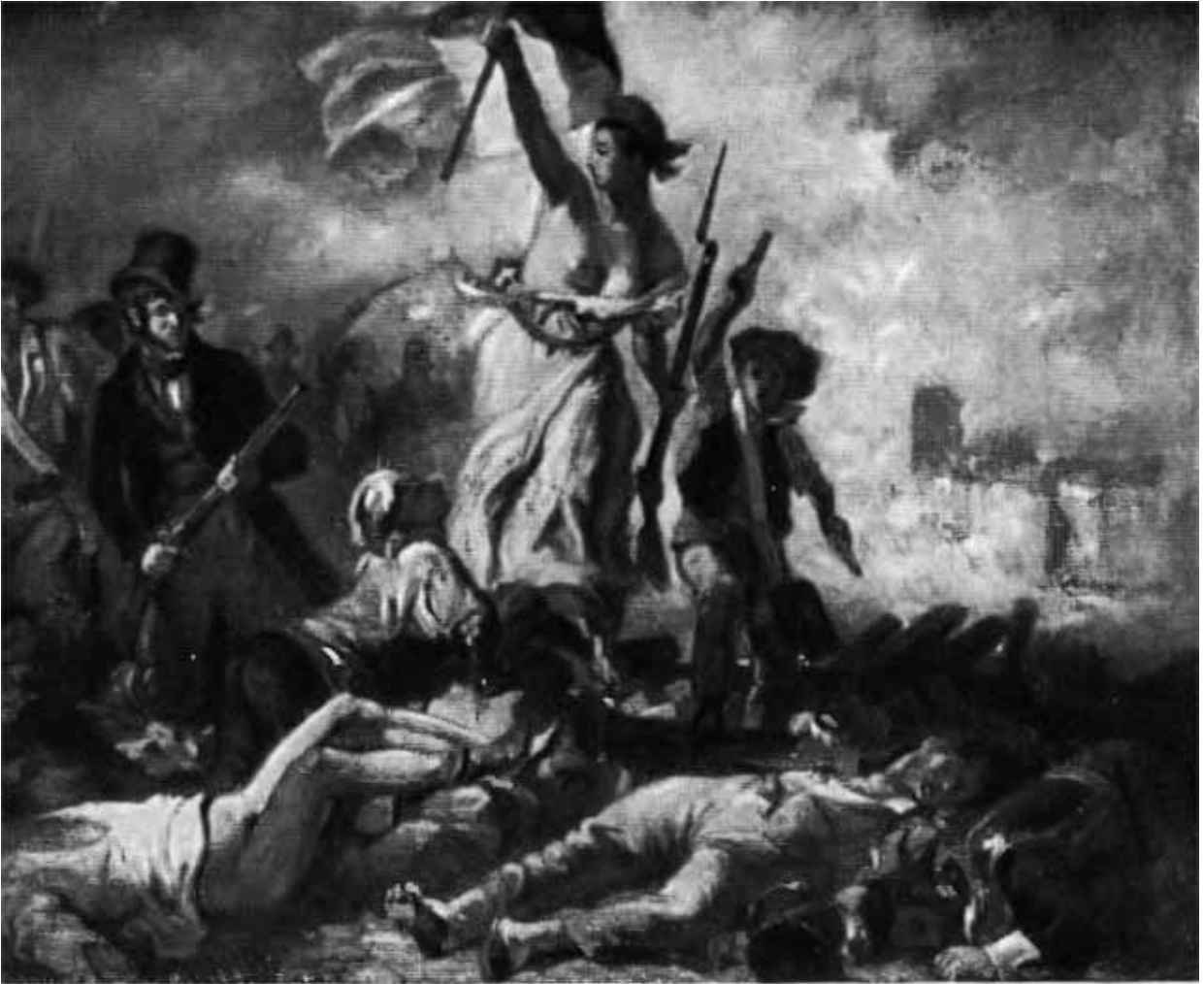
Делакруа. Революция 1830 года.