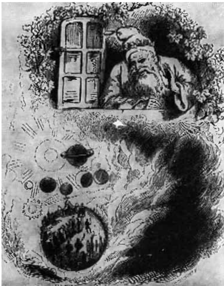
Добрый бог. ( Рисунки Гранвиля к песням Беранже. )