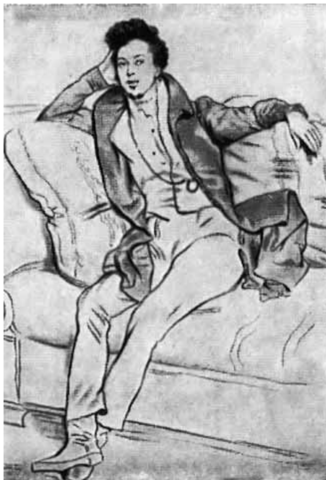
Дюма. Рисунок Девериа.