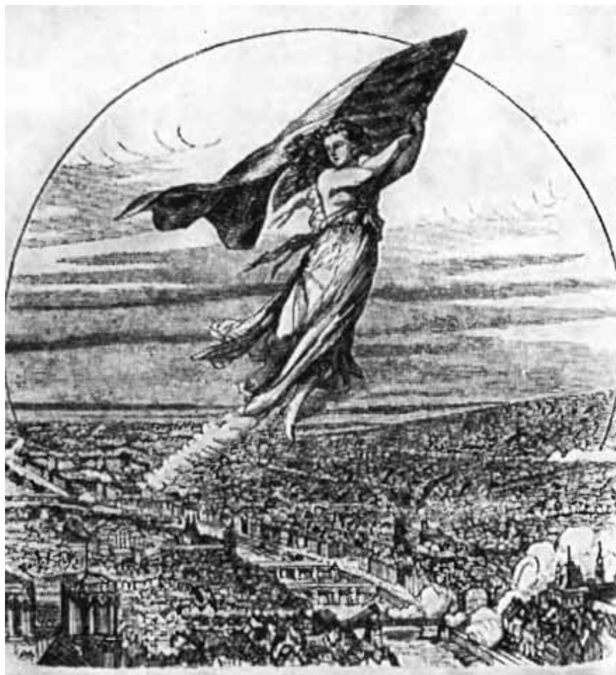
Идея. (Рисунки Гринвиля к песням Беранже.)