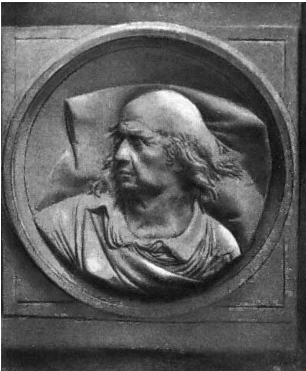
Посмертная маска Беранже.