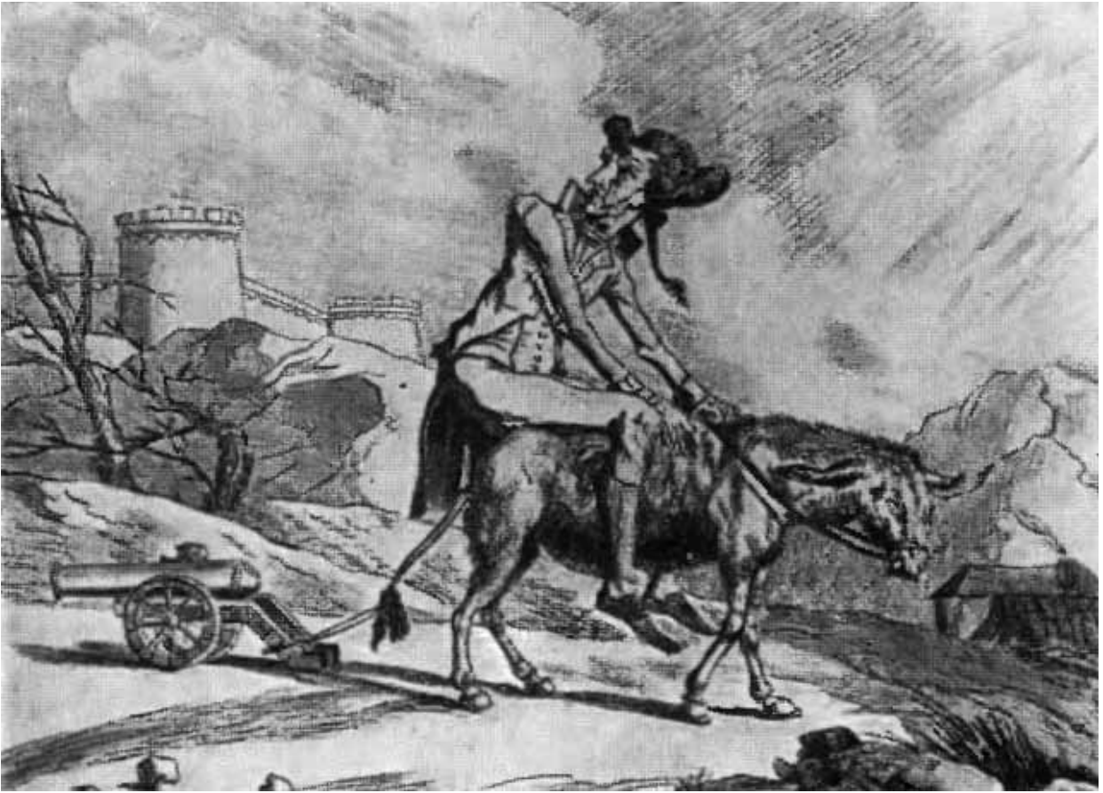
Аристократ-эмигрант. С современной карикатуры.