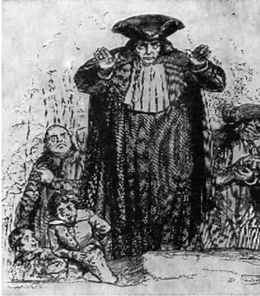
Святые отцы. (Рисунки Гранвиля к песням Беранже.)