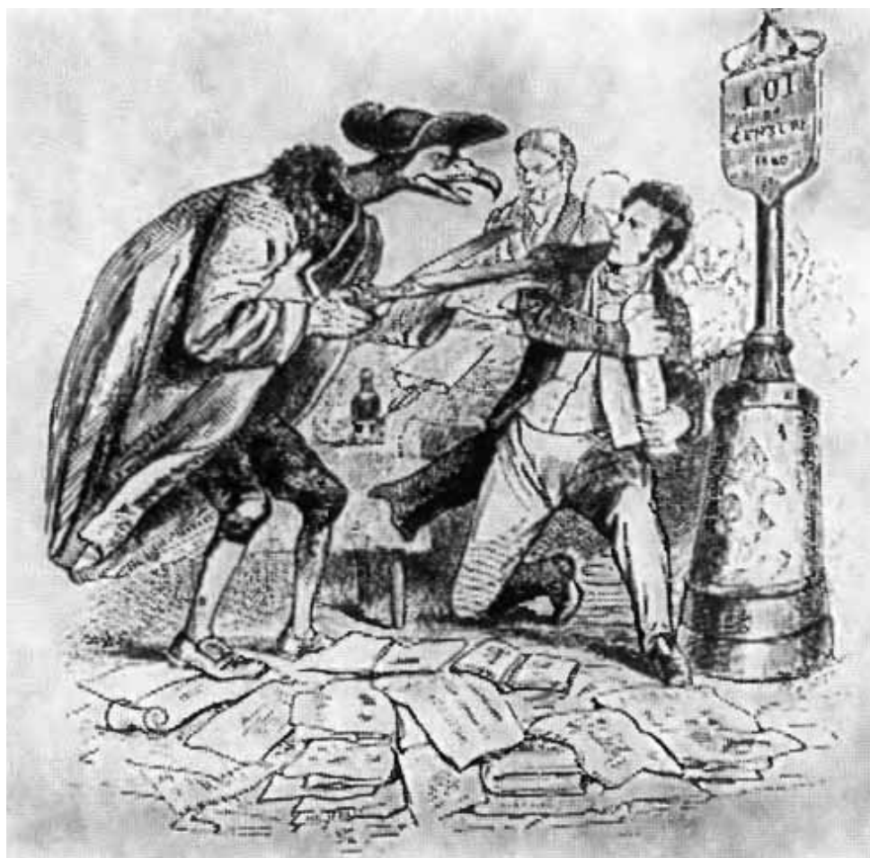
Цензор. Рисунок Гранвиля.