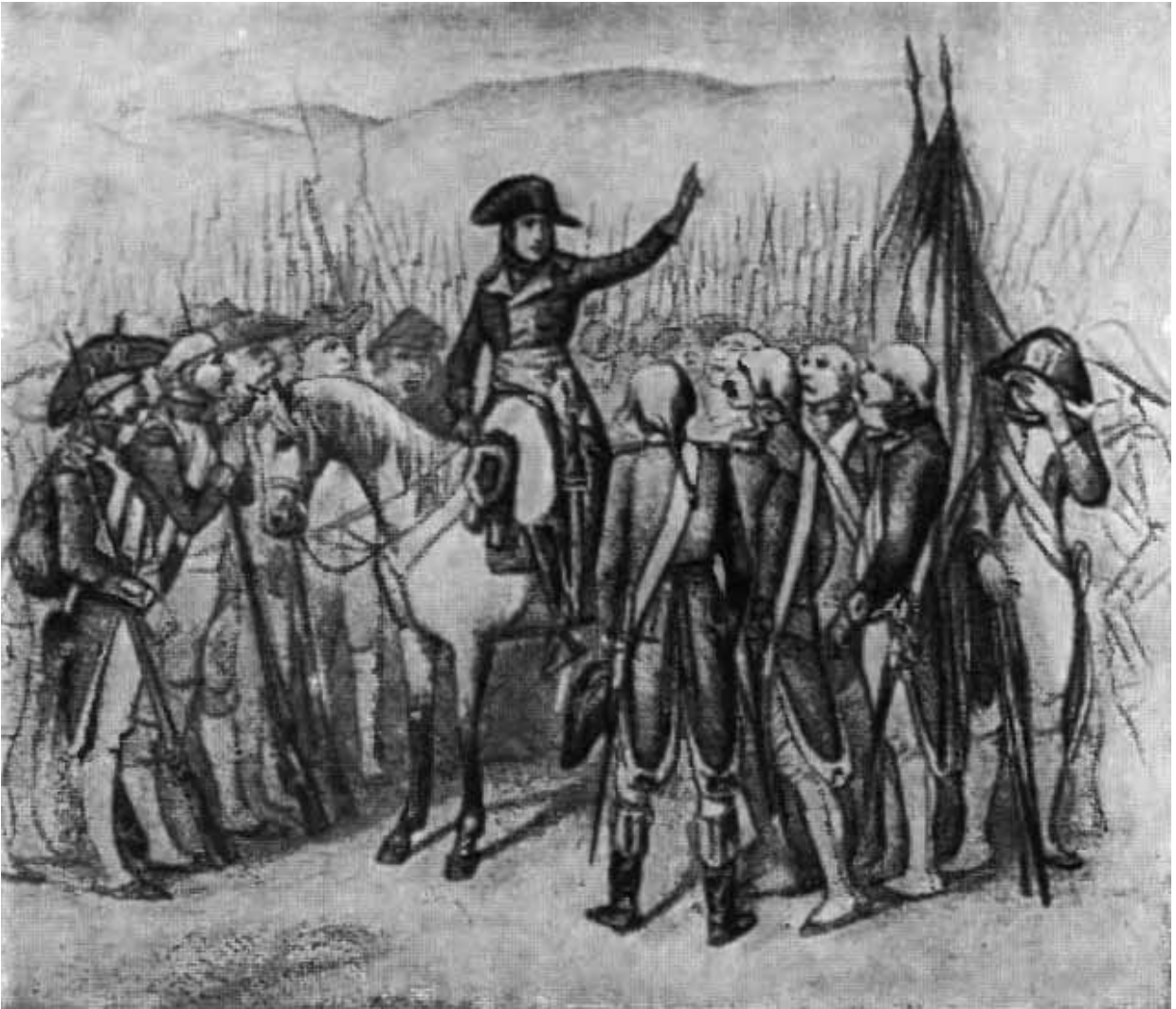
Раффе. Наполеон перед сражением.