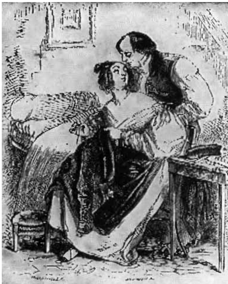
Старый фрак. ( Рисунки Гранвиля к песням Беранже. )