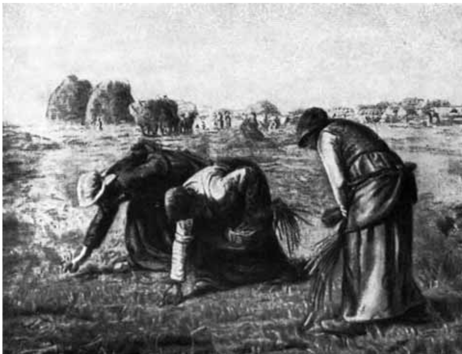
Милле. Собирательницы колосьев.