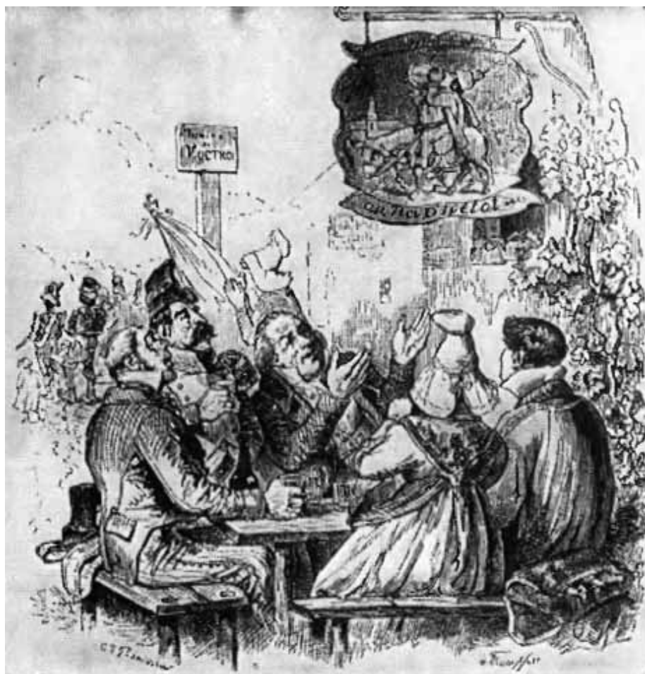
Король Ивето. (Рисунки Гранвиля к песням Беранже.)