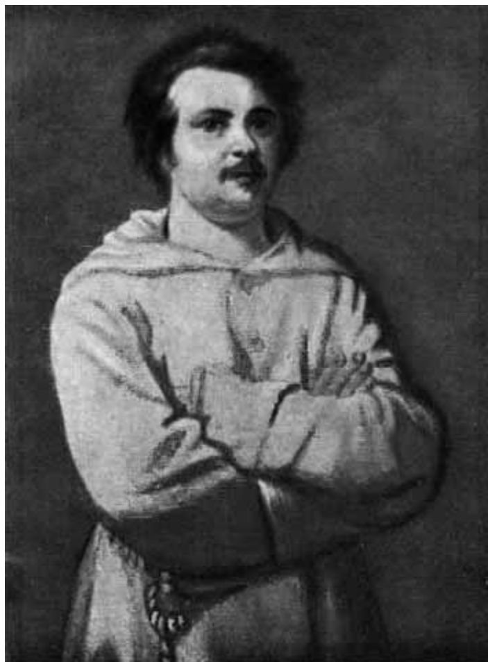
Бальзак. С портрета Луи Буланже.