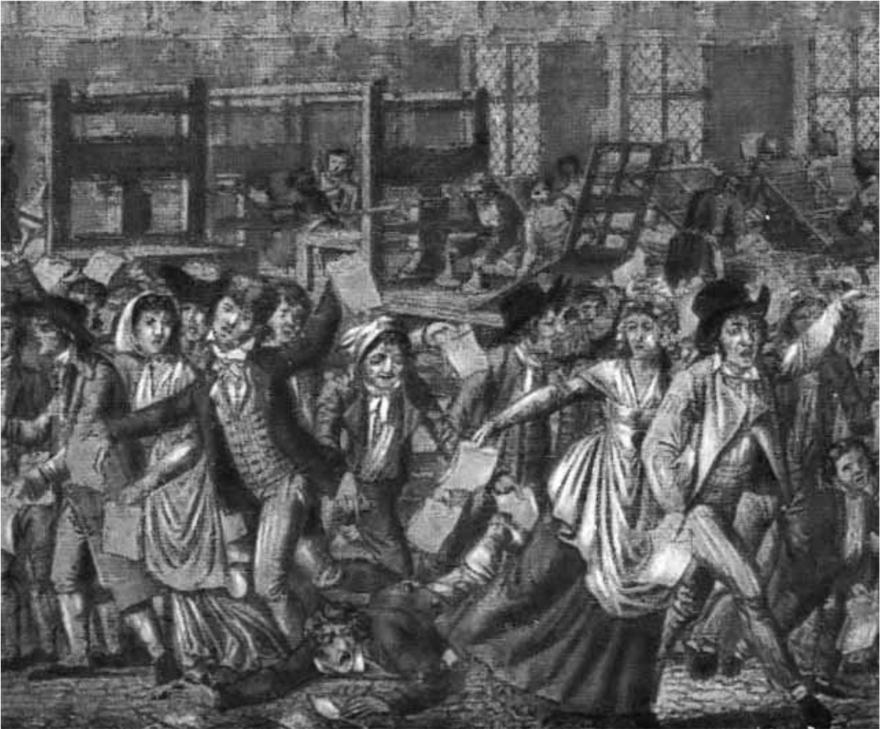
Свобода печати! С современной гравюры.