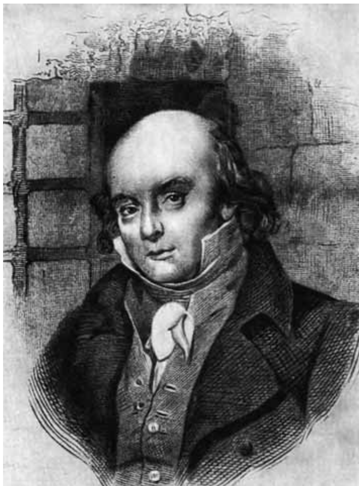
Беранже в тюрьме. Портрет из бельгийского издания песен Беранже 1828 года.