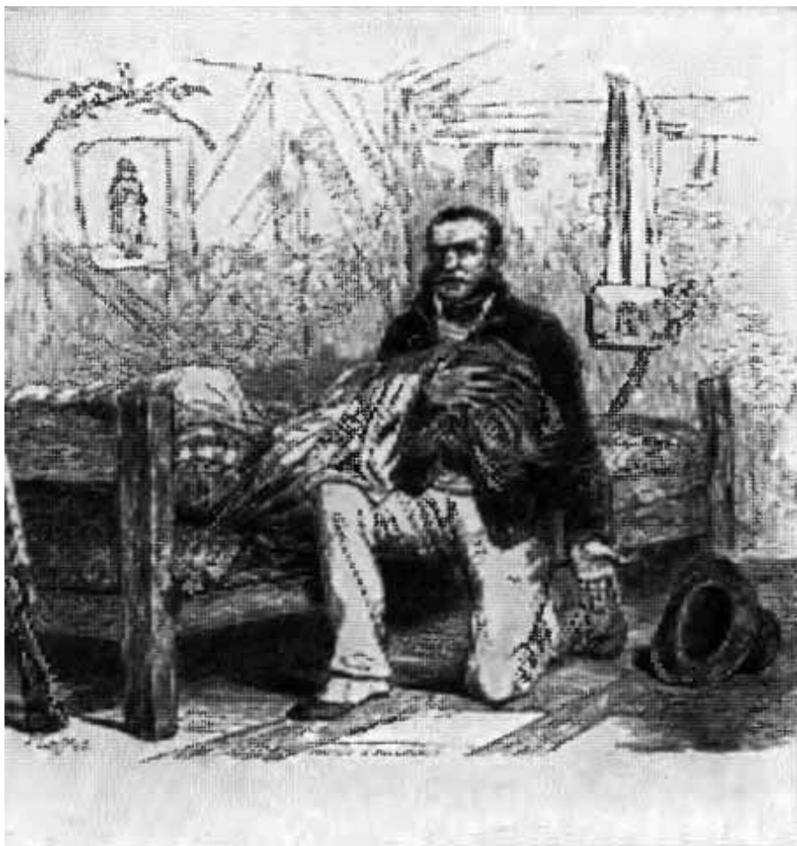
Старое знамя. ( Рисунки Гранвиля к песням Беранже. )