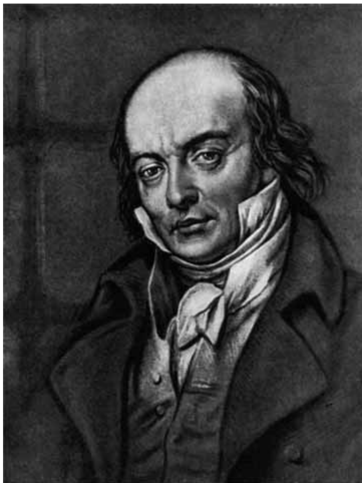
Беранже. Портрет работы Ари Шеффера.