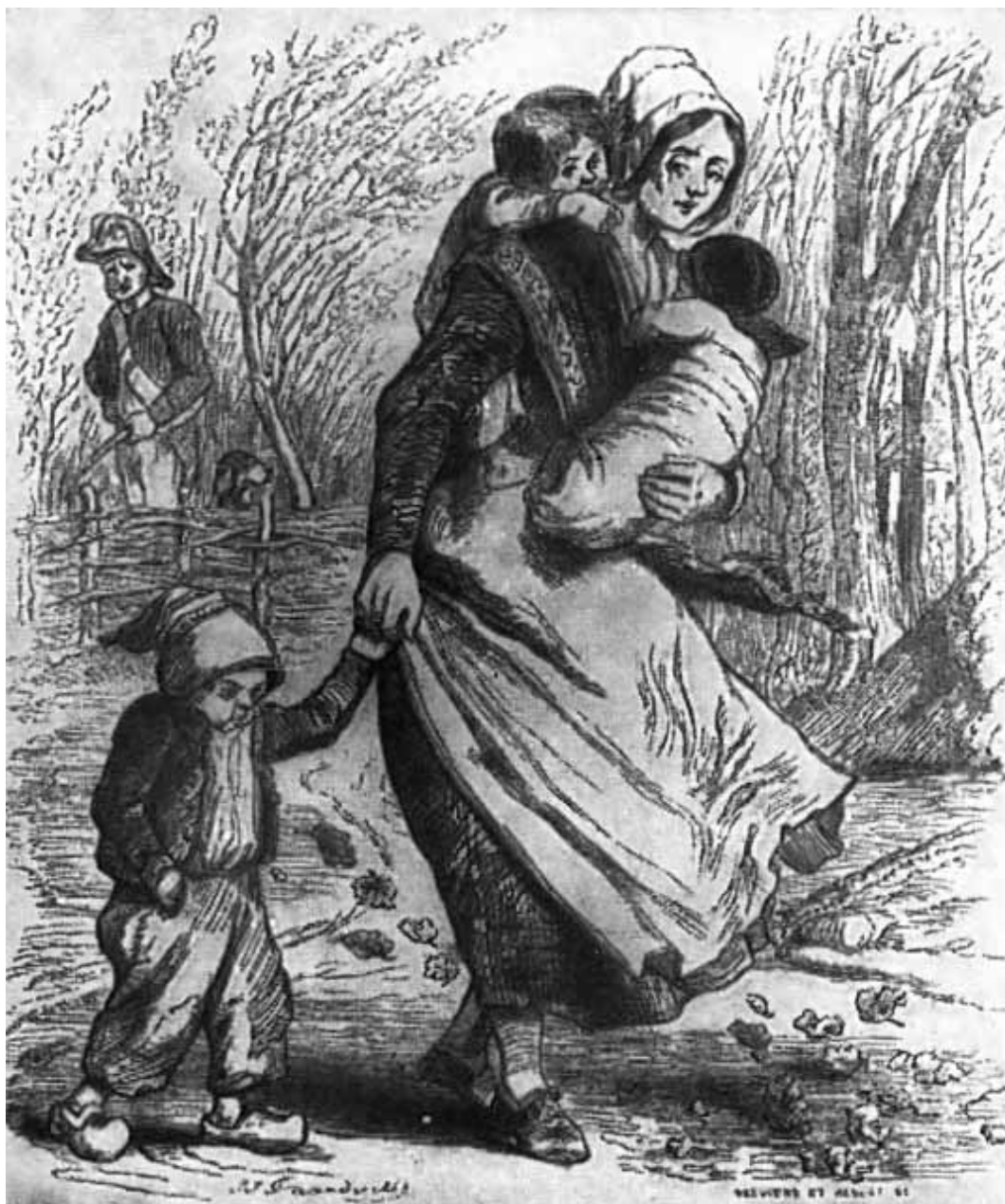
Рыжая Жанна. (Рисунки Гринвиля к песням Беранже.)