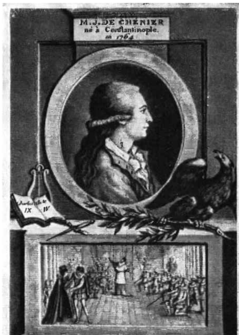
Мари Жозеф Шенье.