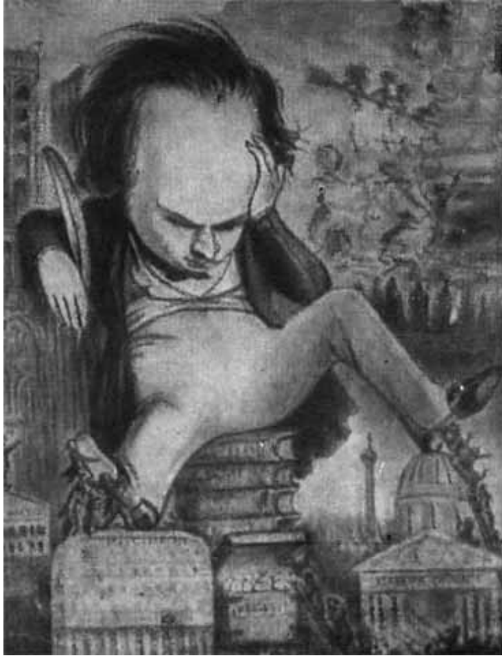
Виктор Гюго. Современная карикатура.