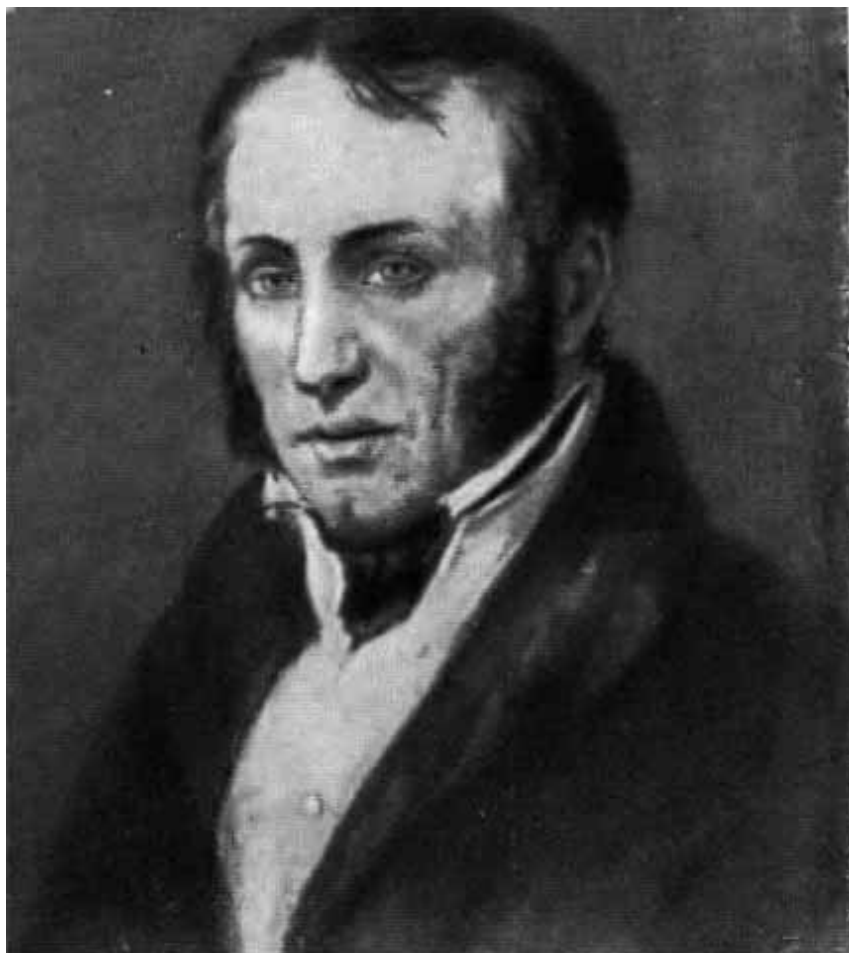
Поль Луи Курье С портрета Ари Шеффери.