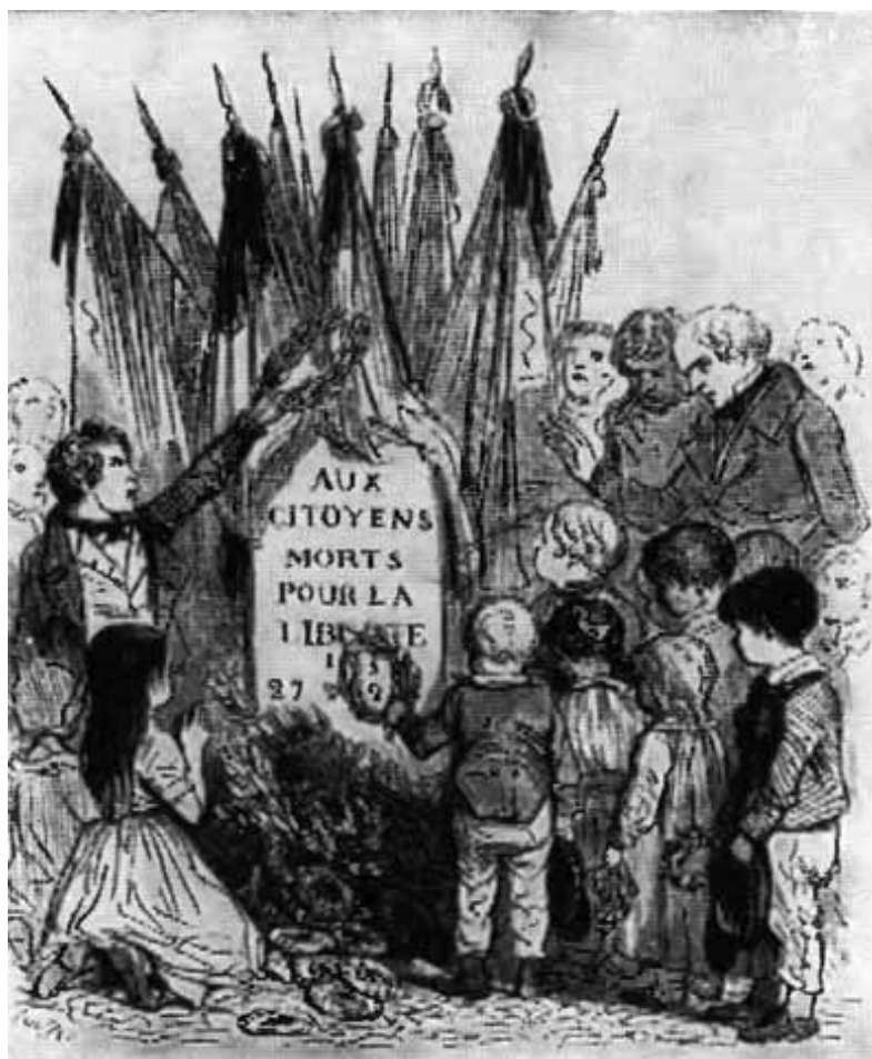
Июльские могилы Рисунок Гранвиля.