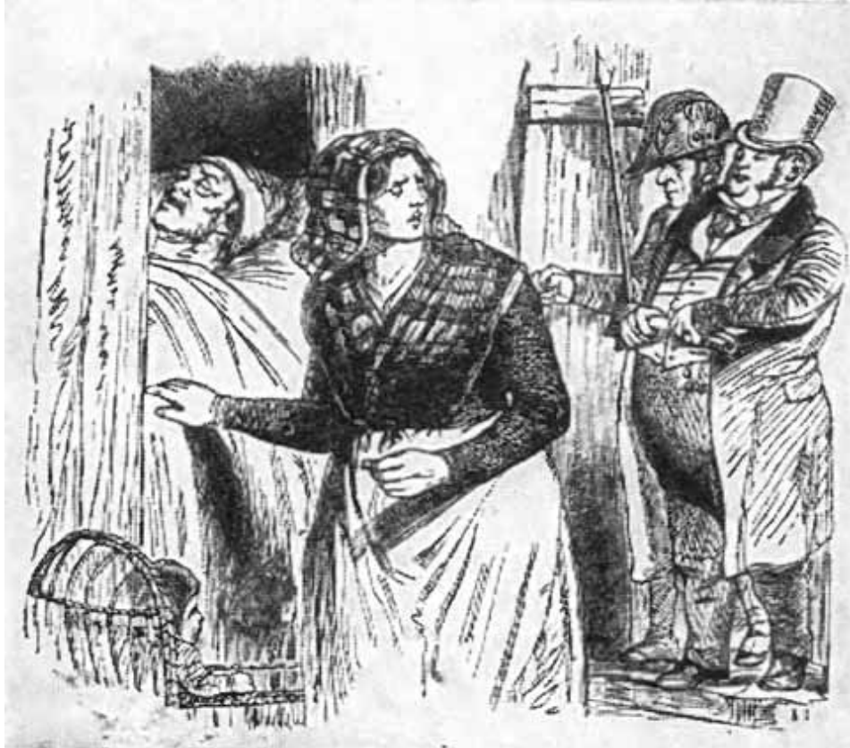
Жак. (Рисунки Гринвиля к песням Беранже.)