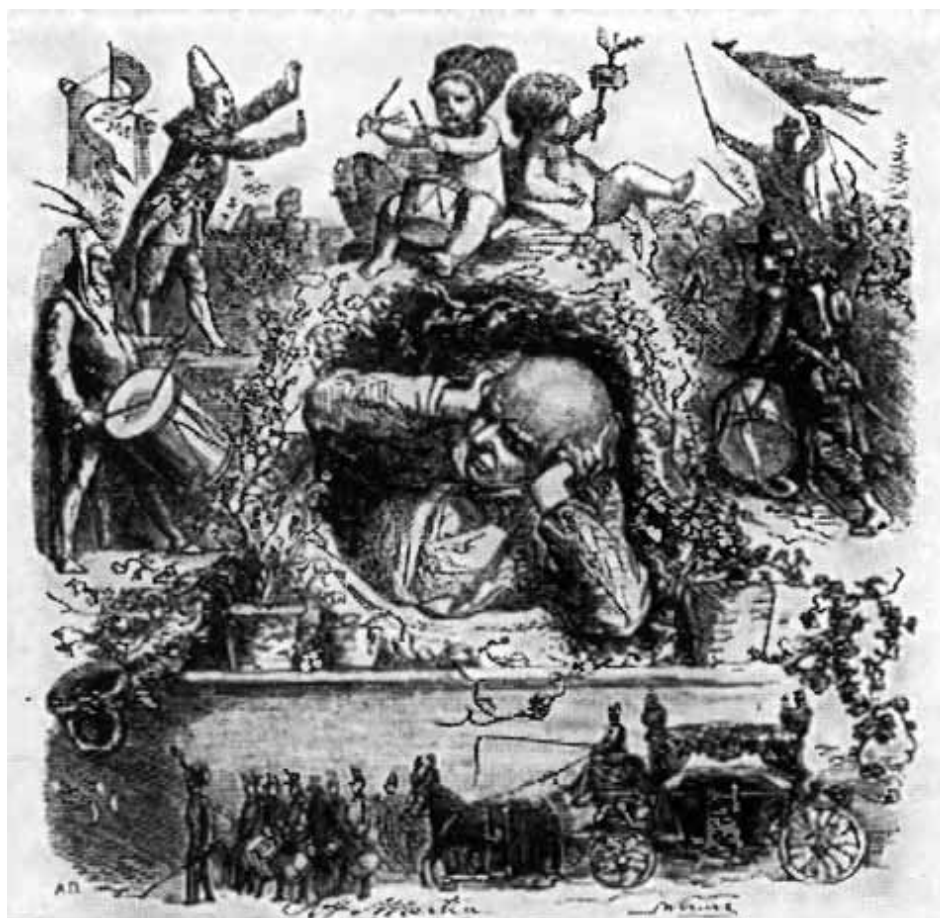
Барабаны. (Рисунки Гринвиля к песням Беранже.)