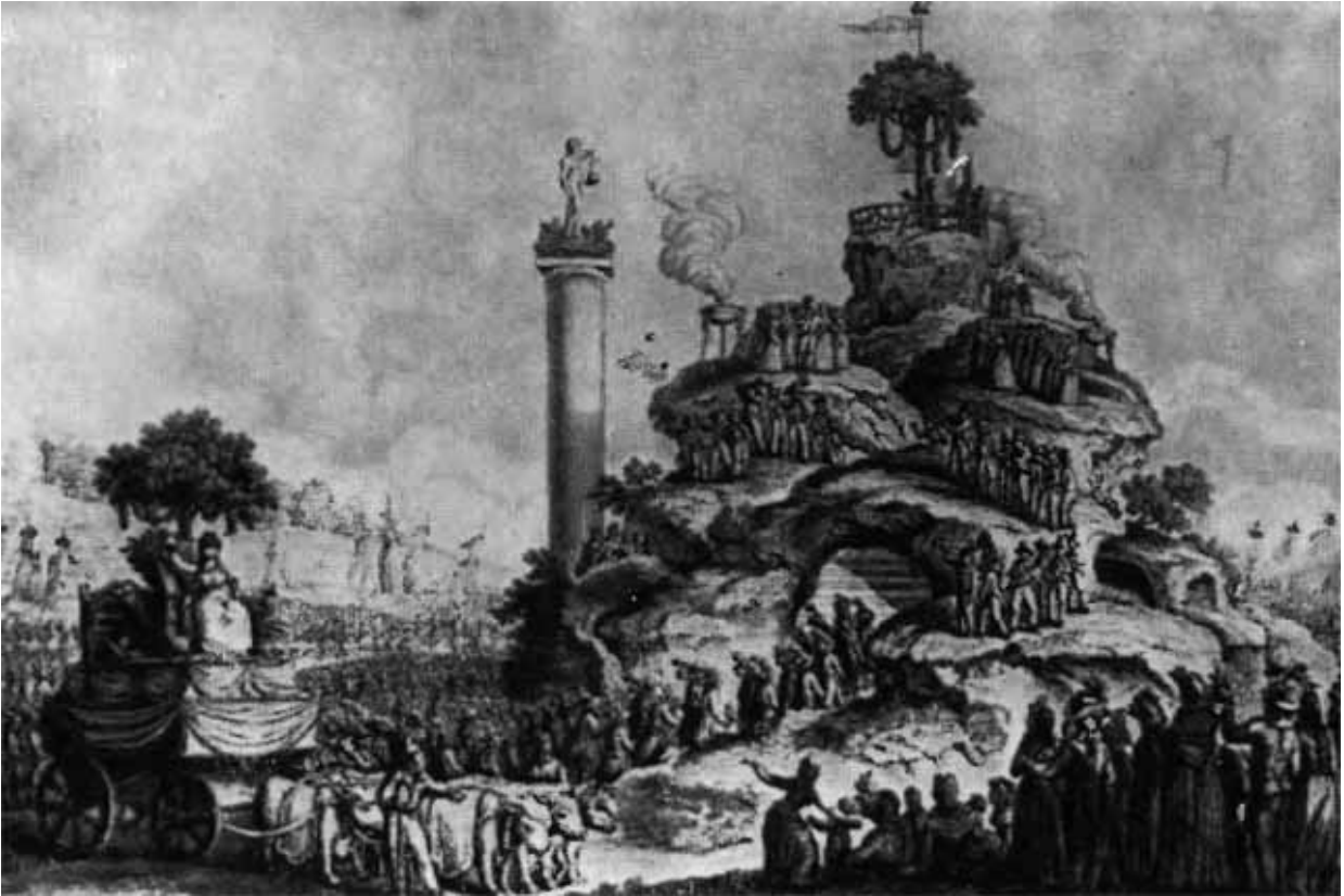
Массовый революционный праздник в Париже в 1794 году.