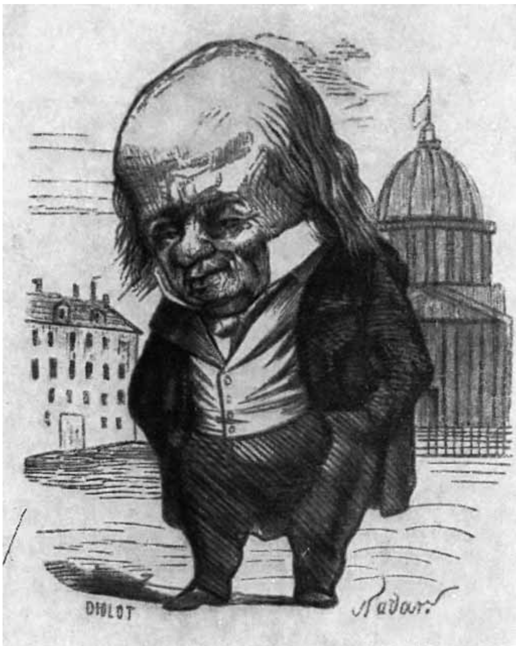
Беранже. Карикатура Надара.