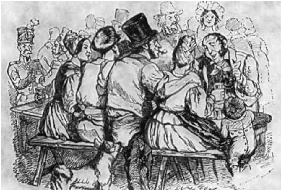
Беднота. (Рисунки Гранвиля к песням Беранже.)