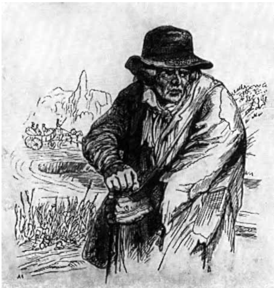
Старый бродяга. (Рисунки Гринвиля к песням Беранже.)