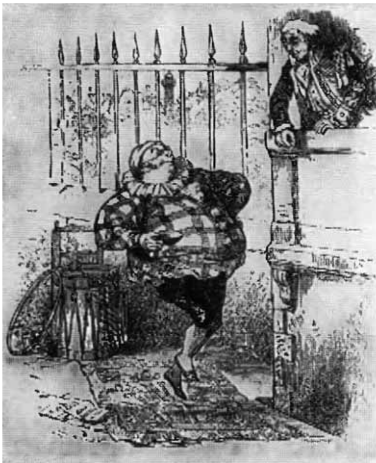
Паяц. (Рисунки Гранвиля к песням Беранже.)