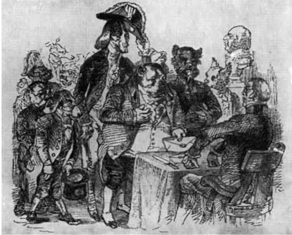
Челобитная породистых собак. (Рисунки Гранвиля к песням Беранже.)