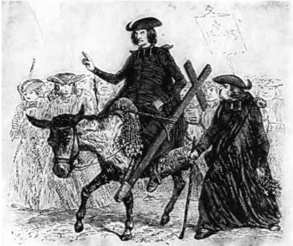
Миссионеры. (Рисунки Гранвиля к песням Беранже.)