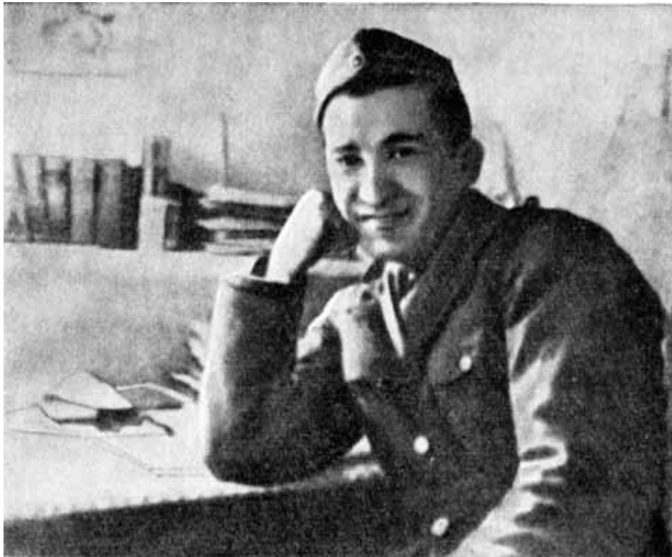
Никос Белояннис — политкомиссар Демократической армии Греции.