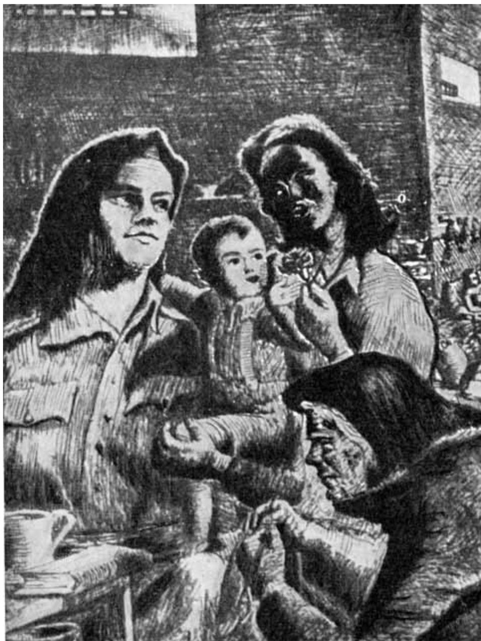
Женщины в тюрьме (рисунок политзаключенного).

В тюрьме. После пытки (рисунок политзаключенного).