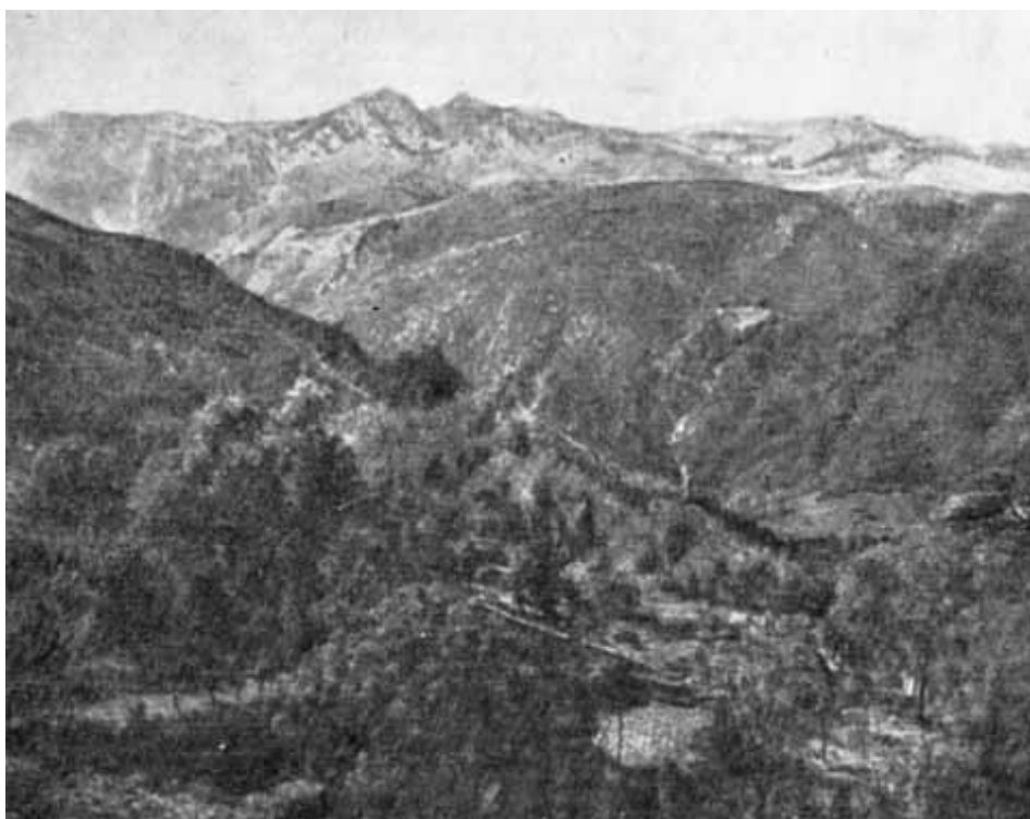
Горный хребет Тайгет.