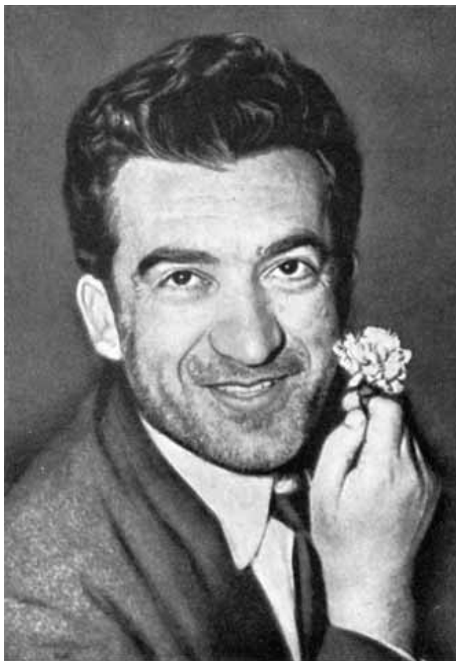
Никос Белояннис с гвоздикой.