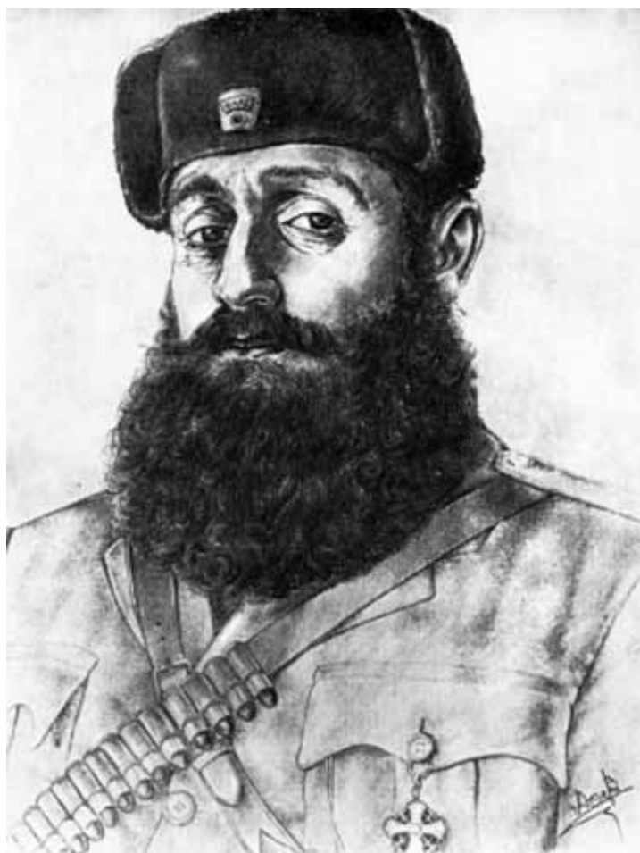
Арис Велухиотис, начальник генерального штаба ЭЛАС.