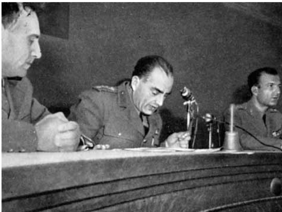
Судьи афинского военного трибунала (1952 г.).