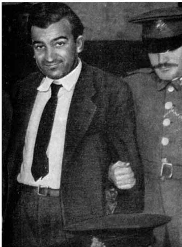
Никос Белояннис во время «процесса 93-х» (1951 г.).