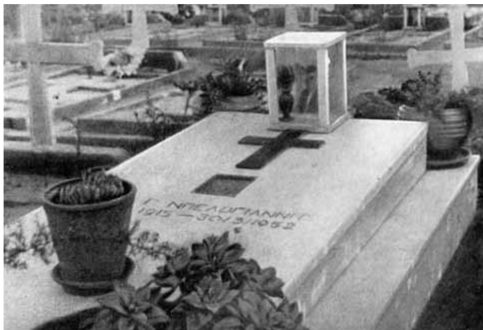
Могила Белоянниса на Третьем кладбище в Афинах.