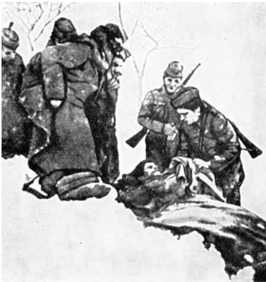
Смерть партизана в горах (фото бойца ЭЛАС).