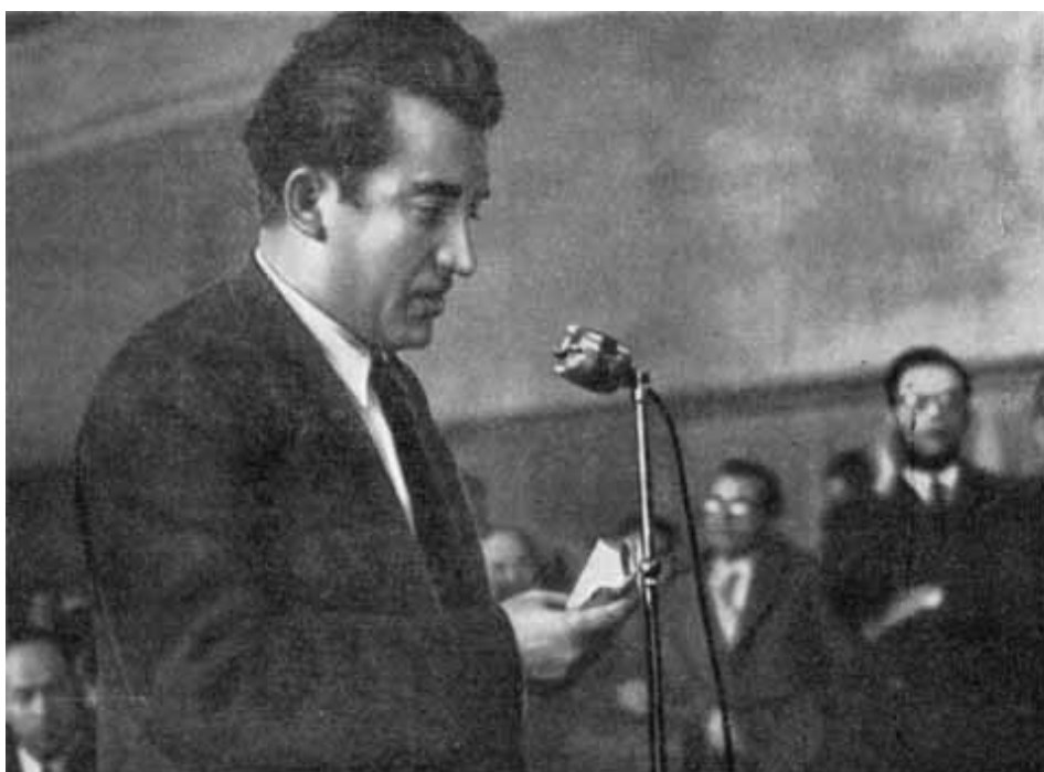
Выступление Белоянниса на «процессе 29-ти» (1952 г.).