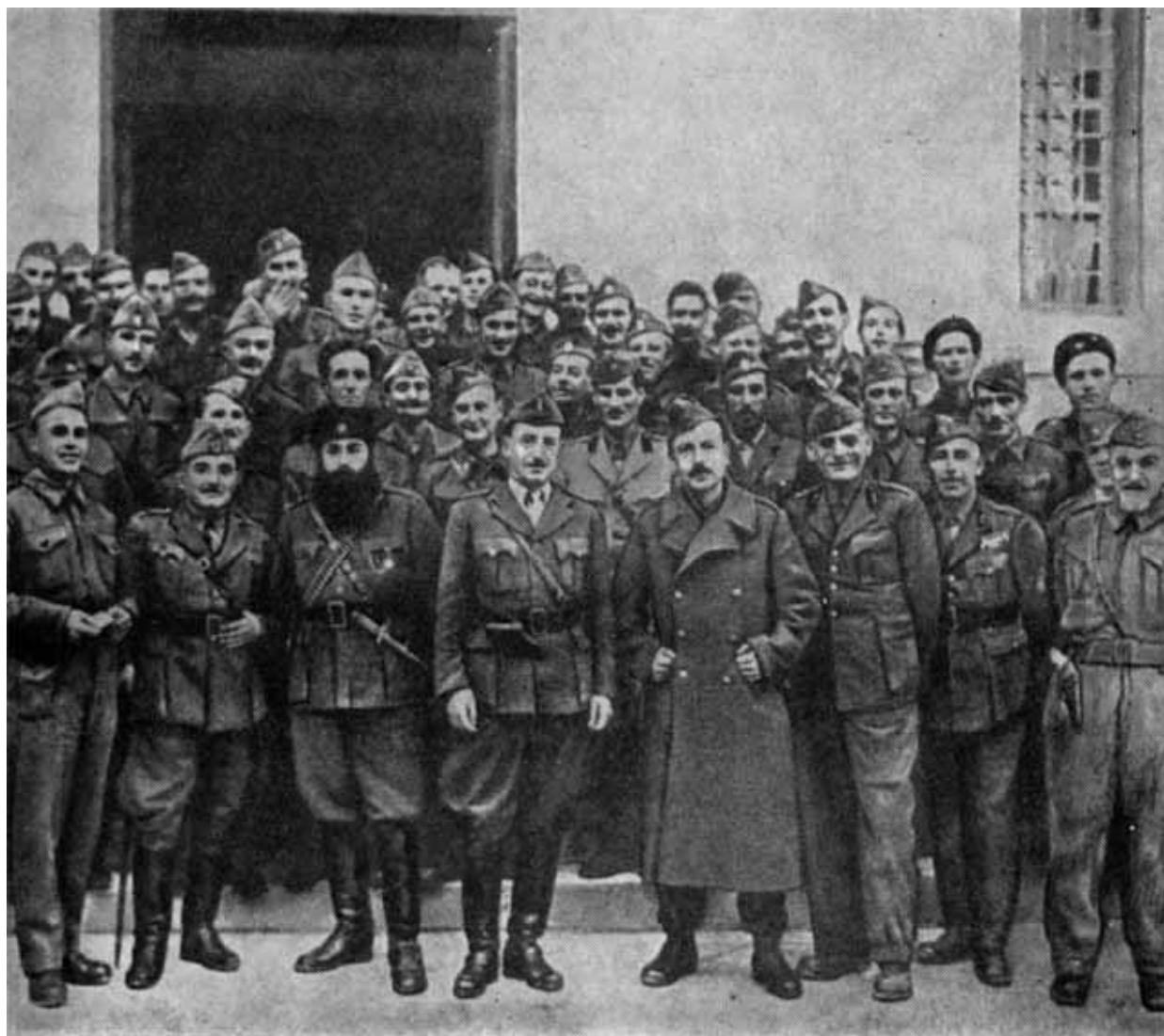
Генеральный штаб ЭЛАС.