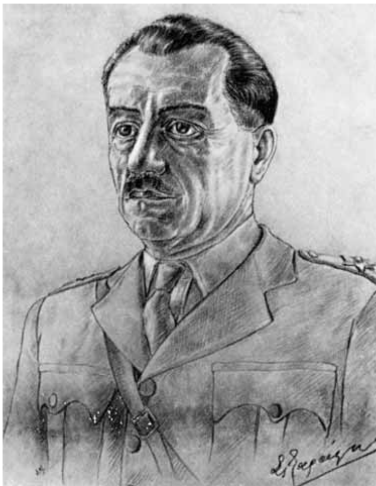
Генерал Стефанос Сарафис, главнокомандующий вооруженными силами ЭЛАС.