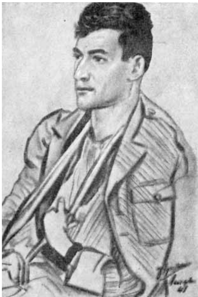
Белояннис после ранения (1948 г.).