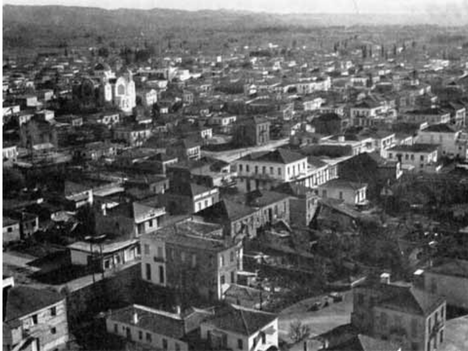
Амальяда — родина Белоянниса.