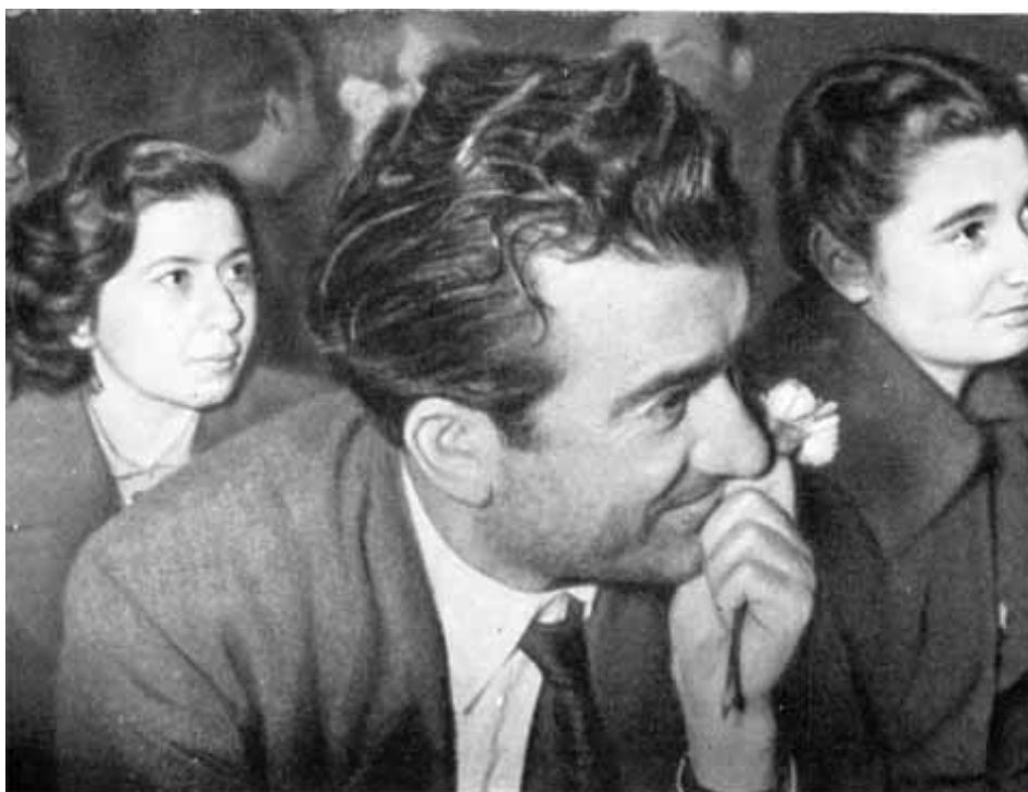
Никос Белояннис во время перерыва судебного заседания.