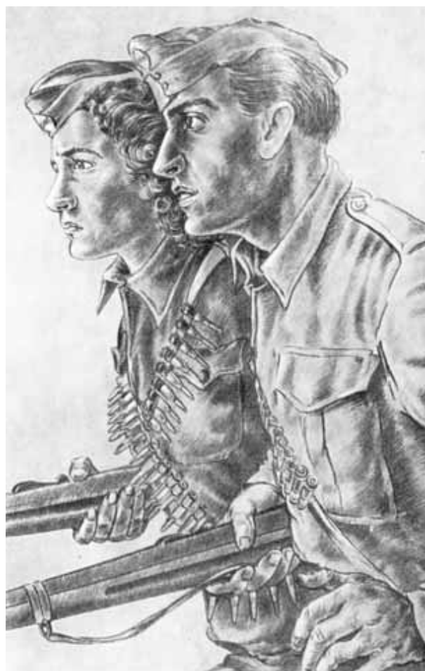
Молодые бойцы ЭЛАС.