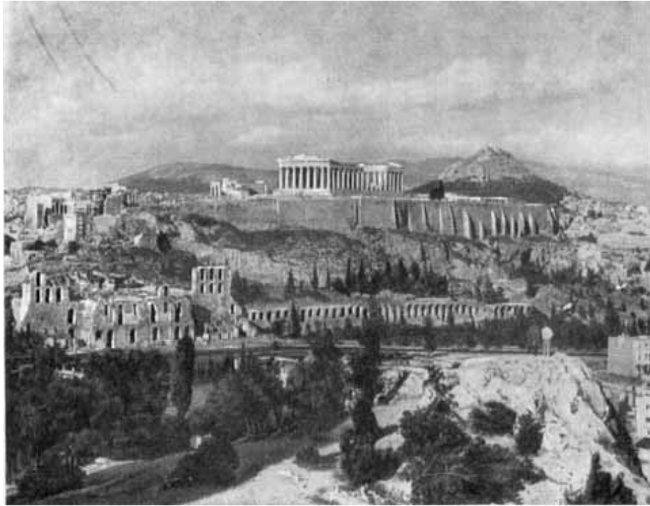
Общий вид Афин.