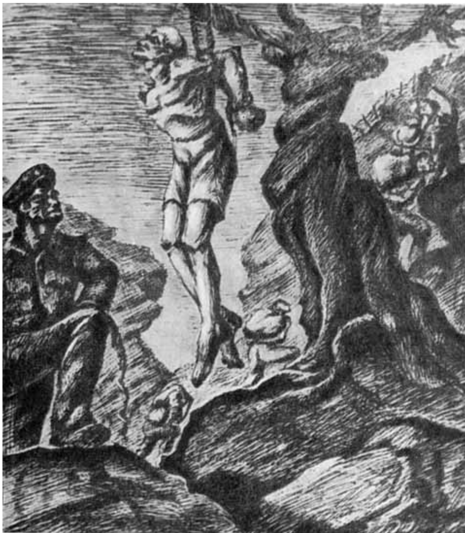
Пытка на острове Юра (рисунок политзаключенного).