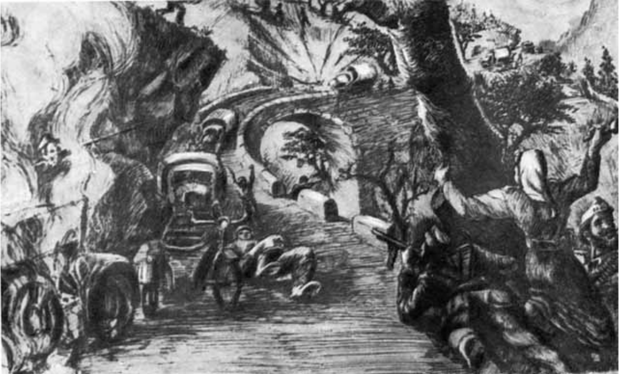
Нападение партизан на фашистскую автоколонну (рисунок политзаключенного).