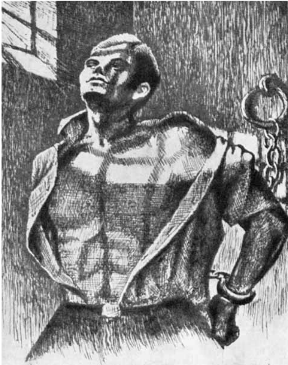
Закованный (рисунок политзаключенного).