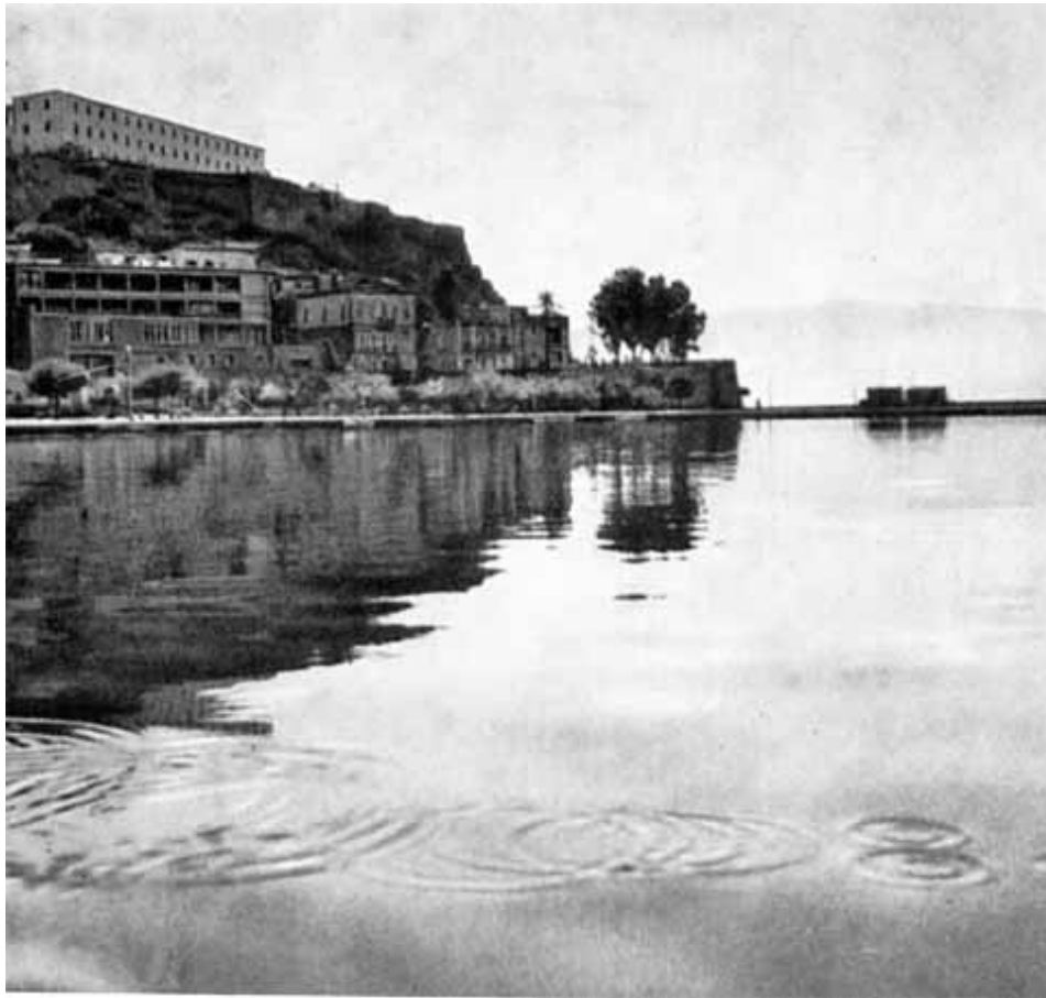
Город Навплион. На горе — тюрьма Акронавплион.