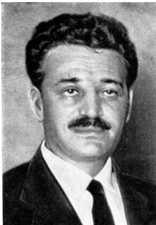
Национальный герой Греции Манолис Глезос.