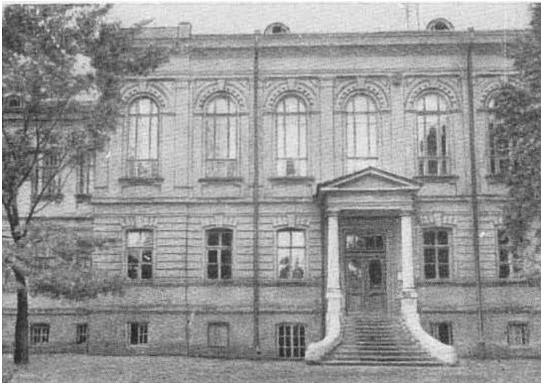
Сабурова дача. Здание пансионата для душевнобольных в Харьковской психиатрической больнице. Конспиративная квартира Артема.