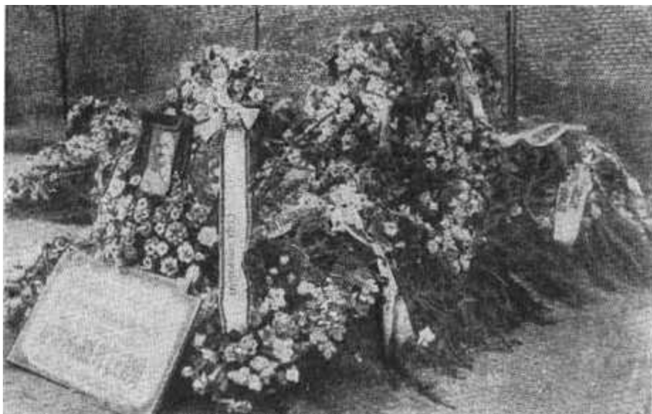
Могила Артема у Кремлевской стены.