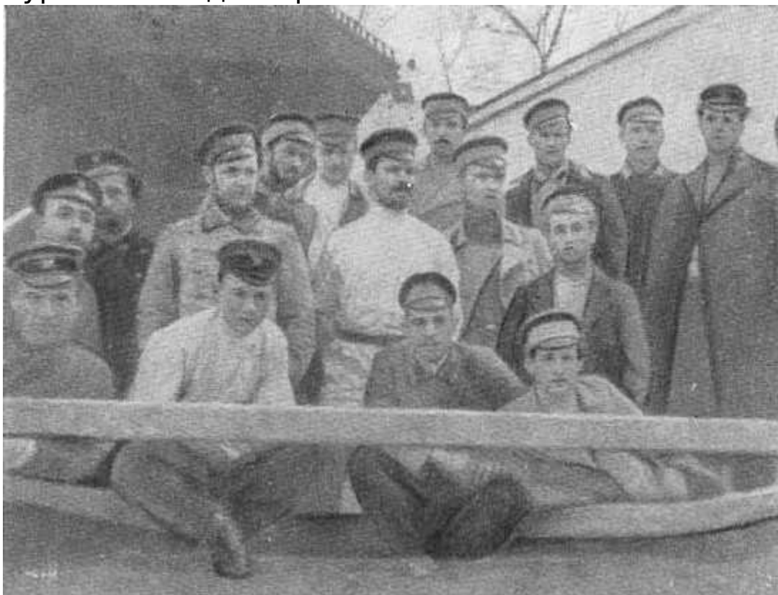
Артем с группой заключенных в Воронежской тюрьме. 1902 г.