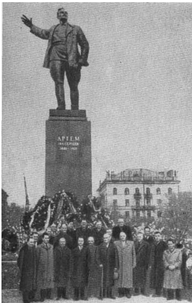
Открытие памятника Артему в городе Артемовске. 1959 г.