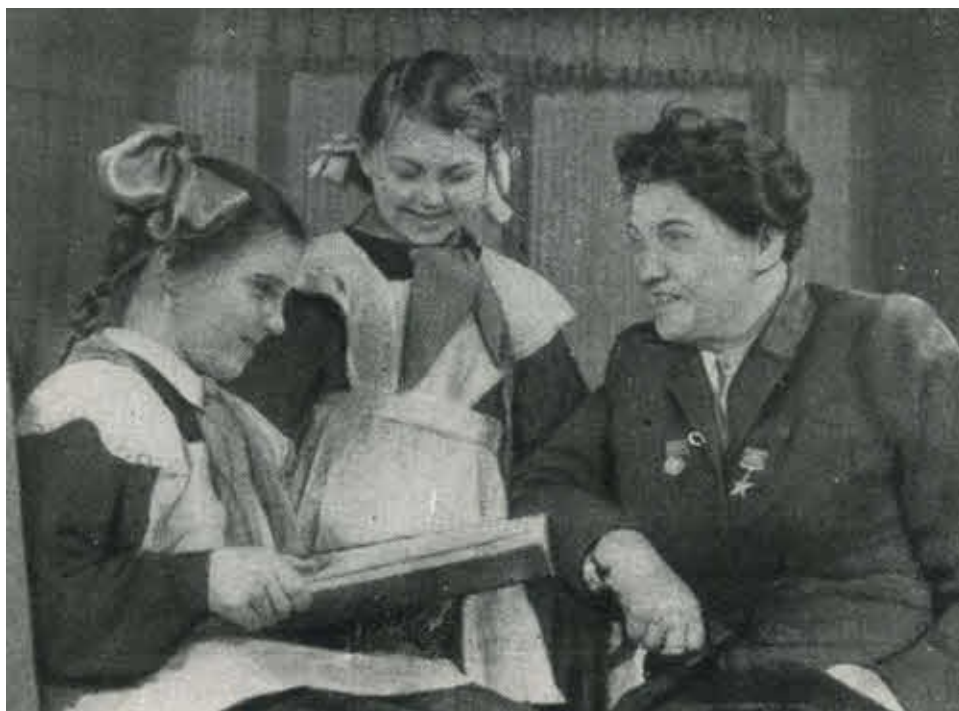
Ангелина в гостях у пионеров. Киев, 1957 г.