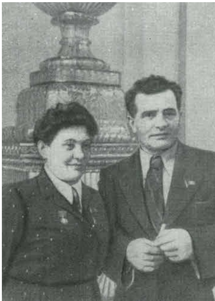
Прасковья Никитична Ангелина и писатель Федор Иванович Панферов на сессии Верховного Совета СССР. Москва, 1954 г.