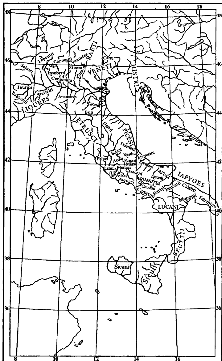
Племена древней Италии