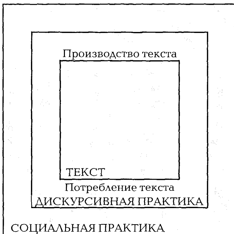
Рисунок 3.1 Трехмерная модель Фэркло для критического дискурс-анализа

Важно понимать, что анализ лингвистических особенностей текста неизбежно повлечет за собой анализ дискурсивных практик, и наоборот 1 . Тем не менее, в модели Фэркло текст и дискурсивная практика представляют два различных измерения и, следовательно, аналитически должны быть разделены.