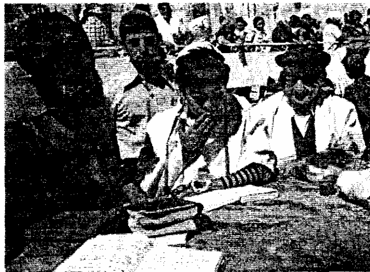
Бар Мицва — праздник совершеннолетия

Многие евреи считают, что «арба миним» придается определенный символический смысл, но, как часто бывает в таких случаях, они не могут договориться, какой именно. В соответствии с одним из «мидрашей», под четырьмя растениями подразумеваются четыре части тела: этрог — это сердце, лулав — позвоночник, мирт — глаза и верба — рот. В другом четыре растения интерпретируются как указание на разные типы людей, где вкус означает Тору, а аромат — добрые дела. В соответствии с этим толкованием, этрог имеет одновременно вкус и аромат и представляет тип человека, который одновременно знает Тору и действует в соответствии с ее предписаниями; плоды лулав (финики), имея вкус, не имеют аромата и представляют тип человека, который изучал Тору, но не делает добрых дел; мирт имеет аромат, но у него нет вкуса, и он представляет, таким образом, тип человека, который делает добрые дела, но не изучает Торы; и наконец, под вербой, которая не имеет ни аромата, ни вкуса, понимается человек одновременно невежественный и себялюбивый. Это наиболее популярное толкова-