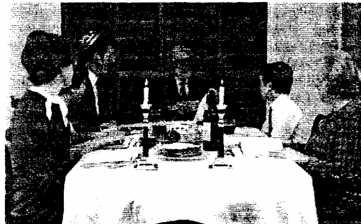
Пэсах — праздник семейный