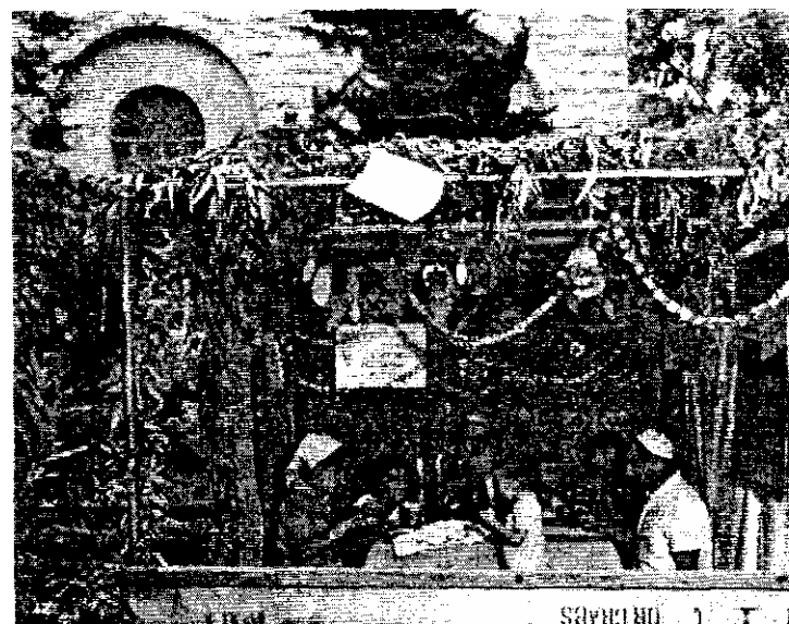
Сукот — праздник Кущей