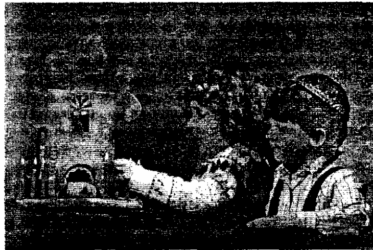
Ханука — праздник Огней

Прятать и затем искать кусочки хамца — широко распространенный ритуал. 14-го числа месяца Нисана устраивают церемонию их поиска, часто всей се-