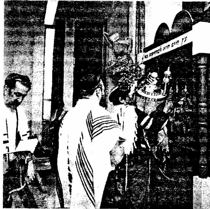
С древнейших времен до наших дней со свитками Закона обращаются с величайшим почтением

Свиток Торы — это пергаментный свиток, на котором написаны первые пять книг Библии. Он тщательно скопирован от руки особыми чернилами профессиональным сойфером (писцом). Алфавит иврита состоит только из согласных букв. Здесь нет огласовки — диакритических знаков печатного варианта, нет знаков пунктуации, отсутствуют музыкальные обозначения над буквами, которые направляли бы читающего во время пения. Все это делает чтение свитков Торы нелегкой задачей, и многим, кто, возможно, хотел бы быть удостоенным чести читать Тору, недостает навыков в иврите. В сефардских общинах свиток Торы укреплен на двух роликах внутри тяжелого деревянного или металлического ящика с резьбой или гравировкой