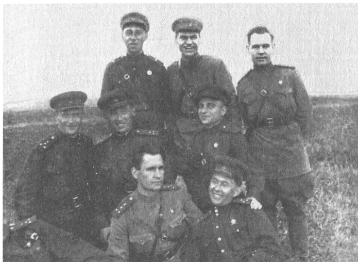
Офицеры одного из отделов военной контрразведки «СМЕРШ». 1943 г.