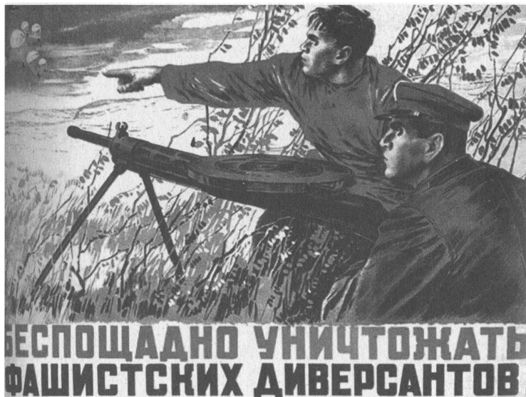
Плакат художника П.Мальцева «Беспощадно уничтожать фашистских диверсантов».

Докладная записка на имя И.В.Сталина об утверждении штата Главного управления контрразведки «СМЕРШ». 1943 г.