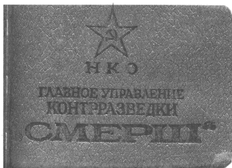
Удостоверение сотрудника «СМЕРШа».