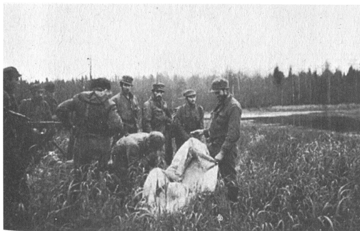
Немецкая разведывательно-диверсионная группа выдвигается на задание после десантирования в тыл Красной Армии. 1942 г.