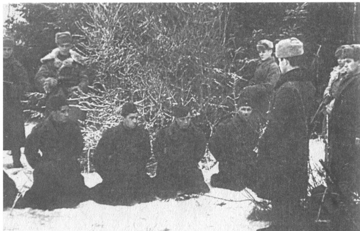
Задержание немецкой разведывательно-диверсионной группы сотрудниками «СМЕРШа».