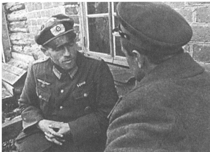
Допрос пленного немецкого офицера. 1942 г.