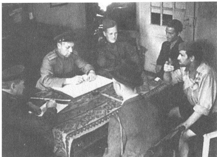
На сборно-пересыльном пункте.