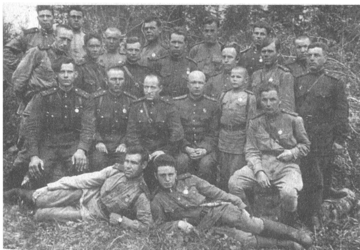
Сотрудники одного из отделов военной контрразведки «СМЕРШ». 1943 г.