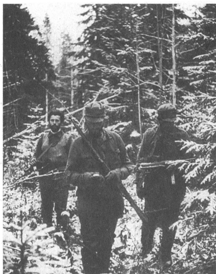
Приземление немецкой разведывательно-диверсионной группы в тылу Красной Армии. 1942 г.