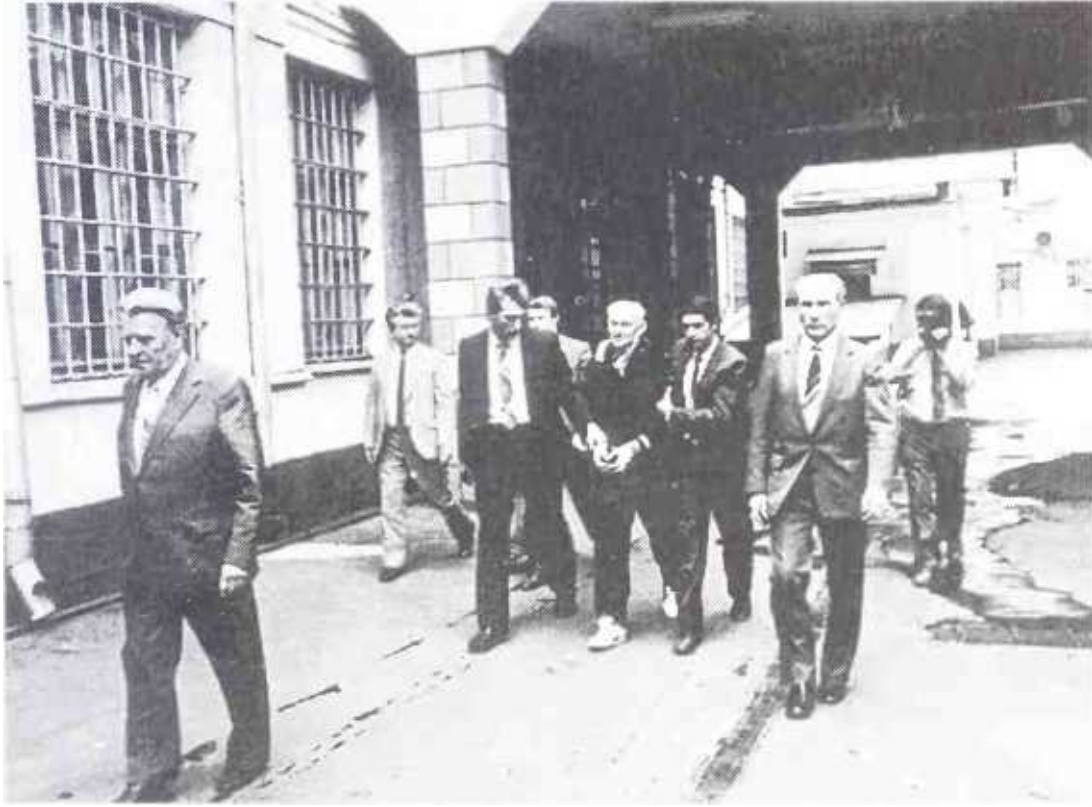
Один из самых высокопоставленных «кротов» — генерал ГРУ Поляков в Лефортово. (На снимке в наручниках).