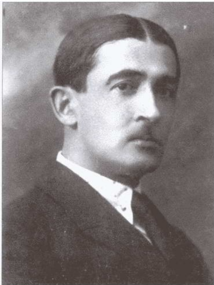
С. Г. Могилевский. 1914 г.