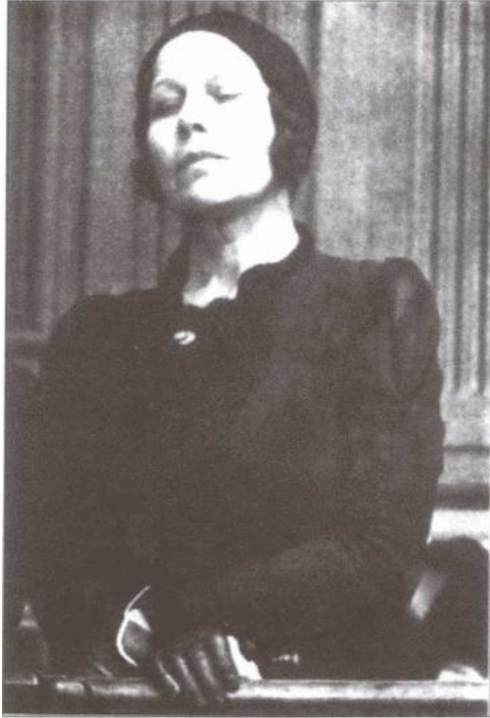
Н.В. Плевицкая на скамье подсудимых. Париж, 14 декабря 1938 г.