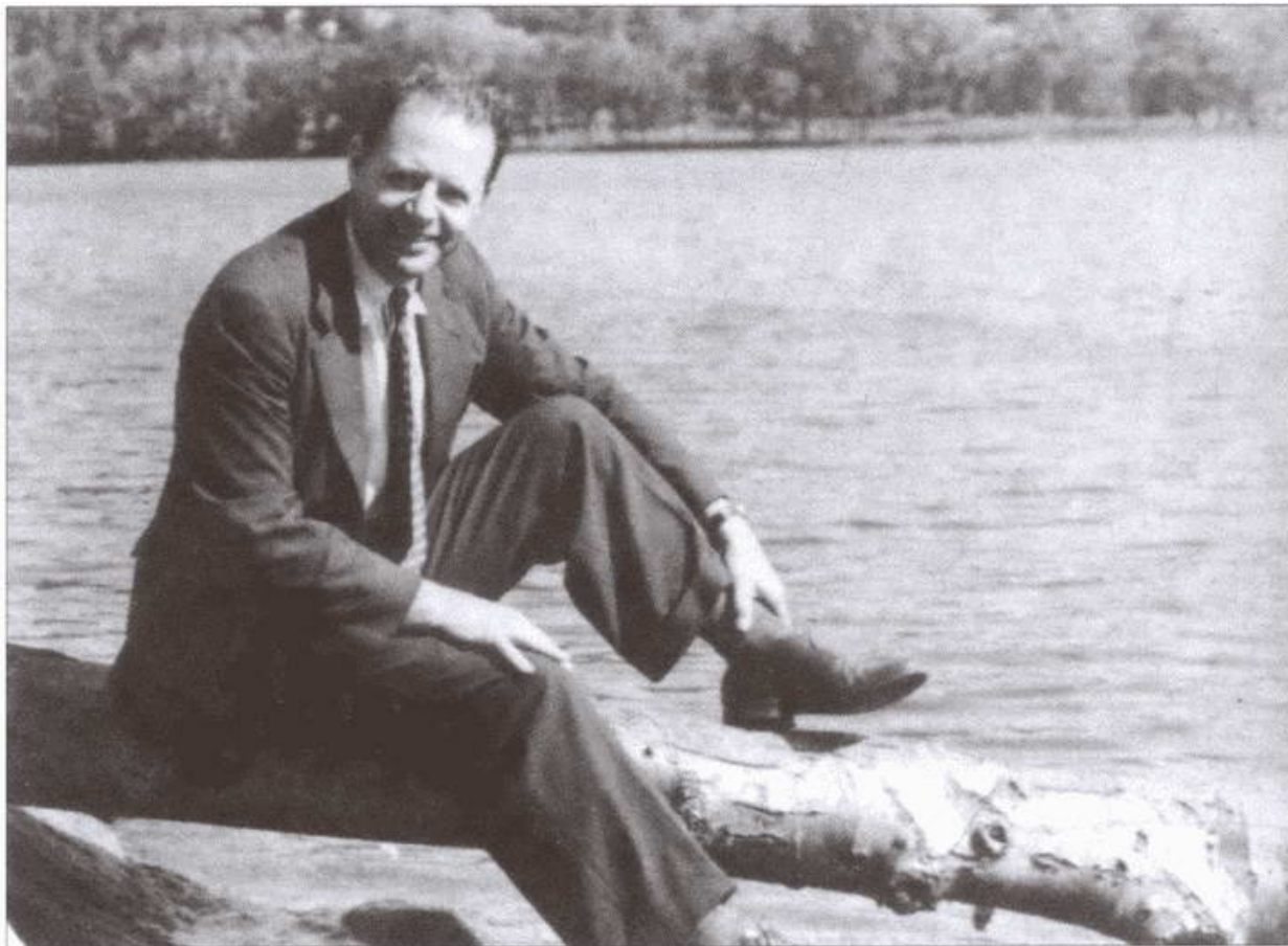
Резидент «Кин». США, 1936 г.