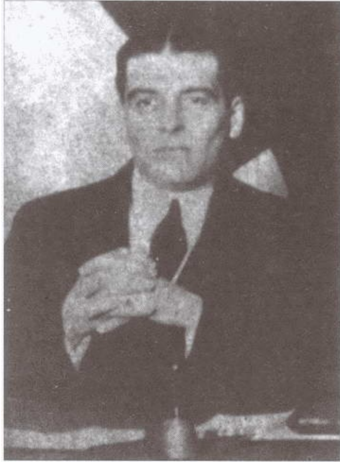
Сергей Николаевич Третьяков