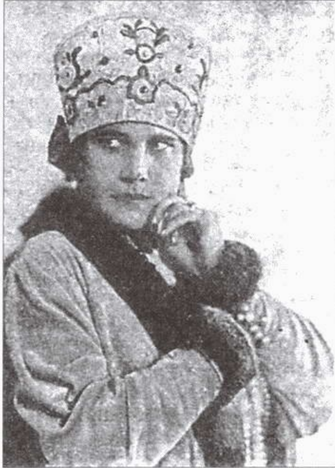
Надежда Плевицкая в сценическом костюме. 1930-е годы