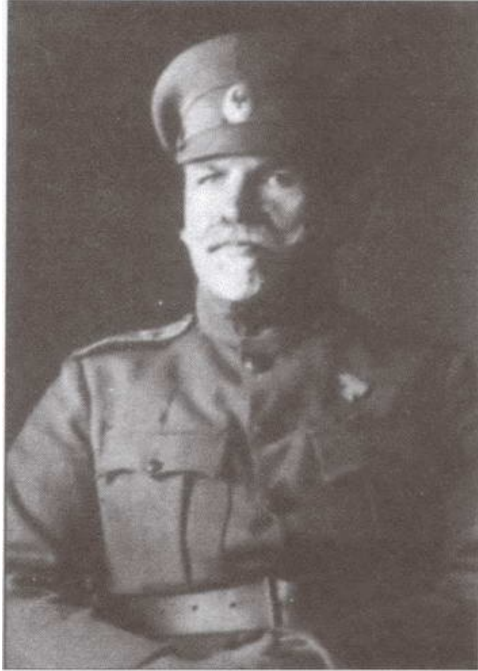
Генерал Ф. Ф. Абрамов