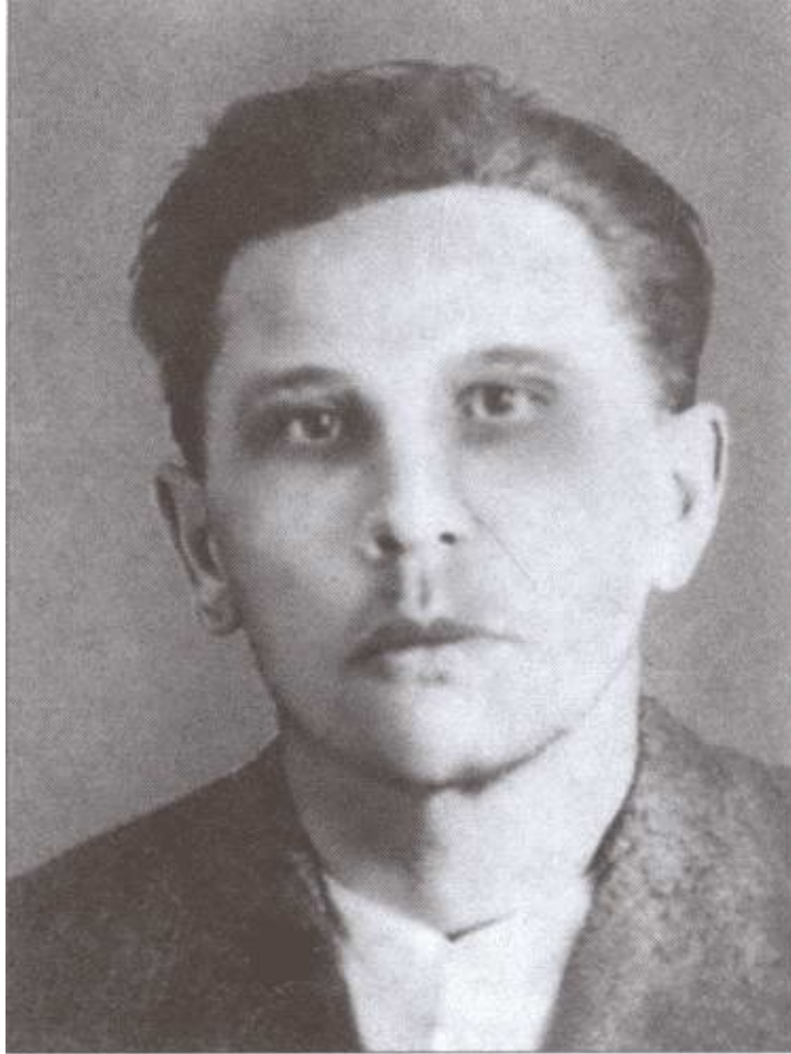
С.М. Глинский. Тюремный снимок, 1937 г.