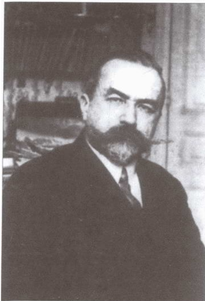
Генерал Е.К. Миллер, председатель РОВС. Париж, середина 1930-х годов