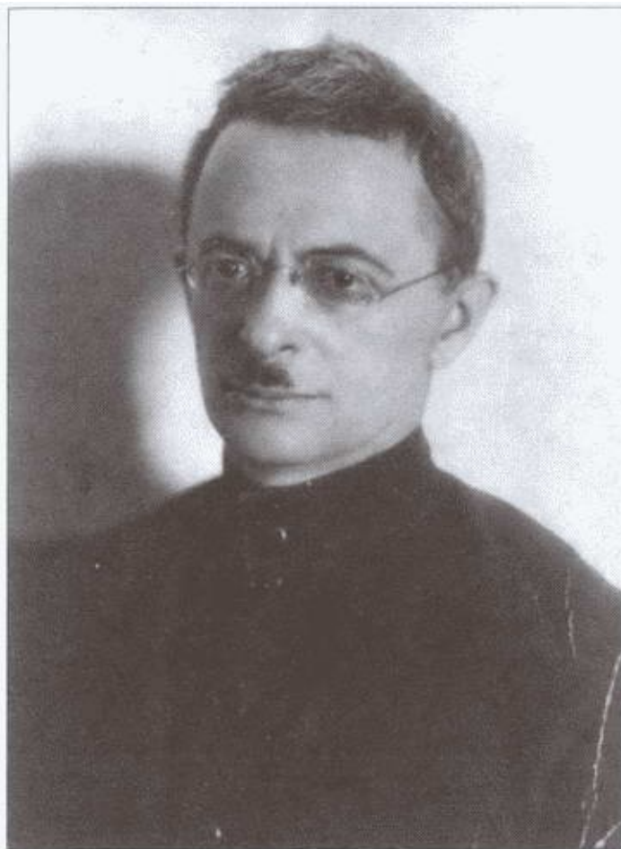
Начальник МНО ОГПУ М.А. Трилиссер. 1926 г.