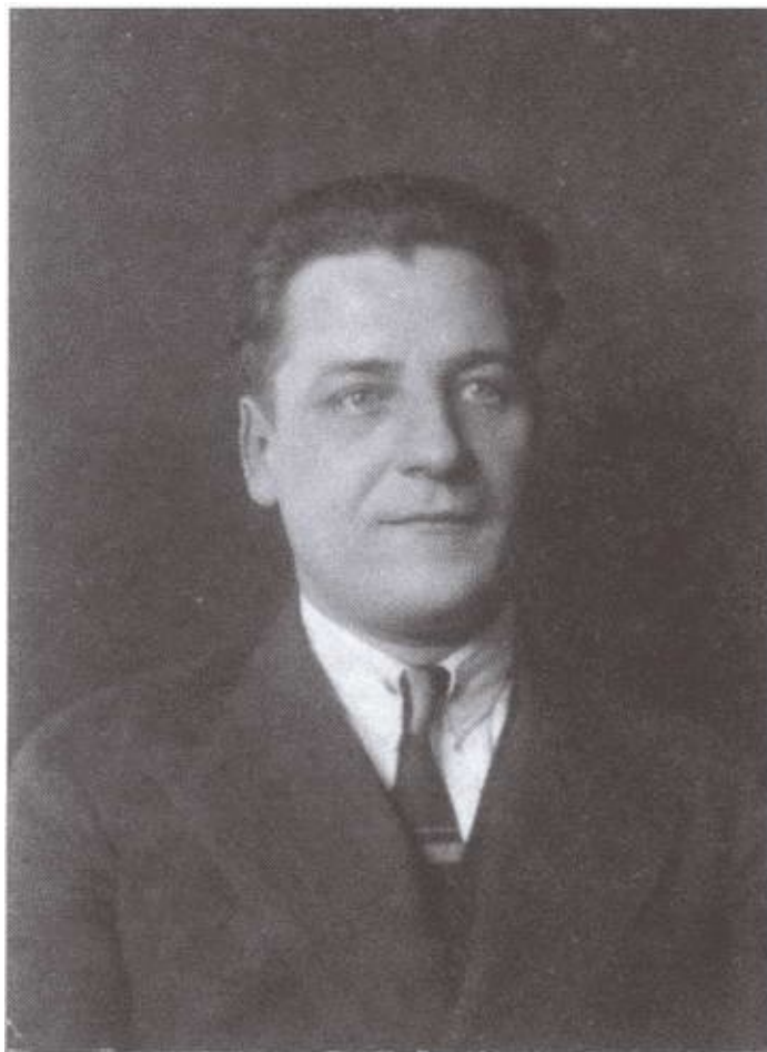
Николай Волленберг. Данциг, 1935 г.