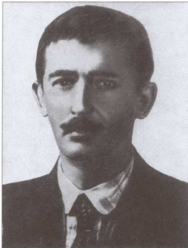
Начальник ИНО ВЧК С. Г. Могилевский. 1921 г.