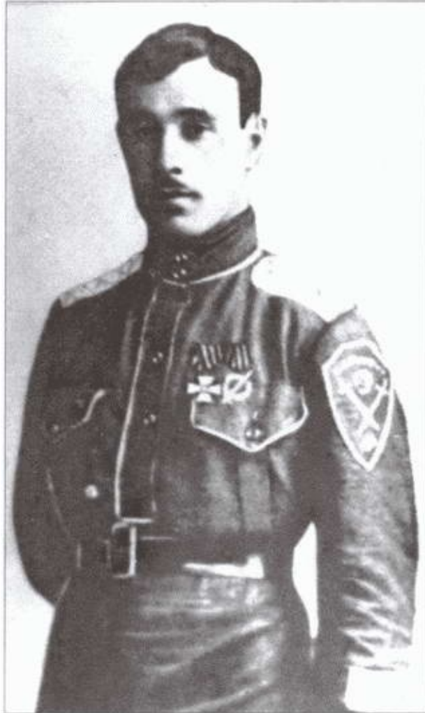
Генерал Н.В. Скобаин