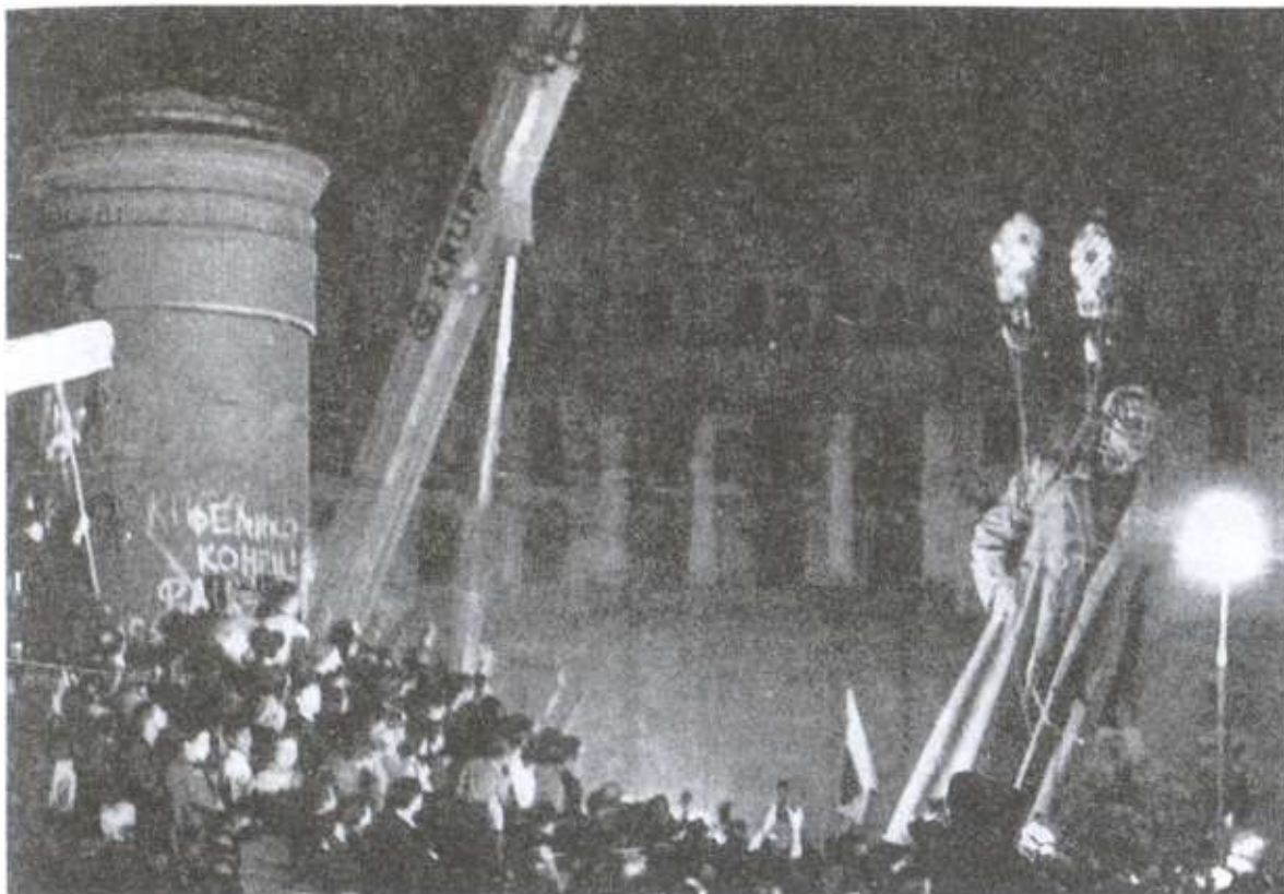
Снос памятника Ф. Дзержинскому