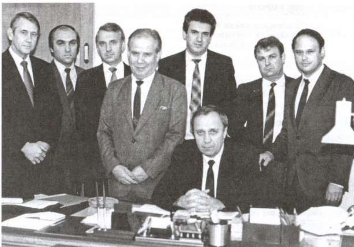
Российский КГБ, Август 1991 года.

По уполномочию Президента СССР Председатель КГБ СССР В Крючков