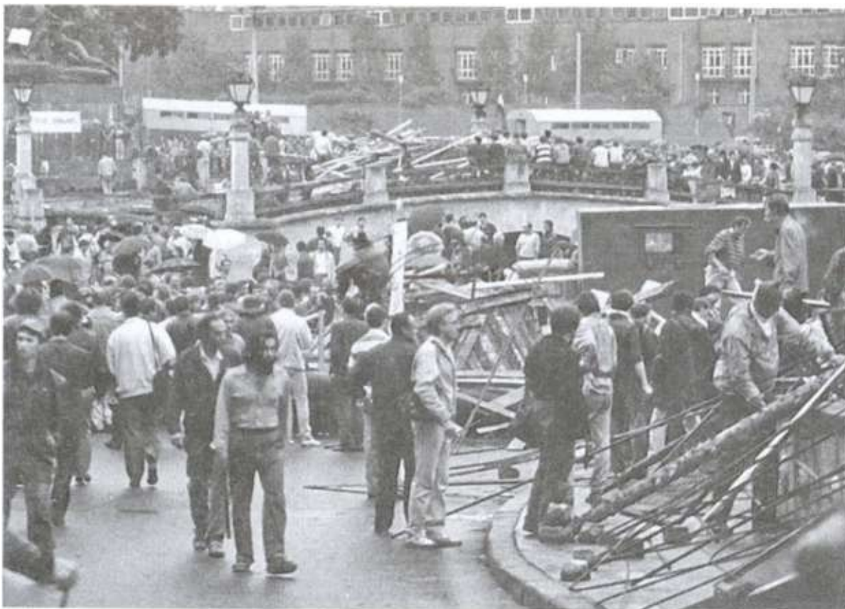
Толпы «защитников Белого дома». 19 августа 1991 года