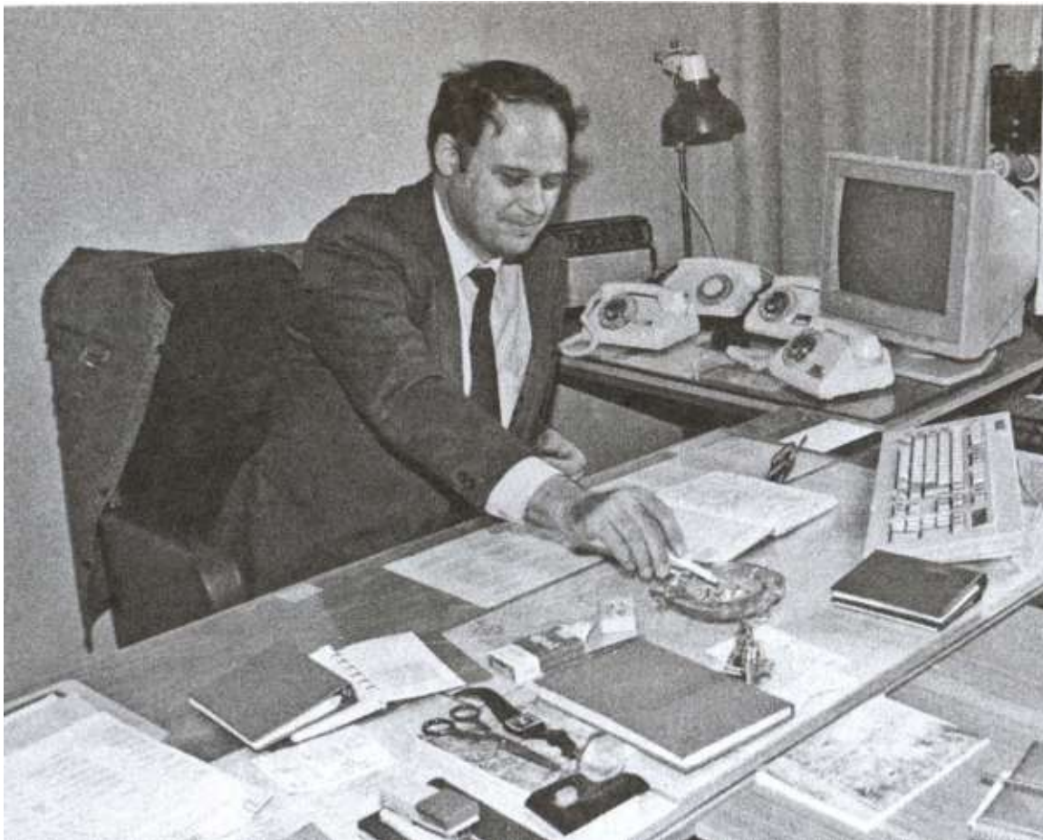
Помощник председателя КГБ РСФСР А.С. Пржездомский