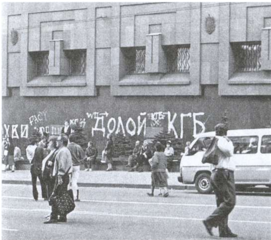
У главного здания КГБ СССР в августовские дни 1991 года