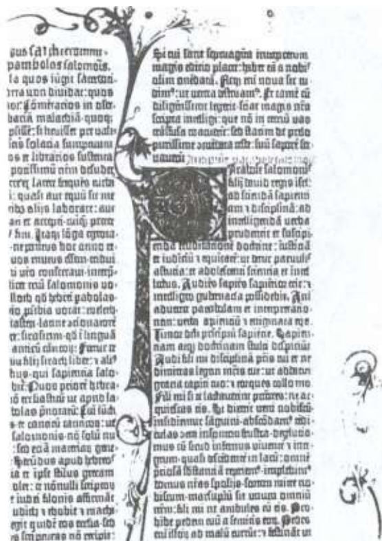
Страница из «Библии» Гутенберга