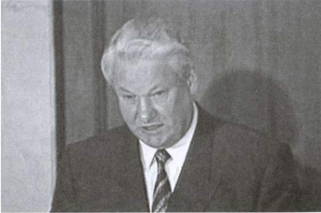
Президент России Б.Н. Ельцин выступает перед чекистами