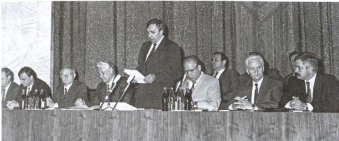
Президиум Всероссийского совещания руководящего состава органов КГБ. 20 июля 1991 года