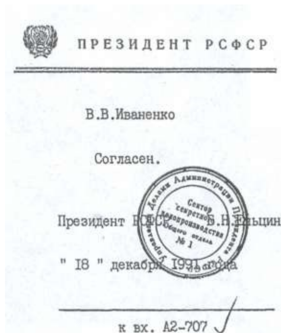
Поручение Б.Н. Ельцина