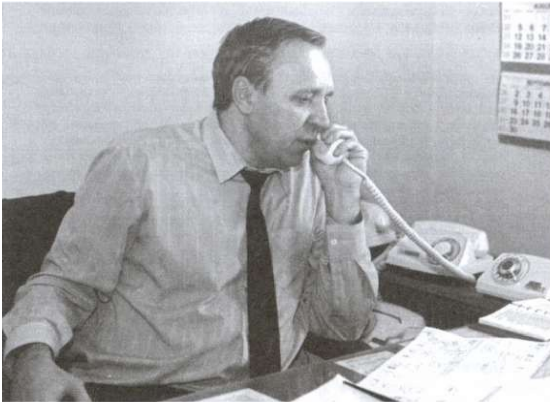
Председатель КГБ РСФСР генерал-майор В.В. Иваненко