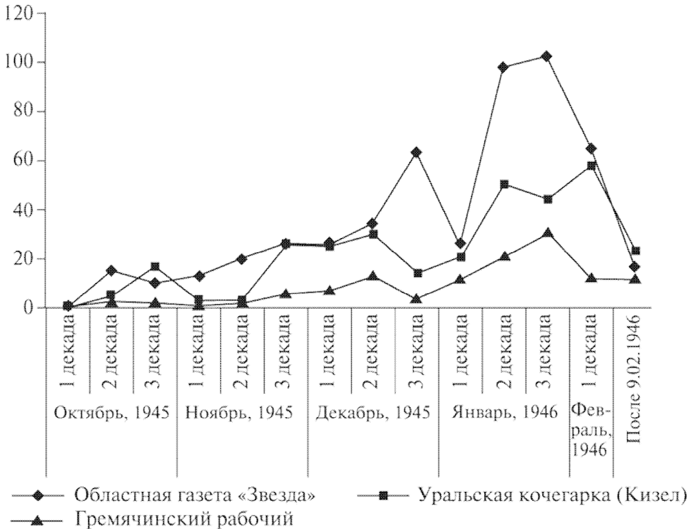
Рис. 1. Динамика газетных публикаций в период выборов в Верховный Совет СССР 1945–1946 гг. (по областной и двум городским газетам)