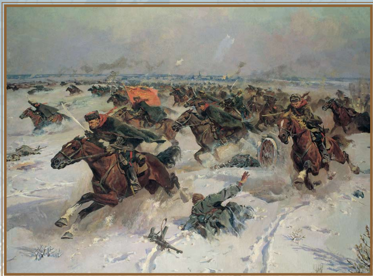
П. А. Кривоногов. Советская конница в боях под Москвой (фрагмент)

Натиск врага был неудержим и страшен. Тысячи фашистских танков рвались к Москве, тучи самолетов нависли над советскими городами и сбрасывали на них смертоносные бомбы. Гитлеровцы залили захваченные территории кровью, не щадя ни старых, ни малых. Гитлер хвастливо заявлял, что закончит войну с Россией в течение нескольких недель. Но и под Брестской крепостью, и под Смоленском, Киевом, Ельней и Тулой враг продвигался с тяжелыми боями и всюду встречал героическое сопротивление. А вот под Москвой гитлеровцы не только получили решительный отпор, но и потерпели от советских войск серьезное поражение, после которого были вынуждены отступить.