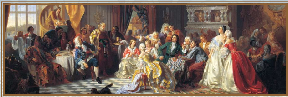
С. Хлебовский. Ассамблея при Петре I (фрагмент)

К середине восемнадцатого века Россия становится одной из стран, которые тогда определяли судьбы мира. Расширяется ее территория, укрепляются позиции на Западе и Востоке. Вместе с тем грандиозное петровское обновление носило ограниченный характер. Страна, хоть и обладала огромной военной силой, по своим порядкам по-прежнему во многом оставалась средневековой, основанной не на вольнонаемном, а на крепостном труде зависимых людей. Частное предпринимательство было под жестким контролем государства, свободные рыночные отношения тоже были скованы постоянным вмешательством государства с его раздутым чиновничьим аппаратом.