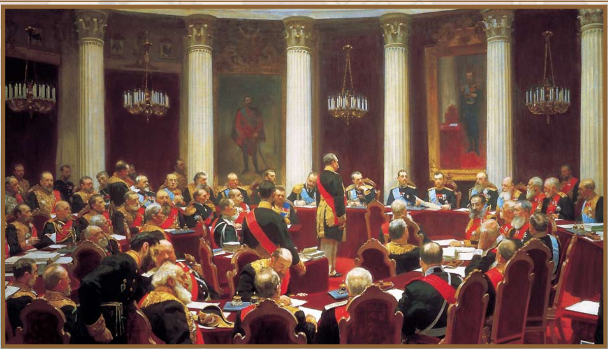
И. Е. Репин. Торжественное заседание Государственного Совета 7 мая 1901 года в честь столетнего юбилея (фрагмент)

бочих, вместе с женами и детьми направлявшихся к Зимнему дворцу, был открыт огонь на поражение, до сих пор не до конца ясно. Манифестанты хотели встретиться с царем, рассказать ему о невыносимой жизни, попросить у него помощи и защиты. Священник Г.А. Гапон, который был тайным агентом Охранного отделения полиции, сыграв роль провокатора, обнадежил рабочих и заверил, что император их примет. Результат — больше тысячи убитых, две тысячи раненых. В числе жертв — дети.