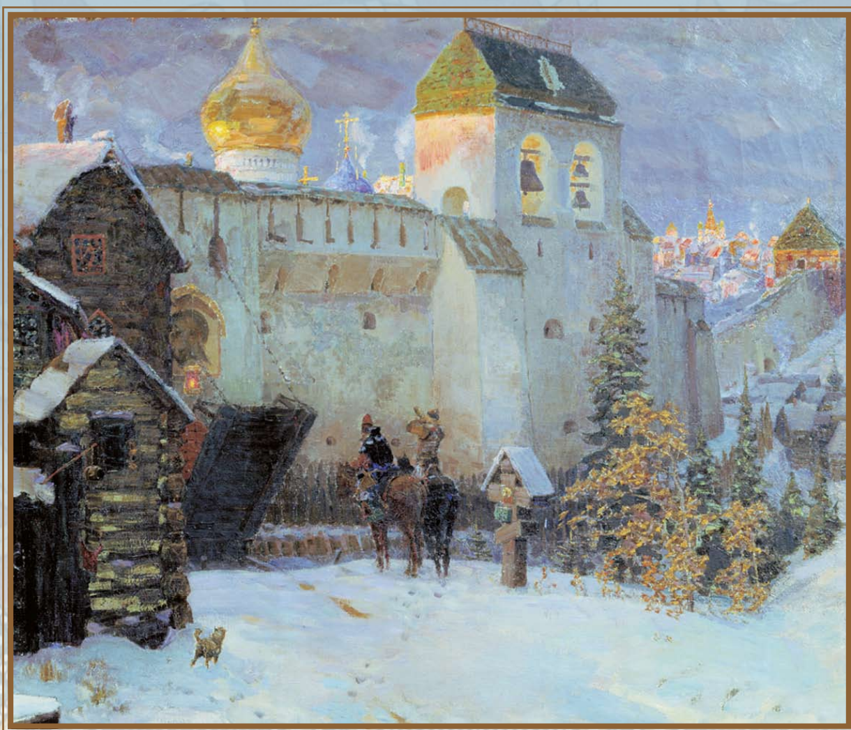
А. М. Васнецов. Старорусский город (фрагмент)

Если Юрий Долгорукий, сидя в Залесье, всеми помыслами был в Киеве, то его сын Андрей еще при жизни отца избрал своей резиденцией Владимир, и впоследствии этот город стал столицей его княжества. А рядом, в двенадцати верстах, повелел он поставить крепость Боголюбов, разместив там церковь и замок, куда и перебрался на постоянное жительство. Оттого, а также за великую набожность прозвал народ князя Боголюбским. Много сделал Андрей Юрьевич для процветания Владимиро-Суздальского княжества, но слишком высоко себя поставил и круто, ни с кем не считаясь, проявлял власть. В результате недруги устроили против него заговор, и он пал их жертвой.