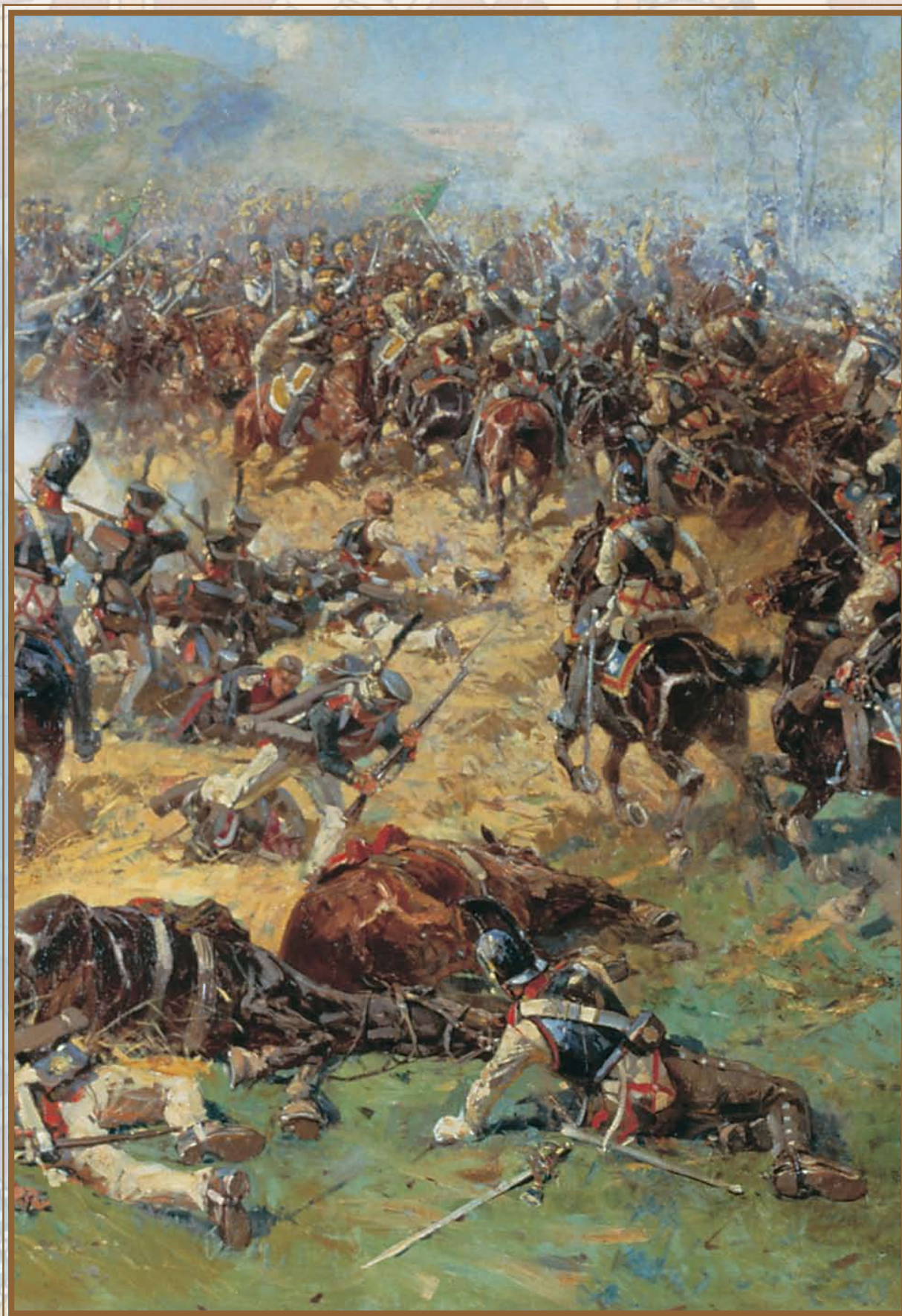
Ф. А. Рубо. Сражение при Бородино 26 августа 1812 года (фрагмент)