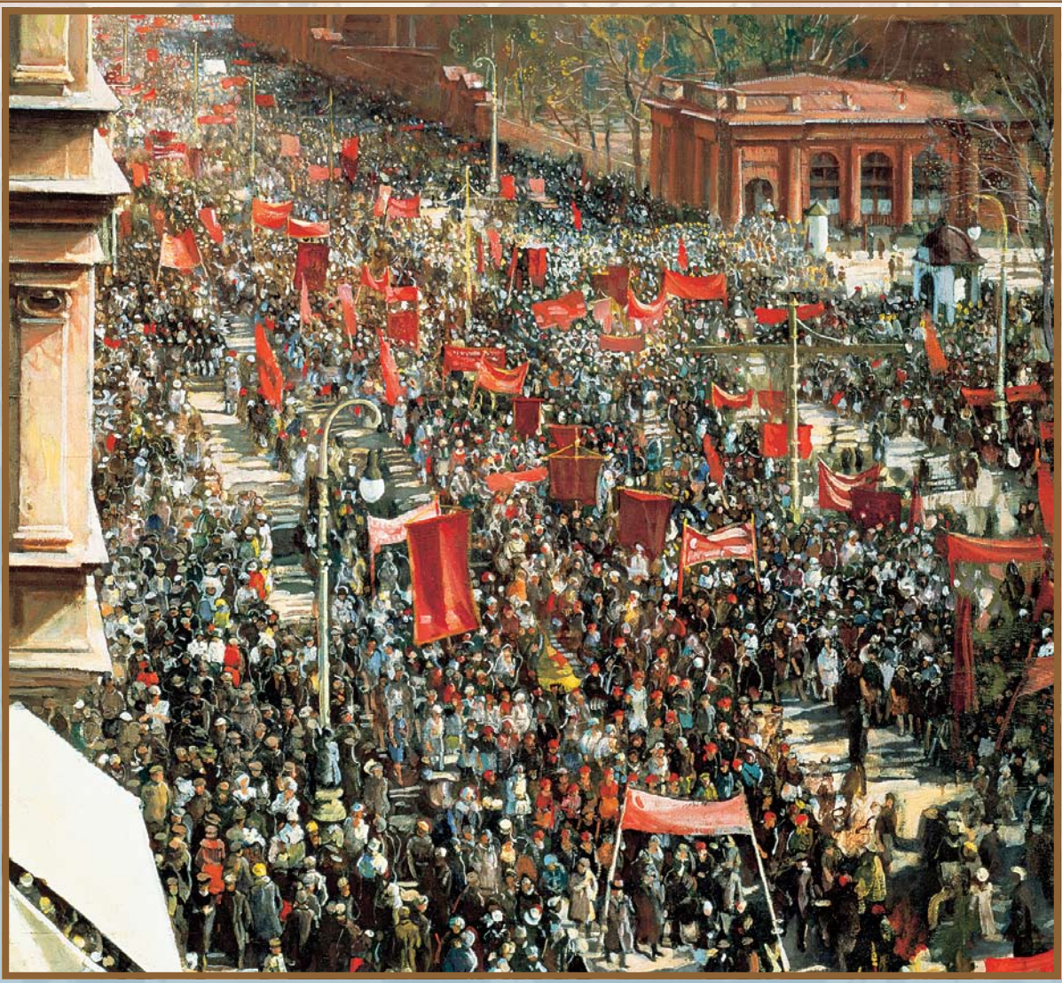
И. И. Бродский. Демонстрация (фрагмент)

но, получено, посеяно, добыто из недр земли... Стройки советских пятилеток вошли в историю. Ведь сооруженные в те годы заводы, фабрики, гидроэлектростанции, аэродромы, проложенные транспортные пути и каналы превратили еще недавно лежавшую в послевоенной разрухе страну в могучее государство. СССР производил самолеты и автомобили, океанские суда и турбины, а также много разной военной техники.