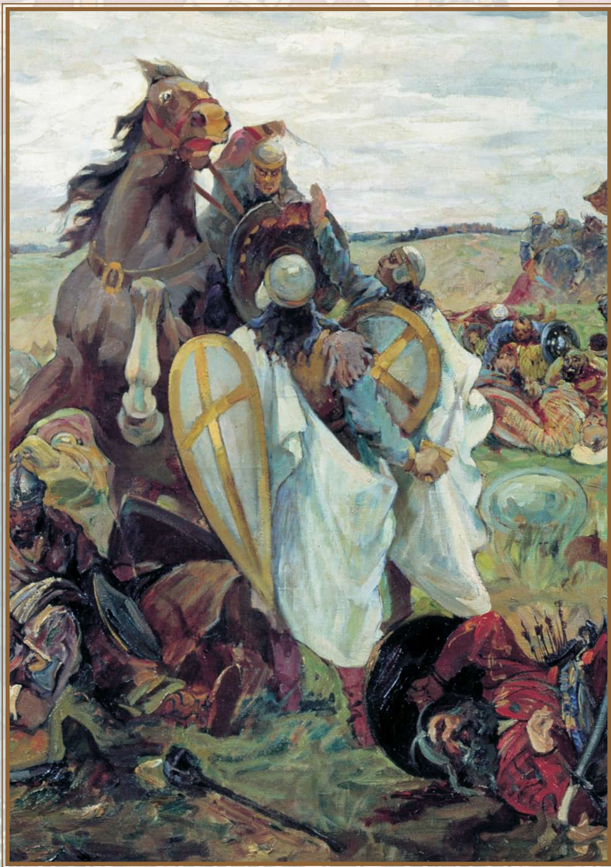
С. Н. Архипов. Схватка русских с татарами. XIII век (Бой богатырей с татарами). (Фрагмент)