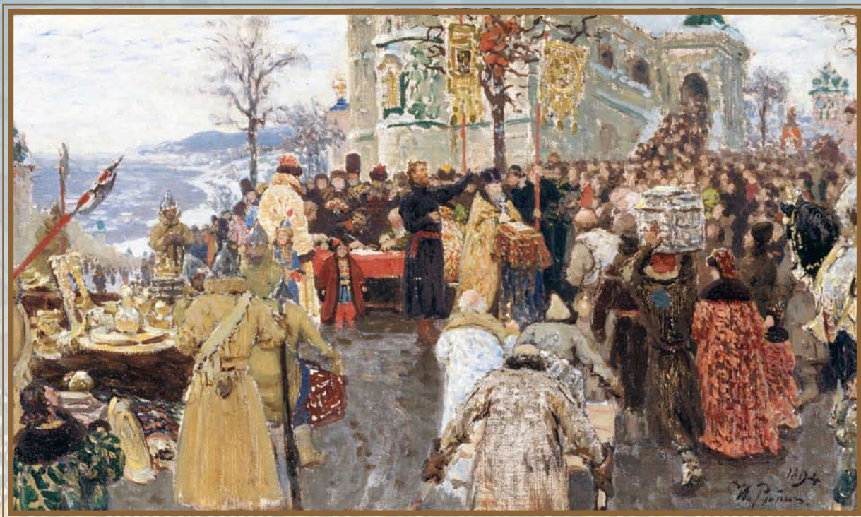
И. А. Репин. Кузьма Минин (фрагмент)

По призыву Минина начался сбор денег и ценностей на ополчение — войско из добровольцев. Недостатка в них не было. Что ни день приходили в Нижний привычные к ратному делу люди: стрельцы, пушкары, вольные казаки... Во главе ополчения встал опытный воевода князь Дмитрий Пожарский. Вместе с Мининым он повел русские полки к Москве. В ходе боев поляки были выгнаны из столицы России, сражения с неприятелем закончились победой русских сил. Москва была освобождена от захватчиков 4 ноября 1612 года. Сегодня эта дата празднуется как День народного единства и отмечена в календаре красным цветом.