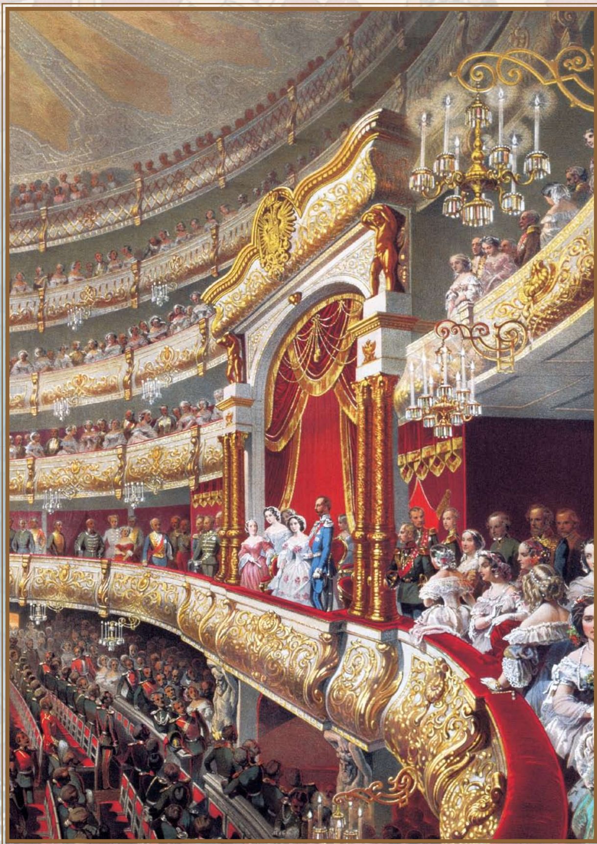
М.А. Зичи. Спектакль в московском Большом театре по случаю священного коронования императора Александра II (фрагмент)