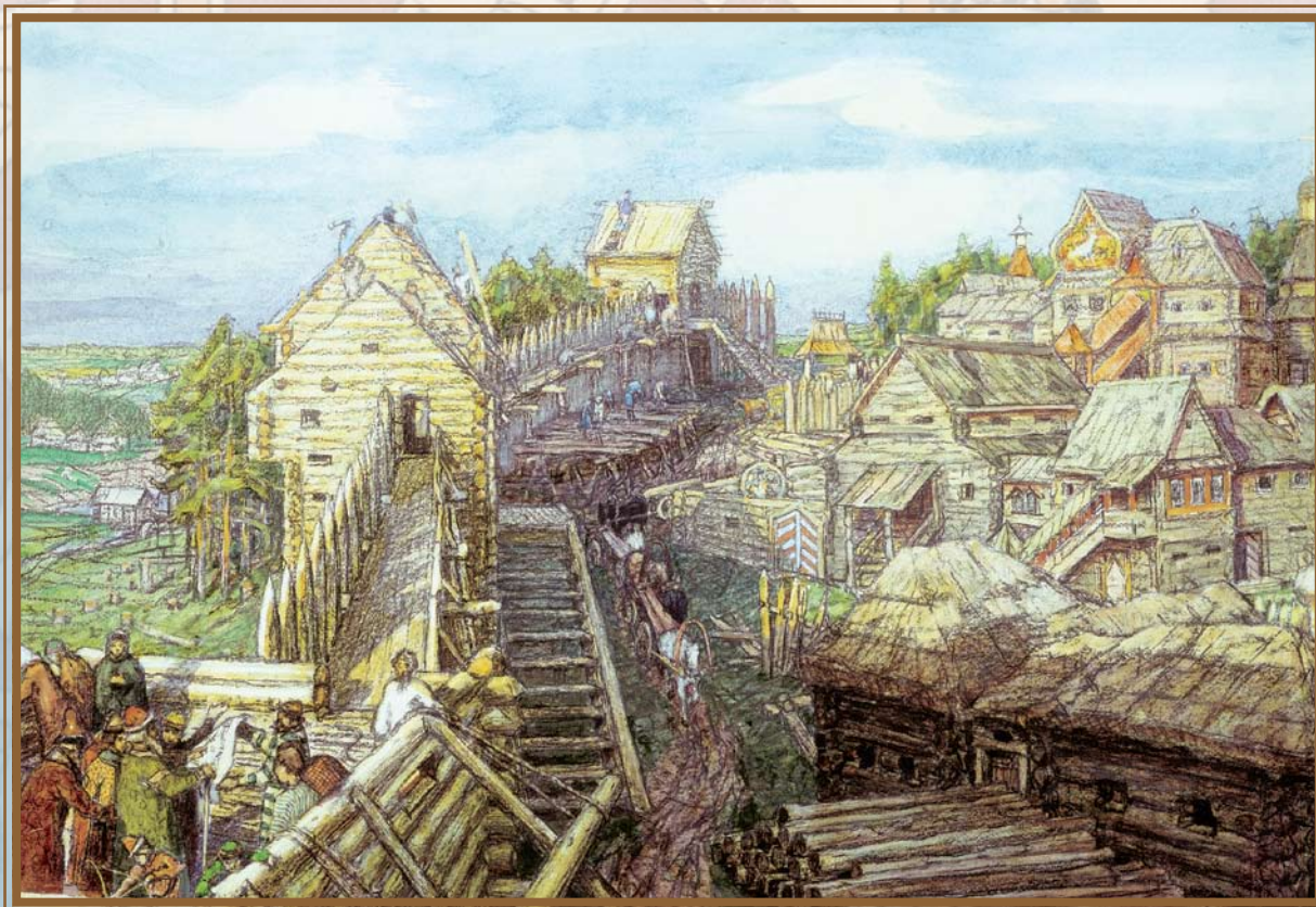
А.М.Васнецов. Строительство деревянных стен Кремля

когда собирался с кем-то воевать. Его военные походы во второй половине десятого века расширили границы Руси. Он тоже достиг Византии и вступил в единоборство с войском этой могучей державы, но потерпел поражение и на обратном пути в Киев попал в засаду и погиб.