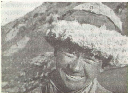
Рис. 1. Акпай.

— На степи сурок 1) с сурчатами, что верблюдов с верблюжатами.