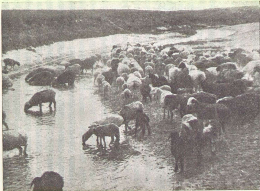
Рис. 3. На водопое.