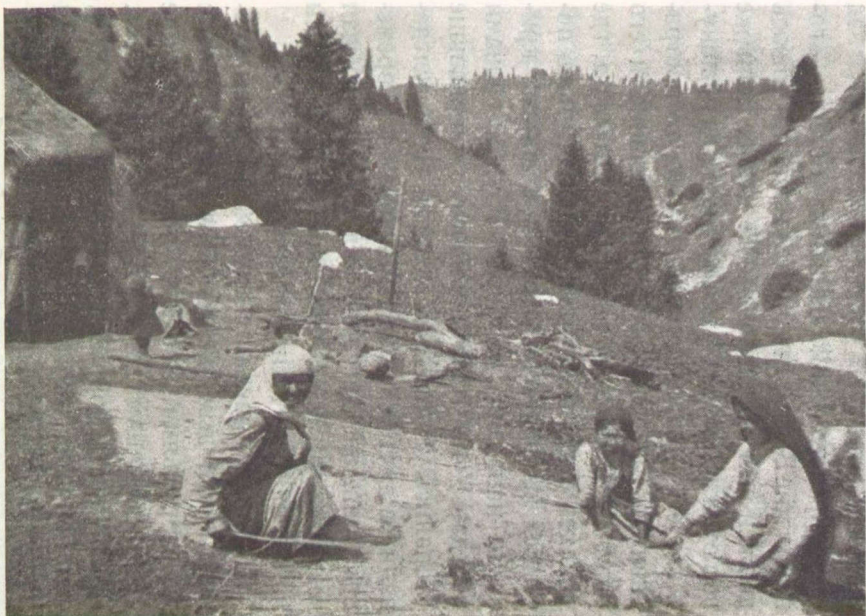
Рис. 6. Приготавливают шерсть для войлока.