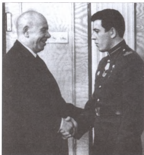
Ю.В. Бабанский (справа) во время награждения в Кремле. Апрель 1969 г.