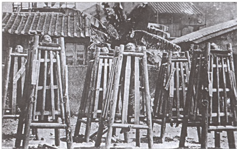
Захваченные «боксеры» в клетках смерти