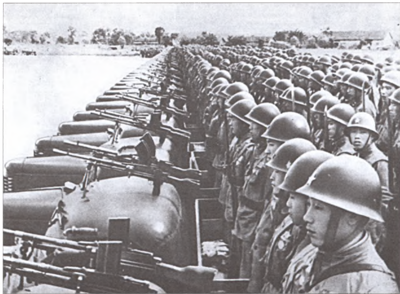
Бойцы Народной освободительной армии Китая. 1951 г.