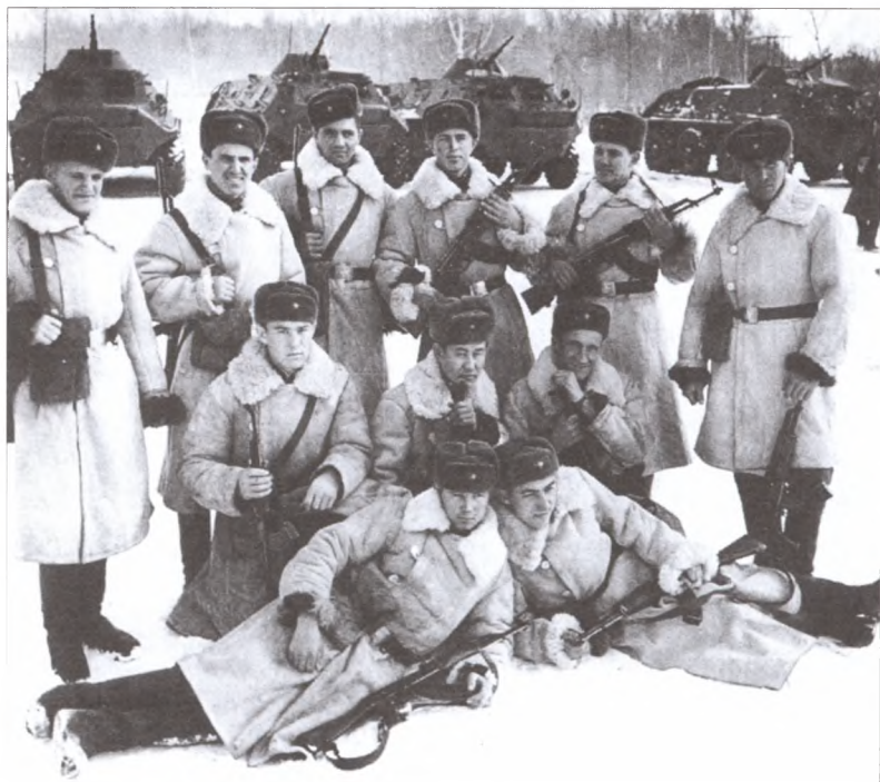
Группа советских бойцов — защитников о. Даманский. 1969 г.