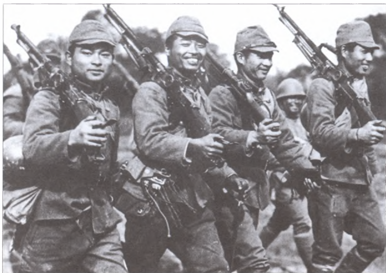
Шеренга японских солдат на марше с трофейными пулеметами. На плечах у японских солдат пулеметы, захваченные в ходе боев с китайской армией: чешские ZB 26/30 и бельгийский FN1928 (на основе американского BAR). Китай, 1939 г.