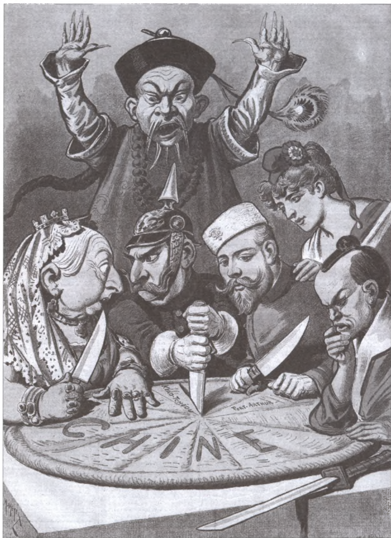
Раздел Китая европейскими державами и Японией. Карикатура 1890-х гг.