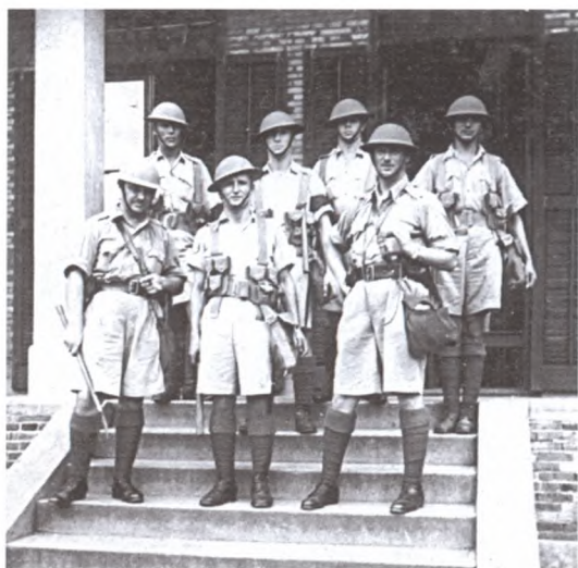
Чины Русского полка ШВК