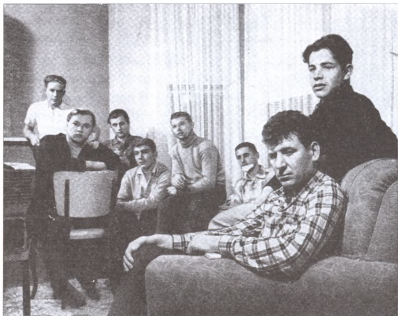
Экипаж танкера «Туапсе»