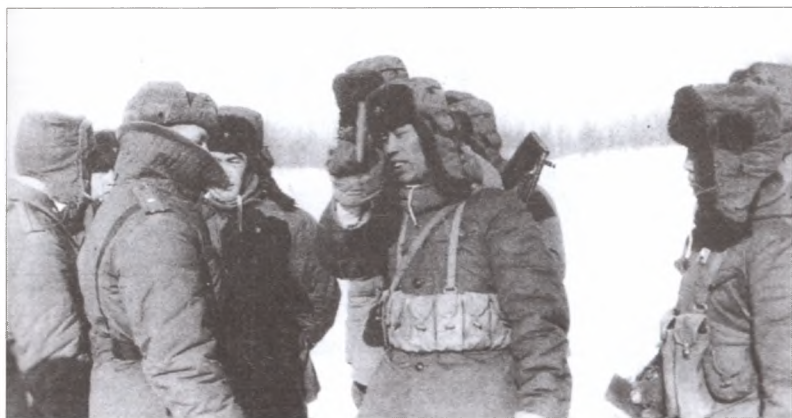
Провокация на советско-китайской границе. Конец 1960-х гг.