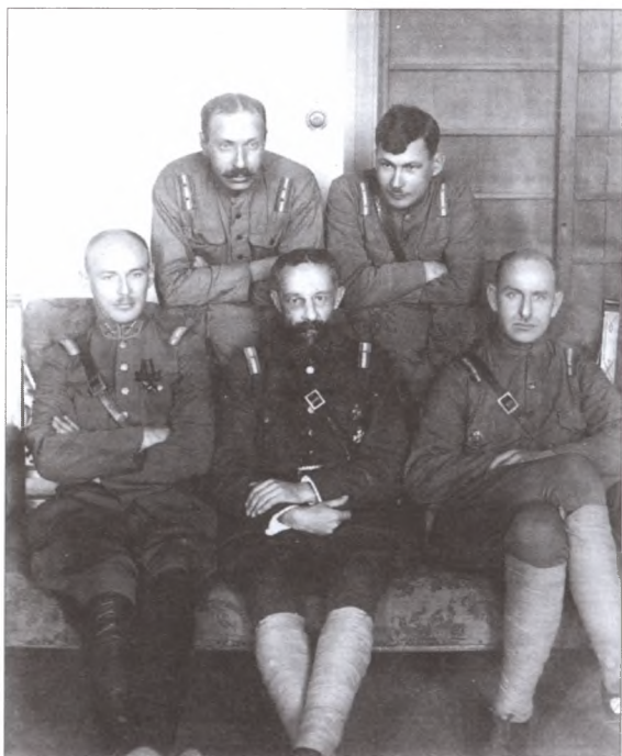
Офицеры Русской группы армии Чжан Зунчана