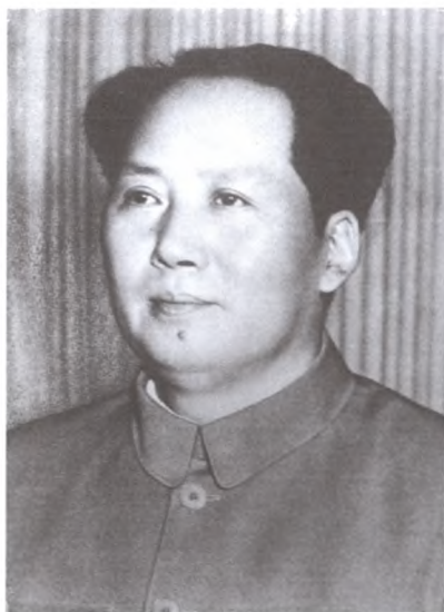
Мао Цзэдун. 15 октября 1951 г.