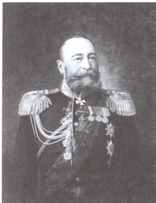
Вице-адмирал Е.И. Алексеев. Художник А.Ф. Першаков