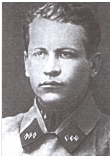
Военный советник К.Б. Калиновский