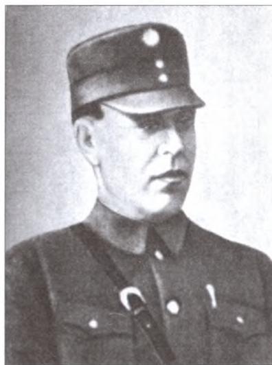
Военный советник, а затем главный военный советник (август 1938 — ноябрь 1939 г.) А.И. Черепанов