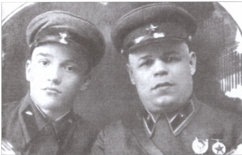
Комбриг П.С. Рыбалко с сыном Вилем (Орел, май 1940 г.)