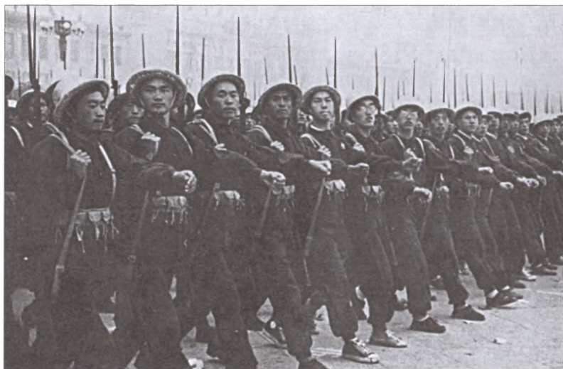
Шеренга китайских солдат. Конец 1930-х гг.