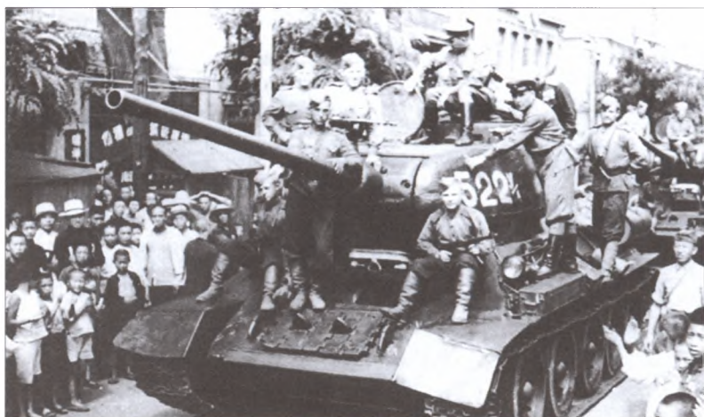
Колонна танков Т-34-85 7-го механизированного корпуса на улицах китайского города Далянь