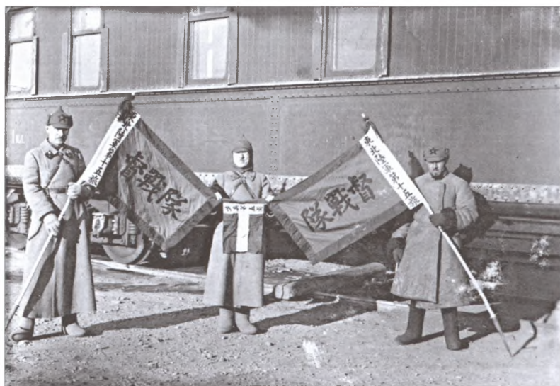
Бойцы РККА с трофейными знамёнами Чжан Сюэяня. Фото 1929 г.