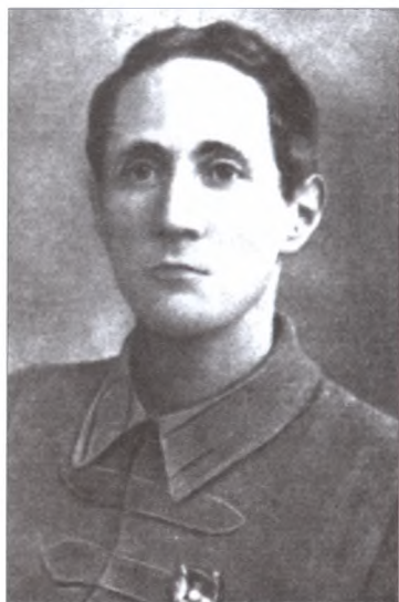
Главный военный советник в Китае (1923—1924 гг.) П.А. Павлов