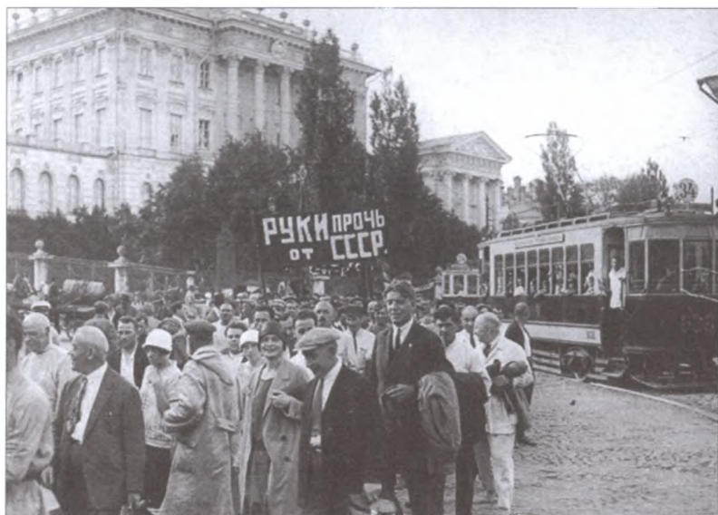
Митинг протеста в Москве против китайских вооруженных провокаций. Фото 1929 г.