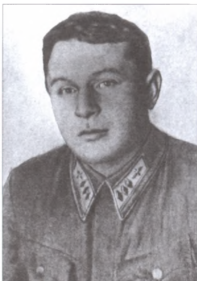
Летчик, военный советник П.В. Рычагов