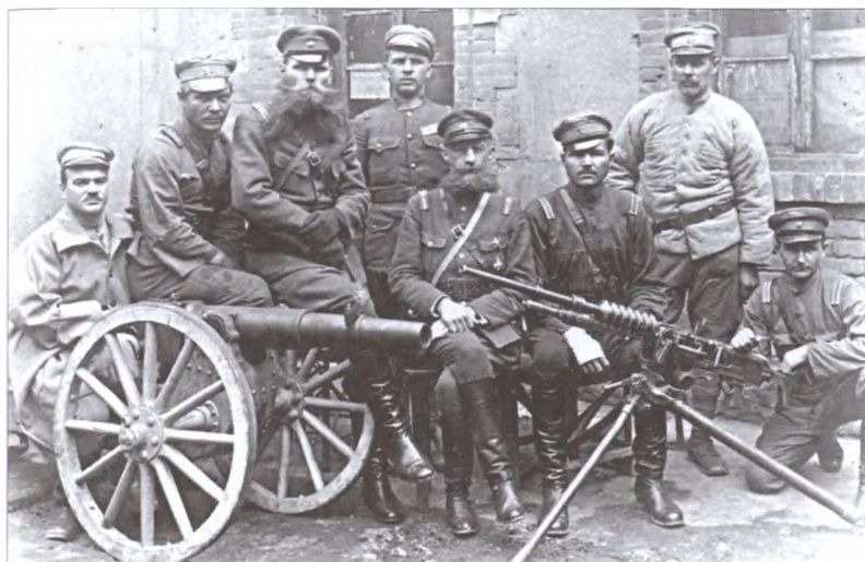
Чины Русской группы китайской армии