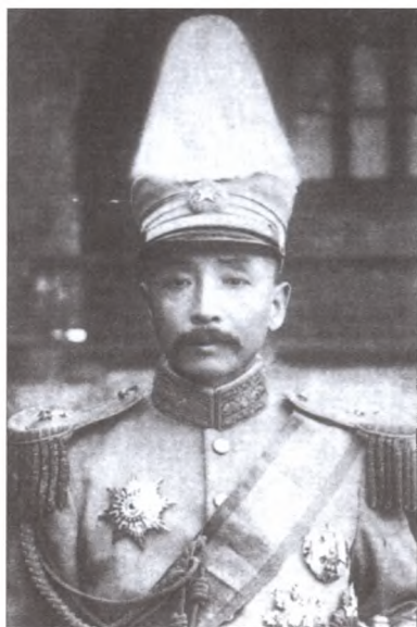
Маршал Чжан Цзолин