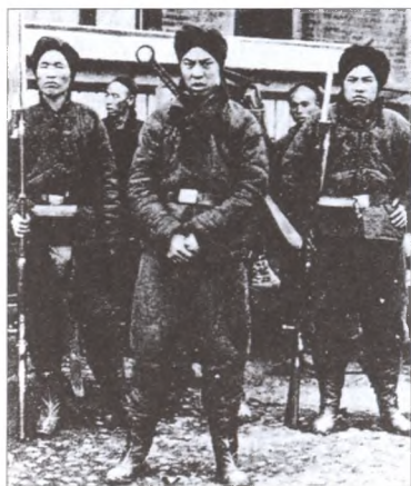
Участники Боксерского восстания