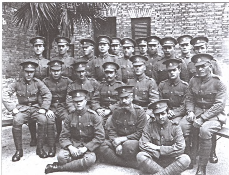
Группа чинов Русского полка Шанхайского волонтерского корпуса