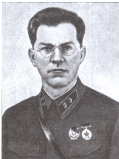
Главный военный советник (1937—1938 г.) М.И. Дратвин