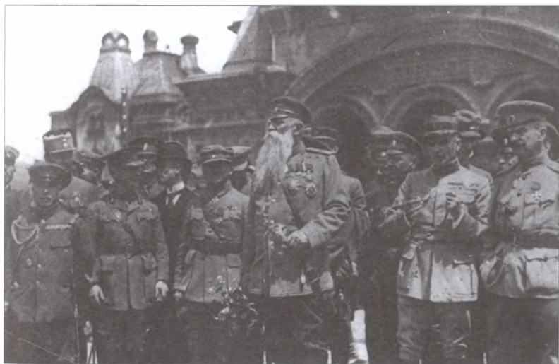
Генерал Хорват и военные представители Антанты во Владивостоке в 1918 г.