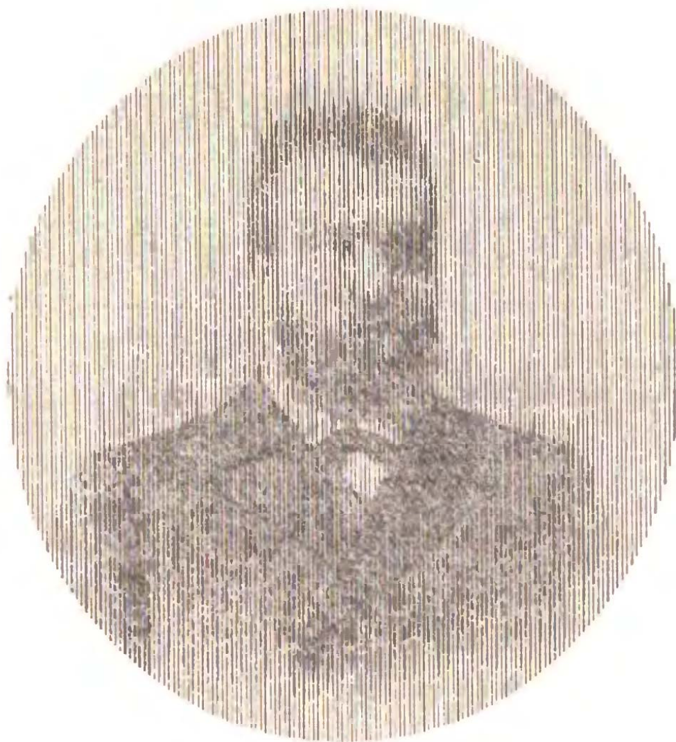
Матвей Кузьмич ЛЮБАВСКИЙ (1860–1936)