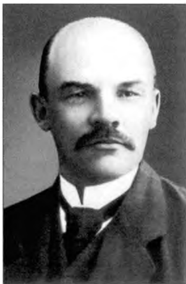
В. И. Ленин. Париж, 1910 г.