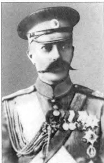
Великий князь Дмитрий Константинович