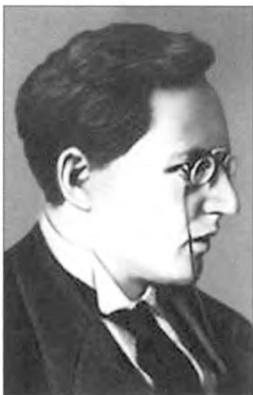
Моисей Соломонович Урицкий, организатор «красного террора»