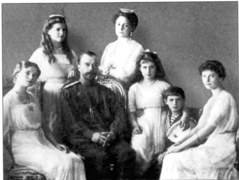
Николай II в окружении семьи