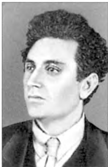
Григорий Евсеевич Зиновьев (Радомысльский)