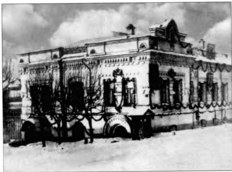
Ипатьевский дом в Екатеринбурге