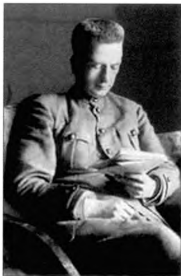
Глава Временного правительства Александр Керенский