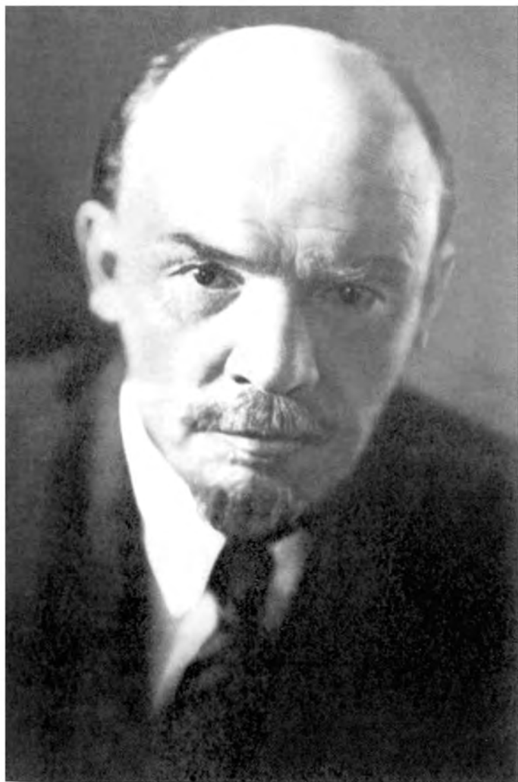
В. И. Ленин после победы Октябрьской революции