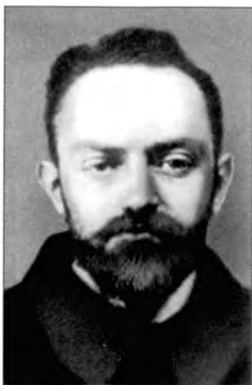
Яков Станиславович Фюрстенберг, более известный как Яков Ганецкий