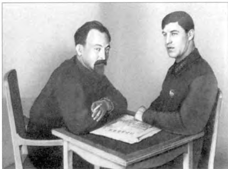
Федор Мартынов на докладе у Феликса Дзержинского