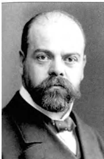
Израиль Лазаревич Гельфанд, более известный как Александр Парвус