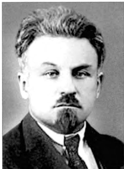
Артур Христианович Артузов, начальник Активного отделения Особого отдела ВЧК, а затем легендарный начальник ИНО