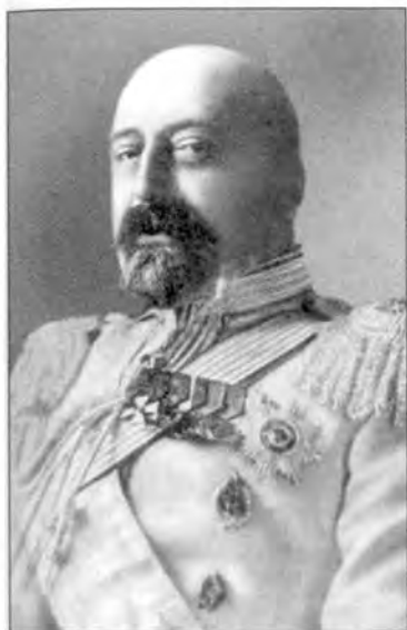
Великий князь Николай Михайлович