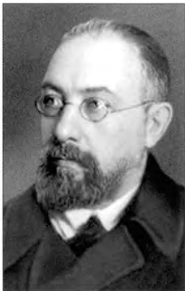
В. Д. Бонч-Бруевич