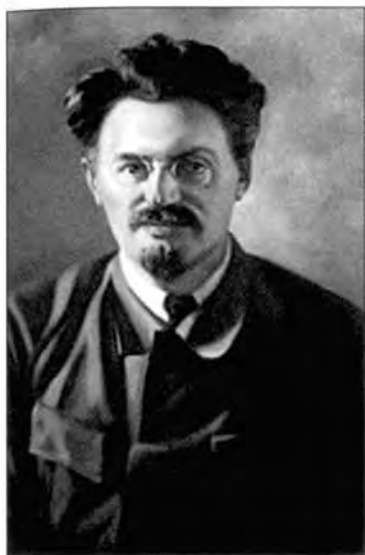
Лев Троцкий (Бронштейн)