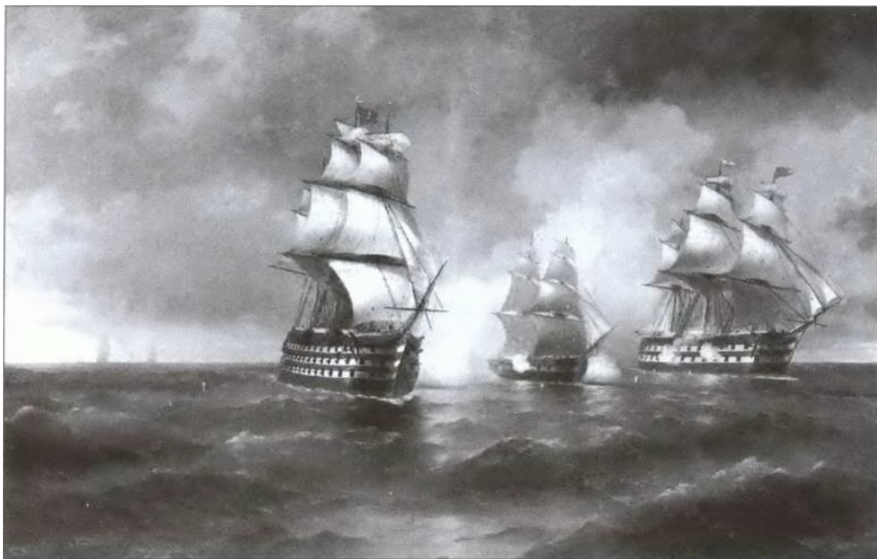
Знаменитая картина И. Айвазовского «Бой брига “Меркурий”...», неверно изображающая события