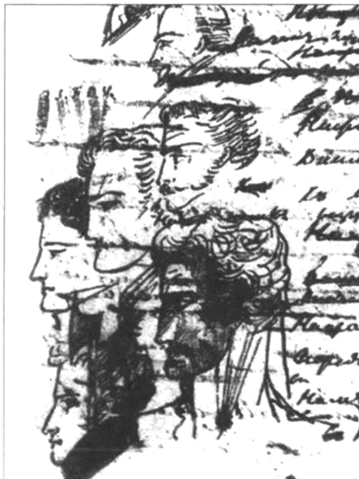
Рисунок А.С. Пушкина. А.И. Казарский — в верхнем ряду слева