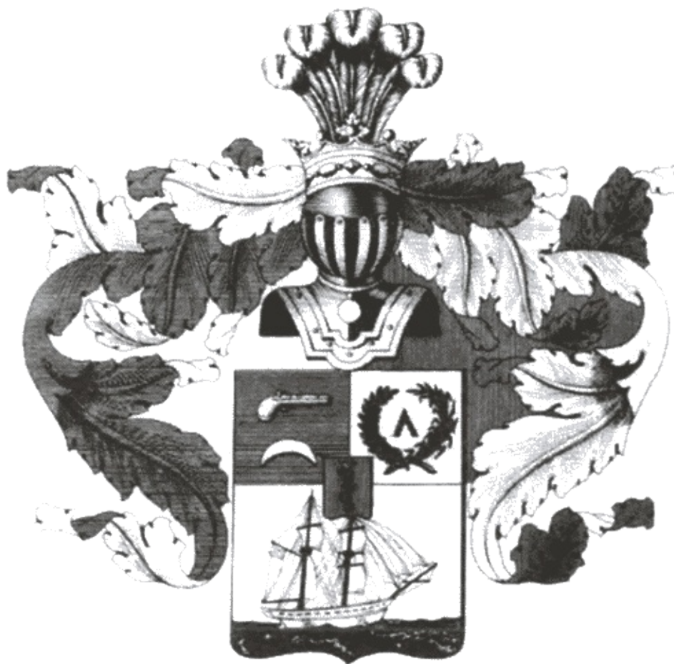
Герб А.И. Казарского с изображением брига «Меркурий» и пистолета. Рисунок Г. Нарбута