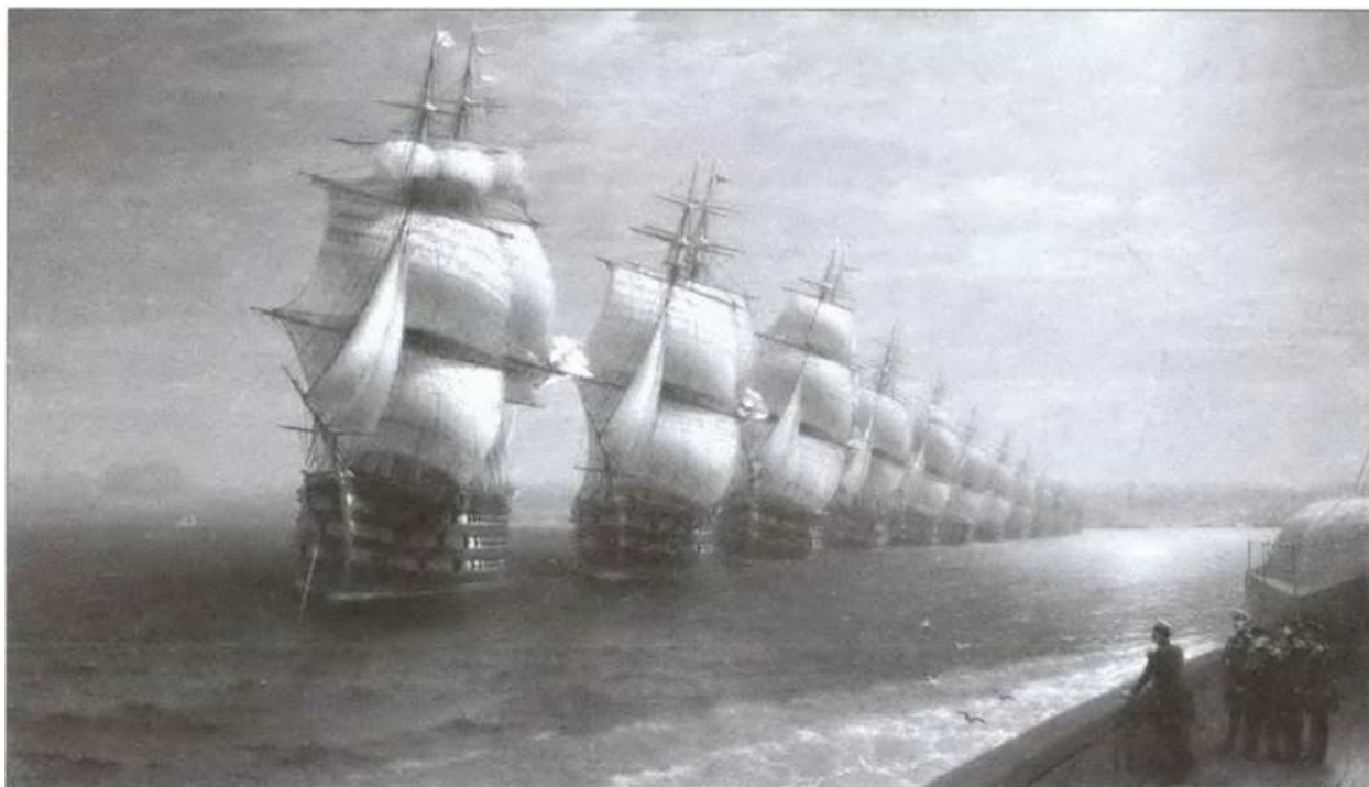
Смотр Черноморского флота в 1849 году. Художник И.К. Айвазовский