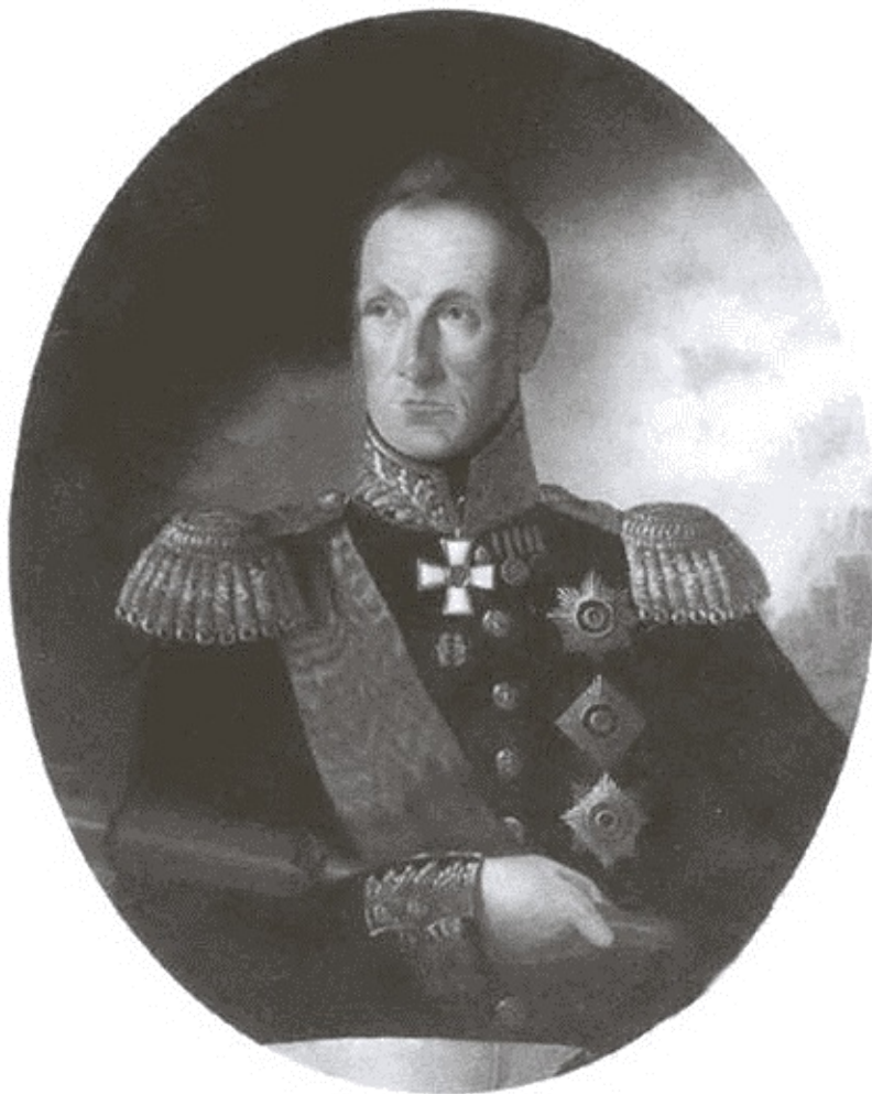
Адмирал А.С. Грейг.