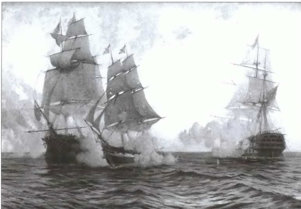
Бой брига «Меркурий» с турецкими кораблями 14 мая 1829 г. Художник М.С. Ткаченко