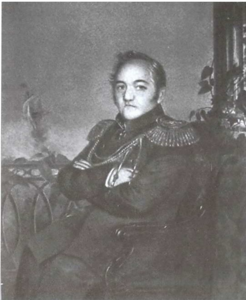
М.П. Лазарев. С картины К.П. Брюллов