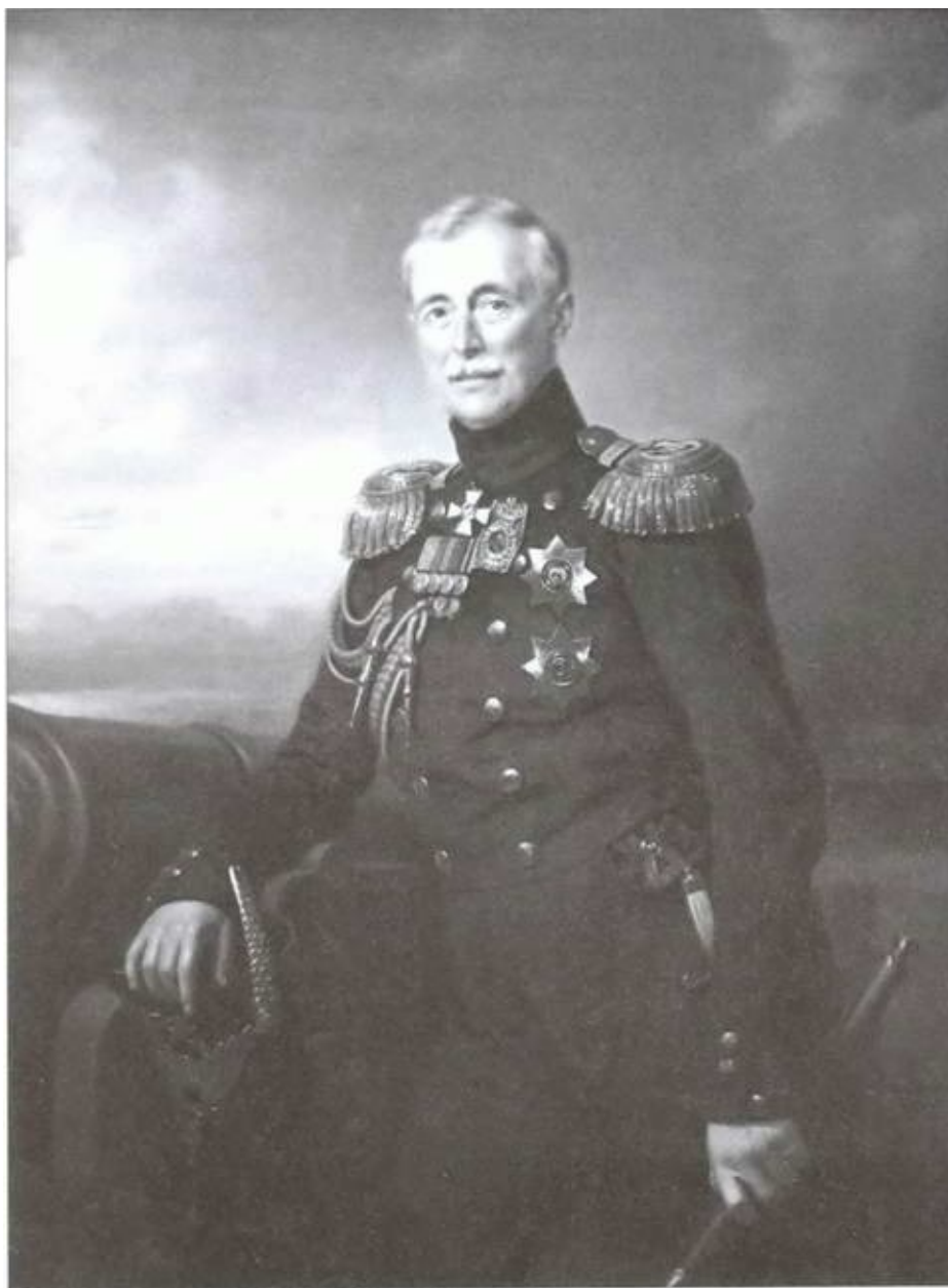
А.С. Меншиков. Художник Ф. Крюгер