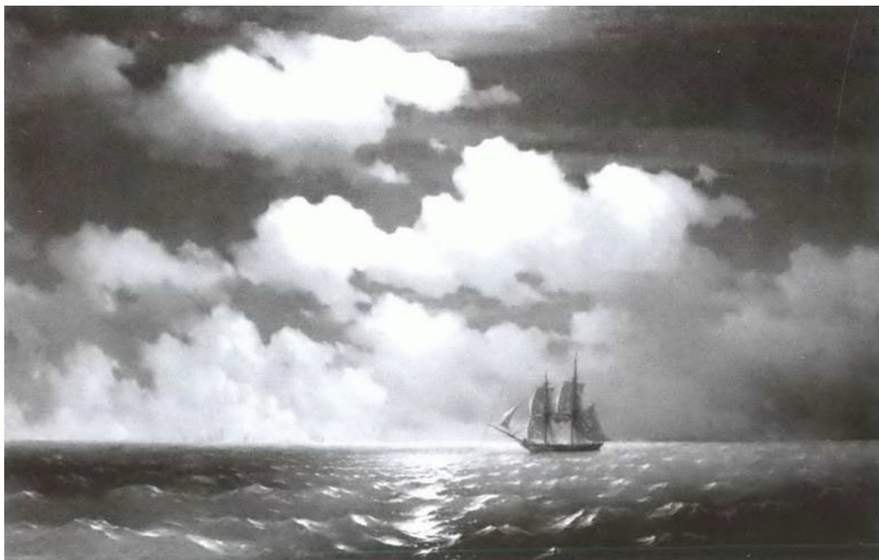
Бриг «Меркурий» после победы над двумя турецкими судами. Художник И.К. Айвазовский