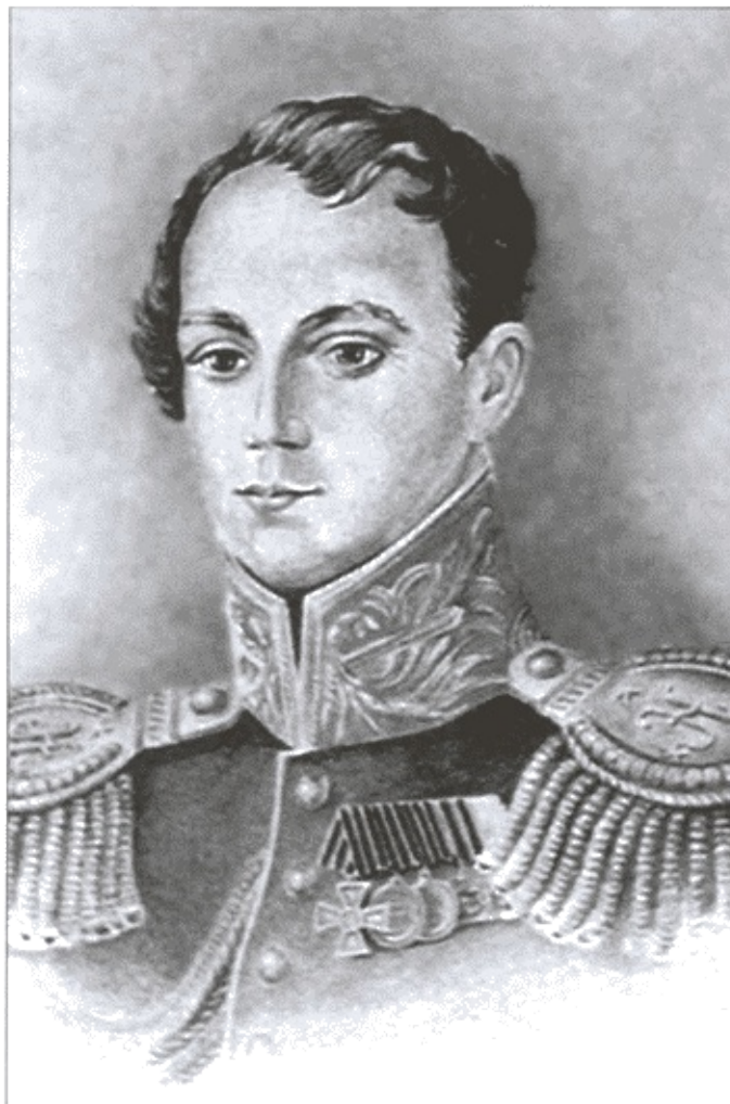
Флигель-адъютант капитан 1-го ранга А.М. Казарский. Неизвестный художник