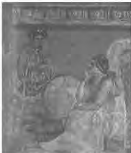
Рис. 5 Фреска «Македония и Азия». Неаполитанский музей.

Битва при Ипсе (современное селение Сипсин в Турции) проходила в два этапа 75 . На первом фортуна находилась на стороне Антигона. Деметрий в конной атаке сумел окружить слонов, находившихся на левом фланге противника, и атаковать их. В бой включилась конница, возглавляемая Антиохом, но в результате преимущество оказалось на стороне Деметрия. Он сумел обратить Антиоха в бегство и еще долго преследовал