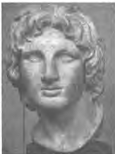
Рис. 1 Александр Македонский. Британский музей.

В 326 г. Александр пересек Инд и вступил в сражение с индийским правителем Пором. Селевк в это время находился непосредственно рядом с царем (Ibid. V. 13. 1). В битве с Пором на реке Гидасп Селевк, Антиген и Таврон командовали отдельными частями пехоты (Ibid. V. 16. 3). В бою македонской пехоте пришлось столкнуться с боевыми слонами. Арриан в подробностях описывает эту, невиданную до того времени, бойню. Безумие, которое охватило слонов после убийства их погонщиков, привело к большой сумятице. В результате македонская пехота сумела уничтожить часть животных, а часть поймать (Ibid. V. 17). Из 6 тыс. пехоты погибло не более 80 человек. Такой успех, безусловно, подкрепил авторитет Селевка. Победа в сражении на Гидаспе, возможно, стала серьезной ступенью в его дальнейшей карьере. Спустя двадцать лет он вновь посетил