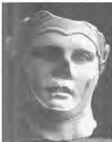
Рис. 3. Селевк I. Лувр.

чувствовать себя уверенно. Началась война за обладание этим городом, которая продолжалась до 308 г. до н. э. Подробности этой борьбы остаются невыясненными и основная причина тому — фрагментарность наших источников, а отсюда и расхождения в датировке этих событий. Иероним из Кардии, повествование которого было основой для книг XVIII–XX Диодора, пропустил эту войну. Возможно, что для Иеронима, долгое время служившего Антигону, упоминание о поражении