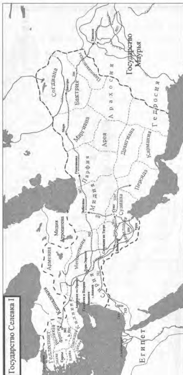
3. Государство Селевка I.