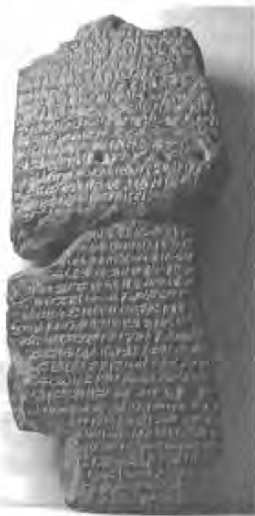
Рис. 4 «Хроника диадохов». ВСНР 3.

Ситуация, сложившаяся к 310 г., была столь серьезна, что потребовала вмешательства самого Антигона. К этому времени Селевк уже обладал Персидой и Сузианой, располагая достаточным военным и экономическим потенциалом, чтобы противостоять столь сильному сопернику. Точно неизвестно, когда Антигон вторгся в Вавилонию 34 , но, скорее всего, это было сделано не позднее осени 310 г. (ВСНР 3. rev. 14). Неизвестными остаются подробности столкновений 310 г. до н. э. между войсками Селевка и Антигона, о которых идет речь в «хронике