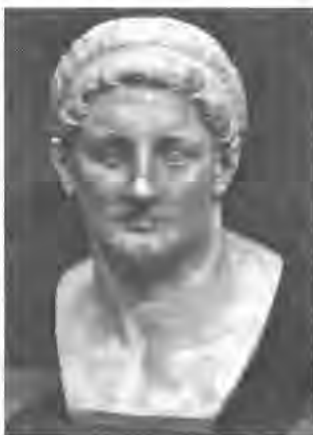
Рис. 2. Птолемей I. Лувр.

73. 3) 13 . После поражения Эвмена в битве при Габие (конец 317 г.) и последующей его казни, Антигон обратил свое внимание на соседнюю Мидию и выступил против ее сатрапа Пифона, обвинив его в измене и пособничестве греку Эвмену. В 316 г. до н. э. Антигон сумел нейтрализовать армию Пифона, сам сатрап погиб, а Мидия была подчинена власти Антигона.