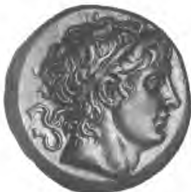
Рис. 6 Деметрий Полиоркет.

шейся как восточная столица. Именно в Селевкии в Пиерии был впоследствии похоронен сам Селевк (App. Syr. 63; Malal. VIII. 19). К этим двум городам вскоре прибавляются еще два: Лаодикея Приморская, которая, как и Селевкия, строилась как морской порт 81 , и Апамея – база селевкидского войска. Так был образован сирийский Тетраполис – важнейшая агломерация в Сирии (ср. Strabo. XVI. 2. 4) 82 .