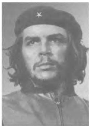
Эрнесто Че Гевара (1928–1967) Президент Национального банка Кубы (1959–1961) министр промышленности Кубы (1961–1965)

Эрнесто Рафаэль Гевара де ла Серна (прозвище Че он добавил для того, чтобы подчеркнуть свое аргентинское происхождение) родился в 1928 г. в аргентинском городе Росарио в семье креолов, владевших плантацией чая. Уже в раннем детстве у него начинаются приступы бронхиальной астмы, которыми он страдает всю жизнь. Несмотря на это, он окончил школу, а в 1953 г. – медицинский факультет Национального университета в Буэнос-Айресе и получил диплом врача, что помогало ему лечить себя и окружающих в длительных поездках по Латинской Америке и боевых ситуациях. В 1955 г. в Мексике он познакомился с Раулем и Фиделем Кастро и присоединился к ним в их борьбе