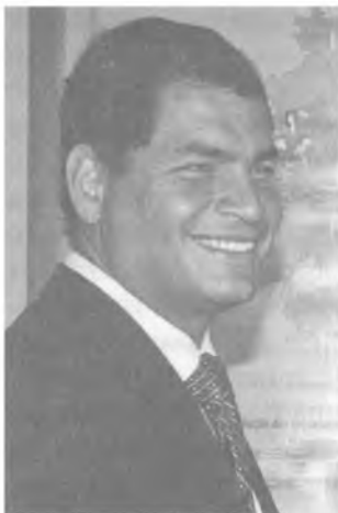
Рафаэль Корреа (1963) Президент Эквадора (2007–2017)

Рафаэль Висенте Корреа Дельгадо родился в городе Гуаякиль (Эквадор). Доктор экономических наук, выпускник Университета Иллинойса (США). Занимал пост министра экономики. Президентский пост впервые завоевал на президентских выборах 26 ноября 2006 г. благодаря своим социалистическим лозунгам в поддержку «простых людей» и антиамериканской риторике. По заявлениям Рафаэля Корреа, целью его внешнеполитического курса является образование единого латиноамериканского блока и борьба с гегемонией США. Переизбирался на пост президента Эквадора в 2009 и в 2013 гг.