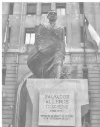
Памятник президенту Чили Сальвадору Альенде Госсенс на площади Ла Монеда в Сантьяго

лили нападающие. Известно лишь, что когда его нашли в президентском кабинете, он сидел в своем кресле, на коленях у него лежала винтовка, а сам он был изрешечен пулями 94 .