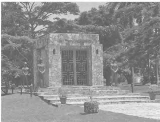
Мавзолей Омара Торрихоса

поверхности для эксплуатации и обороны канала. Также предполагалась ликвидация всех американских военных баз в этой зоне. В несколько раз увеличивалась плата США Панаме за использование канала. Вашингтону, правда, удалось во многих оговорках и поправках оставить за собой право вмешательства в дела Республики Панама в случае «возникновения угрозы» каналу. Другие страны тоже имели право подписать протокол к договору, что гарантировало международный нейтралитет канала. Это было огромной победой для страны.