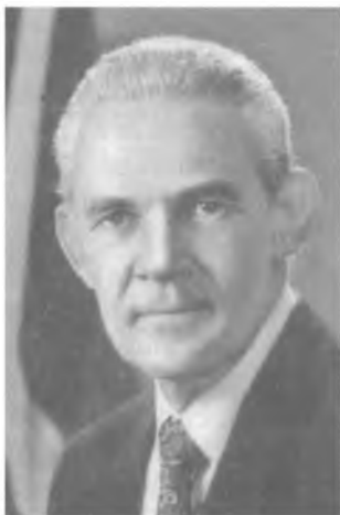
Майкл Норман Мэнли (1924–1997) Премьер-министр Ямайки (1972–1980, 1989–1992)

Майкл Норман Мэнли в 1949 г. окончил Лондонскую экономическую школу. На родине работал журналистом, занимал ответственные посты в профсоюзах. В 1962 г. был избран сенатором, в 1967 г. – в палату представителей. В 1969 г. возглавил ННП.