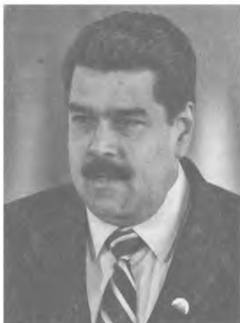
Николас Мадуро (1962) Президент Венесуэлы с 2013 г.

Николас Мадуро родился в Венесуэле в католической семье с еврейскими корнями. Закончил лицей и общественную школу, но высшего образования не получил. Работал водителем автобуса. Рано начал заниматься политикой. Стал другом и помощником Уго Чавеса. Занимал важные посты в правительстве Чавеса: президент Национального собрания (2005–2006), министр иностранных дел (2006–2013). На выборах 2013 г. Мадуро избран президентом.