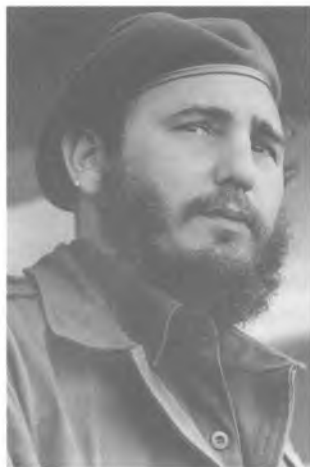
Фидель Кастро Рус (1926–2016) Председатель Совета министров Кубы (1959–2008) Первый секретарь ЦК КПК (1961–2011)

Фидель Кастро Рус родился в семье крупного землевладельца. В 1950 г. окончил юридический факультет Гаванского университета, получил степень доктора права. Принимал активное участие в студенческом движении. Он возглавил революционные силы, выступавшие против диктатуры Р.Ф. Батисты, установленной в 1952 г. Подготовил и возглавил вооруженное нападение на военную казарму «Монкада» в г. Сантьяго-де-Куба 26 июля 1952 г. Однако выступление молодых патриотов было подавлено. Фидель был арестован, передан суду и приговорен к 15 годам тюремного заключения. На суде он выступил с известной речью «История меня оправдает». 15 мая 1955 г. был освобожден по амнистии и эмигрировал в Мексику, где начал подготовку вооруженного отряда кубинских революционе-