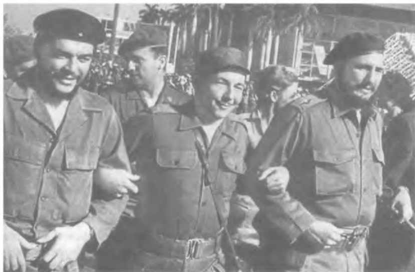
Товарищи по оружию, «барбудос». (Слева направо: Э. Че Гевара, Рауль и Фидель Кастро Рус. 1959 г.)

Вспомним, что территория государства Кубы не столь велика (110,2 тыс. км 2 ), а население, удвоившееся со времени революции 1959 г., в 2003 г. составило 11,2 млн человек и мало изменилось по данным на 2015 г. Из природных ресурсов наиболее значимы запасы никеля (37% общемировых), кобальта, меди и нефти, которые до недавнего времени были мало разработаны. Из сельскохозяйственных культур — сахар, табак, цитрусы.