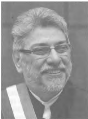
Фернандо Луго (1951) Президент Парагвая (2008–2012)

Семья Фернандо Луго была не особо религиозной, но очень оппозиционной к диктатуре А. Стресснера. Сам Луго окончил обычную школу и начал преподавать в сельской очень религиозной местности, что оказало на него большое воздействие. В 19 лет он поступил в римско-католическую семинарию, в 1977 г. был рукоположен в сан священника и отправлен в Эквадор, где пять лет служил миссионером. Здесь он познакомился с теологией освобождения. По возвращении в Парагвай он вновь под давлением хунты на церковь был вынужден уехать из страны и отправился в Рим, где продолжил свое образование. Вернувшись на родину, он познал трудности беднейшего населения, особенно после того, как послужил епископом в отдаленной епархии Сан-Педро, где окончательно решил бороться за улучшение жизни основной массы парагвайцев. Для этого подал в отставку из епархии, получил разрешение от Святого престола и стал баллотироваться в президенты. В 2008 г. при большой поддержке народа был избран президентом.