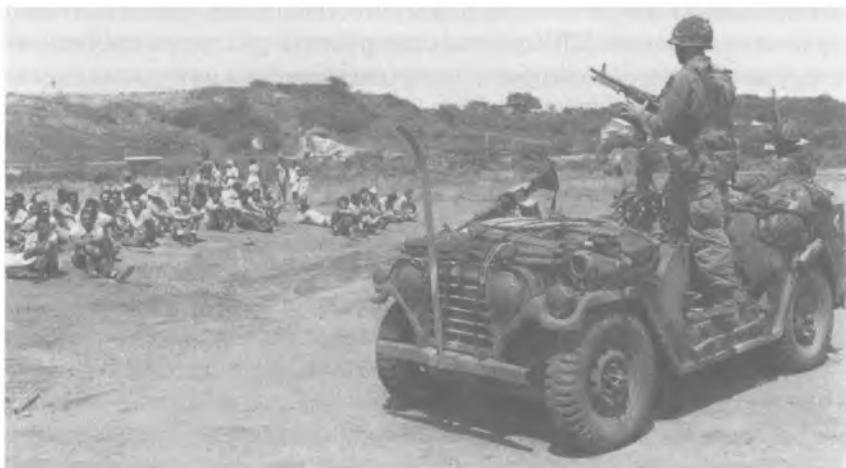
Джип М151 охраняет пленных кубинцев во время высадки американских войск на остров Гренада в октябре 1983 г. в рамках операции Urgent Fury («Вспышка ярости»)

Вся мировая общественность осудила вооруженную интервенцию на Гренаду, расценила ее как использование «Большой дубинки», которая была не только незаконной, но и ненужной. Против интервенции выступила Организация американских государств. Резкой была реакция латиноамериканских государств. Генеральная Ассамблея ООН приняла резолюцию, осуждающую действия США как грубое нарушение международного права, и потребовала немедленного вывода американских войск с территории суверенного государства. Соединенные Штаты, однако, продолжали утверждать, что спасают мир от «коммунистической угрозы» и потому могут допускать произвол и беззаконие для установления демократии в американском духе.