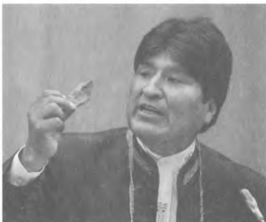
Эво Моралес демонстрирует листья коки с трибуны ООН

Хуан Эваристо Моралес Айма (Эво Моралес) родился в бедной семье в высокогорном департаменте Оруро. Его родители – индейцы-аймара – занимались земледелием и разведением лам. Эво пас лам и собирал картофель. Семья постоянно голодала. Из-за этого четверо из семи детей в их семье умерли в раннем детстве. Когда Эво исполнилось 12 лет, после сильных заморозков, уничтоживших урожай картофеля и все поголовье лам, семья вынуждена была