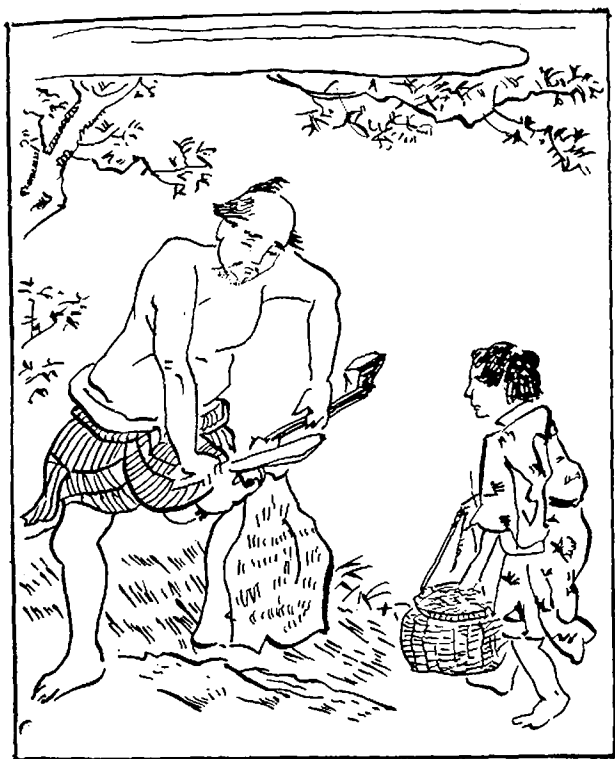
Боец скота — кожевник

ленном уровне развития общества ремесленники, очевидно, уже как-то социально обособлялись.