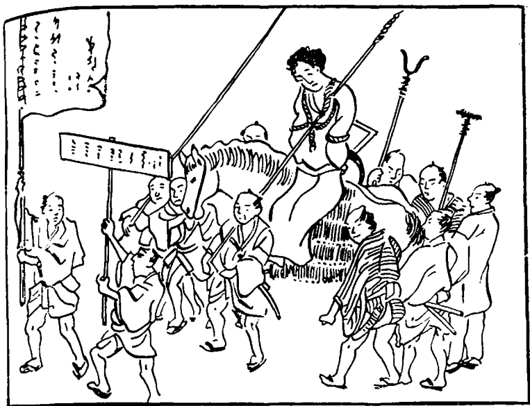
Один из элементов ритуала казни: преступника провозят по улицам города. По приказу феодала казнь производили хинин

в целом и остальным населением страны [см. 79, 118]. Это отчуждение подкреплялось взаимным недоверием и презрением. Представители каждой из этих групп париев считали себя более достойными по своим нравственным качествам и по той роли, которую они играли в общественной жизни страны.