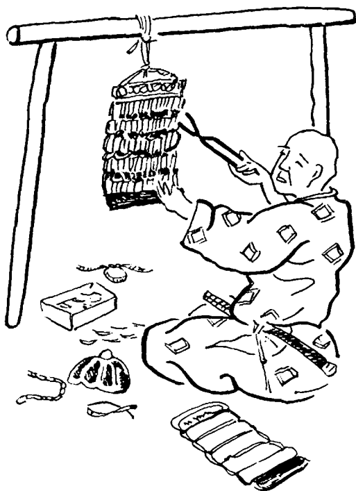
Ремесленник, изготавливающий доспехи

XVI в. (особенно со второй половины) ведущими стали центристские тенденции и попытки укрепления существовавшей социально-экономической структуры.