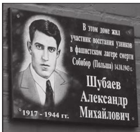
Памятная доска А.М. Шубаеву. 15 октября 2018 г. Хасавюрт