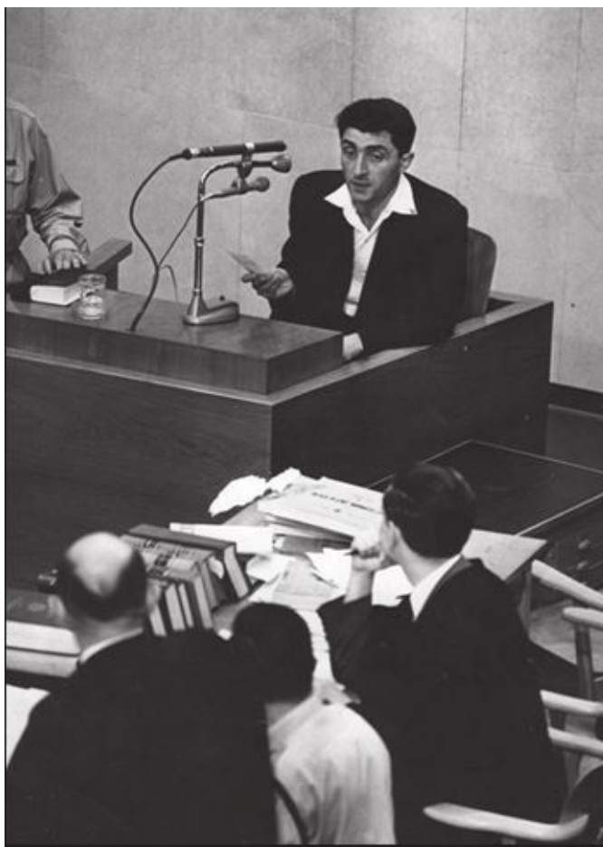
Моше Бахир. Выступление на процессе А.Эйхмана в Израиле. 1961 г