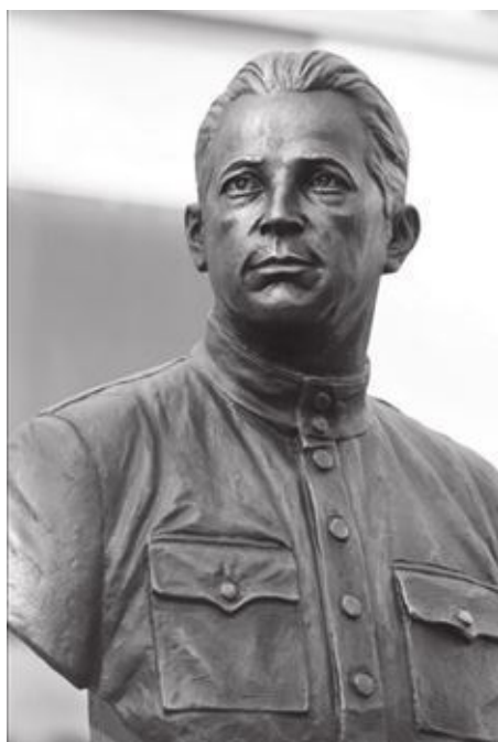
Памятник-бюст А.А. Печерскому в Ростове-на-Дону. Установлен РВИО 24 апреля 2018 г.