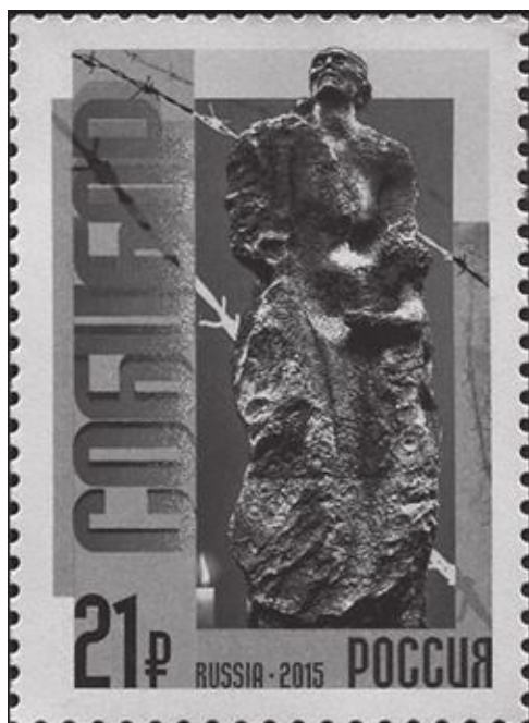
К 70-летию Победы в Великой Отечественной войне Почта России выпустила марку в память о восстании заключенных в лагере смерти Собибор