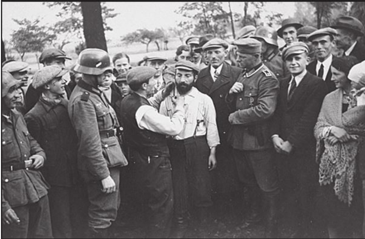
Германские солдаты и жители польского города Томашов-Мазовецкий окружили еврея, которому принудительно стригут бороду. Октябрь 1939 г.