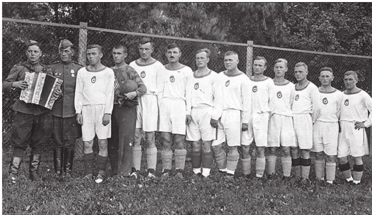
Сборная футбольная команда дивизии.