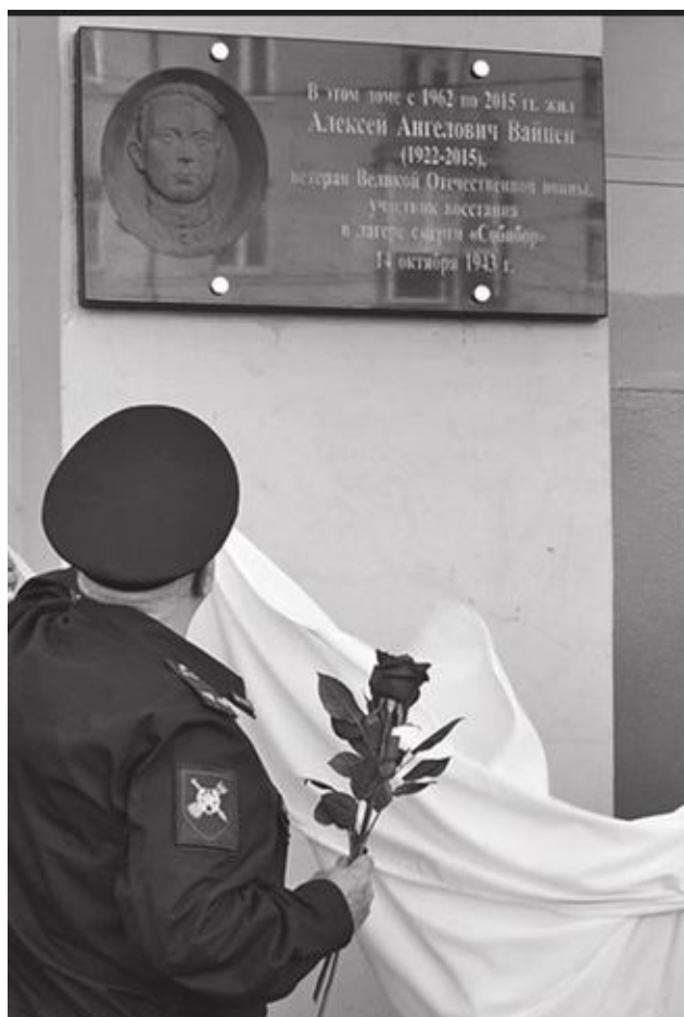
Открытие Мемориальной доски А. А.Вайцену. 12 октября 2018 г. Рязань