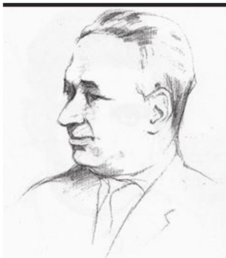
Лейтенант Красной Армии - руководитель восстания Александр Аронович Печерский.