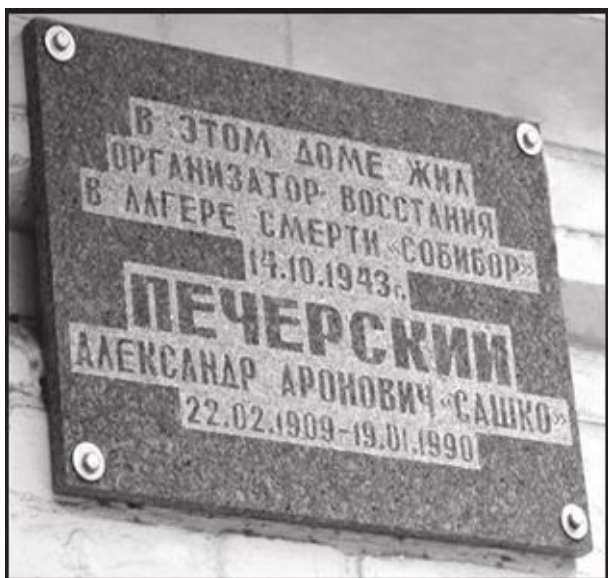
Мемориальная доска на доме, где жил А. А. Печерский. Ростов-на Дону