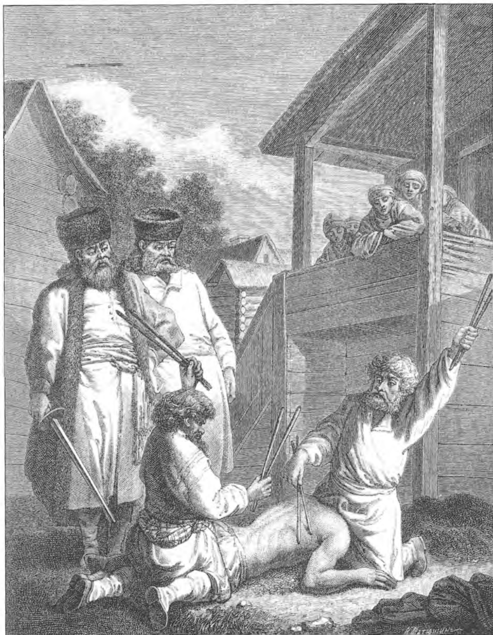
Наказание батогами в России в XVIII веке