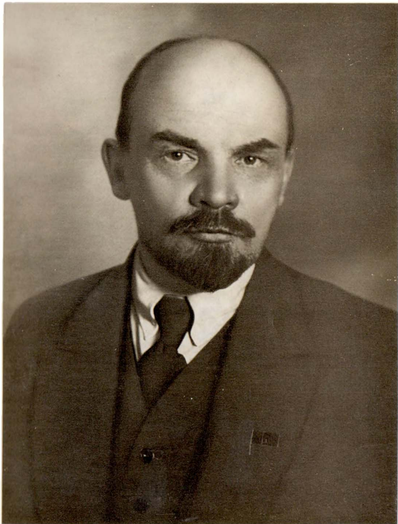
В. И. ЛЕНИН 1920 г.