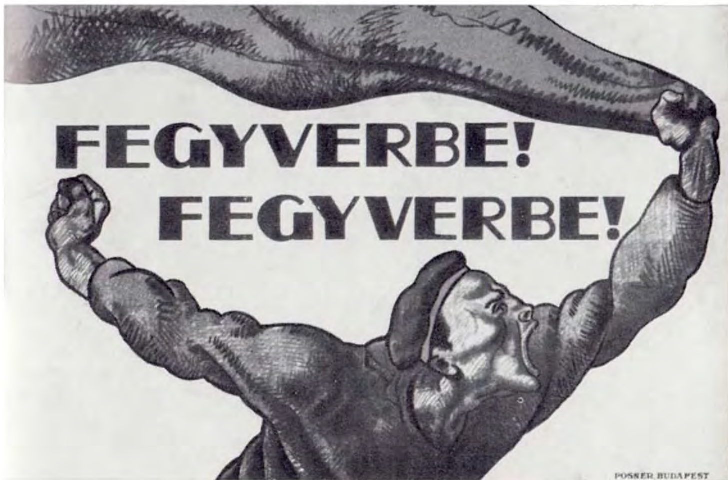
Плакат с памятника в честь венгерской революции 1919 г. «К оружию!»