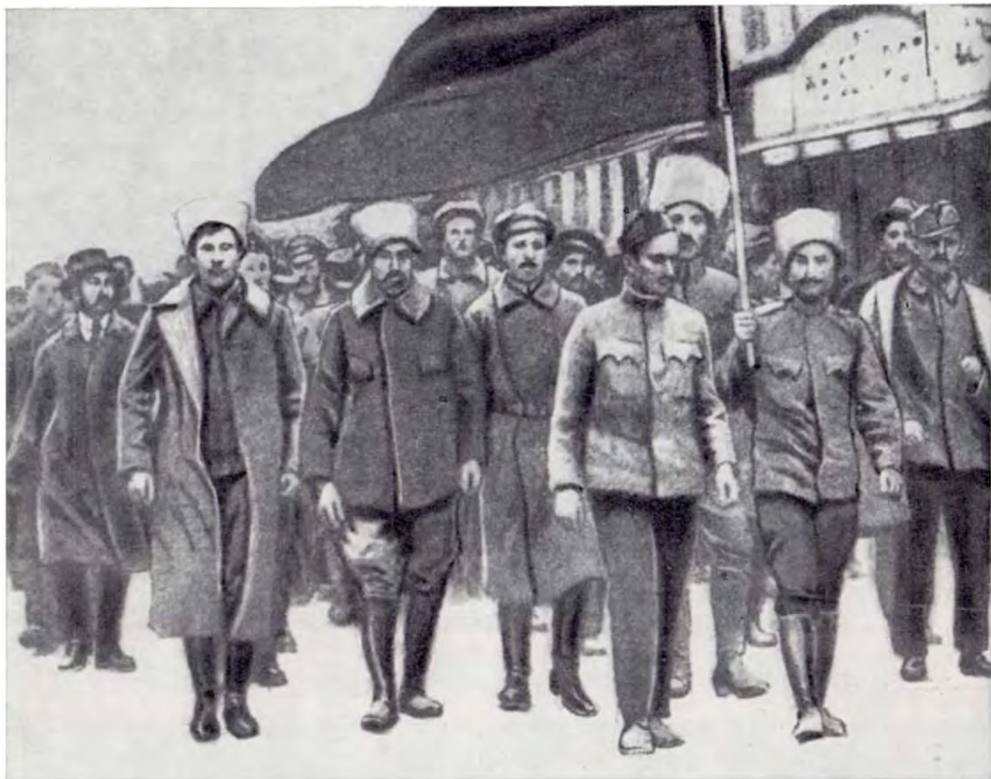
Бывшие русские военнопленные после митинга, проведенного в политехническом институте в Гойаваре, идут на место сбора, чтобы вступить в ряды Венгерской Красной Армии. Апрель 1919 г.