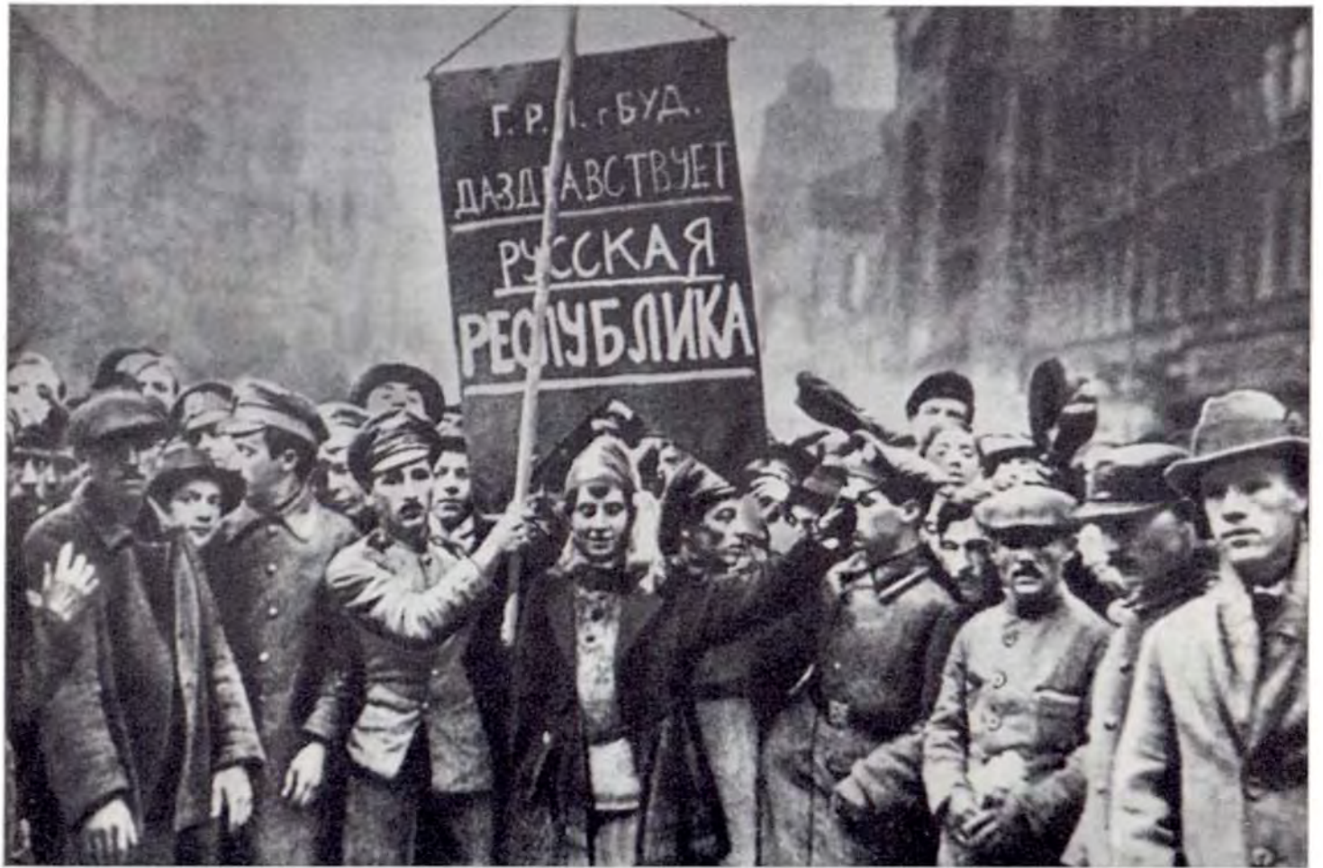
Русские военнопленные в Будапеште празднуют первую годовщину Октябрьской революции в России. 7 ноября 1918 г.