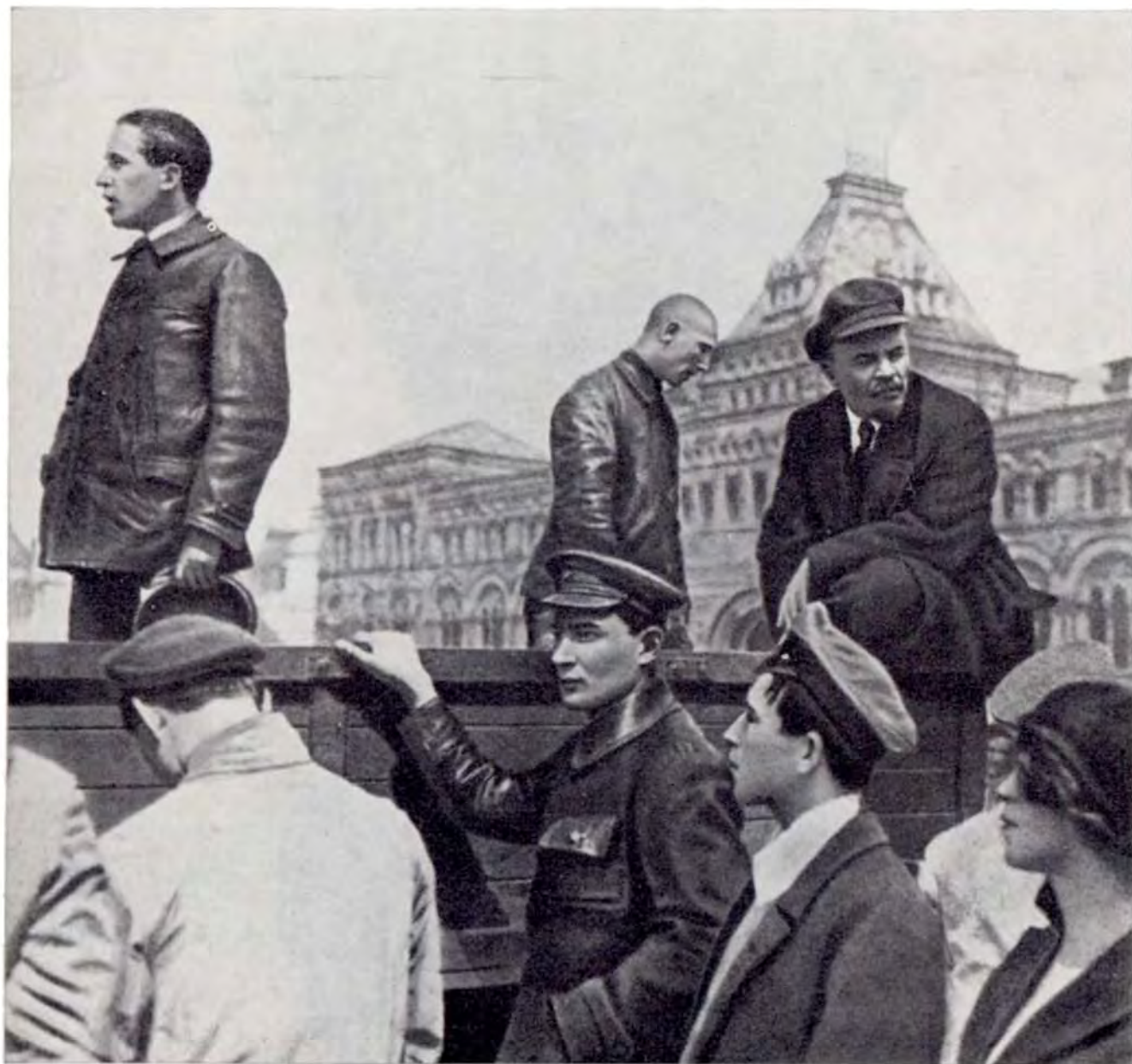
Выступление Тибора Самуэли на параде войск Всевобуча на Красной площади. Москва, 25 мая 1919 г.