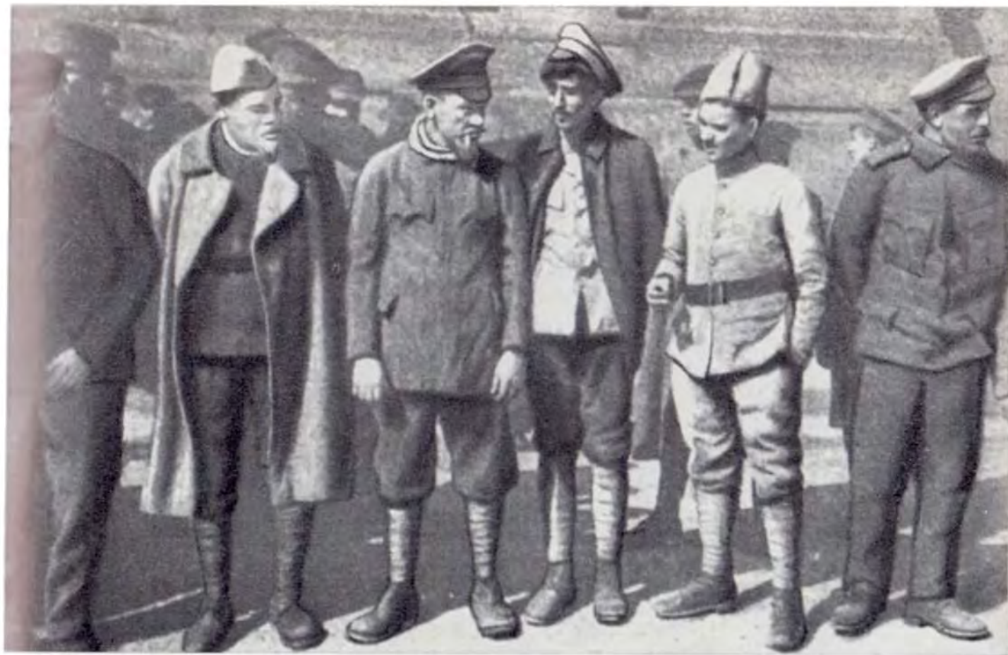
Русские военнопленные, находящиеся в Венгрии, вступают в ряды Венгерской Красной Армии.

Интернациональный полк проходит по Будапешту. 1919 г.